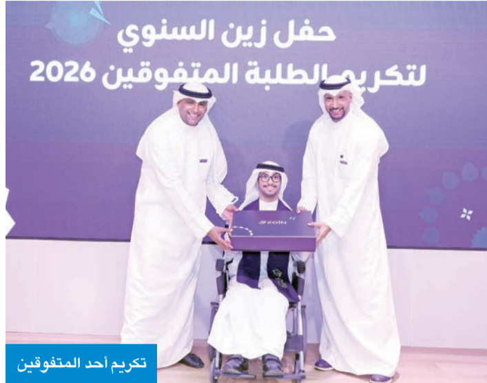
تكريم أحد المتفوقين