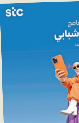
أكثر من برنامج صيفي شبابي لتنمية وتوظيف

الإتصالات والحلول الرقمية في الكويت. ويعد هذا البرنامج جزءاً من جهود stc الأوسع نطاقاً من خلال youth stc، والذي يهدف إلى تلبية الاحتياجات والشباب المتنوعة والمتجددة لفئة الشباب بالكويت، ومن خلال باقات مخصصة تتضمن الوصول إلى مرافق وتجارب إضافية. وتتميز باقات youth stc بعروض حصرية تم ابتكارها بالتعاون مع شركاء متخصصين في مختلف القطاعات، وتهدف شركة stc من خلال برامج استراتيجية تركز على الشباب إلى تمكين الجيل القادم بفرص تعزيز الإبداع، مع دعم المواهب الوطنية والمساهمة في اقتصاد الكويت كله.