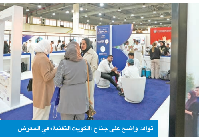
توافد واضح على جناح «الكويت التقنية» في المعرض

كما حدد الحد الأقصى لعمر السيارات الخاصة ومركبات النقل الخفيف والحافلات الصغيرة (حتى 14 راكباً) بـ 3 سنوات عند بداية الترخيص،