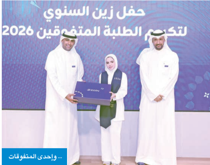
... وأحدى المتفوقات

أقامت حفلها السنوي لتكريم أوائل الثانوية بعد عام دراسي استثنائي... تحفيزاً للطاقات الواعدة • الرشيد: مبادرة «زين» تعكس إيمانها بأهمية الاستثمار في الإنسان وترسيخ التميز بين الشباب