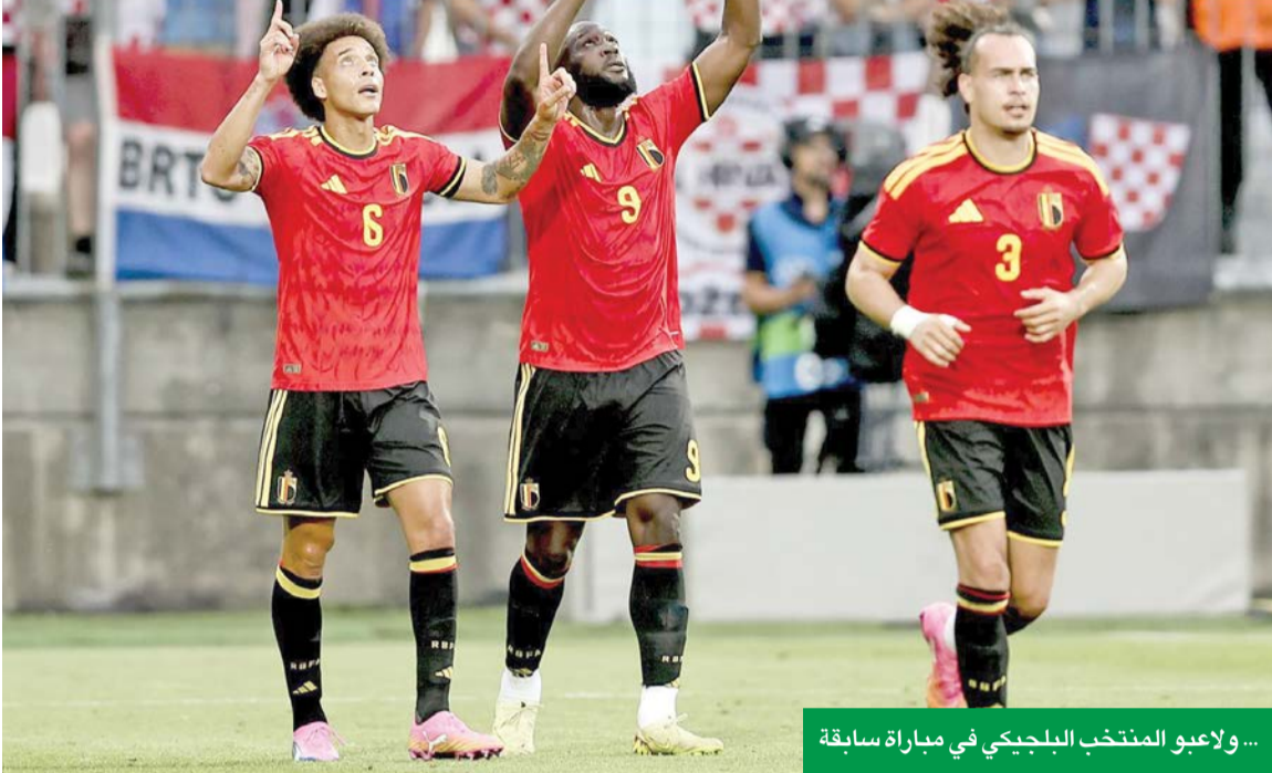
... ولاعبو المنتخب البلجيكي في مباراة سابقة