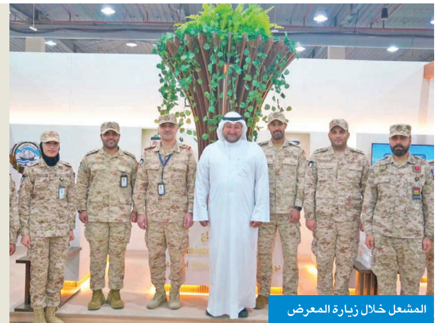
المشعل خلال زيارة المعرض