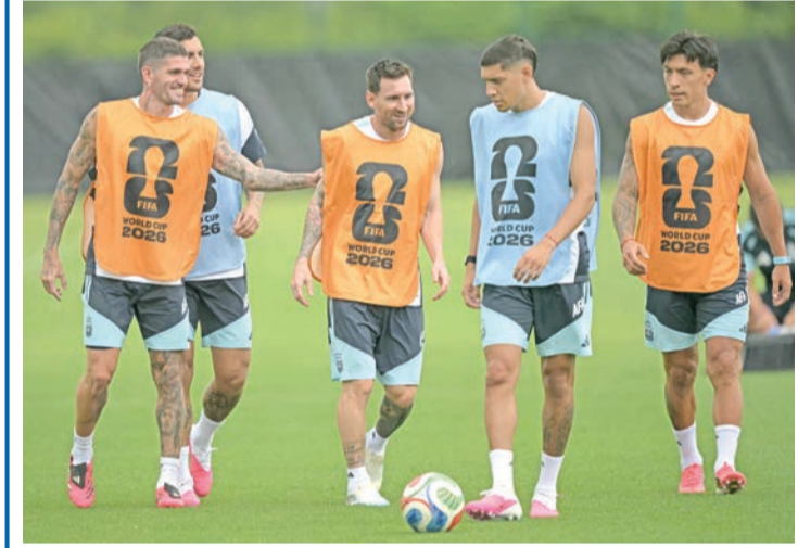
2-3 بعد التمديد على منتخب الرأس الأخضر، الذي يشارك للمرة الأولى في المونديال، وذلك في دور الـ 32 للمنافسة. ويشار إلى أن الفائز من لقاء الأرجنتين ومصر سوف يلتقي في دور الثمانية مع الفائز من مباراة سويسرا وكولومبيا.

اضطر المنتخب الأرجنتيني للتدريب في صالة نادي إنتر ميامي الأمريكي بسبب العواصف الرعدية التي ضربت فورت لودرديل، حسبما أفاد الاتحاد الأرجنتيني لكرة القدم على موقعه الإلكتروني الرسمي. ويستعد منتخب الأرجنتين (بطل العالم) لملاقاة نظيره المصري، غدا الثلاثاء، في دور الـ 16 لبطولة كأس العالم لكرة القدم 2026، المقامة حالياً في الولايات المتحدة والمكسيك وكندا. ومع هذا التغيير في الخطط، أعاد مدربو اللياقة البدنية تنظيم الحصص التدريبية، واستعانوا بتدريبات مكثفة ومخصصة للاعبين الذين لم يشاركوا في مباراة الفريق ضد الرأس الأخضر بدور الـ 32 للمونديال. في المقابل، وأصل باقي لاعبي الفريق تدريبات الاستشفاء كالمعتاد بعد كل مباراة. ويشار إلى أن منتخب الأرجنتين تاهل لدور الـ 16 عقب فوزه الصعب