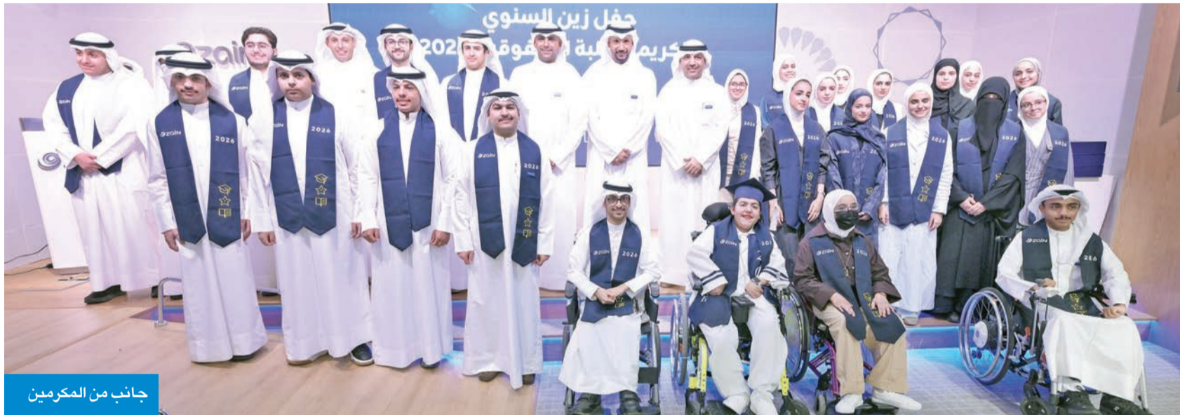
جانب من المكرمين

أثبتم أن الطموح حين يجتمع مع الاجتهاد يصنع قصة نجاح تستحق الفخر حتى في أصعب الظروف المصبيح