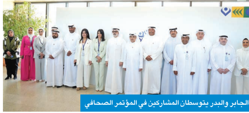
الجابر والبدر يتوسطان المشاركين في المؤتمر الصحافي

وأكد أن هذه المبادرة تمثل استثماراً وطنياً في أمن الكويت التنموي واستدامة مرافقها الحيوية، وتجسد نموذجاً من مؤسسات متكاملات للنعاون بين مختلف الجهات الوطنية، بما يسهم في تعزيز مرونة الدولة وقدرتها على الاستجابة الفاعلة والتعافي السريع في مواجهة الظروف الاستثنائية.