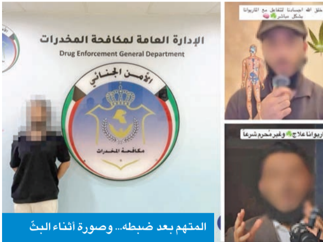
المتهم بعد ضبطه... صورة أثناء البث

تم تحديد هوية المتهم وضبطه، وبمواجهته بالمقاطع المنشورة أقر بأنها عائدة لحسابه الشخصي، واعترف بشهرها، فتم اتخاذ الإجراءات القانونية اللازمة بحقه، وإحالته إلى جهة الاختصاص.