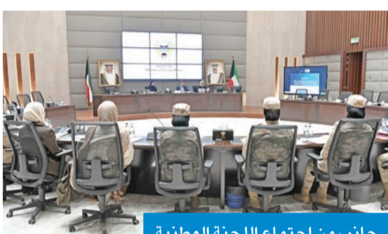
جانب من اجتماع اللجنة الوطنية

لجنة تنفيذ قرار مجلس الأمن 1325 تناقش تمكين المرأة