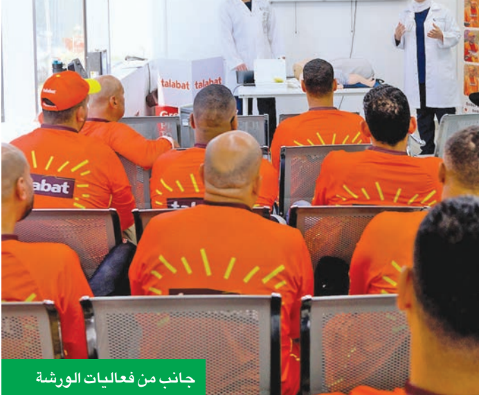
جانب من فعاليات الورشة

في الإسعافات الأولية لسائقي التوصليل... ضمن حملة «الصيف يجمعنا»