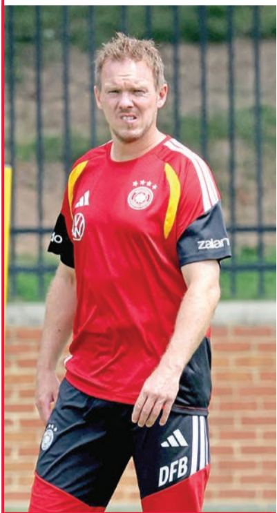
نأغلسمان مدرب المنتخب الألماني

الإكوادور في المباراة الأخيرة بسبب معاناته من إصابة عضلية، لكن من المتوقع أن يكون جاهزاً للمشاركة منذ بداية المباراة أمام باراغواي.