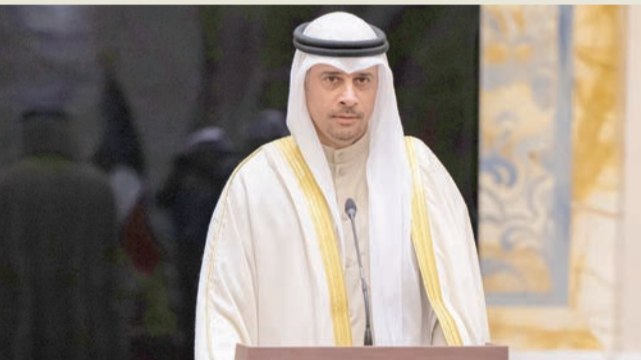
الجلالمة: خطوة استراتيجية ضمن برنامج الإصلاح

دمج «الشباب» مع «الرياضة» لبناء جهاز حكومي أكثر كفاءة