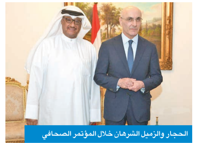
الحجار والزميل الشهران خلال المؤتمر الصحفي