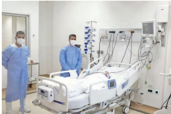
رعاية طبية مميزة وفق البروتوكولات العلاجية العالمية