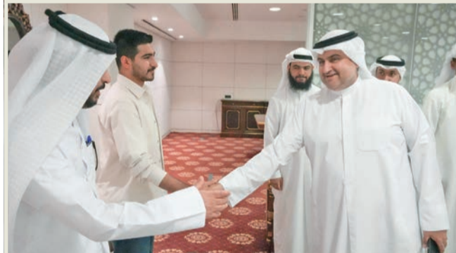
وزير العدل: صُرِفَت للحالات الأشد حاجة

7.5 ملايين دينار لـ 2422 حالة ضمن حملة الغارمين