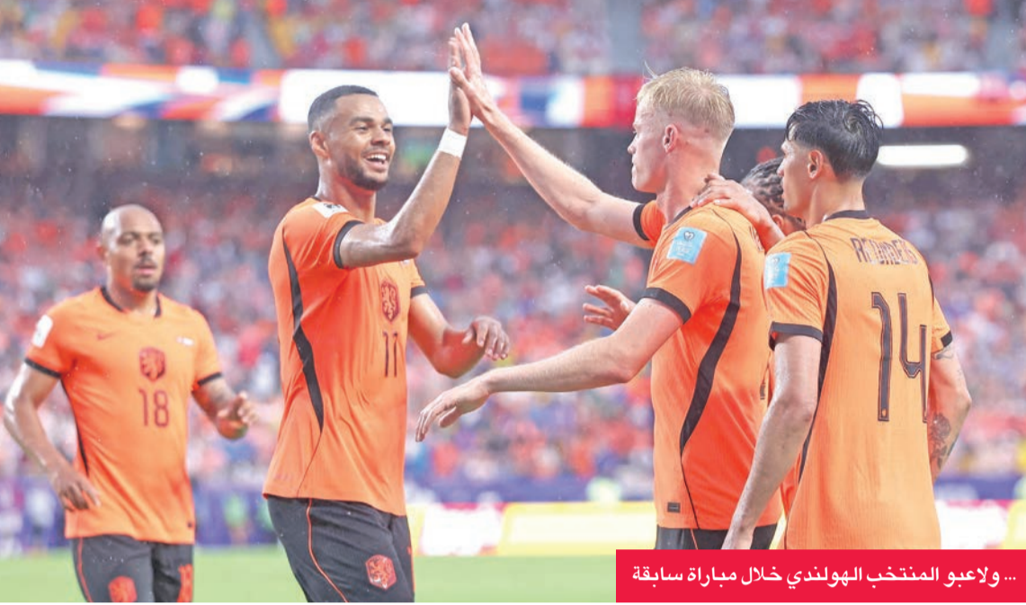
... ولاعبو المنتخب الهولندي خلال مباراة سابقة