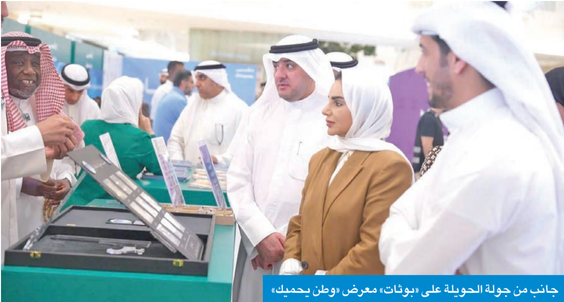
جانب من جولة الحويلة على «بوثات» معرض «وطن يحميك»

بجهد الكوادر العاملة في المعرض والجهات الحكومية والأهلية المشاركة وتعاونها المثمر، الذي أسهم في إنجاح الفعاليات، وإيصال رسالة الحملة إلى الجمهور.