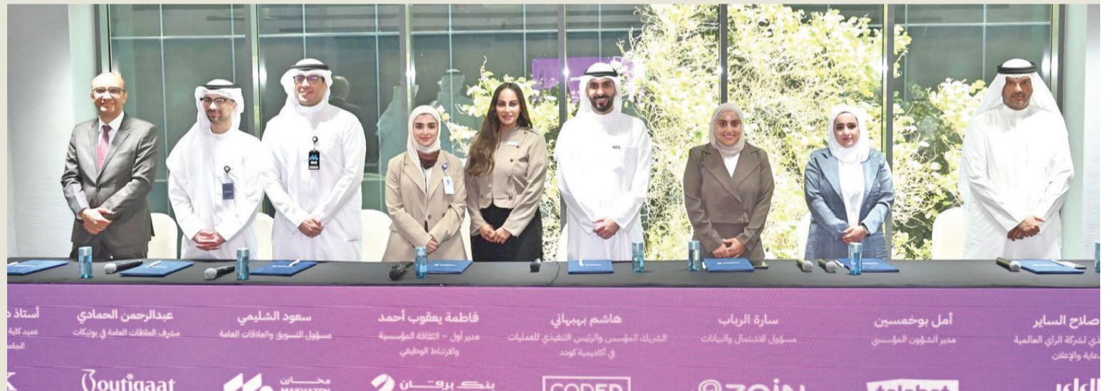
ممثلو البنك في لقطة جماعية مع رعاة برنامج Academy X

نؤمن بأن الفتاة الكويتية تمتلك القدرة على الإبداع والقيادة متى ما أُتيحت لها البيئة المناسبة والأدوات الصحيحة