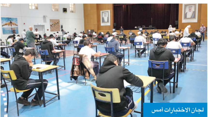
لجان الاختبارات أمس

استمرار الرصد المباشر والتعامل الحاسم مع أي ملاحظات أو تجاوزات بشكل فوري، بما يعزز العدالة وتكافؤ الفرص، ويضمن سلامة سير الامتحانات وفق أعلى معايير النزاهة والانضباط. في مجال آخر، اختتم أمس