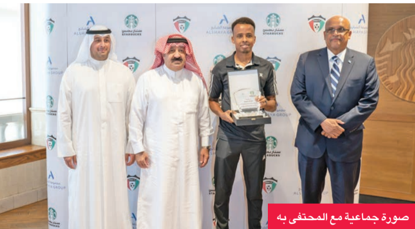
صورة جماعية مع المحققي به

تأكيداً لالتزامها بدعم متميزي التحكيم والرياضة في الكويت