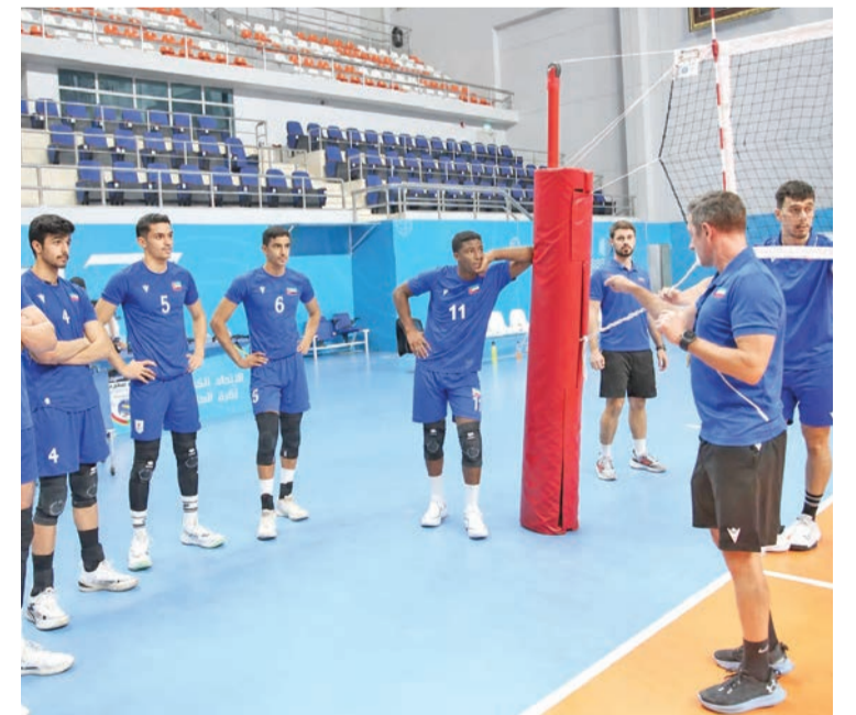
مدرب الأزرق يوجه اللاعبين خلال الحصص التدريبية الأخيرة