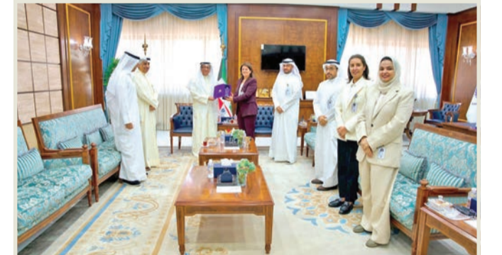
زار الهيئة لتأكيد التكامل بين أجهزة الدولة

بورسلي: «نزاهة» حصن منيع للمال العام وتتمتع باليقظة والإخلاص