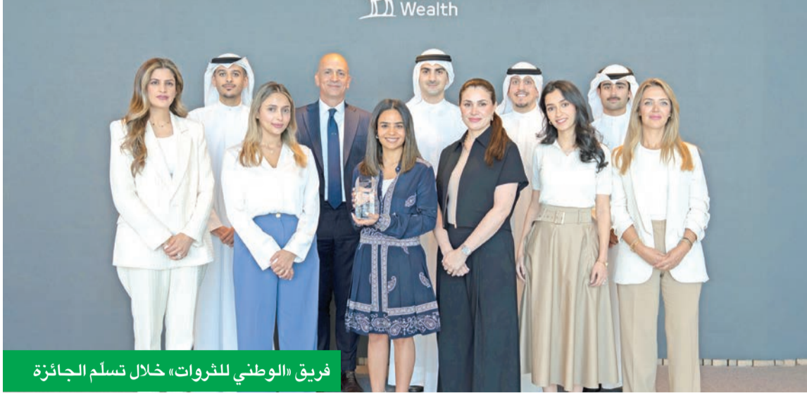
فريق «الوطني للثروات» خلال تسلم الجائزة

تأكيداً لريادتها في مجال إدارة الثروات والخدمات المصرفية الخاصة