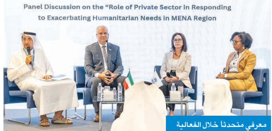
معرفي متحدثاً خلال الفعالية

هذا العام في وقت يواجه العالم تحديات إنسانية متزايدة، موضحاً أن عدد اللاجئين والنازحين قسراً تجاوز 120 مليون شخص نتيجة استمرار النزاعات المسلحة، وتفاقم الأزمات الإنسانية، وتراجع مستويات livelihood المخصص للاستجابة لتهديد الأوضاع، وهو ما يستوجب من المجتمع الدولي مضاعفة جهود، والوفاء