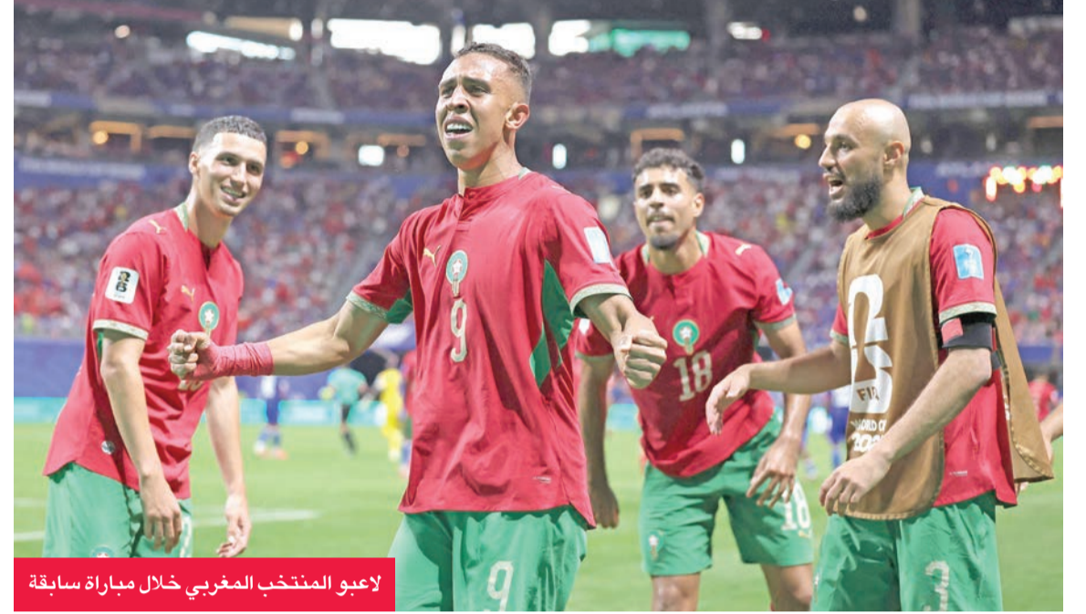
لاعبو المنتخب المغربي خلال مباراة سابقة