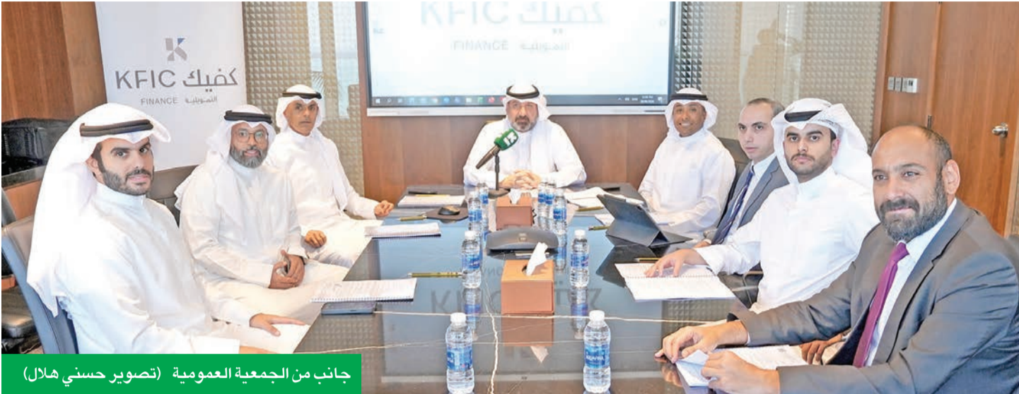
جانب من الجمعية العمومية

ترقب تحويل أنشطة الشركة حسب أحكام الشريعة... وتطلعات للإدراج وفق دراسة تُطلق مستقبلاً