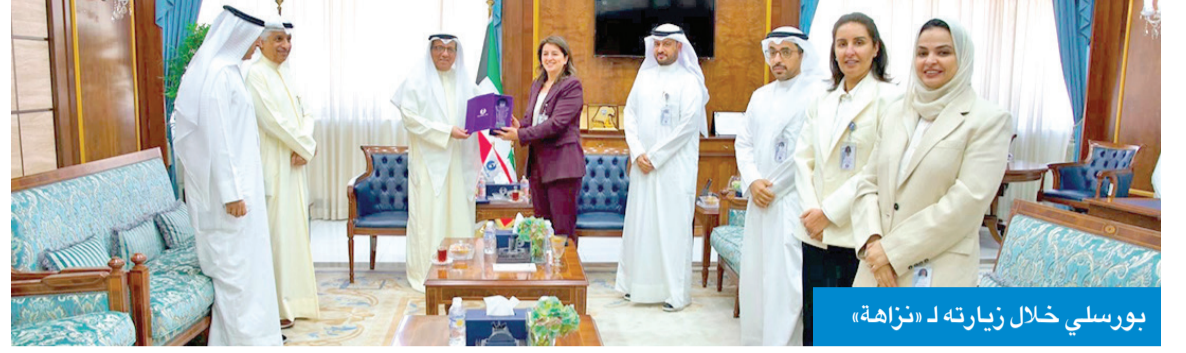
بورسلي خلال زيارته لـ «نزاهة»

رئيس المجلس الأعلى للقضاء يزور هيئة مكافحة الفساد