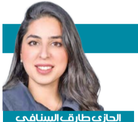
الجزيري طارق السنافي

حفلة في الصيف أنعشت السياحة والناس، هذا مختصر ما حدث بعد أن تم الإعلان عن حفل الفنان راشد الماجد في الكويت منذ أسابيع بفصل الصيف الحار، وسرعان ما امتلأت القاعة بالجمهور في ليالٍ متتالية وإلى اليوم الحديث عن هذه الحفلة الغنائية وتداول فيديوهات مقاطع الأغاني لا يزال «تريند» هذه الحفلات الغنائية والمهرجانات الفنية تعد من أهم الفعاليات التي تضيف روح مختلفة إلى موسم الصيف، فقد أصبحت جزءاً مهماً من السياحة الصيفية وجذب الزوار وتنشيط الحركة الاقتصادية والثقافية، فالفن قادر على جمع الجمهور وصناعة أجواء مليئة لاستعادة الذكريات وإحياء روح الفرح في الكويت، كما يمنح الناس الفرصة «لكسر أجواء» حرارة الصيف وروتين التذمر من عدم وجود فعاليات للناس المحبة للفن.