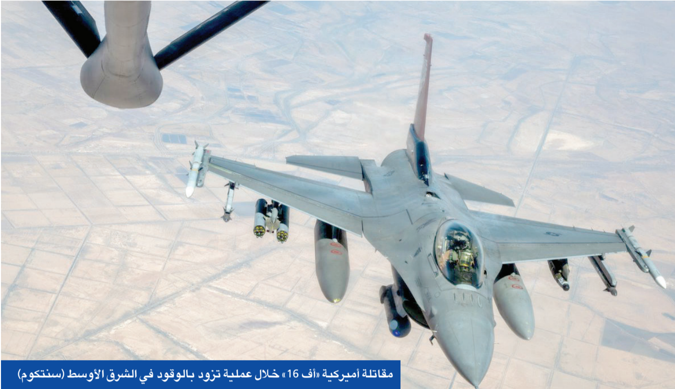
مقاتلة أميركية « أف 16 » خلال عملية تزود بالوقود في الشرق الأوسط (سنتكوم)

● الكويت: استمرار الاعتداءات يقوّض مساعي السلام ويهدد أمن المنطقة واستقرارها ● واشنطن وطهران يتبادلان التهديدات والاتهامات حول انتهاك مذكرة إسلام آباد