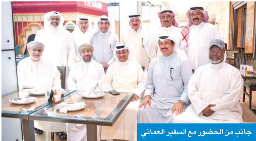
جانب من الحضور مع السفير العماني