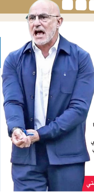
دي لا فوينتي

اعتبر اليوناني جورجوس دونيس، المدير الفني للمنتخب السعودي، أن فريقه لم يكن الطرف الأفضل في المباراة أمام الراس الأخضر التي حسنها التعادل السلبي ليودع الأخضر على إثر ذلك منافسات كأس العالم 2026 من دور المجموعات. وقال دونيس في المؤتمر الصحافي بعد نهاية اللقاء: «شاهدت فريقاً يريد أن يتحز، وكان لدينا مشاكل في خلق الفرص، عندما نتشارك في مواجهة مثل هذه ونعجز عن السيطرة على إيقاع المواجهة يصعب علينا صناعة الفارق، وكان للخصم فرص مباشرة، وبشكل عام لقد لمست إرادة اللاعبين ورغبتهم بالانتصار، لكن صعب علينا خلق الفرص والسيطرة على المواجهة، ولا يمكن الفوز بهذه الطريقة».