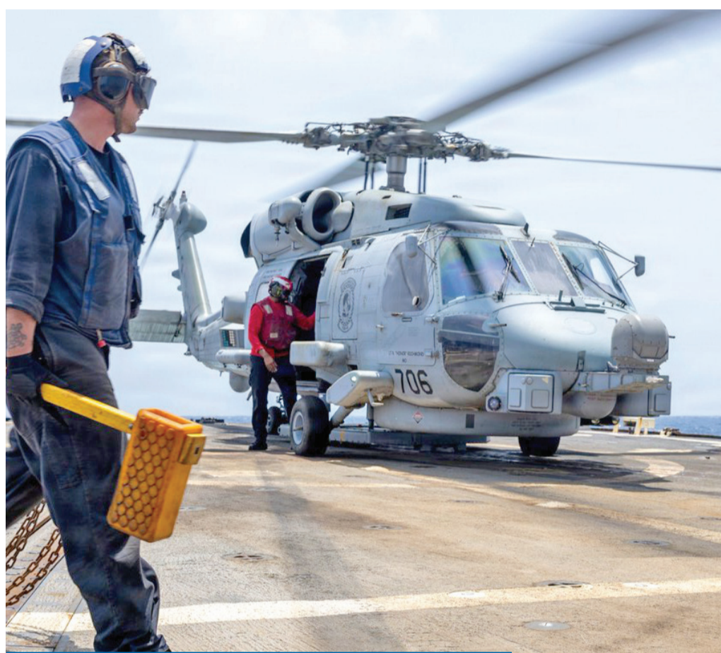
مروحية أميركية قبيل إقلاعها من المدمرة «ديلبورت دي بلاك» (سنككوم)

السياسيون في العالم كالقروء في الغابة، إذا تشاجروا أفسدوا الزرع، وإذا تصالحوا أكلوا المحصول. جورج أوروبيل