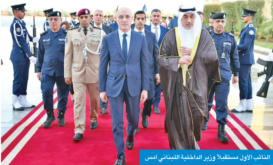
النائب الأول مستقبلاً وزير الداخلية اللبناني أمس

بعث سمو أمير البلاد، الشيخ مشعل الأحمد، ببرقية تهنئة إلى رئيس جمهورية جيبوتي، إسماعيل عمر جيله، عبر فيها سموه عن خالص تهنائيه بمناسبة ذكرى الاستقلال لبلادهم، وتمنى سموه له موفور الصحة والعافية، ولجمهورية جيبوتي وشعبها الشقيق كل التقدم والأزدهار. كما بعث سمو ولي العهد، الشيخ صباح الخالد، ببرقية تهنئة إلى رئيس جيبوتي، ضمنها سموه خالص تهنائيه بمناسبة ذكرى الاستقلال لبلادهم، وراجيا له دوام الصحة والعافية. وبعث سمو رئيس مجلس الوزراء، الشيخ أحمد العبدالله، ببرقية تهنئة مماثلة.