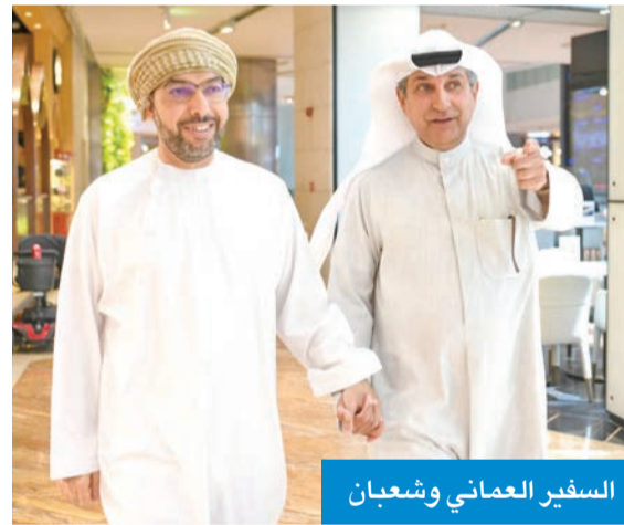
السفير العماني وشعبان

من المواطنين الكويتيين. وذكر أن مثل هذه الدعوات ليست غريبة على الشعب الكويتي الذي تطبع بالأصالة والكرم العربي، مشيراً إلى أنه خلال فترة عمله الدبلوماسي كوّن شبكة علاقات اجتماعية من خلال زيارة وكان بين أهله الذين غمروهم بحبهم وكرمهم غير المحدود، وكانوا خير سند له في أداء مهامه الوظيفية سواء كانت من الجهات الرسمية أو