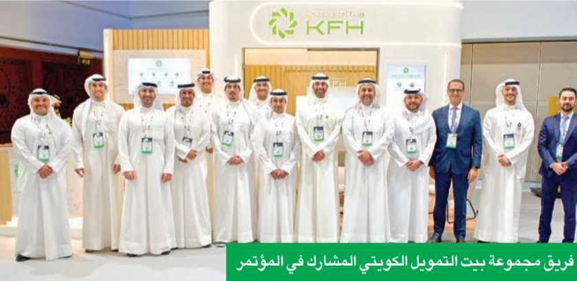
فريق مجموعة بيت التمويل الكويتي المشارك في المؤتمر

للتبادل الرؤى حول توجهات السوق، وبحث البات وفرص التعاون المشترك مع المشاركين.