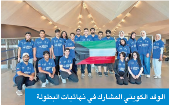
الوفد الكويتي المشارك في نهائيات البطولة

غادر البلاد وفد طلابي كويتي إلى سويسرا، أمس الأول، للمشاركة في نهائيات بطولة العالم لسباق السيارات الهيدروجينية التي تنطلق اليوم بمشاركة 4 فرق طلابية تمثل مختلف المراحل التعليمية.