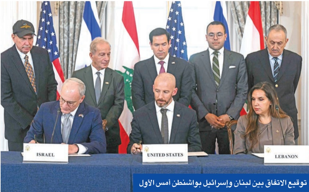
توقيع الاتفاق بين لبنان وإسرائيل بواشنطن أمس الأول

طردت الصين عدة مندوبين بارزين من المؤتمر الوطني لنواب الشعب، وهو برلمان البلاد والهيئة العليا لسلطة الدولة التي تضم ما يقرب من ثلاثة آلاف مندوب. وقال المؤتمر الوطني لنواب الشعب، أمس، إن من بين المسؤولين الـ13 الذين شملتهم القرار، كان هناك 6 جنرالات عسكريين، من بينهم شو شيويه تشيانغ، المسؤول عن تطوير المعدات ضمن اللجنة العسكرية المركزية، الهيئة القوية التي تقود الجيش. ومن بين المطرودين المندوب الحزبي البارز ما شينغغوانغ، عضو المكتب السياسي، الذي شغل منصب سكرتير الحزب الشيوعي في إقليم شينغيانغ.