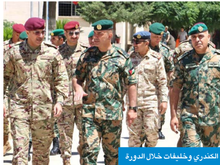
الكندري وخليفات خلال الدورة

التقى مساعد أمر الحرس الأميري، اللواء الركن عادل الكندري، والوفد المرافق له، قائد الحرس الملكي الأردني الخاص، العميد الركن خلدون خليفات، في إطار زيارته الرسمية لمدرسة تدريب الحرس الملكي الخاص في الأردن.