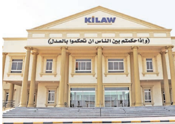
(وإذا حكمتهم بين الناس ان تحكموا بالعدل)

الالتزام بالحضور طوال فترة التدريب، وإعداد مشروع قانوني (تقرير ختامي) يعتمد من الكلية وجهة التدريب، فيما يحصل المشاركون على شهادة تدريب معتمدة تعزز سيرتهم الذاتية. وأكدت أن المفاضلة بين المتقدمين ستتم وفقاً لأعلى المعدلات التراكمية للعام الجامعي 2024/2025، مع مراعاة أولوية التسجيل، داعية الطلبة المستوفين للشروط إلى المبادرة بالتسجيل والاستفادة من هذه الفرصة التي تجمع بين الخبرة العملية والتميز الأكاديمي.