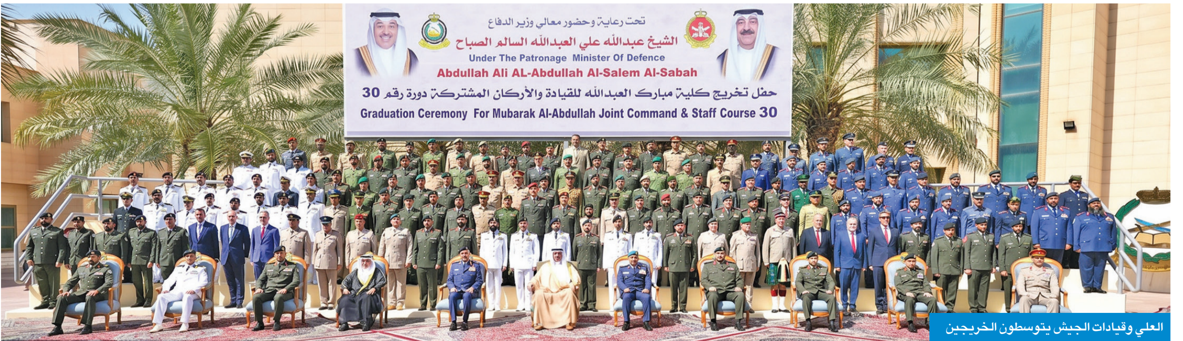
العلي وقيادات الجيش يتوسطون الخريجين

بلغ عدد الدارسين في دورة القيادة والأركان المشتركة رقم (30) نحو 118 دارساً، منهم 59 ضابطاً من الجيش الكويتي، و7 ضباط من وزارة الداخلية، و10 ضباط من الحرس