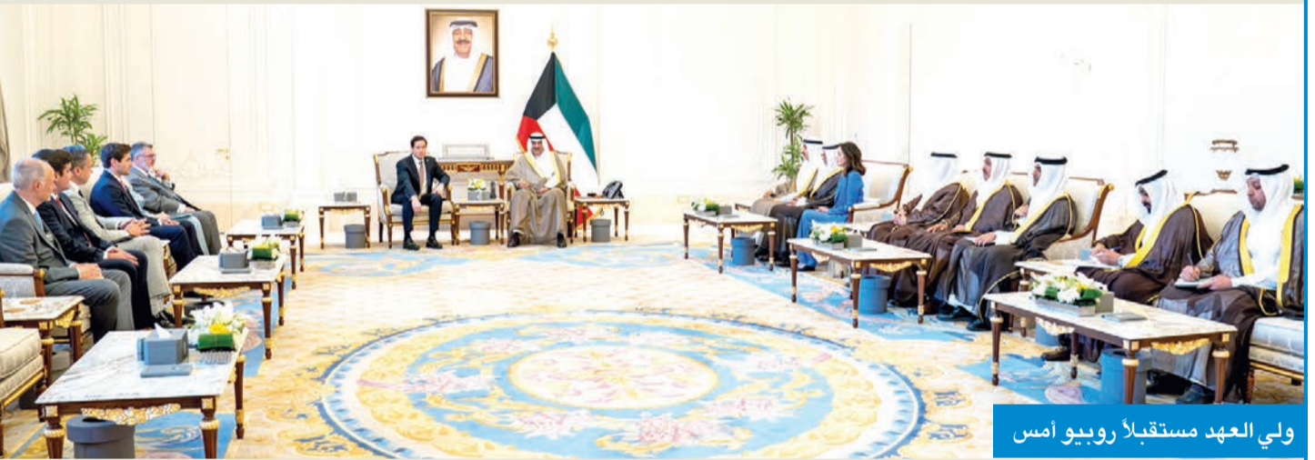
ولي العهد مستقبلاً روبيو أمس

سموه ووزير خارجية أميركا أكد دعم جميع الجهود للحفاظ على أمن المنطقة