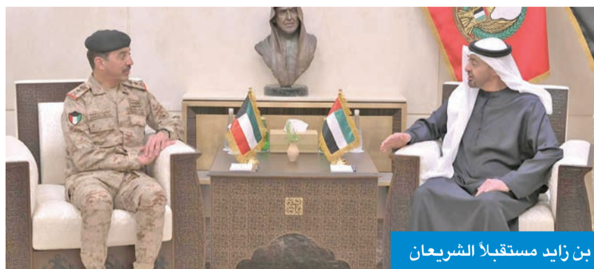
بن زايد مستقبلاً الشريعان

● الشريعان ونظيره الإماراتي يبحثان رفع الجاهزية والكفاءة العملياتية