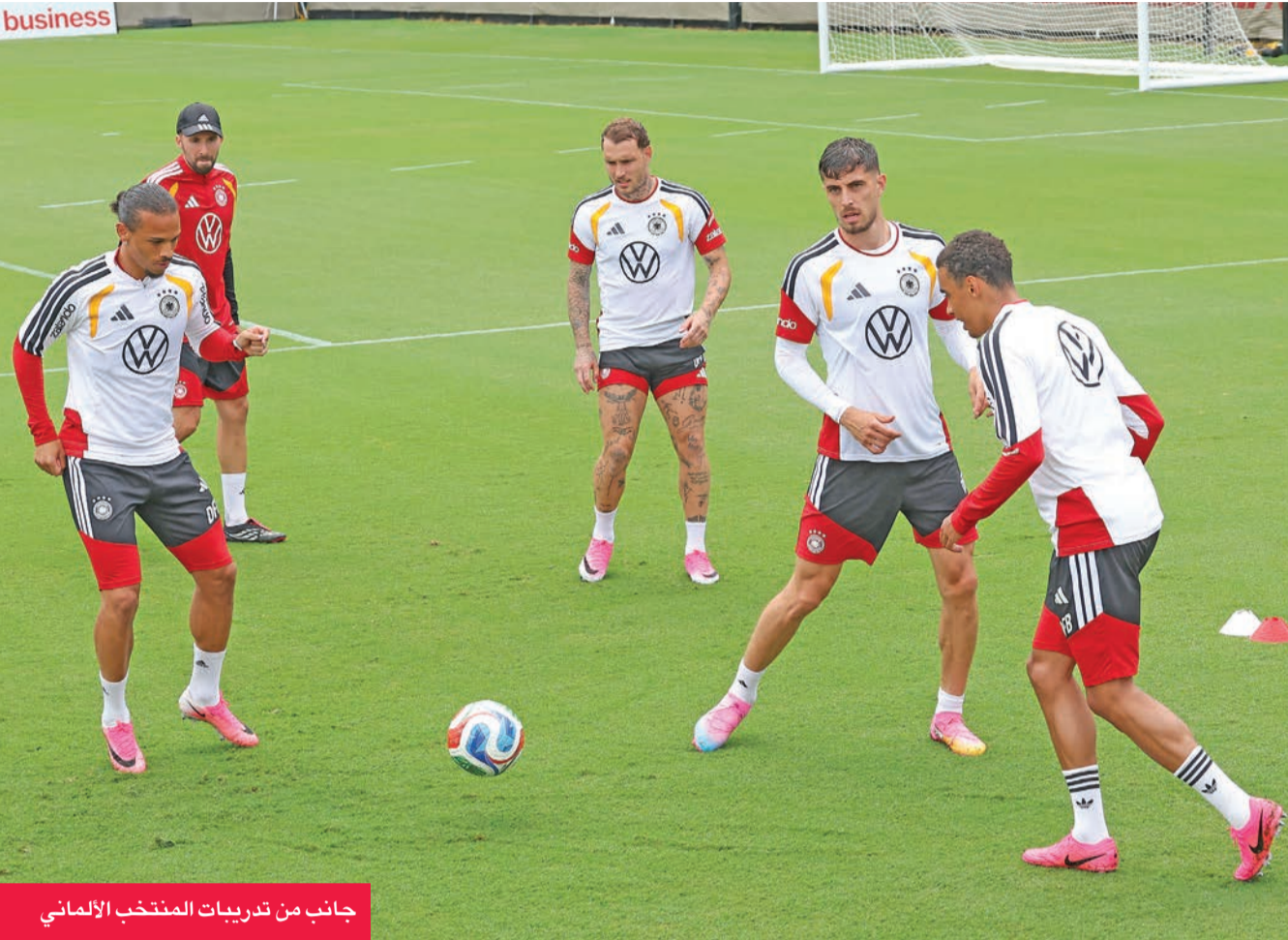
جانب من تدريبات المنتخب الألماني

ولم يستبعد ناغلسمان مكافأة أونداف المتألق باللعب أساسياً في خط الهجوم بدلاً من كاي هافرتز، بينما قد يقدم جيمي ليويلينج وماكسيميليان باير الدعم الهجومي من الأطراف، ليحلا محل ليروي ساني وفلوريان فيرتز. أما بالنسبة للإكوادور، فلا توجد أي إصابات أو مشاكل تتعلق باللياقة البدنية، ومن غير المتوقع أن يجري بيكاسيس تغييرات جذرية على تشكيلته رغم بدايته المتعثرة في كأس العالم.