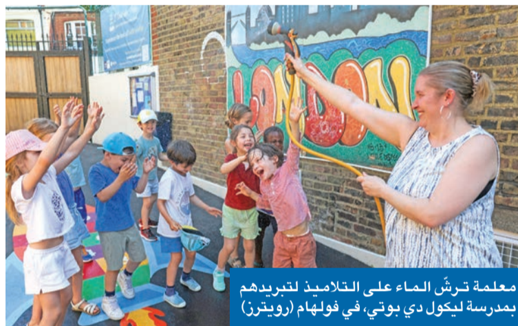
معلمة ترش الماء على التلاميذ لتبريدهم بمدرسة ليكول دي بوتي، في فولهام (روترن)

وفي إيطاليا، أصدرت وزارة الصحة، أمس، إنذاراً أحمر بشأن موجة الحر في 16 مدينة، من بينها ميلانو وروما. وأصدرت هيئة الأرصاد الجوية البولندية تحذيرات من ارتفاع درجات الحرارة في غرب البلاد من اليوم إلى بعد غد السبت.