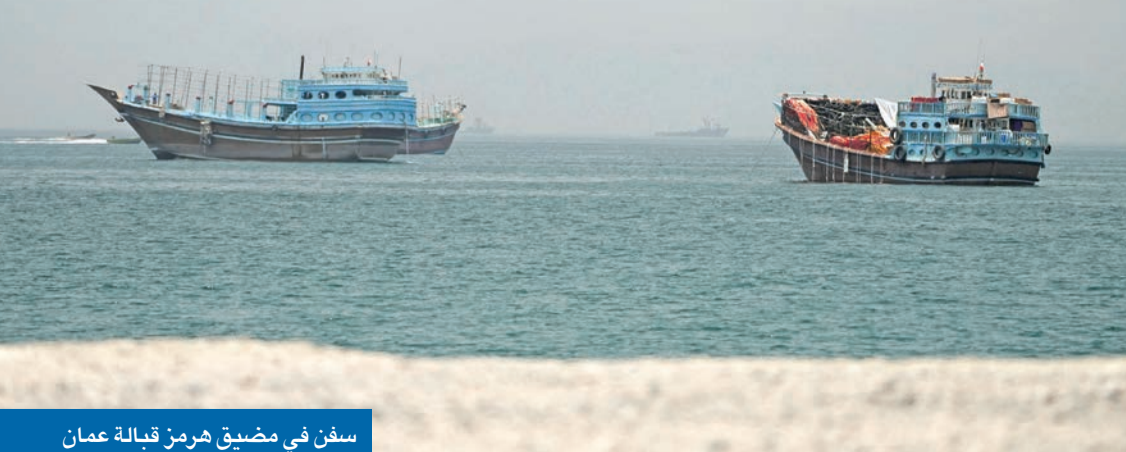
سفن في مضيق هرمز قبالة عُمان

الإيراني طرح صيغة تقضي بتولي طهران عملية تحصيل رسوم من السفن العابرة للممر الملاحي الحيوي، على أن تحصل سلطنة عُمان على حصة من العائدات، مقابل إغلاقها «الممر الثالث» الذي تم فتحه مؤخراً قبالة السواحل العمانية في «هرمز». غير أن هذا المقترح لم يحظ بقبول الجانب العماني، الذي شدد خلال المحادثات على ضرورة العودة إلى الوضع القائم قبل 28 فبراير 2026، أي ما قبل بدء الهجوم الأميركي الإسرائيلي على إيران، بما يضمن استعادة ترتيبات المرور السابقة في هذا الممر البحري الاستراتيجي. وأفاد المصدر، الذي رافق «02»