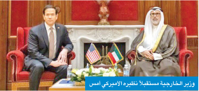
وزير الخارجية مستقبلاً نظيره الأميركي أمس

التقى وزير الخارجية الشيخ جراح الجابر أميراً ووزير خارجية الولايات المتحدة ماركو روبيو بمناسبة الزيارة الرسمية التي يجريها والوفد المرافق إلى الكويت. وقالت وزارة الخارجية، في بيان، إن اللقاء شهد استعراض الشراكة الاستراتيجية الراسخة بين البلدين والشعبين الصديقين، والتأكيد على ما يمثله العام الحالي من محطة بارزة في مسيرة العلاقات الكويتية - الأميركية التاريخية، تزامناً مع الذكرى الخامسة والستين لإقامة العلاقات الدبلوماسية بين البلدين، والذكرى