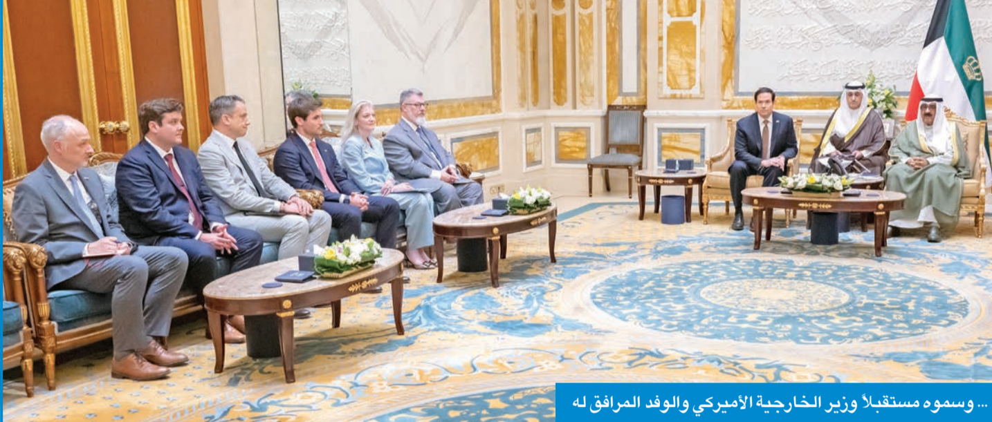
... وسموه مستقبلاً وزير الخارجية الأميركي والوفد المرافق له

● روبيو نقل تحيات وتقدير الرئيس الأميركي لسموه وتمنياته للكويت المزيد من التقدم والازدهار