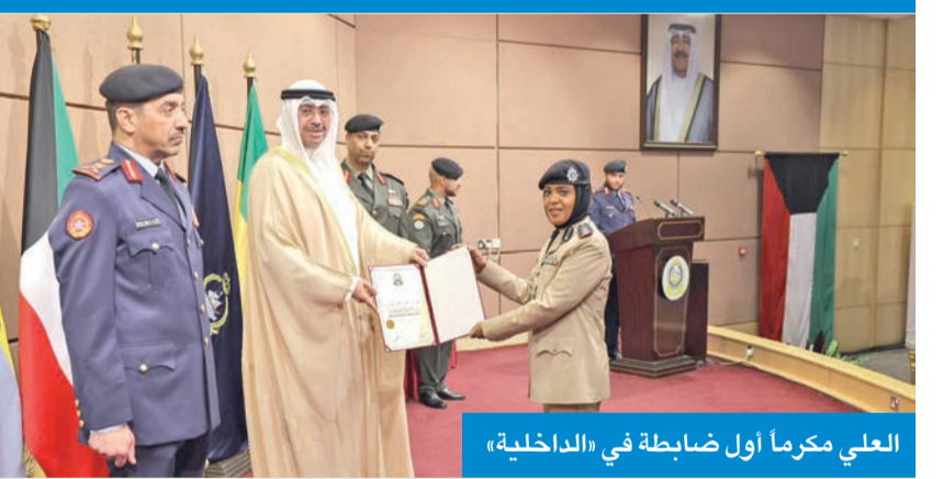
العلي مكرماً أول ضابطة في «الداخلية»

الوطني، إضافة إلى 42 ضابطاً من القوات المسلحة بالدول الشقيقة والصديقة، كما شهدت الدورة تخريج أول ضابطة من العنصر النسائي من منتسبي وزارة الداخلية.