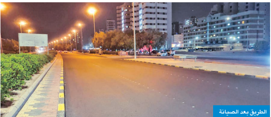
الطريق بعد الصيانة

افتتاح الطريق بين صباح السالم والمسائل باتجاه الفحيحيل بعد صيانتها