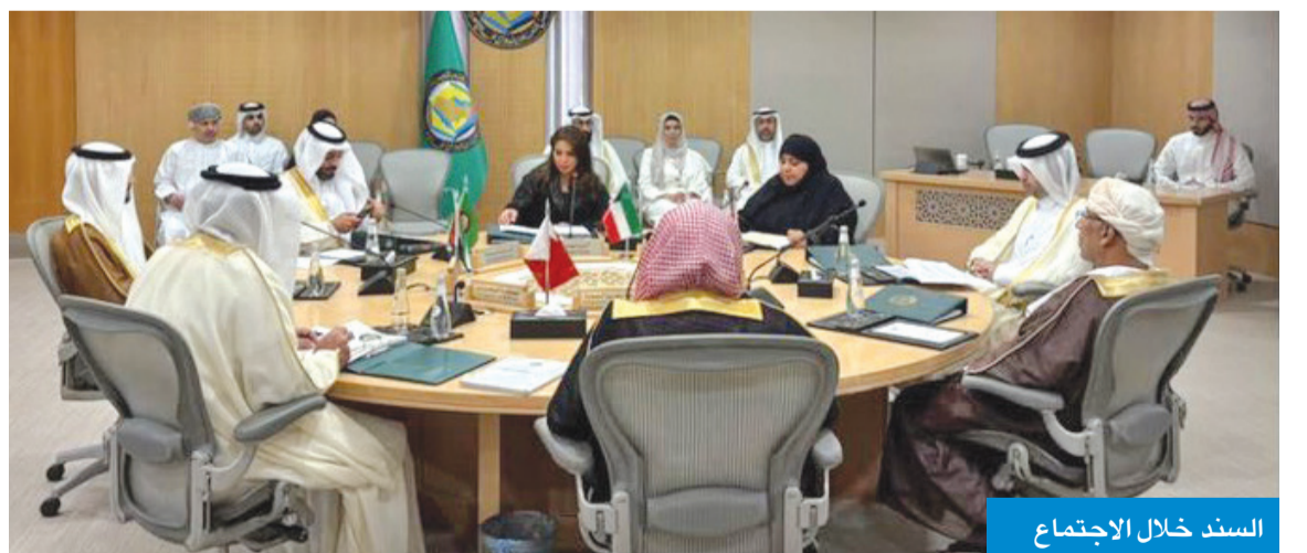
السند خلال الاجتماع

السند شاركت في اجتماع خليجي وأكدت تعزيز التعاون القضائي