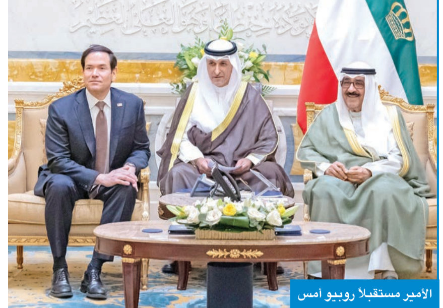
الأمير مستقبلاً روبيو أمس

استقبل سمو أمير البلاد الشيخ مشعل الأحمد وزير خارجية الولايات المتحدة الأميركية ماركو روبيو والوفد الرسمي المرافق وذلك بمناسبة زيارته الرسمية للبلاد. حيث نقل لسموه تحيات وتقدير