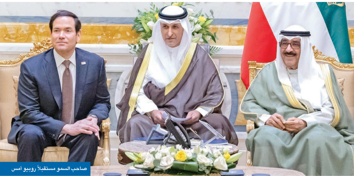
صاحب السمو مستقبلاً روبيو أمس

وزير الخارجية الأميركي: نتطلع إلى تعزيز شراكتنا في مختلف المجالات