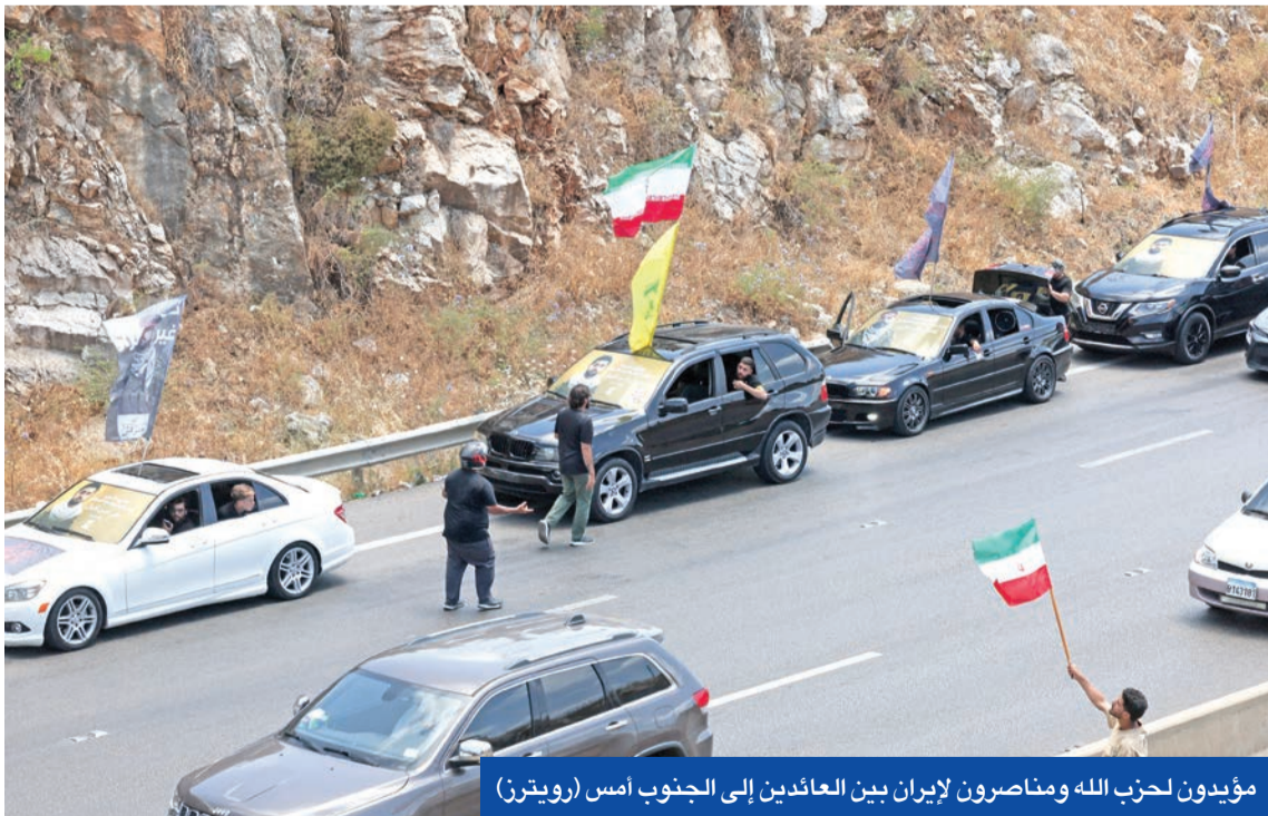
مؤيدون لحزب الله ومناصرون لإيران بين العائدين إلى الجنوب أمس

ولفت إلى مناقشة عدة موضوعات ليست ضمن بنود مذكرة التفاهم مع دول المنطقة، في مقدمتها مسألة الصواريخ الباليستية الإيرانية والوكلاء، بهدف تهدئة مخاوف الحلفاء وربط الوزير إمكانية طلب