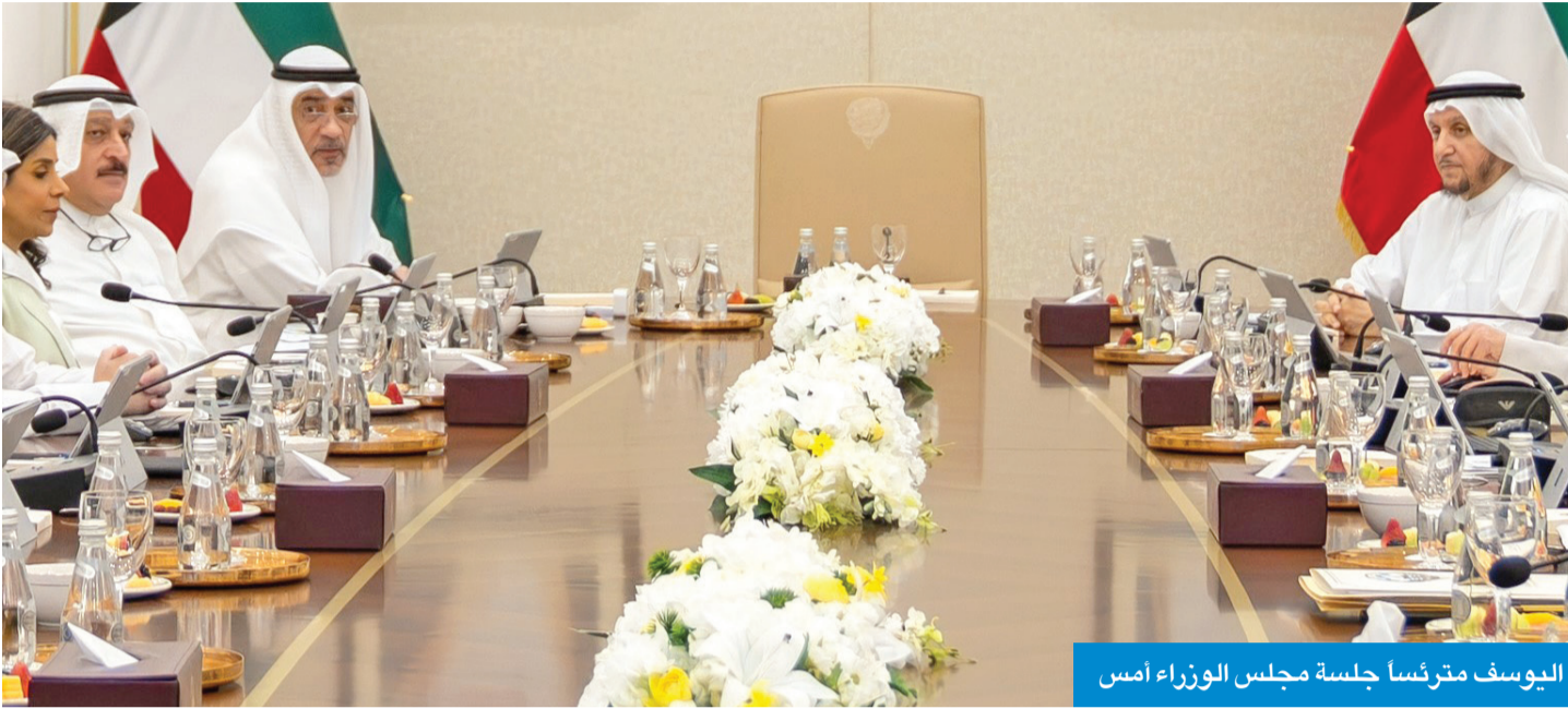
اليوسف مترئسا جلسة مجلس الوزراء أمس

تعقد في مدينة نيويورك من 22 إلى 28 سبتمبر المقبل