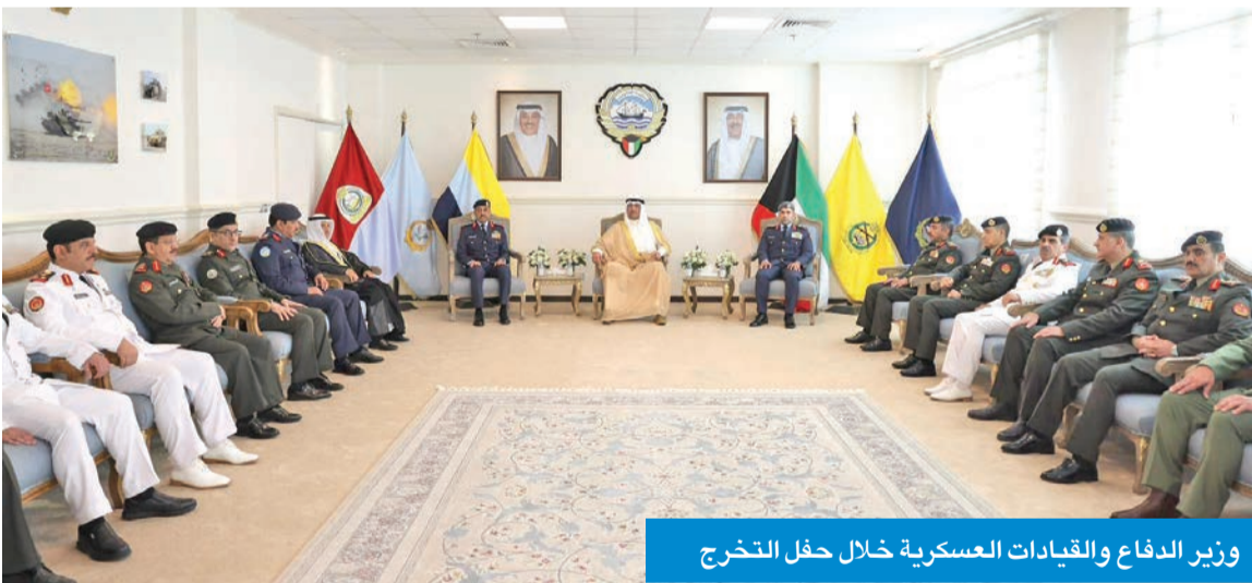
وزير الدفاع والقيادات العسكرية خلال حفل التخرج

الاستمرار في تطوير قدرات الخريجين المهنية لخدمة الوطن وتعزيز الجاهزية