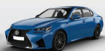
Lexus GS-F Model Year: 2016 & 2019

WINJTHHP5BCOF5000156 TO JTHHP5BCOL5007622