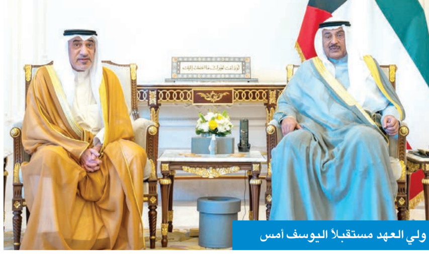
ولي العهد مستقبلاً اليوسف أمس

استقبل سمو ولي العهد الشيخ صباح الخالد، أمس، رئيس مجلس الوزراء بالإناثة وزير الداخلية، الشيخ فهد اليوسف، كما استقبل سموه، وزير