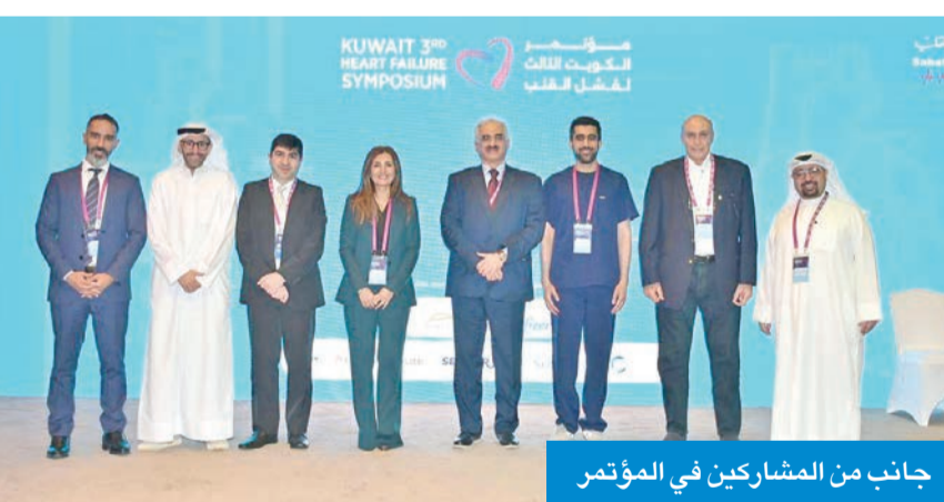
جانب من المشاركين في المؤتمر