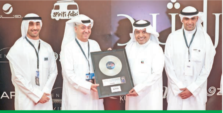
وليد الخشتي يُقدّم درعاً تذكارية من «زين» إلى الفنان راشد الماجد

أعلنت «زين الكويت» رعايتها لحفلات الفنان القدير راشد الماجد في الأرينا، بالتعاون مع شركة روتانا، والتي شهدت إقبالاً واسعاً من الجماهير العاشقة لسندباد الأغنية العربية بعد غياب 6 سنوات عن الكويت، وقدمت تجربة فنية راقية لا تُنسى لمحبي الأغنية الخليجية والعربية.