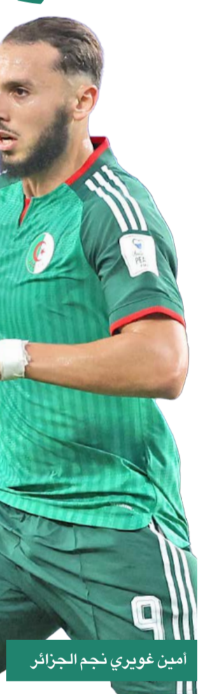
أمين غويري نجم الجزائر

وكان المنتخب الجزائري استهل مشواره في المونديال بهزيمة قاسية أمام الأرجنتين بثلاثية نظيفة، أما المنتخب الأردني، الذي يشارك للمرة الأولى في تاريخه بنهائيات كأس العالم، فقد قدم أداء مشرفا أمام النمسا قبل أن يسقط بنتيجة 3-1، بعدما استقبل هدفين في الدقائق الأخيرة من اللقاء.