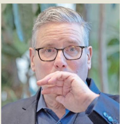
ستارمر في شمال لندن الجمعة

بريطانيا أمام أعلى معدل لتغيير الرؤساء فيما يقرب من قرنين