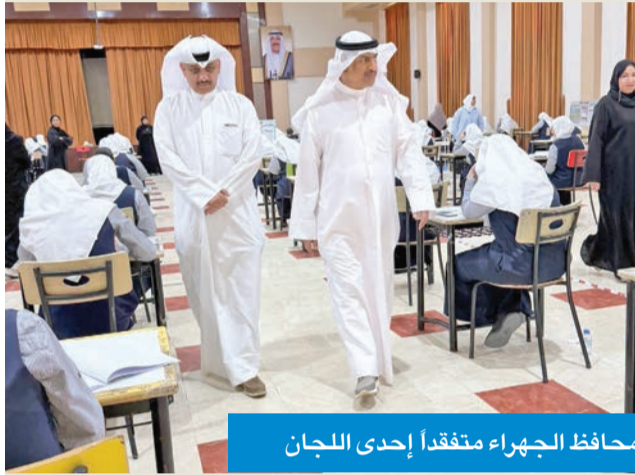
محافظ الجهراء متفقداً إحدى اللجان