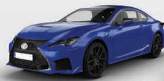
Lexus RC-F Model Year: 2015/2016 & 2020