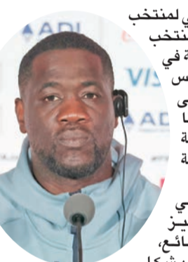
إيميريس فاي، المدير الفني لمنتخب كوت ديفوار

وأمسك سينجو بفخذه بعد التحام مع كاي هافيرتنز، ثم ركل الكرة خارج الخطوط، وبعد ذلك سقط بطريقة جعلته يعود إلى أرض الملعب، ما أدى إلى توقف اللعب. وأثارت هذه اللحظة غضب اللاعبين الألمان، لأنها حرمتهم من رمية تماس سريعة، مما زاد من التوتر في المباراة، في الوقت نفسه قال فاي: «كنا نود أن يعيدوا لنا الكرة»، وأضاف أنه دخل في مشادة كلامية مع الظهر الألماني ناثانيل براون، «قلت له ببساطة أن يتحلّى بالتواضع. صحيح أنه قدم مباراة رائعة وهو جزء من منتخب قوي جداً، لكن لا اعتقد أنه بحاجة إلى الحديث بسوء عنا فقط لأن فريقه كان متأخراً أو لأن النتيجة كانت 1-1 ويريد الفوز».