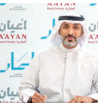
توقيع عقد النادي الصحي النسائي مع «سبارك»

واختتم الترتيب تصريحه قائلاً: «يمثل المشروع نموذجاً متكاملاً لتطوير الوجهات الساحلية الحديثة، وينسجم مع أهداف رؤية الكويت 2035 الرامية إلى تعزيز جودة الحياة ودعم قطاعي السياحة والترفيه، وتنتقل إلى أن يسهم المشروع في إعادة إحياء الوجهة البحرية في الفنتاس وتقديم تجربة نوعية تجعله أحد أبرز الوجهات الساحلية في دولة الكويت».