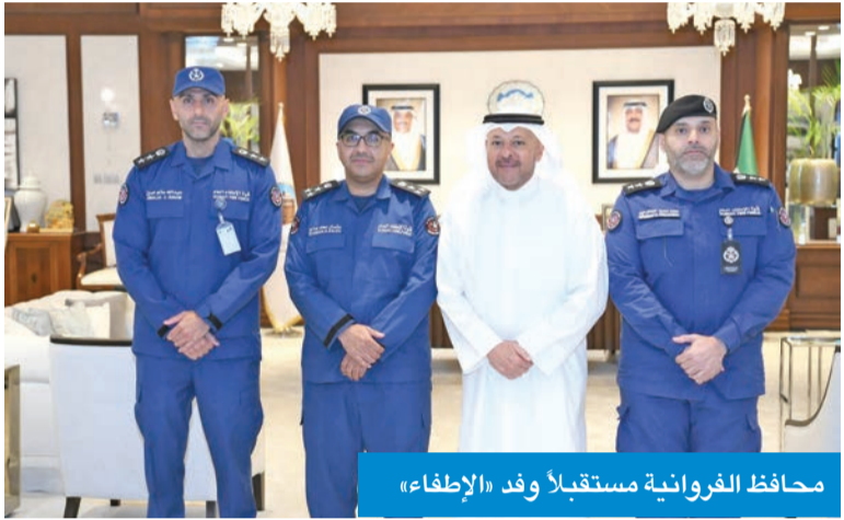
محافظ الفروانية مستقبلاً وفد «الإطفاء»

للحفاظ على سلامة الأرواح والممتلكات، من جانبه، أشاد المحافظ بالدور الحيوي الذي تؤديه إدارة مكافحة إطفاء الفروانية ومنتسبوا، متمناً بجهودهم الميدانية وما يبذلونه من عمل متواصل في سبيل تعزيز منظومة الأمن والسلامة بالمحافظة، ومؤكداً أهمية استمرار التعاون والتنسيق بين مختلف الجهات الحكومية بما يسهم في خدمة المواطنين والمقيمين.