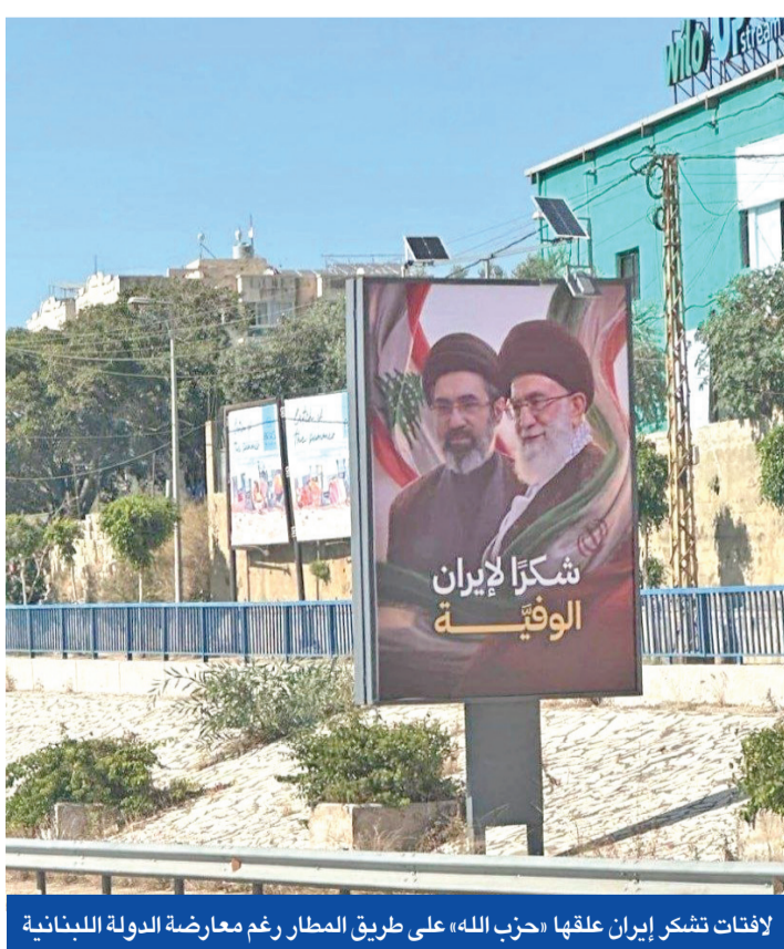
لافات تشكر إيران علقها «حزب الله» على طريق المطار رغم معارضة الدولة اللبنانية

في هذا الطرح، تحديد جهة وسيطة للإشراف على تنفيذ الخطوات الميدانية، حيث لم يتم الاتفاق على الطرف الذي سيؤدي هذه المهمة. من ناحية أخرى، يتمسك لبنان بدور آلية مراقبة وقف إطلاق النار المعروفة بالمكانيزم التي يقودها جنرال أميركي، أو قوات اليونيفيل، في حين ترفض إسرائيل أي دور لها وتوسيع نطاقها لتشمل منطقة مشتركة للتسقيط المباشر، وهو ما يرفضه الوفد العسكري اللبناني الذي يصر على أن يتم أي تسقيط عبر وسيط.