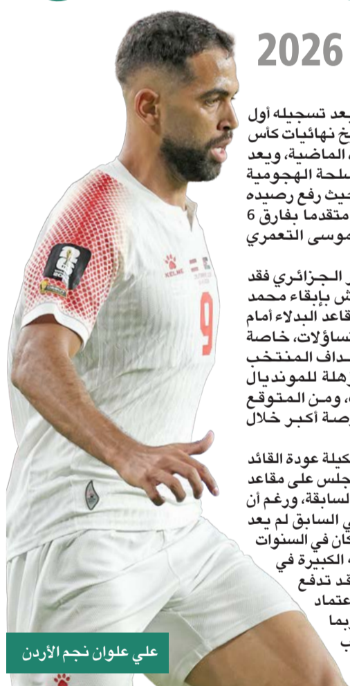
علي علوان نجم الأردن

وقال ميسي: «حاولت أن أجهد نفسي بأفضل طريقة ممكنة لآكون في حالة جيدة بدنيا، وأكون مفيدا، وأساعد الفريق». وأقل من المباريات في الولايات المتحدة مقارنته بذروة مسيرته مع برشلونة، عندما كان يلعب أكثر من 50 مباراة في الموسم. وأدائه في بداية هذا المونديال أثبت أنه لم يفقد حذته، رغم عدم مواجهته لأفضل المدافعين بشكل أسبوعي في الدوري الأميركي.