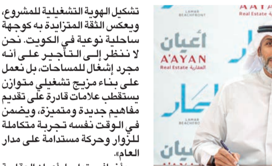
توقيع عقد النادي الصحي النسائي مع «سبارك»

تشكيل الهوية التشغيلية للمشروع، ويعكس الثقة المتزايدة به كوجهة ساحلية نوعية في الكويت. نحن لا ننظر إلى التأخير على أنه مجرد إشغال للمساحات، بل نعمل على بناء مزيج تشغيلي متوازن يستقطب علامات قادرة على تقديم مفاهيم جديدة وبتميز، ويضمن في الوقت نفسه تجربة متكاملة للزوار وحركة مستدامة على مدار العام.