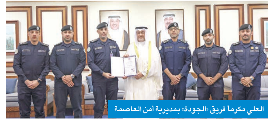
العلي مكرما فريق «الجودة» بمديرية أمن العاصمة

أكد أن حصول مديرية أمن العاصمة على «الأيزو» إنجاز