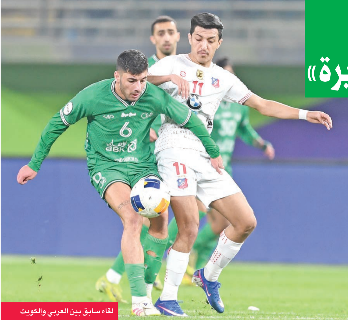
لقاء سابق بين العربي والكويت