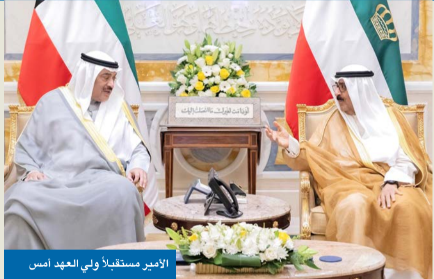
الأمير مستقبلاً ولي العهد أمس

استقبل صاحب السمو أمير البلاد الشيخ مشعل الأحمد، أمس، سمو ولي العهد الشيخ صباح الخالد. كما استقبل سموه رئيس مجلس الوزراء بالإنيابة وزير الداخلية الشيخ فهد اليوسف، ووزير الدفاع الشيخ عبدالله العلي، ووزير الخارجية الشيخ جراح الجابر.