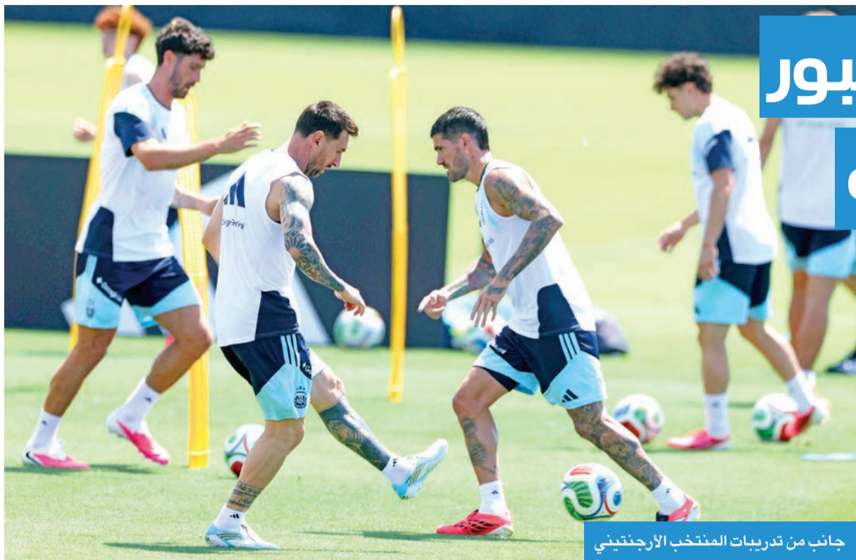
جانب من تدريبات المنتخب الأرجنتيني

عدم المجازفة به والدفع بكونراد لايمر في هذا المركز. وفي خط الوسط، من المنتظر أن يحتفظ النفاثي نيكولاس سايبوالد وتشافي شلاجر بمكانتهما الأساسيين، مع منح كارني تشوكويمبكا دور صانع الألعاب خلف المهاجمين، بينما سيحتاج المهاجم ساسا كالادريتش إلى تقديم مستوى أفضل بعدما تم استبداله بين الشوطين في المباراة الماضية لمصلحة أرناتوفيتش، الذي قد يفرض نفسه خيارا أساسيا هذه المرة.