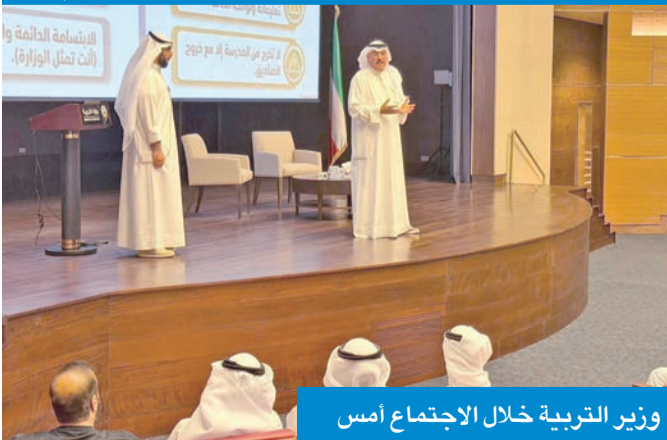
وزير التربية خلال الاجتماع أمس

بالمسؤولية الوطنية، وإيماناً بأهمية دوره في دعم العملية التعليمية والمحافظة على نزاهة الامتحانات وجودة مخرجاتها.