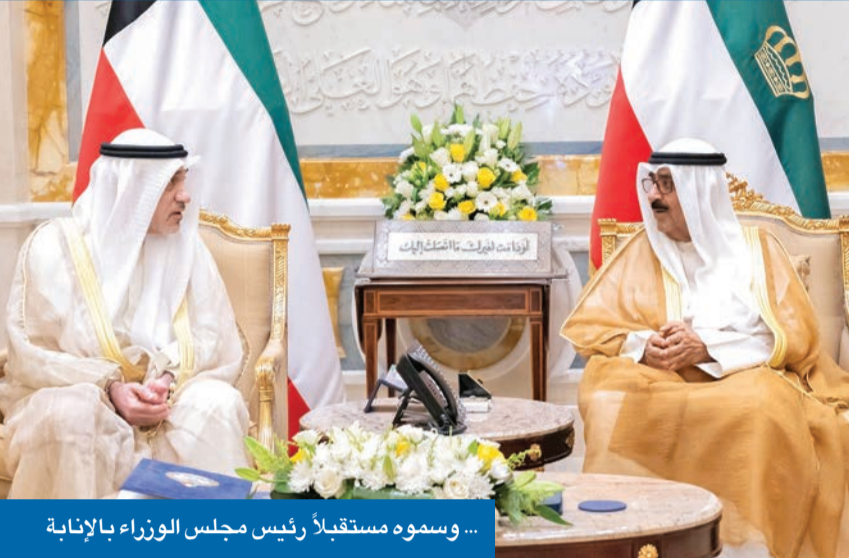
... وسموه مستقبلاً رئيس مجلس الوزراء بالإنيابة