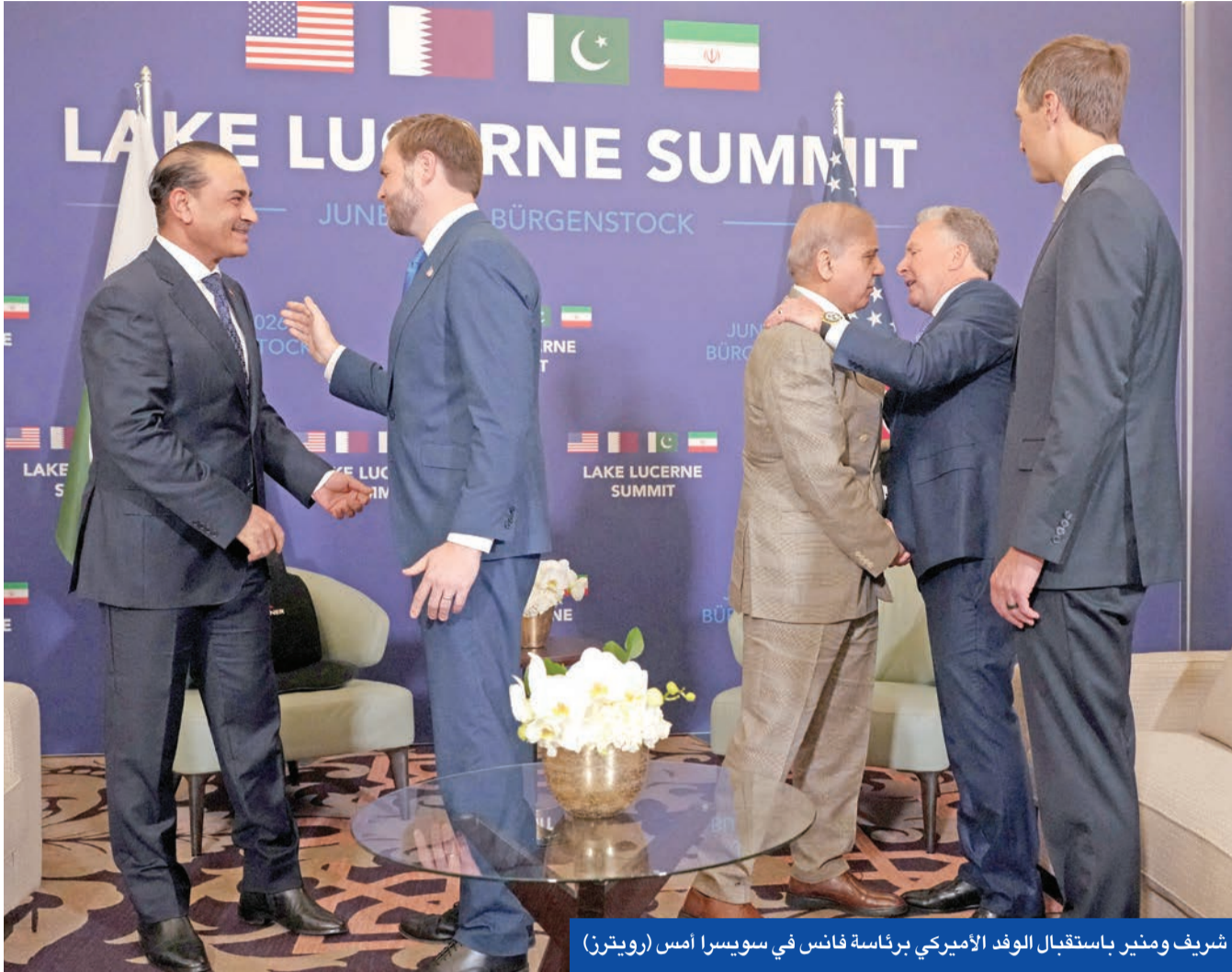
شريف ومينير باستقبال الوفد الأميركي برئاسة فانس في سويسرا أمس

وزراء خارجية مصر والسعودية وباكستان وتركيا يطالبون من القاهرة بمعالجة شواغل الخليج