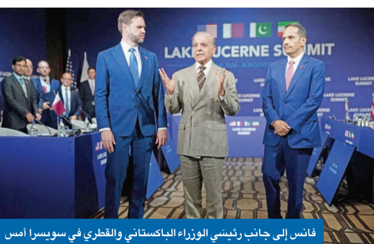
فانس إلى جانب رئيسي الوزراء الباكستاني والقطري في سويسرا أمس

وجه الرئيس الأمريكي دونالد ترامب جملة تهديدات لإيران، بالتزامن مع جولة مفاوضات صعبة عقدها، أمس، وفدان أميركي برئاسة نائب الرئيس جي دي فانس، وإيراني برئاسة رئيس البرلمان محمد باقر قاليباف، في منتجع بورغنشتوك الجبلي على بحيرة «الوسيرن» السويسرية، بحضور رئيسي الوزراء السويسيين الباكستاني شهباز شريف، والقطري محمد بن عبدالرحمن. وعلى وقع الانتقادات لمذكرة التفاهم الأميركية الإيرانية، هدد ترامب بمعاودة قصف إيران، إذا لم تضبط وكلاءها في لبنان فوراً أو بحال أغلقت مضيق هرمز. وفي منشور على منصته الاجتماعية «تروث سوشيل» قال ترامب، في إشارة إلى المواجهات بين إسرائيل وحزب الله: «يجب على إيران أن توقف فوراً وكلاءها المدعومين بسخاء في لبنان عن إثارة المشاكل. وإذا لم 02