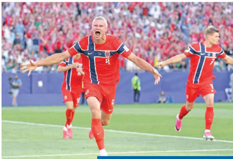
لاعبو المنتخب النرويجي خلال المباراة السابقة

ورغم أملاك الفريقين أسماء بارزة، تكشف الأرقام عن مشاكل فنية، فالنرويج