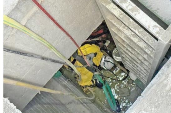
انتشال جثة العامل

منطقة خيطان ظهر أمس، وفور تلقي البلاغ تم تحريك مركزي إطفاء الغروانية وصحبان إلى الموقع. وأضافت الإدارة أنه تبين لرجال الإطفاء أن الحريق اندلع في منزل عربي مكون من 3 أدوار، وأن هناك أشخاصا محشورين جراء الحادث، وقد تمكن رجال الإطفاء من إنقاذ شخصين مصابين بحروق