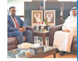
المبارك يبحث مع سفير إثيوبيا تعزيز التعاون في مجال الطيران