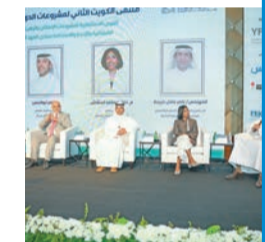
ملتقى «المشروعات التنموية»: توفير بيانات سكانية جاذبة ومستدامة