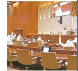
«البلدي» اعتمد ربط «السادس» بمدينة المطلاع عبر طريق سليل الجهراء