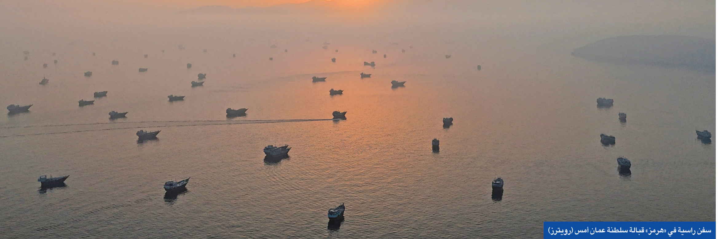
سفن راسية في «هرمز» قبالة سلطنة عمان أمس

● ترامب: النفط يتدفق... وإذا لم نصل لاتفاق نووي فمسعود للضربات أو حراسة المنطقة ● غموض يحيط برسوم مضيق هرمز والإفراج عن الأرصدة الإيرانية المجمدة ومصير لبنان