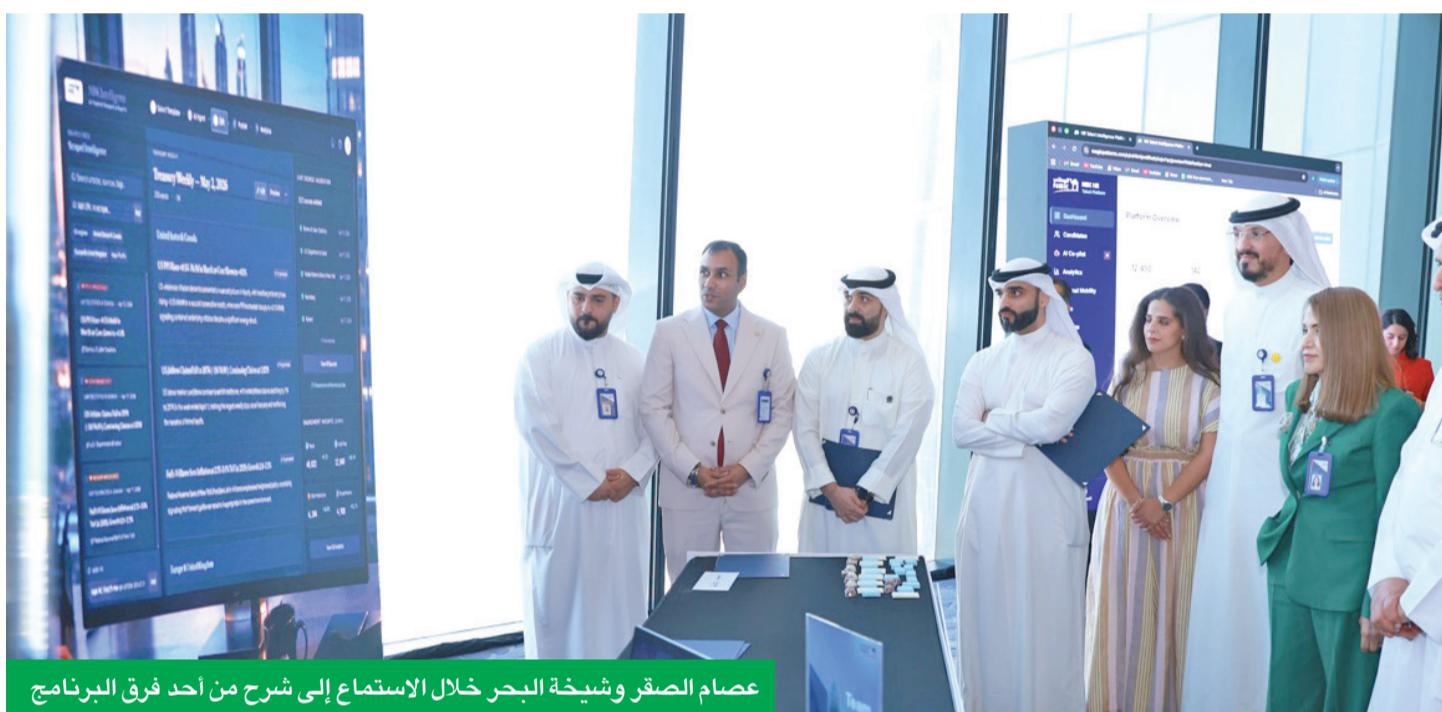
عصام الصقر وشيخة البحر خلال الاستماع إلى شرح من أحد فرق البرنامج

الإرت العريق، من خلال تمكين الموظفين، وتعزيز ثقافة الابتكار، وضمان أن يكون كل موظف شريكاً فاعلاً في رسم ملامح مستقبل الخدمات المالية محلياً وإقليمياً.