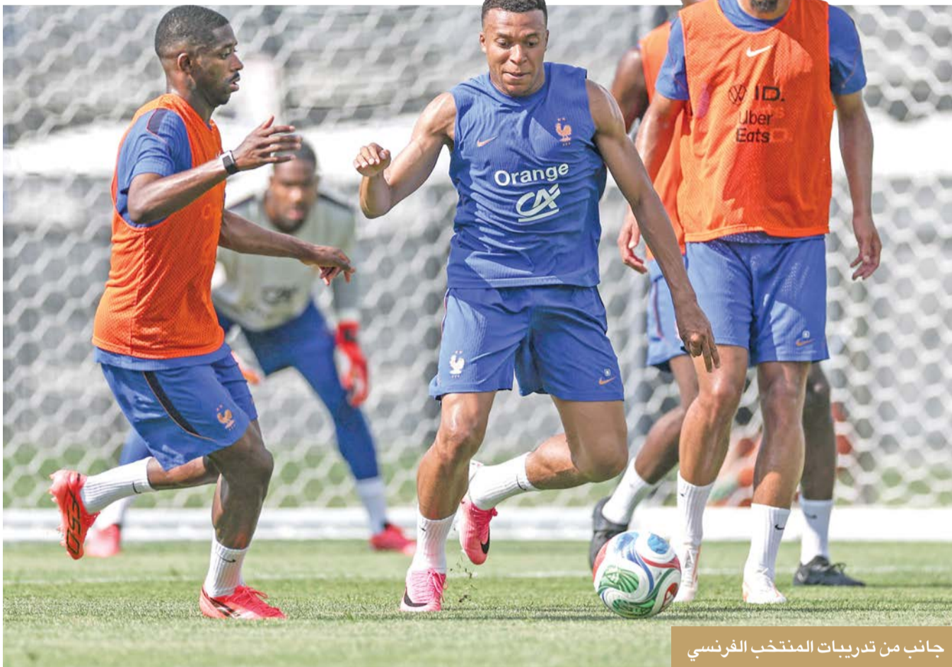
جانب من تدريبات المنتخب الفرنسي

1-2 وكولومبيا 1-3 في مارس قبل خسارته 2-0 أمام كوت ديفوار، ثم الفوز 1-3 على أيرلندا الشمالية خلال الشهر الجاري.