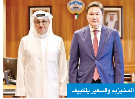
المخيزيم والسفير يلكيف

وأعلنت «الكهرباء» أن هذا اللقاء يأتي في إطار حرص الوزارة على تعزيز الشراكات الدولية وتبادل الخبرات الفنية والمعرفية بما يدعم جهود التنمية المستدامة وبتواكب التوجهات المستقبلية في قطاعي الطاقة والمياه.