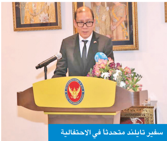
سفير تايلند متحدثاً في الاحتفالية

● «شراكة البلدين تمتد إلى أكثر من 63 عاماً وتدعم رؤية 2035»