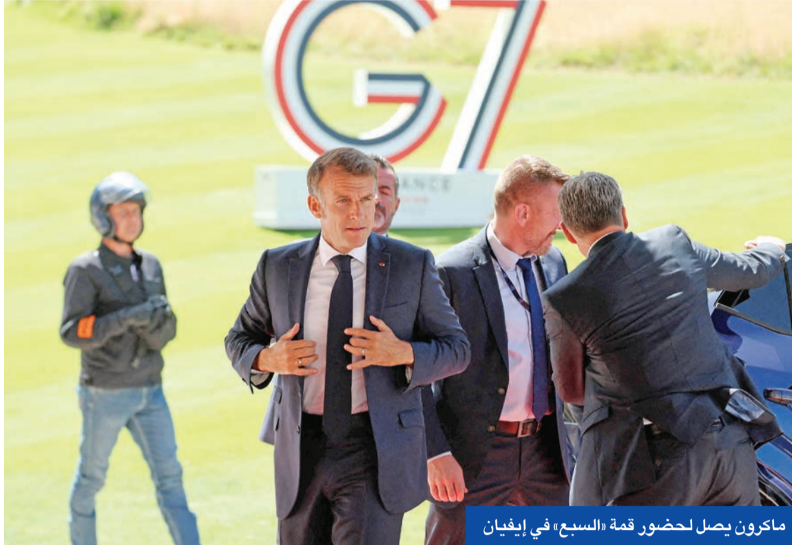
ماكرون يصل لحضور قمة «السبع» في إيفيان