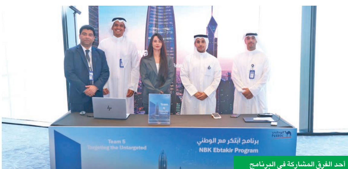
أحد الفرق المشاركة في البرنامج