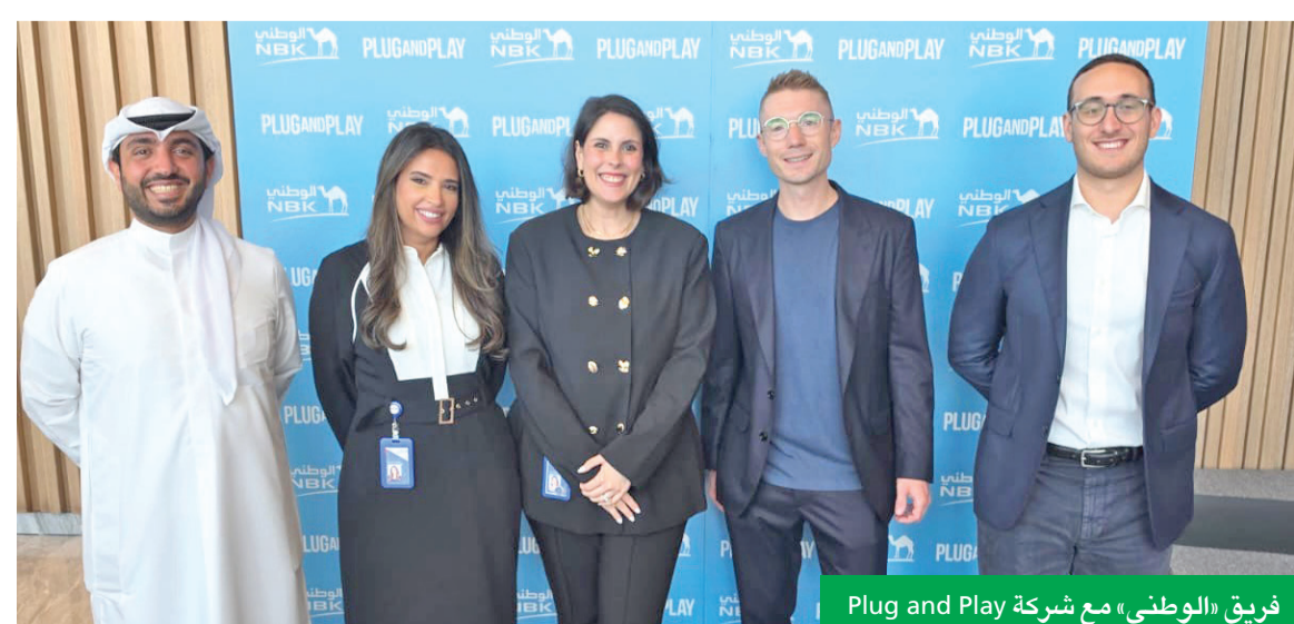
فريق «الوطني» مع شركة Plug and Play