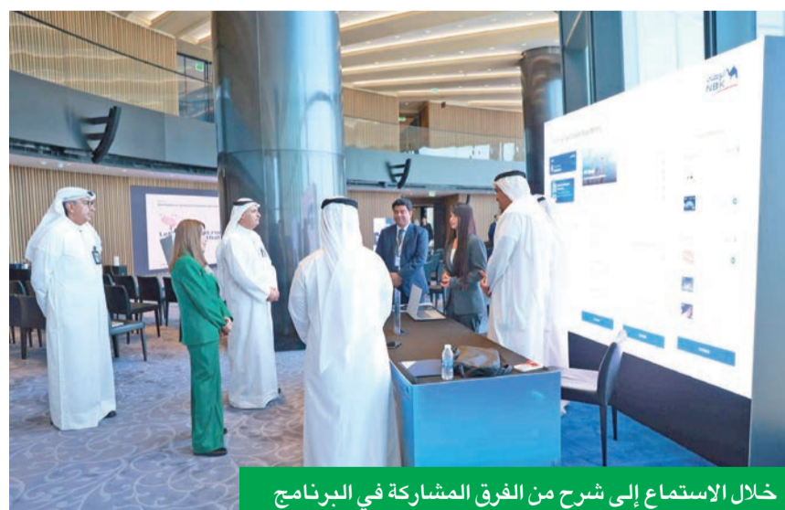
خلال الاستماع إلى شرح من الفرق المشاركة في البرنامج