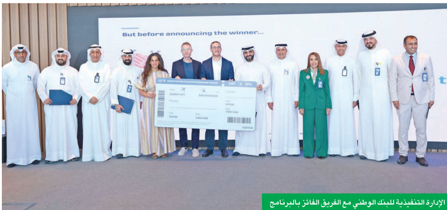
الإدارة التنفيذية للبنك الوطني مع الفريق الفائز بالبرنامج

5 فرق استعرضت النماذج النهائية لمشاريعها في يوم العروض التقديمية