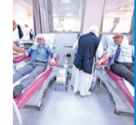
السفير الإيطالي: الكويت مركز للعمل الإنساني