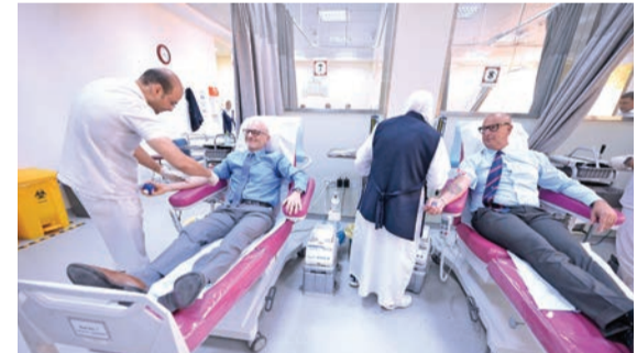
السفير الإيطالي خلال حملة التبرع بالدم