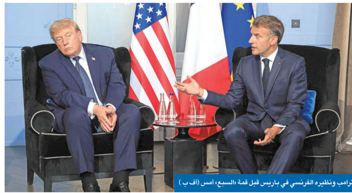
ترامب ونظيره الفرنسي في باريس قبل قمة «السبع» أمس

محاولة مبكرة من «حزب الله» لاستغلال الاتفاق ضد السلطة