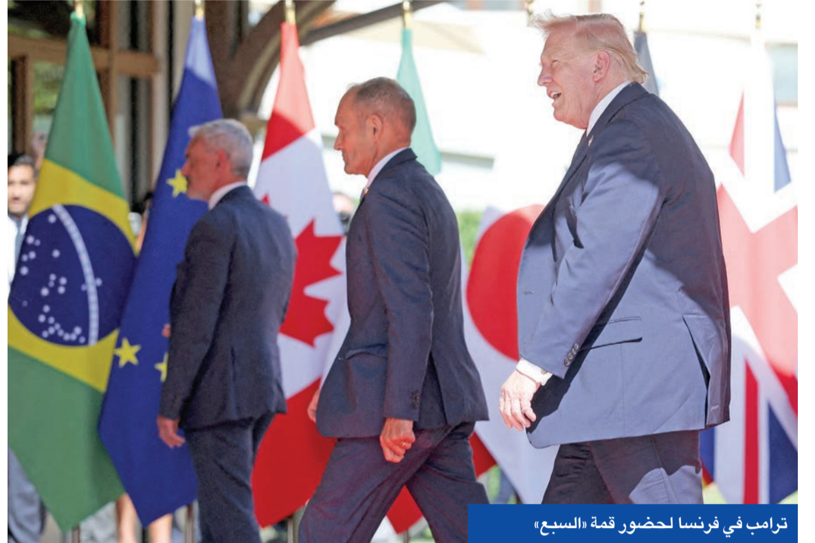
ترامب في فرنسا لحضور قمة «السبع»

تحويله إلى ذلك السلام الدائم الذي نرغب جميعاً في رؤيته يتحقق»، مضيفاً: «نحن واضعون في ضرورة عودة حرية الملاحة دون دفع أي رسوم في مضيق هرمز... يجب ألا تمتلك إيران أبداً سلاحاً نووياً».