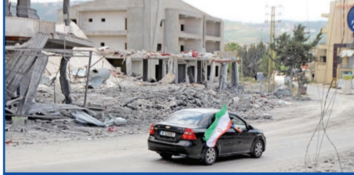
مؤيدو «حزب الله» يرفعون علم إيران خلال عودتهم إلى جنوب لبنان أمس

ووقف القتل والتدمير والتهجير وسائر الماسي والالام التي أنزلت باللبنانيين». وفي تمسك بالمفاوضات، قال سلام: «سوف نضاعف الجهود من خلال المفاوضات الجارية في واشنطن لتأمين الانسحاب الإسرائيلي الكامل من أراضينا والإفراج عن أسرانا».