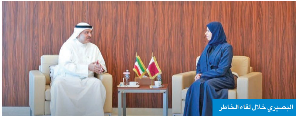
البصيري خلال لقاء الخاطر

العالي، على تعزيز مجالات التعاون مع المؤسسات الأكاديمية المتميزة في المنطقة، ومتابعة أوضاع الطلبة الكويتيين الدارسين في الخارج، بما يضمن توفير أفضل السبل الداعمة لمسيرتهم التعليمية والأكاديمية.