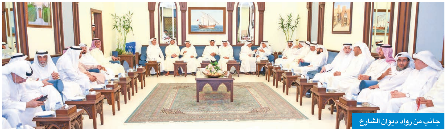
جانب من رواد ديوان الشارخ