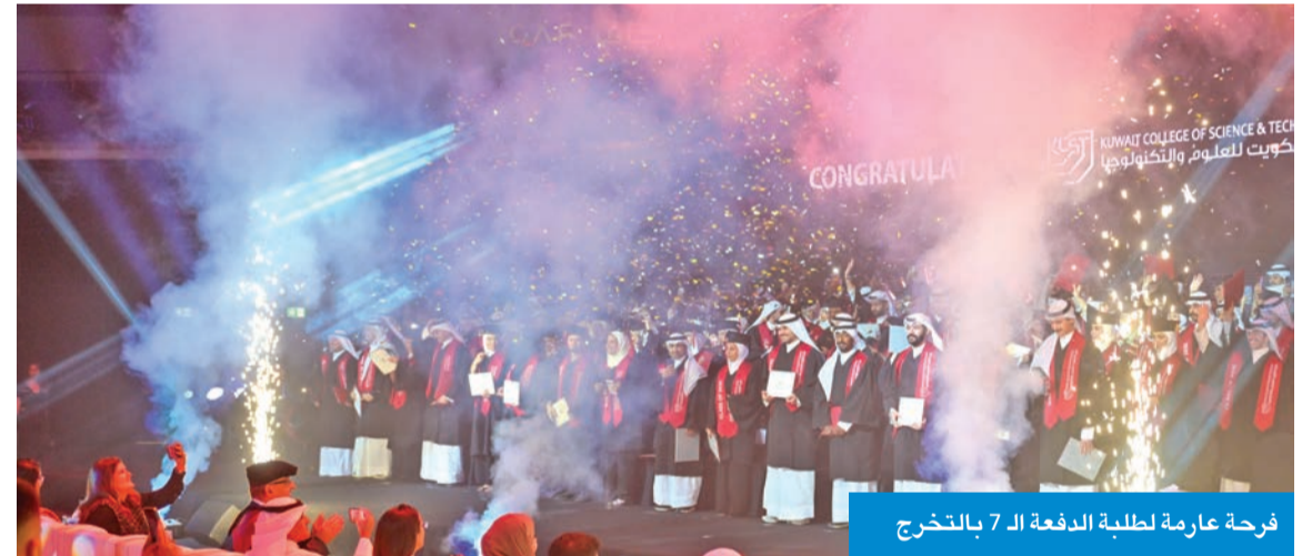
فرحة عارمة لطلبة الدفعة الـ 7 بالتخرج

عبّرت إحدى الطالبات المتفوقات عن فخرها وفرحتها نيابة عن زملائها وزميلاتها الخريجين بهذا التخرج، وقدمت شكرها واعتزازها إلى أعضاء هيئة التدريس في الجامعة على دعمهم وخبرتهم وإخلاصهم في تقديم المعلومات والخبرات الأكاديمية وفق أفضل طرق التدريس لجميع الطلبة لتأهيلهم لمستقبل مشرق. وأعربت عن شكرها لأولياء الأمور على دعمهم المتواصل لأبنائهم وبناتهم الخريجين والخريجات، الذين لم يكونوا ليصلوا إلى هذا اليوم بدونهم.