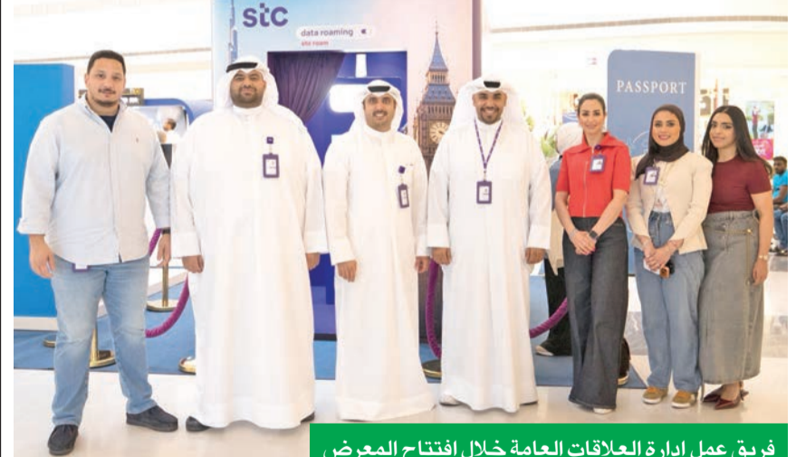
فريق عمل إدارة العلاقات العامة خلال افتتاح المعرض

التزامنا المستمر بالتواصل الوثيق مع عملائنا وتزويدهم بحلول تناسب أنماط حياتهم واحتياجاتهم المتغيرة، وقد أتاح لنا المعرض فرصة مثالية للتواصل المباشر مع الزوار وعرض خدمات التجوال وحلول الاتصال التي تمكنهم من البقاء على اتصال أينما كانوا».