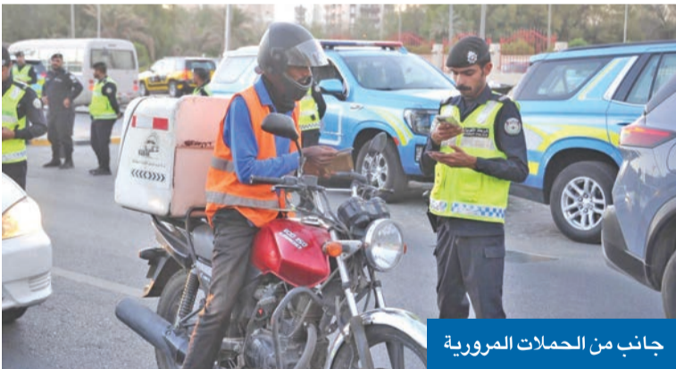
جانب من الحملات المرورية

بلاغات مشاحرة، تمت السيطرة عليها وفصّنها بالطرق القانونية وإحالة أطرأها إلى جهات الاختصاص.