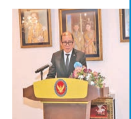
تشاياتوت: 6% من الكويتيين زاروا تايلاند خلال العام الماضي