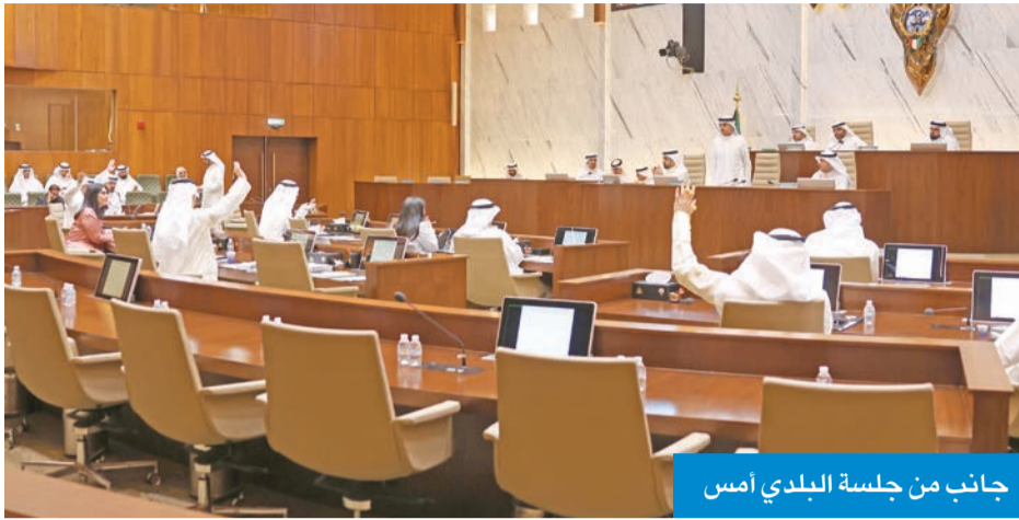
جانب من جلسة البلدي أمس