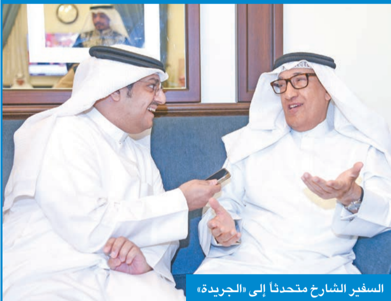
السفير الشارخ متحدثاً إلى «الجريدة»