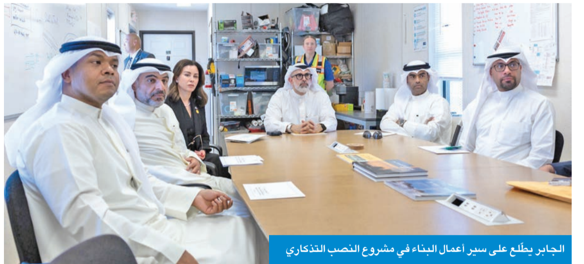
الجابر يطلع على سير أعمال البناء في مشروع النصب التذكاري

دان وزير الخارجية الأميركي، ماركو رويو، الاعتداءات الإيرانية الأثمة على مطار الكويت الدولي التي أدت إلى سقوط ضحايا مدنيين، مؤكداً التزام واشنطن بأمن دولة الكويت واستقرارها. وقال المتحدث باسم وزارة الخارجية الأميركية، تومي