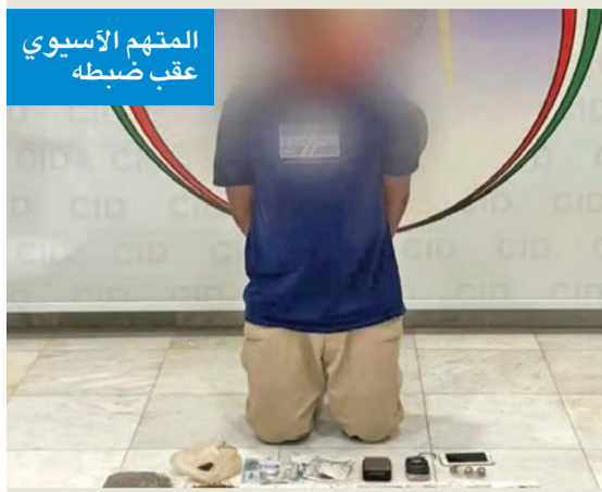
المتهم الآسيوي عقب ضبطه

تمكّن قطاع الأمن الجنائي في وزارة الداخلية، ممثلاً بالإدارة العامة للمباحث الجنائية، إدارة مباحث محافظة مبارك الكبير من ضبط متهم بنغلادشي يحوز مواد مخدرة ومؤثرات عقلية بقصد الاتجار والتعاطي.