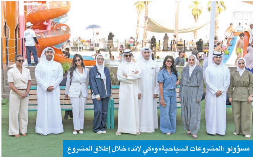
مسؤولو «المشروعات السياحية» و«كي لاند» خلال إطلاق المشروع

أعلنت شركة المشروعات السياحية إطلاق الموسم الصيفي الترفيهي على شاطئ البلاجات، بالتعاون مع «كي لاند»، في إطار شراكة استراتيجية تهدف إلى تطوير وتعزيز قطاع الترفيه العالمي بالكويت، وتقديم تجربة متكاملة تلبى تطلعات الجميع خلال فترة الصيف.