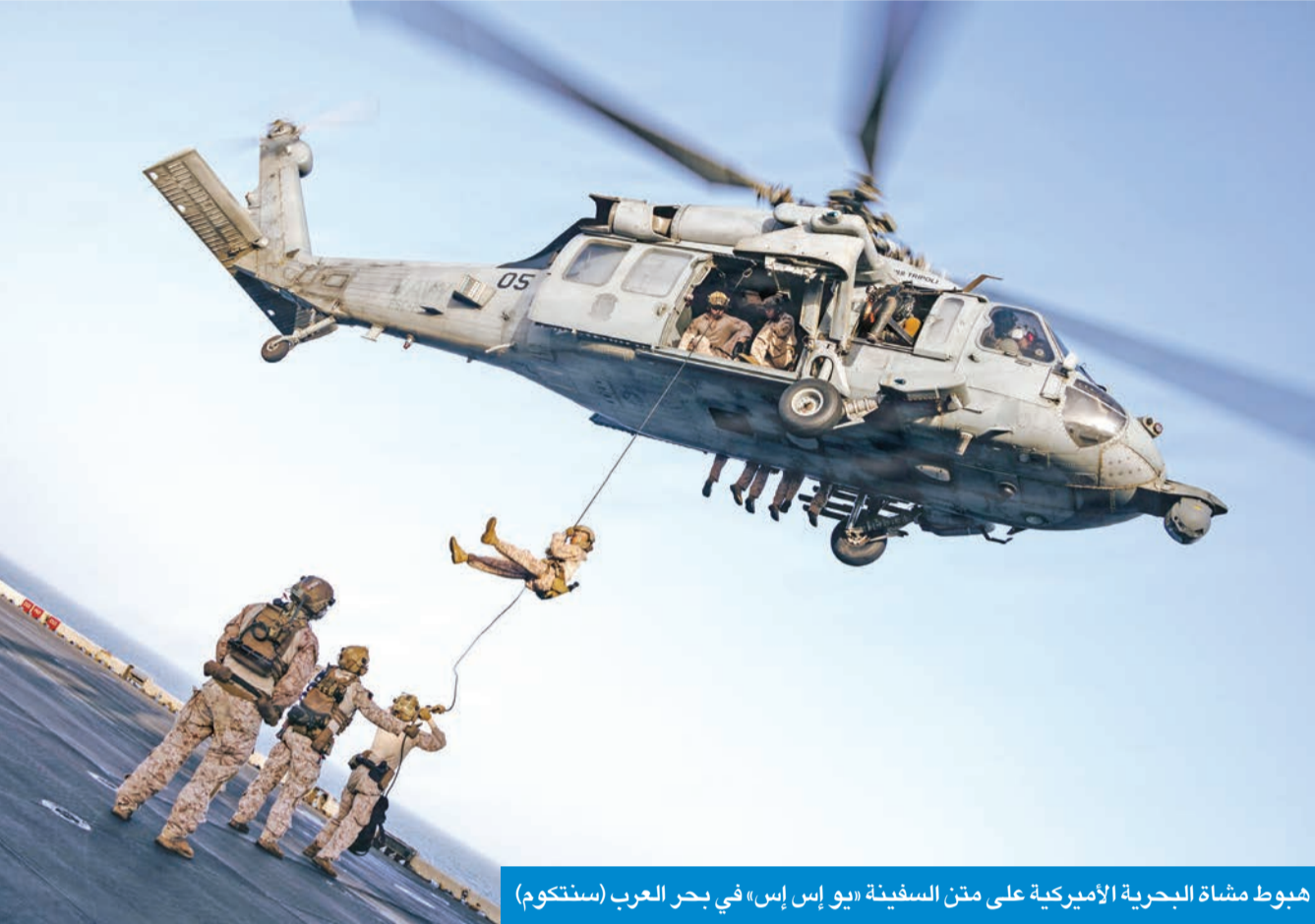
هبوط مشاة البحرية الأميركية على متن السفينة «يو إس إس» في بحر العرب

وأكدت أن الاعتداءات الإيرانية المتواصلة تعني المزيد من التصعيد ودفع المنطقة نحو التوتر وزعزعة الأمن والاستقرار، مشددة على أن هذه الاعتداءات تقوض الجهود الدولية الرامية إلى استعادة الأمن والاستقرار في المنطقة.