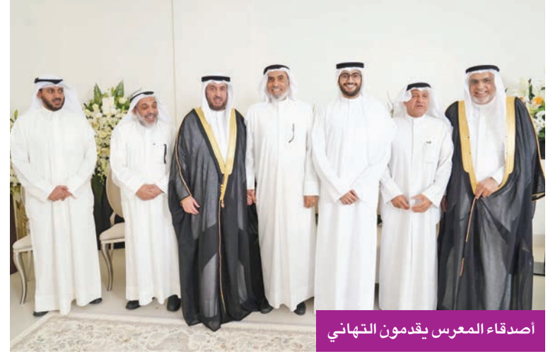
اصدقاء المعرس يقدمون التهاني