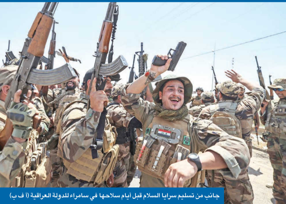
جانب من تسليم سرايا السلام قبل أيام سلاحها في سامراء للدولة العراقية

كشف رئيس اللجنة العليا لحصر السلاح بيد الدولة العراقية، الفريق أول الركن قيس المحمداوي، أن قوات بلاده أخطت هجمات كانت تستهدف دول الخليج خلال الفترة الماضية. وقال المحمداوي، في تصريح أمس، إنه تم اعتقال متورطين في هجمات استهدفت دول المنطقة، مشيراً إلى التوصل إلى «خيوط مهمة» بشأن القضية. وأكد المحمداوي، وهو نائب رئيس هيئة العمليات