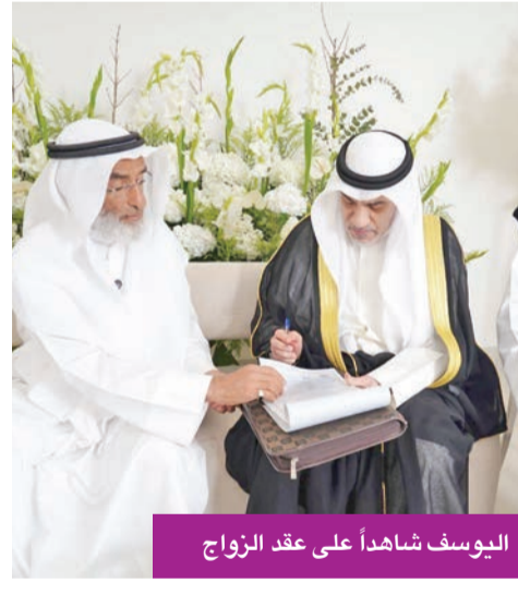
اليوسف شاهداً على عقد الزواج