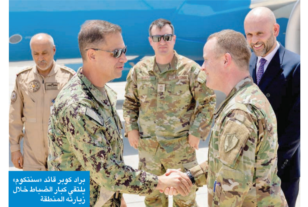
براد كوبر قائد «سنككوم» يلتقي كبار الضباط خلال زيارته المنطقة

واقربت «الخارجية» الإيرانية باستهداف القوات الأميركية لمنشآت