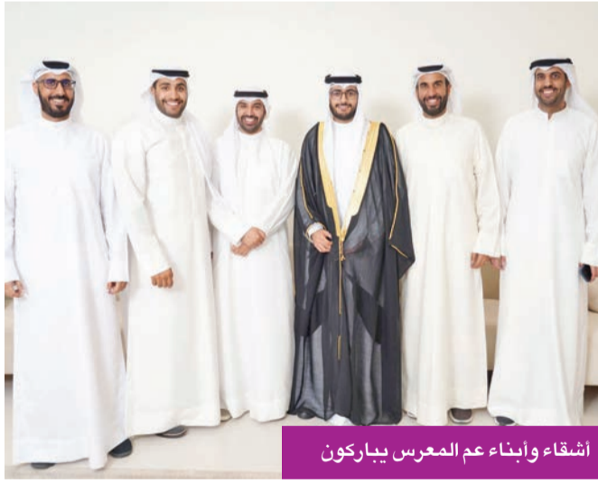
اشقاء وابناء عم المعرس يباركون