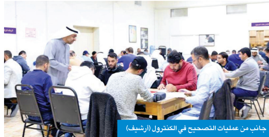
جانب من عمليات التصحيح في الكنترول (أرشيف)

سيد القصاص اعتمد وكيل وزارة الكهرباء والماء والطاقة المتجددة د. عادل الزامل كشف رفع المستوى الوظيفي لموظفي الوزارة (التدرج الوظيفي)، وفقاً للدرجة الوظيفية التي يستحقها كل موظف، وما يقابلها من قيمة مالية. وأشار القرار، الذي حصلت «الجريدة» على نسخة منه، إلى أن «الكشف يضم نحو 3718 موظفاً من مهندسين وإداريين وقانونيين ومالين وفنيين وموظفي حاسوب، وسكرتارية، وغيرها». وتحرص الوزارة من خلال القرار على تحفيز الكوادر الوطنية، وتعزيز بيئة العمل