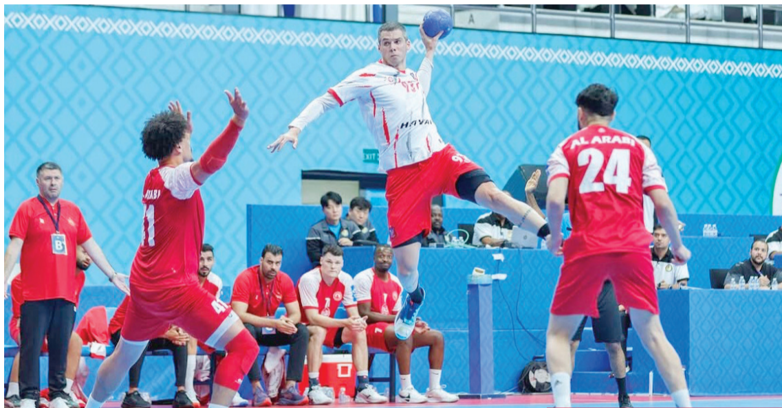
من مباراة الكويت والعربي القطري