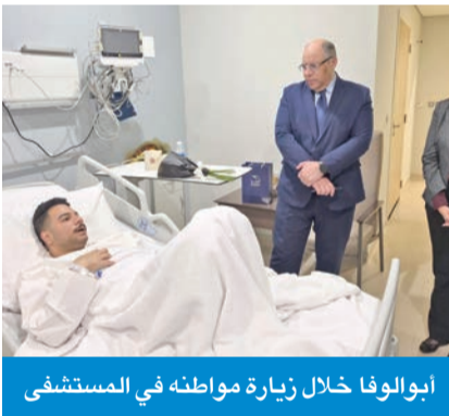
أبولوفا خلال زيارة مواطنه في المستشفى

العلاج، وحالته مستقرة وتحت المتابعة الطبية. وأعرب السفير المصري عن خالص تقديره وامتنانه للسلطات الكويتية، لاسيما وزارتي الداخلية والصحة، لما قدمته من رعاية واهتمام بالمصابين، مشيداً بسرعة الاستجابة وكفاءة التعامل مع تداعيات الحادث، وأكد أن ذلك يجسد النهج الإنساني الراسخ لدولة الكويت بقيادة سمو الأمير مشعل الأحمد، وحرصها الدائم على توفير الرعاية والحماية لجميع المقيمين على أرضها.