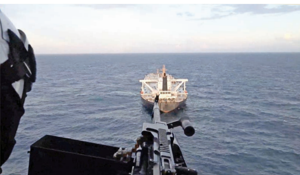
صورة مأخوذة من فيديو لسيطرة القوات الأميركية على ناقلة نفط إيرانية في المحيط الهندي أمس الأول

السعودية تجدد تضامنها مع الكويت والبحرين ودعمها الكامل لكل ما تتخذنه من إجراءات