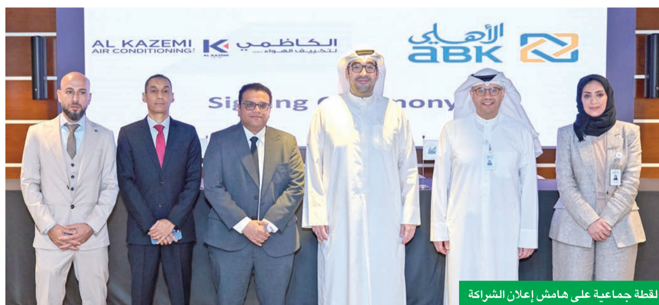
لقطة جماعية على هامش إعلان الشراكة

أثراً ملموساً في حياة العملاء، وهذا ما نسعى إلى تحقيقه اليوم بتوفير الراحة والرفاهية لهم من خلال منصة ABK Build التي نواصل عبرها عقد المزيد من الشراكات لتكون الخيار المثالي في القطاع المصرفي بما يتعلق بالتمويل الإسكاني». من جهته، قال الكازمي «نعتز