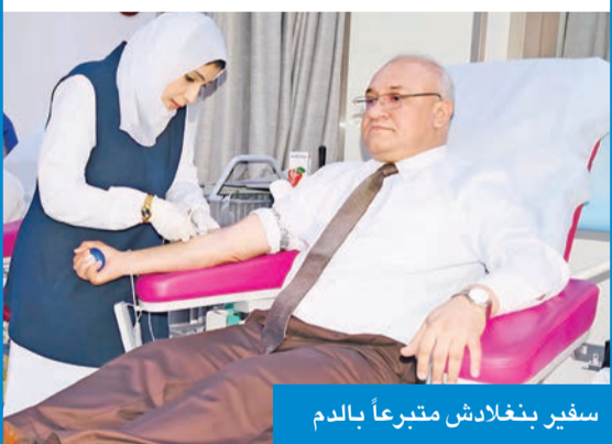
سفير بنغلادش متبرعاً بالدم