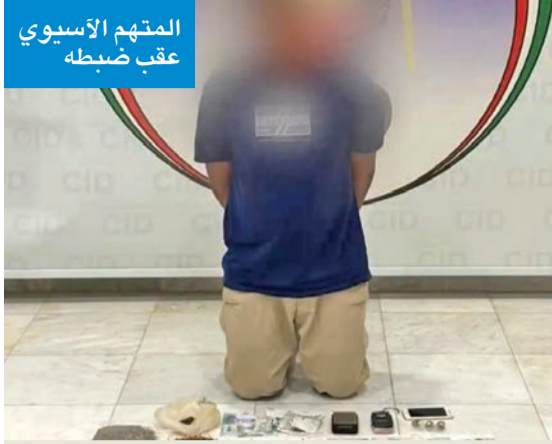
المتهم الآسيوي عقب ضبطه