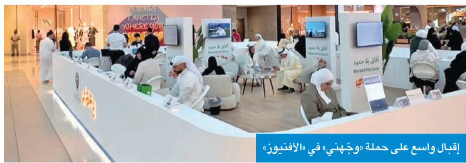
إقبال واسع على حملة «وجهني» في «الافنيوز»

بخطط الابتعاث والإجابة عن الاستفسارات الأكثر شيوعاً. وأفاد بأنه سيتم تخصيص مقر للدعم الفني في برج السحاب، خلال الفترة من 1 إلى 7 يوليو المقبل، لمساندة الطلبة خلال فترة التقديم، إلى جانب استمرار التواصل المباشر مع الطلبة عبر خدمة «سكيب لاينو» للإجابة عن الاستفسارات وتقديم الإرشاد اللازم بما يضمن سهولة