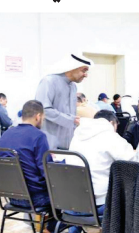
جانب من عمليات التصحيح في الكنترول (أرشيف)

ولفتت إلى أن نتائج الطلبة سترفع بعد اعتمادها على موقع الوزارة الرسمي، إضافة إلى توفيرها عبر تطبيق «سهل» لتكون متاحة لأولياء الأمور للاطلاع عليها،