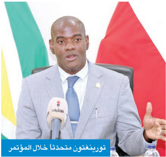
تورينغتون متحدثاً خلال المؤتمر

وأعددة لتعزيز التعاون مع الكويت في مجالات البنية التحتية والتنمية والزراعة والأمن الغذائي والإنشاءات والتعدين والنقط والغاز.