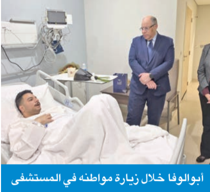
أبولوفا خلال زيارة مواطنه في المستشفى

دان السفير المصري لدى البلاد محمد أبولوفا الهجمات الإيرانية على الكويت، معتبراً أنها تمثل تصعيداً خطيراً يهدد أمن واستقرار المنطقة، ويقوّض الجهود الرامية إلى تعزيز الأمن والاستقرار الإقليمي، مجدداً في الوقت نفسه تأكيد موقف بلاده الثابت في دعم الكويت والتضامن الكامل معها في مواجهة الهجمات الإيرانية. وشدد على مساندة القاهرة لكل ما تتخذه الكويت من إجراءات وتدابير للحفاظ على أمنها واستقرارها وحماية أراضيها ومنشأتها الحيوية. تصريحات أبولوفا جاءت عقب زيارته المقيم المصري بمدوح عرفة، الذي يتلقى العلاج في أحد مستشفيات الكويت، إثر إصابته جراء الهجمات الإيرانية الأثمة التي استهدفت الكويت في 3 الجاري. وأوضح أن 8 مصريين تعرّضوا لإصابات متفاوتة نتيجة الهجمات التي استهدفت مطار الكويت الدولي، حيث تلقى جميع المصابين الرعاية الطبية والعلاج اللازمين، لافتاً إلى أن 7 منهم غادروا المستشفى بعد تحسّن أوضاعهم الصحية، فيما لا يزال مصري واحد يتلقى