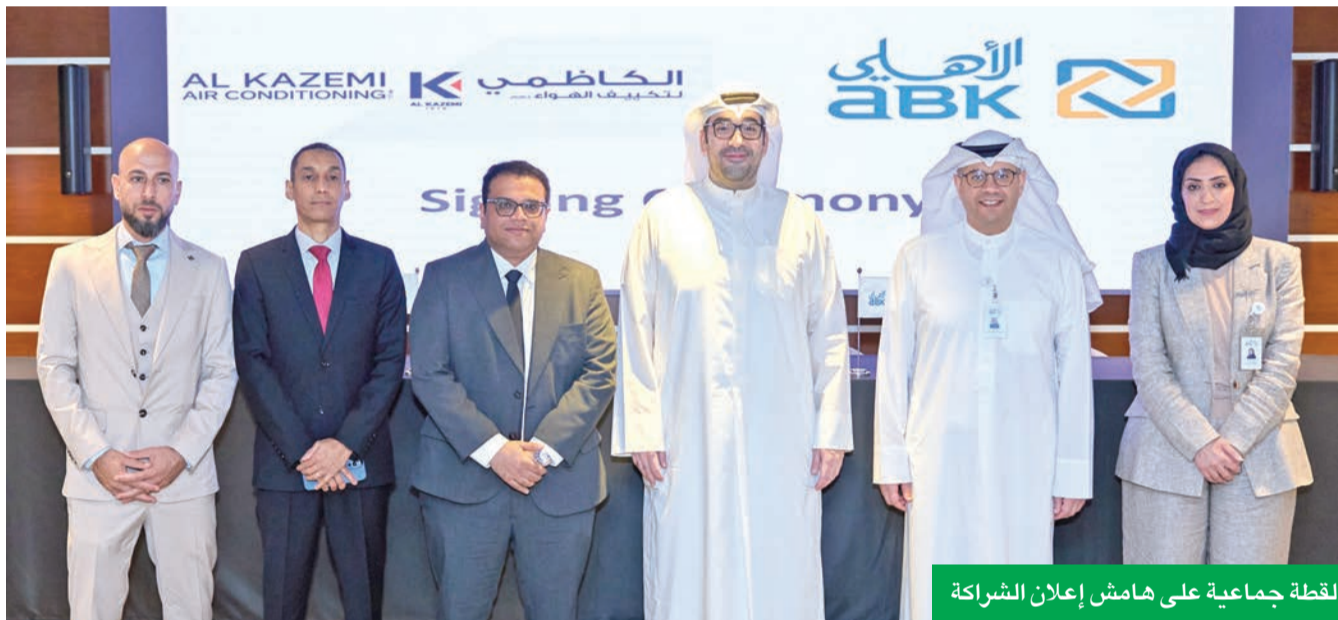
لقطة جماعية على هامش إعلان الشراكة

أثراً ملموساً في حياة العملاء، وهذا ما نسعى إلى تحقيقه اليوم بتوفير الراحة والرفاهية لهم من خلال منصة ABK Build التي نواصل عبرها عقد المزيد من الشراكات لتكون الخيار المثالي في القطاع المصرفي بما يتعلق بالتمويل الإسكاني». من جهته، قال الكازمي «نعتز