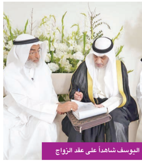
اليوسف شاهداً على عقد الزواج