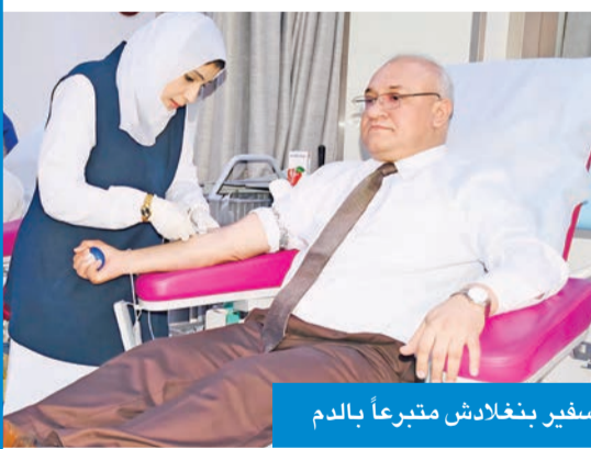
سفير بنغلادش متبرعاً بالدم