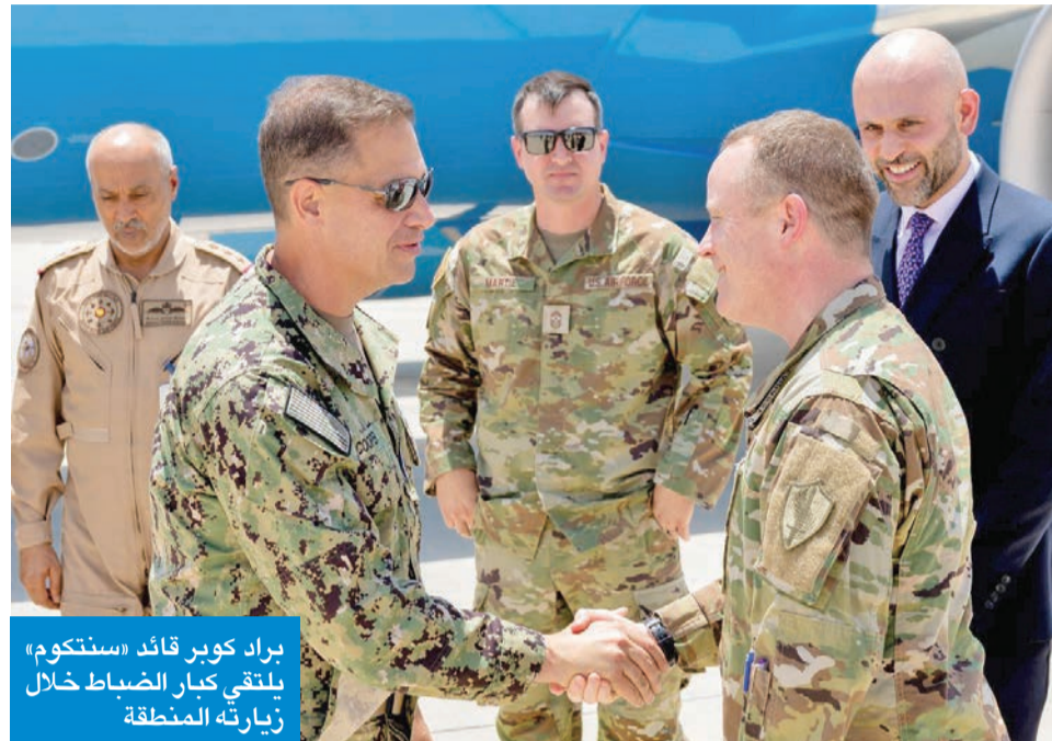
براد كوبر قائد «سنككوم» يلتقي كبار الضباط خلال زيارته المنطقة

واقربت «الخارجية» الإيرانية باستهداف القوات الأميركية لمنشآت