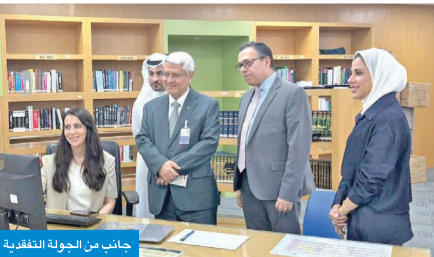
جانب من الجولة التفقدية