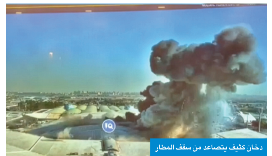
دخان كثيف يتصاعد من سقف المطار