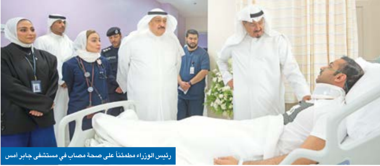
رئيس الوزراء مطمئناً على صحة مصاب في مستشفى جابر امس

● أعرب عن خالص العزاء وصادق المواساة لذوي ضحية الهجوم الإيراني الآثم