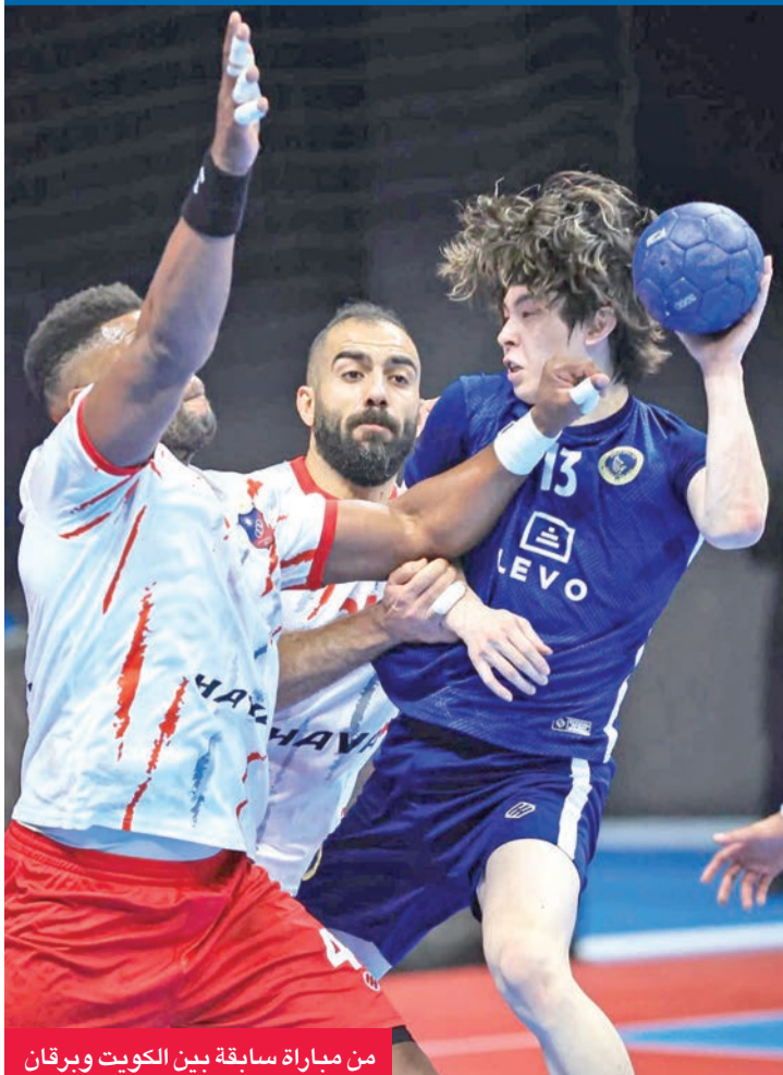
من مباراة سابقة بين الكويت وبرقان