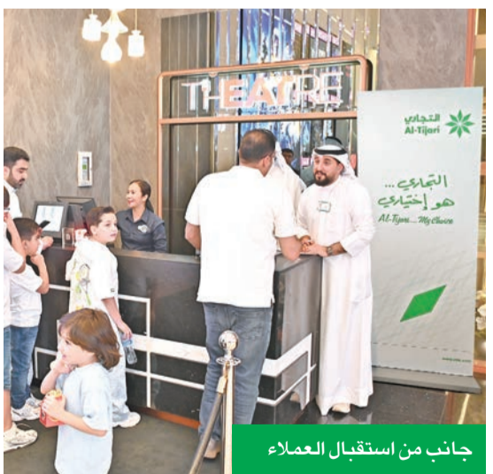
جانب من استقبال العملاء

نظم البنك التجاري الكويتي، بالتعاون مع سينما VOX بجمع الأفنيوز، فعالية حماسية لمتابعة مباراة نهائي دوري أبطال أوروبا لكرة القدم لموسم 2026 بين فريقين باريس سان جرمان وأرسنال في دار سينما فوكس صالة «THEATRE» التي ضمن للفعاليات التي ينظمها البنك لعملاء الخدمات المصرفية الشخصية «بريمير».