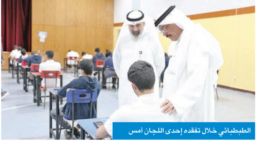
الطببائي خلال تفقده إحدى اللجان أمس

«التربية»: استكمال المرحلة الرابعة للوظائف الإشرافية