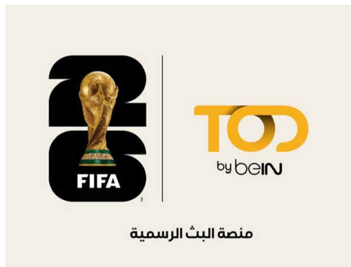
منصة البث الرسمية