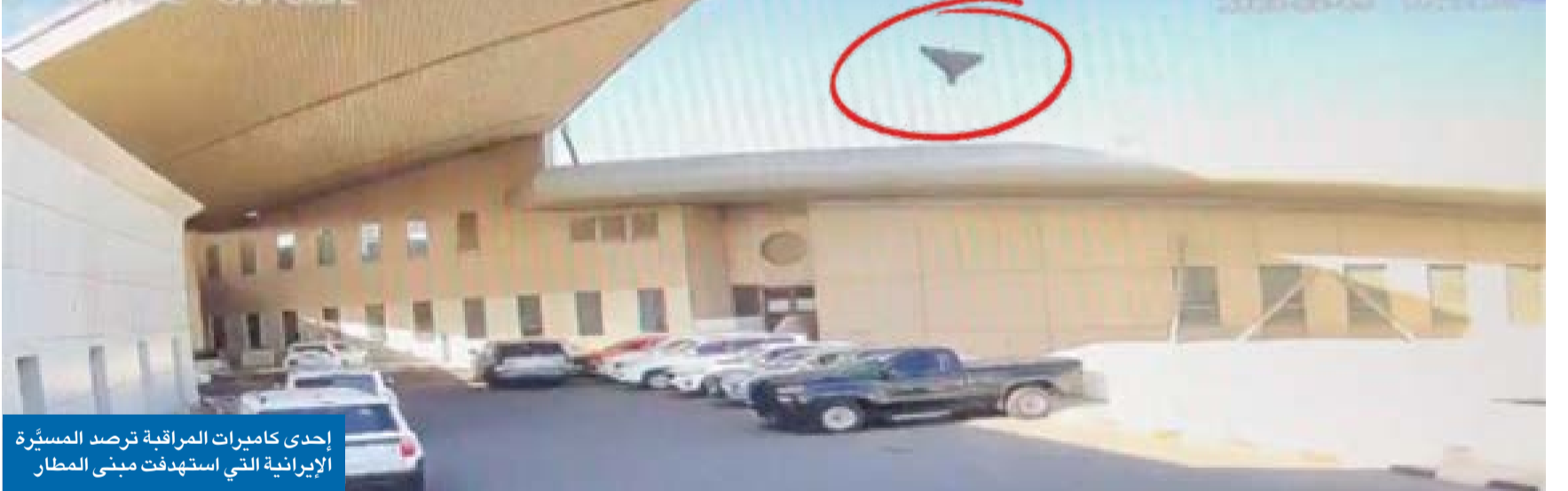
إحدى كاميرات المراقبة ترصد المسيرة الإيرانية التي استهدفت مبنى المطار

الحرس الثوري زعم أن الحادث سببه إخفاق «باتريوت» الأميركية في اعتراض الصواريخ «سنتكوم» نفت رواية «الحرس» ووصفتها بأنها ادعاء كاذب وأكدت تعمّد الهجوم إلى الحديث عن «عملية راية كاذبة» المقطع أربك رواية الحرس الثوري ودفعه