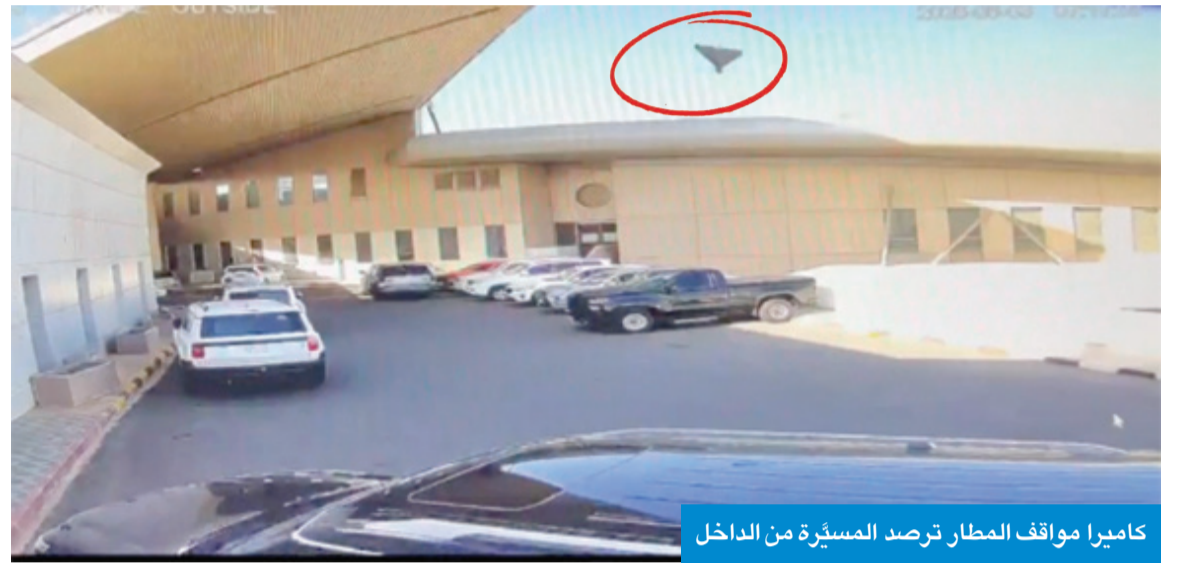
كاميرا مواقف المطار ترصد المسيّرة من الداخل

ممكن سقوطها داخل مبنى الـ T1، في وقت وثقت كاميرات أخرى داخل المطار الإصابات الناجمة عن الاعتداء وكانت واضحة بشكل كبير وحددت الإصابات بين المسافرين والعاملين في أكثر من موقع وأكثر من زاوية. وأعلنت الهيئة العامة للطيران المدني تفعيل خطة الطوارئ إثر استهداف مطار الكويت الدولي وتعليق الرحلات حتى إشعار آخر. كما باشرت الهيئة إجراء المعاينة الفنية لحصر الأضرار