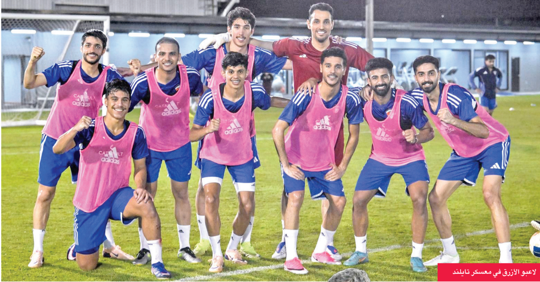
لاعبو الأزرق في معسكر تايلند

الجهاز الفني يطمح إلى نتيجة إيجابية استعداداً لخوض منافسات «خليجي 27»