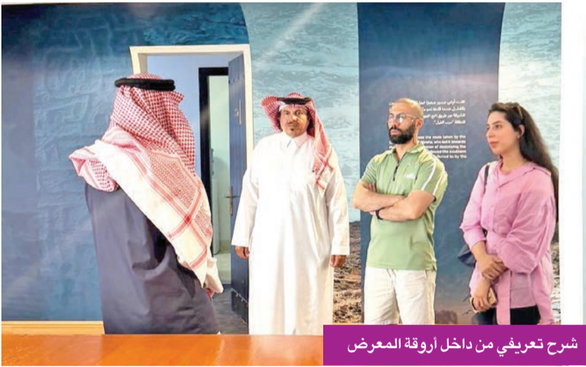
شرح تعريفي من داخل أروقة المعرض