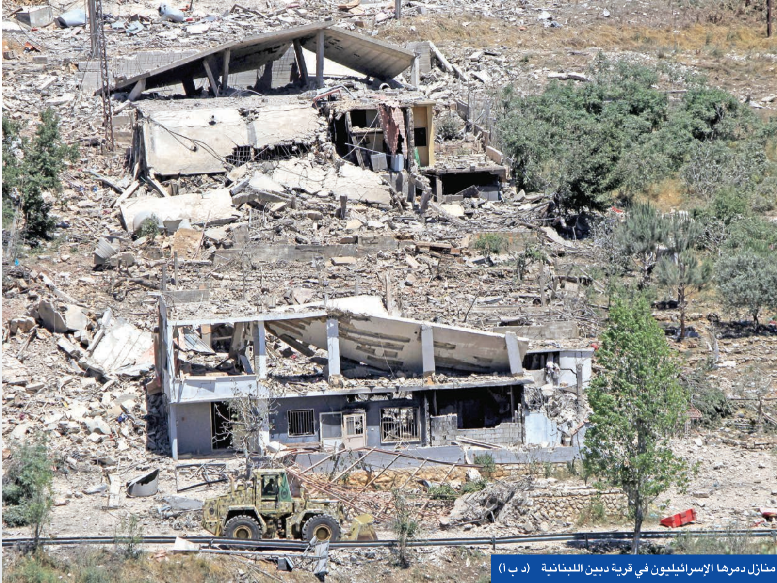
منازل دمرها الإسرائيليون في قرية دين اللبنانية

الإسرائيلي بدأ سحب قواته من بلدة دين التابعة لمدينة مرجعيون في القطاع الشرقي من جنوب لبنان. وقالت المصادر وشهود العيان لوكالة أنباء سبغيا الصينية إن «عدة دبابات من طراز ميركافا وناقلات جند شوهدت وهي تتجه من الطرف الشرقي لبلدة دين نحو بلدة الخيام المجاورة». فيما أفيد لاحقاً عن فتح طريق دين - مرجعيون - ابل السقي.