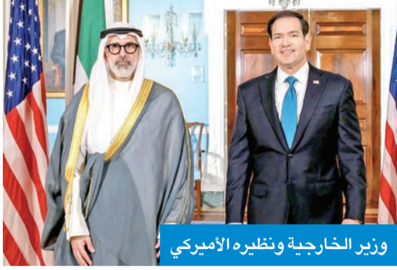
وزير الخارجية ونظيره الأمريكي

الجابر عقد اجتماعاً مع رويبو وأدانا الاعتداءات الإيرانية الآتمة ● للكويت الحق الكامل في اتخاذ الإجراءات اللازمة لصون سيادتها