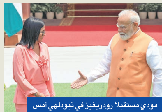
مودي مستقبلاً رودريغيز في نيودلهي أمس

مودي يبحث مع رودريغيز توسيع الواردات الهندية من النفط الفنزويلي