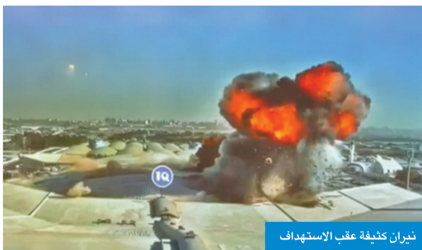
نيران كثيفة عقب الاستهداف