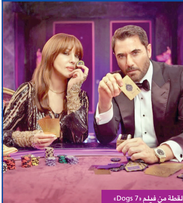
لقطة من فيلم «Dogs 7»