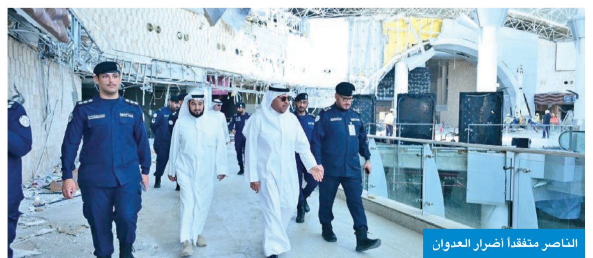
الناصر متفقداً أضرار العدوان

قام محافظ الفروانية الشيخ عبيد الناصر، أمس، بجولة تفقدية في مبنى الركاب (T1) بمطار الكويت الدولي، للاطلاع على الأوضاع الميدانية والوقوف على آثار الهجوم الذي استهدف المطار جراء العدوان الإيراني الغاشم على دولة الكويت. واستمع المحافظ إلى شرح حول حجم الأضرار التي لحقت ببعض مرافق المطار، والإجراءات الاحترازية التي تم تنفيذها لضمان سلامة المسافرين والعاملين، مشيداً بالجهود الكبيرة التي بذلتها مختلف الجهات الأمنية والفنية كذلك العاملون في المطار بمواجهة هذه الظروف الاستثنائية.