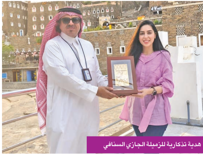
هدية تذكارية للمزيلة الجازي السنافي

عمليات «الراس» المعقدة ويساعد في تعقيم والتخام الجروح.