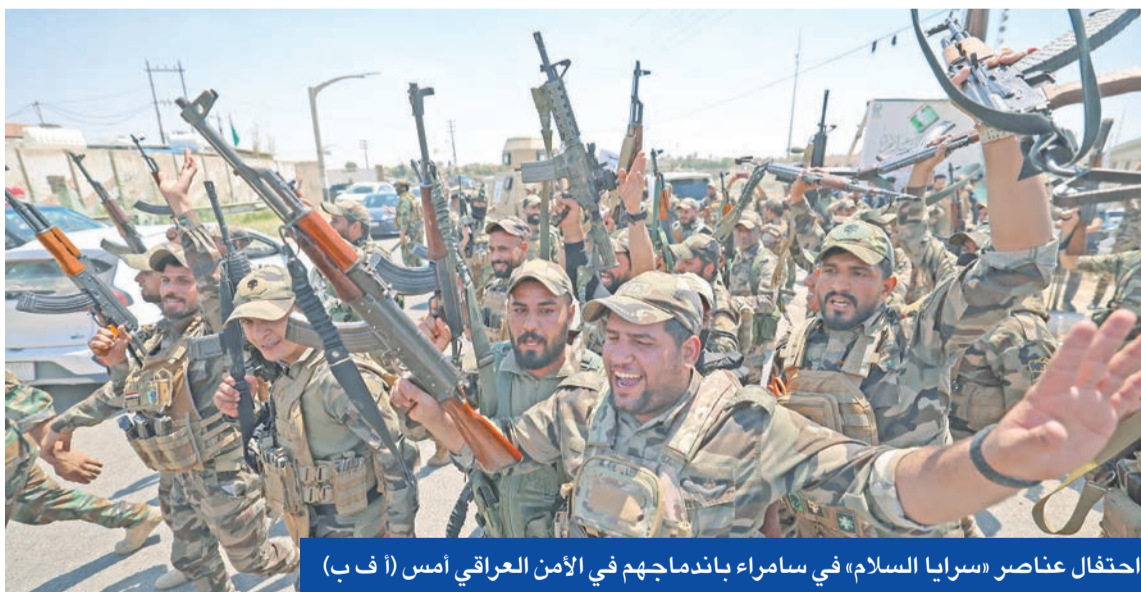
احتفال عناصر «سرايا السلام» في سامراء باندهاجهم في الأمن العراقي أمس

خياراً تدرسه حالياً الحكومة العراقية». من جهة ثانية، أعلن العراق، أمس، وفاة المرجع الشيعي محمد إسحاق الفياض عن عمر ناهز الـ 96 عاماً في أحد مستشفيات بغداد. ويعد الفياض المولود في أفغانستان أحد أعمدة المرجعية الدينية الشيعية العليا التي يتزعمها المرجع الأعلى علي السيستاني (95 عاماً) وأحد أبرز المرشحين ليكون خلفاً للسيستاني كمرجع أعلى في حوزة النجف. وعلى رسالة السيستاني أعلنت المبادرات بشكل منفصل هذا العام، على أنها تملك الحق في المياه، ولأن تسميع بيان يصعب ملؤه إلا بلطف المولى تعالى وعنايته».