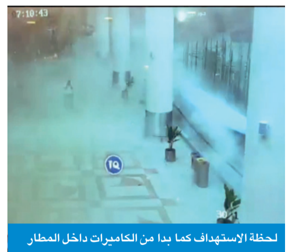
لحظة الاستهداف كما بدا من الكاميرات داخل المطار