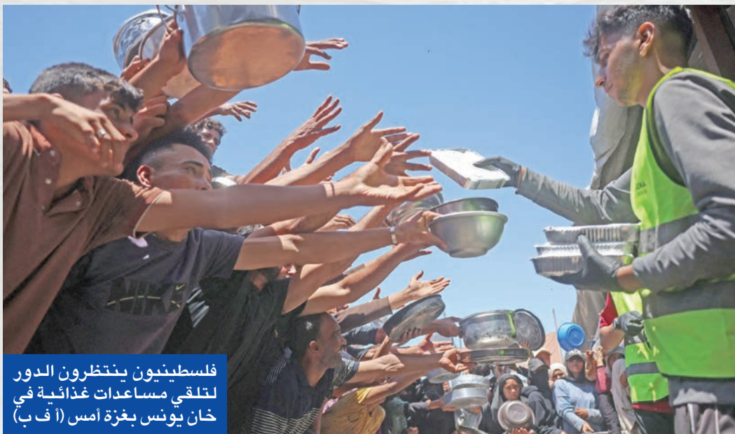
فلسطينيون ينتظرون الدور لتلقي مساعدات غذائية في خان يونس بغزة أمس

المستمر على القطاع إلى 72.956 قتيلاً و173.043 مصاباً، وذلك منذ اندلاع المواجهات في 7 أكتوبر 2023.