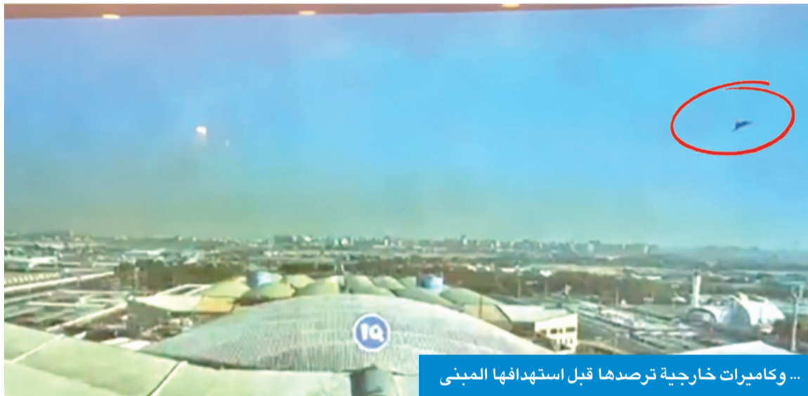
... وكاميرات خارجية ترصدها قبل استهدافها المبنى