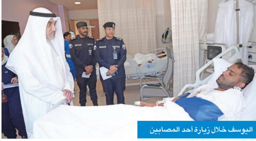
اليوسف خلال زيارة أحد المصابين

زار المصابين جراء الاعتداء الإيراني الآثم واطمأن على حالتهم الصحية ● أشاد بجهود الكوادر الطبية والقوى الأمنية في التعامل مع تداعيات العدوان