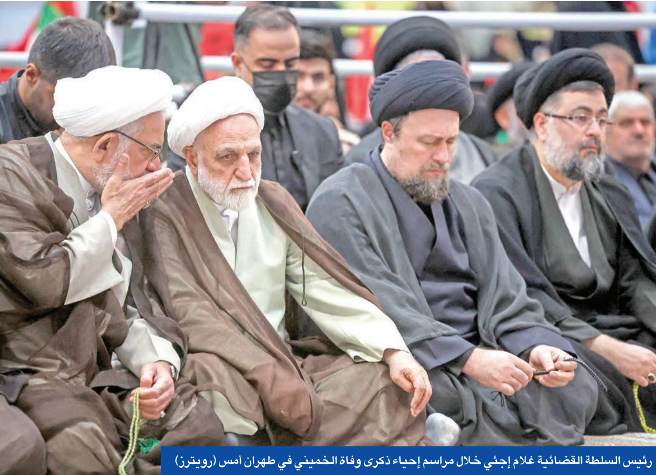
رئيس السلطة القضائية غلام إجنئي خلال مراسم إحياء ذكرى وفاة الخميني في طهران أمس

ورأى في كلمته، التي تأتي بمناسبة ذكرى وفاة مؤسس النظام روح الله الخميني، أن الولايات المتحدة و«الاستكبار العالمي» يعارضان «الهوية المتميزة» والصداقة لإيران، معتبراً أن الصراع مع واشنطن يتعلق بطبيعة عسكرية أو دبلوماسية. وتزامن ذلك مع تبادل أطراف بالنظام الإيراني للوم بشأن قبول المسار الدبلوماسي الذي أعقبه فرض الحصار البحري الأميركي، إذ اعتبر عضو البرلمان كامران غضنفرى أنه لولا الفتنة، التي أثارها بعض المسؤولين، الذين حاولوا دون اتخاذ القوات المسلحة إجراءات حاسمة بسبب المفاوضات غير العمدية، لكننا أجبرنا العدو على التراجع قبل ذلك بكثير». وقال غضنفرى: «لا ينبغي بأي حال من الأحوال أن نتراجع أمام العدو، وإذا استهدف سفينة لنا فيجب أن نستهدف ثلاث أو أربع سفن تابعة له».