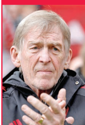
السير كيني دالغليش

كشف السير كيني دالغليش، أسطورة نادي ليفربول الإنجليزي لكرة القدم، عن خضوعه للعلاج من مرض السرطان. وذكرت وكالة الأنباء البريطانية «بي إيه ميديا» أن الأسطورة الاسكتلندية، البالغ 75 عاماً، والذي تألق مع منتخبه الوطني وسلتيك وليفربول، اضطر إلى إصدار بيان بعد نشره المعلومة عن طريق الخطأ على وسائل التواصل الاجتماعي. وقال دالغليش: «كما أشار المنشور الذي نشرته عن غير قصد على وسائل التواصل الاجتماعي، فإنني أخضع حالياً للعلاج من السرطان». وأضاف: «على عكس طريقة استخدائي للهاتف المحمول، فإن العلاج يسير بشكل جيد». وأكد: «في الوضع المثالي، كنت أفضل أن يبقى هذا الأمر خاصاً، لأن هذا هو ما ينبغي أن يكون عليه الحال، لكن مهاراتي الضعيفة في التعامل مع التكنولوجيا أجبرتني على الكشف عنه». من جانبه، أرسل نادي ليفربول، الذي لعب له دالغليش وتولى تدريبه أيضاً، رسالة دعم وتمنيات طبية له، وأضاف: «يود النادي التأكيد على طلبة باحترام خصوصيته خلال الفترة المقبلة».