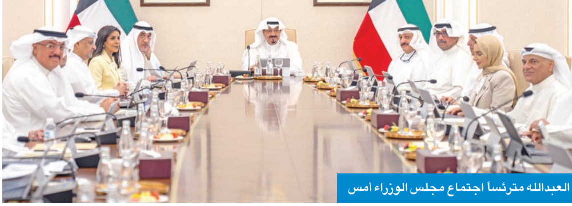
العبدالله مترئسا اجتماع مجلس الوزراء أمس

ونظرا لتطور الأوضاع المتسارعة في ظل الظروف الراهنة فإن المجلس ستمت في حالة انعقاد دائم لمناقشة آخر المستجدات على الساحتين المحلية والإقليمية.