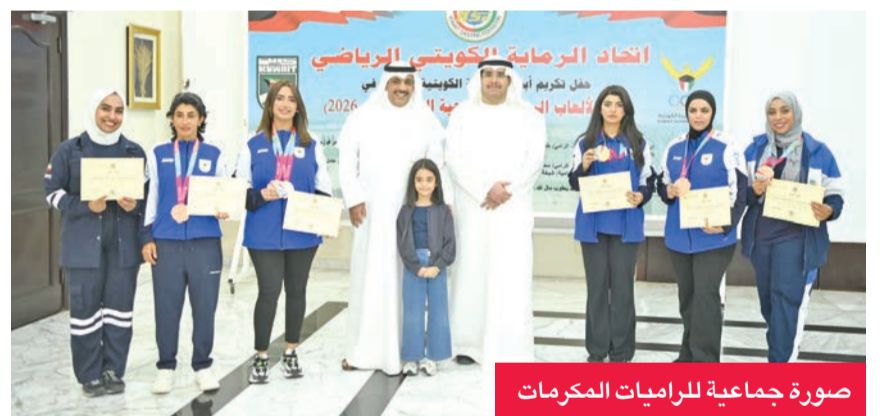
صورة جماعية للرابيات المكرمات

كرم اتحاد الرماية الكويتي أبطاله الذين تألقوا في دورة الألعاب الخليجية الأخيرة بالدوحة، بعد أن حققوا حصيلة لافتة بلغت 10 ميداليات متنوعة، وجاء التكريم في حفل رسمي، حيث أكد رئيس الاتحاد المهندس دعيح العنقيبي أن الإنجاز يعكس قيمة الرامي الكويتي وقدرته على المنافسة رغم التحديات. وأوضح العنقيبي أن الرماة والرابيات حققوا أفضل النتائج رغم قلة العدد وضيق فرص التدريب والاستعداد، مشيداً بقدرتهم على التعامل مع الظروف المحيطة وتجاوز العقبات ليعودوا إلى الكويت باربع ذهبيات وأربع فضيات وبرونزياتين. وأعرب عن تقديره للدعم الذي قدمه وزير الدولة لشؤون الشباب الدكتور طارق الجلاهية، ورئيس اللجنة الأولمبية الكويتية الشيخ فهد الناصر، والمدير العام للهيئة العامة للرياضة بالتكليف بشار عبدالله، إلى جانب الجهات التي ساهمت في إنجاح المشاركة، وتوجه بالشكر إلى دولة قطر على حسن الاستقبال والتخليم المتميز للدورة الخليجية. (كويتا)