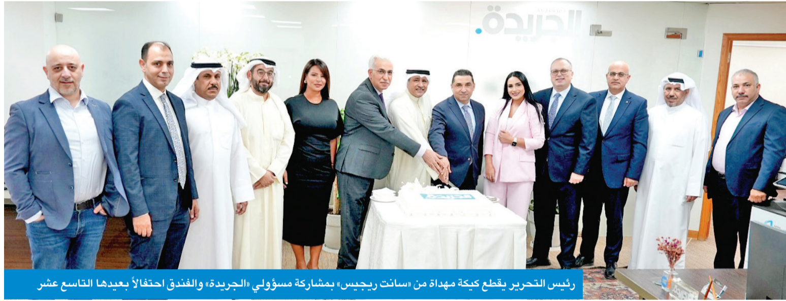
رئيس التحرير يقطع كعكة مهادة من «سانت ريجيس» بمشاركة مسؤولي «الجريدة» والفندق احتفالاً بعيدها التاسع عشر