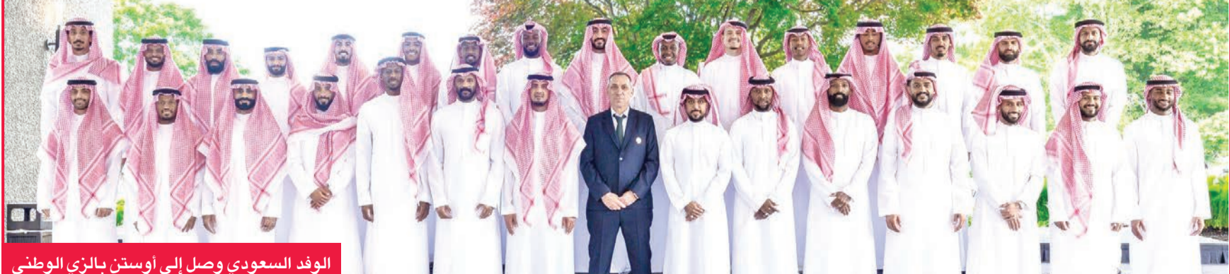
الوفد السعودي وصل إلى أوستن بالزلي الوطني

برنامجها التأهيلي الخاص بمتابعة الجهاز الطبي. وسيخوض الأخضر خلال الفترة الثانية من المعسكر مواجهتين وديتين، بالقي في الأولى منتخب بورتوريكو بعد غد (الجمعة) على ملعب Q2 بمدينة أوستن، في حين يواجه منتخب