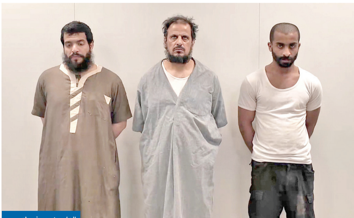
الهاربون بعد ضبطهم

وأكدت «الداخلية» أن أمن المجتمع خط أحمر وأن يد العدالة ستطال كل من يحاول الهروب من المسائلة القانونية أو تقديم العون للمطلوبين والخارجين على القانون.