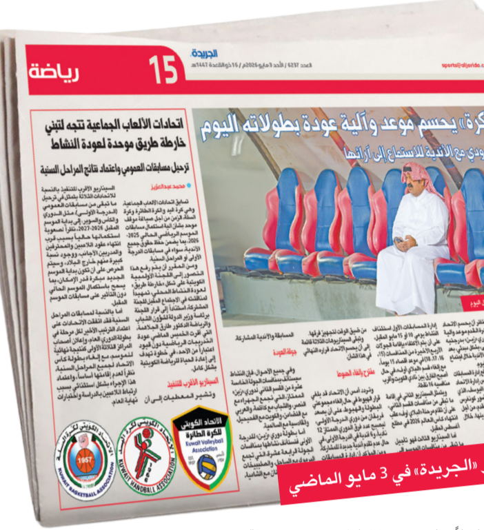
صورة ضوئية لخبر «الجريدة» في 3 مايو الماضي

كما اعتمد المجلس توصية لجنة المسابقات بعدم استكمال دوري المراحل السنوية، والانتفاء بالنتائج الحالية، حيث تصدر فريق كاظمة دوري الشباب تحت 19 سنة، وجاء العربي ثانياً واليرموك