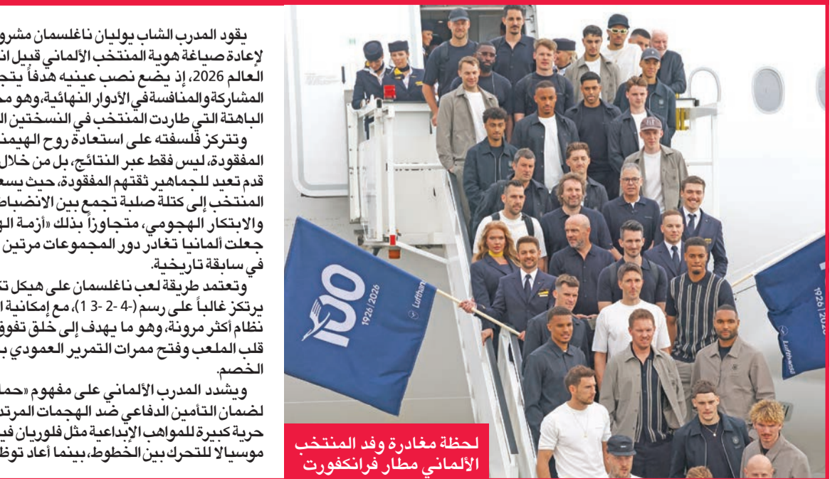
لحظة مغادرة وفد المنتخب الألماني مطار فرانكفورت

كيميش كظهير أيمن لضمان التوازن والخبرة في بناء اللعب من الخلف، مما يعكس رغبته في دمج عناصر الخبرة مع الجيل الصاعد. ومع ذلك، يصطدم طموح ناغلسمان بسلسلة من التحديات والمشاكل المعقدة في القائمة، أبرزها أزمة «المهاجم الصريح» التي لا تزال تترق، حيث يعاني الفريق من نقص في المهاجمين القادرين على استغلال الكرات الهوائية والحسم داخل الصندوق، مما دفعه للبحث عن حلول بديلة مثل نيك فولتيماده أو كاي هافيرتز في دور «المهاجم الوهمي». وتبقى المعضلة الأكبر أمام ناغلسمان هي خلق «هيكل قبائدي» واضح داخل غرفة الملابس، حيث واجه انتقادات بسبب كثرة التحوير وتغيير التشكيلات التي وصلت لاستدعاء عشرات اللاعبين في فترة وجيزة، مما أثار أحياناً على حالة الانسجام. ويسابق المدرب الزمن الآن لتثبيت الركائز الأساسية، معتمداً على أسماء مثل أنطونيو رودريغز وجوناثان تاه في الدفاع، وليون غوريتسكا في الوسط، سعياً للوصول إلى المونديال بمنتخب لا يكفئ بالأدوار الشرفية، بل يذهب إلى أميركا الشمالية برغبة حقيقية في استعادة التاج العالمي المفقود منذ عام 2014.