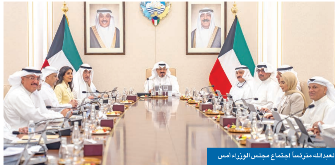
العيدالله مترئساً اجتماع مجلس الوزراء أمس

• تقييم يومي لمخاطر «إيولا» وتعزيز إجراءات التقصي الوبائي والترصد الصحي