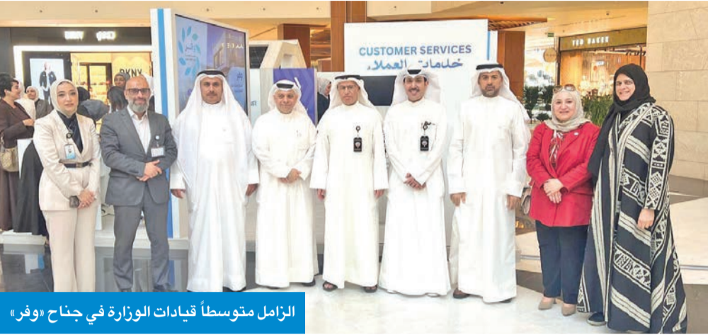
الزامل متوسطاً قيادات الوزارة في جناح «وفر»

نتطلع لتغطية نحو 90% من مشروع العدادات الذكية بنهاية 2026