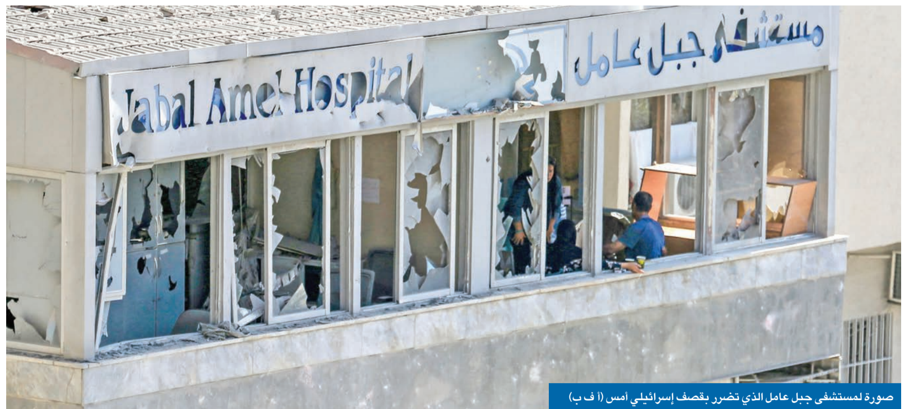
صورة لمستشفى جبل عامل الذي تضرر بقصف إسرائيلي أمس

3 قراءات لإعلان ترامب... ومسار الحرب الإسرائيلية معلق على اختراق دبلوماسي