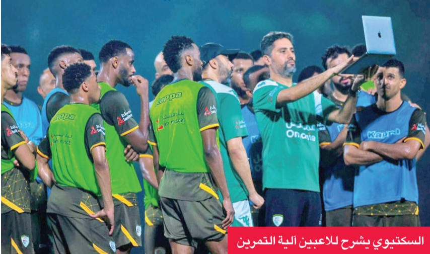
السكتيوي يشرح للاعبين آلية التمرين

يوصل منتخب عمان الأول لكرة القدم معسكره الخارجي في العاصمة الإندونيسية جاكارتا، ضمن فترة التوقف كاستعداداً للاستحقاقات المقبلة، وفي مقدمتها بطولة كأس الخليج «خليجي 27» ونهايات كأس أمم آسيا 2027. ويخوض الأحمر العماني مباراتين وديتين خلال معسكره، الأولى أمام منتخب إندونيسيا الجمعة 5 يونيو