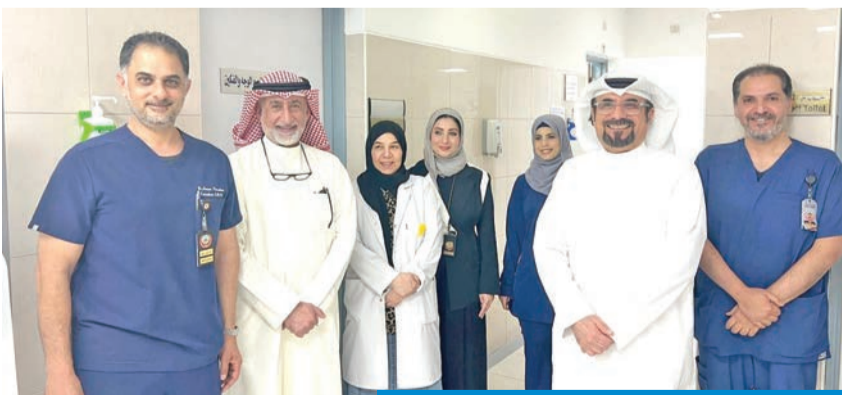
خلال افتتاح العيادة التخصصية بمركز الصقر

لزيادة العيادات التخصصية ورفع جودة الخدمات العلاجية المقدمة للمراجعين. وأضافت أن الافتتاح يأتي استكمالاً لخطة التوسع في العيادات التخصصية، التي تشمل عيادات علاج اللثة وأمراض الفم وعيادات طب أسنان الأطفال، إلى جانب تخصص طب الأسنان الشامل، بما يعكس التوجه نحو تعزيز التوسع في العيادات التخصصية بمراكز طب الأسنان، وتزويدها للمراجعين داخل مراكز الرعاية الصحية الأولية.