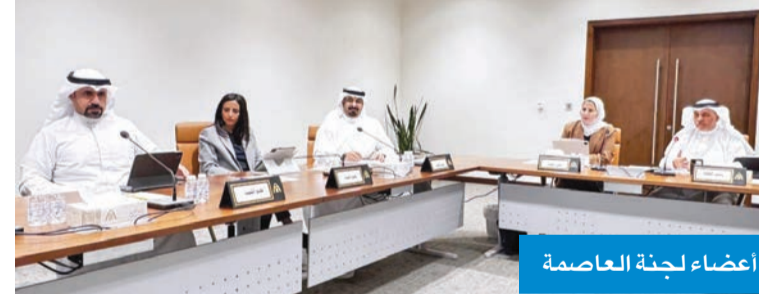
أعضاء لجنة العاصمة

التجارية بالمحافظة، إلى الجهاز التنفيذي، وأبقت على الجدول طلب وزارة المالية تحديث بيانات قطعة الأرض المستغلة لنشاط مقصف بمنطقة الواحة، فيما حفظت الاقتراح المقدم بشأن تخصص موقع «حراج» لبيع السيارات المستعملة.