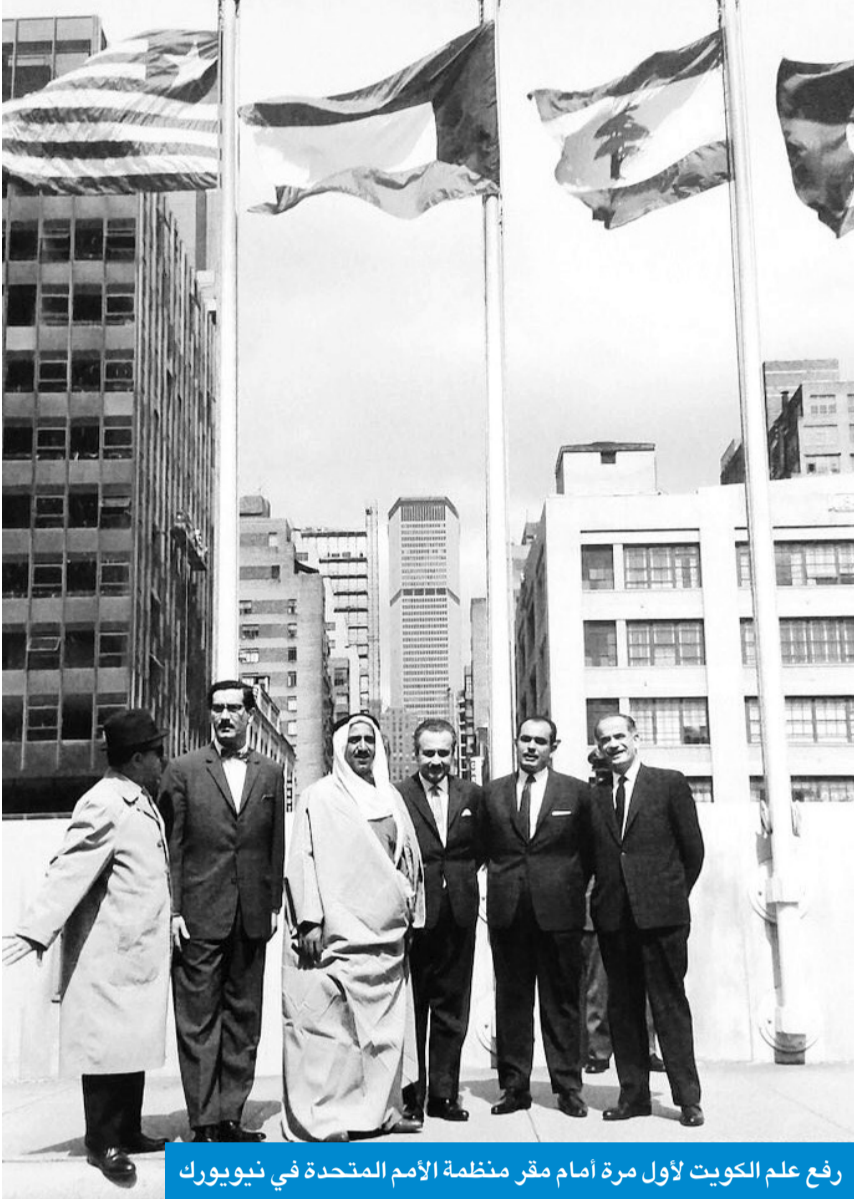
رفع علم الكويت لأول مرة أمام مقر منظمة الأمم المتحدة في نيويورك

أحييت الذكرى الـ 63 لعضويتها بالمنظمة الدولية منذ 14 مايو 1963 الكويت حظيت بعضوية مجلس الأمن مرتين دافعت فيهما عن القضايا العربية والإسلامية وعلى رأسها فلسطين برزت بدورها الفاعل وسيطاً موثقاً في عدد من القضايا الإقليمية والعالمية خلال العقود الستة الماضية الكويت توجت بتسميتها «مركزاً للعمل الإنساني» تقديراً لدورها العالمي في الإغاثة ودعم الشعوب