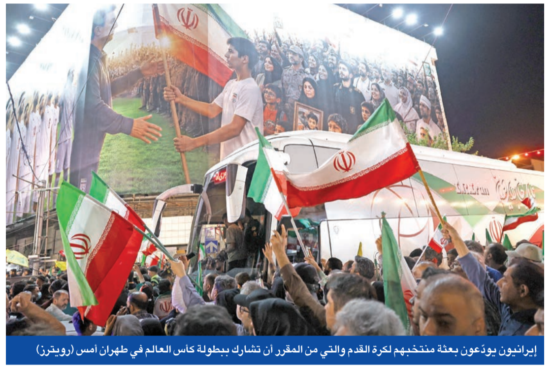
إيرانيون يؤدون بعثة منتخبهم لكرة القدم والتي من المقرر أن تشارك بطولة كأس العالم في طهران أمس

مع دخول الصراع الذي تشهده المنطقة يومه الـ 76، شهدت مياه الخليج حركة ملحوظة سمحت بعبور عشرات السفن من ضمنها نحو 30 صينية لمضيق هرمز بالتزامن مع استيلاء عناصر «الحرس الثوري» على سفينة قبالة سواحل الإمارات واقتيادها إلى المياه الإيرانية، في حين كشف تقرير أميركي أن الرئيس دونالد ترامب قد ينفذ خطوته التالية تجاه طهران فور عودته من بكين وسط تزايد التوقعات بعودة الحرب ودخول إسرائيل بحالة