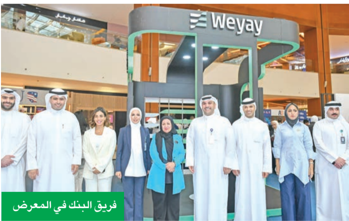
فريق البنك في المعرض

احتجاجاتهم، بالإضافة إلى تعزيز مفهوم الثقافة المالية لديهم بطريقة مبسطة ومواكبة لعصرهم. وتؤكد هذه المشاركة مكانة «وياي» كشريك فعال في دعم الشباب الكويتيين، وإيمانه بان الاستثمار في طاقاتهم هو استثمار في مستقبل أكثر إشراقاً وازدهاراً للمجتمع.