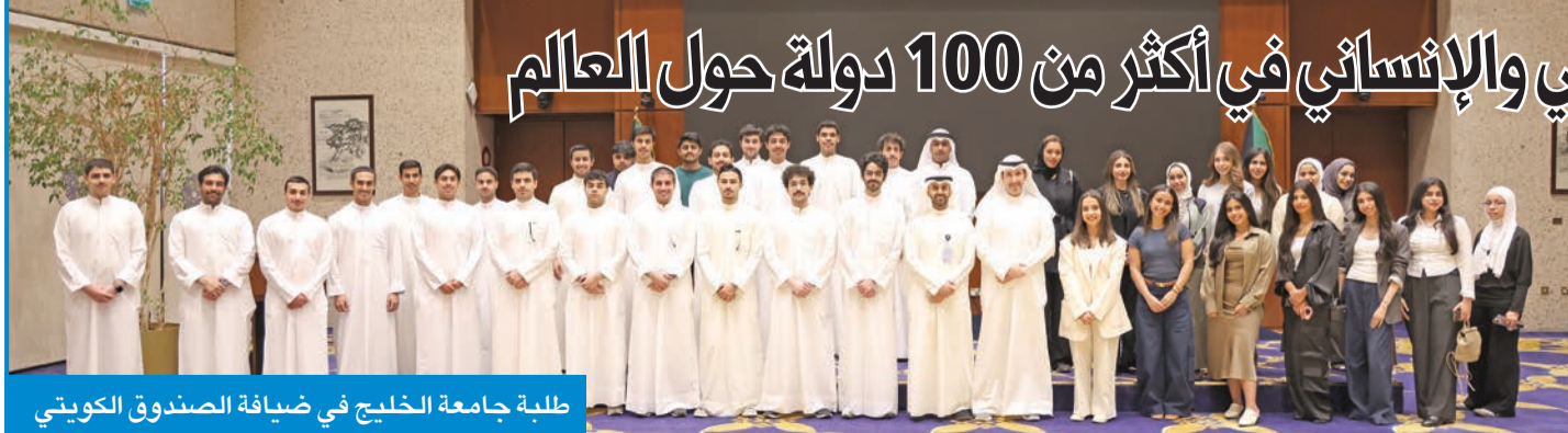
طلبة جامعة الخليج في ضيافة الصندوق الكويتي

بممثل تجربة اقتصادية رائدة تحتذى بالعديد من المؤسسات والهيئات الأخرى.