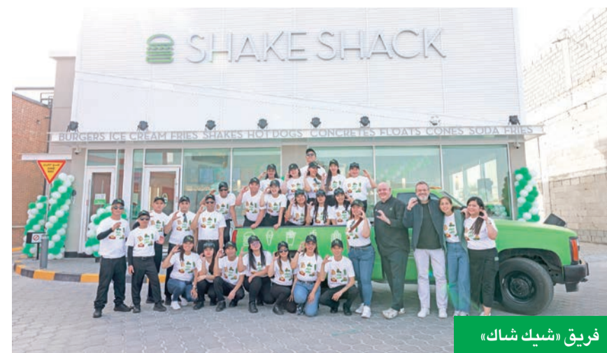
فريق «شيك شاك»

واحتفالاً بالافتتاح الكبير، أضفت «شيك شاك» الكويت أجواء مميزة على منطقة سعد العبدالله من خلال عرض حي لفرقة شباب، إلى جانب تقديم هدايا حصرية مخصصة لأول 100 ضيف. وتتواصل الاحتفالات طوال الشهر من خلال تحدي الـ 10 ثوان، الذي يمنح ضيوف المطعم فرصة الفوز برغز مجاني، إضافة إلى هدايا حصرية محدودة الإصدار تحمل علامة «شيك شاك» (حتى نفاد الكميات). وذلك للضيوف الذين ينفقون 7 دنانير أو أكثر على الطلبات الداخلية قبل الـ 31 الجاري.