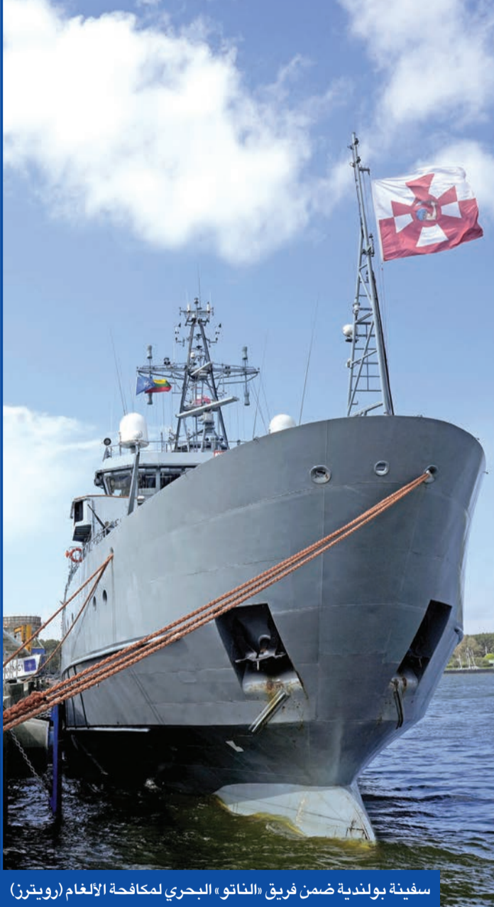
سفينة بولندية ضمن فريق «الناتو» البحري لمحاكاة الألغام