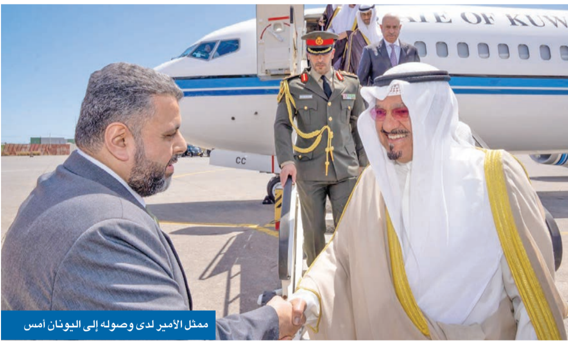
ممثل الأمير لدى وصوله إلى اليونان أمس

انسيابية التجارة العالمية عبر الممرات الحيوية