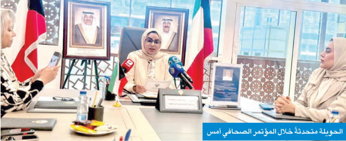
الحويلة محدثة خلال المؤتمر الصحفي أمس

أكدت أن الجائزة مبادرة وطنية نوعية تُطلق برعاية رئيس الوزراء في 16 مايو وتقام كل عامين إطلاق منصة إلكترونية لتقديم المبادرات وإنشاء بنك معلومات للكفاءات النسائية