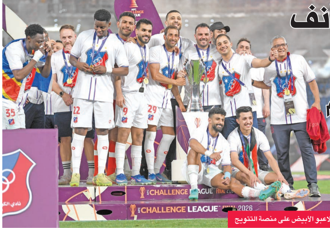
لاعب الأبيض على منصة التتويج

اللقب، حيث إنه ساهم بشكل كبير في الأدوار الإقصائية، وأنا أريد منه تقديم المزيد مع الفريق.