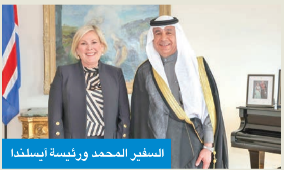
السفير محمد ورئيسة آيسلندا

وتأكيد أهمية تعزيز التعاون المشترك في مختلف المجالات، والإسهام في تحقيق مصالح البلدين وشعبهما. وتلقت رئيسة آيسلندا أطيب تحياتها إلى سمو أمير البلاد وسمو ولي العهد. كما أعربت عن تمنياتها لسفير الكويت الجديد بمهام عمله، والعمل على تطوير العلاقات الثنائية بين البلدين في كل المجالات وعلى جميع الصعد.