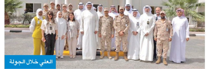
العلي خلال الجولة

وزير الدفاع تفقد «الخدمات المساندة» وأشاد بعطائها