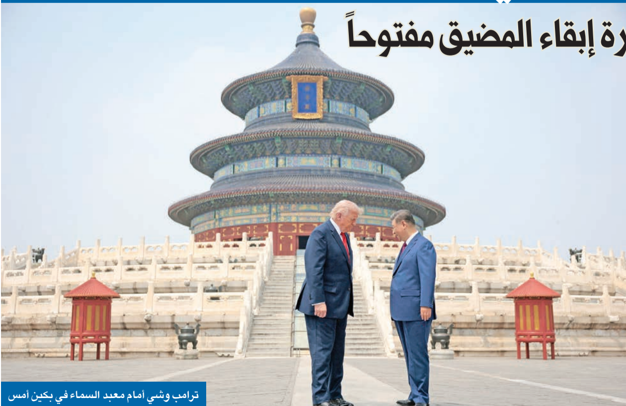
ترامب وشي أمام معبد السماء في بكين أمس

توافق بين ترامب وشي على ضرورة إبقاء المضيق مفتوحاً