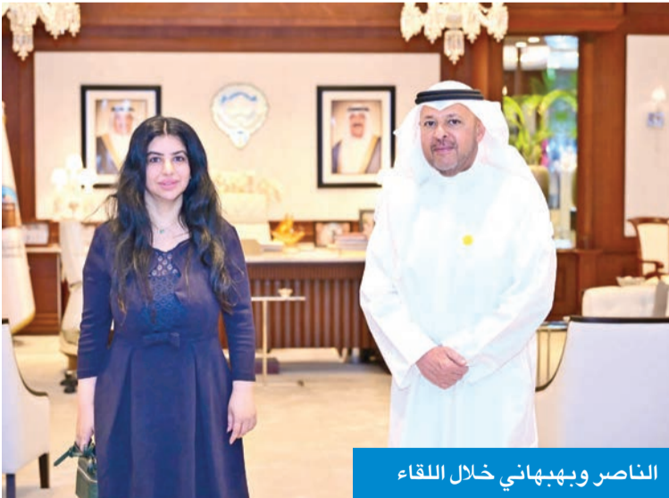
الناصر وبهبهاني خلال اللقاء

استقبل محافظ الفروانية الشيخ عذبي الناصر، في مكتبه صباح أمس، المديرية العامة للهيئة العامة للبيئة بالتكليف نوف بهبهاني، في إطار تعزيز التعاون والتنسيق بين المحافظة والهيئة، ويبحث عدد من الملفات والقضايا البيئية ذات الاهتمام المشترك.