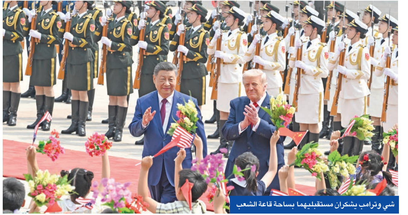
شي وترامب يشكران مستقبلهما بساحة قاعة الشعب