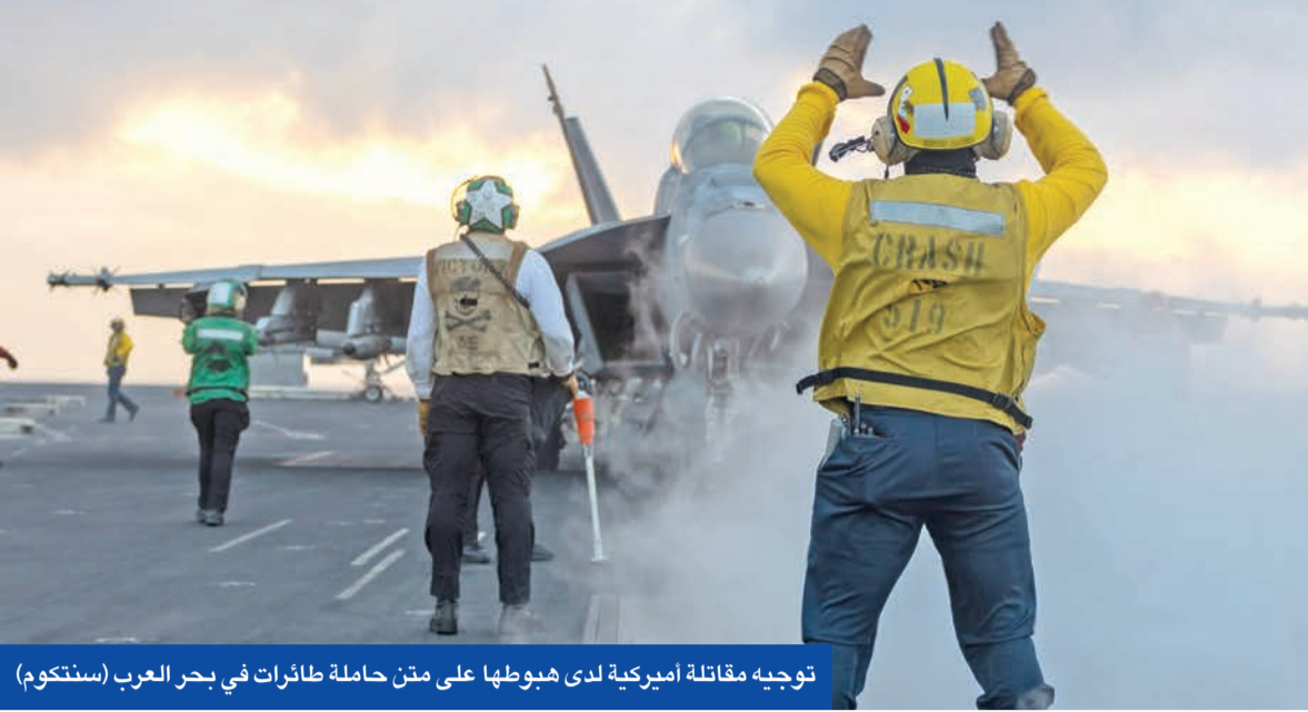
توجيه مقاتلة أميركية لدى هبوطها على متن حاملة طائرات في بحر العرب (سنكسكوم)

كوشنر وستيف ويتكوف، بالإضافة إلى «عدد من أصدقائنا في العالم العربي»، موضحاً أنه يعتقد أن المباحثات تحفز تقدماً «لكن السؤال الجوهرى هو: هل سنحرز تقدماً كافياً يلي الخط الأحمر الذي وضعه الرئيس ترامب»، بشأن البرنامج النووي الإيراني.