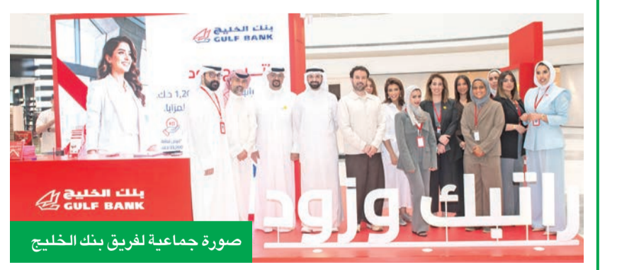
صورة جماعة لفريق بنك الخليج

على مدى ثلاثة أيام، من 14 إلى 16 مايو الجاري، ينظم بنك الخليج فعالية خاصة في مول العاصمة، للتعريف بمزايا حساب الراتب للكويتيين العاملين في الحكومة، حيث يحصل العملاء عند تحويل رواتبهم على هدية ترحيبية تصل إلى 1200 دينار، إلى جانب مجموعة من المزايا الحصرية التي تلبي احتياجاتهم وتتنوع توقعاتهم.