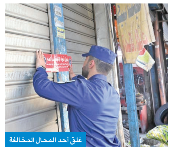
غلق أحد المحال المخالفة

وقد أسفرت الحملة عن غلق إداري وتحريم إخطارات لـ 44 محلاً، وذلك لمخالفتها الضوابط المعمول بها، وعدم استيفائها لاشتراطات السلامة المقررة من قبل قوة الإطفاء العام.