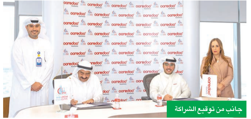
جانب من توقيع الشراكة

في خطوة تعكس التوجه المتسارع نحو رقمنة القطاع الصحي في دولة الكويت، أعلنت Ooredoo توقيع شراكة استراتيجية مع مستشفى هادي، بهدف تسريع وتيرة التحول الرقمي وتعزيز البنية التحتية التكنولوجية للمؤسسات الصحية، بما يواكب أحدث التطورات العالمية في مجالات الاتصالات وتقنية المعلومات والذكاء الاصطناعي. وتندرج هذه الشراكة ضمن إطار دعم مستهدفات رؤية الكويت 2035، التي تركز على بناء اقتصاد معرفي مستدام، وتسريع التحول الرقمي في مختلف القطاعات الحيوية، وفي مقدمتها القطاع الصحي، من خلال تطوير حلول ذكية ومتكاملة تساهم في رفع كفاءة الخدمات الطبية وتحسين تجربة المرضى. وبموجب الاتفاقية، ستتولى Ooredoo، بالتعاون مع مستشفى هادي وبالشراكة مع Huawei، تنفيذ منظومة متكاملة من حلول الاتصالات وتقنية المعلومات، تشمل شبكات الجيل الجديد، ومراكز بيانات عالية الأداء، وتقنيات الحوسبة السحابية الافتراضية، إلى جانب أنظمة النسخ الاحتياطي والتعافي من الكوارث، وحلول التخزين المتقدمة، فضلاً عن خدمات دعم وتشغيل محلية طويلة الأمد، تضمن استمرارية العمليات وكفاءتها.