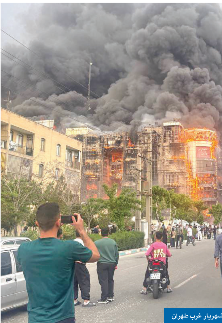
حريق في مجمع أرغوان التجاري بمدينة شهرينار غرب طهران

كشفت مصادر إيرانية لـ «الجريدة» أن مجموعة من العوامل تضاعفت لتحدث حالة «البليدة» التي شهدتها مضيق هرمز أمس الأول، عقب إعلان الرئيس الأميركي دونالد ترامب عملية مشروع «الحرية»، وهي خطوة كادت تطيح بوقف إطلاق النار الساري منذ 8 أبريل الماضي. وقال المصدر إن وزير الخارجية الإيراني عباس عراقجي أبلغ المجلس الأعلى للأمن القومي والقيادة الإيرانية، في وقت متأخر من مساء الأحد، بمبادرة تتعلق بالمضيق طرحها الوسيط الباكستاني، بهدف كسر جمود المفاوضات وإبداء حسن النية، تمهيداً لبناء قدر من الثقة بين واشنطن وطهران. وأوضح أن المبادرة، التي كان يُفترض أن تبقى سرية، تنص على السماح لإيران بخروج تدريجي للسفن العالقة في الخليج عبر الممر العُماني من «هرمز»، مقابل إفراج الولايات المتحدة عن السفن الإيرانية التي تحتجزها، بما في ذلك ناقلات نفط صادرتها القوات الأميركية في المحيط الهندي، كما تقضي ببدء واشنطن رفع الحصار تدريجياً عن الموانئ والسفن الإيرانية، بالتوازي مع تزايد حركة العبور في المضيق. وأضاف أن عراقجي أبلغ الجانب الباكستاني موافقة