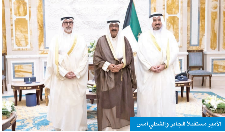
الأمير مستقبلاً الجابر والشطي أمس

استقبل سمو أمير البلاد الشيخ مشعل الأحمد، أمس، وزير الخارجية الشيخ جراح الجابر، حيث قدم لسموه رئيس البعثة الدبلوماسية الكويتية الجديد طلال الشطي سفيراً لدولة الكويت لدى جمهورية التشيك، الذي أدى اليمين القانونية أمام سموه، وذلك بمناسبة توليه مهام منصبه الجديد.