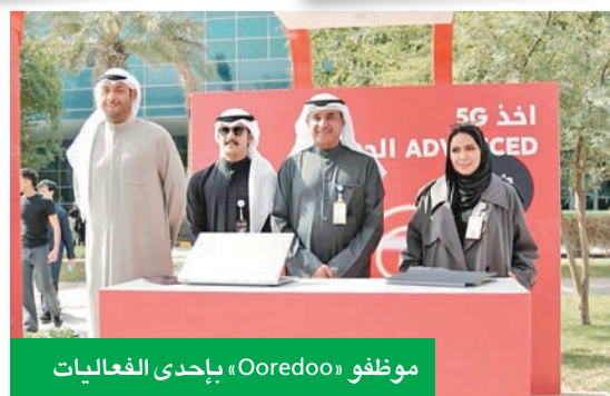
موظفو Ooredoo، بإحدى الفعاليات