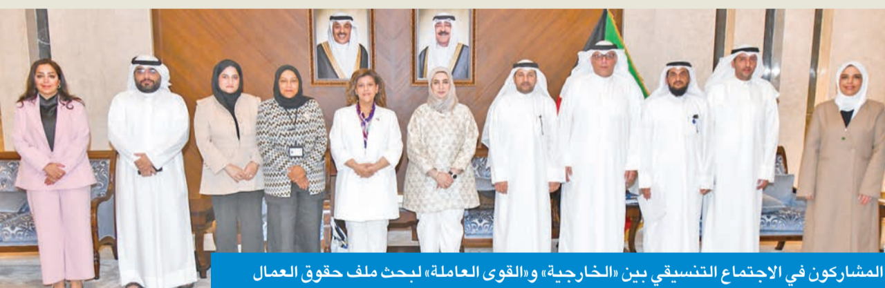
المشاركون في الاجتماع التنسيقي بين «الخارجية» و«القوى العاملة» لبحث ملف حقوق العمال

الامر الذي ينعكس إيجاباً على تنظيم سوق العمل وحماية حقوق العمالة. وأكدت أن الاجتماع يأتي ضمن جهود الهيئة المستمرة لتطوير السياسات العمالية وتحقيق بيئة عمل آمنة ومستقرة تكفل حقوق العامل وصاحب العمل على حد سواء؛ وتعكس التزام دولة الكويت بالمعايير الإنسانية الدولية، مشددة على أهمية استمرار التنسيق المشترك مع وزارة الخارجية وتكثيف التعاون مع الجهات الدولية والدول الصديقة، بما يساهم في تطوير منظومة سوق العمل وضمان سلامة تنفيذ الاتفاقيات الثنائية وحماية حقوق العمالة.