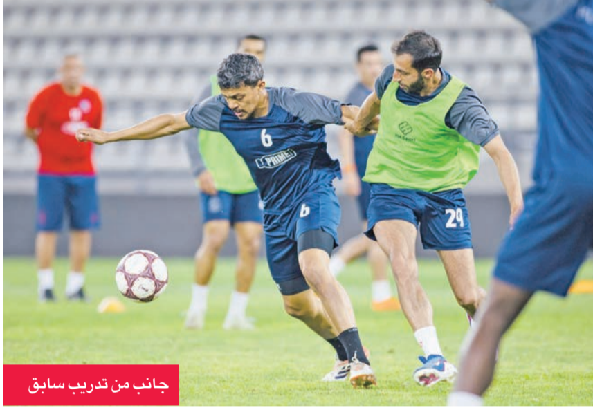
جانب من تدريب سابق

بما قدموه، وحثهم على حصد اللقب الآسيوي الرابع. من جهة أخرى، يدخل فريق الكويت معسكراً مطلقاً باحثاً في المشاركة. كما يواصل المدرّب عقد محاضراته الفنية مع اللاعبين، التي تتضمن تحليلاً ل أداء فريق سفاري رينغ، وأبرز لاعبيه، مع إلقاء الضوء على أبرز نقاط القوة والضعف لدى المنافس. ويحرص نيوشا أيضاً على تجهيز اللاعبين ذهنياً ونفسياً للمواجهة، إلى جانب الجوانب الفنية والبدنية، مع الإثباتة