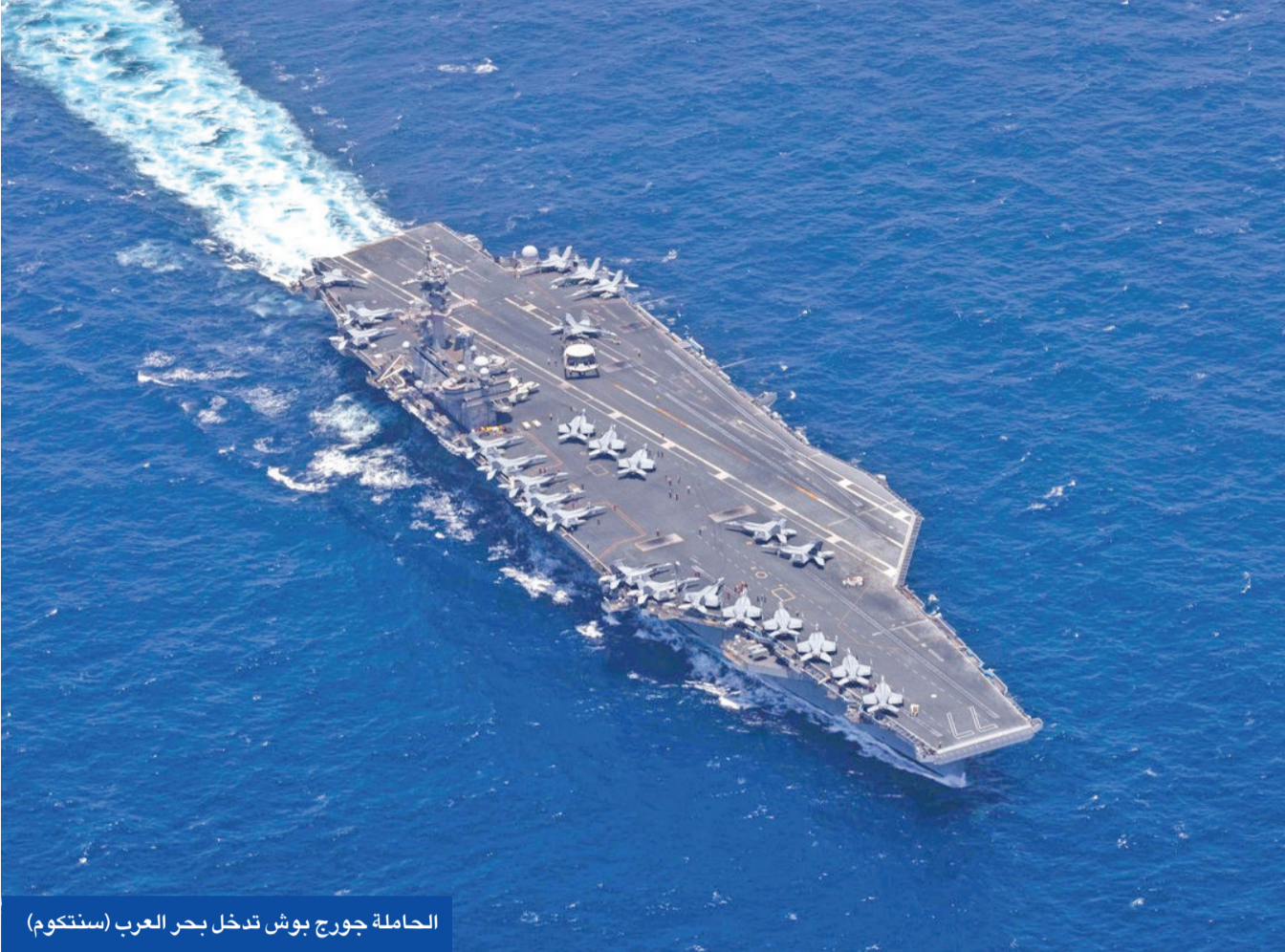
الحاملة جورج بوش تدخل بحر العرب