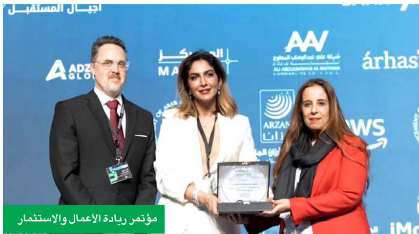
مؤتمر ريادة الأعمال والاستثمار