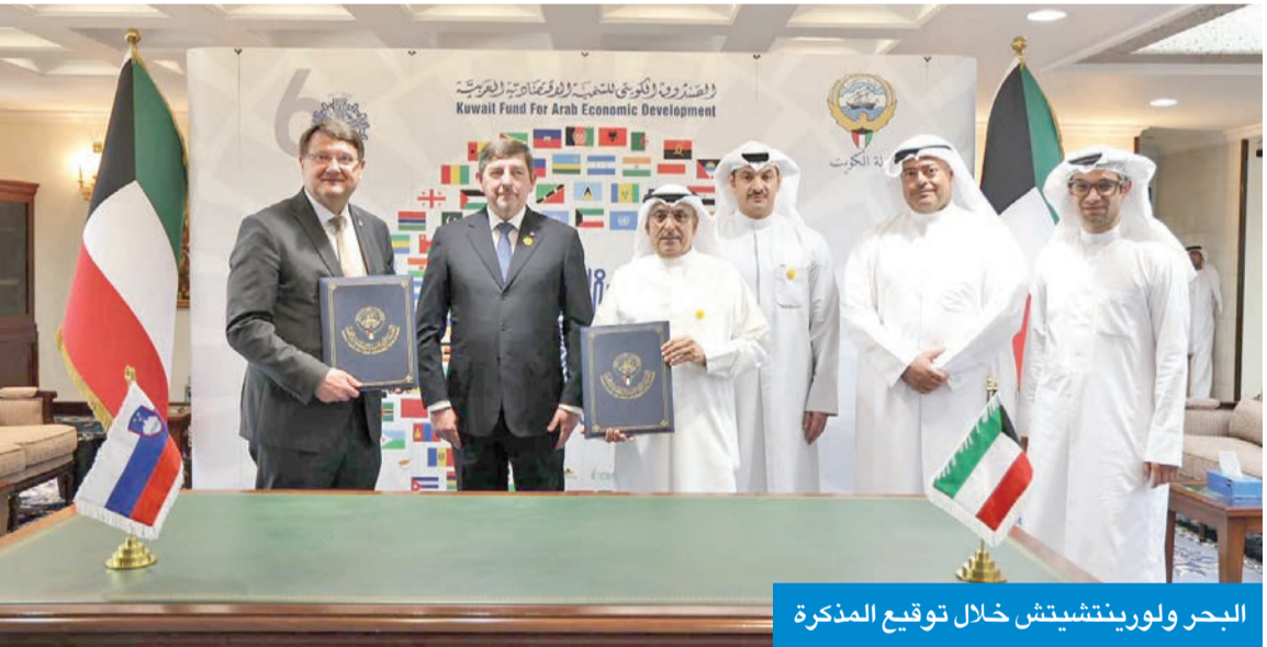
البحر ولورينتشيتش خلال توقيع المذكرة

لدعم التعاون بدول يشترك فيها الطرفان بمشاريع وبرامج تنمية نشطة