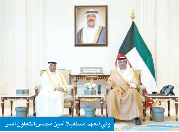
ولي العهد مستقبلاً أمين مجلس التعاون أمس