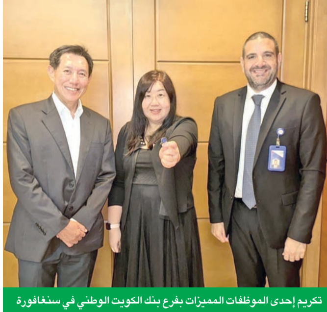
تكريم إحدى الموظفين المميزات بفرع بنك الكويت الوطني في سنغافورة

البرنامج عزز إنتاجية الموظفين ورسخ أهمية العمل الجماعي وروح الفريق