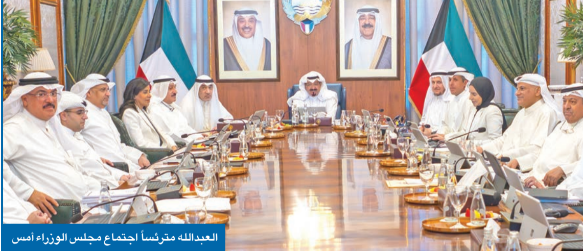
العدالله مترئساً اجتماع مجلس الوزراء أمس