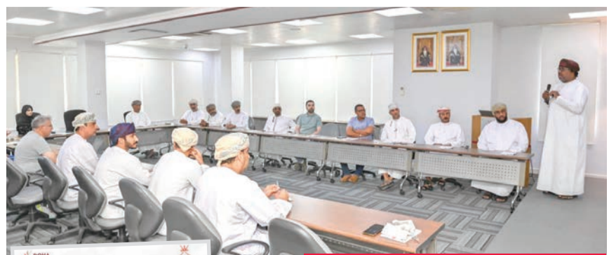
اجتماع ممثلي الاتحادات في اللجنة الأولمبية

أعلنت اللجنة الأولمبية العمانية مشاركتها في دورة الألعاب الخليجية الرابعة بالدوحة، خلال الفترة من 11 إلى 22 الجاري، بوفد يضم 78 رياضياً ورياضية، عبر 11 منتخباً ينافسون في 11 رياضة.