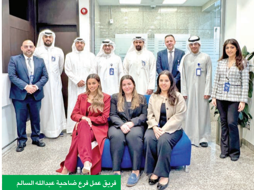
فريق عمل فرع ضاحية عبدالله السالم