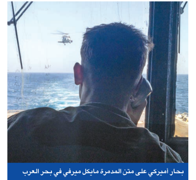
بحار أميركي على متن المدمرة مايكل ميرفي في بحر العرب

وكان المندوب الأميركي لدى الأمم المتحدة، مايك والتر، أعلن أمس الأول أن «المشروع لا يشمل مضيق هرمز فقط، بل أيضاً الممرات الدولية كافة، مثل جبل طارق وملقا»، موضحاً أنه يختلف عن مشروع البحرين، الذي عرقلته روسيا والصين الشهر الماضي، في أنه «يركز بصورة أكبر على زرع الألغام في الممرات المائية الدولية وفرض الرسوم الذي سيؤثر على جميع