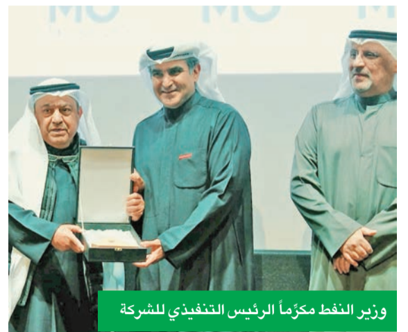
وزير النفط مكرمًا الرئيس التنفيذي للشركة

ونؤمن بأن تمكين رواد الأعمال يمثل ركيزة أساسية لدفع عجلة النمو الاقتصادي. ومن هذا المنطلق، نعمل على بناء منظومة داعمة تفتح آفاقًا جديدة أمام الكفاءات الوطنية، ونسرع ونيرة التحول الرقمي في الكويت.