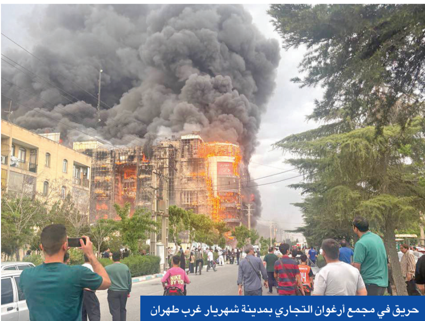
حريق في مجمع أرغوان التجاري بمدينة شهريار غرب طهران

أن إيران هي الطرف المعتدي، والمسؤولة عن تفاقم الأزمة في منطقة الخليج العربي. وأضاف أن طهران تمثل مصدر الخطر والتهديد لأمن الخليج واستقراره، في ظل استمرار سياساتها التصعيدية، بما في ذلك استهداف البنية التحتية المدنية وتهديد ممرات الملاحة الحيوية، وهو ما يستدعي موقفاً دولياً حازماً لردع هذه الممارسات، وضمان استقرار المنطقة.