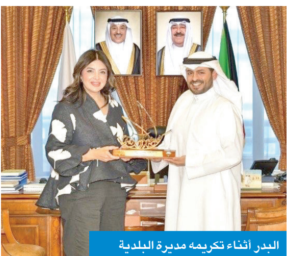
البدر أثناء تكريمه مديرة البلدية

أكد محافظ مبارك الكبير ومحافظ حولي بالتكليف الشيخ صباح البدر، أمس، أهمية العمل الميداني ومتابعة المشروعات التنموية والرقابية في البلاد، ومنها إزالة جميع التعديات القائمة على أملاك الدولة.