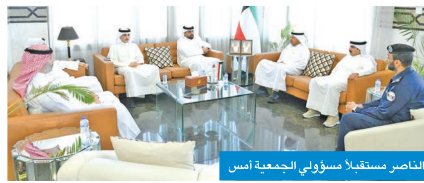
الناصر مستقبلاً مسؤولي الجمعية أمس

دعم العمل التعاوني، وتعزيز الشراكة مع مؤسسات المجتمع، بما يساهم في الارتقاء بالخدمات المقدمة لأهالي المنطقة.