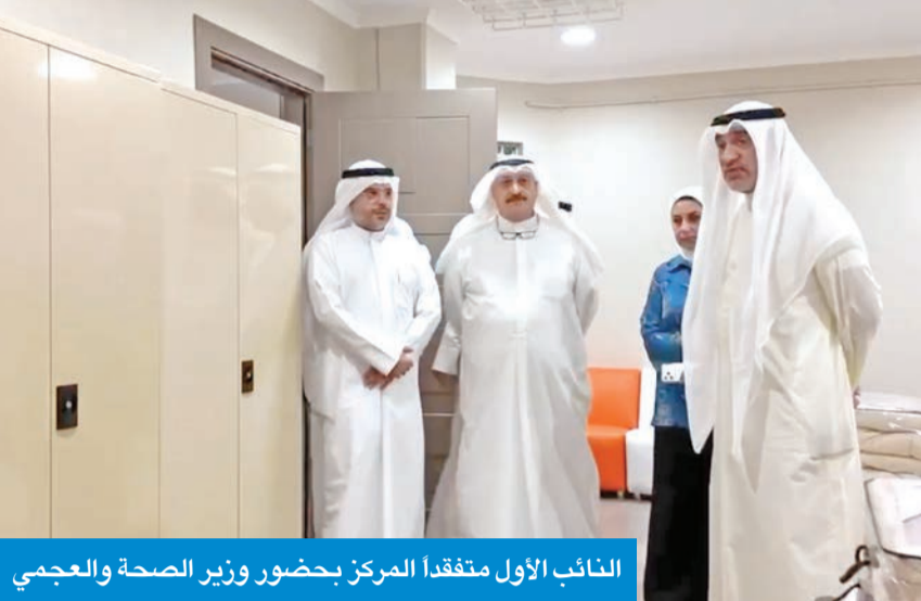
النائب الأول متفقدًا المركز بحضور وزير الصحة والعجمي