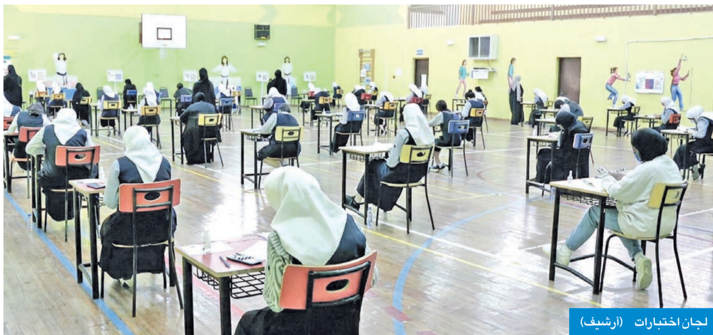
لجان الاختبارات (أرشيف)