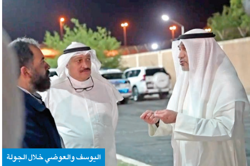
اليوسف والعوضي خلال الجولة

أكد النائب الأول لرئيس مجلس الوزراء وزير الداخلية الشيخ فهد اليوسف أن دعم برامج علاج الإدمان يمثل أولوية، مشدداً على حرص الدولة على توفير الرعاية الصحية والتأهيلية اللازمة لجميع الحالات، وعدم ترك أي شخص دون علاج.