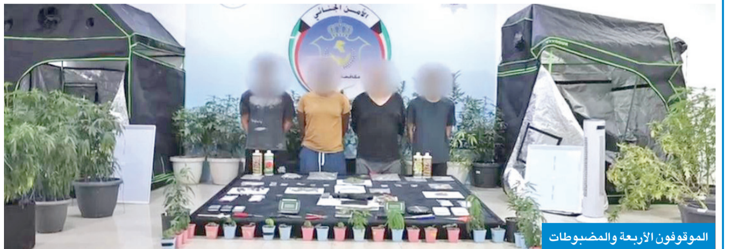
الموقوفون الأربعة والمضبوطات