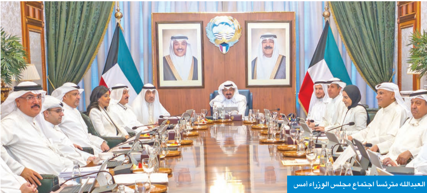
العبدالله مترئسا اجتماع مجلس الوزراء أمس

والأمنية التي تشهدها دولة الكويت والمنطقة. واستعرض المجلس عدداً من المواضيع المدرجة على جدول الأعمال والتقارير والمحاضر وقرر الموافقة عليها، كما قرر حالة عدد منها إلى اللجان الوزارية المختصة لدراستها ورفع التوصيات المناسبة بشأنها لاستكمال الإجراءات الخاصة لإنجازها، ونظراً لتطورات الأوضاع المتسارعة في ظل الظروف الراهنة فإن مجلس الوزراء مستمر في حالة انعقاد دائم لمتابعة آخر المستجدات على الساحتين المحلية والإقليمية.