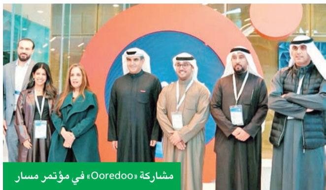
مشاركة Ooredoo، في مؤتمر مسار

تواصل Ooredoo الكويت العمل على تعزيز مكانتها كشريك وطني فاعل، من خلال الابتكار، وتوسيع شراكاتها، وإطلاق مبادرات نوعية تسهم في تحقيق التنمية المستدامة، بما يتماشى مع رؤية الكويت 2035، ويعكس التزامها الدائم برؤيتها في تطوير عالم عملائها بكل ما يتطلبه ذلك.