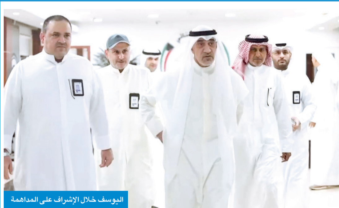
اليوسف خلال الإشراف على المداهمة

أسس إنسانية ومهنية للتعامل مع مرضى الإدمان لمعالجتهم وإعادة دمجهم في المجتمع