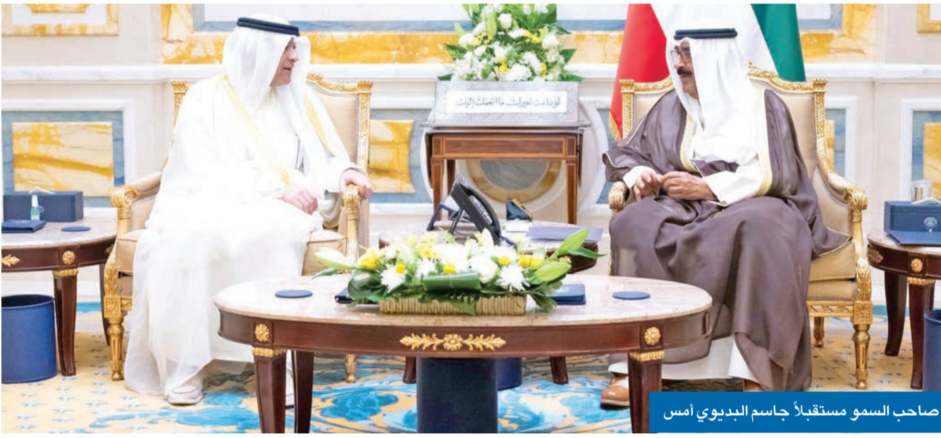
صاحب السمو مستقبلاً جاسم البديوي أمس

استقبل سمو أمير البلاد الشيخ مشعل الأحمد، أمس، الأمين العام لمجلس التعاون لدول الخليج العربية جاسم البديوي. وقالت الأمانة العامة لمجلس التعاون، في بيان على موقعها الإلكتروني، إن الأمين العام للمجلس استمع خلال الاستقبال إلى التوجيهات السامية من صاحب السمو، والتي أكدت أهمية مواصلة دعم مسيرة مجلس التعاون وتعزيز جهود التكامل بين دوله، بما يلبي تطلعات شعوبه نحو مزيد من الأمن والاستقرار والازدهار والتنمية. وأعرب البديوي لسمو أمير البلاد عن شكره وتقديره لدعم سموه الكريم لمسيرة العمل الخليجي المشترك، وأعمال الأمانة العامة للمجلس.