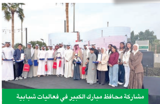
مشاركة محافظ مبارك الكبير في فعاليات شبابية