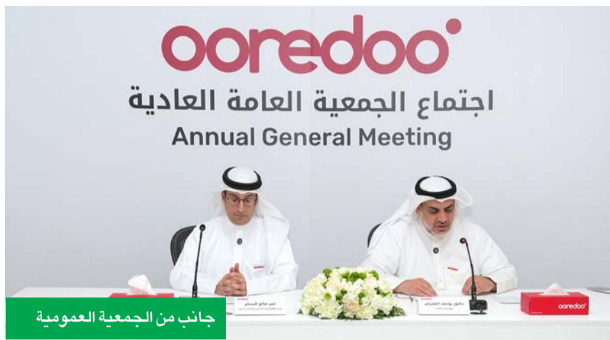
جانب من الجمعية العمومية