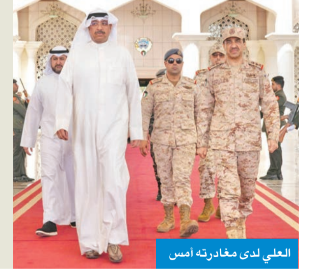
العلي لدى مغادرته أمس

غادر وزير الدفاع الشيخ عبدالله العلي البلاد، صباح أمس، متوجهاً إلى تركيا، تلبية لدعوة من نظيره التركي. ورافق العلي نائب رئيس الأركان العامة للجيش اللواء الركن الطيار صباح الجابر وعدد من كبار الضباط القادة من وزارتي الدفاع والداخلية والحرس الوطني. كان في وداع العلي لدى مغادرته البلاد رئيس الأركان العامة للجيش، الفريق الركن خالد الشريهان، ووكيل وزارة الدفاع الشيخ ر. عبدالله المشعل.