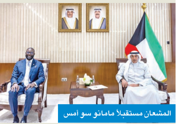
المشعان مستقبلاً مامانو سو أمس

استقبل نائب وزير الخارجية، السفير حمد المشعان، أمس، رئيس البعثة الإقليمية للجنة الدولية للصليب الأحمر لدول مجلس التعاون لدول الخليج العربية، مامانو سو، بمناسبة انتهاء مهام عمله.