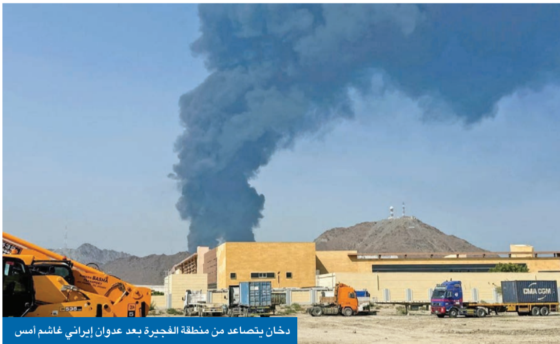
دخان يتصاعد من منطقة الفجيرة بعد عدوان إيراني غاشم أمس

• «سنتكوم»: أغرقنا 6 زوارق إيرانية ونحط السفن على عبور «الممر الآمن»