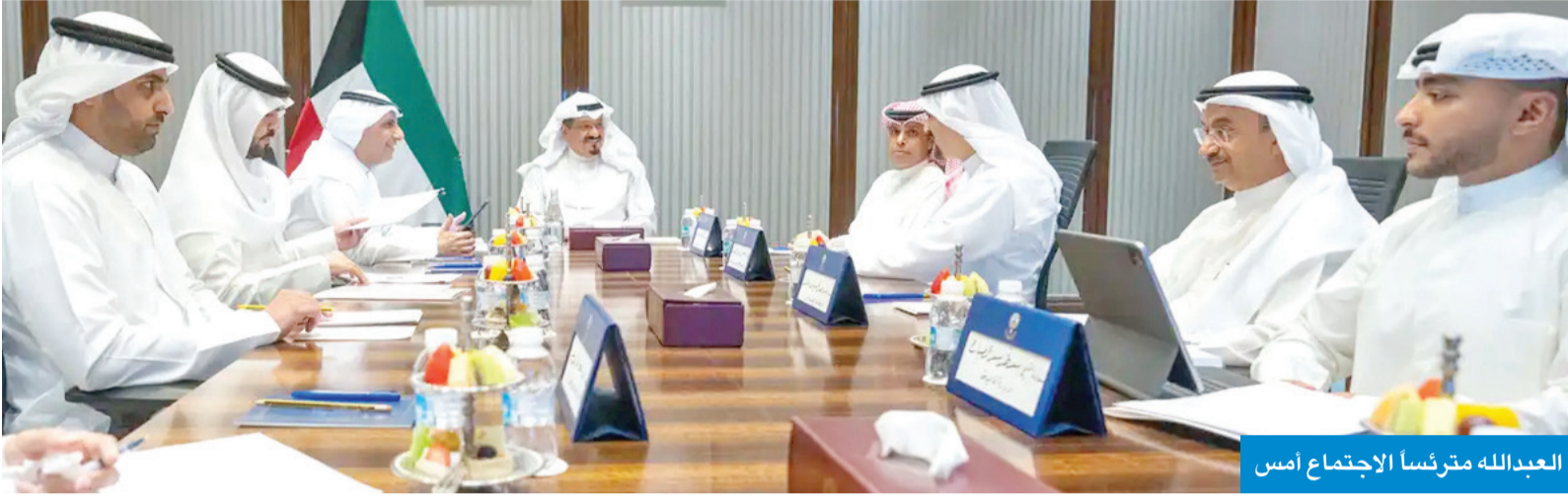
العدالة مترئساً الاجتماع أمس

● وجه خلال ترؤسه اجتماعاً لمتابعة «إعادة الهيكلة» إلى بناء منظومة إدارية متطورة ● الإسهام في استثمار موارد الدولة وإكساب الإدارة الكفاءة والشفافية لمواكبة المستقبل