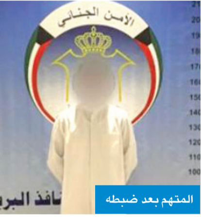
المتهم بعد ضبطه