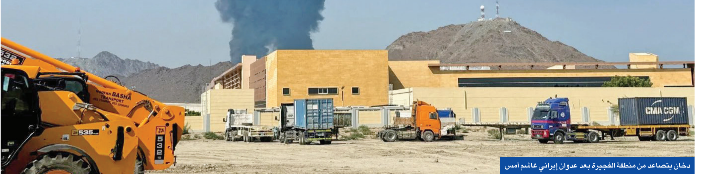
دخان يتصاعد من منطقة الفجيرة بعد عدوان إيراني غاشم أمس