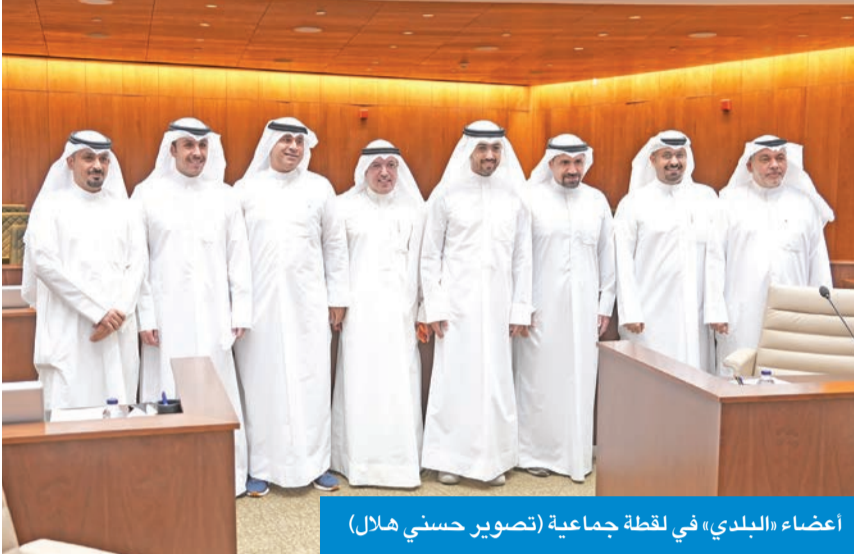
أعضاء «البلدي» في لقطة جماعية

اعتمد في جلسته العادية اشتراطات بناء المستشفيات الخاصة وخصص موقعا لهيئة الاستثمار