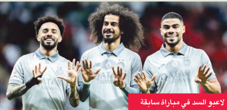
لاعبو السد في مباراة سابقة

يصطدم السد حامل لقب كأس أمير قطر بالدحيل مساء اليوم الثلاثاء في نصف النهائي، في مواجهة قوية تحدد الطرف الأول للنهائي المرتقب، حيث ينتظر الفائز لقاء الغرافة حامل للقب مع الوكرة.