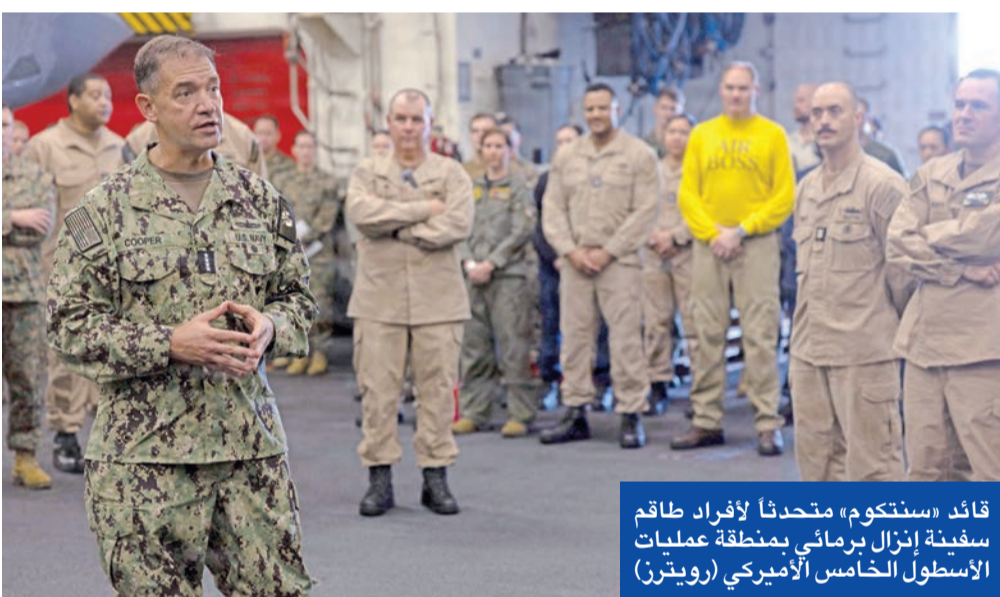
قائد «سنتكوم» متحدثاً لأفراد طاقم سفينة إزال برماني بمنطقة عمليات الأسطول الخامس الأميركي

وفي مقابلة مع «فيس نيوز»، هدد ترامب بإبادة إيران من على وجه الأرض إذا هاجمت السفن الأميركية المشاركة في العملية. ورداً على المشروع الأميركي، حذر رئيس لجنة الأمن القومي البرلمانية الإيرانية، إبراهيم عزيزي، من أن أي تدخل أميركي في النظام الملاحي الجديد لـ «هرمز» سيعتبر خرقاً لاتفاق القبولين في الإمارات. وقبل الغار الذي تم تمديد من واشنطن لأجل غير مسمى. وأعلنت بحرية «الحرس الثوري» توسيع نطاق سيطرتها بـ «هرمز» ليشمل «من الجنوب خطا يربط بين كوه مبارك في إيران وجنوب الفجيرة في الإمارات، ومن الغرب خطا يربط بين نهاية جزيرة قشم الإيرانية وأم القيوين في الإمارات». وفي حين أظهرت بيانات ملاحية عبور 9 سفن لـ «هرمز» في الاتجاهين، منذ دخول «مشروع الحرية»، حين سفن تجارية أو ناقلة النفط من المضيق خلال الساعات الماضية. وإلى جانب الناقلة الإماراتية التي قصفها الحرس الثوري تعرضت سفينة كورية للهجوم.