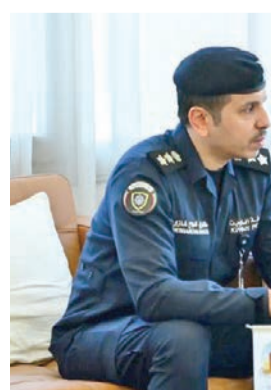
الناصر مستقبلاً العقيد العتيبي

بما يسهم في الارتقاء بمستوى الخدمات وتحسين جودة الحياة. وخلال اللقاء، تم استعراض عدد من المبادرات والمشاريع الهادفة إلى تعزيز الاستدامة البيئية، إلى جانب دعم البرامج المجتمعية التي تخدم أهالي المنطقة، بما يتماشى مع توجهات الدولة في تحقيق التنمية المستدامة.