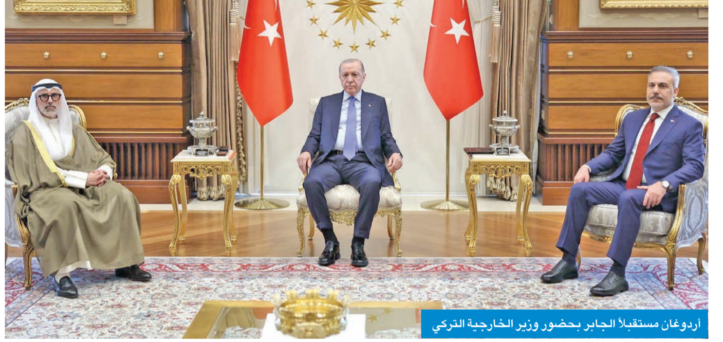
أردوغان مستقبلاً الجابر بحضور وزير الخارجية التركي

أردوغان عقد لقاء مغلقاً مع وزير الخارجية في المجمع الرئاسي بأنقرة