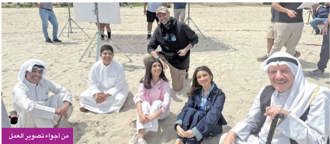
من أجواء تصوير العمل

ويُعد فيلم «من جيل إلى جيل» نموذجاً للأعمال الهادفة التي تخاطب مختلف الأجيال، وتُبرز إسهامات كل جيل في بناء الحاضر واستشراف المستقبل، في رسالة تؤكد أن مسيرة التنمية الخليجية هي امتداد متواصل تتكامل فيه الجهود وتتعاظم فيه المسؤوليات.