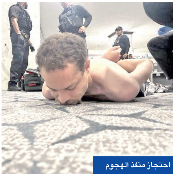
احتجاز منفذ الهجوم