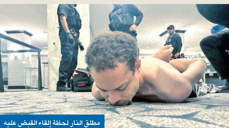
مطلق النار لحظة إلقاء القبض عليه

الرئيس الأميركي يستبعد تورط إيران... ومنفذ الهجوم مدرس لم تتضح دوافعه