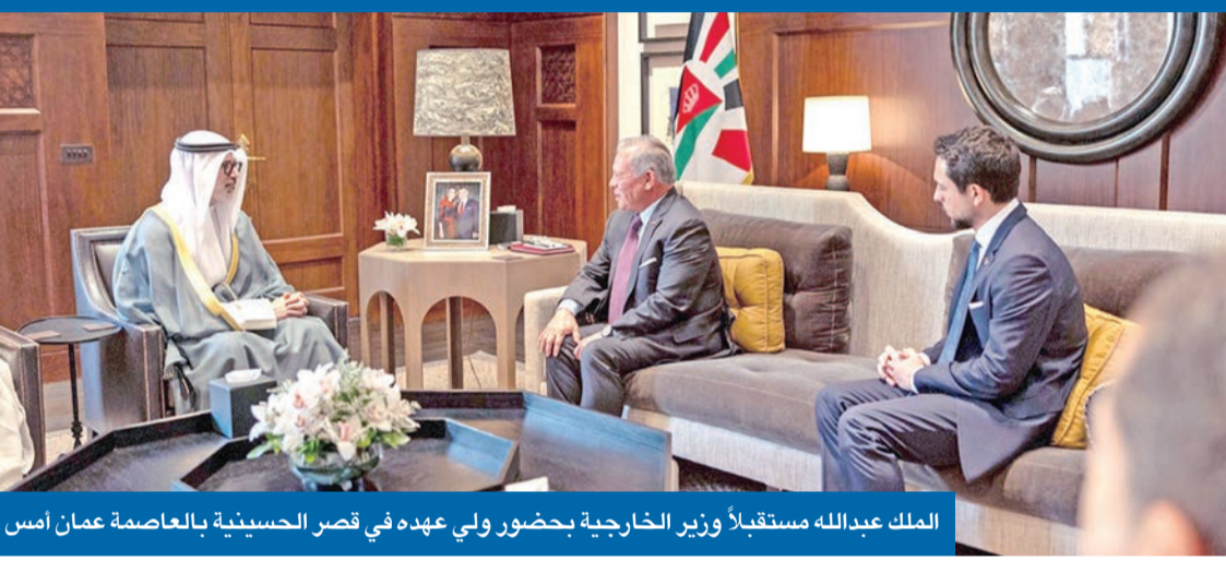
الملك عبدالله مستقبلاً وزير الخارجية بحضور ولي عهده في قصر الحسينية بالعاصمة عمان أمس

طلب وزير الخارجية الإيراني عباس عراقبي، وفق ما علمت