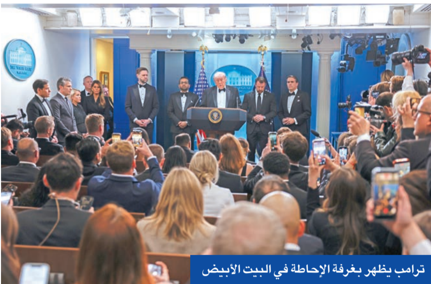
ترامب يظهر بغرفة الإحاطة في البيت الأبيض