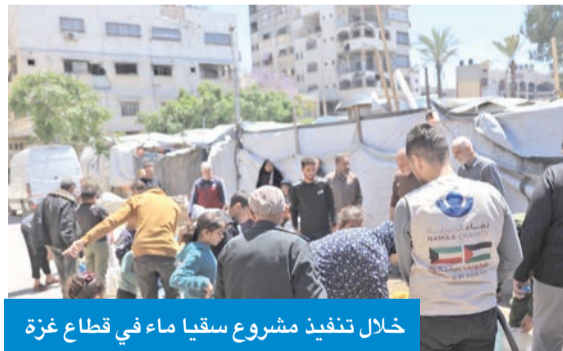
خلال تنفيذ مشروع سقيا ماء في قطاع غزة

أعلنت حمية نماء الخيرية؛ التابعة لجمعية الإصلاح الاجتماعي في الكويت، تنفيذ مشروع إنساني بعنوان «قطرة تحيي الأمل» لتوزيع 450 صهريجاً من المياه في قطاع غزة استفاد منه أكثر من 11250 شخصاً، ضمن جهودها الرامية إلى تلبية الاحتياجات الأساسية للسكان المتضررين في ظل الأوضاع الإنسانية الصعبة هناك.