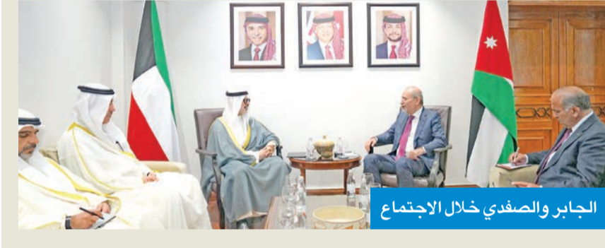
الجابر والصفدي خلال الاجتماع

بحثا العلاقات بين البلدين وتطورات الأحداث وجهود المعالجة