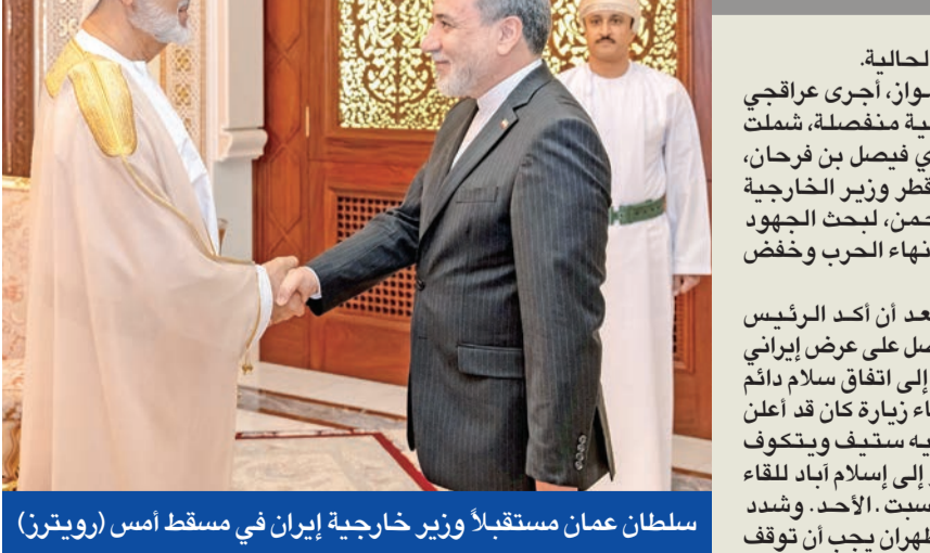
سلطان عمان مستقبلاً وزير خارجية إيران في مسقط أمس

ميدانياً، ادعى «الحرس الثوري» أن سفينة الحاويات «فرانسيسكا» تابعة لإسرائيل وأمريكا، مشيراً إلى أنه احتجزها رداً على احتجاز سفن إيرانية من قبل البحرية الأميركية.