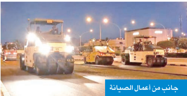
جانب من أعمال الصيانة

تسريع وتيرة الإنجاز في مشاريع الصيانة، مع الالتزام بالجدول الزمني المحدد، لضمان إنجاز الأعمال في الوقت المناسب، وتحقيق نقلة نوعية في مستوى الطرق والسلامة المرورية بالبلاد.