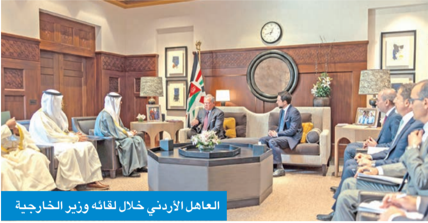
العاهل الأردني خلال لقائه وزير الخارجية

ونقل الوزير الجابر خلال اللقاء تحيات سمو أمير البلاد الشيخ مشعل الأحمد، وولي العهد الشيخ صباح الخالد إلى الملك وولي عهده، وتمنياً سموهما لهما بتمام الصحة وموفور العافية وللشعب الأردني الشقيق المزيد من التقدم والازدهار.