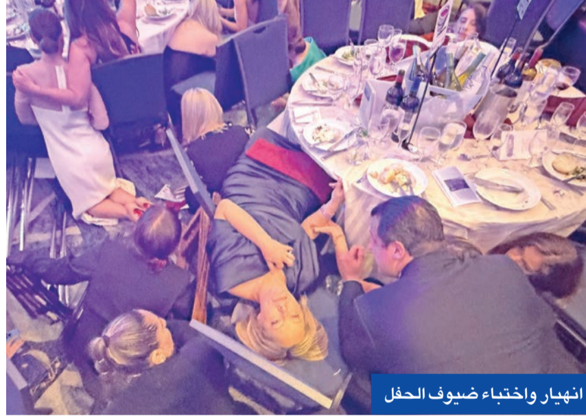
انتهاء واختباء ضيوف الحفل

الكويت وعلى الفور، توالى ردود فعل قادة العالم تعبيراً عن الصدمة والارتياح لسلامة ترامب وزوجته وضيوفه. وأدانست وزارة الخارجية محاولة اقتحام المسلح للقاعة التي كان يتواجد فيها ترامب، وأكدت تضامناً الكويت مع حكومة وشعب الولايات المتحدة، وجددت موقفها الرافض لكل أشكال العنف.