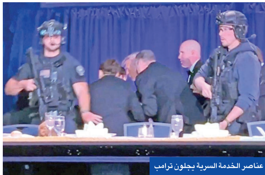
عناصر الخدمة السرية يجلبون ترامب

اليوم به أمام المحكمة الاتحادية. وفي مفارقة تاريخية أضافت بُعداً دراماتيكياً للمحاولة الجديدة لاغتيال ترامب، وقع الحادث في فندق هيلتون واشنطن، وهو الموقع نفسه الذي أطلق فيه النار على الرئيس في محاولة اغتيال عام 1981. وإضافة إلى مخططات خارجية وإيرانية لم تصل إلى التنفيذ والتهديدات والوقائع الأمنية في 2016 و2018، تعرض ترامب إلى حادثين أمنيين خطيرين منذ الحملة الرئاسية لولايته الثانية، الأول في 13 يوليو 2024، في تجمع انتخابي في باتلر، بنسلفانيا، حيث أطلق مسلح النار، مما أدى إلى إصابة ترامب في آذنه، ومقتل أحد الحضور. أما الحادث الثاني فوقع في 15 سبتمبر 2024، في نادي ترامب الدولي للغولف في ويست بالم بيتش، فلوريدا، حيث رصد جهاز الخدمة السرية مسلحاً كان يختبئ في الشجيرات بالقرب من ملعب الغولف قبل أن يتم إلقاء القبض عليه.