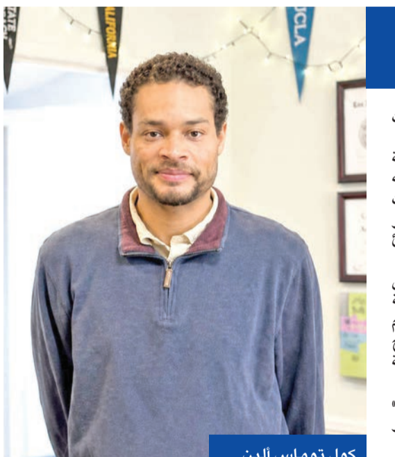
كول توماس ألين

ويكمن هذا الخطاب نبرة أكثر حذراً مقارنة بمواقفه السابقة بعد محاولة اغتياله خلال الحملة الانتخابية عام 2024 في بنسلفانيا، حين حذّر من «مناخ خطير جداً بسبب مستوى الخطاب السياسي»، ملحاً إلى مسؤولية خصومه السياسيين بالقول «لقد وصفوني بانني تهديد للديموقراطية».