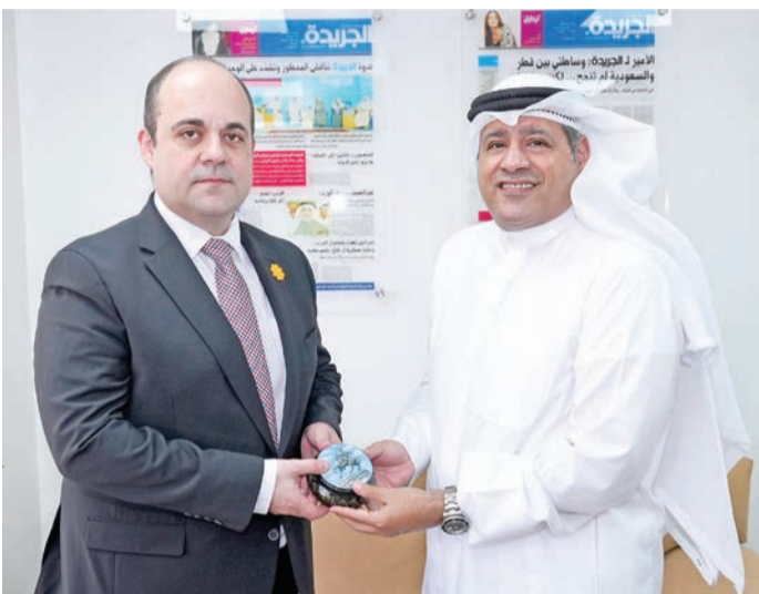
السفير صباح يقدم هدية تذكارية لرئيس التحرير

جرى بين الرئيس الأوكراني فولوديمير زيلينسكي وسمو ولي العهد الشيخ صباح الخالد في 4 مارس الماضي. من جانبه، ركب الزميل العنبي بالسفير الأوكراني، مؤكداً حرص «الجريدة» على الانفتاح على مختلف التجارب الدولية، وعلى تعزيز التعاون مع السفارات والبعثات الدبلوماسية بما يخدم القارئ، ويثري المحتوى الصحفي، مشيراً إلى أهمية الإعلام في دعم العلاقات الدبلوماسية والاقتصادية، وتعريف الرأي العام بالفرص الاستثمارية والتجارية المتاحة في الدول الصديقة.