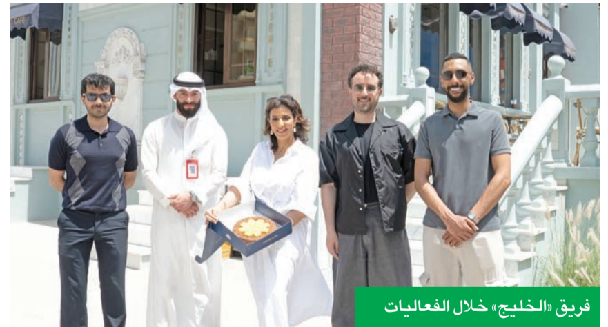
فريق «الخليج» خلال الفعاليات

في إطار رعايته لمبادرة «زهرة العرفج» الوطنية