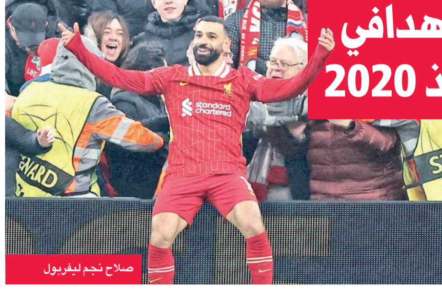
صلاح نجم ليفربول

لكرة القدم أمس عن المدرب ليام روسينيور. وأضاف الطالما تحلى ليام بأعلى درجات النزاهة والاحترافية منذ تعيينه في منتصف الموسم. وتابع «لم يكن هذا قراراً اتخذته النادي باستخفاف، إلا أن النتائج والأداء الأخيرين لم يرتقيا إلى المستوى المطلوب،