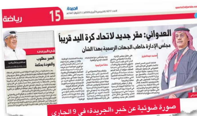
صورة ضوئية عن خبر «الجريدة» في 9 الجاري

تأكيداً لانفراد الجريدة. حول مقر جديد لاتحاد كرة اليد