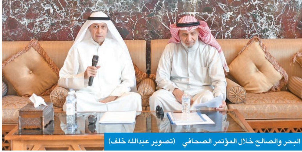
البحر والصالح خلال المؤتمر الصحفي

وشدد على أن مكافحة الغش في الامتحانات عن بُعد تعد قضية محورية في عصر التحول الرقمي، لما لها من تأثير مباشر على جودة التعليم وعدالة تقييم الطلبة، حيث تشير دراسات تقديرية في دول عدة إلى أن أكثر من 50 في المئة مارسوا الغش في الاختبارات الإلكترونية، وربما لا يتم ضبط سوى 2 المئة فقط، مبيّناً أن الاختبارات عن بُعد لا يمكن أن تُلقى على كاهل عضو هيئة التدريس دون تزويده بمعايير ملزمة وتطبيقات وتقنيات تحت إشراف فني تساعده في الامتحانات عن بُعد، قبل الإعلان عن قرار أداؤها إلكترونياً، فهل تم توفير ذلك؟ واستطرد قائلاً: «إذا ما أخذنا بعين الاعتبار التطبيقي الذي صدر قبل فترة لأحة التعليم عن بُعد، حيث نصت المادة 19 أنه في حال تنفيذ الاختبارات الفصلية أو النهائية عن بُعد من خلال المنصات المعتمدة، مستطرداً: «يجب الالتزام باستخدام أدوات التحقق والمراقبة الإلكترونية المعتمدة من مكتب نائب المدير العام للشؤون الأكاديمية والتنمئة والابتكار، بما يكفل التحقق من هوية الطلبة وضمان سلامة إجراءات الاختبارات ونزاهة عملية التقويم، مستطرداً: هل تم الالتزام بما جاء في هذه المادة؟ وهو ما لم يكن واضحاً بعد تواصلنا مع بعض الأقسام، ولفت إلى أن المادة 14 من ذات اللائحة تدعو إلى التزام الطلبة بفتح الكاميرات أثناء الاختبارات مع إظهار الهوية التي تثبت شخصيتهم، وسؤالها هناك كم عدد الكاميرات التي يجب أن يلتزم الطالب بفتحها؟ وكيف سيتم التعامل مع بشأن توفيرها؟ علماً بأن هناك جامعات خاصة ألزمت الطلبة بتوفير 3 كاميرات من جميع النواحي.