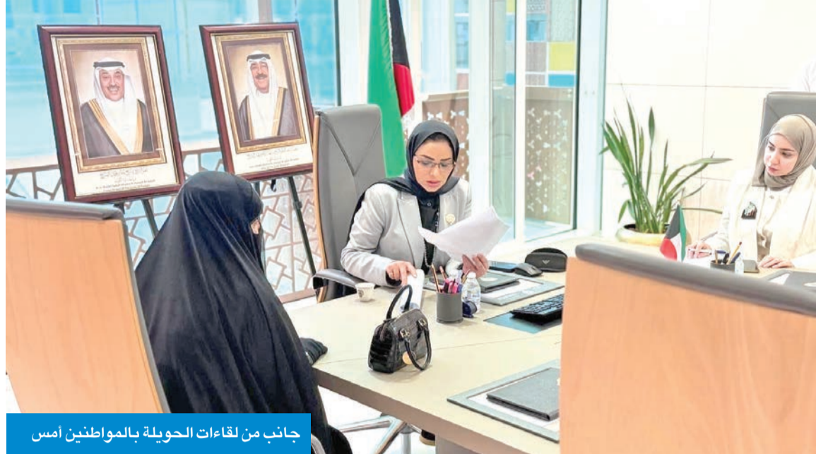
جانب من لقاءات الحويلة بالمواطنين أمس

... وتبحث ونظيرتها الإماراتية السلامة الرقمية للأطفال بحثت الوزارة الحويلة مع وزيرة الأسرة الإماراتية، سناء سهيل، سبل تبادل الخبرات وأبرز الممارسات في مجال السلامة الرقمية للأطفال. وأعلنت «الشؤون» في بيان أمس الأول، أن الحويلة تلقت اتصالاً هاتفياً من وزيرة الإماراتية أعلنت خلاله على تجربة بلادها في مجال السلامة الرقمية للأطفال، وتعزيز الوعي باستخدام المسؤول لتكنولوجيا، حيث أكدت أهمية تكامل الأدوار بين القطاعين العام والخاص في هذا المجال. وأضافت «الشؤون» أن الحويلة استعرضت تجربة الكويت ممثلة في مبادرة «تلمن» التي أطلقها المجلس الأعلى لشؤون الأسرة لتقديم خدمات استشارية ونفسية مجانية لمختلف فئات المجتمع في بيئة آمنة وسرية. ووفق البيان، ناقش الجانبان سبل تعزيز التعاون في إدارة الأزمات والطوارئ، خصوصاً ما يتعلق بدعم الأسرة وتكثيف رسائل التوعية وتعزيز الدعم النفسي والاجتماعي. وأعرب الجانبان، وفقاً لما أورده البيان، عن تمنياتهما بأن يعم الأمن والسلام دول مجلس التعاون الخليجي.