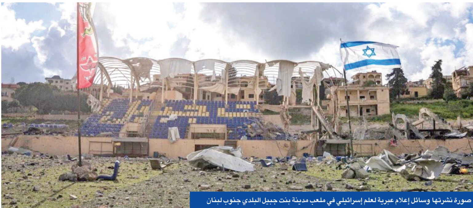
صورة نشرتها وسائل إعلام عبرية لعلم إسرائيلي في ملعب مدينة بنت جبيل البلدي جنوب لبنان

ترتيبات لزيارة عون إلى السعودية وقطر • ننتياهو يشغل محركاته في واشنطن