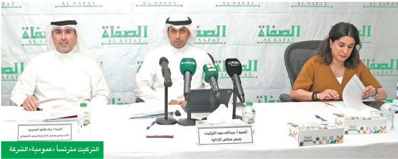
التركيت مترئساً «عمومية» الشركة

«شهدت خلال 2025 تحسناً نوعياً في الأداء التشغيلي والمالي وعززت متانة مركزها المالي»