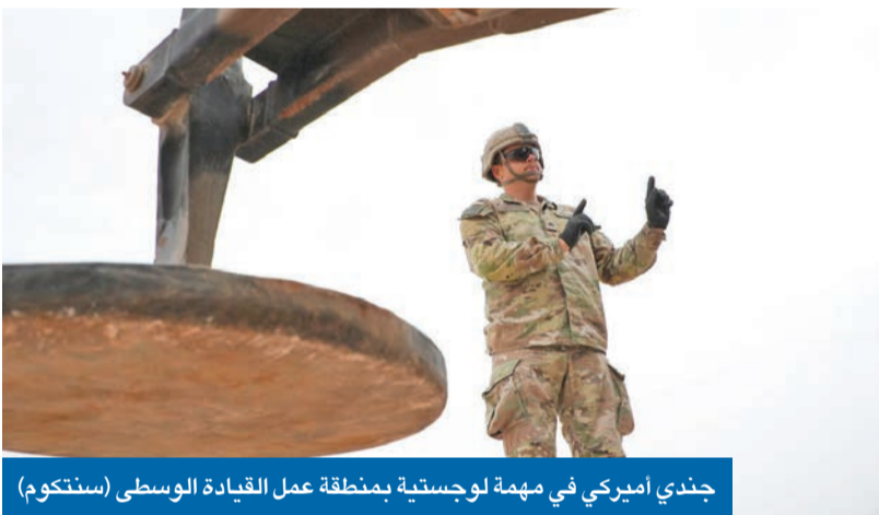
جندي أميركي في مهمة لوجستية بمنطقة عمل القيادة الوسطى (سنتكوم)

فخ «لا حرب ولا سلام» يربك استراتيجية المواجهة الإيرانية