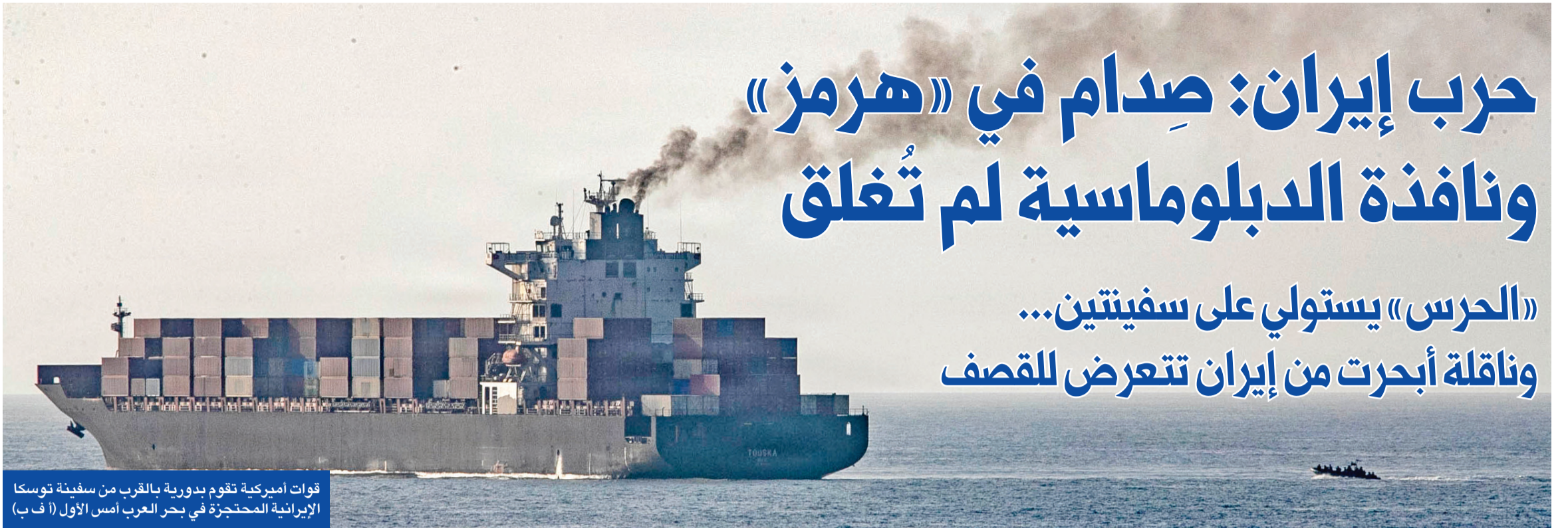
قوات أميركية تقوم بدورية بالقرب من سفينة توسكا الإيرانية المحتجزة في بحر العرب أمس الأول