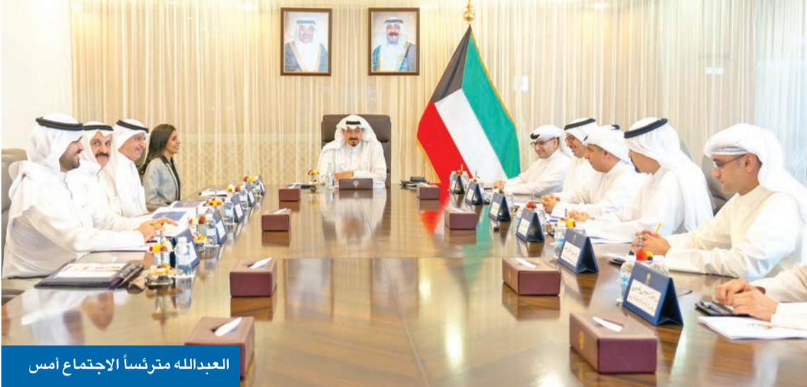
العبدة الله مترئساً الاجتماع أمس

العبدة الله ترأس اجتماعاً لتعزيز كفاءة إدارتها وتوظيفها وفق الأولويات التنموية • استعرض قرارات منح تراخيص لاستغلالها وتطوير منظومة التخزين الاستراتيجي • خدمة للمصلحة العامة ودعم الجاهزية الوطنية لمواجهة مختلف الظروف