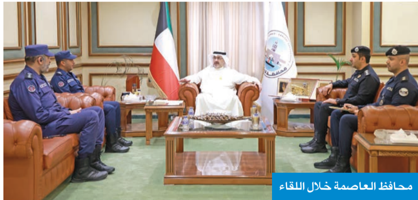
محافظ العاصمة خلال اللقاء

جانب استعراض الخطط الوقائية والتدريبية المشتركة، بما يسهم في تحقيق أعلى معدلات السلامة. في هذا السياق، أكد محافظ العاصمة أهمية الدور الحيوي الذي تضطلع به قوة الإطفاء العام بقطاعاتها المختلفة في تأمين المنشآت الحيوية وحماية الأرواح والممتلكات وخصوصاً في مواقع المطارات التي تمثل بوابة البلاد الأولى. وأشار المحافظ إلى أن أحدث التقنيات والمعدات المستخدمة في مكافحة الحرائق والمنشآت الحيوية يعكس كفاءة الأجهزة الوطنية، وقدرتها على إدارة الأزمات بكفاءة واحترافية.