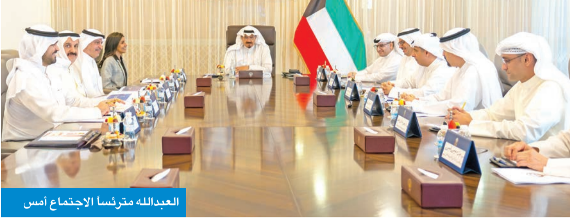
العدالة مترأساً الاجتماع أمس

يخدم المصلحة العامة ويسهم في دعم الجاهزية الوطنية لمواجهة مختلف الظروف. حضر الاجتماع وزيرة الأشغال العامة د. نورة المشعان، ووزير الدولة لشؤون البلدية وزير الدولة لشؤون الإسكان عبدالمطيف المشاري، ووزير الكهرباء والماء والطاقة المتجددة د. صبيح المخيزيم، ووزير التجارة والصناعة أسامة بودي، ووزير الدولة للشؤون الاقتصادية والاستثمار عبدالعزيز المرزوق، ووزير