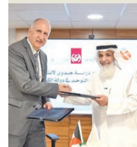
من توقيع الاتفاقية

وتمت أهدافه لما يمثله من إضافة نوعية في خدمة ذوي الاحتياجات الخاصة. وأكد الظفيري، بأن المشروع يُعد مبادرة رائدة تحمل بُعداً إنسانياً وتنموياً مهماً، مشيراً إلى أنه تم عرض الفكرة مسبقاً على وزيرة الشؤون الاجتماعية، أمثال الحويلة، حيث رُحبت بالمشروع