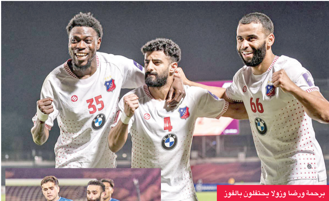
برحمة ورضا وزولا يحتفلون بالفوز

فاز على موراس القيروغزستاني بثنائية في نصف نهائي الدوري