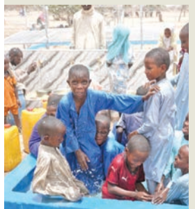
من الآبار المنفذة

نفذت «نماء الخيرية» التابعة لجمعية الإصلاح الاجتماعي مشروع حفر 3 آبار ارتوازية في ولاية حجر لميس بجمهورية تشاد شملت قريتي ملاوي والمساقط، إلى جانب تقديم مساعدات إنعاشية عاجلة للاجئين السودانيين، استفاد منها أكثر من 10 آلاف شخص.