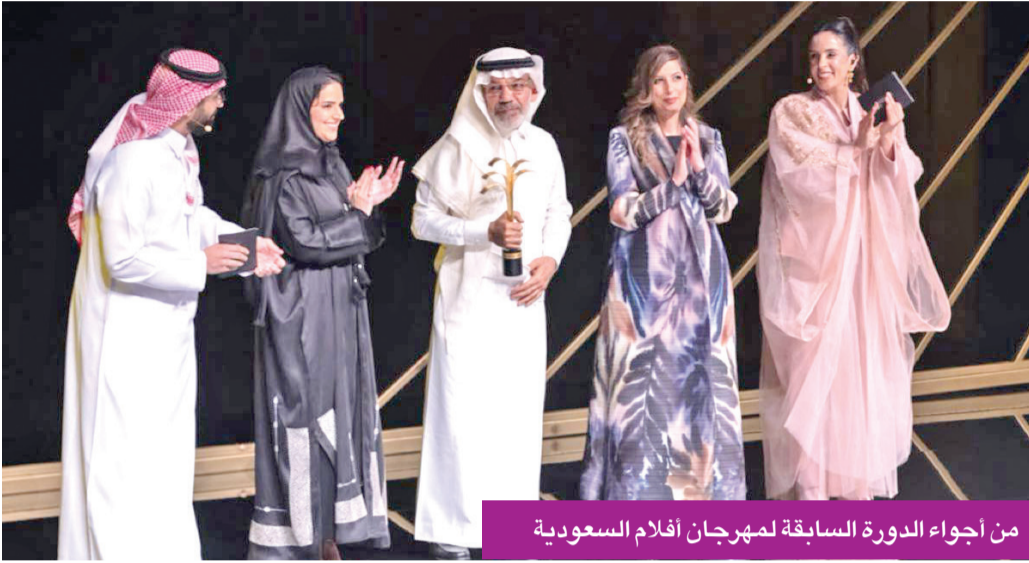
من أجواء الدورة السابقة لمهرجان أفلام السعودية

الحوشان، و«زائف»: خيال علمي، مدته 14 دقيقة و42 ثانية، إخراج إسماعيل البخاري، و«مزروقي»: درامي، مدته 34 دقيقة و10 ثوان، إخراج حسين آل محفوظ، و«مجهول»: درامي، مدته 16 دقيقة و9 ثوان، إخراج إبراهيم الغامدي. يذكر أن مهرجان أفلام السعودية هو حدث ثقافي سينمائي يقدم من خلاله العديد من البرامج الثقافية في القطاع السينمائي، من خلال عروض الأفلام والورش التدريبية والندوات الثقافية والندوات المتقدمة وسوق الإنتاج ومسابقة المشاريع.