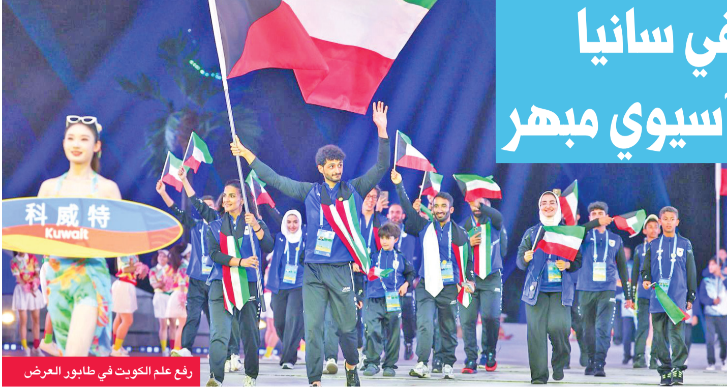
رفع علم الكويت في طابور العرض

مشاركتي بالبطولة لحظة تاريخية ستظل محفورة بذاكرتي كحافز للمزيد من الإنجاز