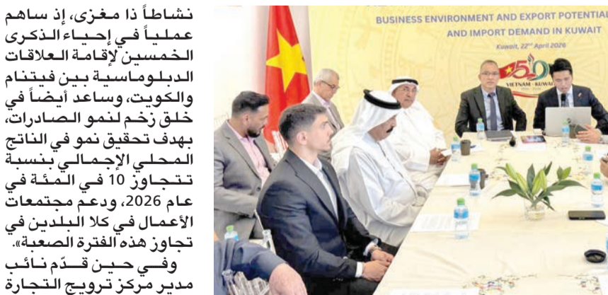
جانب من أعمال المؤتمر

ثانغ: 7.5 مليارات دولار... حجم التجارة بين البلدين سنوياً