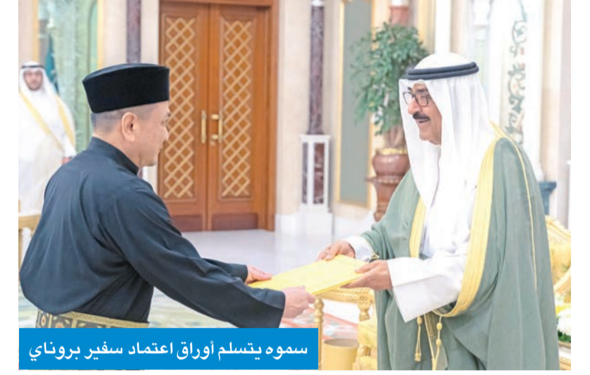
سموه يتسلم أوراق اعتماد سفير بروناي