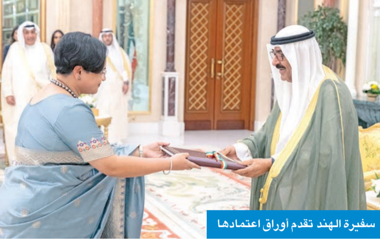
سفيرة الهند تقدم أوراق اعتمادها