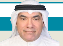
د. عبدالرحمن إبراهيم التركي

على الهامش: لا يوجد كويتي واحد مضطر لتغيير أي شيء لأي أحد. مواقف دولة الكويت مُشرفة، وسياساتها الخارجية معروفة، وموقفها من كل القضايا الإسلامية والعربية ثابت. انتهى النقاش (إلى الأبد).