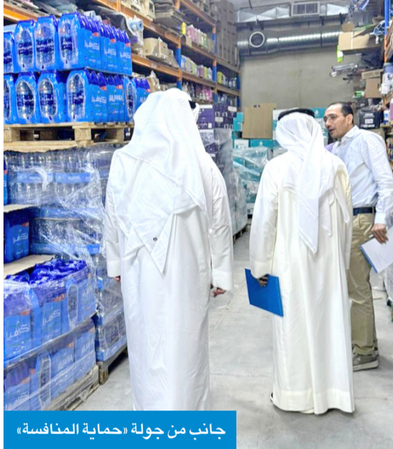
جانب من جولة «حماية المنافسة»

بما يسجّم مع اختصاصات الجهاز ودوره في حماية البيئة التنافسية. ودعا «حماية المنافسة» جميع الفاعلين في الأسواق إلى الالتزام بالقوانين والأنظمة واللوائح ذات الصلة والتعاون مع الفرق المختصة وتقديم البيانات والمعلومات المطلوبة، بما يسهم في تعزيز كفاءة الأسواق والحد من أي ممارسات قد تضر بالمنافسة أو تؤثر على توازن السوق. كما دعا الجهاز المستهلكين وأصحاب الأعمال إلى الإبلاغ عن أي ممارسات يشتبه في مخالفتها لقواعد المنافسة عبر قنواته الرسمية، مشدداً على استمراره في استقبال البلاغات والاستفسارات والتعامل معها وفق الإجراءات القانونية المعمّدة.