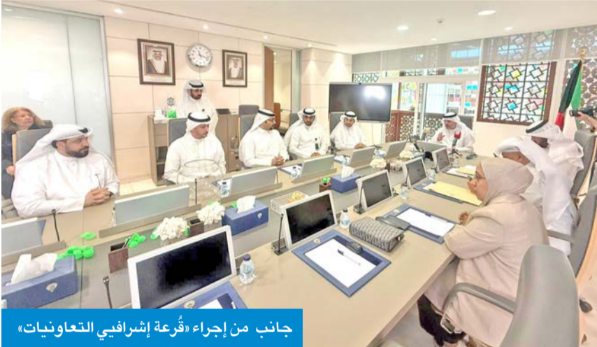
جانب من إجراء «قرعة إشرافية التعاونيات»

نحذّر مجالس الإدارات من التضيق على أصحاب الوظائف بالحيولة دون تمكينهم