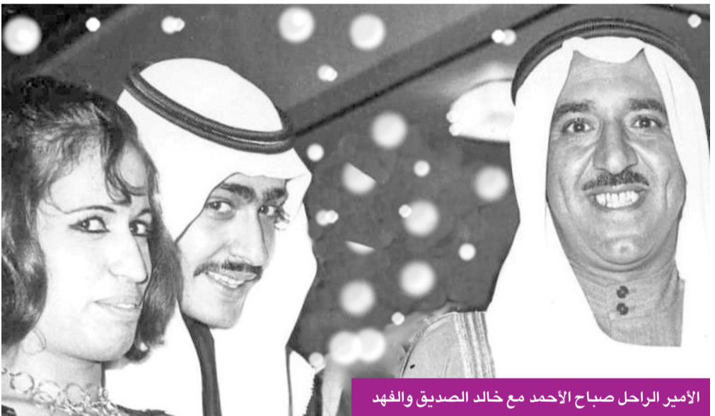
الأمير الراحل صباح الأحمد مع خالد الصديق والفهد

نعت وزارة الإعلام حياة الفهد، التي رحلت بعد مسيرة فنية وإنسانية حافلة بالعباءة، امتدت أكثر من ستة عقود في خدمة الفن والثقافة بالكويت والخليج. وقالت «الإعلام»، في بيان: إن وزير الدولة لشؤون الاتصالات وتكنولوجيا المعلومات وزير الإعلام والثقافة بالوكالة عمر العمر وجميع منتسبي الوزارة يتقدمون بخالص العزاء وصادق المواساة إلى أسرة الفقيده وذويها، مستذكرين ما قدمته من إسهامات بارزة أثرت الساحة الفنية الكويتية والخليجية وجعلتها إحدى رائدات الفن.