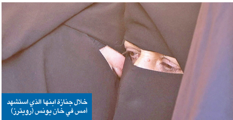
خلال جنازة ابنها الذي استشهد أمس في خان يونس

الليل لأنني مضطر إلى مراقبة أطفالتي باستمرار». نصف مساحة القطاع ما زال تحت السيطرة العسكرية الإسرائيلية، بموجب اتفاق وقف إطلاق النار الذي دخل حيز التنفيذ في أكتوبر 2025.