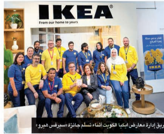
فريق إدارة معارض إيكيا الكويت أثناء تسلم جائزة «سيرفيس هيرو»