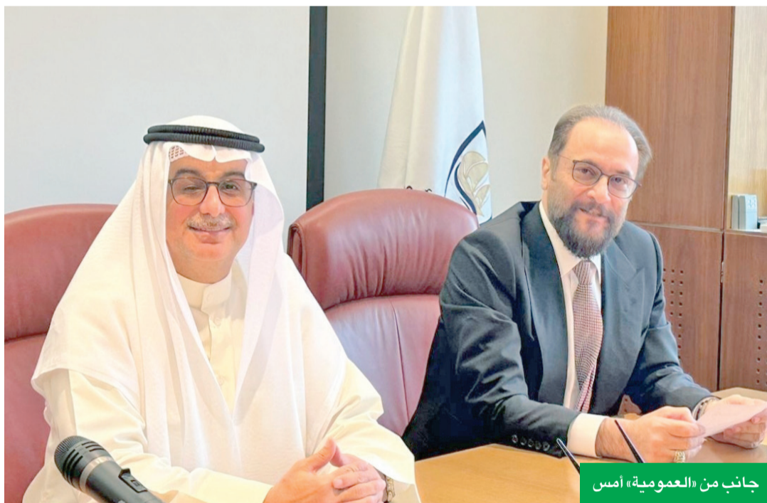
جانب من «العمومية» أمس

«عمومية» الشركة تقر توزيع 40% أرباحاً نقدية و28.8% أسهم منحة