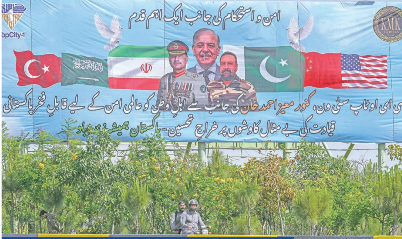
لوحة ترحب باستضافة مباحثات السلام الأميركية - الإيرانية في إسلام آباد أمس الأول

● قاليباف: ترامب يريد «طاولة استسلام» ونرفض التفاوض تحت التهديد