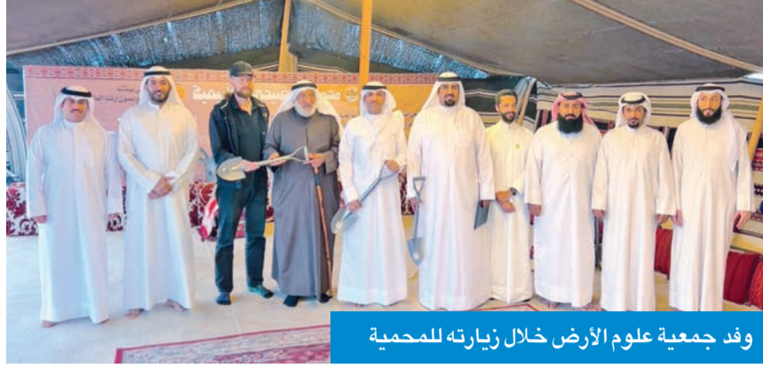
وفد جمعية علوم الأرض خلال زيارته للمحمية

الجمعية احتفت بيوم الأرض وزارات محمية الوضحي الطبيعية في «أم قدير»