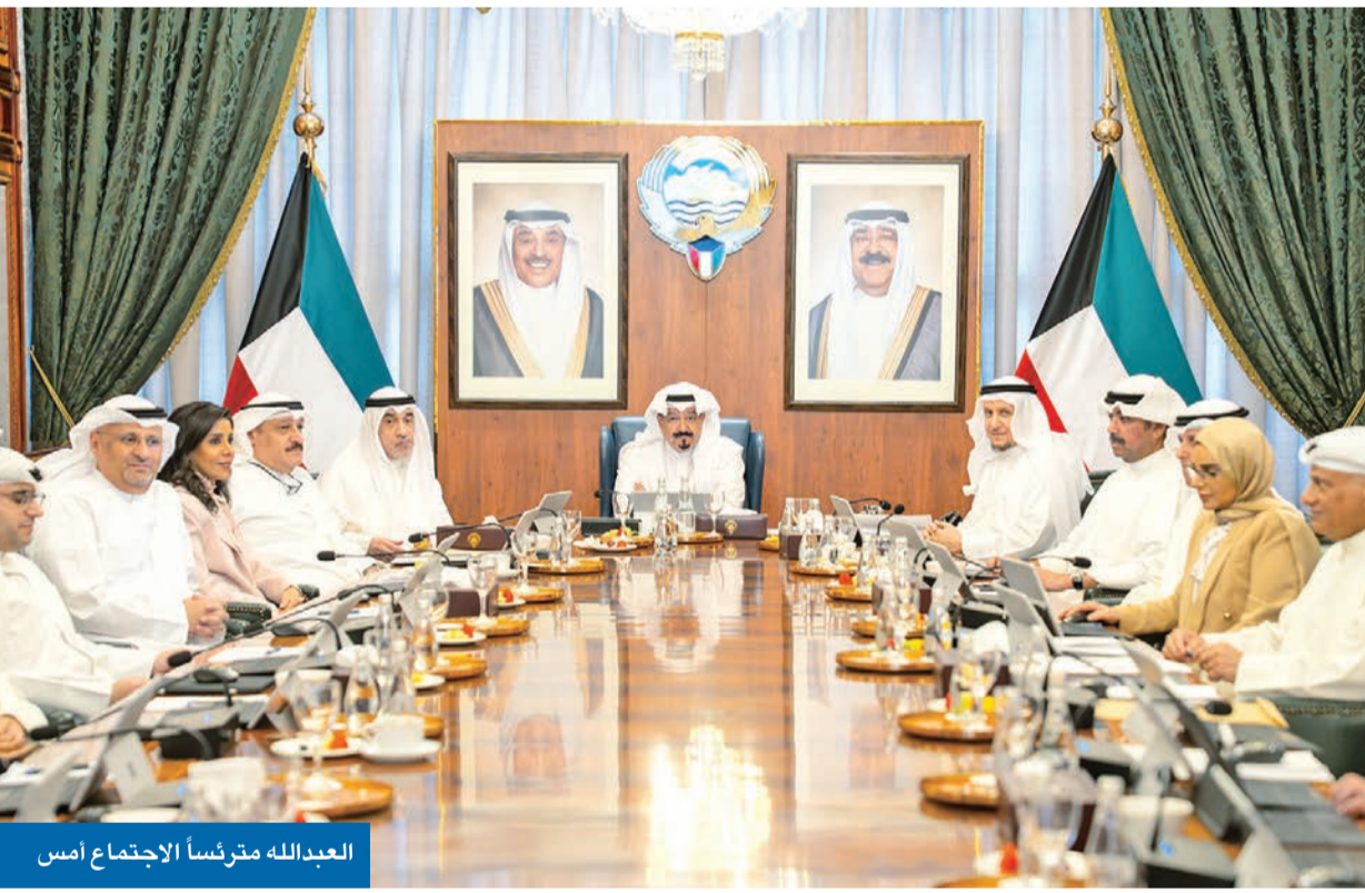
العبدالله مترئساً الاجتماع أمس

اطمأن على جاهزية الجهات الحكومية لضمان سلامة الأرواح وتوفير الاحتياجات المعيشية «مستمرون في حالة انعقاد دائم لمتابعة آخر المستجدات على الساحتين المحلية والإقليمية» «متضامنون مع الإمارات لحفظ أمنها بعد نجاحها في تفكيك تنظيم إرهابي على أرضها»