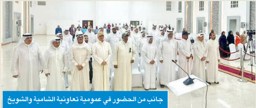
جانب من الحضور في عمومية تعاونية الشامية والشويخ