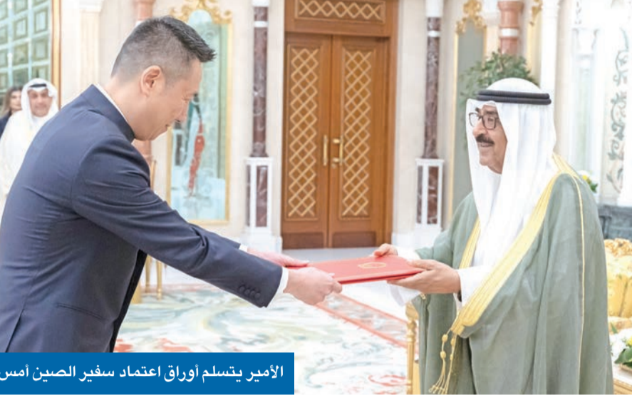
الأمير يتسلم أوراق اعتماد سفير الصين أمس