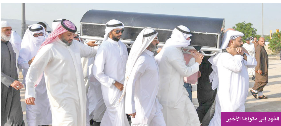
الفهد إلى مفاها الأخير

الرحلة الأخيرة في سنواتها الأخيرة، بدأت ملامح التعب تظهر على جسدها، لكنها استمرت في العطاء، وتعرضت لأمراض صحية متكررة، كان أبرزها إصابتها بجلطة دماغية في أغسطس الماضي، بعد خضوعها لعملية قسطرة في القلب، مما أدى إلى فقدانها الكامل للحركة والإدراك، مما استدعى وضعها على أجهزة التنفس الصناعي في العناية المركزة، ومن ثم تم نقلها إلى المملكة المتحدة لاستكمال العلاج، ومع ضعف استجابتها للعلاج عادت الفهد إلى أرض الوطن لتكمل فكاها ضد المرض، ورغم استقرار حالتها لفترة، فإن وضعها الصحي ظل هشاً. وفي الأيام الأخيرة، تدهورت حالتها بشكل حاد، ودخلت العناية المركزة، قبل أن تفارق الحياة. وقدمت الفهد أعمالاً كثيرة حققت نجاحاً كبيراً، منها «سليمان الطيب» و«جرح الزمن» و«مدينة الرياح» و«سيف العرب» و«قناص خيطان» و«أم هارون» وغيرها.