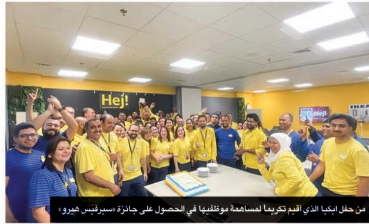
من حفل إيكيا الذي أقيم تكريماً لمساهمة موظفيها في الحصول على جائزة سيرفيس هيرو