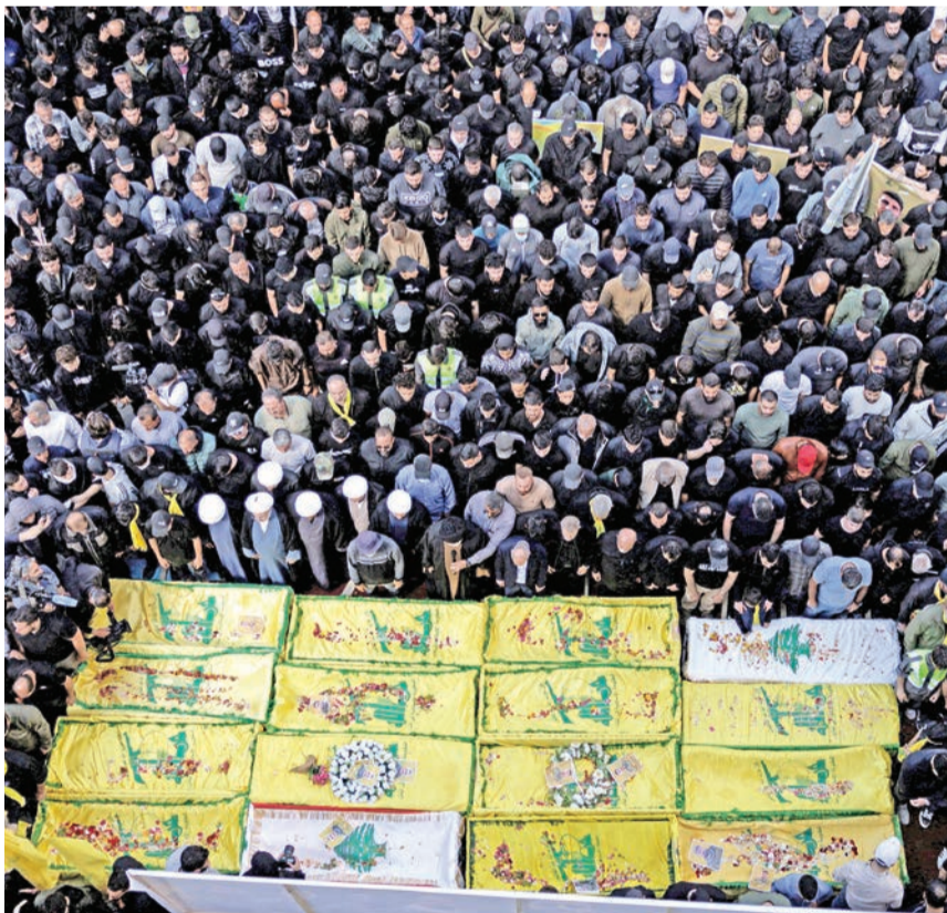
تشيع قتلى من «حزب الله» ومدنيين في القليلة جنوب لبنان أمس