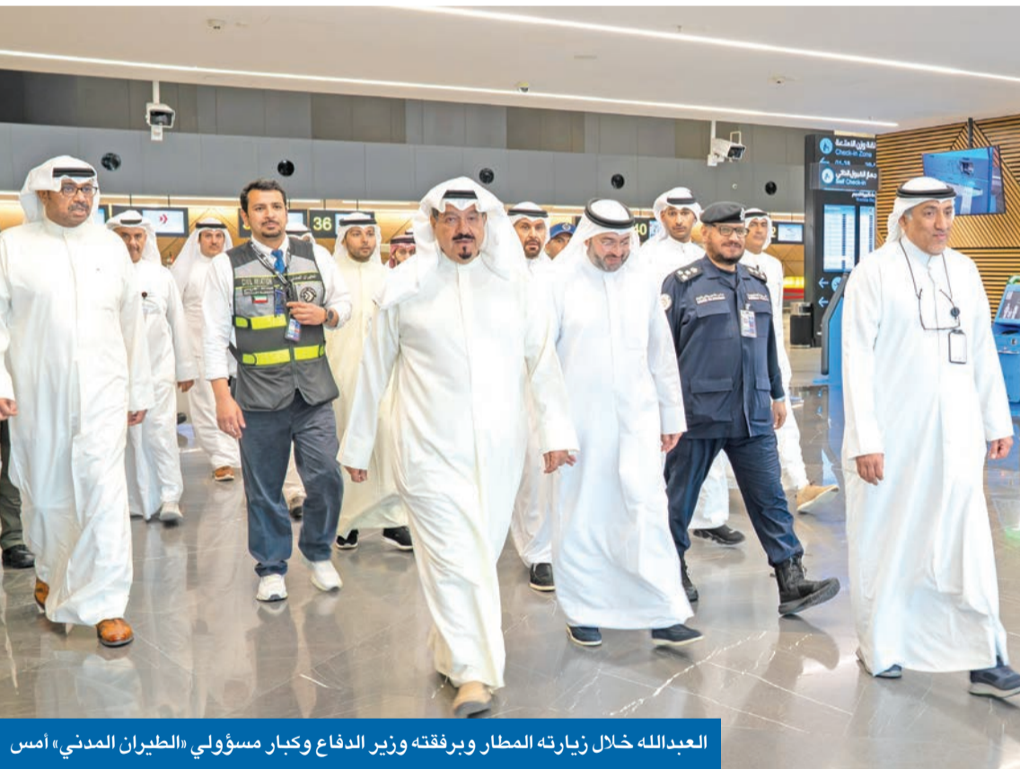
العدالله خلال زيارته المطار وبرفقته وزير الدفاع وكبير مسؤولي الطيران المدني أمس

• اطمأن إلى جاهزية المرافق ومنظومات الأمن والسلامة والتدابير الاحترازية المعتمدة