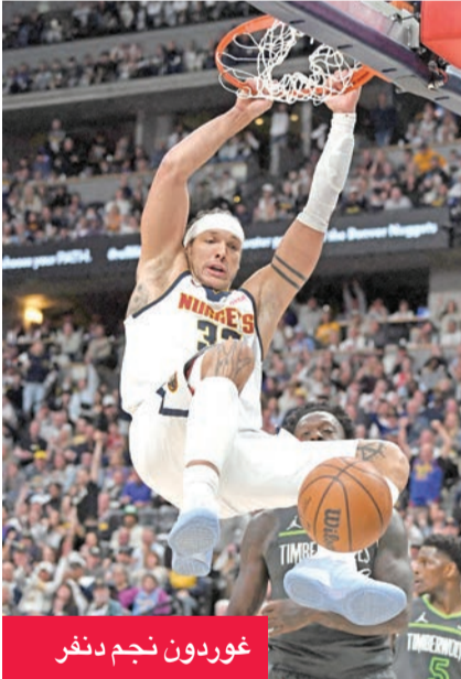
غوردون نجم دنفر

استهل فريق دنفر ناغتش ولوس أنجلوس ليكرز ونيويورك نيكس وكليفلاند كافاليرز مشوارها على أرضها السبت في الجولة الأولى من الأدوار الإقصائية (بلاي أوف) لدوري كرة السلة الأميركي للمحترفين، بشكل مثالي في مواجهات تحسم على أساس الأفضل من 7 مباريات. تغلب ناغتش على ضيفه مينيسوتا تمبروولفز 116-105 في مباراة متقاربة إلى حد كبير، تاخر فيها صاحب الأرض بفارق 12 نقطة في الربع الأول قبل أن يستعيد توازنه في الربع الثاني ويوسع الفارق بعد الاستراحة. وفي السلسلة الأخرى ضمن المنطقة الغربية، تفوق لوس أنجلوس ليكرز على هيوستن روكتس 107-98. وفاز نيويورك نيكس بسهولة على أتلانتا هوكس 113-102. وفي أولى مباريات (أمس)، فرض كافاليرز سيطرته بفوز واضح على تورونتو رابترز 126-113.