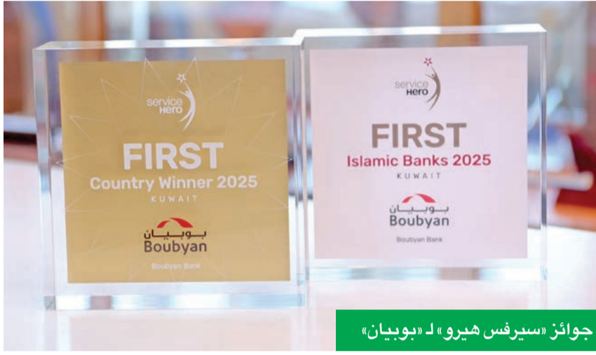
جوائز «سيرفس هيرو» لـ «بوبيان»

وأوضح المجحم أن الحفاظ على مستوى عالٍ من جودة الخدمة يتطلب متابعة مستمرة وتقييماً دائماً، مؤكداً أن البنك يعمل بشكل دائم على تطوير خدماته، بما يتماشى مع تطلعات العملاء، ويعزز من مستوى رضاهم وثقتهم. واختتم المجحم تصريحه معرباً عن تقديره للعملاء