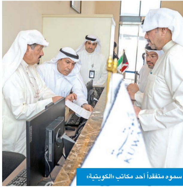
سموه متفقداً أحد مكاتب «الكويتية»

أكد رئيس مجلس الوزراء، سمو الشيخ أحمد العبدالله، ضرورة التنسيق الكامل بين الجهات المعنية، لضمان جاهزية مطار الكويت الدولي للتشغيل وفق الخطط المعتمدة، وبما يساهم في دعم حركة النقل الجوي في البلاد، مثنياً الجهود الكبيرة التي تبذلها الكوادر الوطنية والفنية في تجهيز المطار، وضمان عودة حركة الملاحة الجوية بصورة طبيعية بعد فترة التوقف التي فرضتها الظروف الاستثنائية.