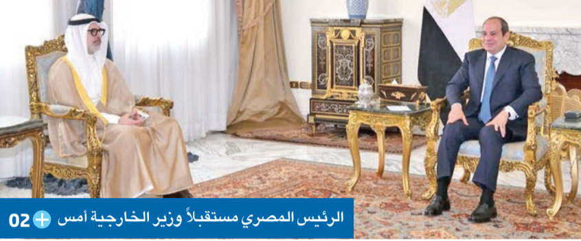
الرئيس المصري مستقبلاً وزير الخارجية أمس 02+

«رفض قاطع لأي اعتداء على سيادتها... وتجمعنا بها روابط تاريخية وأواصر راسخة»