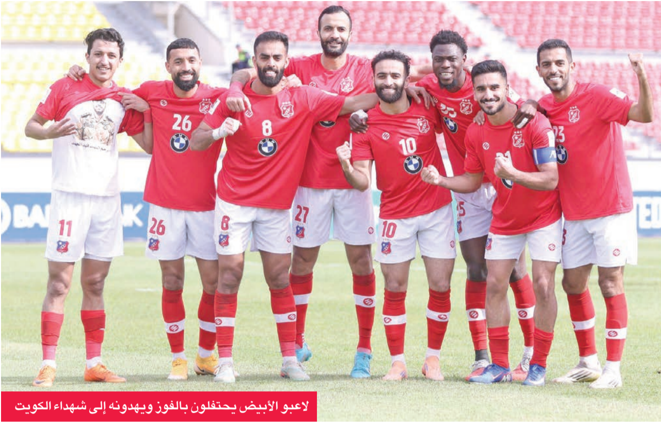
لاعبو الأبيض يحتفلون بالفوز ويهدونه إلى شهداء الكويت