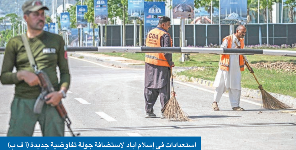
استعدادات في إسلام آباد لاستضافة جولة تفاوضية جديدة

الرئيس الأميركي يتحدث مجدداً عن فرصة أخيرة إيران تتردد في المشاركة قبل فك الحصار