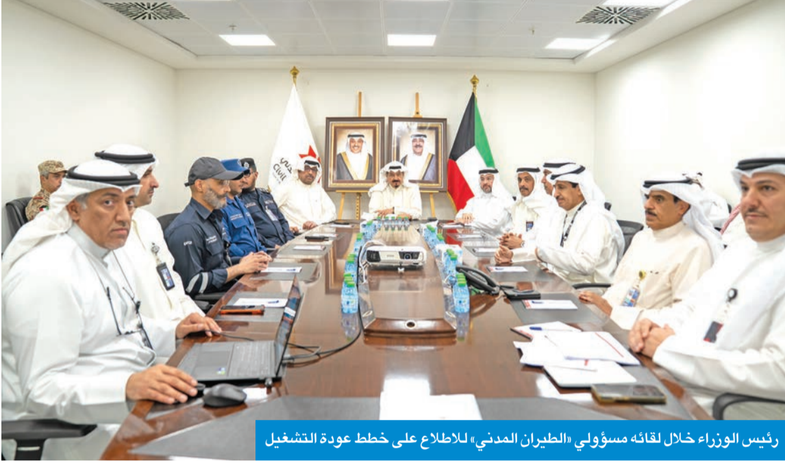
رئيس الوزراء خلال لقائه مسؤولي «الطيران المدني» للاطلاع على خطط عودة التشغيل