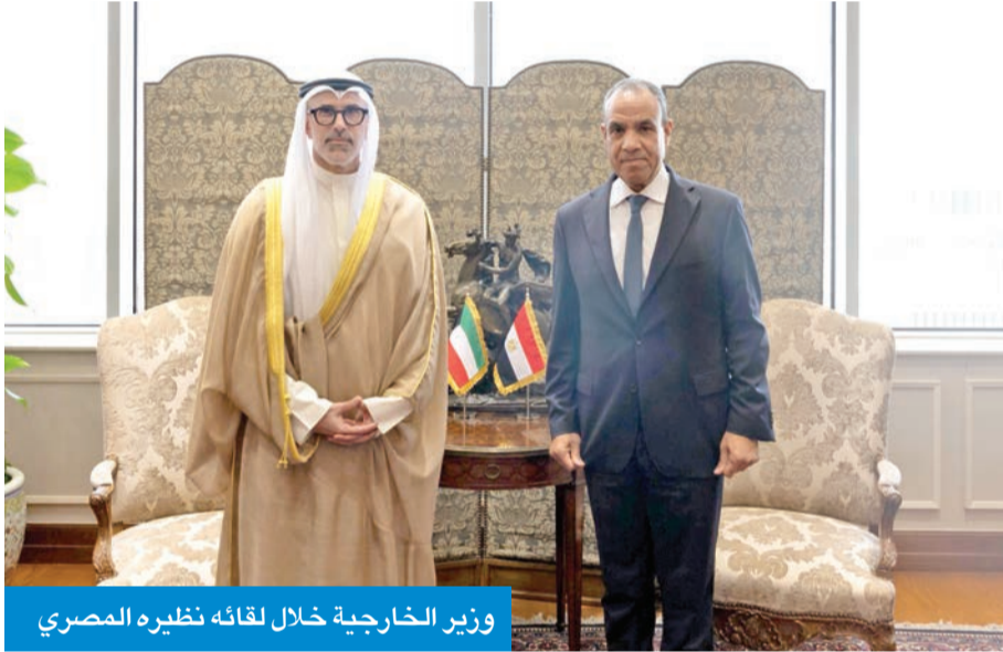
وزير الخارجية خلال لقائه نظيره المصري

● الجابر: تكثيف التنسيق مع مصر بما يسهم في الحفاظ على السلم الإقليمي وصون الأمن العربي ● مشاورات سياسية كويتية - مصرية للتنسيق المشترك إزاء التطورات الإقليمية والدولية ● عبدالعاطي: أمن الكويت جزء لا يتجزأ من أمن مصر وتعزيز التنسيق لمواجهة التحديات الراهنة ● نقدر الدعم الكويتي لأبناء الجالية المصرية خلال الظروف الدقيقة الراهنة