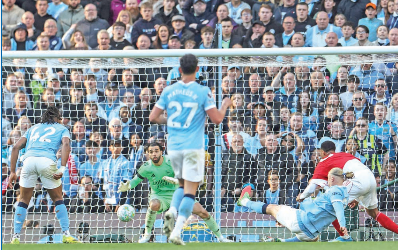
هالاند نجم سيتي يسجل الهدف الثاني في مرمى أرسنال

أمال حامل اللقب في بلوغ مسابقة دوري أبطال أوروبا. وسجّل فان دايك هدف الانتصار (10+90)، بعدما كان المصري محمد صلاح قد افتتح التسجيل للبرفول (29)، قبل تسجيل المهاجم بيتو من غينيا-بيساو هدف التعادل لأصحاب الأرض (54). ورفع ليفربول رصيده إلى 55 نقطة في المركز الخامس، وهو آخر المراكز المؤهلة لدوري الأبطال، موسعاً بذلك الفارق إلى 7 نقاط مع تشلسي السادس الذي خسر أمام ضيفه مانشستر يونايتد 1-0 السبت، قبل 5 مباريات من نهاية الموسم. في المقابل، تجفّد رصيد إيفرتون عند 47 نقطة في المركز العاشر.