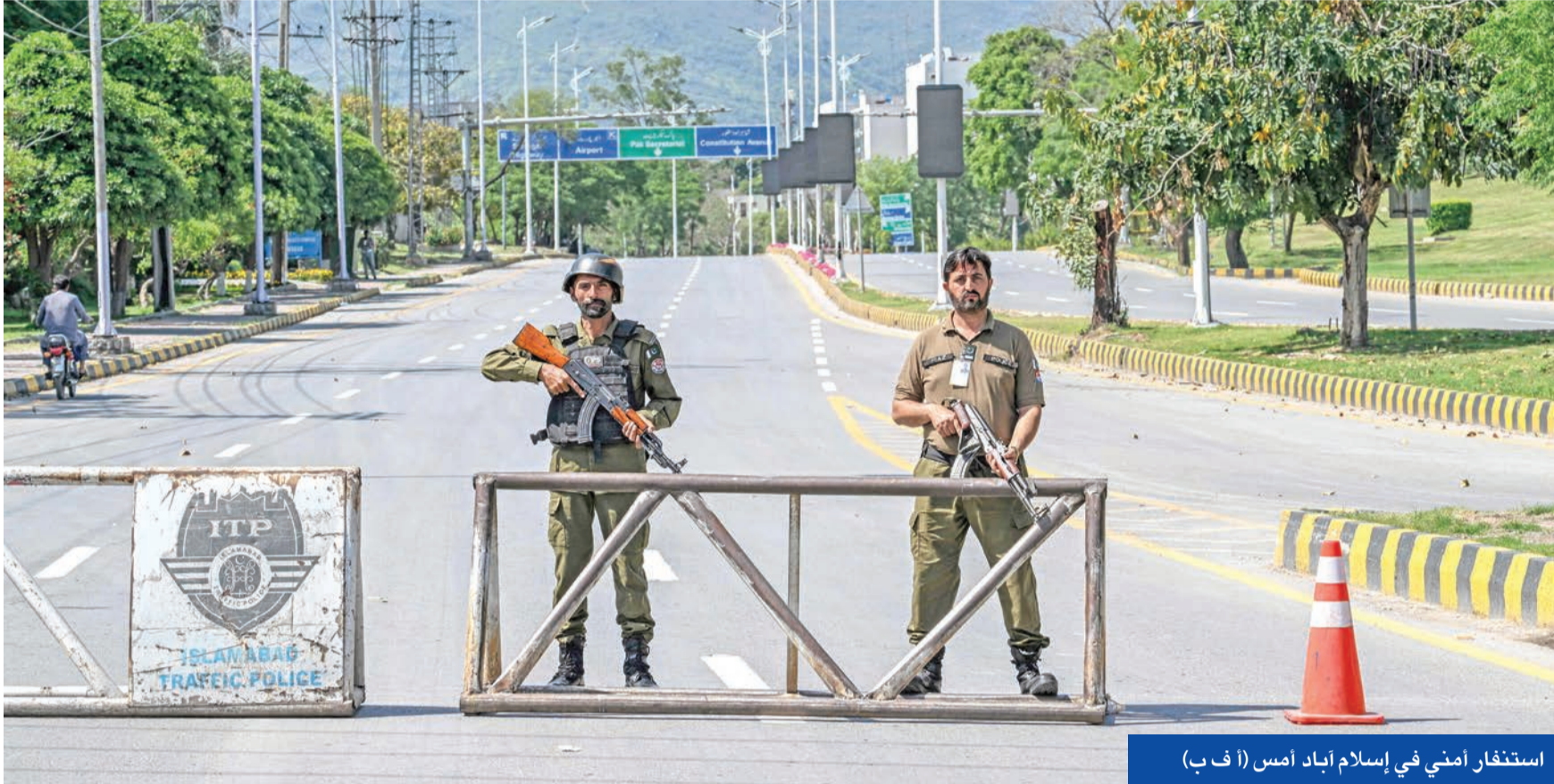
استفزاز أمني في إسلام آباد أمس

● ترامب يتحدث مجدداً عن «فرصة أخيرة» وضرب الكهرباء والجسور ● طهران تشير إلى لمسات نهائية للتوقيع على اتفاق إطاري