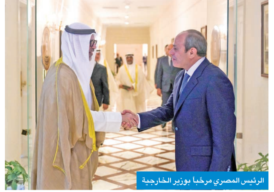
الرئيس المصري مرحباً بوزير الخارجية