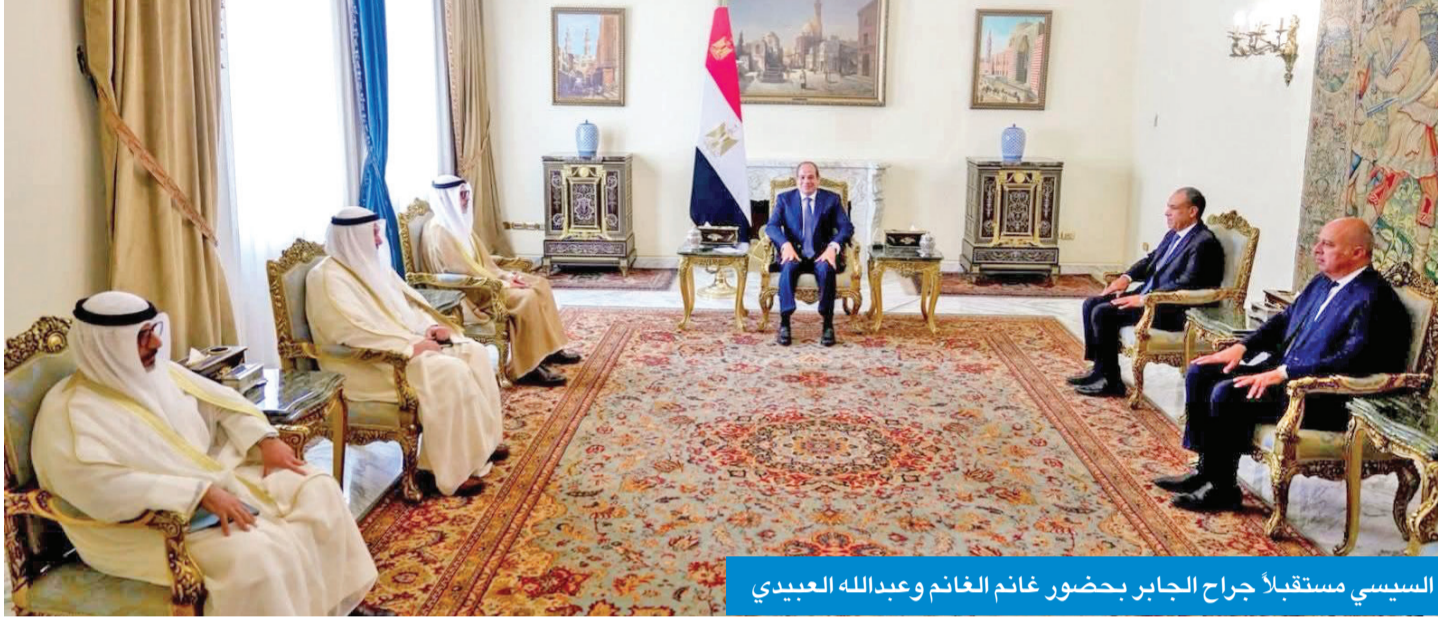
السياسي مستقبلاً جراح الجابر بحضور غانم الغانم وعبدالله العبيدي

● الجابر: القيادة السياسية تتمنى للشعب المصري المزيد من التقدم والازدهار