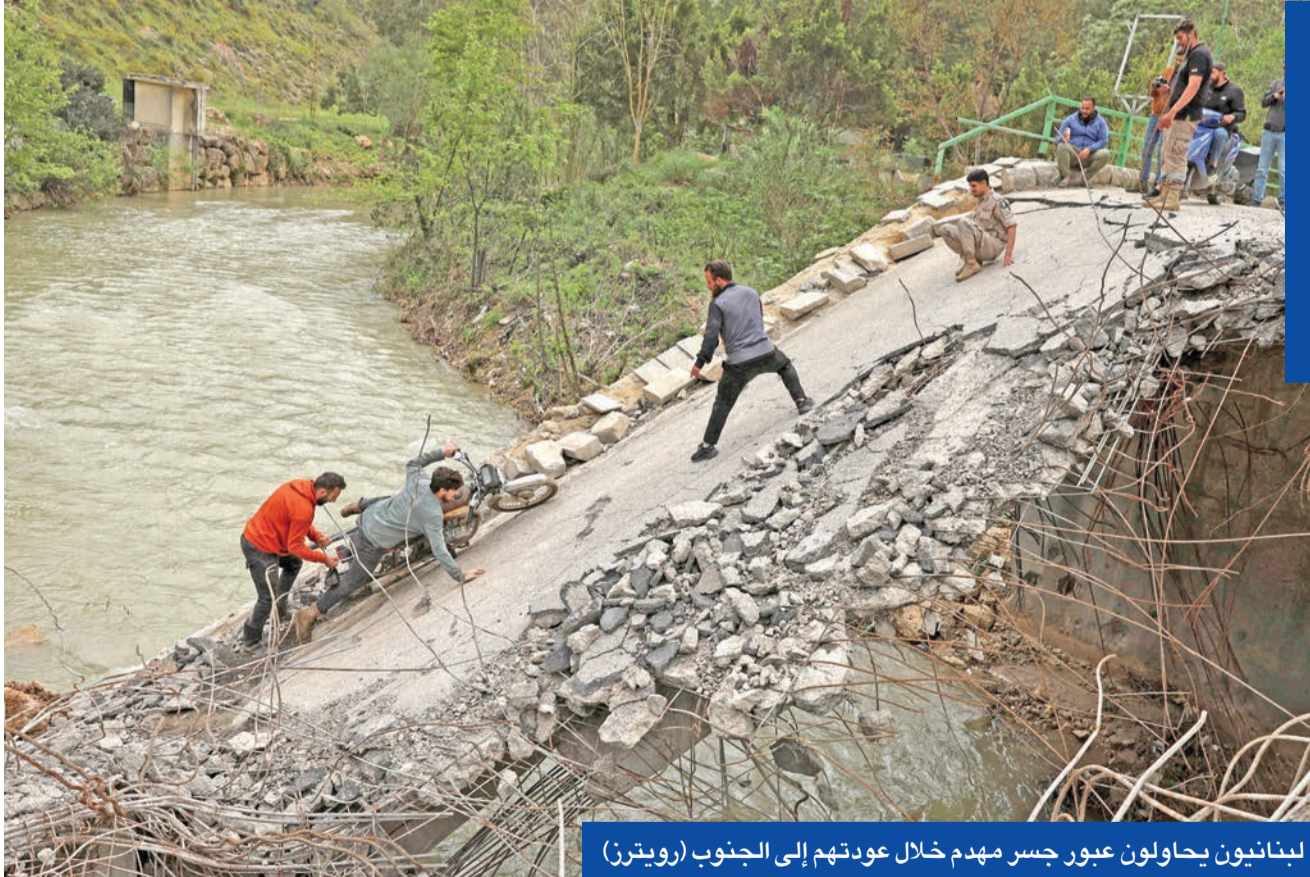
لبنانيون يحاولون عبور جسر مهدم خلال عودتهم إلى الجنوب

لبنان إلى مظلة دعم إقليمية وعربية لمواكبة أي اتفاق محتمل، سواء لناحية ضمان التنفيذ أو فيما يتعلق بملفات إعادة الإعمار وتوفير المساعدات الاقتصادية، فضلاً عن الدفع نحو تسوية سياسية داخلية متماسكة تحول دون أي انفجار جديد. وفي هذا الإطار، يبرز الدور السعودي بوصفه عنصراً وازناً في تثبيت الاستقرار، عبر الدفع باتجاه تكريس القواعد الكفيلة بحماية اتفاق الطائف واستكمال تطبيقه كمرجعية أساسية لتنظيم الحياة السياسية في البلاد.