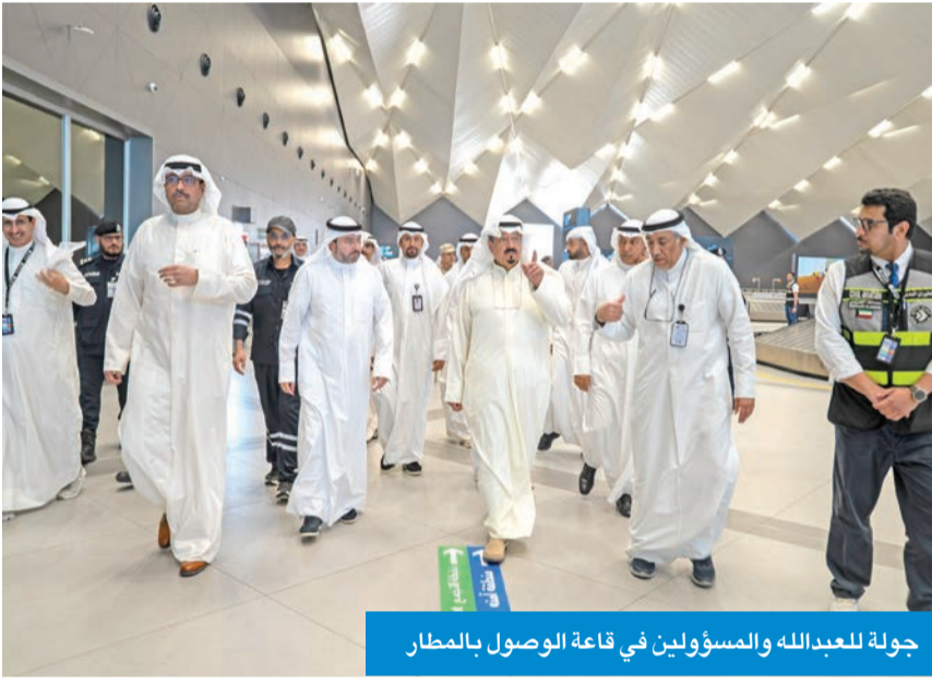
جولة للعبدالله والمسؤولين في قاعة الوصول بالمطار