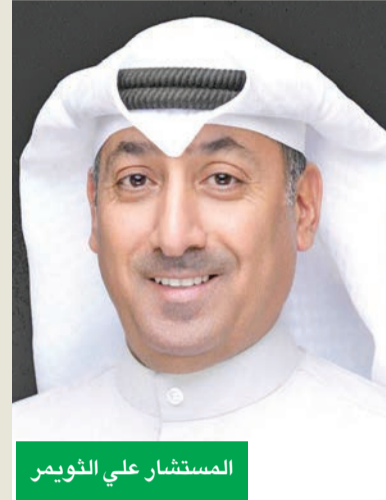
المستشار علي الغويم