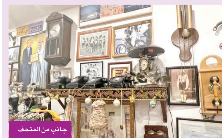
جانب من المتحف

أوضح الفزيع أن المتحف يفتح أبوابه على مدار أيام الأسبوع، مستقطباً فئات متعددة من المهتمين والباحثين في التراث وأيضاً طلاب المدارس والجامعات ومنظمات المجتمع المدني. وأضاف أن المتحف يحتضن ديوانية أسبوعية تُقام مساء كل يوم ثلاثاء، يتردد عليها خالاهما نقاشات وموضوعات ذات صلة بالتراث الكويتي. وأشار إلى أن زوّار المتحف يتنوعون بين طلبة ومهتمين، إلى جانب وفود من خارج الكويت كانت تحرص على زيارته قبل الظروف الراهنة، مما يعكس مكانته كوجهة ثقافية تعنى بتوثيق التراث والتعريف به.