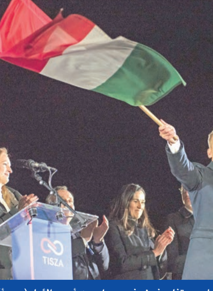
ماغيار يحتفل بفوزه في بودابست أمس الأول

في انتكاسة ثقيلة تردد صداها في بروكسل وواشنطن وموسكو، أقر رئيس الوزراء المجري القومي اليميني فيكتور أوريان ليل الأحد - الاثنتين بهزيمته الساحقة في الانتخابات التشريعية، وهنا خصمه المحافظ المؤيد للاتحاد الأوروبي بيتر ماغيار على فوزه الكاسح. واحتفى قادة الاتحاد الأوروبي برحيل أوريان، الذي مضى عليه 16 عاماً متواصلة في الحكم، تحول خلالها، لاسيما في السنوات الأخيرة، إلى كابوس لمؤسسات الاتحاد الأوروبي؛ بسبب علاقته الوثيقة بالرئيس الروسي فلاديمير بوتين، ولجونه المستمر إلى استخدام الفيتو داخل المجلس الأوروبي منعا لاتخاذ قرارات تتعارض مع مصالح موسكو. وقالت رئيسة المفوضية الأوروبية أوسولا فون دير لاين: «قلب أوروبا ينبض بقوة أكبر في المجر هذه الليلة، لأن المجر اختارتها وعادت إلى مسارها الأوروبي».