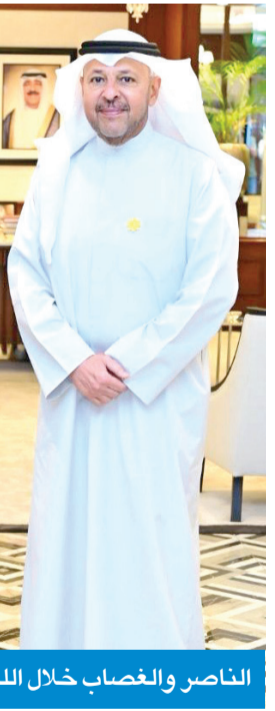
المالكي يهدي إلى جيلتوف زهرة العرفج

وأشاد المالكي، خلال الزيارتين، بمتانة العلاقات التي تجمع البحرين بكل من روسيا وباكستان، مؤكداً حرص بلاده على تعزيز التعاون المشترك في مختلف المجالات، كما استعرض مع السفيرين سبل تطوير العلاقات الثنائية وتبادل وجهات النظر حول عدد من القضايا ذات الاهتمام المشترك. وتخللت الزيارتين أجواء ودية عكست روح التقارب بين البعثات الدبلوماسية في الكويت، حيث التقطت صور تذكارية تجمعهم معهم وهم يرتدون شعار «زهرة العرفج»، في إشارة إلى تقديرهم للصفوف الأمامية الذين يحمون الكويت ومن يقدم على أرضها الطبية، وتجسيدا لما تمثله هذه الزهرة من قيم الصمود والتجذر في البيئة المحلية.