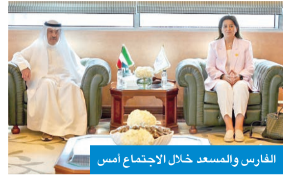
الفارس والمسدع خلال الاجتماع أمس

بحث رئيسة الهيئة العامة لمكافحة الفساد (نزاهة)، د. رنا الفارس، مع مدير معهد الكويت للدراسات القضائية والقانونية المحامي العام الأول، المستشار بدر المسدع، تعزيز سبل التعاون المشترك ودعم الجهود الوطنية الرامية لترسيخ مبادئ الشفافية والنزاهة، وتطوير المنظومة القانونية والمؤسسية ذات الصلة. وذكرت «نزاهة»، في بيان صحفي، أمس، أن ذلك جاء لدى زيارة الفارس للمعهد، بحضور أعضاء مجلس إدارة «نزاهة»، ونواب مدير معهد الكويت للدراسات القضائية.