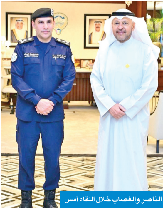
الناصر والغصاب خلال اللقاء أمس

وشكر المحافظ هذه المبادرات، مشيداً بجهود المدارس والكوادر التعليمية، ومثمناً ما تحمله من رسائل تقدير وعطاء تعكس حرصهم على المشاركة في مثل هذه الحملات الوطنية.