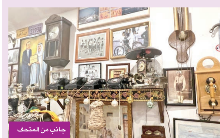
جانب من المتحف