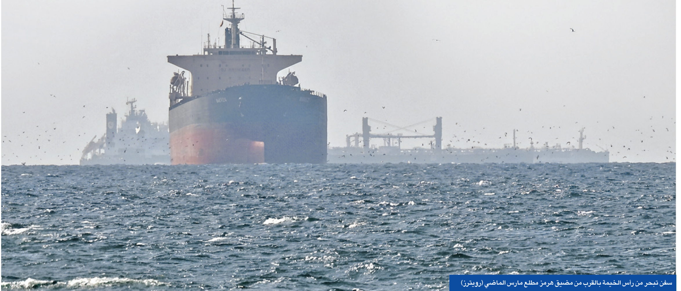
سفن تبحر من رأس الخيمة بالقرب من مضيق هرمز مطلع مارس الماضي