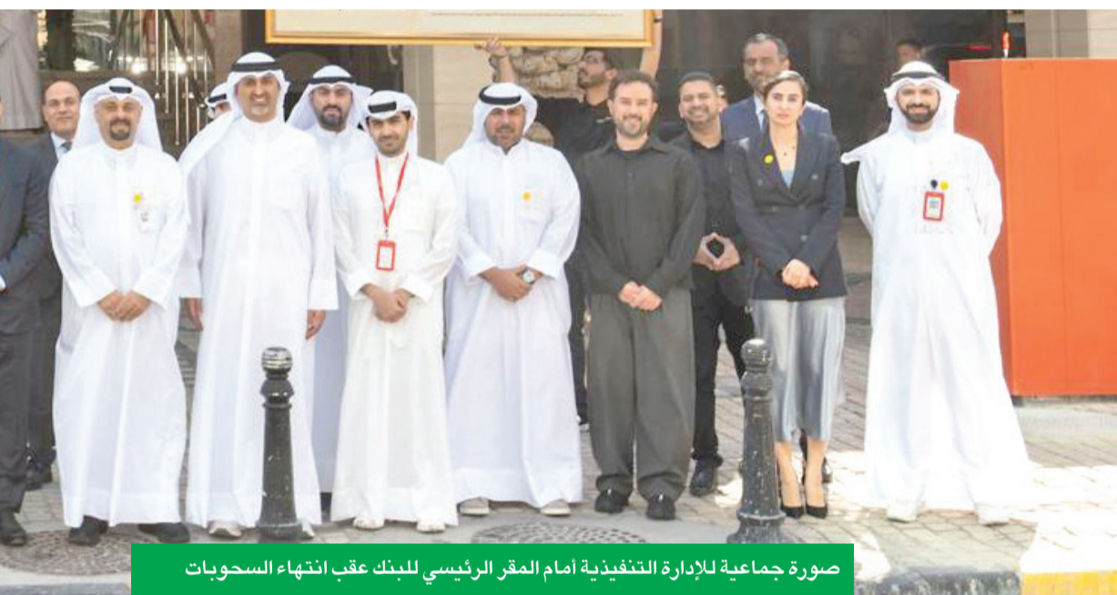
صورة جماعية للإدارة التنفيذية أمام المقر الرئيسي للبنك عقب انتهاء السحبوات