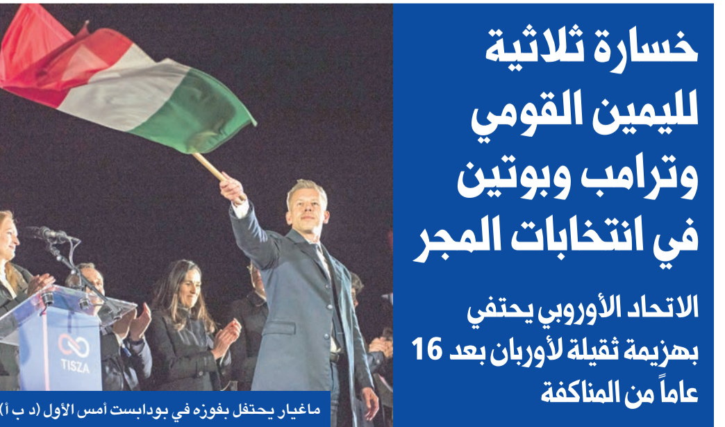
ماغيار يحتفل بفوزه في بودابست أمس الأول (د ب أ)

في انتكاسة ثقيلة تردد صداها في بروكسل وواشنطن وموسكو، أقر رئيس الوزراء المجري القومي اليميني فيكتور أوربان ليل الأحد -الاثنتين بهزيمته الساحقة في الانتخابات التشريعية، وهنا خصمه المحافظ المؤيد للاتحاد الأوروبي بيتر ماغيار على فوزه الكاسح. واحتفى قادة الاتحاد الأوروبي برحيل أوربان، الذي مضى عليه 16 عاماً متواصلة في الحكم، تحول خلالها، لاسيما في السنوات الأخيرة، إلى كابوس لمؤسسات الاتحاد الأوروبي؛ بسبب علاقته الوثيقة بالرئيس الروسي فلاديمير بوتين، ولجونه المستمر إلى استخدام الفيتو داخل المجلس الأوروبي منعا لاتخاذ قرارات تتعارض مع مصالح موسكو. وقالت رئيسة المفوضية الأوروبية أوسولا فون دير لاين: «قلب أوروبا ينبض بقوة أكبر في المجر هذه الليلة، لأن المجر اختارتها وعادت إلى مسارها الأوروبي».