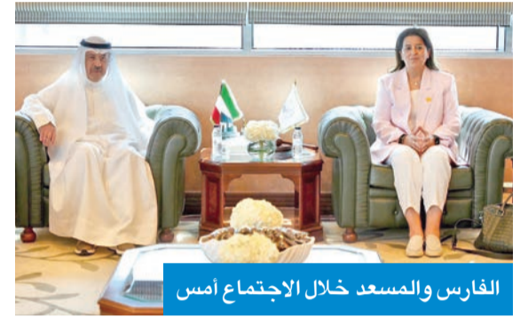
الفارس والمسدع خلال الاجتماع أمس

بحث رئيسة الهيئة العامة لمكافحة الفساد (نزاهة)، د. رنا الفارس، مع مدير معهد الكويت للدراسات القضائية والقانونية المحامي العام الأول، المستشار بدر المسدع، تعزيز سبل التعاون المشترك ودعم الجهود الوطنية الرامية لترسيخ مبادئ الشفافية والنزاهة، وتطوير المنظومة القانونية والمؤسسية ذات الصلة. وذكرت «نزاهة»، في بيان صحفي، أمس، أن ذلك جاء لدى زيارة الفارس للمعهد، بحضور أعضاء مجلس إدارة «نزاهة»، ونواب مدير معهد الكويت للدراسات القضائية.