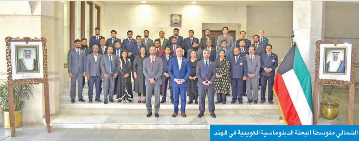
الشمالي متوسلا البعثة الدبلوماسية الكويتية في الهند

شارك سفير الكويت لدى الهند مشعل الشمالي، وأعضاء البعثة، في ارتداء شارة نبات «زهرة العرفج» الزهرة الوطنية لدولة الكويت.