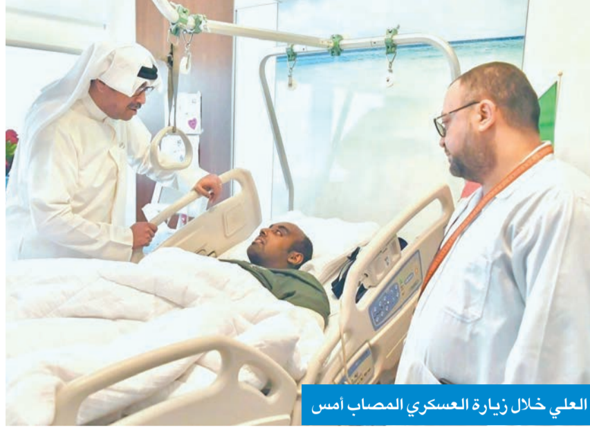
العلي خلال زيارة العسكري المصاب أمس

تلقى وزير الخارجية، الشيخ جراح الجابر، اتصالاً هاتفياً، من وزير الشؤون الخارجية بجمهورية الهند د. سوبراهمانيام جايشانكار، حيث تم خلال الاتصال مناقشة تطورات الأحداث الراهنة في المنطقة والجهود المبذولة بشأنها.