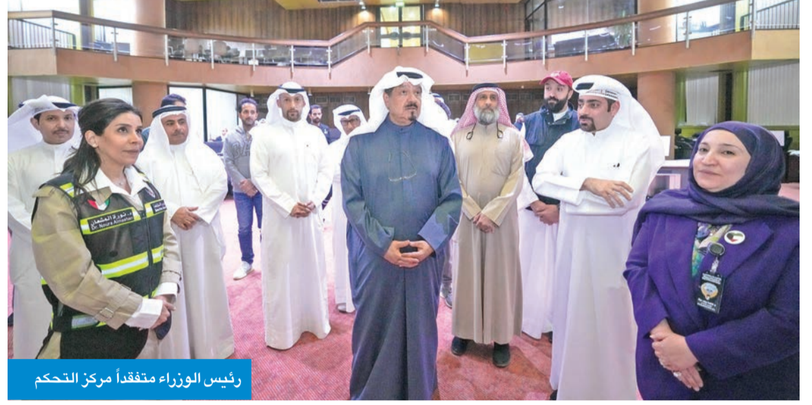
رئيس الوزراء متفقداً مركز التحكم

الكويتية لخطوات تعزيز الإنتاج والعمل في المخازن، تنفيذاً لخطط الأمن الغذائي المعتمدة لتغطية احتياجات المواطنين والمقيمين في البلاد.