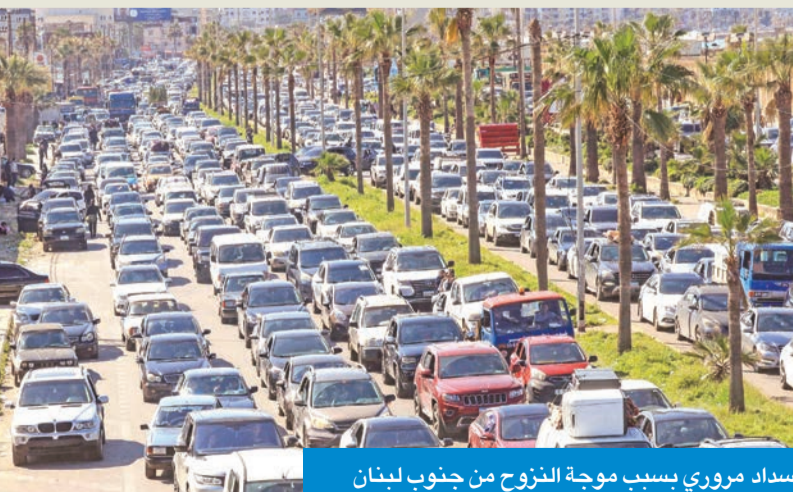
انسداد مروري بسبب موجة النزوح من جنوب لبنان

وقال رئيس الأركان الإسرائيلي، الجنرال إيل زامير، صباح أمس: «أطلقنا معركة هجومية في مواجهة حزب الله، داعياً إلى الاستعداد للقيام بعدة من القتال»، وأضاف أن الجيش كان قد استعد، ضمن التحضيرات لعملية زئير الأسد، لسيناريو متعدد الجبهات وللمعركة هجومية ضد حزب الله. من جهته، قال قائد المنطقة الشمالية في الجيش الإسرائيلي، رافي ميلو، في بيان: «اختار حزب الله النظام الإيراني على حساب دولة لبنان، وأطلق هجوماً على