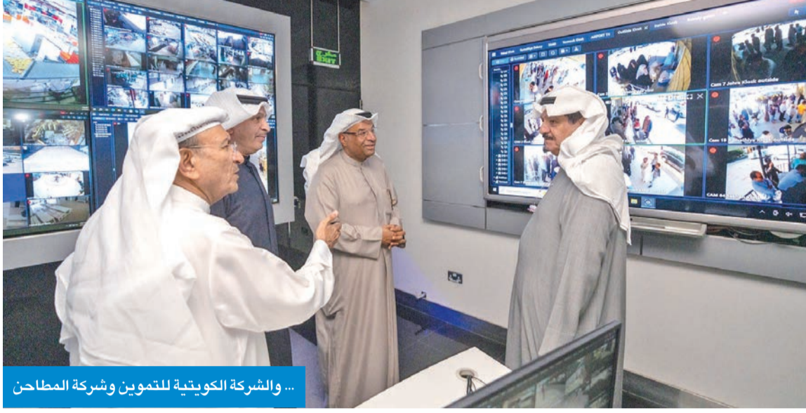
... والشركة الكويتية للتموين وشركة المطاحن