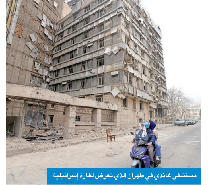
مستشفى غاندي في طهران الذي تعرض لغارة إسرائيلية

لكن ستارم حرص في الوقت نفسه على تأكيد أن بريطانيا لم تشارك في الضربات الأميركية والإسرائيلية الأوسع ضد إيران، وأن موقف لندن المعلن لا يزال يفرق