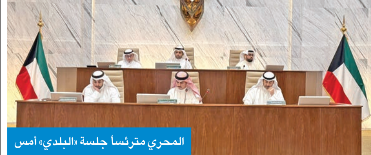
المحري مترئساً جلسة «البلدي» أمس

إحدى الشركات العقارية بشأن ضم وإضافة أرض أملاك الدولة إلى القسيمة رقم 4 الكائنة بمنطقة القبلة القطعة التجارية الأولى، علاوة على مناقشة طلب إعادة تنظيم عدد من القسام ومخفر الصالحي ومرافق عامة بمنطقة القبلة بالقطعة رقم 14 وفق قواعد وشروط القطع التنظيمية، وطلب وزارة الشؤون الإسلامية تخصيص مساحة من الحيازة الزراعية رقم 96 قطعة رقم 10 بمنطقة الوفرة الزراعية.