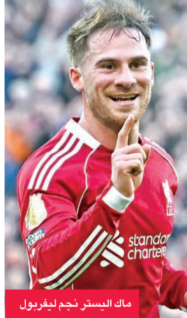
ماك اليستر نجم ليفربول

امتحان تشلسي، وفاز بالدوري اللندني الثاني توالياً، أمام ضيفه المنقوص عددياً 2-1 الأحد في ختام المرحلة 28.