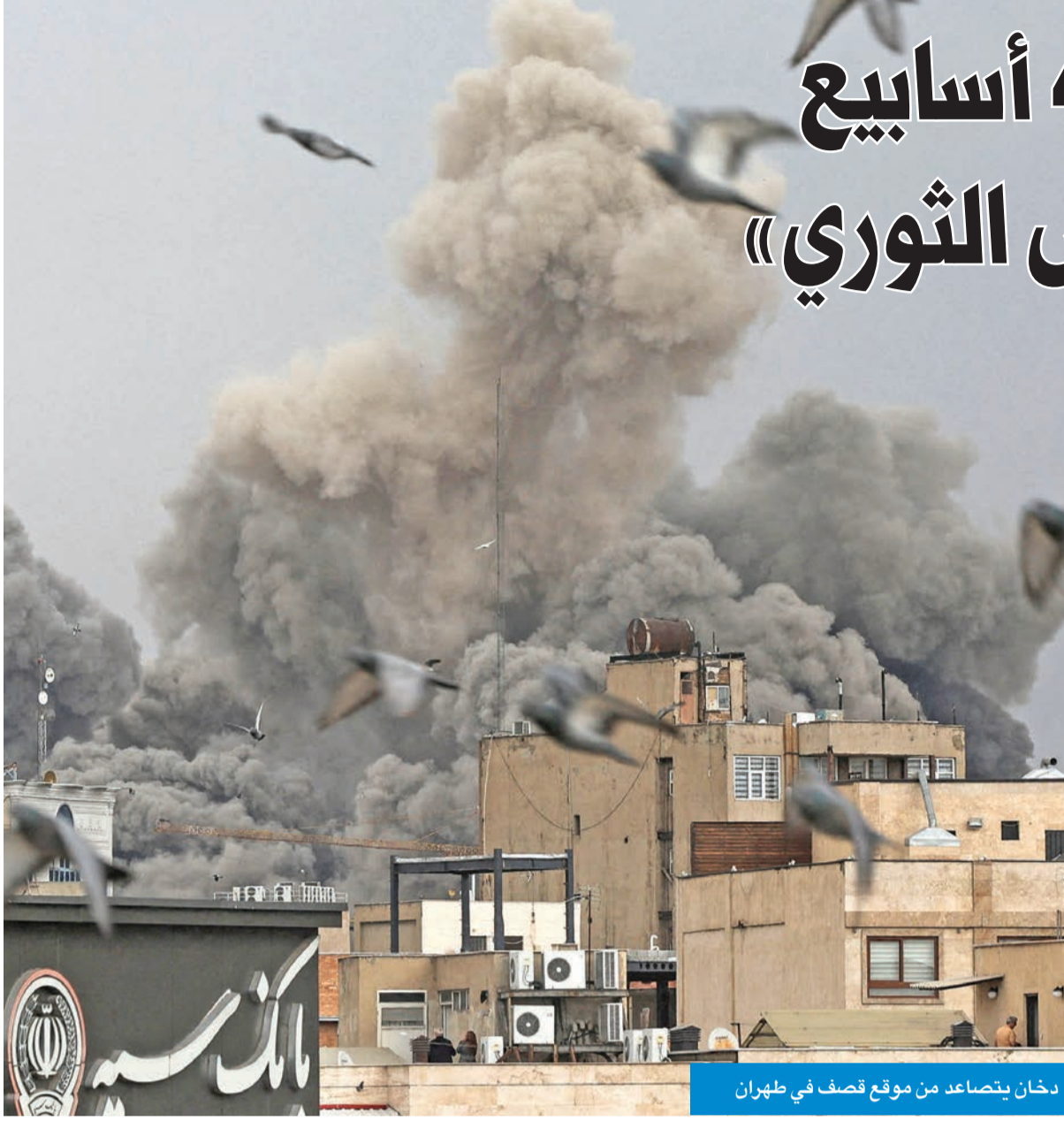
دخان يتصاعد من موقع قصف في طهران

لاريجاني وقاليباف يدعمان خلافة مجتبي خامنئي لوالده... وبزئشكيان يفضل نقل صلاحيات المرشد إلى «شوري قيادة»