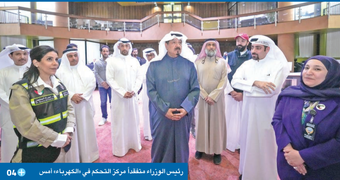
رئيس الوزراء متفقداً مركز التحكم في «الكهرباء» أمس

العدالله: الظروف تتطلب أعلى درجات الجاهزية