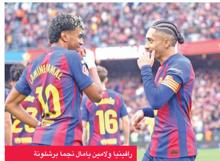
رافينيا ولامين يامال نجما برشلونة

أما أتلتيكو مدريد فسيفتقد جوني كاردوسو للإصابة في أوتار الفخذ، بينما لا يزال بابيلو باربوس غانبا بسبب مشكلة في الفخذ، ومن المتوقع عودته منتصف مارس الجاري.