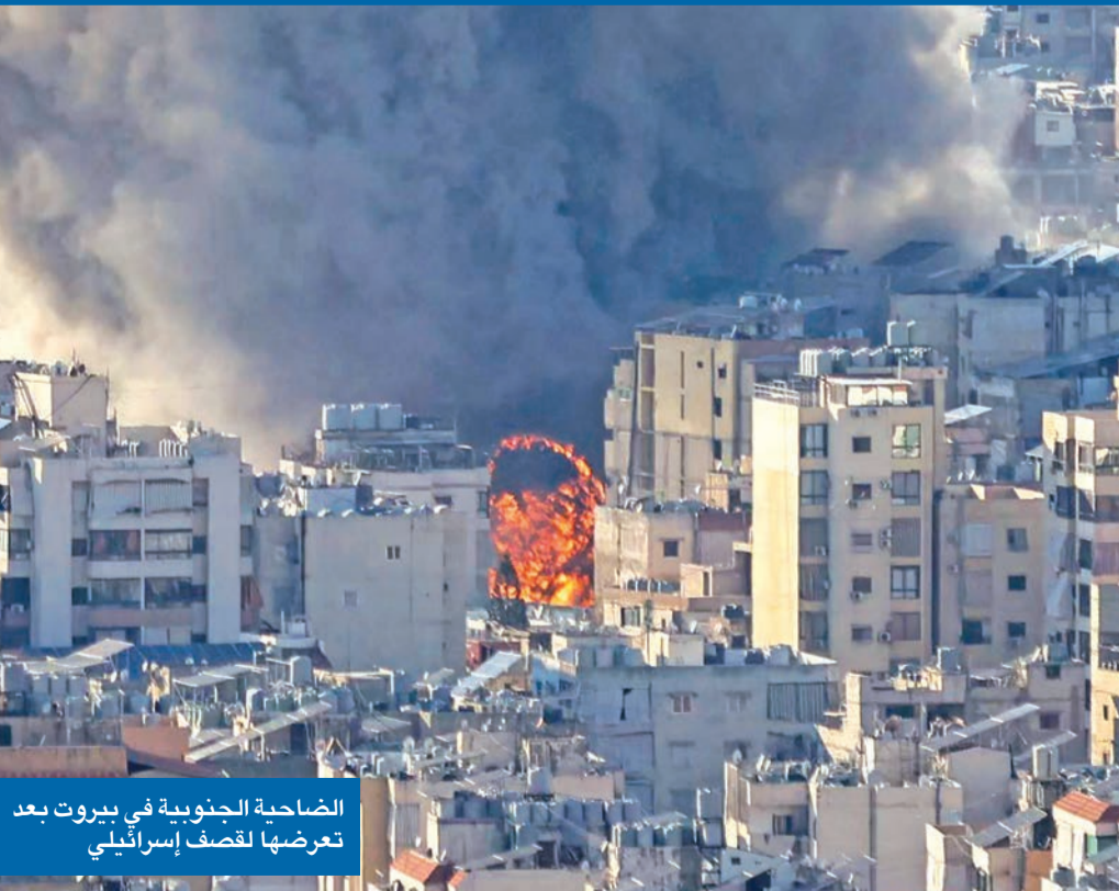
الضاحية الجنوبية في بيروت بعد تعرضها لقصف إسرائيلي