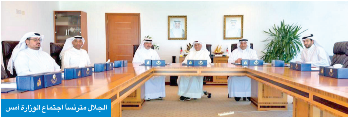
الجلال مترئساً اجتماع الوزارة أمس

الوزارة واستمرارية العمل المؤسسي وفقاً لتعميم ديوان الخدمة المدنية رقم 4 لسنة 2026، بشأن تحديد عدد العاملين بالجهات الحكومية في ظل الظروف التي تمرّ بها المنطقة.