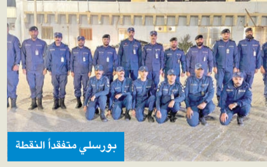
بورسلي متفقداً النقطة

تفقد نائب رئيس قوة الإطفاء العام للحماية المدنية بالتكليف، العميد عمر بورسلي، أمس الأول، نقطة تأمين ميناء الدوحة، للوقوف على كل الاستعدادات، والتأكد من جاهزية القوة المشاركة في تأمين المواقع الحيوية بالبلاد في ظل الظروف الراهنة.