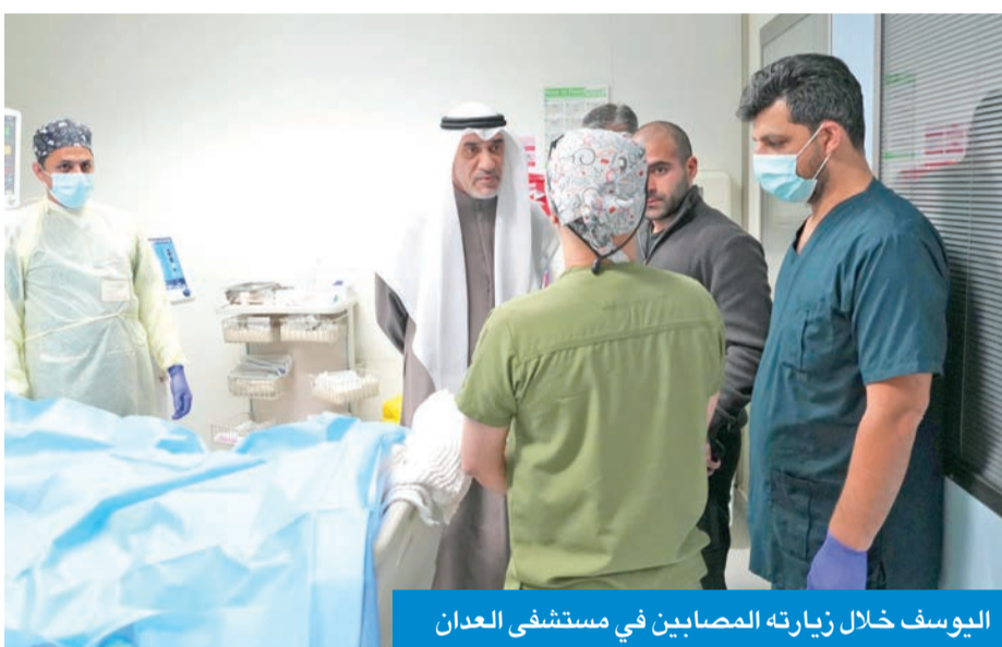
اليوسف خلال زيارته المصابين في مستشفى العedan

زار عدداً من المصابين بمستشفى العedan للاطمئنان على حالتهم الصحية «الدولة حريصة على حفظ الأمن والسلامة العامة في مختلف الظروف»