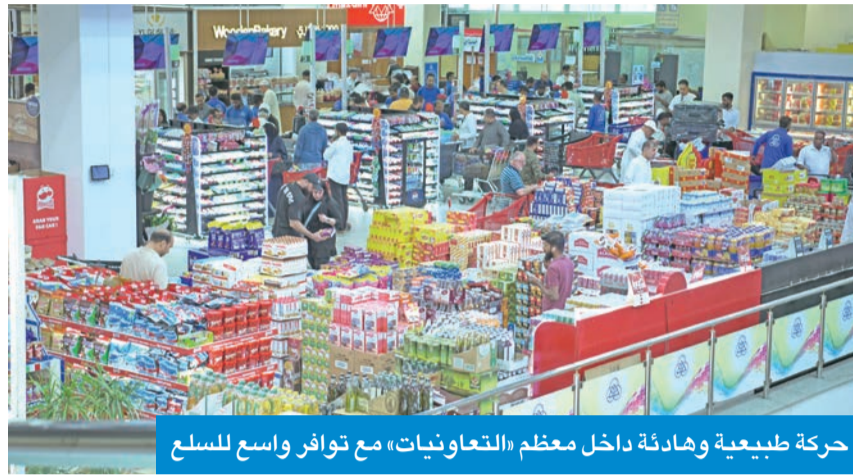
حركة طبيعية وهادئة داخل معظم «التعاونيات» مع توافر واسع للسلع

● التدخل السريع لتوفير السلع التي تحظى بإقبال كبير وسحب عالٍ لتجنب نقصها