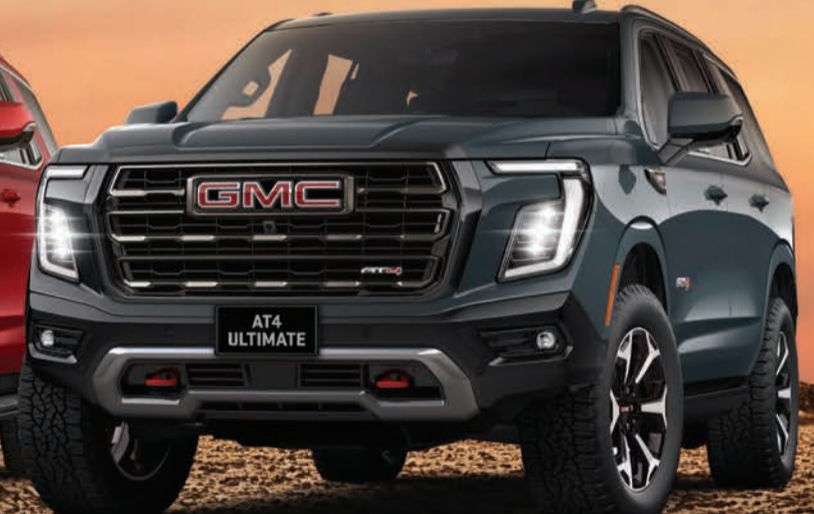
يوكون AT4 ULTIMATE

الآن كفالة المصنم لمدة 5 سنوات أو لغاية 100,000 كم (ايهما اسبق)