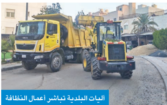
آليات البلدية تبشر أعمال النظافة

خطة طوارئ في ظل الأوضاع الراهنة بالتنسيق مع الجهات الحكومية