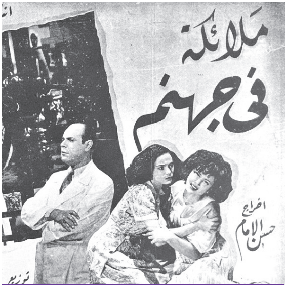
إعلان فيلم «ملائكة في جهنم»... أولى تجاربه الإخراجية