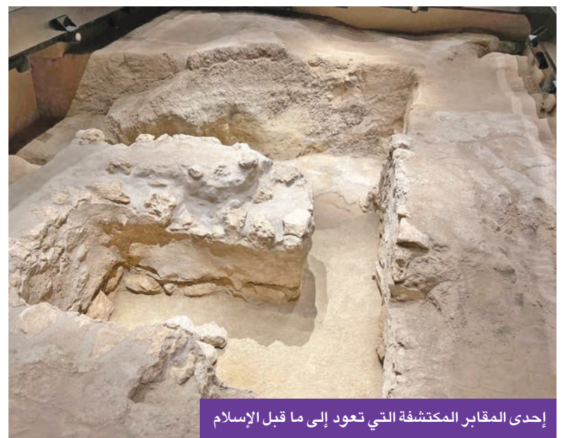
إحدى المقابر المكتشفة التي تعود إلى ما قبل الإسلام