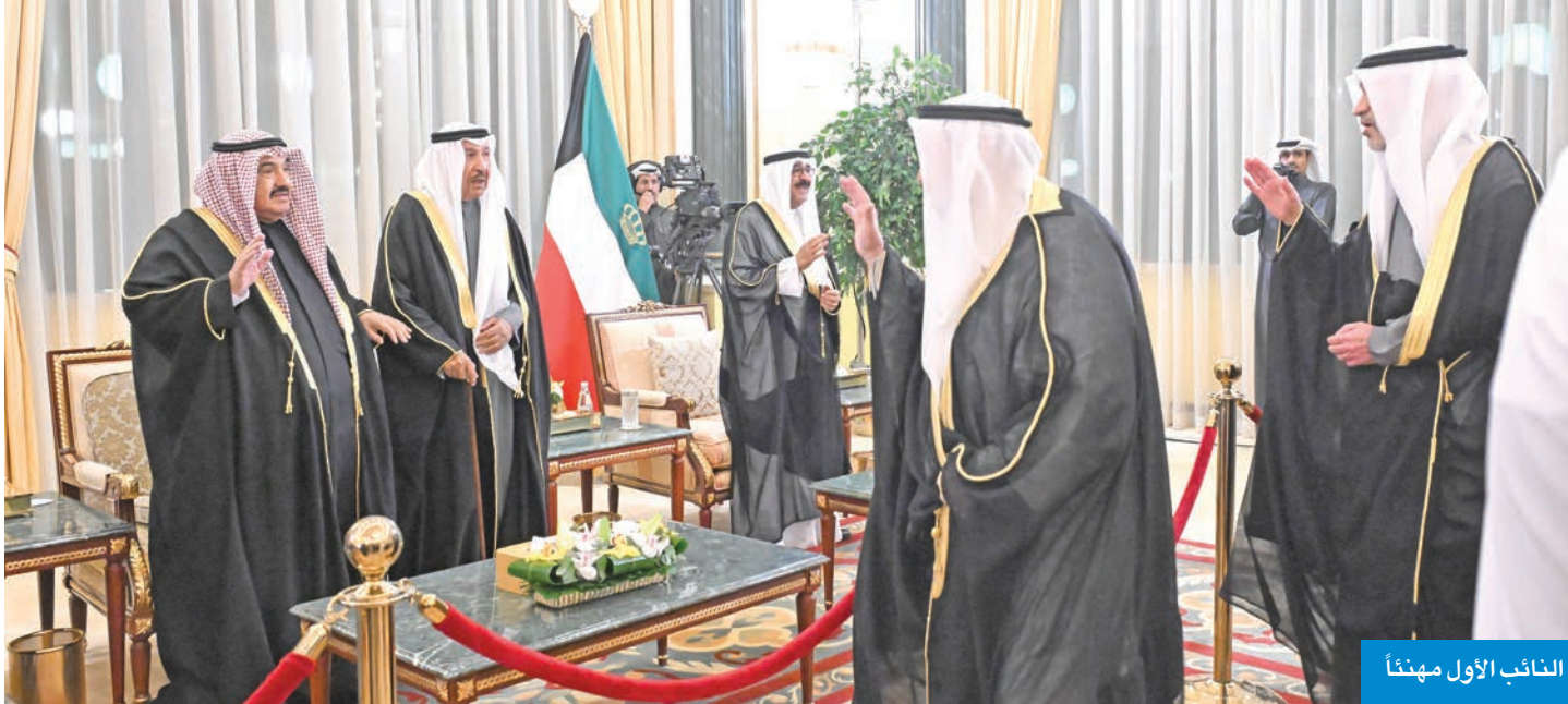
النائب الأول مهنتاً

بمناسبة حلول شهر رمضان المبارك، استقبل سمو أمير البلاد الشيخ مشعل الأحمد، وسمو ولي العهد الشيخ صباح الخالد، وأسرته آل الصباح، في ديوان أسرة آل الصباح بقصر بيان، مساء أمس الأول، جموع المهنيين من المواطنين والمقيمين بهذا الشهر الفضيل. وقد جسد ذلك روح الأسرة الواحدة في المجتمع الكويتي الذي خيل على المحبة والمودة وروح الإخاء، متمنين أن تعود هذه المناسبة الفضيلة على الجميع بالخير واليمن والبركات.