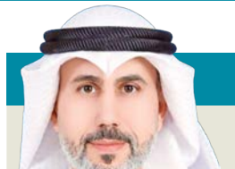
د. مبارك الجهادي

جريمة التهديد في القانون الكويتي هي الفعل الذي يقوم به الشخص ويترك أثر بخطر يعرّض لإحاقه بنفسه أو بماله أو بسمعته أو بأي شخص يهيم أمره، ويكون هذا التهديد من شأنه الإكراه في نفس المجني عليه وإجباره على القيام بفعل أو الامتناع عن فعل معيّن. وتشمل وسائل التهديد القول والكتابة والفعل؛ سواء كان مباشراً أو غير مباشر وقد يكون مصحوباً بشرط أو أمر أو دون ذلك، ويشمل أي فعل أو عبارة تجعل المجني عليه يشعر بالخطر على نفسه أو ممتلكاته أو سمعته، ويكفي أن يكون الفعل مؤثراً في نفسه لإثبات الجريمة، بغض النظر عن تحقق الضرر الفعلي. ويعتبر التهديد بالكتابة