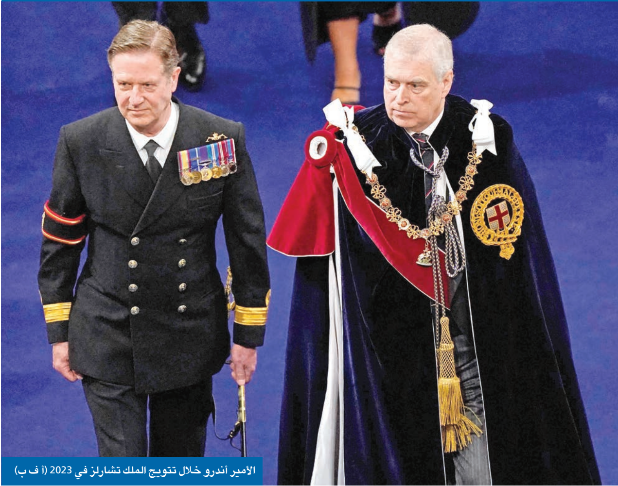
الأمير أندرو خلال تتويج الملك تشارلز في 2023

أعلنت الشرطة النيجيرية مقتل 37 شخصاً، وإصابة 26 آخرين، جراء تسرب غازات سامة في منجم بشمال وسط نيجيريا. وقال المتحدث باسم الشرطة، ألفريد الأبو، في بيان نقلته «أسوشيتد برس»، أمس، إن الحادث وقع صباح الثلاثاء الماضي في قرية كامباني زوراك، بمنطقة واسي في ولاية بلاتو النيجيرية. وأضاف المتحدث أن «التحقيقات الأولية كشفت أن عمال المناجم تضرروا نتيجة تسرب مفاجئ لأكسيد الرصاص وغازات أخرى مصاحبة له، مثل الكبريت وأول أكسيد الكربون، وهي غازات سامة للإنسان، خصوصاً في الأماكن المغلقة أو سيئة التهوية».