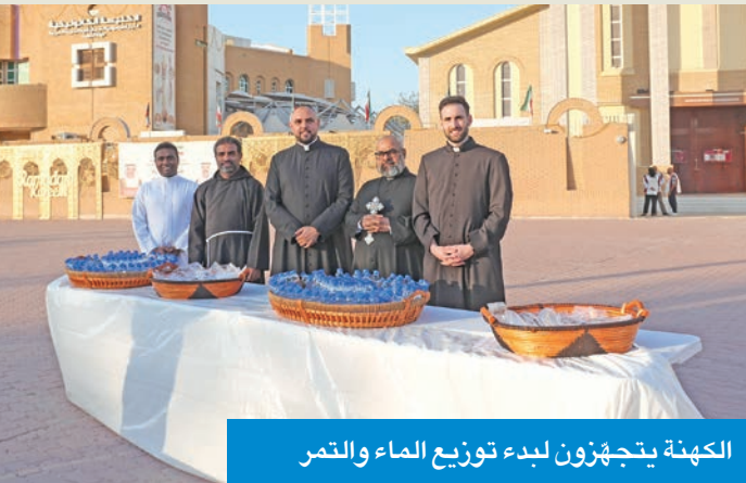
الكنية يتجهّزون لبدء توزيع الماء والخمر

الرحمة والغفران. وفي هذه السنة، يلتزم صيامنا نحن كمسيحيين في زمن الأربعيني المقدّس مع صيام إخوتنا المسلمين في شهر رمضان المبارك، وهذا التلاقي الروحي العميق ليس مصادفة، بل هو علامة رجاء للإنسانية ودعوة لنا جميعا، كمؤمنين بالله الواحد، أن نسير معا في درب التقوى والصلاة وأعمال الرحمة.