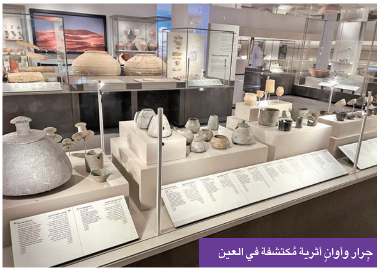
جرار وأوانٍ أثرية مُكتشفة في العين