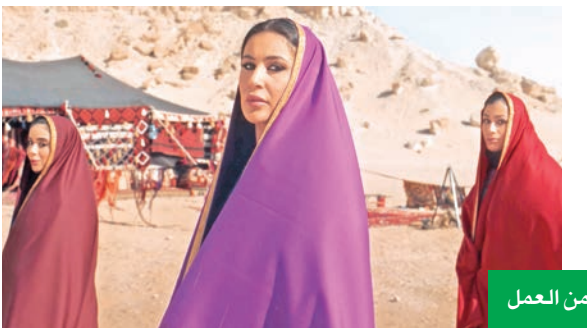
لقطات من العمل