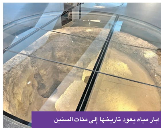
آبار مياه يعود تاريخها إلى مئات السنين

الإبقاء على المبنى الأصلي الذي أنشئ عام 1969، ليظل عنصراً أساسياً في السردية المعمارية الجديدة، جامعاً