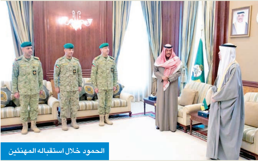
الحمود خلال استقباله المهنيين

أن الحمود أعرب عن شكره لئائيه والفريق البرجس وكبار القادة على تهنئتهم، داعياً المولى عز وجل أن يعيد الشهر الفضيل على الكويت وجميع دول العالم بالخير والبركات، وأن يحفظ الكويت من كل مكروه في ظل قيادتها الرشيدة.