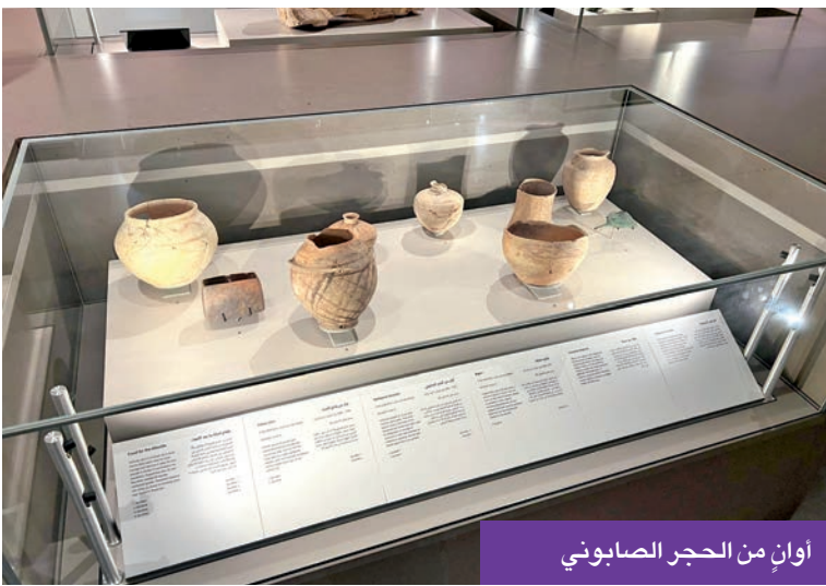
أوانٍ من الحجر الصابوني