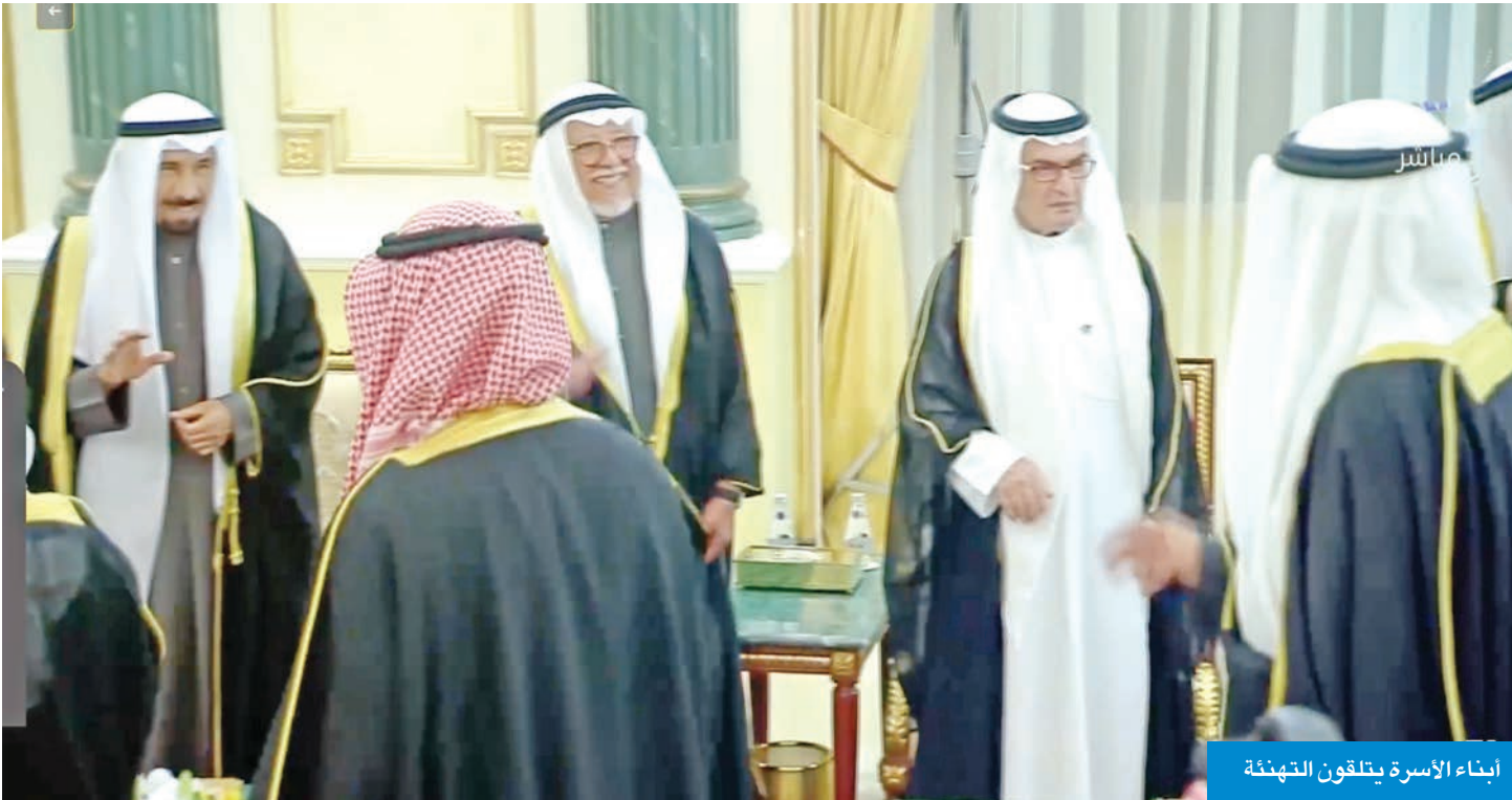
أبناء الأسرة يتلقون التهنة