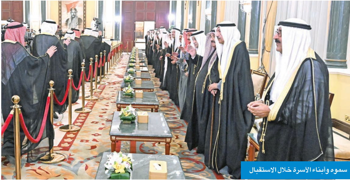
سموه وأبناء الأسرة خلال الاستقبال