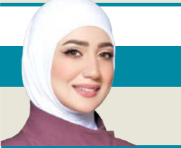
ليلع ال عباس @aila_al_abbas

أدام الله نعمه علينا، وحفظ الكويت وشيوخها وشعبها وكل وافد شريف فيها من كل مكروه. والله المستعان.