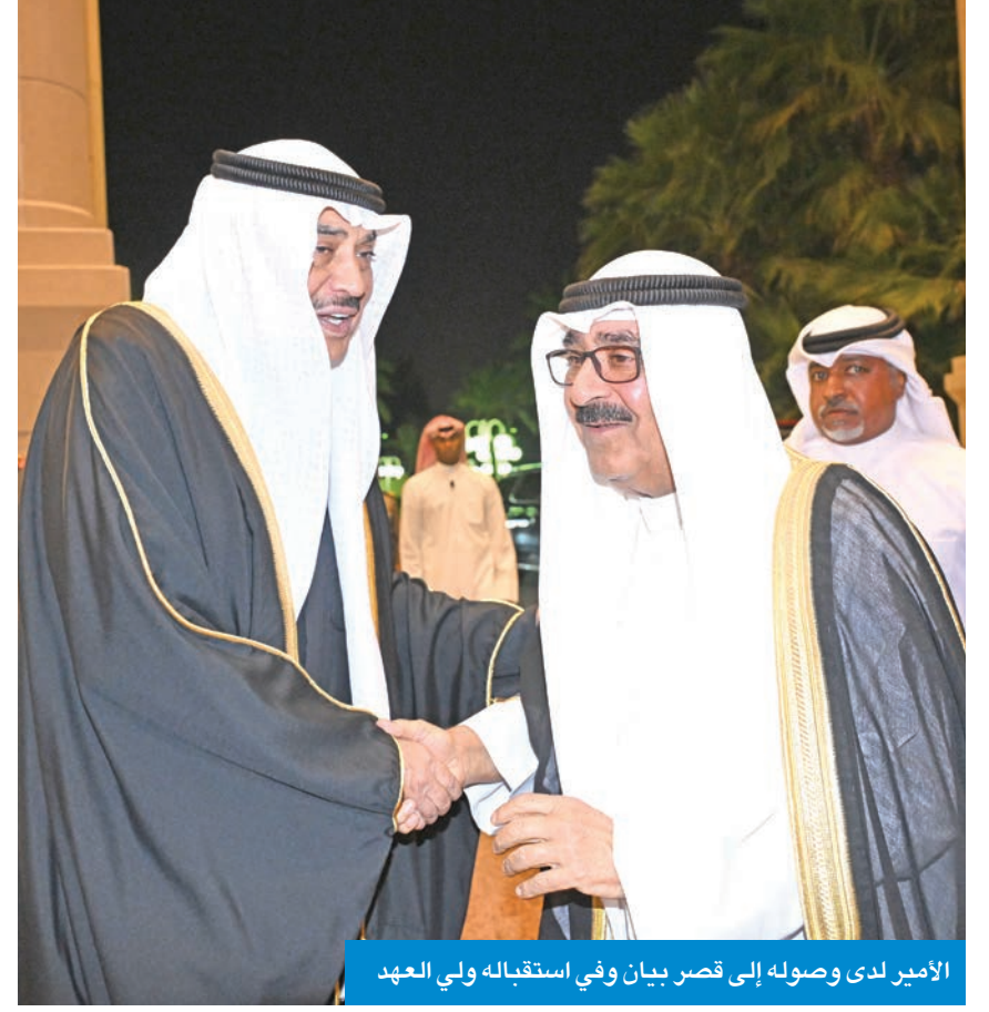
الأمير لدى وصوله إلى قصر بيان وفي استقباله ولي العهد