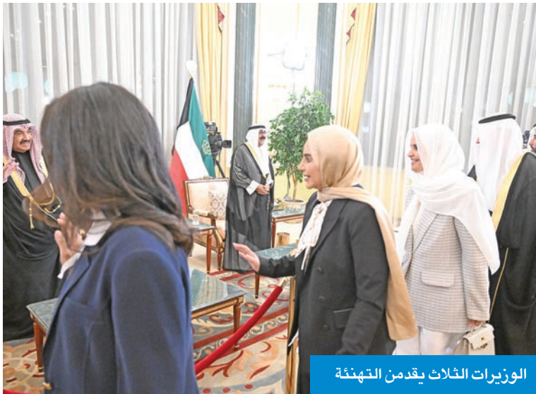
الوزيرات الثلاث يقدمن التهنية