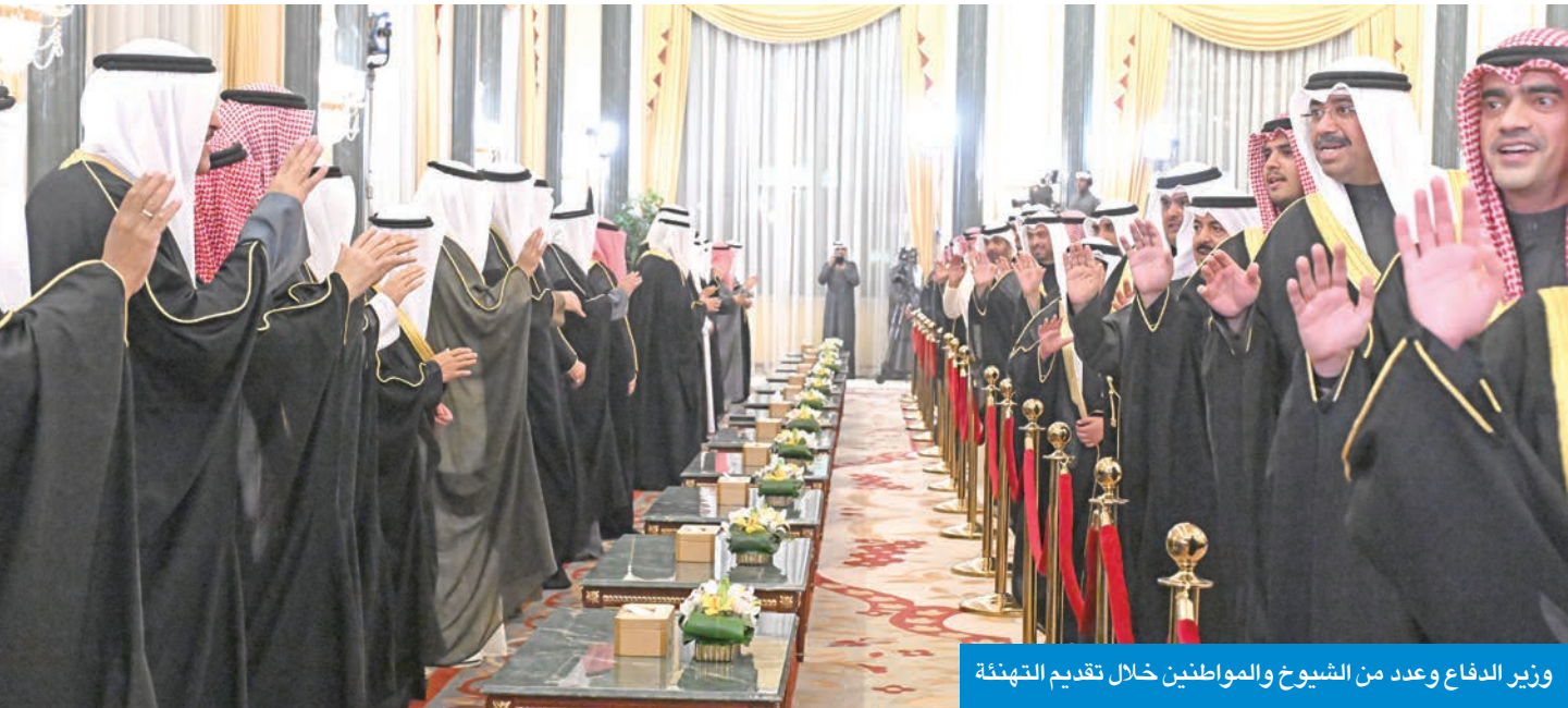
وزير الدفاع وعدد من الشيوخ والمواطنين خلال تقديم التهنة