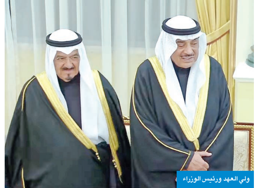
ولي العهد ورئيس الوزراء