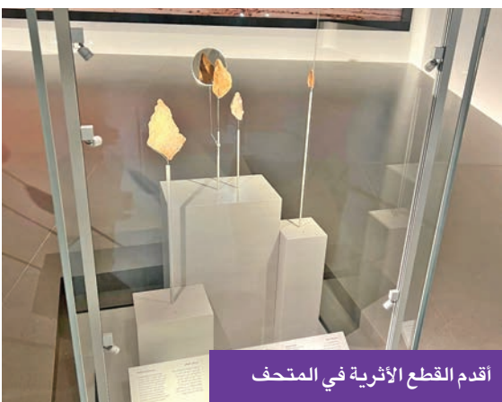
أقدم القطع الأثرية في المتحف

كما يوفر مساحة تعليمية مخصصة لسورث العمل التفاعلية والأنشطة التطبيقية، تتيح للزوار من مختلف الأعمار فرصة التفاعل المباشر مع الموروث الثقافي والتاريخي، في تجربة تعليمية ثرية. وتتكمّل تجربة الزيارة بوجود مقهى ومنجر ومكتبة قسراء، إلى جانب صالة للمعارض المؤقتة، بما يجعل من كل زيارة رحلة ثقافية متكاملة تجمع بين المعرفة والمتعة.