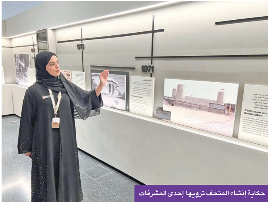
حكاية إنشاء المتحف ترويهما إحدى المشرفات

متقدماً مكن المجتمعات القديمة من تحقيق استدامة زراعية، وأسهم في ترسيخ دعائم الاستقرار الدائم في منطقة العين.