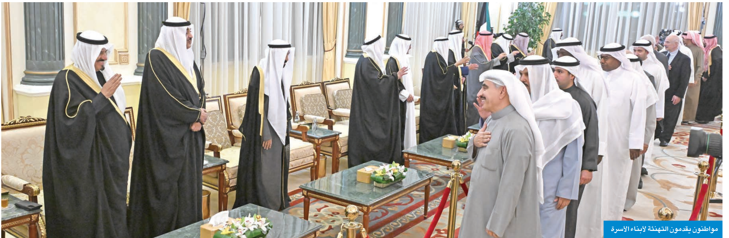
مواطنون يقدمون التهنية لأبناء الأسرة