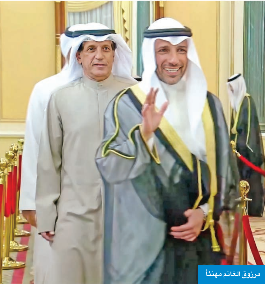
مرزوق الغانم مهننا