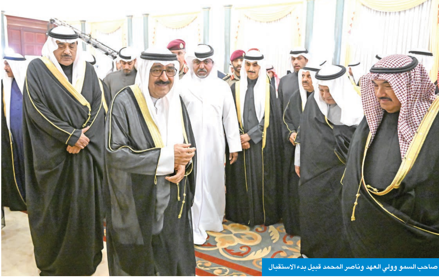
صاحب السمو وولي العهد وناصر المحمد قبيل بدء الاستقبال