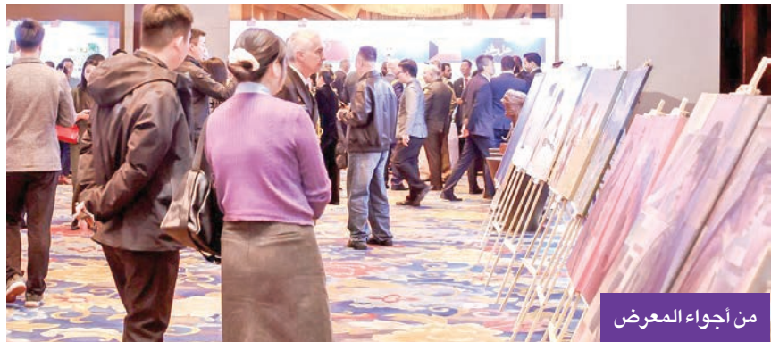
من أجواء المعرض