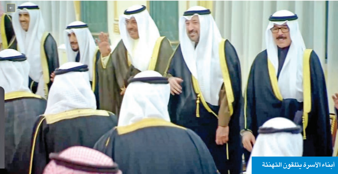
أبناء الأسرة يتلقون التهنة