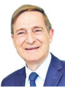
هانس كريستيان راينتنس

أما سفير اليابان موكاي كينيتشيرو فتقدم بخالص التهاني إلى القيادة السياسية والشعب الكويتي بمناسبة حلول شهر رمضان المبارك، قائلاً: «باتي رمضان هذا العام، وهو الثاني لي في الكويت، وقد لمست فيه عمق العادات والتقاليد التي تعكس روح الألفة والتكافل في المجتمع،