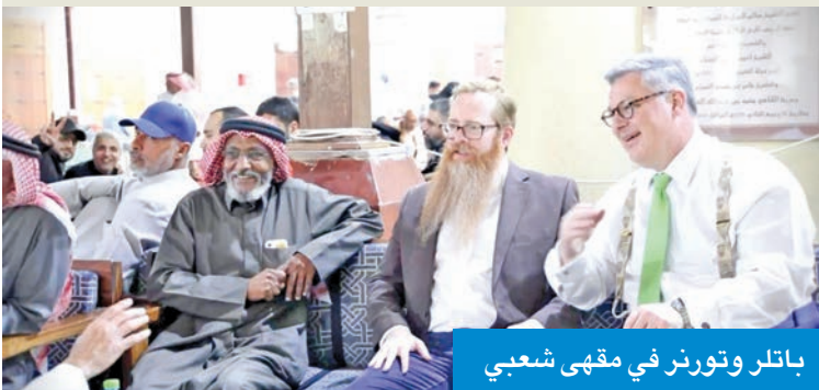
باتلر وتورنر في مقهى شعبي

الكويتيين يحبون عاداتهم، والناس قريبة من بعضها، والأجواء دافئة»، مضيفاً: «باسم السفارة الأميركية، أتمنى لكم شهر رمضان كله سلاماً وخيراً، ومن قلوبنا، رمضان كريم».