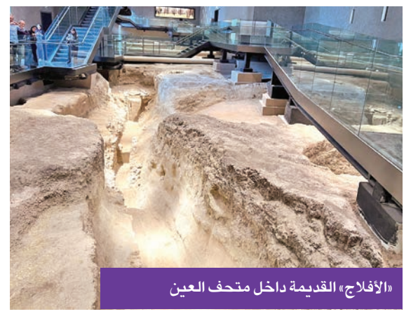
«الأفلاج» القديمة داخل متحف العين