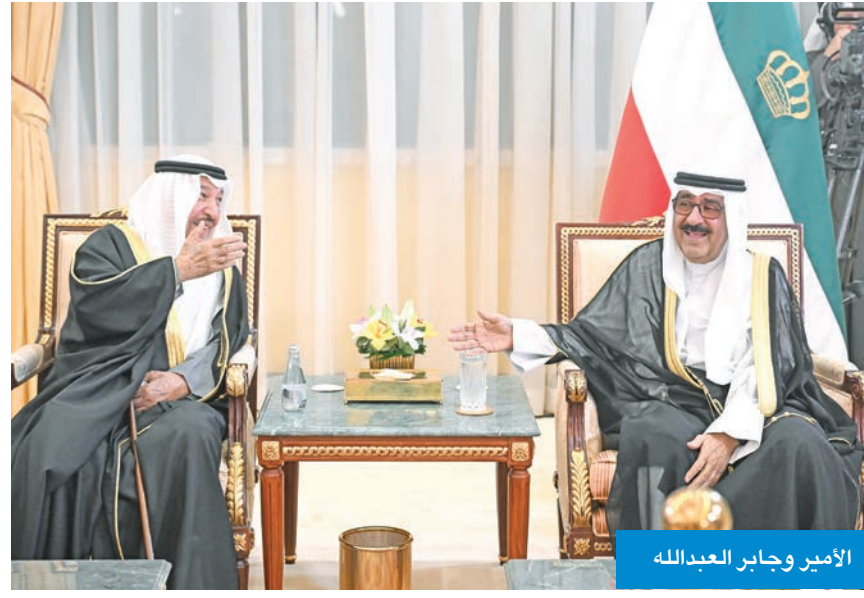
الأمير وجابر العبدالله

بمناسبة حلول شهر رمضان المبارك، استقبل سمو أمير البلاد الشيخ مشعل الأحمد، وسمو ولي العهد الشيخ صباح الخالد، وأسرته آل الصباح، في ديوان أسرة آل الصباح بقصر بيان، مساء أمس الأول، جموع المهنيين من المواطنين والمقيمين بهذا الشهر الفضيل. وقد جسد ذلك روح الأسرة الواحدة في المجتمع الكويتي الذي خيل على المحبة والمودة وروح الإخاء، متمنين أن تعود هذه المناسبة الفضيلة على الجميع بالخير واليمن والبركات.