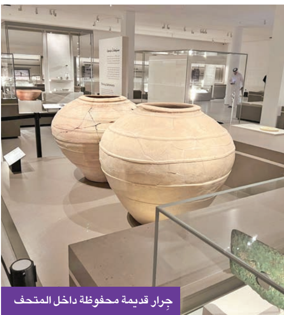
جرار قديمة محفوظة داخل المتحف

لا تقتصر أهمية متحف العين على كونه ذاكرة محلية، بل يتجاوز ذلك ليشكل مرجعاً علمياً للباحثين في تاريخ شبه الجزيرة العربية، حيث أسهمت المكتشفات الأثرية في إعادة رسم خريطة الاستيطان البشري في المنطقة، وكشفت عن شبكات تواصل تجاري وثقافي ربطت «العين» بمحيطها الإقليمي منذ آلاف السنين، مما يعكس مكانتها كمحطة حضارية فاعلة لا مجرد واحة معزولة.