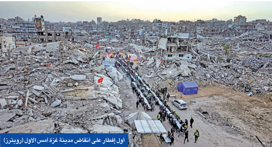
أول إفطار على انقاض مدينة غزة أمس الأول

الأمم المتحدة تتهم إسرائيل بالتطهير العرقي في الضفة