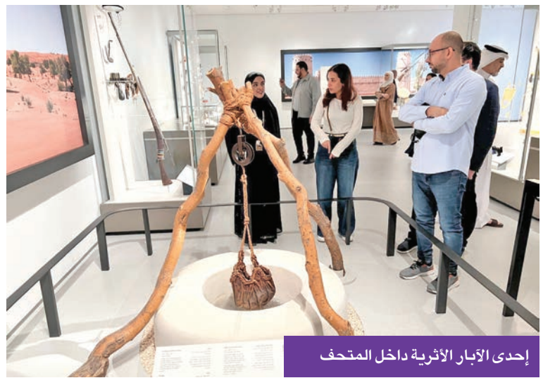
إحدى الآبار الأثرية داخل المتحف