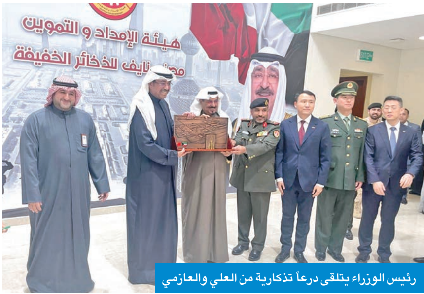
رئيس الوزراء يتلقى درعا تذكارية من العلي والعامزي