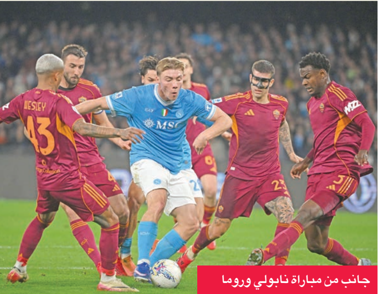
جانب من مباراة نابولي وروما

يرى أنطونيو كونتي مدرب نابولي أن فريقه كان يستحق أكثر من مجرد التعادل بهدفين لمثلهما أمام روما في المباراة التي أقيمت أمس الأول بالدوري الإيطالي لكرة القدم. ووصف كونتي اللقاء بأنه كان بمثابة «مباراة على الطراز الإنكليزي» بسبب كثافتها العالية والضغط المتبادل من كلا الطرفين، مشيراً إلى أن مصير الفريق في التأهل للمسابقات الأوروبية الموسم المقبل سيتحدد بناء على ما سيقدمه في المباريات الـ 13 المتبقية من الدوري. وأثنى كونتي على دعم جماهير فريقه، وأكد في تصريحات لمصلحة «دازن إيطاليا»... «يجب أن نشكر المشجعين، فليس من المسلم به أن يقدروا ما نقوم به هذا الموسم، ورسالتهم بأننا نقاتل ولا نستسلم هي رسالة رائعة».