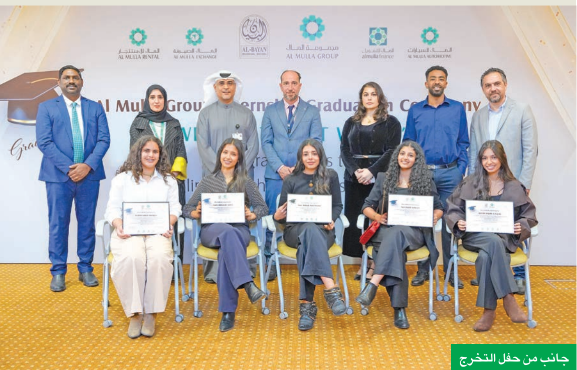
جانب من حفل التخرج