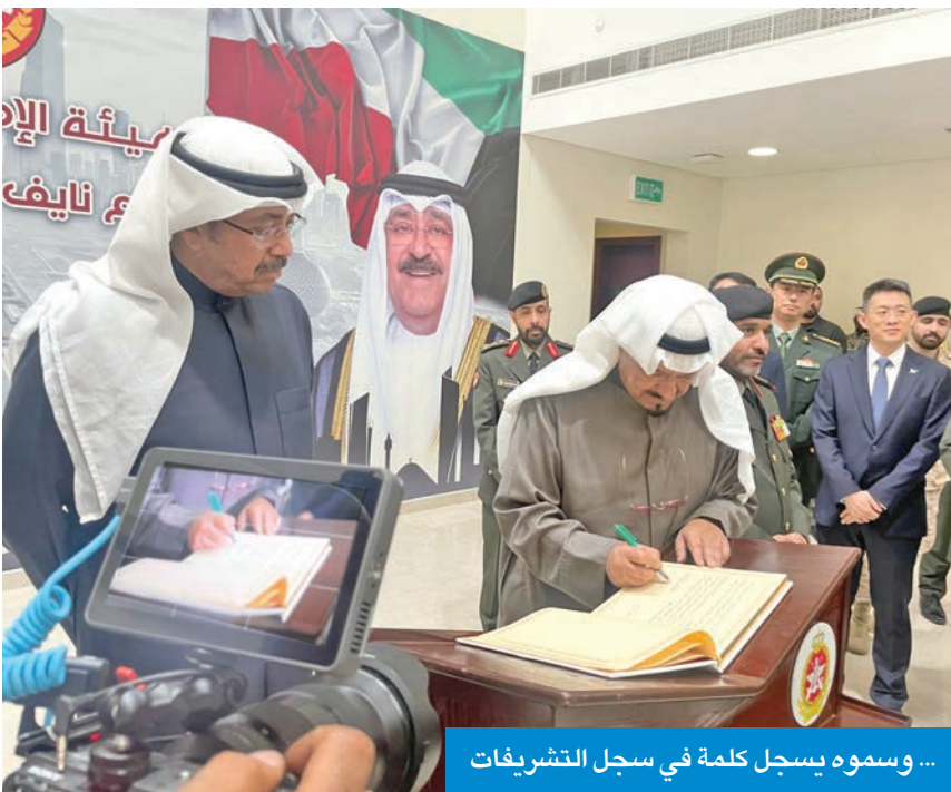
... وسموه يسجل كلمة في سجل التشريعات