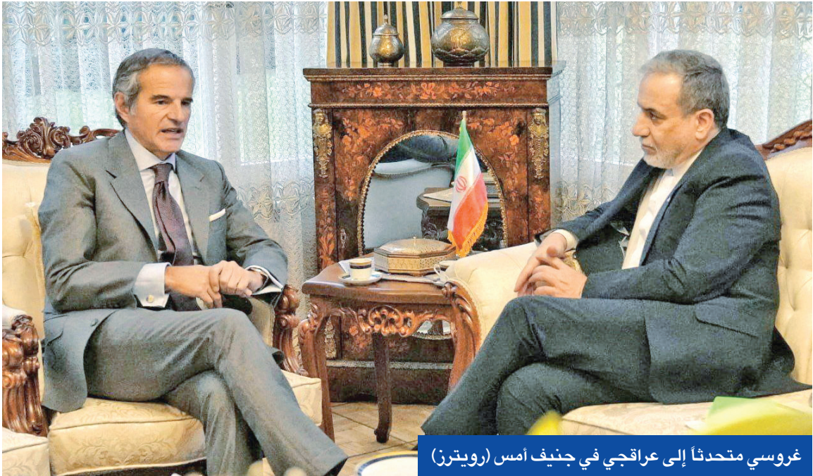
غروسي متحدثاً إلى عراقجي في جنيف أمس

فيكتور أوربان إن «التوصل إلى اتفاق مع إيران أمر صعب. لطالما قلنا إنه صعب، لكننا سنحاول. مفاوضات في طريقهم إلى هناك الآن. سيعقدون اجتماعات. سنرى ما سيحدث. نأمل أن يتم التوصل إلى اتفاق».