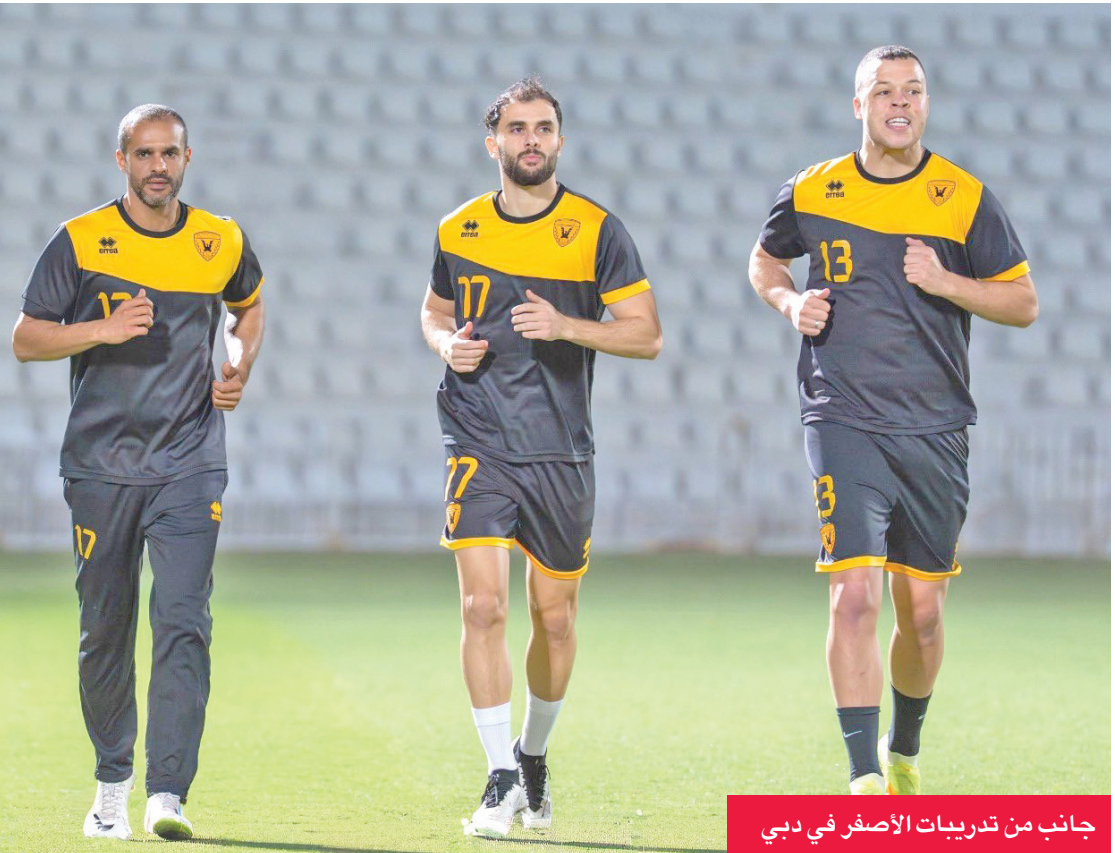
جانب من تدريبات الأصفر في دبي