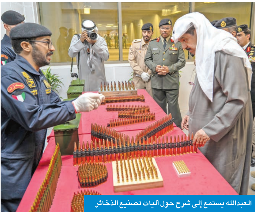
العبدالله يستمع إلى شرح حول آليات تصنيع الذخائر

الإنتاج وفق أعلى معايير الجودة واشترطات «الناتو» الخاصة بالذخائر الخفيفة أولى تجارب «الدفاع» في مجال تصنيع الذخائر... والأول من نوعه في الكويت