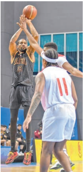
من مباراة الكويت والقادسية