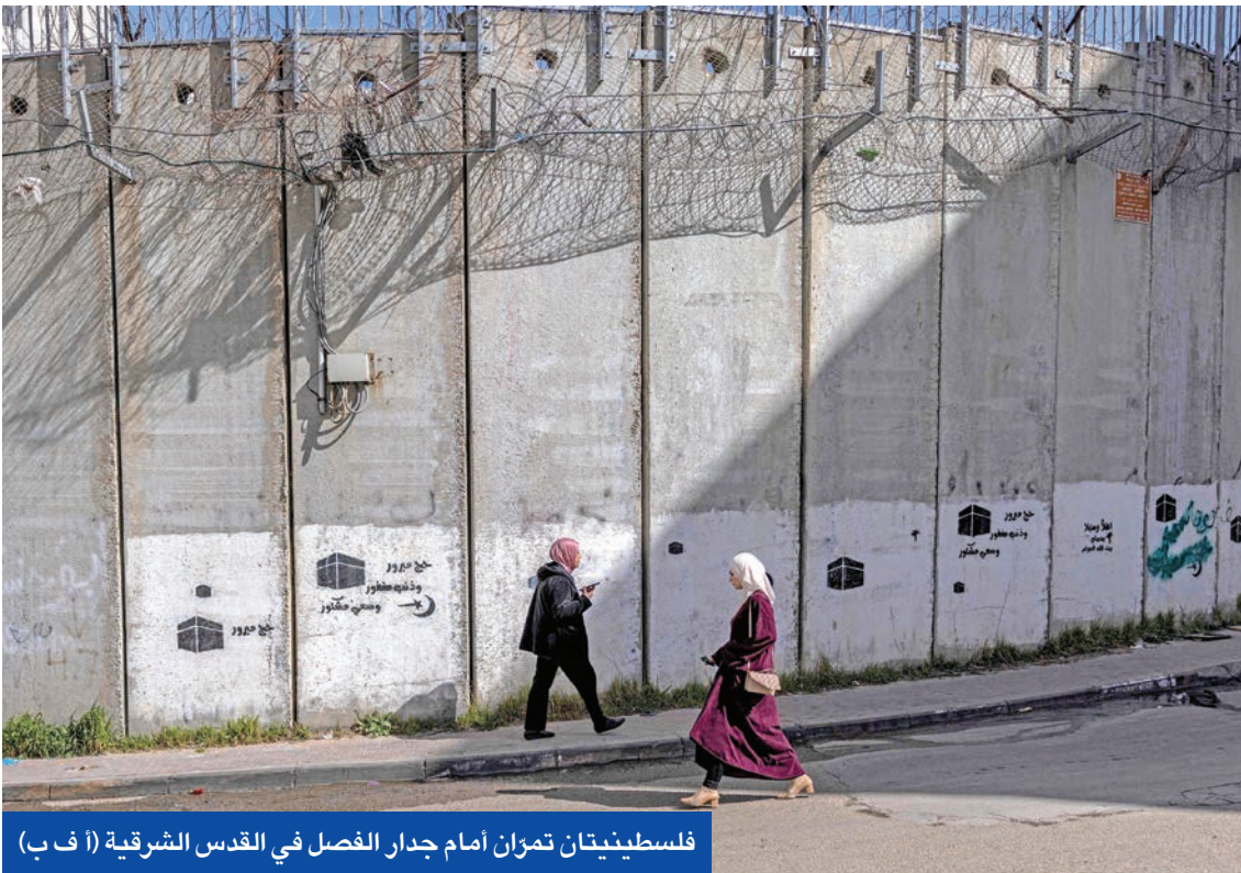
فلسطينيتان تمشان أمام جدار الفصل في القدس الشرقية

رغم التحذيرات الدولية من خطورة إصرار سلطات الاحتلال الإسرائيلي على التوسع الاستيطاني وتغيير الوضع القانوني للأراضي الفلسطينية لتقويض أي أفق للسلام ودفع المنطقة إلى المزيد من التوتر وعدم الاستقرار، تتجه حكومة بنيامين نتتياهو إلى توسيع مساحة القدس المحتلة، عبر ضم مزيد من المستوطنات وربطها بالمدينة المقدسة، في خطوة تُعد الأولى من نوعها منذ عام 1967.