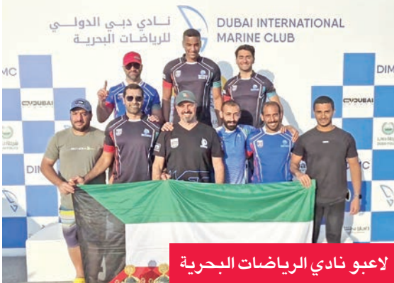
لاعبو نادي الرياضات البحرية

حقق لاعبو نادي الرياضات البحرية الكويتي إنجازاً رياضياً مميزاً، أمس الأول، ضمن الجولة الثانية من بطولة دبي الدولية للرياضات البحرية إثر حصدهم مراكز متقدمة في عدد من الفئات وسط مشاركة قوية من نخبة من المتسابقين.