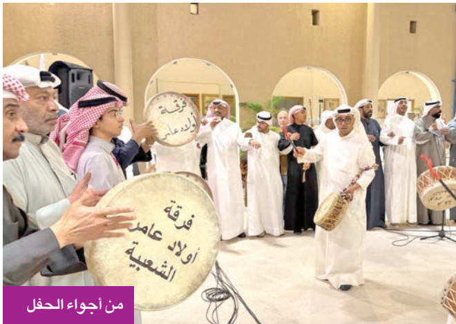
من أجواء الحفل

مسؤوليتها الثقافية والمجتمعية في إحياء الموروث الشعبي الكويتي وصونه، وترسيخ حضوره في المشهد الفني المعاصر، بما يُتيح للأجيال الجديدة فرصة التعرّف على هذا الإرث الفني العريق، والنهل من قيمه الجمالية والوطنية.