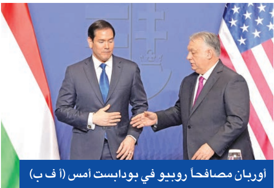
أوربان مصافحاً روبيو في بودابست أمس

ورغم تقديم الخطة رسمياً باعتبارها توسعاً استيطانياً عادياً، فإن معطياتها الميدانية تشير إلى فرض سيادة فعلية على أراض في الضفة الغربية، وتوسيع حدودها الجغرافية. وجاء تسارع هذه الخطوات في ظل تغييرات إدارية أدخلها وزير المالية بتسلييل سموتريتش داخل «الإدارة المدنية»، عبر إنشاء إدارة خاصة بالاستيطان وتسيط مسارات المصادقة، مما يجعل تمرير المخطط أكثر سرعة مقارنة بالسنوات الماضية. ويرى مراقبون أن الجمع