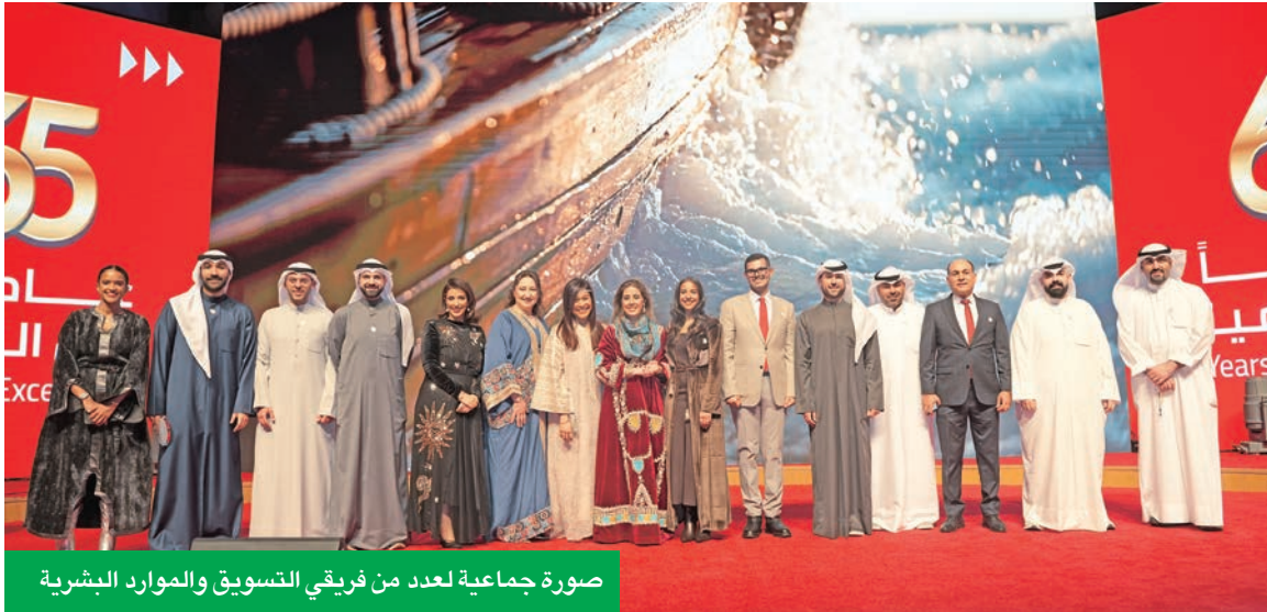
صورة جماعية لعدد من فريقي التسويق والموارد البشرية