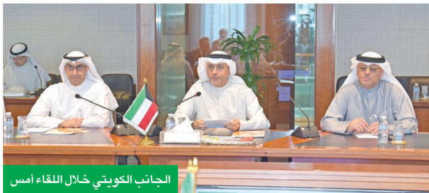
الجانب الكويتي خلال اللقاء أمس

في توقيع بروتوكول تعاون مع غرفة الكويت، والاستعداد لتعزيز العلاقات مع الجهات المعنية فيها، مؤكداً أهمية الكويت في المنطقة، حيث إنها تعتبر مدخلاً للخليج.