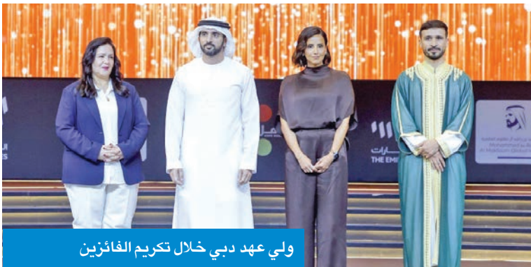
ولي عهد دبي خلال تكريم الفائزين