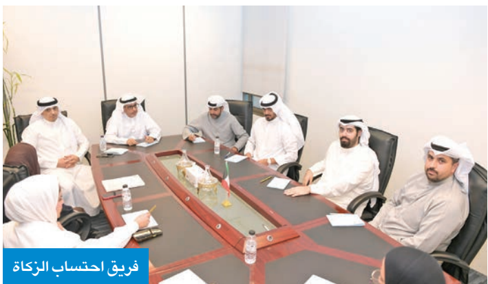
فريق احتساب الزكاة

الواقفين ويعظم الأثر المجتمعي للوقوف حتى يبقى الوقف الكويتي على قدر الثقة وعلى قدر اسم الكويت ومكانتها بدعم كريم من القيادة الحكيمة وبشركات فاعلة مع مؤسسات الدولة والمجتمع المدني.