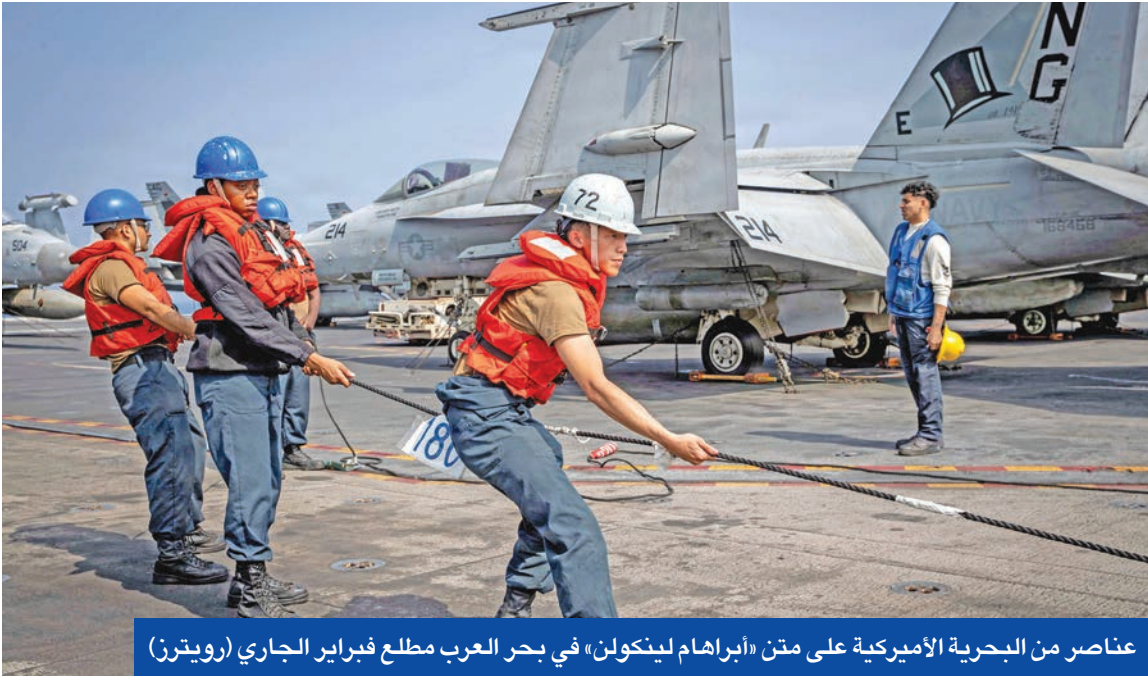
عناصر من البحرية الأمريكية على متن «أبراهام لينكولن» في بحر العرب مطلع فبراير الجاري