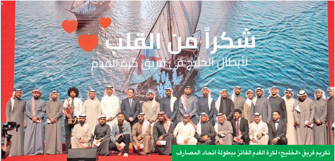
تكريم فريق «الخليج» لكرة القدم الفائز ببطولة اتحاد المصارف