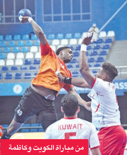
من مباراة الكويت وكاظمة

إدارة المدرب الجزائري سعيد حجازي، ليخرج اللقاء بتعادل مثير 30-30. ابقي الكويت في الصدارة برصيد 21 نقطة، فيما تجمد رصيد كاظمة عند 14 نقطة في المركز الثاني بفارق الأهداف عن برقان الثالث الذي حقق فوزاً مهماً على الصليبيخات 33-39.