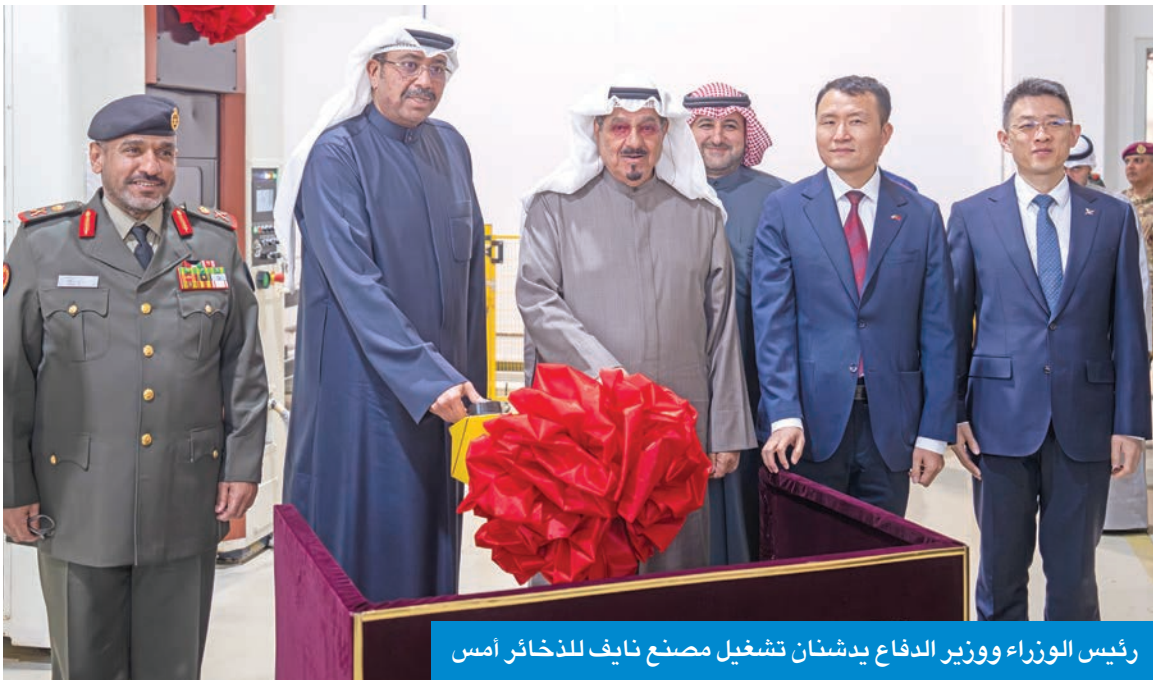
رئيس الوزراء ووزير الدفاع يدشنان تشغيل مصنع نايف للذخائر أمس