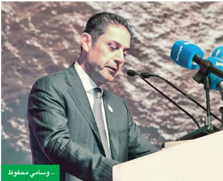
... وسامي محفوظ