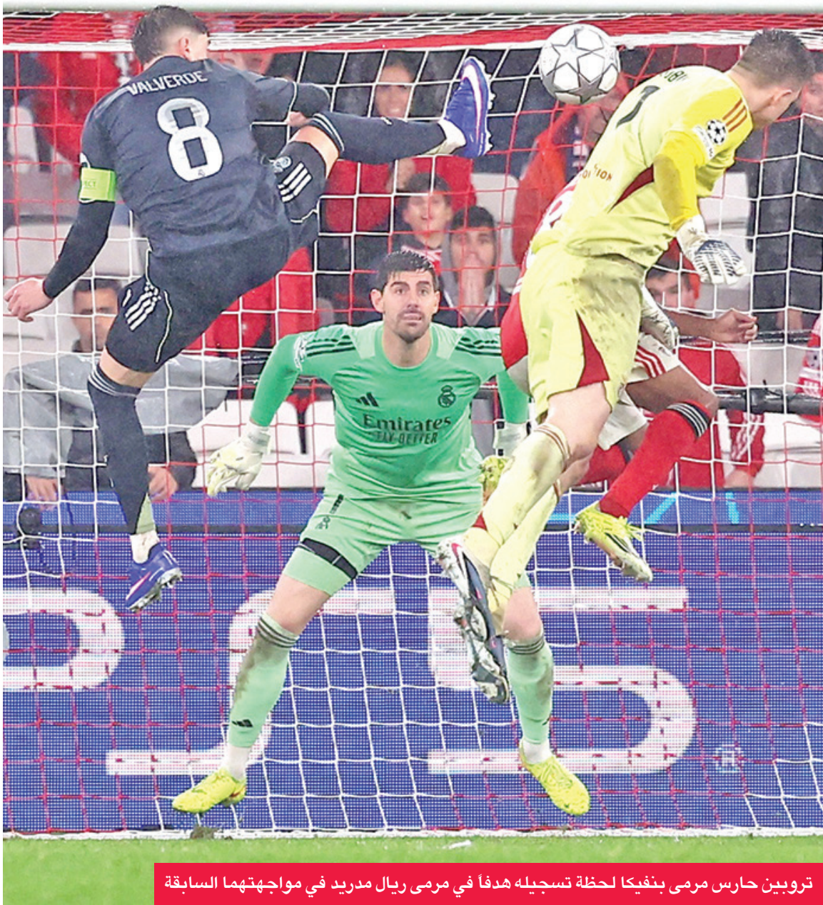
تروبين حارس مرمى بنفيكا لحظة تسجيله هدفا في مرمى ريال مدريد في مواجهتهما السابقة

بدلاً من الضائع، وتحمل مواجهات ريال مدريد وبنفيكا طعماً تاريخياً، إذ حرم الأخير النادي الملكي من اللقب بفوزه عليه 3-5 في نهائي 1962، عندما سجل للفائز النجم أوزيبيو ثنائية وللخاسر المجري فيرينتس بوشكاش ثلاثية. لكن رصيد نسور بنفيكا توقف عند لقبين في ستينيات القرن الماضي، فيما حصد ريال مدريد في 2024 لقبه الخامس عشر القياسي، بفارق شاسع عن أقرب مطارديه ميلان الإيطالي (7)، وهو يخوض مراحل خروج المغلوب للمرة الـ 29 توالياً. ويلعب الفائز من هذه المواجهة مع مانشستر سيتي أو سيورتيغ البرتغالي.