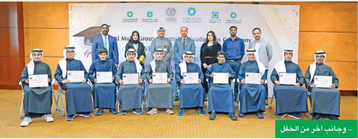
... وجانب آخر من الحفل

وخلال ثلاثة أيام مكثفة من التدريب المهني، تنقل الطلاب بين شركات مجموعتي الملا للسيارات والخدمات المالية، بدعم من قطاع الملا للاستثمار والتأجير لتسهيل عملية تعلمهم. وشارك