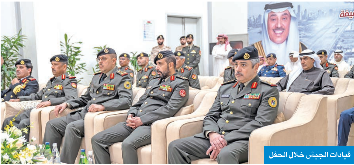
قيادات الجيش خلال الحفل