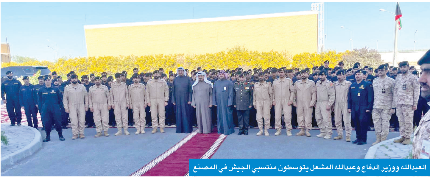
العبدالله ووزير الدفاع وعبدالله المشعل يتوسطون منتسبي الجيش في المصنع

محمد الشهران أحد الإنجازات الذكية لرفع أداء القوات المسلحة وتلبية حاجات الأجهزة الأمنية خطوة تفتح آفاقاً تسمح بتطوير الذخائر وتدريب جيل قادر على بناء مشاريع حيوية صرح مميز جاء وفقاً لرؤية القيادة السياسية وأحد أهم المشاريع العامزي