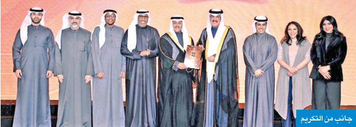
جانب من التكريم

نجاح المعرض ثمرة جهود مخلصة من النادي العلمي والداعمين والرعاة والمطوعين الخرافي