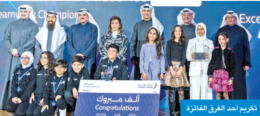
تكريم أحد الفرق الفائزة

المشاركات والإنجازات وتمثيل وطنهم محلياً ودولياً بكل اعتزاز. وأوضح أن البطولة تندرج ضمن المبادرات الوطنية النوعية الهادفة إلى تنمية مهارات التفكير