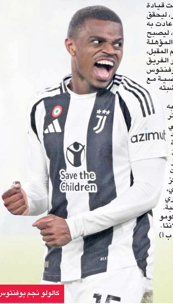
كالولو نجم يوفنتوس

سيئة في الموسم الجاري تحت قيادة مدربه السابق إيجور تيودور، ليحقق الفريق سلسلة من الانتصارات عادت به إلى المراكز الأولى في الترتيب، ليصبح مهيبا للمنافسة على المقاعد المؤهلة لدوري أبطال أوروبا في الموسم المقبل، وهو الأمر الأهم عند جماهير الفريق الأبيض والأسود. وتعادل يوفنتوس بصعوبة في الجولة الماضية مع لاتسيو بنتيجة 2-2، ليواصل تشبّهه بالمراكز الأولى.