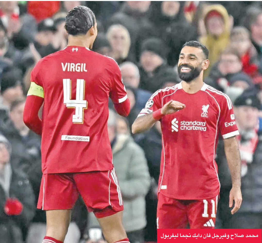
محمد صلاح وفيرجيل فان دايك نجمي ليفربول

استعادة التوازن بعد الهزيمة أمام أستون فيلا بالدوري الإنكليزي، وقد تكون بطولة كأس الاتحاد فرصة للفريق من أجل إثبات قدراته على مقارعة الكبار والمنافسة على الألقاب. ويعوّل برايتون على عدد من نجومه، على رأسهم جيمس ميلنر صاحب الخبرة الكبيرة، كما يعتبر فيردي كاديوغلو أحد أهم عناصر