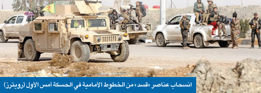
انسحاب عناصر «قسد» من الخطوط الامامية في الحسكة أمس الأول (رويترز)

بغداد تستكمل عملية نقل سجناء «داعش» من سورية