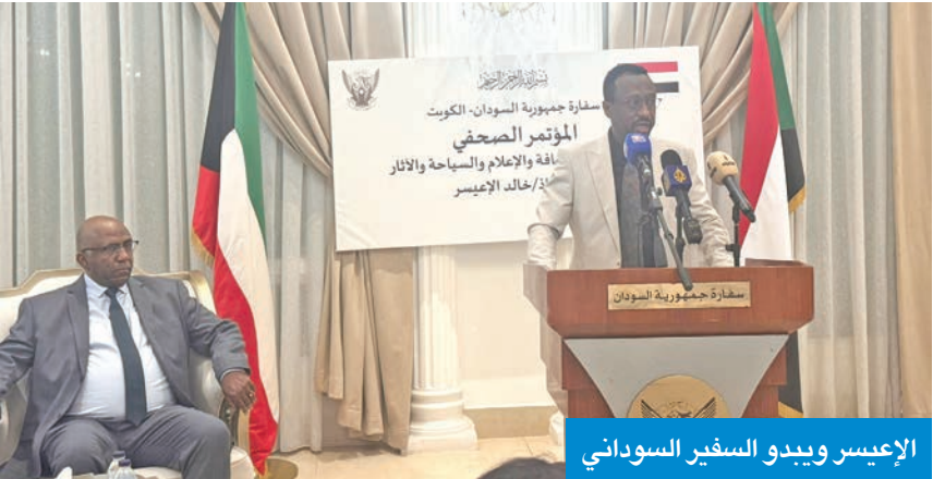
الإعيسر ويبدو السفير السوداني

وأضاف أن «الصندوق» صادق كذلك على منحة لتمويل مشروع تعزيز أوضاع اللاجئين السودانيين في تشاد بقيمة 3.2 ملايين دولار بالتعاون مع المفوضية السامية لشؤون اللاجئين، إلى جانب مشروع لتحسين أوضاع النازحين وتعزيز المجتمعات المستضيفة بقيمة 2.5 مليون دولار.