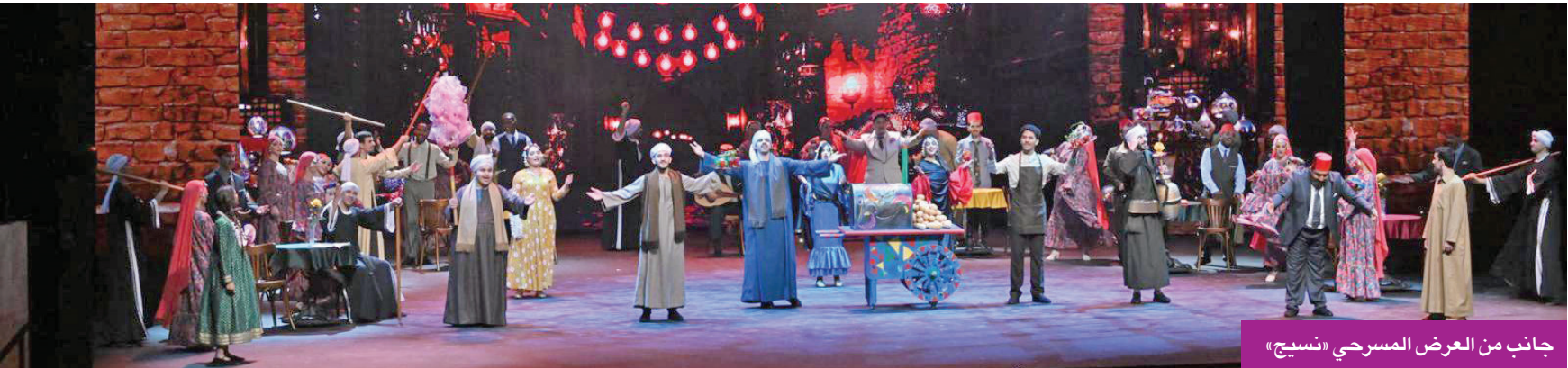
جانب من العرض المسرحي «نسيج»

توفي الممثل الأمريكي جيمس فان دير بيك، نجم مسلسل التسعينيات الشهير Dawson's Creek، عن 48 عاماً، وفق بيان نشر عبر حسابه على «إنستغرام»، أكد رحيله بعد معركة مع المرض، مبيّناً أنه واجه أيامه الأخيرة بشجاعة وإيمان وهدهو. وكان فان دير بيك أعلن في نوفمبر 2024 إصابته بسرطان القولون، قبل أن يكشف لاحقاً عن خطط لبيع مقتنيات من أعماله الفنية للمساهمة في تمويل علاجه.