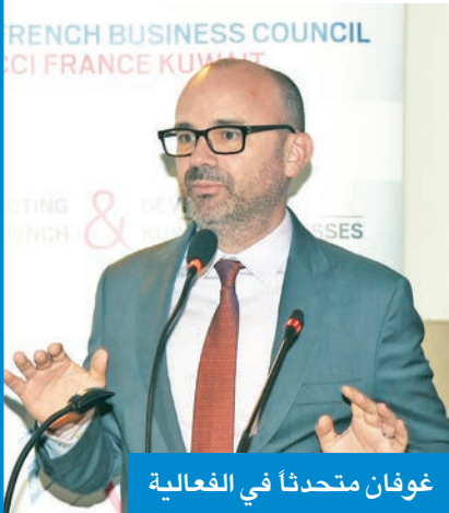
غوفان متحدثاً في الفعالية

الكويت المستمر إلى تعزيز الابتكار والتعاون الدولي، تطلق اليوم سلسلة FBCK TALKS التي تجمع خبراء من مختلف القطاعات. ويعد النجاح الذي حققته الدبوانية الفرنسية للأعمال في يناير الماضي، يعزز المجلس تنظيم فعاليات شهرية تجمع الشركات الفرنسية والكويتية لتعزيز الشراكات الثنائية. وشهدت الجلسة مشاركة متحدتين بارزين قداماً رؤى استراتيجية وتشغيلية متكاملة، وأتاح النقاش للمشاركين فهماً أعمق لتحديات الأمن السيبراني، والأليات العملية لبناء منظومات رقمية أكثر مرونة وقدرة على الصمود في ظل التحول الرقمي المتسارع.