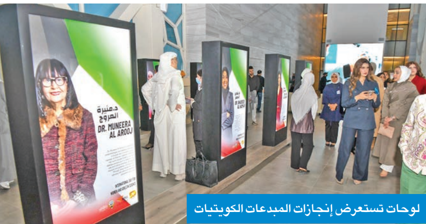
لوحات تستعرض إنجازات المبدعات الكويتيات

أمير البلاد الشيخ مشعل الأحمد التي تؤكد أن تمكين المرأة في مجالات العلوم والتكنولوجيا يمثل ركيزة أساسية لتعزيز التنافسية الوطنية وترسيخ الاقتصاد قائم على المعرفة. بدورها، أكدت نخبة من الباحثات والمخترعات والمبدعات الكويتيات أن الاحتفاء بهن في اليوم الدولي