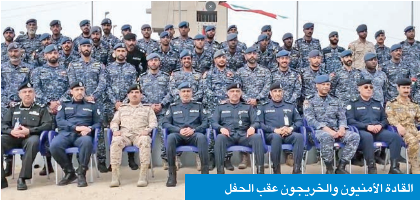
القادة الأمنيون والخريجون عقب الحفل

وتسليمهم شهادات اجتياز الدورة، مشيداً بالجهود المبذولة في إعداد وتأهيل الكوادر، مؤكداً أهمية استمرار تنفيذ البرامج النوعية التي تسهم في دعم المنظومة الأمنية وتعزيز كفاءتها.