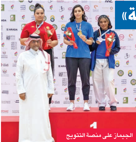
الجييمان على منصة التتويج

أعلن الاتحاد الكويتي للتنس تنظيم النسخة الثانية من بطولة الكويت الآسيوية للناشئين تحت إشراف الاتحاد الآسيوي للتنس، بمشاركة لاعبين من الأردن وإيران وهونغ كونغ وسنغافورة والهند وفرنسا وإيطاليا إلى جانب الدولة المضيفة الكويت. وكانت النسخة الأولى أقيمت في منتصف ديسمبر الماضي. وتأتي استضافة الكويت لهذه البطولة الآسيوية المهمة للمرة الثانية بهدف إتاحة الفرصة أمام لاعبي المنتخب الوطني للاحتكاك مع نظرائهم من دول القارة،