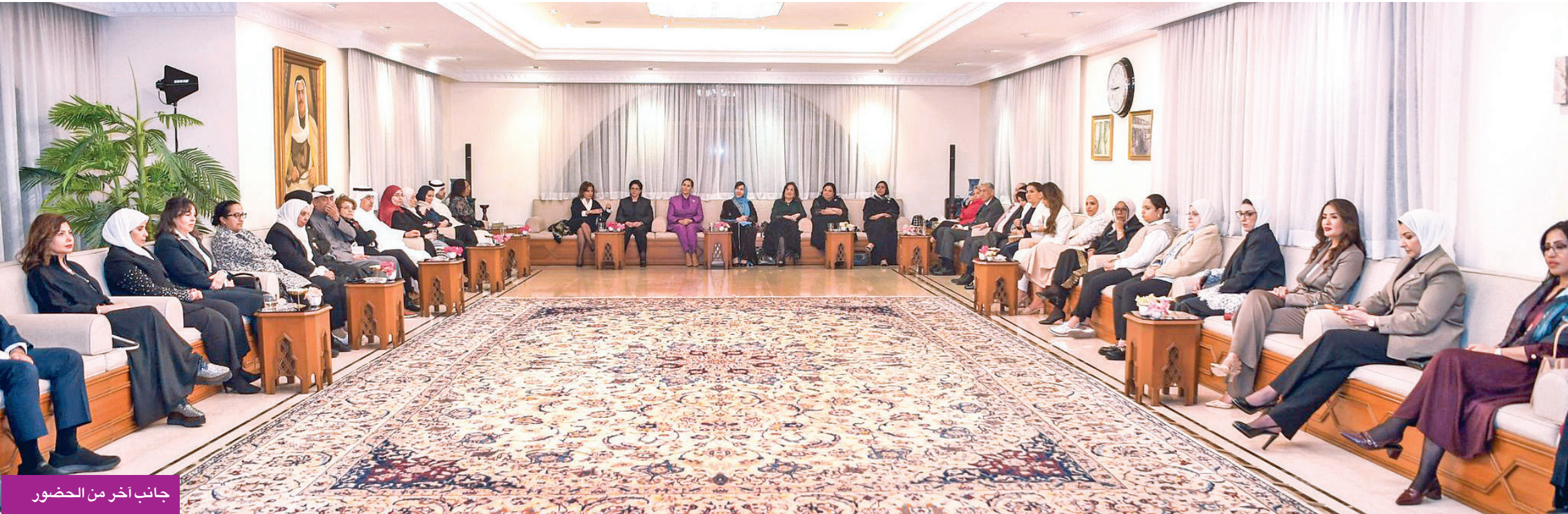
جانب آخر من الحضور

تقرأ جزءاً من تاريخ المنطقة وجزءاً من تاريخ المرأة تحديداً طالب الرفاعي