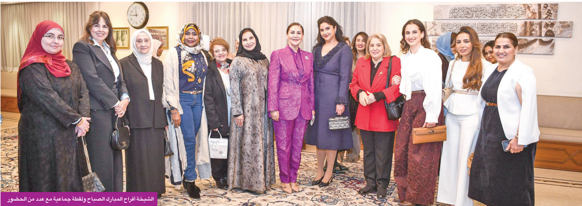
الشيخة أفراح المبارك الصباح ولقطة جماعية مع عدد من الحضور

أقامت حفل عشاء على شرف الروائية السعودية بحضور نخبة من الأدباء والمثقفين