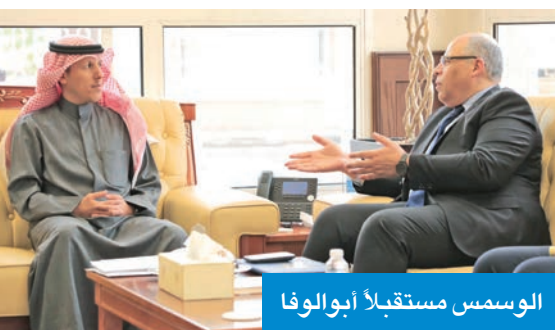
الوسمس مستقبلاً أبو الوفا

بحث وزير الأوقاف والشؤون الإسلامية، د. محمد الوسمي، مع سفير مصر لدى البلاد، محمد أبو الوفا، أمس، سبل تعزيز التعاون المشترك لاسيما المرتبط بعمل الوزارة. وذكرت الوزارة، في بيان لـ «كونا»، أن الوزير الوسمي أكد خلال اللقاء أهمية استمرار التواصل والتنسيق، بما يسهم في دعم العمل الإسلامي وتعزيز الجهود في مجالات الدعوة والتوعية. وأشارت إلى أن الجانبين أكدا خلال اللقاء حرصهما على تطوير مجالات التعاون، وتبادل الخبرات، بما يخدم المصالح المشتركة ويعزز العلاقات الثنائية بين البلدين.