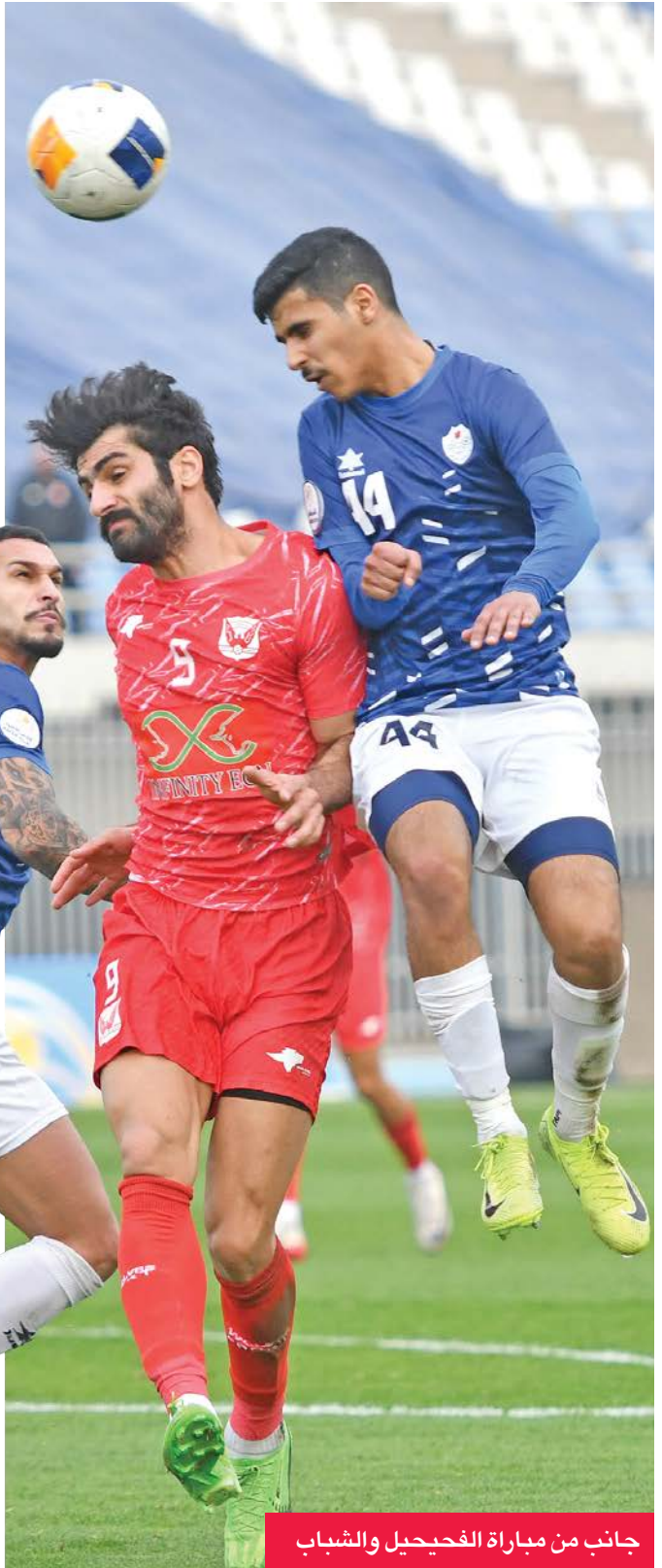
جانب من مباراة الفحيحيل والشباب

إلى ذلك، يواصل الدور الأول منافساته، اليوم (الجمعة)، بإقامة مباراتين، يلتقي فيهما التضامن مع الجهراء الساعة 4:45 مساءً على استاد ثامر، وكازمة مع خيطان الساعة 7:45 مساءً على استاد صباح السالم. فيما تُقام