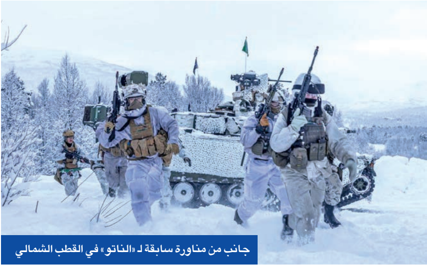
جانب من مناورة سابقة لـ «الناتو» في القطب الشمالي

روسيا تتعهد بإجراءات رداً على عسكرة غرينلاند