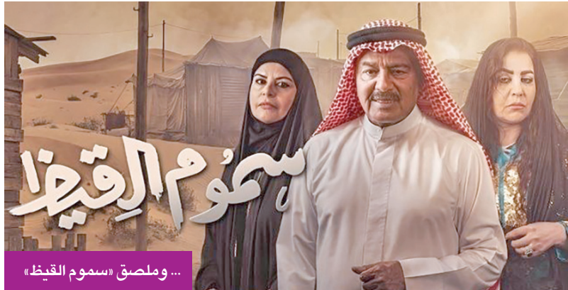
... وملصق «سوم القيثا»

كثرة الأعمال وتنوعها واحتدام المنافسة بينها تعكس ريادة الكويت الممتدة منذ عقود