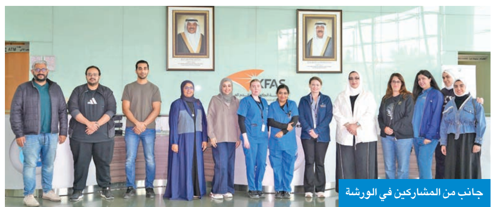
جانب من المشاركين في الورشة

محاور أساسية، من بينها تقييم عوامل الخطورة، الفحص والتصنيف، الوقاية من القروح، مبادئ علاج القروح (Debridement)، التعرف على العدوى، وسائل تخفيف الضغط (Off-loading)، إلى جانب عدد من الممارسات الطبية المتقدمة، إضافة إلى تثقيف المرضى حول أسس العناية الذاتية بالقدم. وأكد «دسمان» حرصه على عقد هذه الورشة عدة مرات خلال العام، انطلاقاً من إيمانه بأهمية الوقاية من القروح وتفادي حالات البتر، وما يتطلبه ذلك من فحص دوري للقدم، وتطبيق بروتوكولات علاجية موحدة، واعتماد نهج متعدد التخصصات في الرعاية الصحية. وأشار إلى أن المعهد من خلال هذه