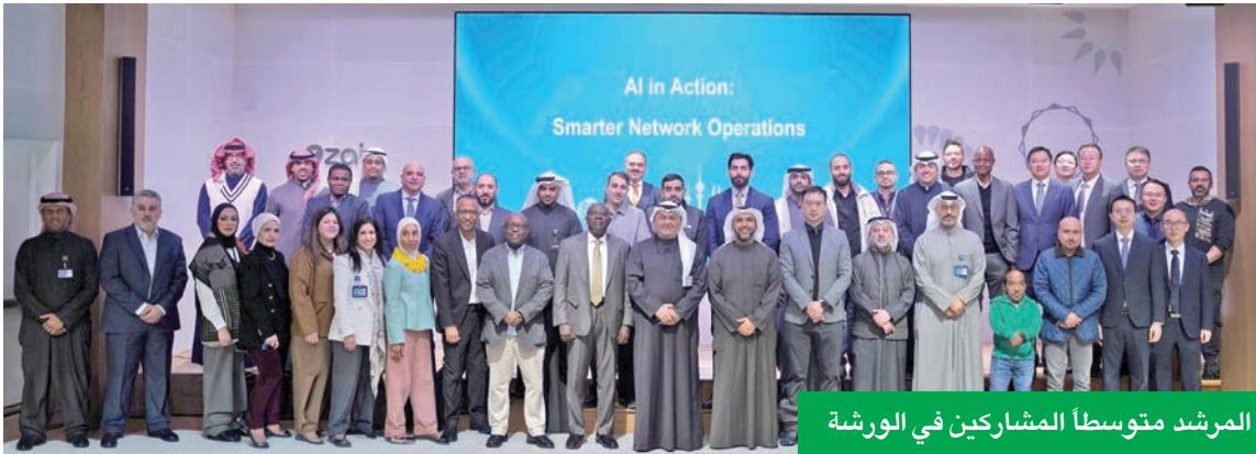
المرشد متوسلاً المشاركين في الورشة