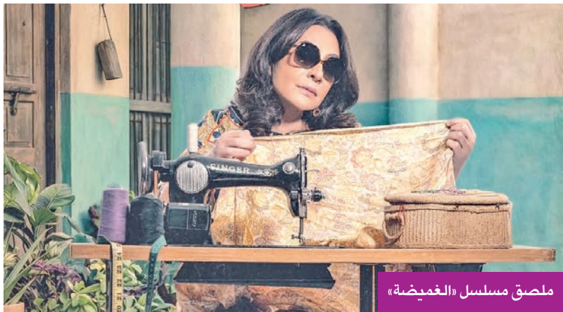
ملصق مسلسل «الغميضة»