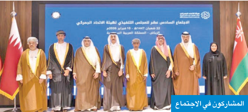
المشاركون في الاجتماع

مسيرة الاتحاد الجمركي، واستعرض مستوى الإنجاز في مشروع بناء وتشغيل منصة تبادل البيانات الجمركية، إلى جانب المشاريع التقنية ذات العلاقة، ومتابعة سير الأعمال التشغيلية للهيئة. واستعرض كذلك نتائج مشاركة هيئة الاتحاد الجمركي في مؤتمر ومعرض التكنولوجيا لمنظمة الممارك العالمية 2026 (WCO Tech)، الذي استضافته العاصمة أبوظبي خلال الفترة من 28 إلى 30 يناير 2026، في إطار حرص الهيئة على توسيع شراكاتها الدولية، وتعزيز الاستفادة من الخبرات العالمية في المجال الجمركي، ودعم جهود استكمال متطلبات قيام الاتحاد الجمركي الخليجي وفق أفضل المعايير والممارسات الدولية.