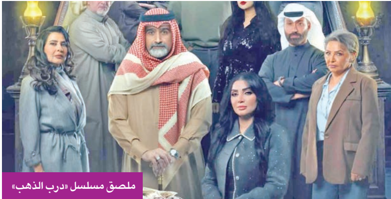
ملصق مسلسل «درب الذهب»