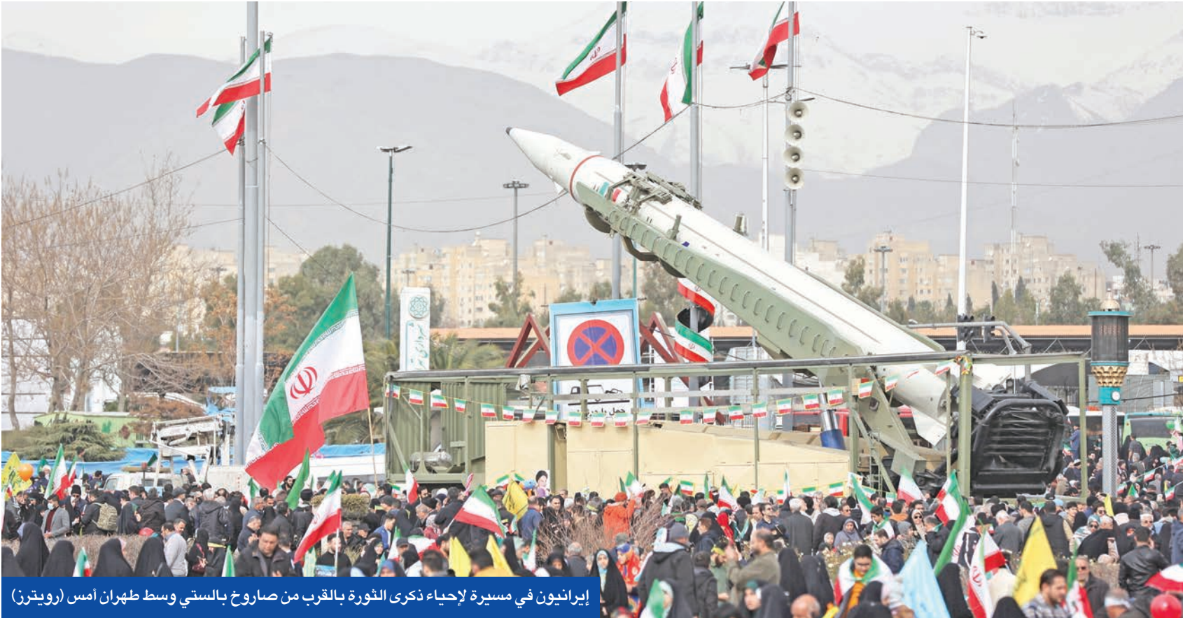
إيرانيون في مسيرة لإحياء ذكرى الثورة بالقرب من صاروخ بالستي وسط طهران امس

أمير قطر يجري مباحثات مع الرئيس الأميركي ولاريجاني... وبزشكيان يرفض أي مطالب «مبالغ فيها»