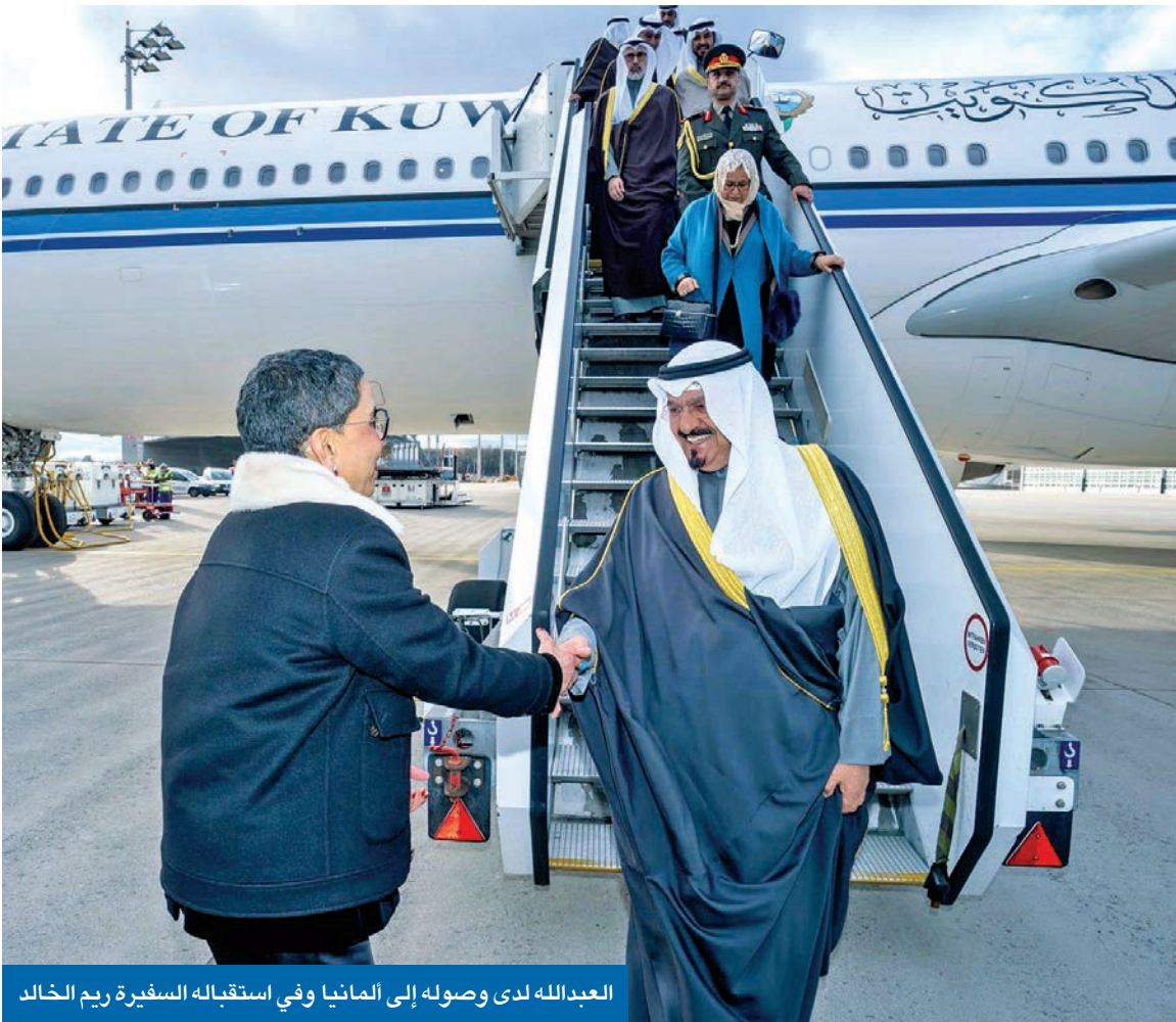
العبدالله لدى وصوله إلى ألمانيا وفي استقباله السفيرة ريم الخالد

أكد رئيس مجلس الوزراء سمو الشيخ أحمد العبدالله أن التحديات المتسارعة التي يواجهها العالم اليوم تستوجب وضع خارطة طريق توافقية لتعزيز الأمن العالمي، وتوحيد الجهود لترسيخ الاستقرار وتعزيز التعاون الدولي، بما يسهم في بناء مستقبل آمن ومزدهر. جاء ذلك في تصريح لسموه لدى وصوله إلى ألمانيا أمس على رأس وفد البلاد المشارك في أعمال الدورة الـ 62 لمؤتمر ميونيخ للأمن، حيث كان في استقباله سفيرة الكويت لدى ألمانيا ريم الخالد، والقنصل العام للبلاد في فرانكفورت عادل الغنيمان، وأعضاء السفارة. وشدد العبدالله مجدداً على التزام الكويت بنهجها المنفتح في علاقاتها الدولية ودعمها لتسوية النزاعات بالحوار والطرق السلمية وتعزيز السلم والأمن الدوليين، لافتاً إلى أن أهمية المؤتمر تكمن في مناقشة أبرز التحديات الأمنية العالمية الراهنة وإتاحة المجال لحوارات بناءة تسهم في تشكيل أرضية مشتركة تعزز التعاون الدولي، وتدعم الجهود الرامية إلى تسوية الخلافات والأزمات الإقليمية والدولية.