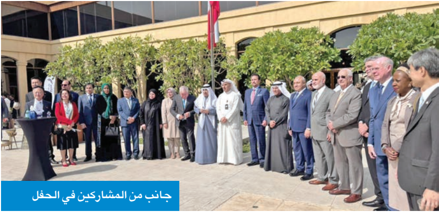
جانب من المشاركين في الحفل