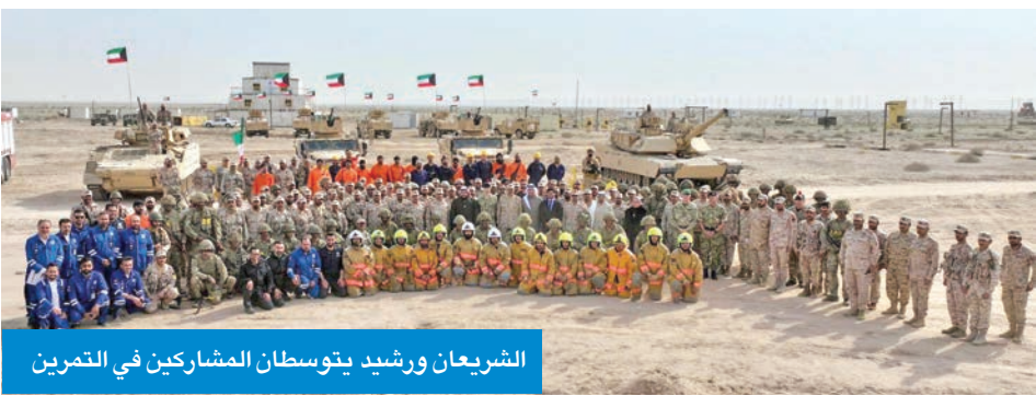
الشريعان ورشيد يتوسطان المشاركين في التمرين

وأضاف: «في الوقت نفسه، ولتحقيق أقصى استفادة من هذه الفرص، قررت تأجيل إغلاق سفارتنا في مدينة الكويت لمدة عام، معتبراً أن للدبلوماسية دوراً محورياً في التقريب بين الشعوب». وفي نوفمبر من العام الماضي، أعلن نائب رئيس الوزراء وزير الخارجية البلجيكي ماكسيم بريفو