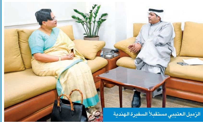
الزميل العتيبي يستقبل السفيرة الهندية

ومهماً في دعم الاقتصاد الكويتي من خلال إسهاماتها في مختلف القطاعات، مشيداً بكونها حالية منتجة وملتزمة، وتحظى بتقدير واسع داخل المجتمع الكويتي. كما ناقش اللقاء دور الإعلام في تعزيز العلاقات بين البلدين، حيث عثرت السفيرة الهندية عن احترامها وتقديرها للدور الذي تقوم به «الجريدة» في تغطية أخبار السفارة الهندية ونشاطاتها المختلفة، مؤكدة أهمية الإعلام المهني في نقل الصورة الحقيقية عن العلاقات الثنائية، وتعزيز جسور التواصل بين الشعبين. وتطرق الحديث كذلك إلى عدد من القضايا الإقليمية