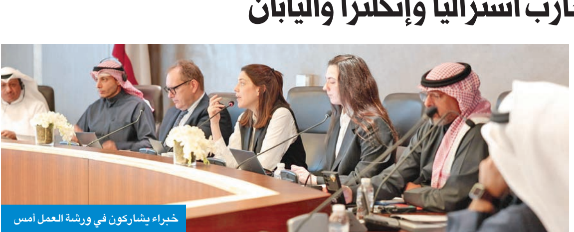
خبراء يشاركون في ورشة العمل أمس

في دعم المعلمين الجدد، واليات اتخاذ القرار المتعلقة بالحصول على الشهادة المهنية الكاملة، مستندة إلى تجارب وممارسات دولية ناجحة في هذا المجال.