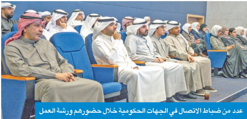
عدد من ضباط الاتصال في الجهات الحكومية خلال حضورهم ورشة العمل

تقدمها «نزاهة»، للمشمولين بنظام الذمة المالية، وخدمة تذكيرهم بالمواعيد القانونية لتقديم الإقرارات، والاستعلام عن المواعيد في موقع الهيئة الإلكترونية والتطبيق الحكومي الموحد للخدمات الإلكترونية (سهل). وبين أنه تم كذلك عرض أنواع الإقرارات والفئات الملزمة بالتقديم، وخطوات تقديم الإقرار، والعقوبات المترتبة على المتأخرين عن التقديم خلال المدد القانونية، والتوعية بإقرارات الذمة المالية والفئات الملزمة وفقاً لقانون إنشاء الهيئة.