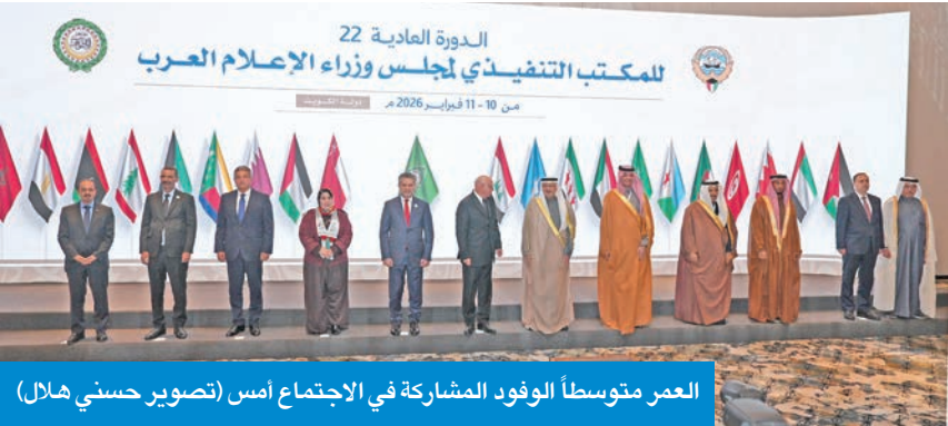
العمر متوسطاً الوفود المشاركة في الاجتماع أمس