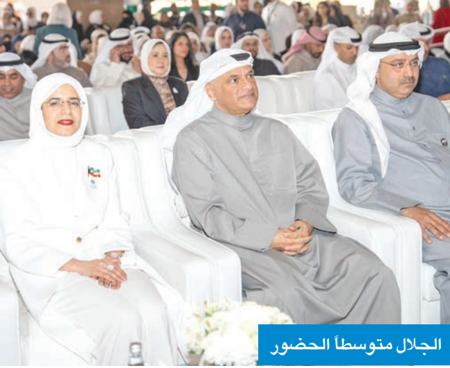
الجلال متوسطاً الحضور

خلال مشاركته في احتفالات «التطبيقي» وجامعة عبدالله السالم