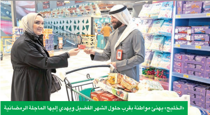
«الخليج» يهنئ مواطنة بقرب حلول الشهر الفضيل ويهدي إليها الماجلة الرمضانية

تلبية احتياجات جميع عملائه من خلال تقديم منتجات تساعدهم على إدارة نفقاتهم بسهولة وأمان.