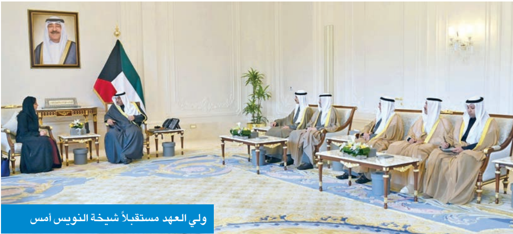
ولي العهد مستقبلاً شبيخة النويس أمس

استقبل سمو ولي العهد الشيخ صباح الخالد، بقصر بيان صباح أمس، الأمينة العامة لمنظمة الأمم المتحدة للسياحة، شبيخة النويس، بمناسبة انعقاد الاجتماع الـ 52 للجنة الإقليمية للشرق الأوسط لمنظمة الأمم المتحدة للسياحة في الكويت. حضر اللقاء رئيس ديوان سمو ولي العهد، الشيخ فامر الجابر، ووزير الدولة لشؤون الاتصالات وتكنولوجيا المعلومات، وزير الإعلام والثقافة بالوكالة، عمر العمر، وكبار المسؤولين بالديوان.