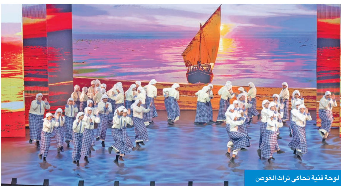
لوحة فنية تحاكي تراث الغوص