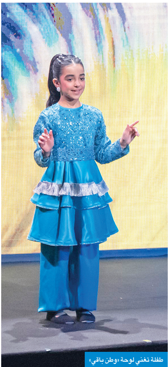
طفلة تغني لوحة «وطن باقي»