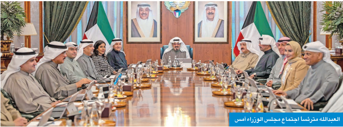
العبدالله مترئساً اجتماع مجلس الوزراء أمس

صاحب السمو وأشاد المجلس بالعمل الدؤوب والجهود المبذولة من وزير المالية وقياديي الوزارة والقائمين على إعداد مشروعات المراسيم الخاصة بربط ميزانيات والإدارات الحكومية والهيئات الملحقة والمؤسسات المستقلة للسنة المالية (2026/2027) مؤكداً أن موافقته على تلك المشروعات المقرر بدء العمل بها بتاريخ 2026/4/1 يأتي في إطار حرص الحكومة والفرامها بالموافقة على ميزانيات الوزارات والإدارات الحكومية والهيئات الملحقة والمؤسسات المستقلة للسنة المالية (2027/2026) في مواعيدها المحددة حتى يتسنى للجهات الحكومية تنفيذ أعمالها ومشاريعها ويمناسية صدور المرسوم الأميري رقم (11) لسنة 2026 بالتعديل الوزاري، وافق المجلس على مشروع مرسوم بقانون بشأن الإنابات الوزارية والحلول الوزارية، كما وافق على قرار بشأن إعادة تشكيل اللجان الوزارية واعتمد مجلس الوزراء محضر اللجنة العليا لتحقيق الجنسية الكويتية، المتضمن حالات فقد وسحب الجنسية الكويتية من بعض الأشخاص، وفقاً لأحكام المرسوم بالقانون رقم (15) لسنة 1959 بشأن الجنسية الكويتية وتعديلاته، واستعرض مجلس الوزراء عدداً من المواضيع المدرجة على جدول الأعمال، وقرر الموافقة عليها، كما قرر حالة عدد منها في اللجان الوزارية المختصة لدراستها، وإعداد تقارير بشأنها لاستكمال الإجراءات الخاصة لإنجازها.