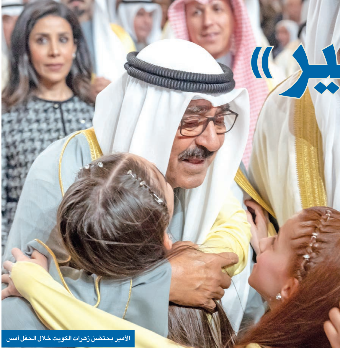
الأمير يحتضن زهرات الكويت خلال الحفل أمس