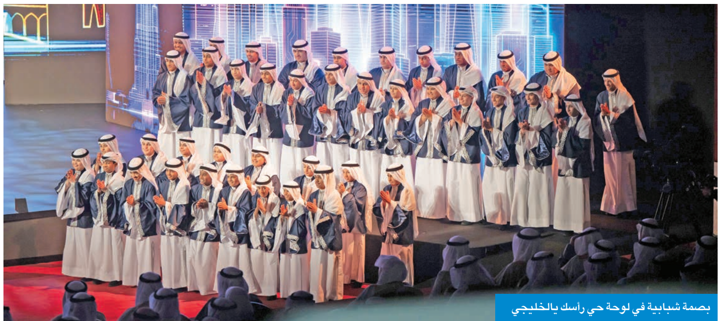
بصمة شبابية في لوحة حي راسك بالخليجي