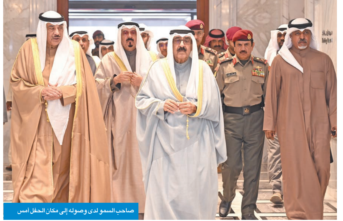
صاحب السمو لدى وصوله إلى مكان الحفل أمس