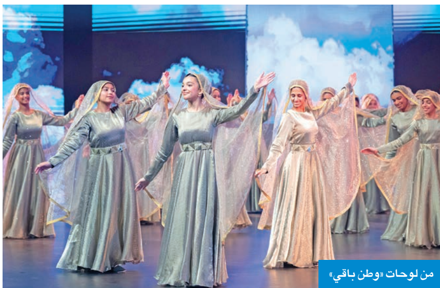
من لوحات «وطن باقي»