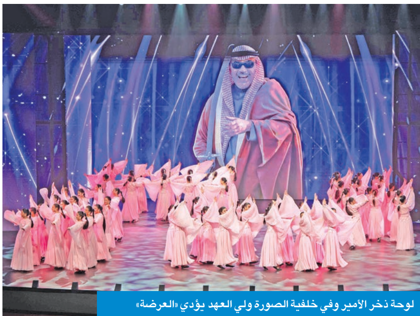
لوحة نذر الأمير وفي خلفية الصورة ولي العهد يؤدي «العرضة»