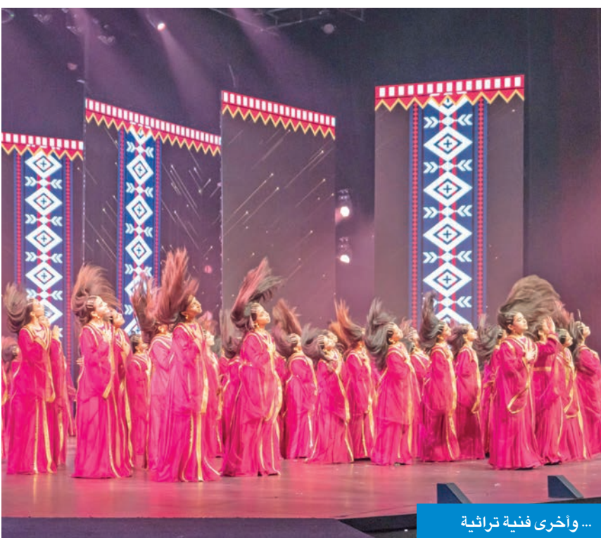
... وأخرى فنية تراثية