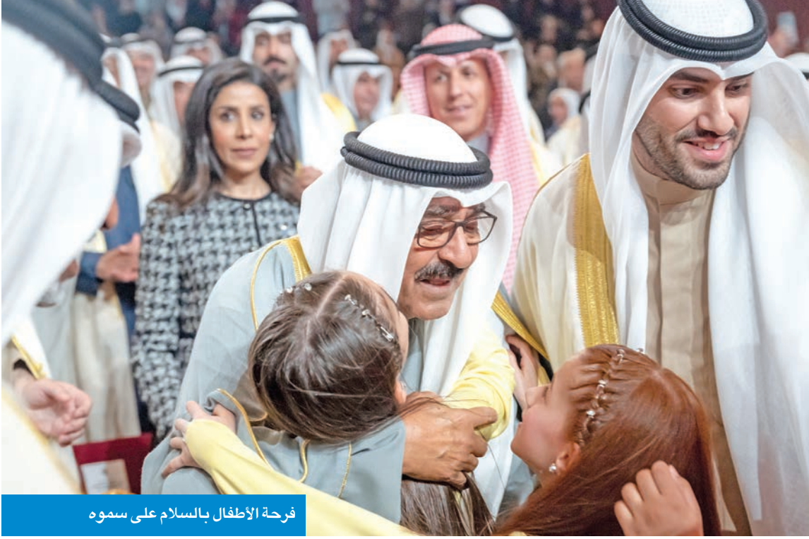
فرحة الأطفال بالسلام على سموه

بحضور ولي العهد ورئيس مجلس الوزراء وكبار المسؤولين في الدولة