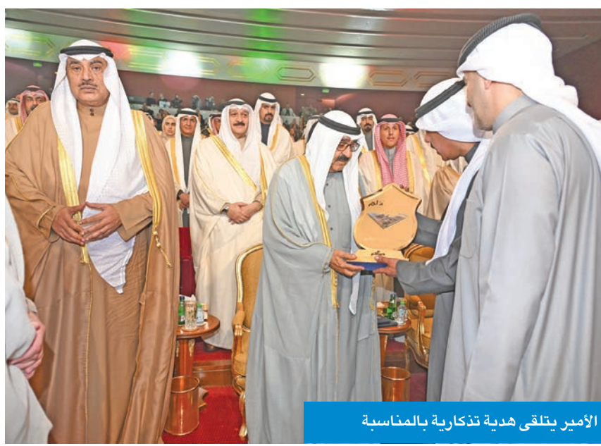
الأمير يتلقى هدية تذكارية بالمناسبة

تحت رعاية وحضور سمو أمير البلاد الشيخ مشعل الأحمد، أقيم صباح أمس، حفل الأوبريت الوطني «ديرة الخير» على مسرح قصر بيان. ووصل سموه إلى مكان الحفل حيث استقبل بكل حفاوة وترحيب من وزير الدولة لشؤون الاتصالات وتكنولوجيا المعلومات وزير الإعلام والثقافة بالوكالة عمر العمر، ووزير التربية سيد جلال الطبطبائي، ورئيسة مركز العمل التطوعي عضوة اللجنة الدائمة للاحتفال بالأعياد والمناسبات الوطنية الشبيخة أمثال الأحمد. وشهد الحفل سمو ولي العهد الشيخ صباح الخالد، ورئيس مجلس الوزراء سمو الشيخ أحمد العبدالله، وكبار المسؤولين بالدولة واستهل الحفل بالسلام الوطني، وبعده بدأ الأوبريت الوطني، حيث قدمت مجموعات من طلاب وطالبات المراحل الدراسية المختلفة من مدارس وزارة التربية لوحات فنية متنوعة عكست مشاعر حب الوطن والانتماء والولاء له، كما جسدت معاني «ديرة الخير» بما يحمله وطننا الغالي من عطاء متواصل، واحتضان لأبنائه، وقدرته على تجاوز التحديات عبر مختلف الأزمان، وما يميزه من حكمة قيادته وتلاحم شعبه. وتم تقديم هدية تذكارية إلى صاحب السمو بهذه المناسبة، وقد غادر سموه مكان الحفل بمثل ما استقبل به من حفاوة وترحيب.