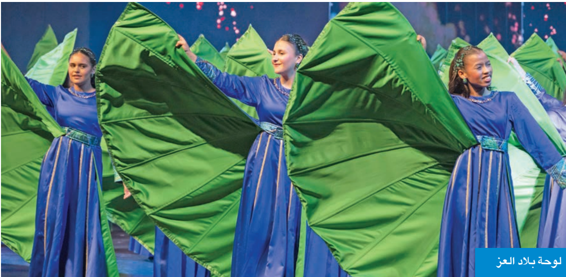
لوحة بلاد العز

تحت رعاية وحضور سمو أمير البلاد الشيخ مشعل الأحمد، أقيم صباح أمس، حفل الأوبريت الوطني «ديرة الخير» على مسرح قصر بيان. ووصل سموه إلى مكان الحفل حيث استقبل بكل حفاوة وترحيب من وزير الدولة لشؤون الاتصالات وتكنولوجيا المعلومات وزير الإعلام والثقافة بالوكالة عمر العمر، ووزير التربية سيد جلال الطبطبائي، ورئيسة مركز العمل التطوعي عضوة اللجنة الدائمة للاحتفال بالأعياد والمناسبات الوطنية الشبيخة أمثال الأحمد. وشهد الحفل سمو ولي العهد الشيخ صباح الخالد، ورئيس مجلس الوزراء سمو الشيخ أحمد العبدالله، وكبار المسؤولين بالدولة واستهل الحفل بالسلام الوطني، وبعده بدأ الأوبريت الوطني، حيث قدمت مجموعات من طلاب وطالبات المراحل الدراسية المختلفة من مدارس وزارة التربية لوحات فنية متنوعة عكست مشاعر حب الوطن والانتماء والولاء له، كما جسدت معاني «ديرة الخير» بما يحمله وطننا الغالي من عطاء متواصل، واحتضان لأبنائه، وقدرته على تجاوز التحديات عبر مختلف الأزمان، وما يميزه من حكمة قيادته وتلاحم شعبه. وتم تقديم هدية تذكارية إلى صاحب السمو بهذه المناسبة، وقد غادر سموه مكان الحفل بمثل ما استقبل به من حفاوة وترحيب.