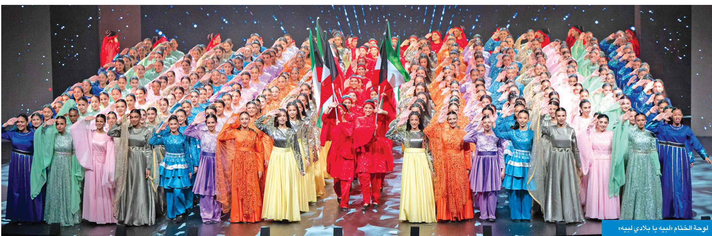
لوحة الختام «لبيه يا بلادي لبيه»