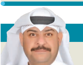
د. سلطان السالم

أعتقد أنه يجب إلزاماً أن يتم توضيح الواضحات رغم أنها تعتبر من أشكال المشكلات وفي هذا الوقت (تحدّداً) من بعد إعلان التشكيل الوزاري الجديد المحدث في الدولة، لن أتطرق لأسماء وشخص الوزراء الجدد (ولا القدامى) لأن التشكيل الوزاري يُجب ما قبله، فتتم محاسبة الوزير على منصبه سياسياً منذ تقلده المنصب. هذا أمر بحد ذاته مهم، فوجب أن يوضع في نصابه الصحيح حقاً. لا تتم محاسبة الوزير على ماضٍ كان، فمُنصبه سياسياً وأخلاقياً الآن يجب ما قبله، وإن كان له ما له وعليه ما عليه تتم محاسبته بصفتة في حينها على أعماله السابقة ومنصبه السابقة إن كان قد تقلّد شيئاً هكذا. وعليه ليس من المنطق في شيء أن أحاسب زيدا من الناس على رأي أو حتى تغريدة كتبت في سياق ومزاج ووقت مضى ووجهة نظر شخصية، وإن أضع الأمر برمته في ميزان الأعمال التي وجب للوزير أو أي شخص بمنصب عام أن يبدأ في القيام بها، تتم محاسبة الرأي على منصبه وأعماله منذ تقلده أعمال المنصب. وأعتقد أن كتبة الدساتير والفقهاء الدستوريين والقانونيين لهم وجهة نظر مشابهة، بحثت وضعت ذات المسألة في ذات السياق حين وجب محاسبة الوزراء على أعمالهم في ذات التشكيل بعينه لا السابق ولا الأسبق.