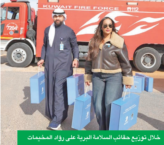
خلال توزيع حقائب السلامة البرية على رواد المخيمات