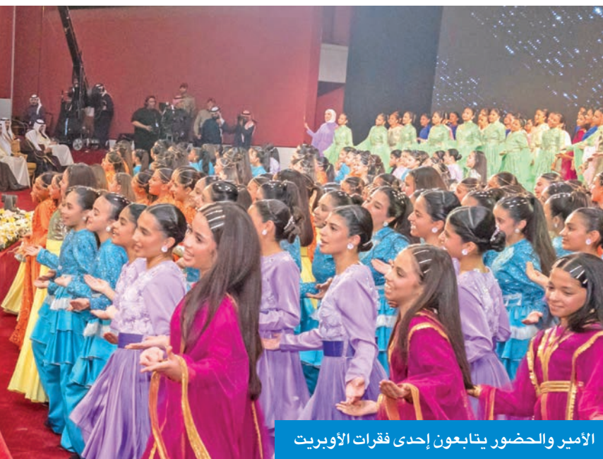
الأمير والحضور يتابعون إحدى فقرات الأوبريت