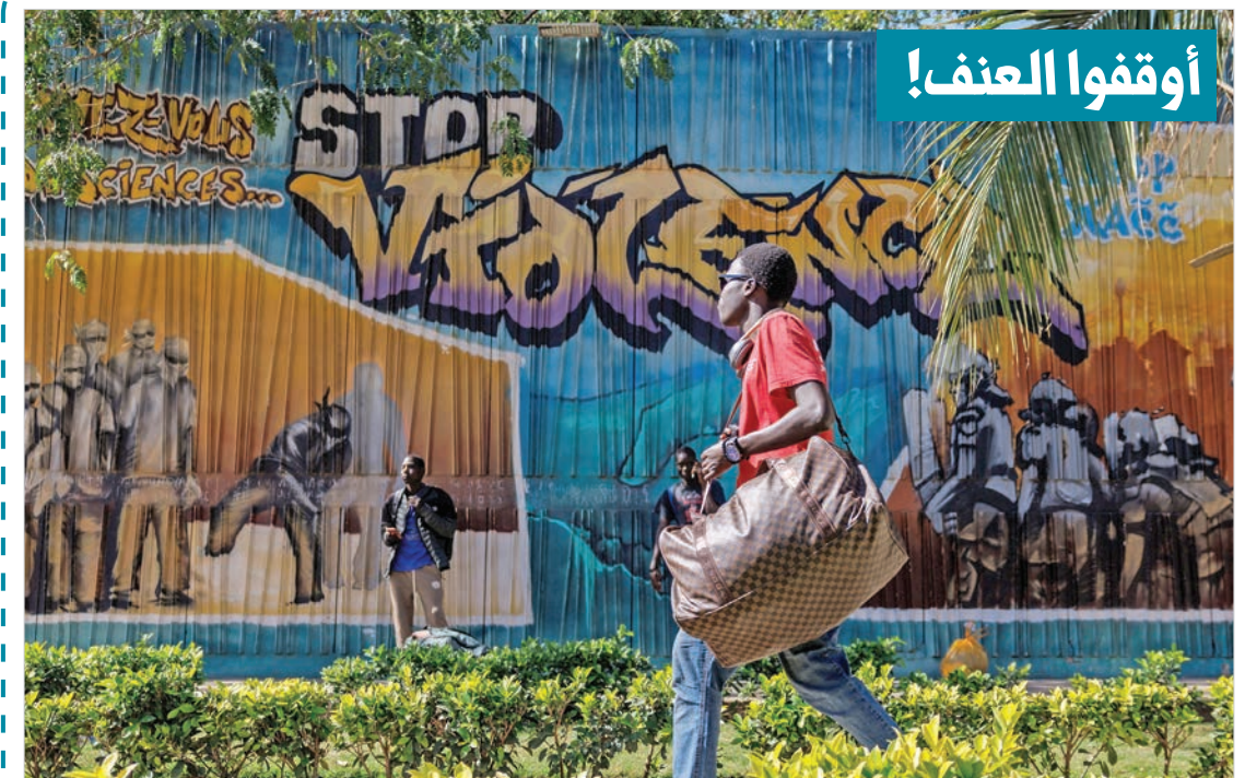
طالب يحمل حقيبة تحوي أغراضه الشخصية أثناء مروره بجوار جدارية كُتِب عليها «أوقفوا العنف» خارج حرم جامعة الشيخ أنثا ديوب، في دأكار عاصمة السنغال التي أغلقت حتى إشعار آخر بعد اشتباكات مع قوات الأمن أسفرت عن مقتل طالب خلال احتجاجات طالب فيها المتظاهرون بمنح دراسية ودعم آخر