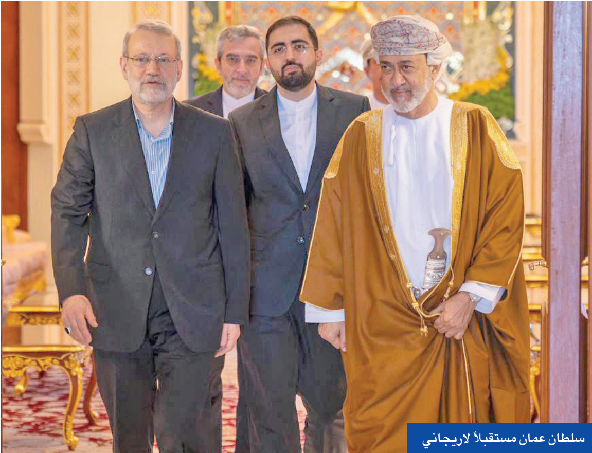
سلطان عمان مستقبلاً لاريجاني