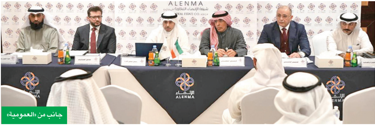
جانب من «العمومية»

وأفادت الشركة بأن صافي الأرباح لعام 2025 بلغ 2.064.903 دينار، وبلغ إجمالي حقوق المساهمين 36.336.893 دينار، مقارنة 44.243.300 دينار لعام 2024، كما حققت الشركة أرباحاً من العمليات التشغيلية 1.231.515 دينار مقارنة بأرباح 2.149.455 دينار في العام السابق. وأوضح أن مطلوبات الشركة بلغت 16.463.081 دينار، مقارنة بـ 12.725.757 دينار في العام السابق، وارتفعت ربحية السهم إلى 5.89 فلس مقارنة بـ 4.47 فلس في العام السابق، ووافقت «العمومية» على توزيع أرباح نقدية بواقع 5 في المئة من قيمة السهم الاسمية (5 فلس لكل سهم) بمبلغ إجمالي 1.752.673.400 دينار عن السنة المالية المنتهية في 31 أكتوبر 2025.