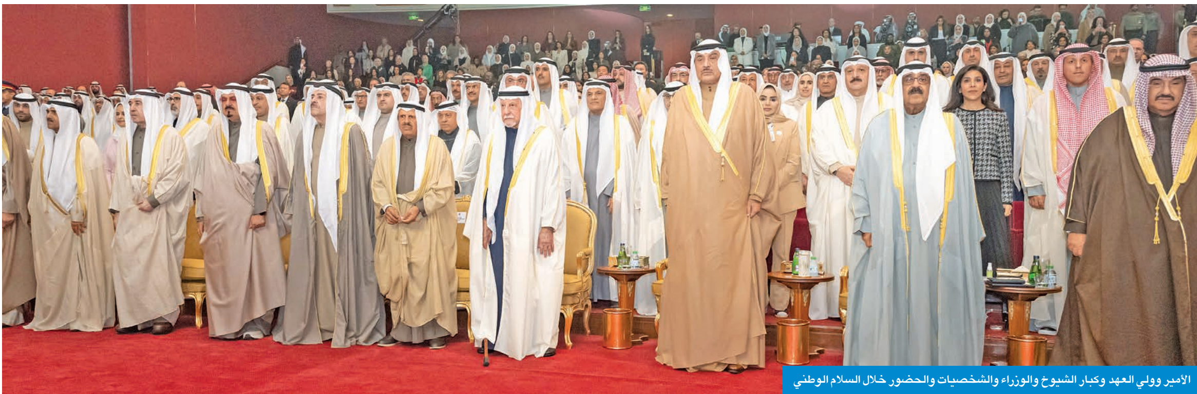
الأمير وولي العهد وكبار الشيوخ والوزراء والشخصيات والحضور خلال السلام الوطني