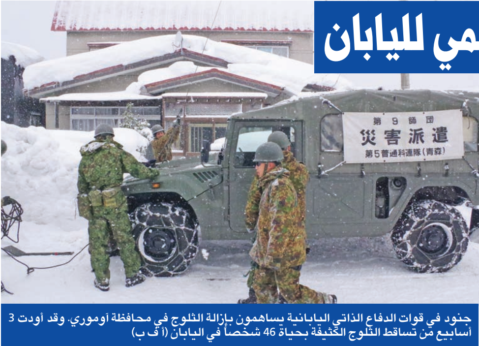
جنود في قوات الدفاع الذاتي اليابانية يساهمون بإزالة الثلوج في محافظة أوموري، وقد أودت 3 أسابيع من تساقط الثلوج الكثيفة بحياة 46 شخصاً في اليابان