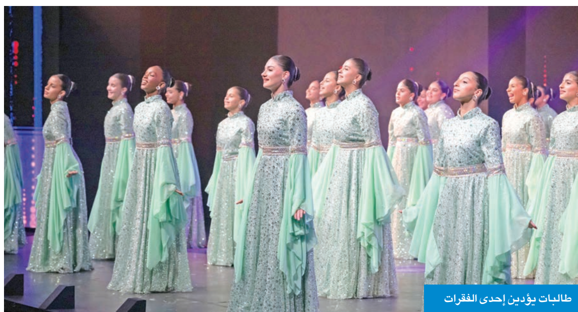
طالبات يؤدين إحدى الفقرات