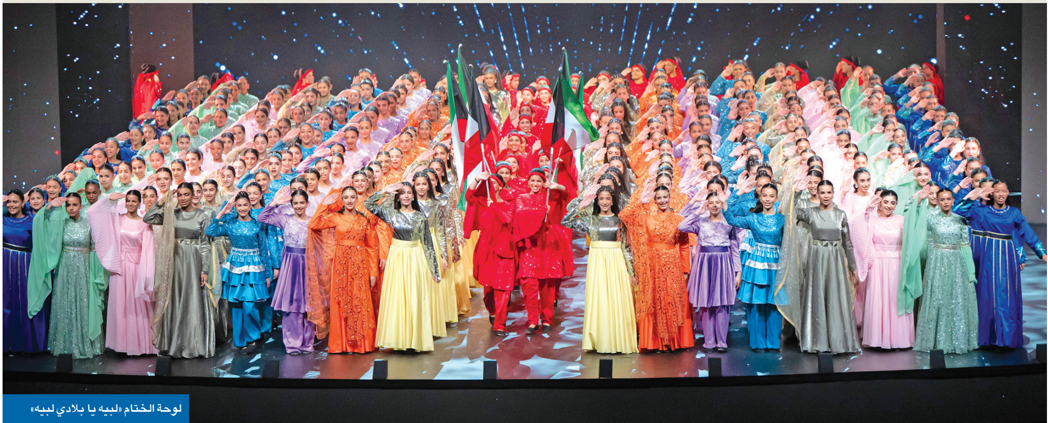
لوحة الختام «لبيه يا بلادي لبيه»

«الأهلي»: تنفيذ مدروس للخطط واقتناص الفرص الإقليمية والعالمية