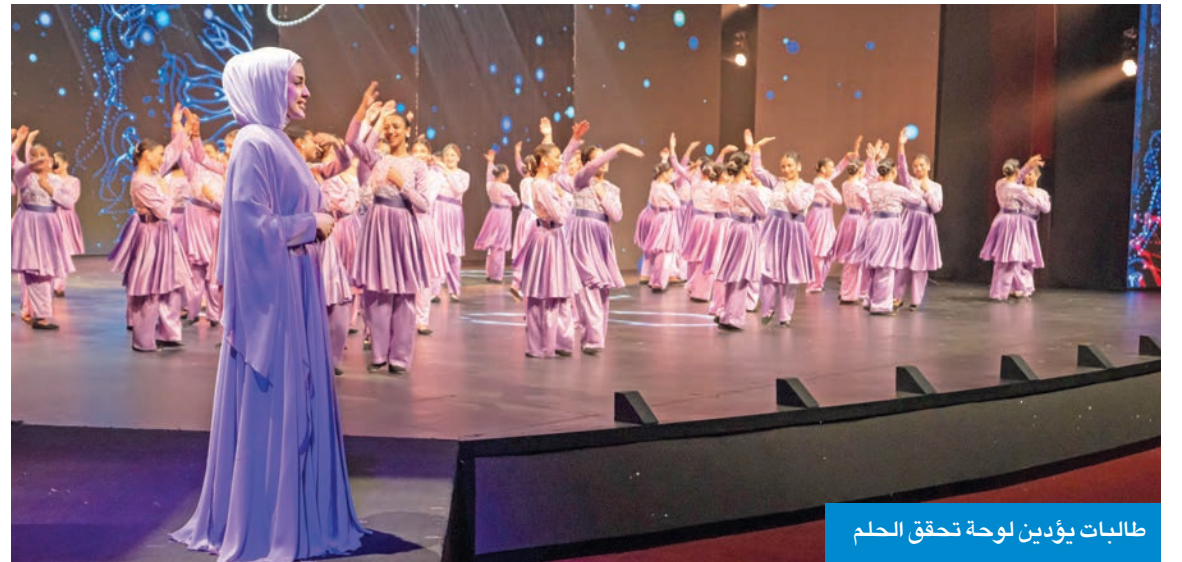
طالبات يؤديين لوحة تحقق الحلم