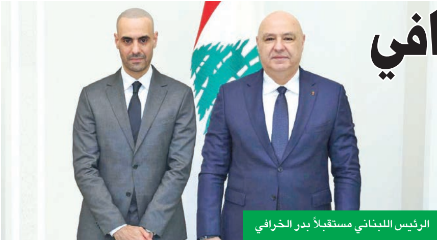
الرئيس اللبناني مستقبل بدر الخرافي

الفرص الاستثمارية المتاحة في لبنان بمختلف، ولاسيما في قطاع الاتصالات.