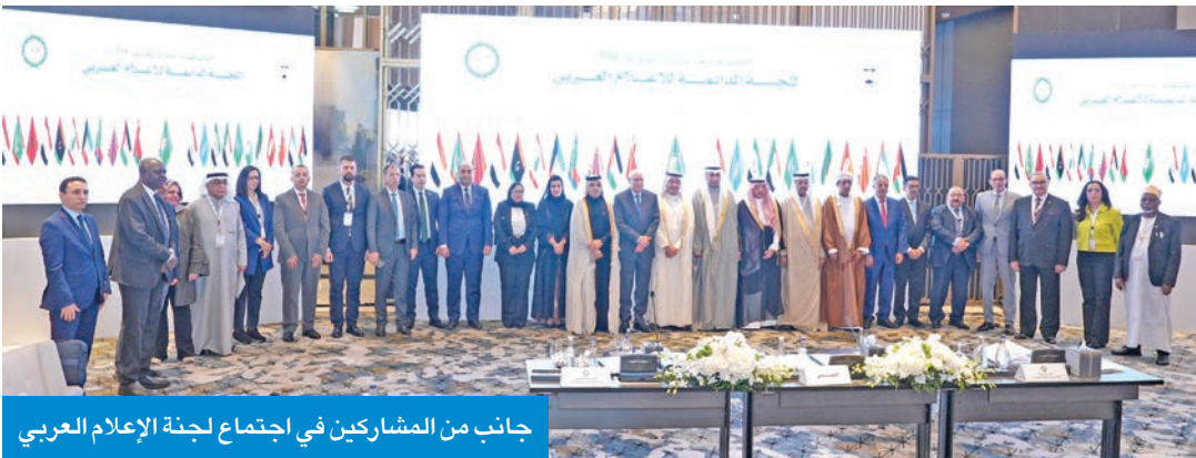
جانب من المشاركين في اجتماع لجنة الإعلام العربي