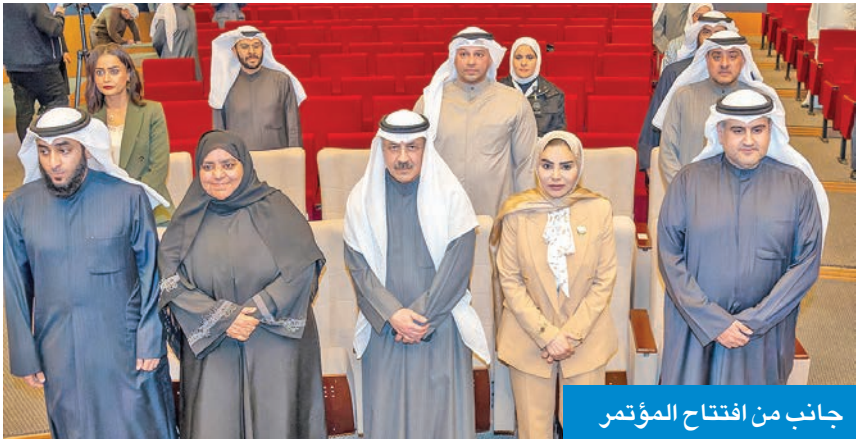
جانب من افتتاح المؤتمر

وأوضح أن وزارة العدل تعمل حالياً بتعاون وتكامل مع الجهات المعنية على حزمة قوانين مترابطة تخدم الأسرة والطفل لتحقيق العدالة وضون كيان الأسرة ومعالجة النزاعات بحلول منصفة قبل أن تتفاقم الخلافات، مستدرِكاً: «لكننا في الوقت نفسه أدركنا أن القانون وحده لا يكفي، فلذلك نعمل على وضع آليات قضاء الأسرة وتسريع الإجراءات وتبسيط الوصول إلى الحقوق وحماية الأطفال من آثار النزاعات الطفولية.