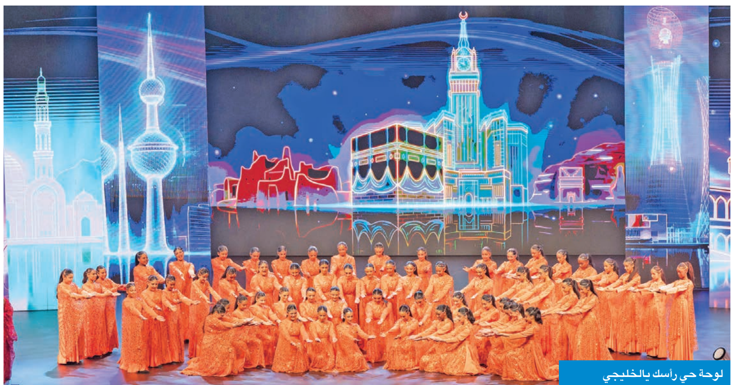
لوحة حي راسك بالخليجي