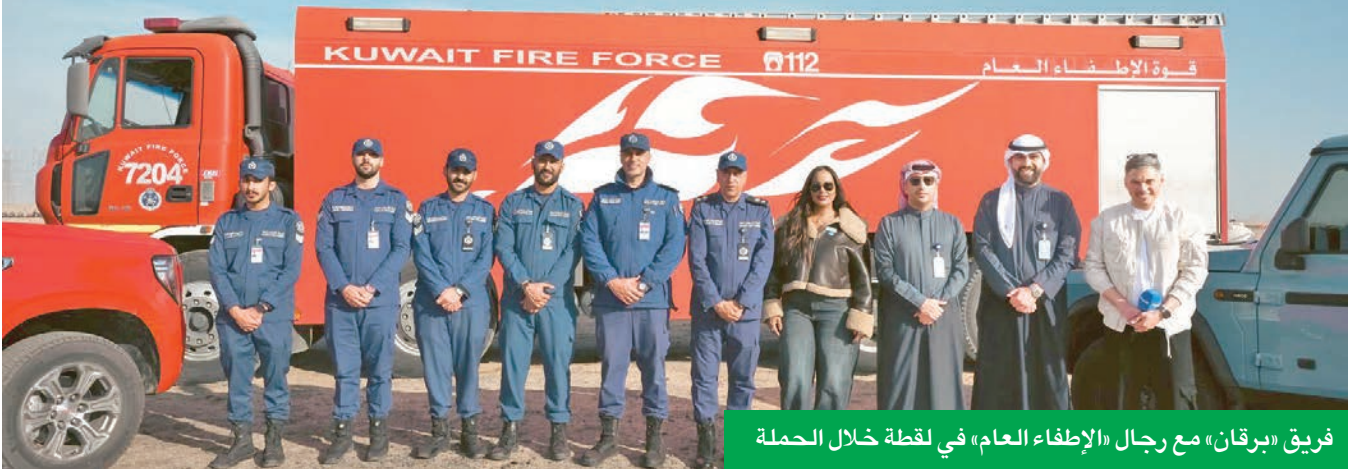
فريق «برقان» مع رجال «الإطفاء العام» في لقطة خلال الحملة

وبطانية حريق، ومطفأة حريق، إلى جانب مواد توعية بإرشادات السلامة. وتحتوي الحقائب كذلك على مطبوعات حملة «لنكن على دراية»