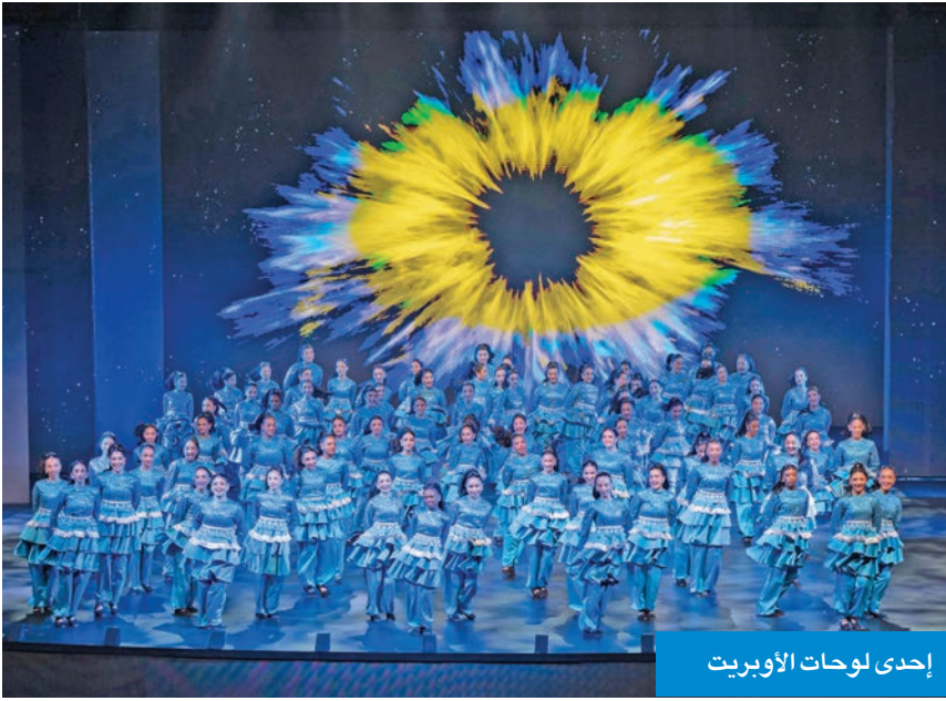
إحدى لوحات الأوبريت