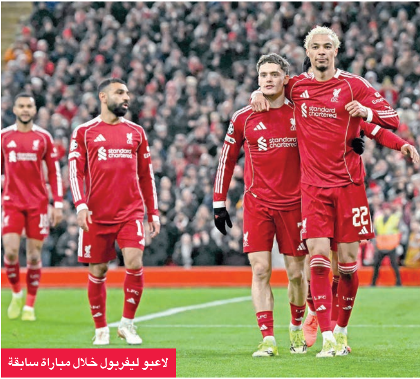
لاعبو ليفربول خلال مباراة سابقة

الديار أمام سندرلاند. وعلى الأسوأ قد يكون في الطريق للمدرب سلوت، في رحلته إلى ديسمبر، ولديه ثلاثة أهداف فقط في آخر 13 مباراة. ويواصل رجال غوارديولا وميواصل على ثلاث جبهات، حيث سيخوضون مواجهة مع أرسنال في نهائي كأس الرابطة الشهر المقبل، وتأملوا إلى دور الـ 16 من دوري أبطال أوروبا، ويلعبون أمام سالفورد من الدرجة الرابعة في الدور الرابع من كأس الاتحاد المحلية.