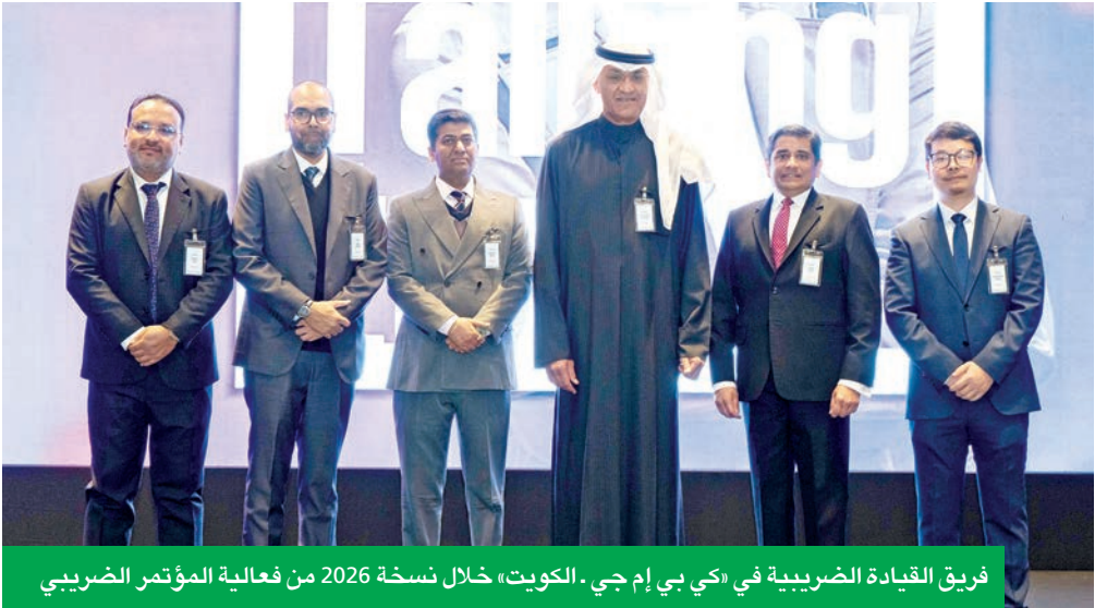
فريق القيادة الضريبية في «كي بي إم جي. الكويت» خلال نسخة 2026 من فعالية المؤتمر الضريبي