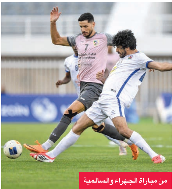
من مباراة الجهراء والسالمية

فاز الفريق الأول لكرة القدم بنادي السالمية على مضيفه الجهراء بهدف من دون رد، في المباراة التي جمعتهما أمس على استاد مبارك العيار، ضمن منافسات الجولة الثالثة عشرة لدوري زين الممتاز.