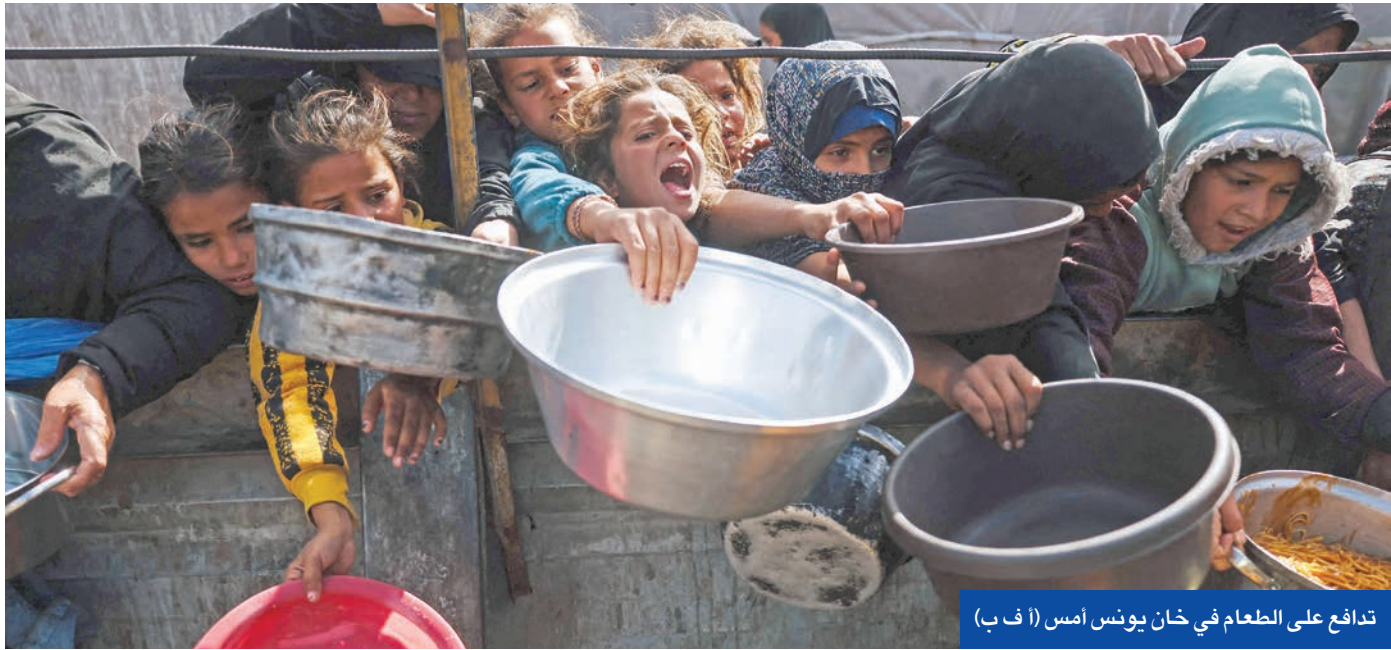
تدافع على الطعام في خان يونس أمس

ووفق المصادر، فإن الخطة التي طُرحت في منتدى دافوس الاقتصادي العالمي، وتمتد لنحو 100 يوم، تشمل تدعيم البنية العسكرية والأمنية والمنشآت التابعة لـ«حماس»، مع ترتيبات أمنية بإشراف دولي، وإمكانية منح عفو مشروط لعناصر تدخلت يوماً المقبلة بنصب فقط على إطلاق النار الإسرائيلية، على أن يشرف مراقبون دوليون مستقلون على التنفيذ.