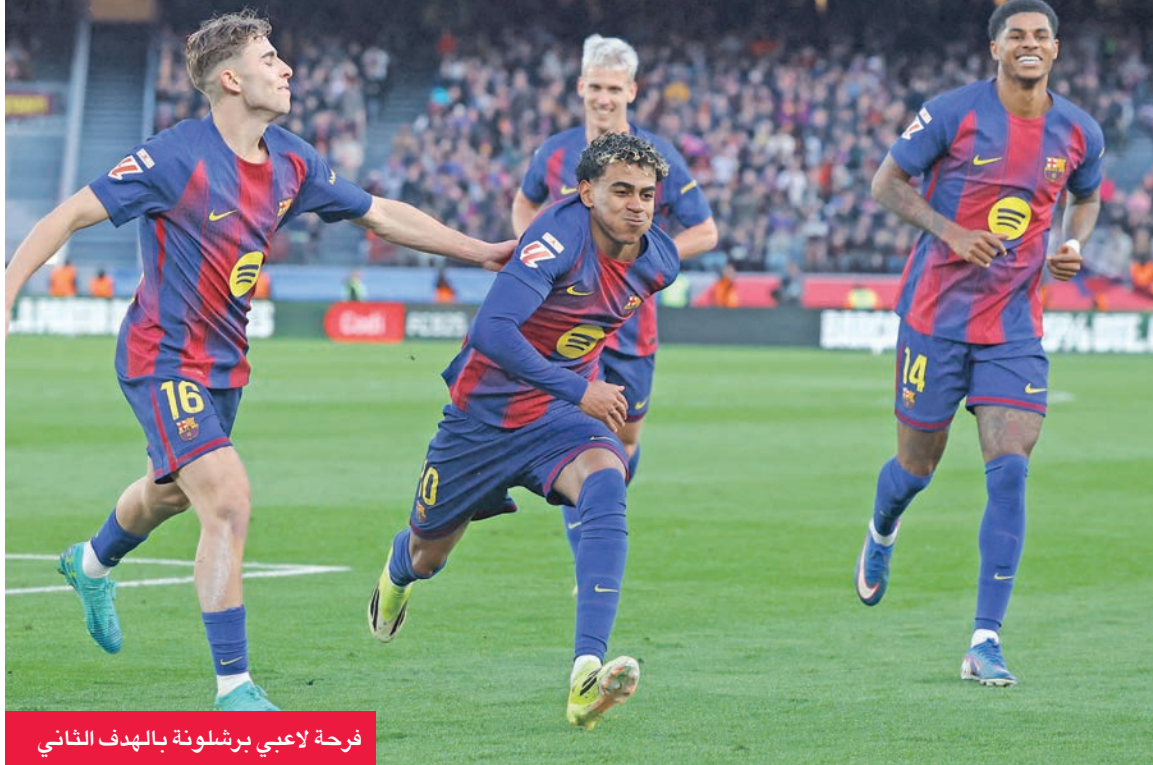
فرحة لاعبي برشلونة بالهدف الثاني

حافظ برشلونة على صدارته لترتيب الدوري الإسباني لكرة القدم، وذلك بعد فوزه على ضيفه ريال مايوركا 3-صفر، أمس ضمن منافسات الجولة 23 من المسابقة.