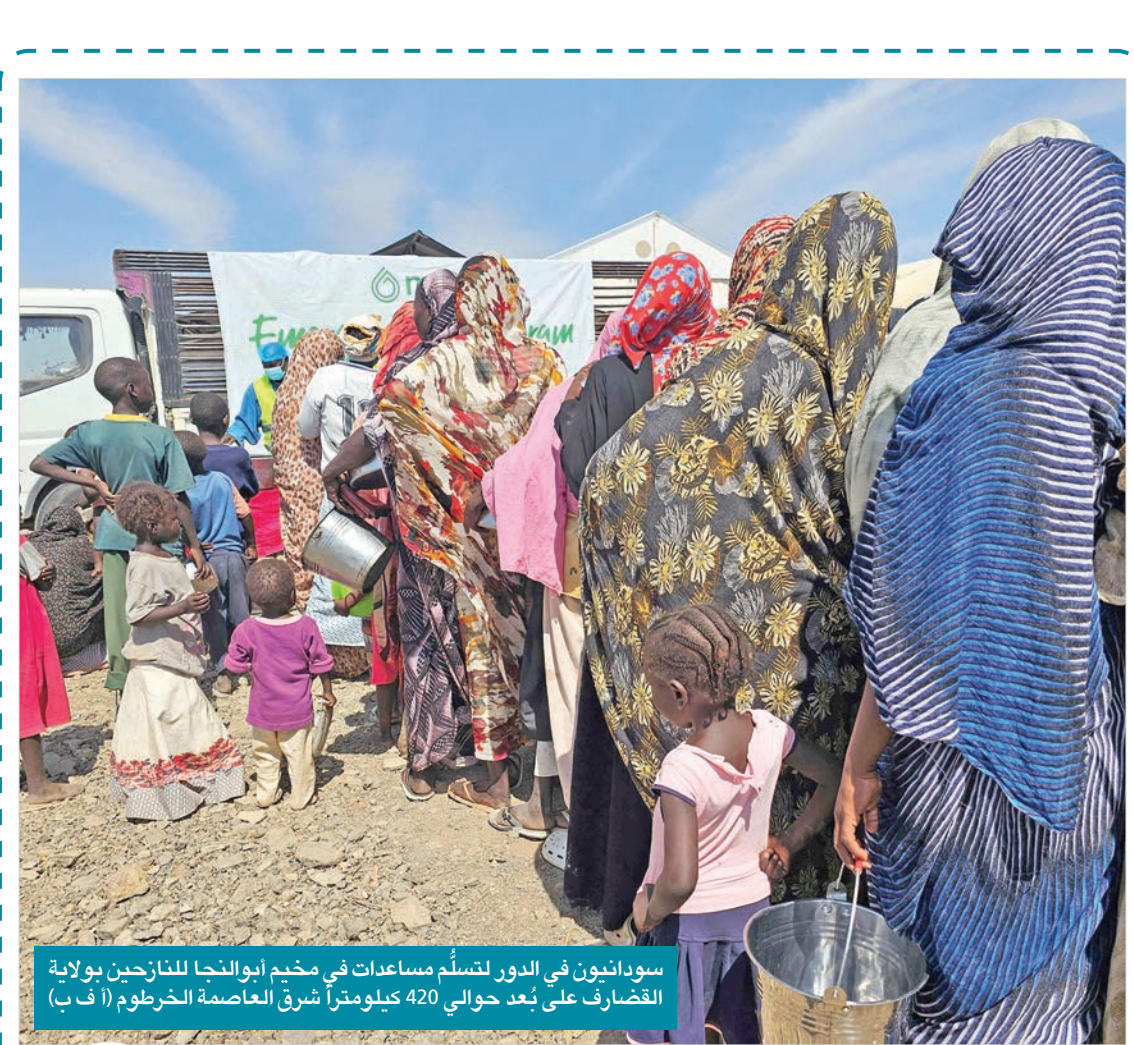
سودانيون في الدور لتسلّم مساعدات في مخيم ابوالنجا للنازحين بولاية القضايرف على بُعد حوالي 420 كيلومتراً شرق العاصمة الخرطوم

ويقول د. عاطف العضبيات إن المثقف المغترب، وهو حال الكثير من مثقفي العالم العربي، يشعر بعجزه وعدم انتمائه، وهو مثقف مشلول الإرادة. وشعور أغلبية المثقفين العرب الطاع