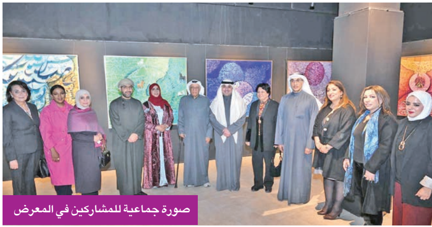
صورة جماعية للمشاركين في المعرض

وأشار إلى أن المعرض يتزامن مع احتتام فعالية «الكويت