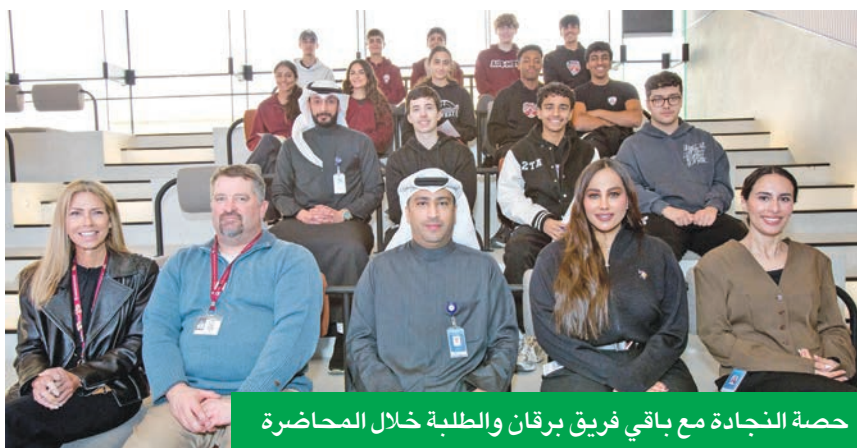
حصة النجادة مع باقي فريق برقان والطلبة خلال المحاضرة

أكثر الطرق أماناً لاستخدامها، كما تضمنت رفع مستوى الوعي بأساليب الاحتيال، وسبل الوقاية منها والتعامل الواعي معها. ويحرص بنك برقان على التواجد الفعال لدعم الطلبة وجيل الشباب في كل فرصة مستغلة، ويتجسد ذلك من خلال استضافة الزيارات المدرسية والجامعية في مقره الرئيسي وفروعه، والمشاركة في أبرز معارض التوظيف، مثل معرض الاستدامة تجاه تمكين الشباب وتنظيمها الجامعة الأمريكية (AUK) وجامعة الشرق الأوسط الأميركية (AUM) وجامعة الخليج للعلوم والتكنولوجيا (GUST)، كما يدعم البنك المبادرات الهادفة إلى تمكين الشباب، ومن بينها «Academy X»، التي تعنى بتشجيع الشباب على التخصص في مجالات العلوم والتكنولوجيا والهندسة والرياضيات.