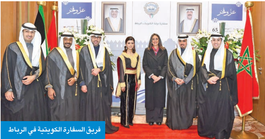
فريق السفارة الكويتية في الرباط