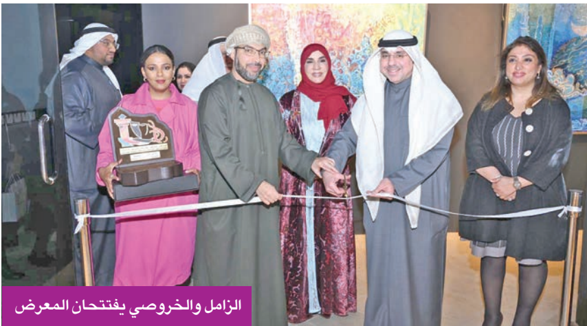
الزامل والخروصي يفتتحان المعرض

الزامل افتتح معرض «ترانيم الحروف» بحضور السفير العماني الخروصي