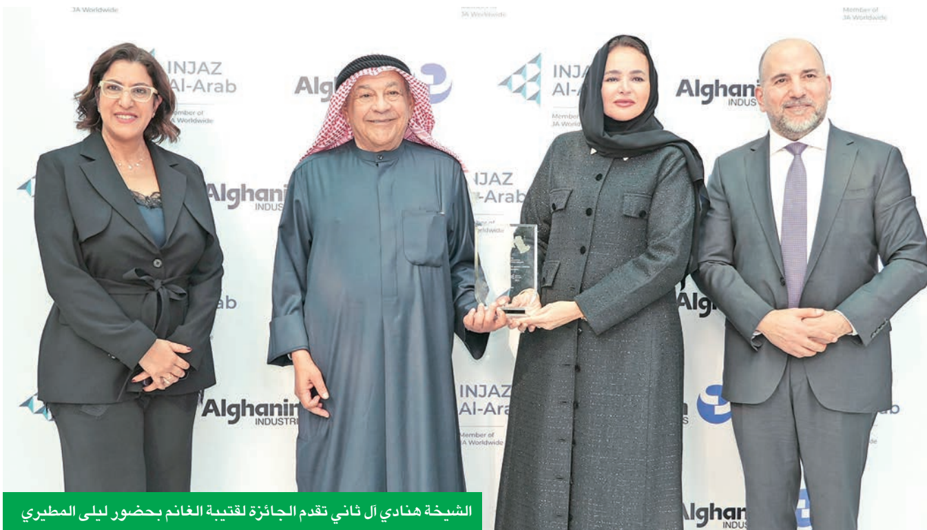
الشيخة هنادي آل ثاني تقدم الجائزة لقربية الغانم بحضور ليلي المطيري

الشيخة هنادي آل ثاني قدمت لقربية الغانم جائزة «الإرث والقيادة مدى الحياة» تقديراً لتعزيزه للشباب