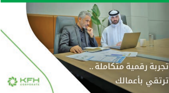
تجربة رقمية متكاملة... ترتقي بأعمالك

«بيت التمويل»: إقبال لافت على منصة eCorp للشركات