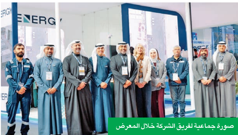
صورة جماعية لفريق الشركة خلال المعرض

خلال المشاركة في مؤتمر ومعرض الكويت للنفط والغاز (KOGS 2026)