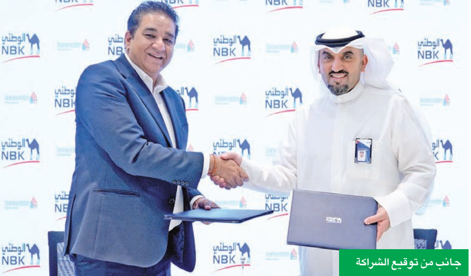
جانب من توقيع الشراكة

وتتسجم هذه الشراكة مع برنامج عروض خاص لدى بنك الكويت الوطني، وهو برنامج صمم لتقديم قيمة حقيقية للعملاء، من خلال مزايا عملية تنطلق من احتياجاتهم. ومن خلال إدراج هوم سنتر ضمن شبكة شركاء البرنامج، تتيج