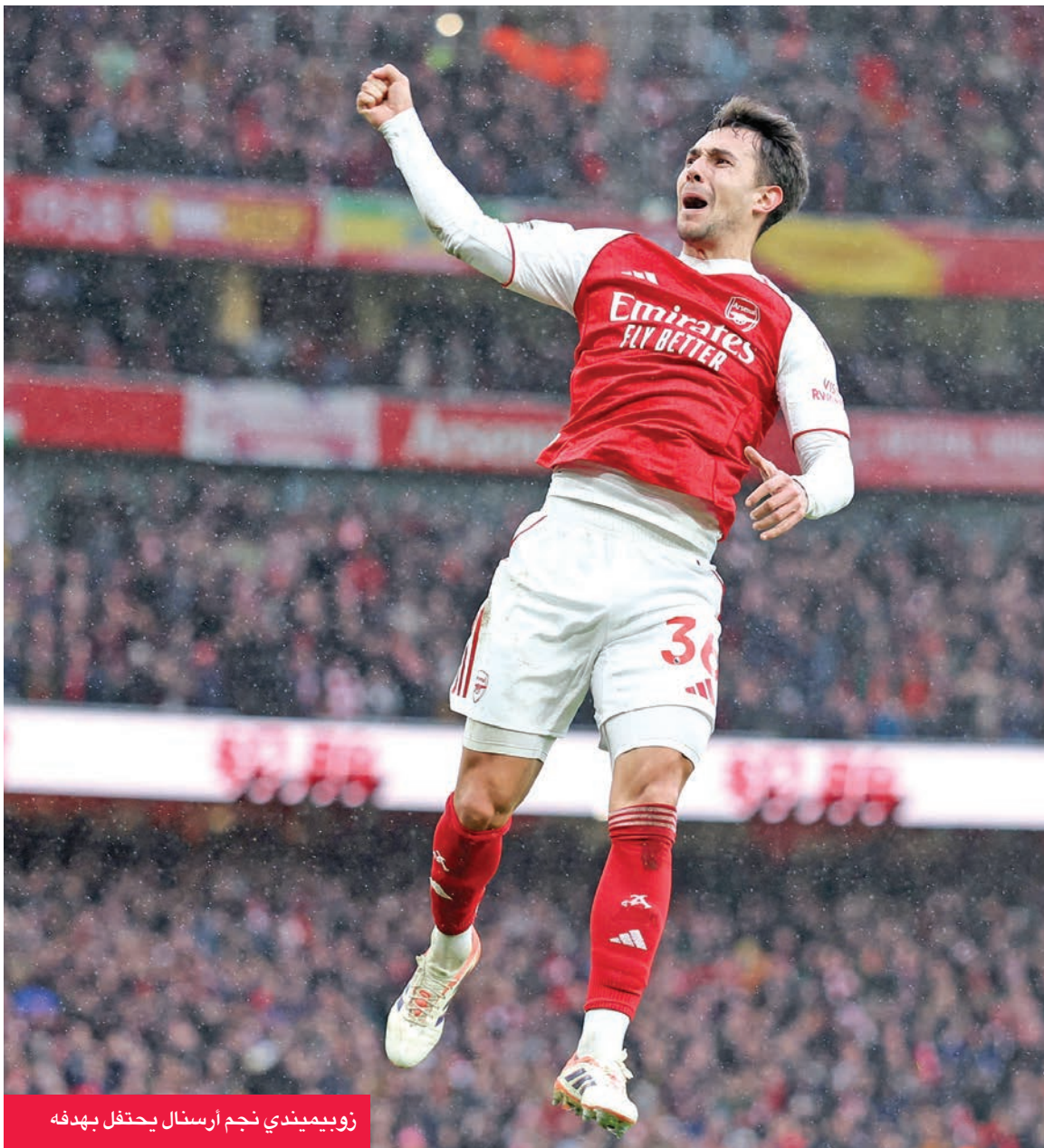
زويميندي نجم أرسنال يحتفل بهدفه

خبيرة أمل كبيرة من نتائج الفريق في الموسم الحالي، رغم الصعقات المدوية التي أربمها في فترة الانتقالات الصيفية الماضية.