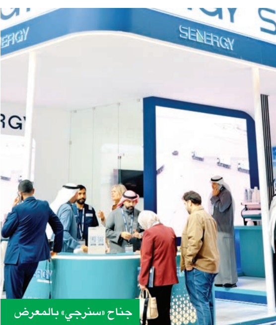
جناح «سنرجي» بالمعرض