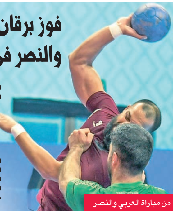
من مباراة العربي والنصر

وبذلك رفع برقان رصيده إلى 10 نقاط في المركز الثالث خلف الكويت المتصدر بـ 16 نقطة وكاظمة الثاني وله 11 نقطة والقادسية الرابع بفارق الأهداف عن العربي الذي ارتقى للمركز الخامس، ولكل منهما 8 نقاط وتراجع الصليبيخات للمركز السادس بـ 7 نقاط وظل السالمية في المركز السابع بـ 6 نقاط، والنصر في المركز الثامن والأخير بنقطتين.