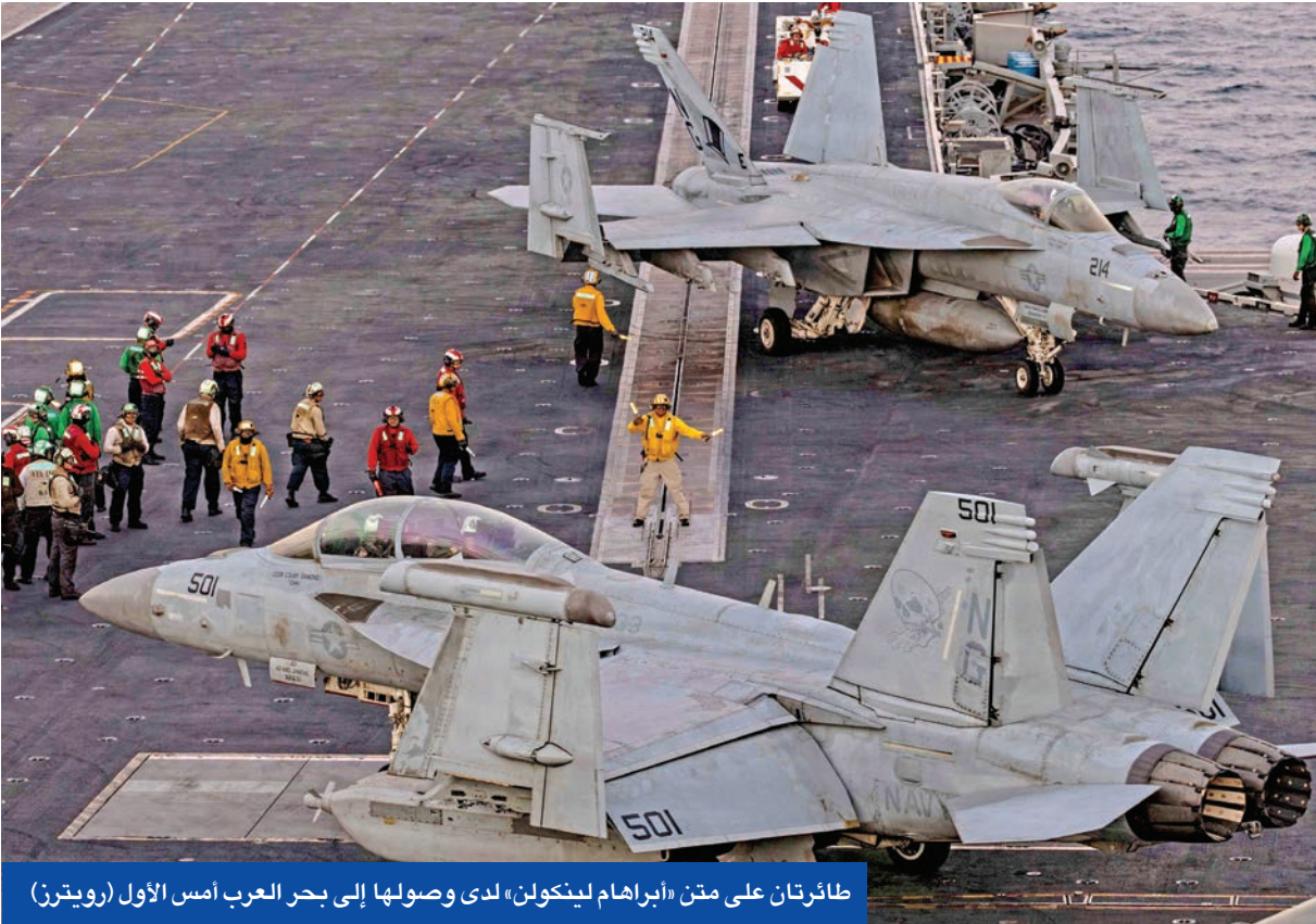
طائرتان على متن «إبراهيم لينكولن» لدى وصولها إلى بحر العرب أمس الأول

في المقابل، اقترحت واشنطن أن يتم تجسيد البرنامج النووي الإيراني بشكل شامل من أجل إجراء عملية جرد وتحقيق دولية بمشاركة أميركية تمهد لاحقاً لمنح طهران الحق في الحصول على برنامج ذري سلمي. وبينما ربط الوفد الأميركي احتمال نجاح التوصل إلى تسوية سلمية بقبول بحث ملفات تتعلق بأمن إسرائيل الإقليمي وفي مقدمتها التسليح الباليستي ودعم الجماعات المناهضة لها، شدد عراقجي على أن بحث تلك الأفكار مرهون بإنهاء احتلال الأراضي في فلسطين ولبنان.