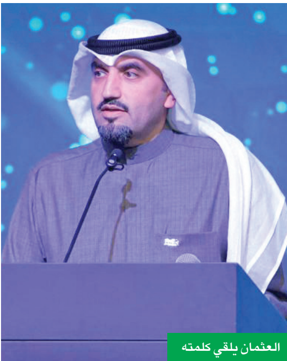
العثمان يلقي كلمته

من مجموعة الخدمات المصرفية الشخصية في حفل النخبة السنوي