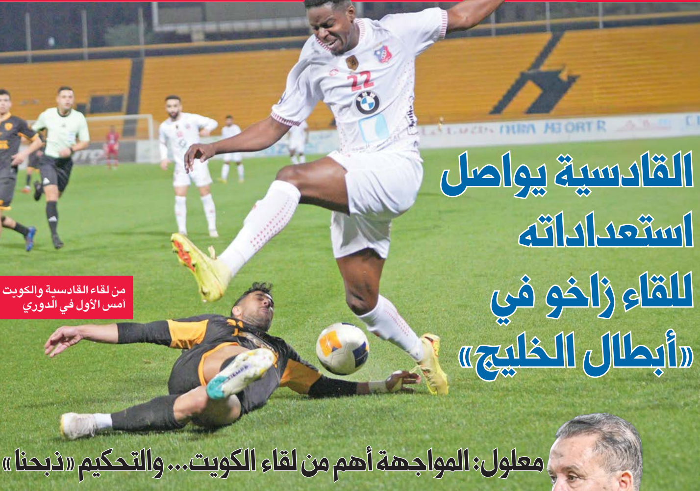
من لقاء القادسية والكويت أمس الأول في الدوري