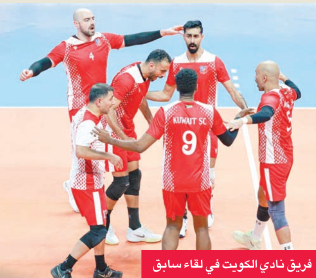
فريق نادي الكويت في لقاء سابق