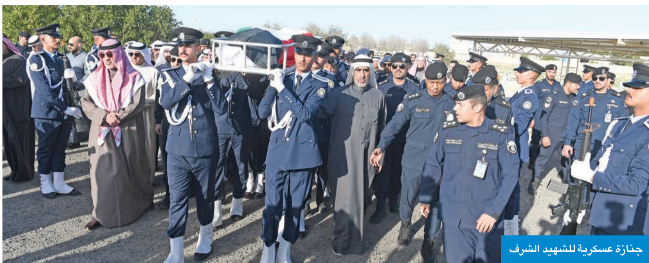
جنازة عسكرية للشهيد الشرف