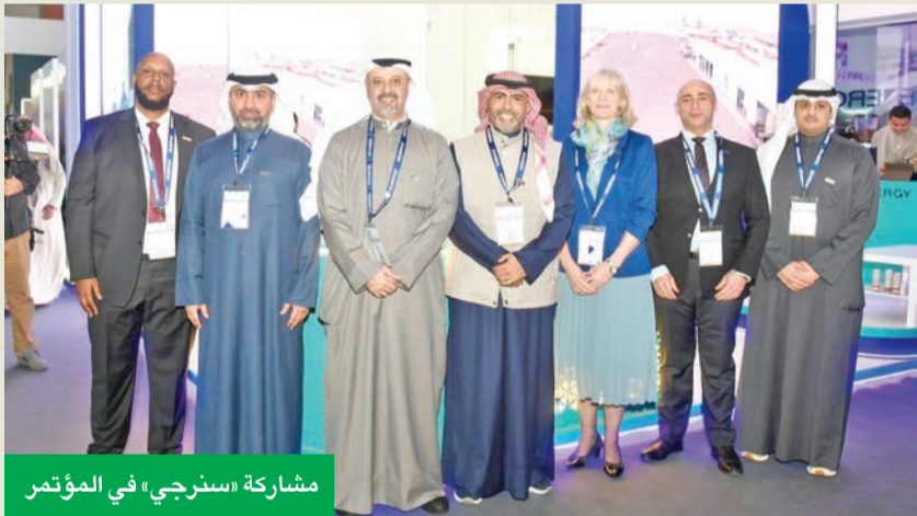
مشاركة «سنرجي» في المؤتمر

شاركت شركة سنرجي في فعاليات الدورة الخامسة من معرض ومؤتمر الكويت للنفط والغاز (KOGS)، الذي أقيم بحضور العديد من كبار المسؤولين في القطاع النفطي. وحضرت الشركة فعاليات المعرض بمشاركة قياداتها التنفيذية، في ظل وجود رسمي بارز من وزير النفط طارق الرومي، والرئيس التنفيذي لمؤسسة البترول الكويتية الشيخ نواف السعود، والرئيس التنفيذي لشركة نפט الكويت، أحمد العبدان، بالإضافة إلى أعضاء مجلس إدارة مؤسسة البترول الكويتية، وممثلي كبريات الشركات النفطية المحلية والدولية المشاركة.