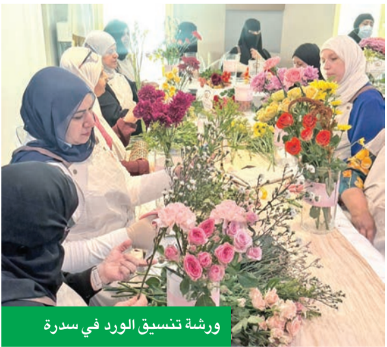
ورشة تنسيق الورد في سدره

المعرض خصومات خاصة على عدد من منتجات التأمين، إضافة إلى جوائز قيمة لموظفي القطاع النقطي.