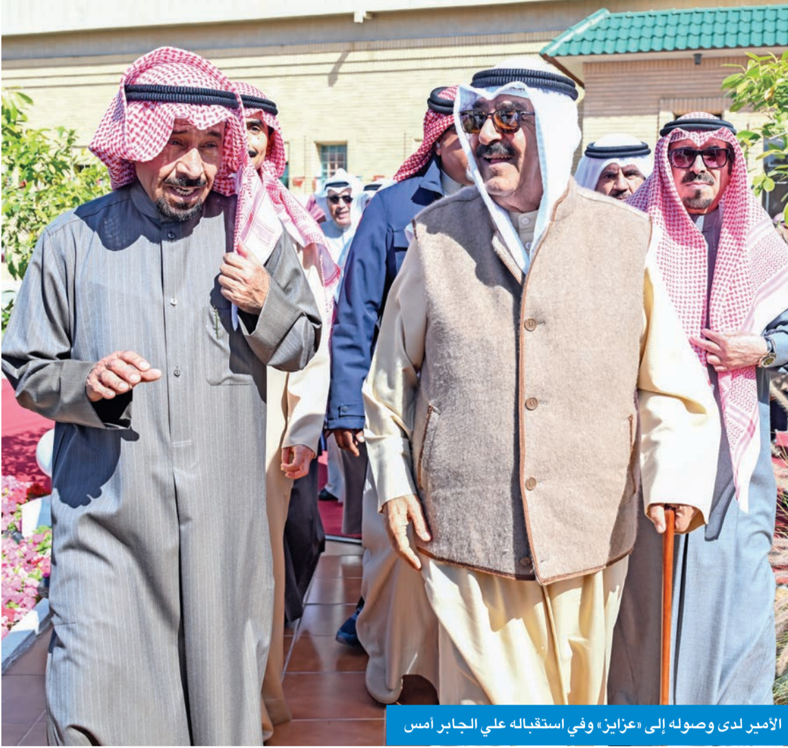
الأمير لدى وصوله إلى «عزايذ» وفي استقباله علي الجابر أمس