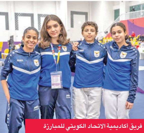
فريق أكاديمية الاتحاد الكويتي للمبارزة