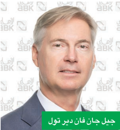
جيل جان فان دير تول