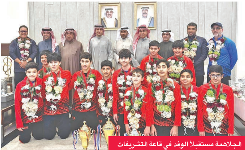
الجلاهمة مستقبلاً الوفد في قاعة التشريفات

عاد إلى البلاد وفد منتخب الكويت للاسكواش، عقب مشاركته في البطولة العربية الـ13 لفئتي تحت 13 و17 عاماً، والتي أقيمت في البحرين، محققاً ثمانية ميداليات متنوعة في مناسبات الفردي والفرق. وكان في استقبال البعثة وزير الدولة لشؤون الشباب طارق الجلاهمة في قاعة التشريفات بمطار الكويت، وذلك في أول استقبال رسمي له منذ توليه المنصب، حيث أعرب عن اعتزازه بالإنجاز الجديد، وحث اللاعبين على مواصلة الجهد، والالتزام في التدريبات، لتحقيق المزيد من النجاحات ورفع علم الكويت في المحافل الدولية.