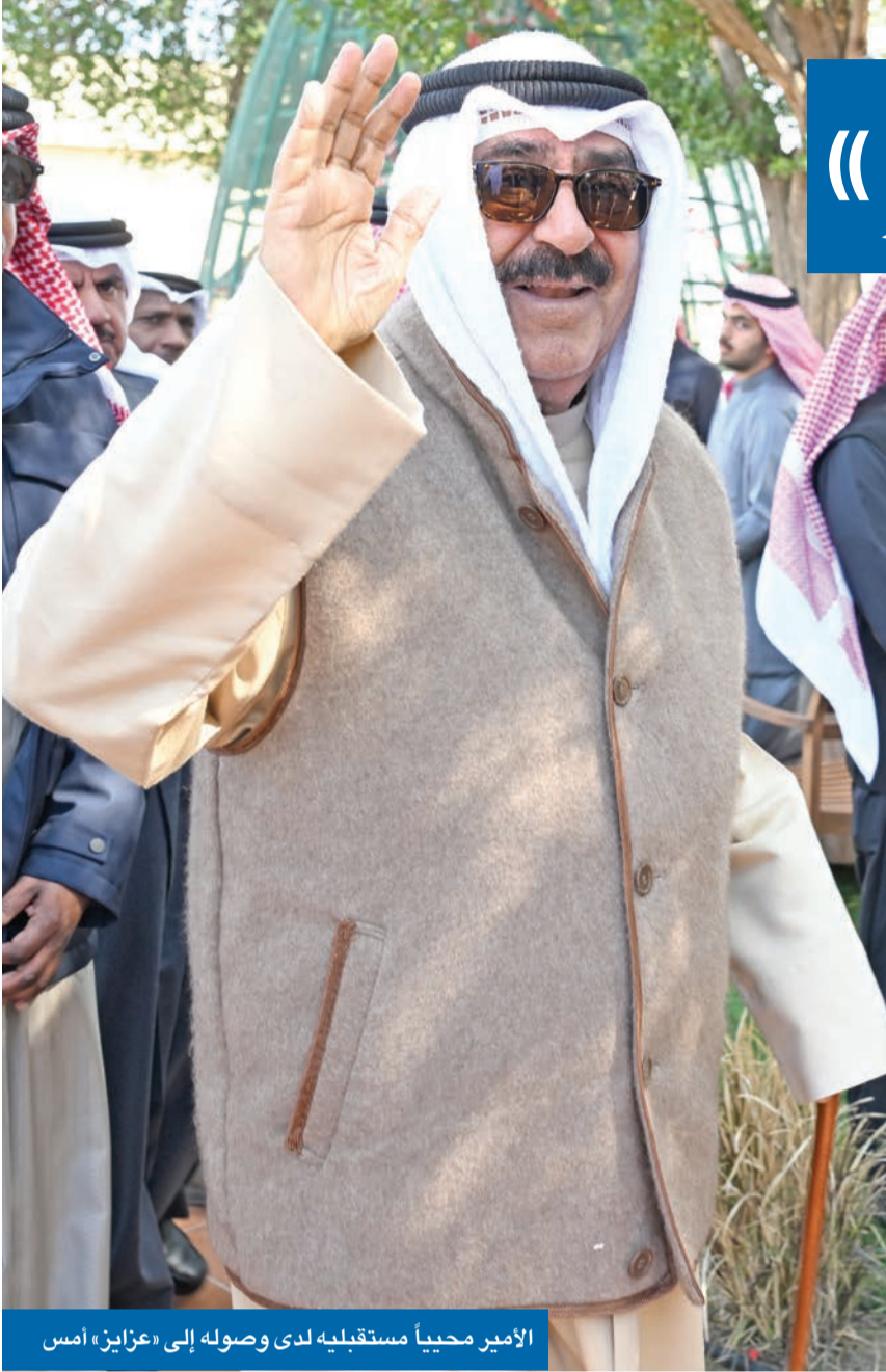
الأمير محيياً مستقبليه لدى وصوله إلى «عرايز» أمس