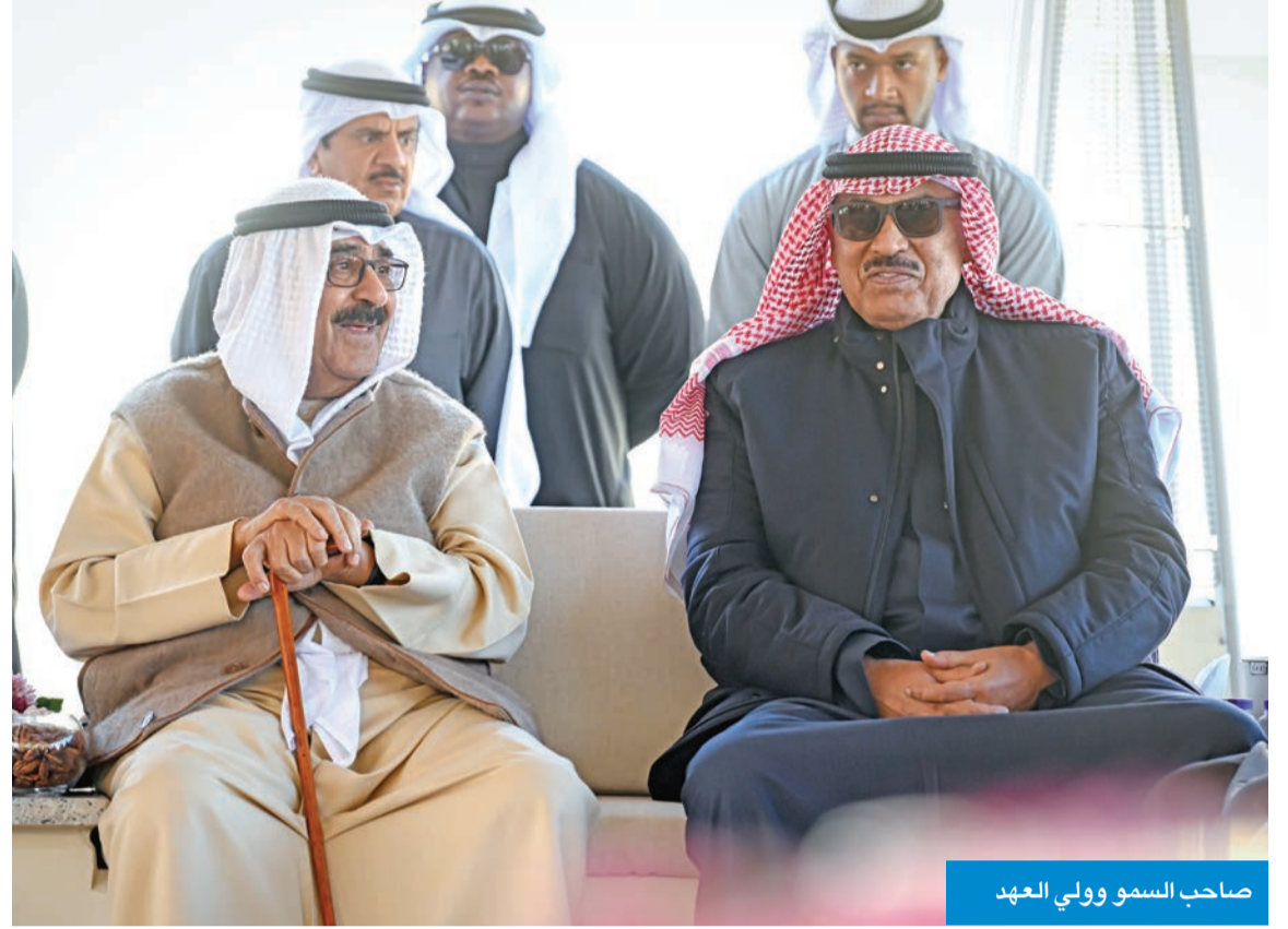
صاحب السمو وولي العهد