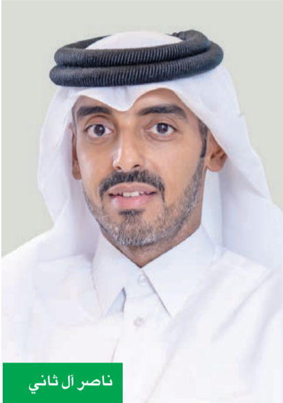
ناصر آل ثاني

Ooredoo – المالديف ارتفعت قاعدة عملاء Ooredoo المالديف 5% لسنة 2025 لتصل إلى 426 ألف عميل، وارتفعت الإيرادات 1% إلى 44 مليون دينار كويتي لسنة 2025، وارتفع الدخل قبل احتساب الفوائد والضرائب والإطفاء بنسبة 5% ليصل إلى 25 مليوناً لسنة 2025 مقارنة بـ 24 مليوناً لسنة 2024. Ooredoo فلسطين ارتفعت قاعدة عملاء Ooredoo فلسطين 4% لتصل إلى 1.5 مليون عميل، وانخفضت الإيرادات 3% إلى 33 مليون دينار كويتي لسنة 2025، فيما تحسن الدخل قبل احتساب الفوائد والضرائب والإطفاء بنسبة 2% إلى 13 مليون دينار لسنة 2025 مقارنة بـ 12 مليوناً لسنة 2024، واستمر الأداء في التأثير كثيراً بتداعيات النزاع في قطاع غزة والضفة الغربية. Ooredoo - فلسطين انخفضت قاعدة عملاء Ooredoo فلسطين 4% لتصل إلى 315 مليوناً لسنة 2025، وارتفعت الإيرادات بنسبة 16% إلى 278 مليون دينار كويتي، مقارنة بـ 239 مليوناً لسنة 2024، وارتفع الدخل قبل احتساب الفوائد والضرائب والإطفاء بنسبة 13% ليبلغ 61 مليوناً، مقارنة بـ 54 مليوناً لسنة 2024. Ooredoo – الجزائر ارتفعت قاعدة عملاء Ooredoo الجزائر 4%، لتصل إلى 315 مليوناً لسنة 2025، وارتفعت الإيرادات 16% إلى 278 مليون دينار كويتي، مقارنة بـ 239 مليوناً لسنة 2024، وارتفع الدخل قبل احتساب الفوائد والضرائب والإطفاء بنسبة 13% ليبلغ 61 مليوناً، مقارنة بـ 54 مليوناً لسنة 2024.