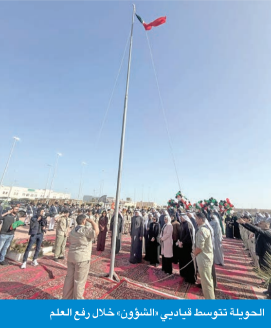
الحويلة تتوسط قياديي «الشؤون» خلال رفع العلم

واكدت مضي «الشؤون» في أداء رسالتها الوطنية والإنسانية ضمن رؤية الكويت، وعبر مبادرات وبرامج تعنى بتمكين الإنسان، ورعاية الأسرة، وحماية فئات المجتمع، وتعزيز التماسك الوجدان معنى الوطن، وتؤكد أن الانتماء ليس شعاراً يُرفع، بل التزام راسخ بقوالب الدولة، ولاء صادق لقيادتها.»