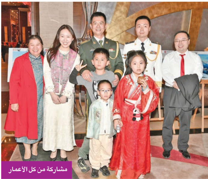
مشاركة من كل الأعمار