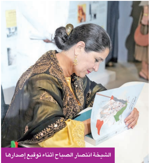
الشيخة انتصار الصباح أثناء توقيع إصدارها