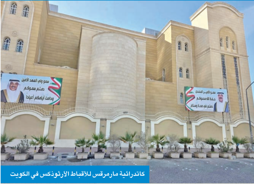
كاتدرائية مارمرقس للاقباط الأرثوذكس في الكويت