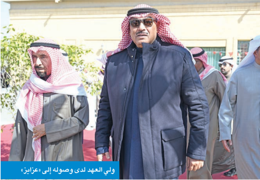
ولي العهد لدى وصوله إلى «عزايذ»