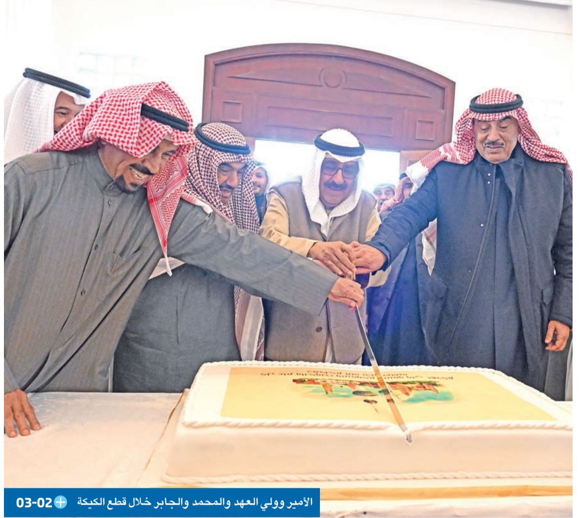
الأمير وولي العهد والمحمد والجابر خلال قطع الكيكة 03-02