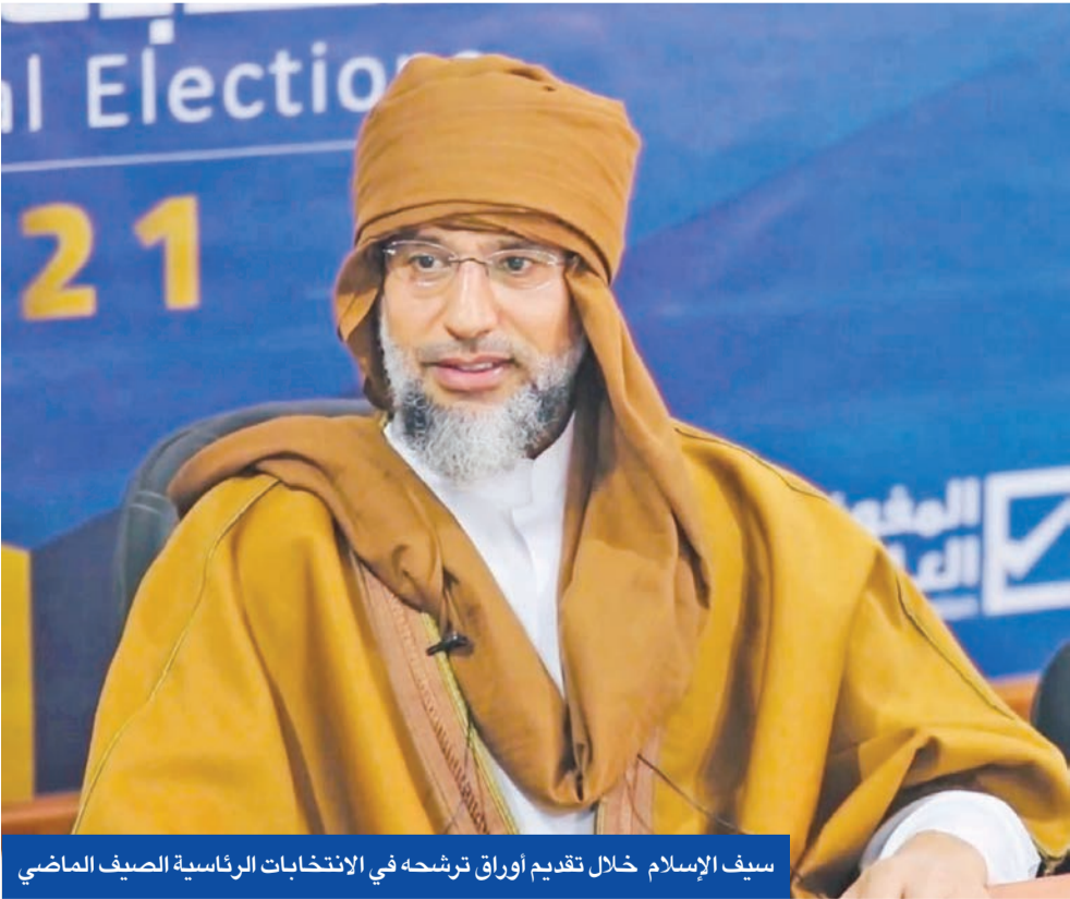
سيف الإسلام خلال تقديم أوراق ترشحه في الانتخابات الرئاسية الصيف الماضي

تقدأ كل شهر من الحساب ذاته، تُنقل جواً من نيويورك إلى بغداد. من ناحية، أكد المالكي في مقابلة تلفزيونية مع قناة «الشرقية» العراقية، مساء أمس الأول، أن قرار استمراره في الترشح أو الانسحاب يعود حصراً إلى «الإطار التنسيقي» الذي يضم القوى الشعبية، ويعد الكتلة الأكبر في البرلمان العراقي التي يعطيها الدستور حق ترشيح رئيس الوزراء.