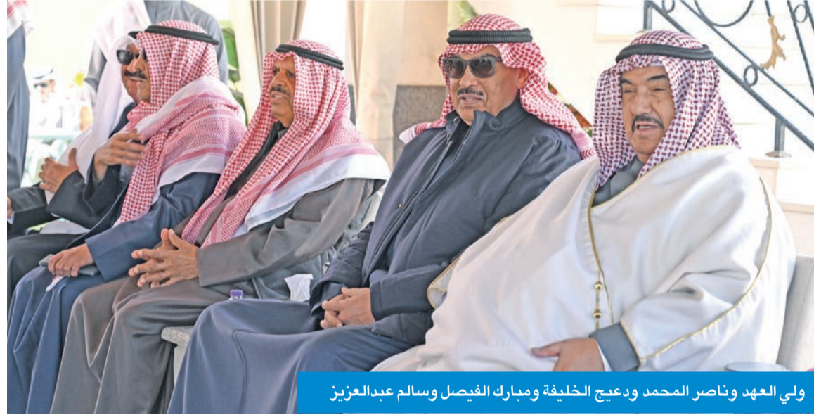
ولي العهد وناصر المحمد ودعيج الخليفة ومبارك الفيصل وسالم عبدالعزيز

بحضور سمو أمير البلاد الشيخ مشعل الأحمد، وسمو ولي العهد الشيخ صباح الخالد، ورئيس مجلس الوزراء بالإنابة الشيخ فهد اليوسف، وأسرة آل الصباح، أقام الشيخ علي الجابر مأدبة غداء على شرف صاحب السمو، وذلك في مزرعة عزايذ بمنطقة العبدلي.