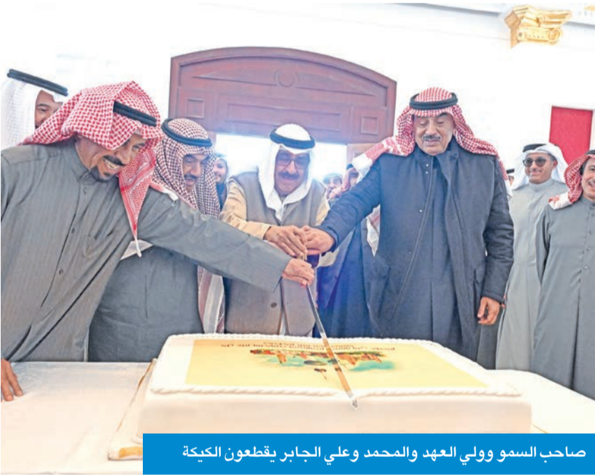
صاحب السمو وولي العهد والمحمد وعلي الجابر يقطعون الكعكة