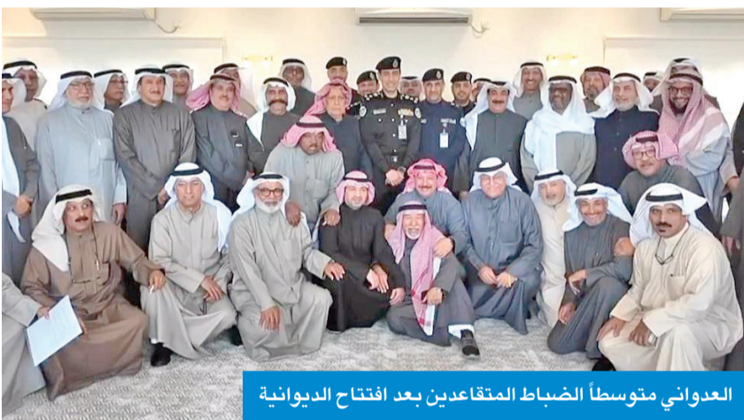
العدواني متوسطا الضباط المتقاعدين بعد افتتاح الديوانية

دشن وكيل وزارة الداخلية المساعد لشؤون الخدمات الأمنية، اللواء علي العدواني، عودة ديوانية الضباط المتقاعدين واستقبال روادها من ضباط وزارة الداخلية المتقاعدين، بحضور عدد من القيادات الأمنية. وتأتي عودة الديوانية تزامناً مع قرب إنجاز أعمال التحديث والصيانة التي أجريت عليها خلال الفترة الماضية، في إطار حرص وزارة الداخلية على تعزيز التواصل مع منتسبيها المتقاعدين، وتقديراً لما قدموه من عطاء وجهود مخلصه طوال سنوات خدمتهم. وأكد العدواني، في كلمة له بالمناسبة، نقلاً عن توجيهات رئيس مجلس الوزراء بالإنيابة الشيخ فهد اليوسف، أهمية الدور الاجتماعي للديوانية في توطيد أواصر التواصل والتلاحم بين الضباط المتقاعدين، وتوفير بيئة تفاعلية تليق بمكانتهم وتاريخهم الوظيفي.