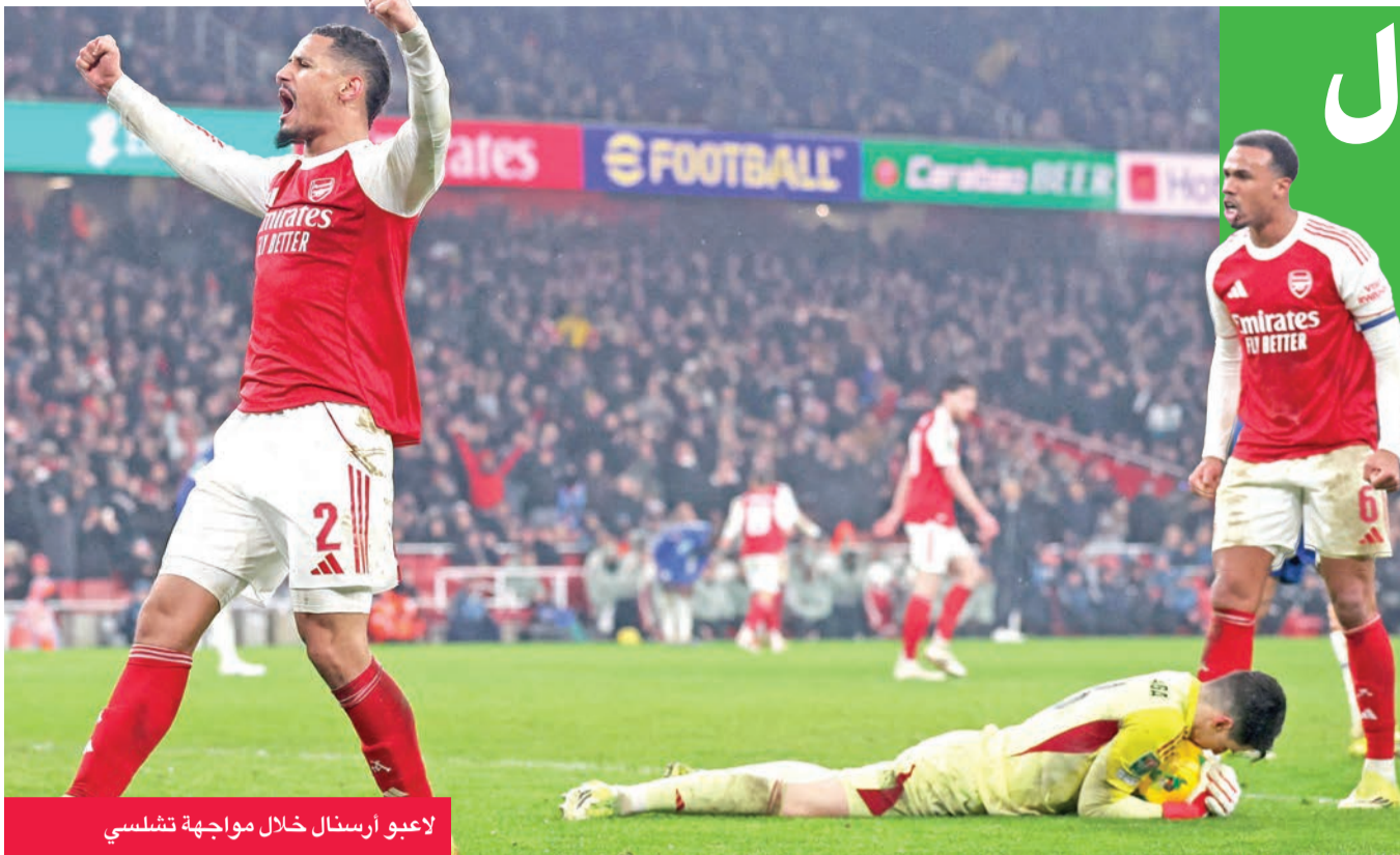
لاعبو أرسنال خلال مواجهة تشلسي

التي أراها»، وأكد: «نريد تحقيق الانتصارات، ولكن علينا أن نتأكد من أننا نحصل على الراحة، وأن نتعافى، وأن نواصل التطور».