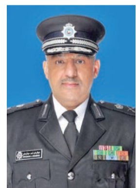
عبد الوهاب الوهيب

توجه وكيل وزارة الداخلية، اللواء عبد الوهاب الوهيب، إلى دولة قطر الشقيقة، أمس، لحضور ختام فعاليات التمرين التعاوني المشترك «أمن الخليج العربي 4». وقالت الوزارة، في بيان صحفي، إن التمرين يقام بمشاركة الأجهزة الأمنية بدول مجلس التعاون لدول الخليج العربية، في إطار تعزيز التعاون والتنسيق الأمني المشترك وتبادل الخبرات.