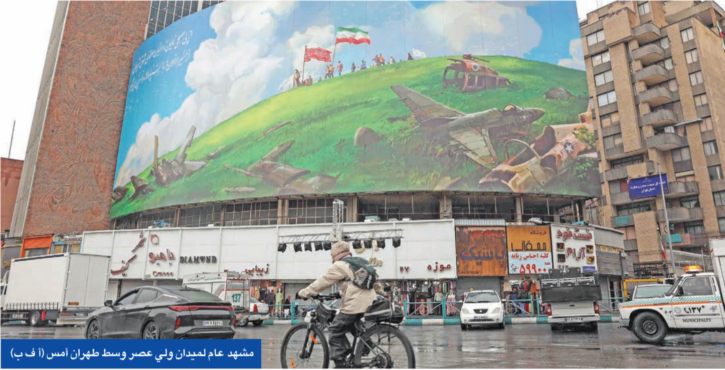
مشهد عام لميدان ولي عصر وسط طهران امس

لليورانيوم، وإخراج مخزونه المخضب الذي يبلغ 450 كيلوغراماً من الأراضي الإيرانية، ووقف برنامج الصواريخ الباليستية، ووقف الدعم للوكلاء» الأمريكية في حال شنت الولايات المتحدة أي هجوم على طهران، مما يزيد من تعقيد المشهد الأمني في المنطقة بالتزامن مع التحركات الدبلوماسية.