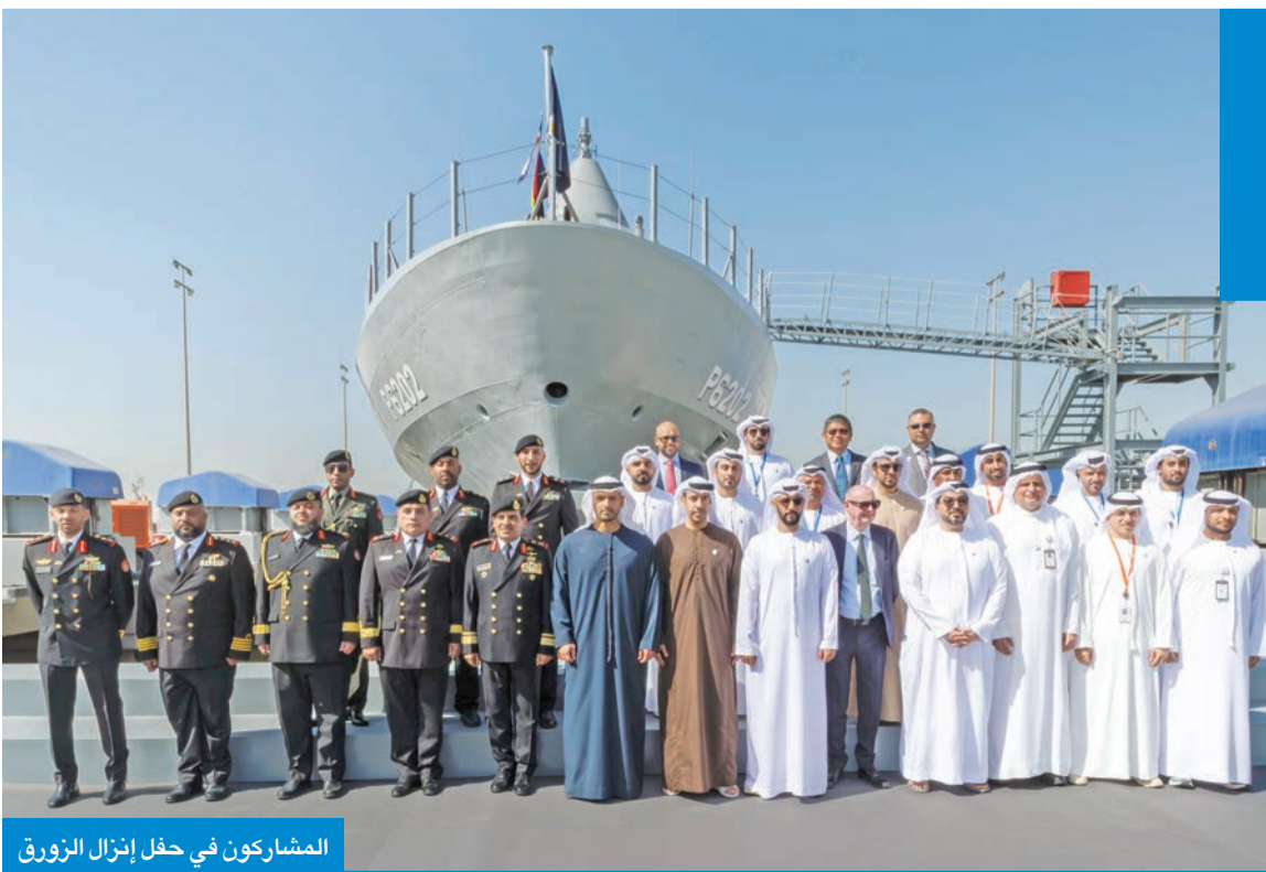
المشاركون في حفل إنزال الزورق

اختتم الحرس الوطني تمرين «صمود» بتنفيذ التمرين الختامي لتمريني «أسد الجزيرة 7» ومراكز قيادة الحرس الوطني (CPX - نصر 21)، الذي يعد من أكبر التمارين في الحرس على مستوى الوحدات المقاتلة والمساندة. وأعلن الحرس، في بيان صحفي، أن التمرين اختتم بحضور رئيس الأركان العامة للجيش الكويتي الفريق الركن خالد الشريهان، ووكيل الحرس الفريق الركن حمد البرجس، ووفد رفيع المستوى من قوات الدرك الإيطالي (الكارابينيري)، ووفد من رئاسة الوزراء الأردنية والملحقين العسكريين لدى دولة الكويت وكبار القادة، ووفود من الجيش الكويتي،