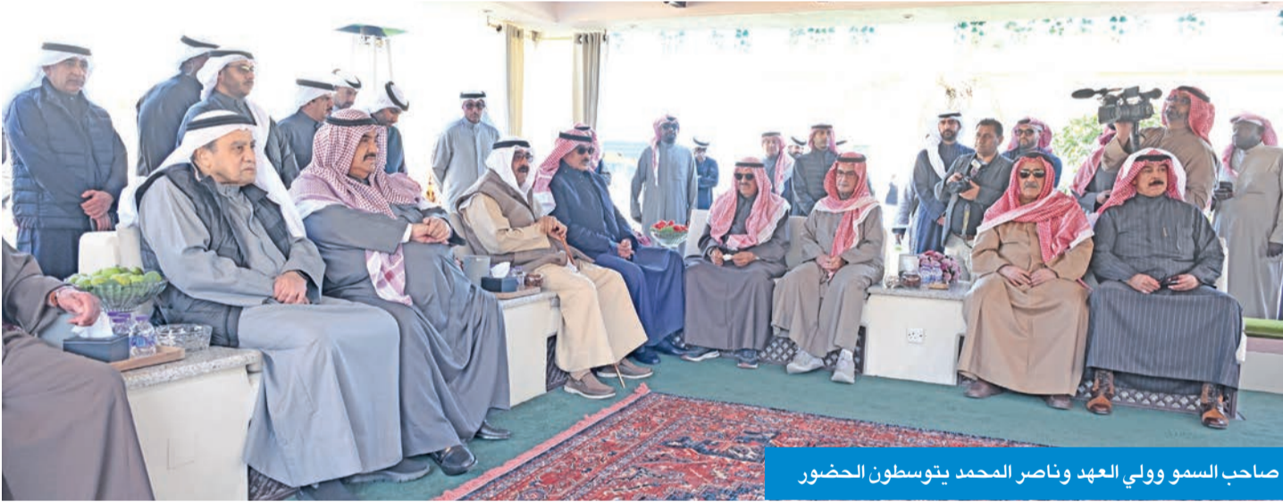
صاحب السمو وولي العهد وناصر المحمد يتوسطون الحضور

بحضور سمو أمير البلاد الشيخ مشعل الأحمد، وسمو ولي العهد الشيخ صباح الخالد، ورئيس مجلس الوزراء بالإنابة الشيخ فهد اليوسف، وأسرة آل الصباح، أقام الشيخ علي الجابر مأدبة غداء على شرف صاحب السمو، وذلك في مزرعة عزايذ بمنطقة العبدلي.