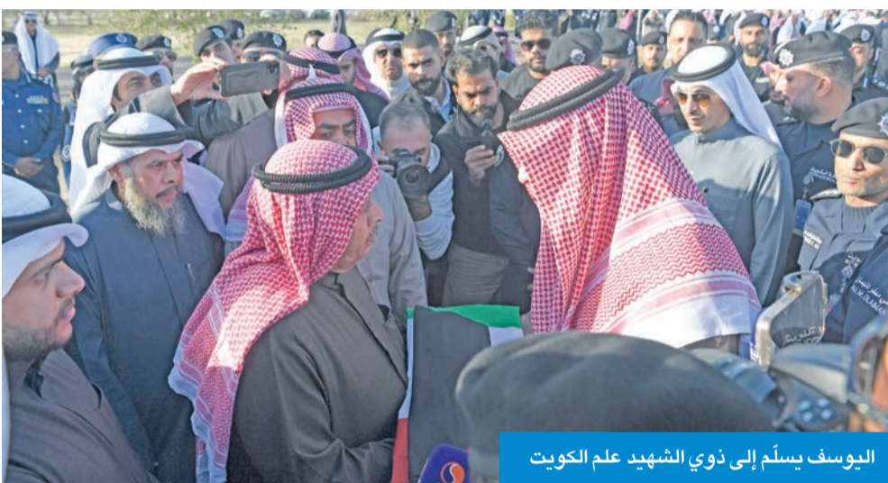
اليوسف يسلم إلى ذوي الشهيد علم الكويت

مشيداً بما قدّمه الشهيد من إخلاص وتفان في أداء واجبه، ومؤكداً أن تضحيات رجال الأمن ستظل محل فخر واعتزاز. وسلم اليوسف إلى ذوي الشهيد علم دولة الكويت الذي تم وضعه على جثمانه وأكد أن إصابة الشرف أثناء تاديبه عمله جعله بإذن الله شهيداً، وهذه أعلى مراتب التضحية في سبيل الوطن، سائلاً المولى عز وجل أن يجمعه مع الأبرار والشهداء. وأضاف اليوسف أن وزارة الداخلية تقدّر وتتفخّن كل تضحيات أبنائها، ولم تنسهم، وسوف تكون تضحياتهم نبراساً للعمل البطولي الذي يقوم به رجال الأمن. ومن جانبه، أكد وكيل وزارة الداخلية أن مسيرة الشهداء ستظل مضيئة في ذاكرة الوطن، وأن تضحياتهم لن تنسى، وستظل مصدر فخر واعتزاز لكل منتسبي الوزارة، داعياً الله عز وجل أن يتغمّد الشهيد بواسع رحمته، وأن يسكنه فسيح جناته، وأن يلهم أهله وذويه الصبر والسلوان.