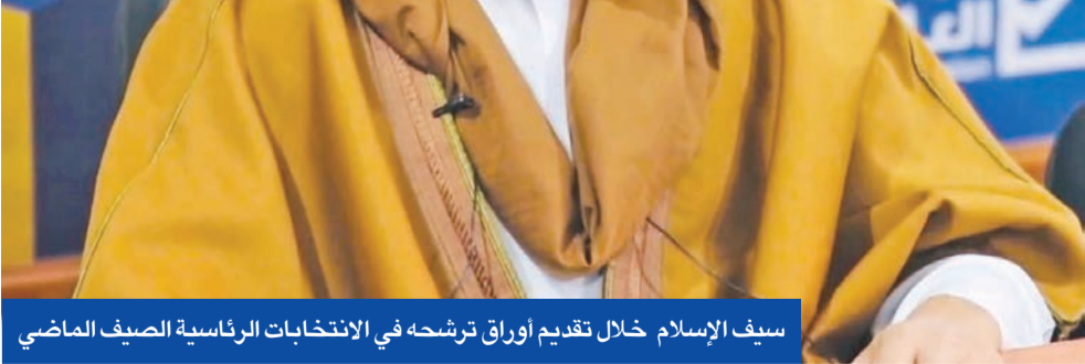
سيف الإسلام خلال تقديم أوراق ترشحه في الانتخابات الرئاسية الصيف الماضي

● الادعاء يلاحق منفذي الهجوم بالزنتان... واللواء 444 ينفي تورطه ● المنفي يحذر من التحريض ويعد بعدم الإفلات من العقاب