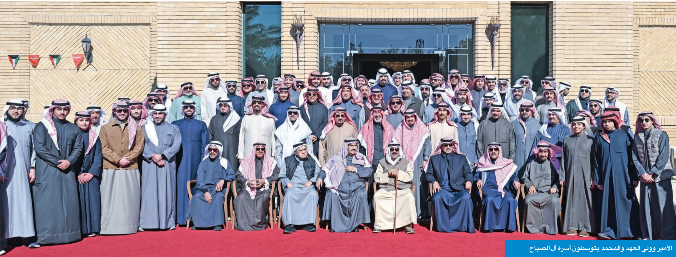
الأمير وولي العهد والمحمد يتوسطون أسرة آل الصباح