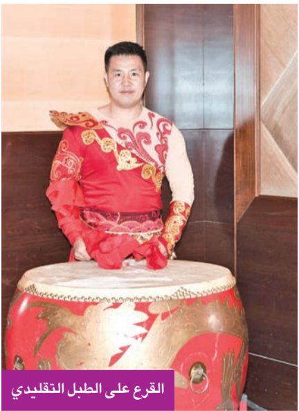
القرع على الطبل التقليدي

وتعريفية، مع شرح للتسهيلات الجديدة وسياسة الإعفاء من التأشيرة الممنوحة للكويتيين، ما يعكس حرص الصين على تعزيز التبادل السياحي والإنساني بين البلدين. وفي كلمته بهذه المناسبة، أكد مدير المركز الثقافي الصيني في الكويت ليو جينهيون أن هذه الفعالية تمثل إحدى محطات برنامج «عيد الربيع السعيد» لعام 2026، مشيراً إلى أن المركز سيواصل خلال الفترة المقبلة تنظيم فعاليات ثقافية متنوعة، من بينها عروض ضوئية حديثة ومعارض تصوير، وفعاليات خاصة بعيد الفوانيس، بهدف إتاحة الفرصة للجُمهور الكويتي للتفاعل المباشر مع الثقافة الصينية.