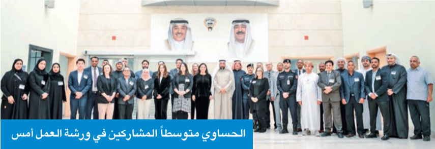
الحساوي متوسطاً المشاركين في ورشة العمل أمس

وفق المعايير الدولية المعتمدة، وتسهم في تعزيز التعاون بين الدول المشاركة، بما يخدم