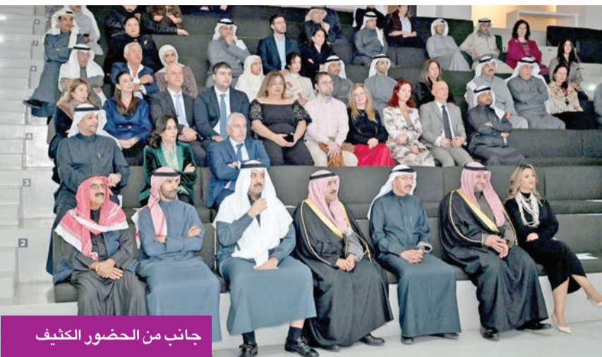
جانب من الحضور الكثيف