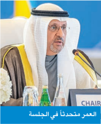
العمر متحدثاً في الجلسة

بدورها أكدت الوزيرة الفدرالية لتكنولوجيا المعلومات والاتصالات في جمهورية باكستان الإسلامية شذى خواجة في كلمتها التزام بلادها بدعم مسيرة منظمة التعاون الرقمي عبر مشاركتها في الجمعية العمومية الخامسة للمنظمة المنعقدة في دولة الكويت وذلك مع توليها رئاسة المجلس لعام 2026 لافتة إلى أهمية التعاون الرقمي في سد الفجوات الرقمية وتعزيز النمو الرقمي الشامل والمسؤول. من جهته أشار وزير الاتصالات وتقنية المعلومات في المملكة العربية السعودية عبدالله السواح في كلمته إلى «الإنجازات التي تحققت تحت رئاسة الكويت وما في ذلك إنشاء اللجنة الوزارية لمكافحة المعلومات الضارة والمهاجمات السيبرانية والبيانات والذكاء الاصطناعي المسؤول فضلاً عن دعم الابتكار الرقمي والشركات الناشئة في المنطقة».