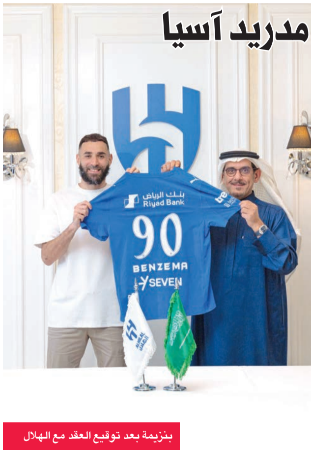
بنزيمة بعد توقيع العقد مع الهلال