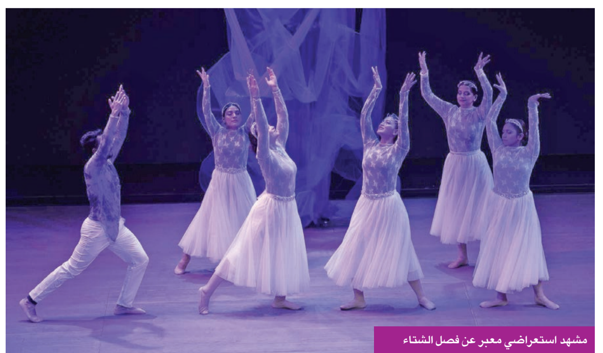
مشهد استعراضى معبر عن فصل الشتاء