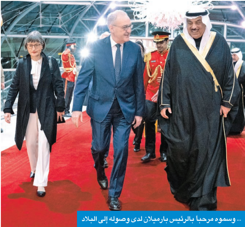
... وسموه مرحباً بالرئيس بارميلان لدى وصوله إلى البلاد

ولي العهد ورئيس الوزراء تقدما مستقبليه والوفد الرسمي المرافق