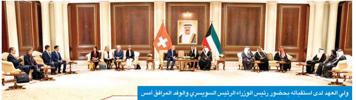
ولي العهد لدى استقباله بحضور رئيس الوزراء السويسري والوفد الرسمي المرافق أمس

ورئيس ديوان سمو ولي العهد الشيخ تامر جابر الأحمد، والمستشار بديوان رئيس مجلس الوزراء، رئيس بعثة الشرف المرافقة الشيخ د. باسل الصباح، ووزيرة الأشغال العامة، رئيسة بعثة الشرف المرافقة لحرم رئيس الاتحاد السويسري، د. نورة المشعان، ومساعد وزير الخارجية لشؤون أوروبا، السفير صادق معرفي.