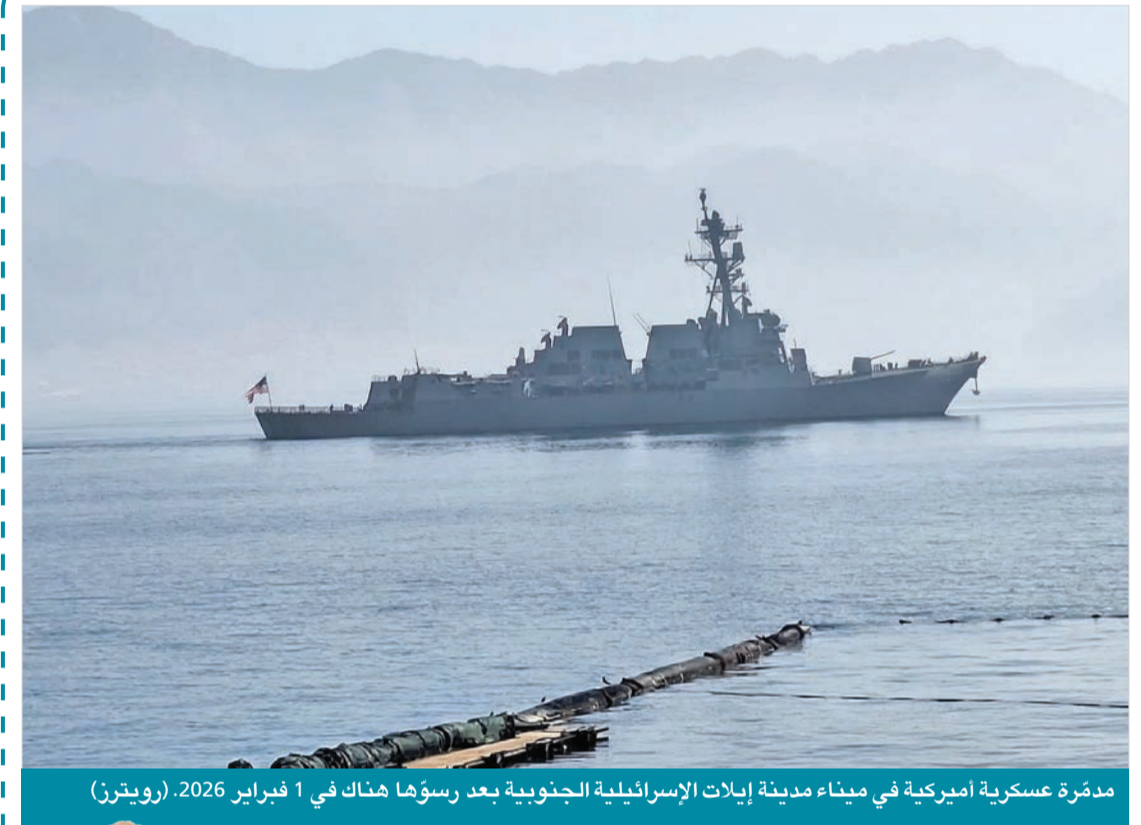
مدرة عسكرية أميركية في ميناء مدينة إيلات الإسرائيلية الجنوبية بعد رسوؤها هناك في 1 فبراير 2026.

في الختام، لقد تداخلت المعايير واشتجبت، فالكويت التي استوعبت واحتضنت غير الكويت التي عبست ولفظت، وحتى البعض ممن ساهموا أول الأمر في تشجيع ما يحصل في ملف «الجناسي» فرملوا سننتهم، وغَيروا اتجاههم، لأنهم شعروا أن النار بدأت تقرب من ثيابهم.