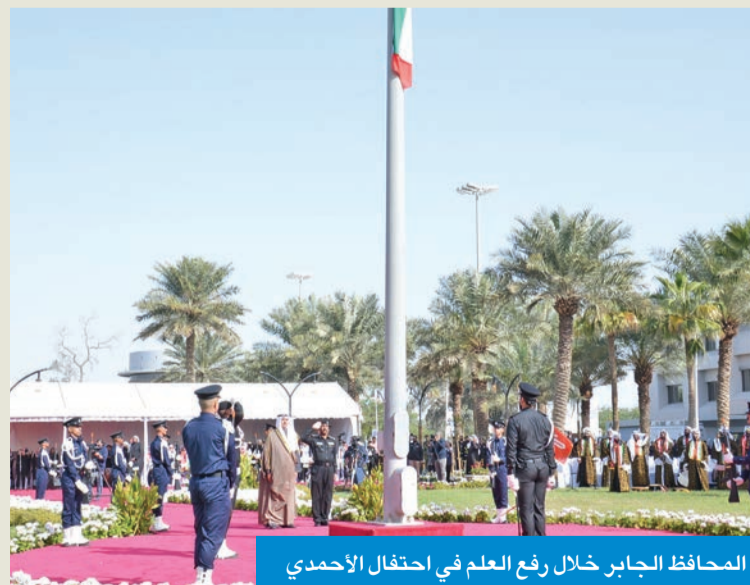
المحافظ الجابر خلال رفع العلم في احتفال الأحمدي

الجابر: محطة وطنية غالية تجسد معاني الولاء ومسيرة الإنجازات