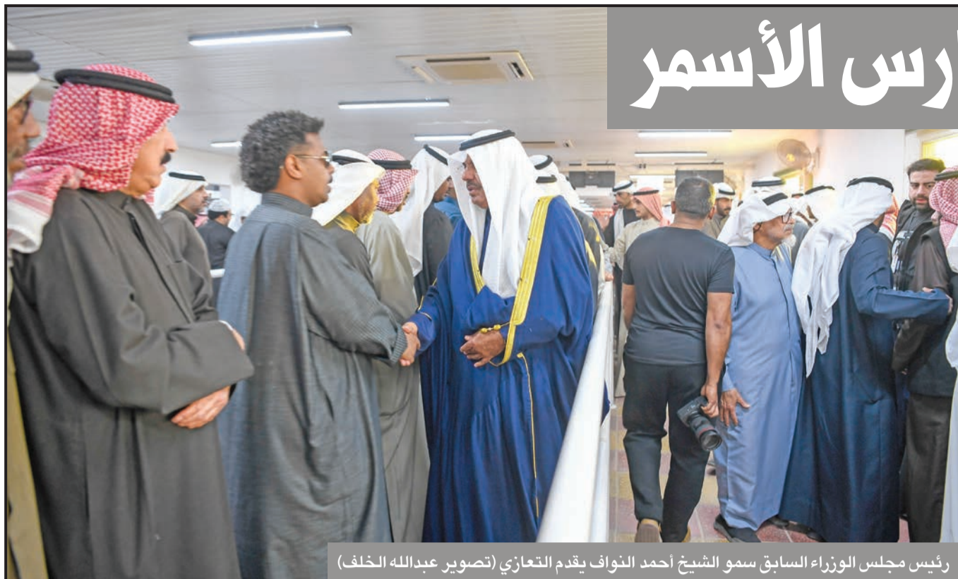
رئيس مجلس الوزراء السابق سمو الشيخ أحمد النواف يقدم التعازي