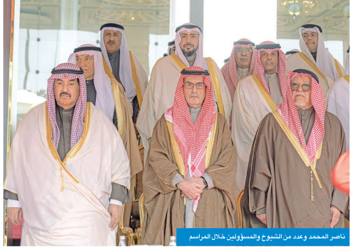
ناصر المحمد وعدد من الشيوخ والمسؤولين خلال المراسم