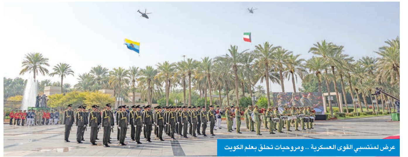
عرض لمنطسي القوى العسكرية ... ومرحوبات تحلق بعلم الكويت

برعاية وحضور سمو أمير البلاد الشيخ مشعل الأحمد، احتفل في قصر بيان صباح أمس بمراسم رفع العلم، إيداناً ببدء الاحتفال بالأعياد الوطنية للبلاد. وشهد الحفل سمو ولي العهد الشيخ صباح الخالد، ورئيس مجلس الوزراء سمو الشيخ أحمد العبدالله، ورئيس المجلس الأعلى للقضاء رئيس محكمة التمييز، المستشار د. عادل بورسلي، وكبار المسؤولين في الدولة. ووصل موكب سمو الأمير إلى مكان الحفل، حيث أطلقت المدفعية 21 طلقة ترحيب بسموه، كما استقبل سموه بكل حفاوة وترحيب من قبل أبناء منطسي الجيش والشرطة والحرس الوطني، ثم قام سموه برفع علم الدولة، وتم عزف النشيد الوطني، كما قامت الفرقة العسكرية بعرض موسيقي منوع.