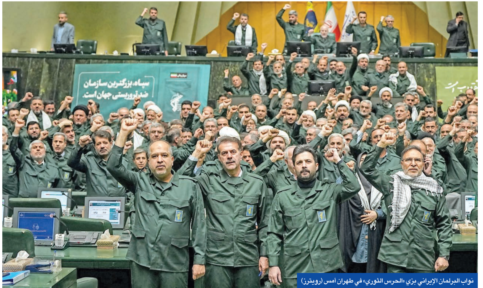
نواب البرلمان الإيراني بزي «الحرس الثوري» في طهران أمس