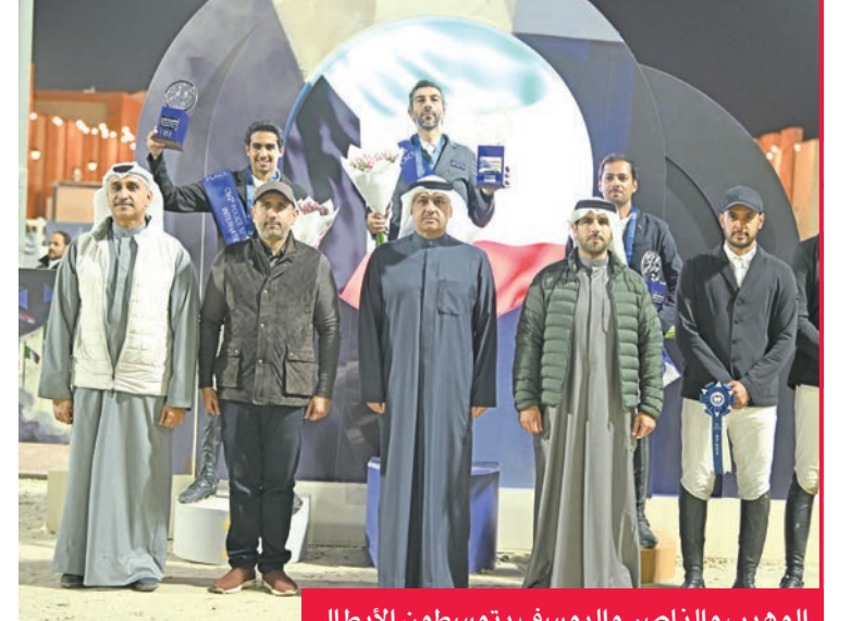
الوهيب والناصر واليوسف يتوسطون الإبطال

توج الفارس عبدالله العوضي بلقب بطولة اتحاد الشرطة الدولية لقفز الحواجز التي أقيمت على مضمار الاتحاد في منطقة صباح بمشاركة فرسان من الكويت وعدد من الدول العربية والخليجية والأوروبية، وسط منافسات قوية استمرت 3 أيام حتى مساء السبت. البطولة نظّمها اتحاد الشرطة الرياضي برعاية النائب الأول لرئيس مجلس الوزراء وزير الداخلية، الشيخ فهد اليوسف، وحضرها وكيل الداخلية، اللواء عبدالوهاب الوهيب، ورئيس اللجنة الأولمبية الكويتية الشيخ فهد الناصر، ومدير أكاديمية الشرطة العميد علي الوهيب.