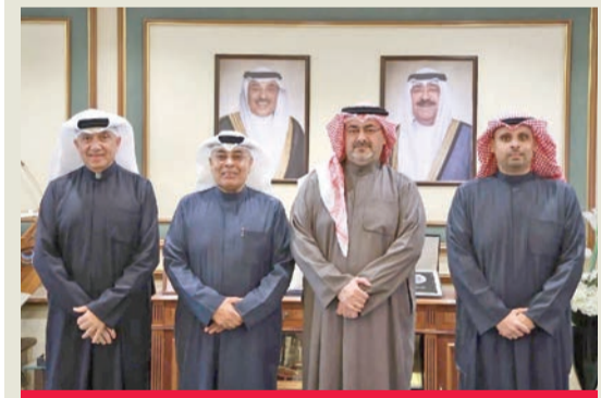
السالم مع رئيس وأعضاء اتحاد الرياضة للجميع

أكد محافظ العاصمة، الشيخ عبدالله سالم العلي، حرص المحافظة على تقديم كامل الدعم لإنجاح فعاليات يوم الكويت الرياضي من خلال تسخير جميع الإمكانيات البشرية والفنية واللوجستية، وبالتنسيق الكامل مع الجهات المعنية واللجان المنظمة بما يضمن تنظيم الفعالية بصورة حضارية تليق باسم دولة الكويت ومكانتها. وأكد أن المحافظة لن تتخرب جهدا في دعم هذه المناسبة الوطنية داعيا المواطنين والمقيمين إلى المشاركة الإيجابية في فعاليات يوم الكويت الرياضي بما يعكس روح الانتماء والمسؤولية الوطنية، ويسهم في إنجاح هذا الحدث الذي يعد أحد أبرز الفعاليات الرياضية المجتمعية في الدولة. (كونا)