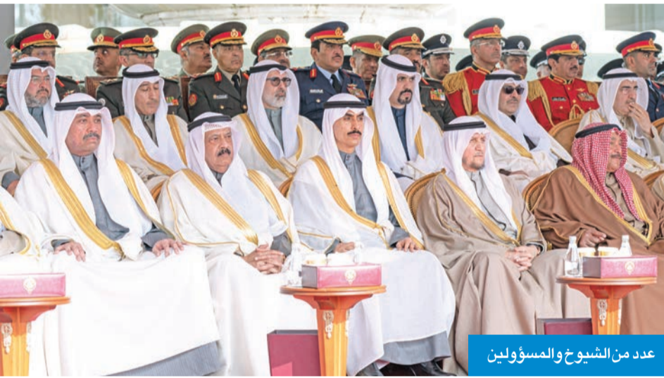
عدد من الشيوخ والمسؤولين