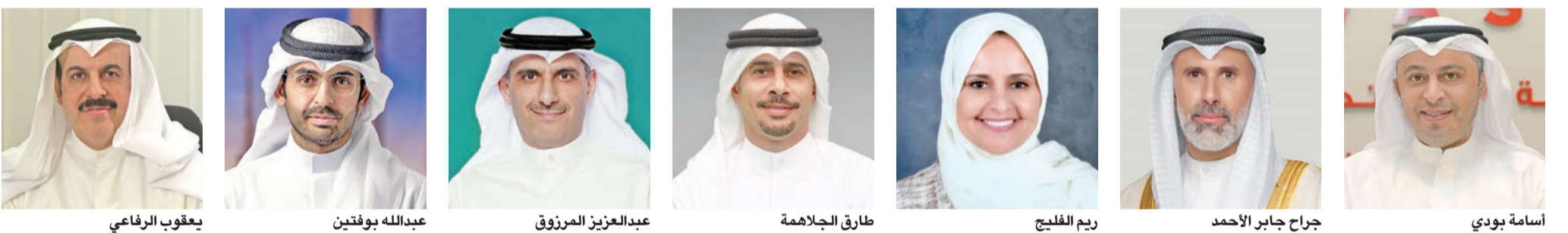
اسامة بودي جراح جابر الأحمد ريم الفليج طارق الجلاهمة عبدالعزيز المرزوق عبدالله بوفتين يعقوب الرفاعي محيي عامر

طارق حمد ناصر الجلاهمة وزير دولة لشؤون الشباب والرياضة، وعبدالعزیز ناصر عبدالعزیز المرزوق وزير دولة للشؤون الاقتصادية والاستثمار، وعبدالله صبيح عبدالله بوفتين وزيراً للإعلام والثقافة، ود. يعقوب السيد يوسف السيد هاشم الرفاعي وزيراً للمالية. وتضمنت المادة الثالثة دعوة رئيس مجلس الوزراء لتنفيذ المرسوم، الذي يُعجل به من تاريخ صدوره، ويُنشر في الجريدة الرسمية. وبموجب التعديل الجديد، خرج من الحكومة الوزراء عبدالرحمن المطيري، وعبدالله اليحيا، وخليفة بودي وزيراً للتجارة والصناعة، والشيخ جراح جابر الأحمد وزيراً للخارجية، ود. ريم غازي سعود الفليج وزيرة دولة لشؤون التنمية والاستدامة، ود. طارق حمد ناصر أمير، أمس، بتعديل وزاري قضى بإضافة 7 وزراء جدد، وخروج 3 من التشكيل، فضلاً عن تعديل منصب وزير، ليرتفع عدد الوزراء في الحكومة إلى 21. وتضمن المرسوم رقم 11 لسنة 2026 في مادته الأولى، تعديل تعيين عمر العمر إلى وزير دولة لشؤون الاتصالات وتكنولوجيا المعلومات، في حين قضت المادة الثانية بتعيين 7 وزراء جدد هم: اسامة خالد عبدالله بودي وزيراً للتجارة والصناعة، والشيخ جراح جابر الأحمد وزيراً للخارجية، ود. ريم غازي سعود الفليج وزيرة دولة لشؤون التنمية والاستدامة، ود. محيي عامر