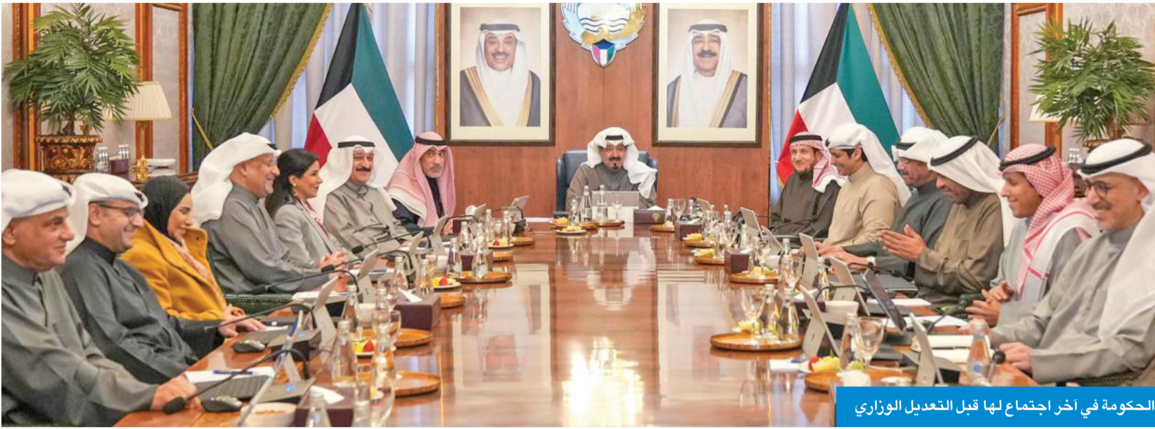
الحكومة في آخر اجتماع لها قبل التعديل الوزاري