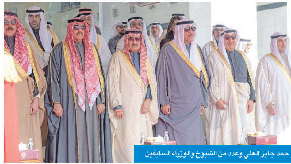
حمد جابر العلي وعدد من الشيوخ والوزراء السابقين