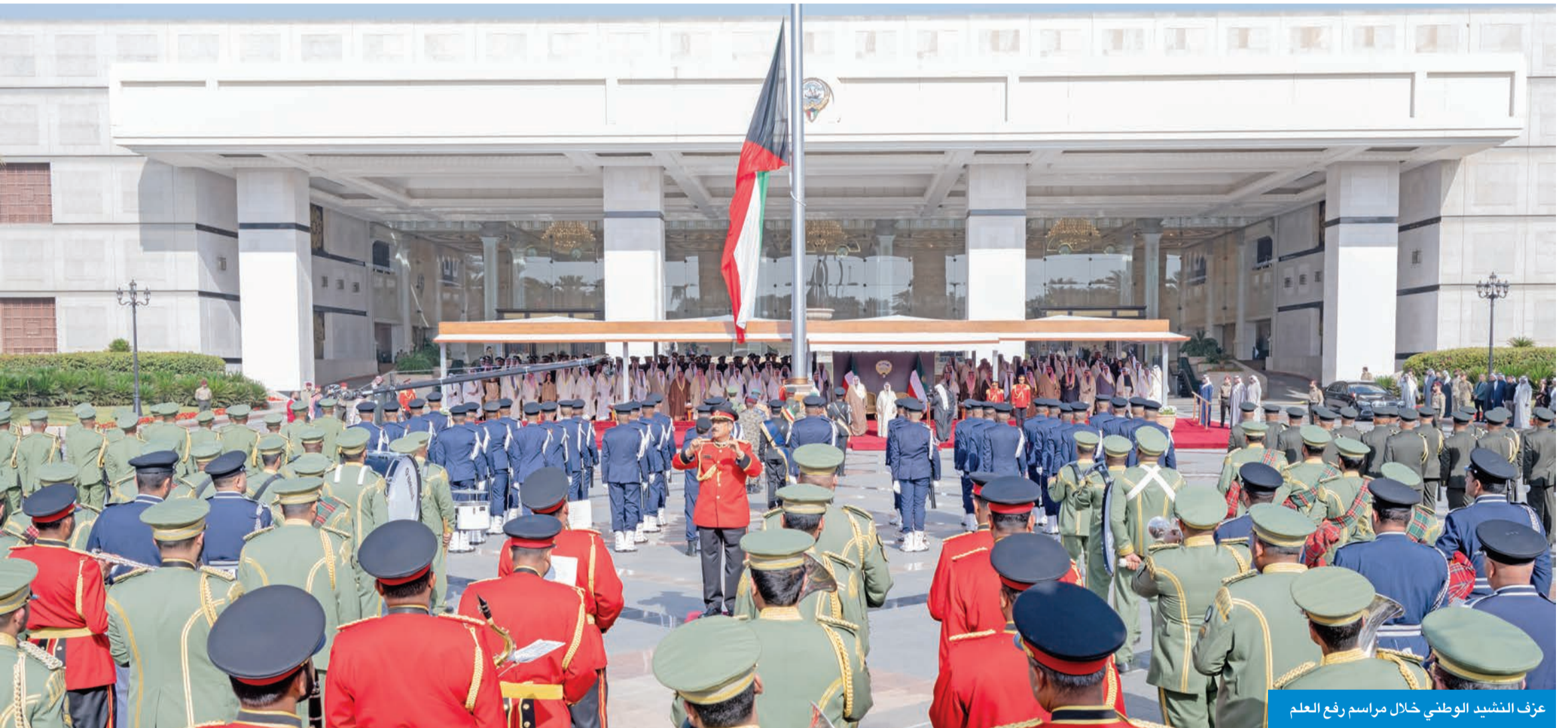
عزف النشيد الوطني خلال مراسم رفع العلم