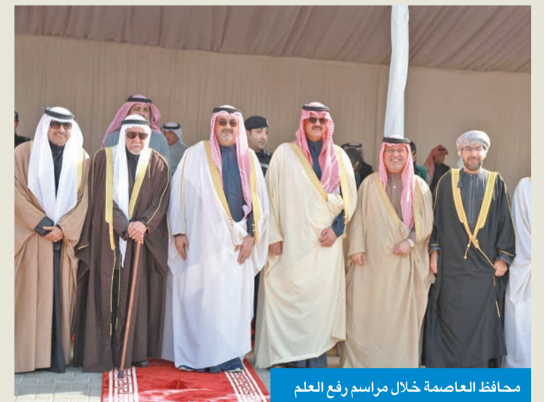
محافظ العاصمة خلال مراسم رفع العلم

عبدالله سالم العلي: مناسبة وطنية تؤكد صمود الشعب ووحدته