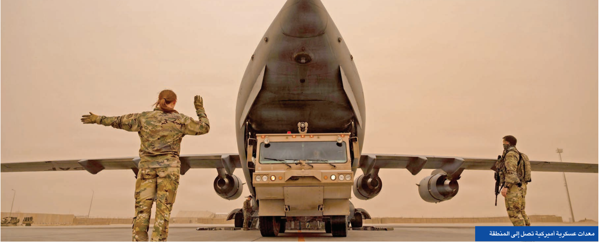
معدات عسكرية أميركية تصل إلى المنطقة

«الحرس» يتراجع عن مناورات هرمز... وإسرائيل تتوقع ضربة في أسبوعين أو شهرين