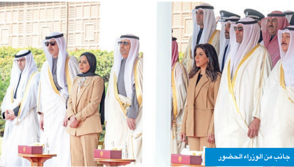
جانب من الوزراء الحضور