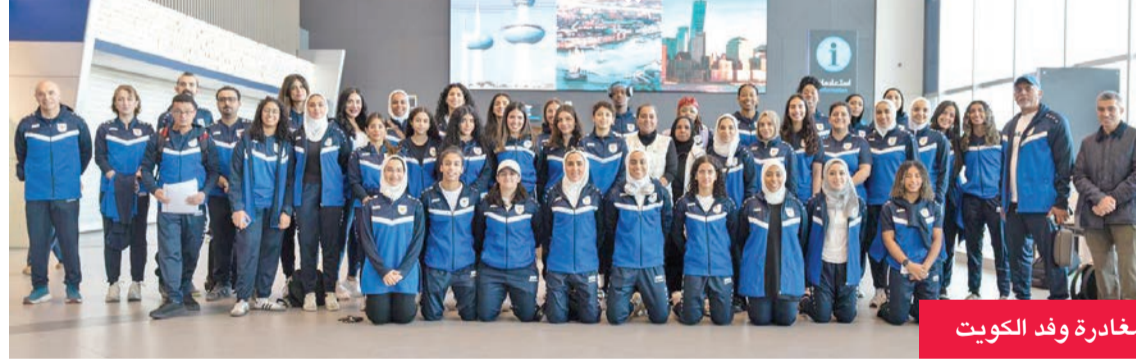
مغادرة وفد الكويت

وتأتي المشاركة الكويتية في هذه النسخة عبر نادي الرماية والنادي البحري ونادي الفتاة ونادي سلوى الصباح وأكاديمية الاتحاد الكويتي للمبارزة، حيث تتنافس اللاعبات في ألعاب الرماية والقوس والسهم والتجديف الشاطئي وكرة السلة وكرة الطائرة والمبارزة. وتشهد الدورة مشاركة 65 فريقا يمثلون 16 دولة عربية يتنافسون في تسع ألعاب فردية