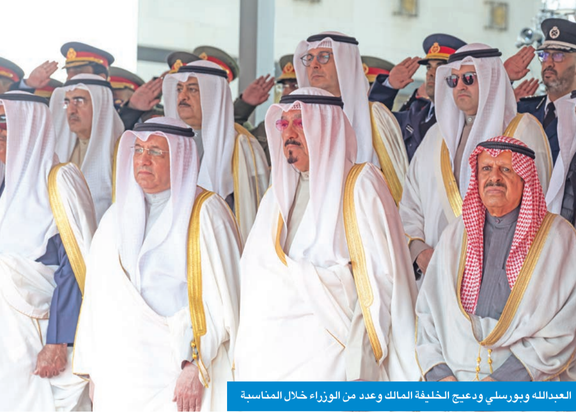
العبدالله وبورسلي ودعيج الخليفة المالک وعدد من الوزراء خلال المناسبة

21 طلقة ترحيباً بسموه... وعروض متنوعة لمنتسبي القوى العسكرية