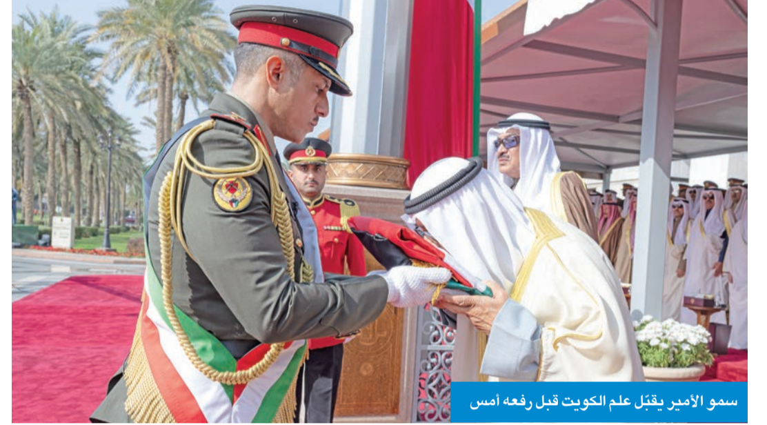
سمو الأمير يقبل علم الكويت قبل رفعه أمس