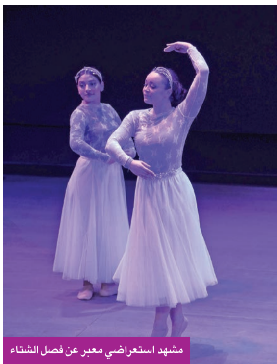
مشهد استعراضى معبر عن فصل الشتاء

استخدام زكي للدرجات اللونية والظلال، ما أضفى على العرض عمقاً جمالياً إضافياً، وكزس العلاقة بين الضوء والحركة والموسيقى. وفي الفواصل القصيرة بين الفصول، جاءت القراءات الشعرية المؤثرة لكيفن زفيرتشاشيفسكي لتكثف إحساس التحول والحدوث الزمنية المتجددة التي يقوم عليها العمل، مؤدية دور الجسر الدراماتورجي بين اللوحات، وموجهة الجمهور عبر التحولات العاطفية والرمزية للعرض.