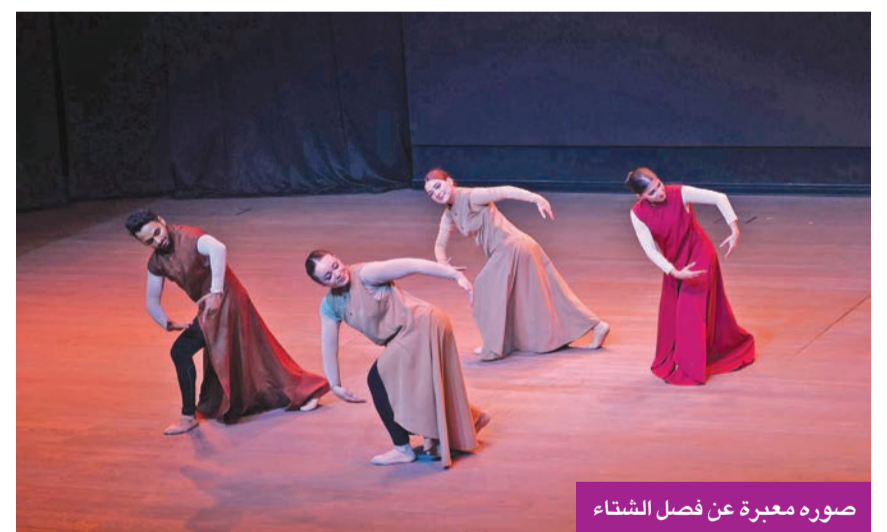
صوره معبرة عن فصل الشتاء

اكتملت صورة العرض من خلال عناصر بصرية وظفت بذكاء، حيث تولت الدكتورة تينا زوبوفيتش أيضاً تصميم الأزياء، فجاءت منسجمة مع طبيعة كل فصل، ومعبرة عن تبايناته الشعورية، مع الحفاظ على الخطوط الكلاسيكية للباليه، وخدمة الحركة دون تقييدها. أما تصميم المناظر المسرحية، فقد حمل توقيع د. إبراهيم سلام إلى جانب مصطفى محمود ومحمد نصر الدين خليل، وجاء قائماً على تكوينات نحتية إيحائية، تمثّلت في منشآت ضخمة من الشبك الشفاف، حوّلت خشبة المسرح إلى فضاء تجريدي يستحضر الطبيعة، ويمنح العرض بعداً بصرياً شاعرياً يكمل الحركة ولا ينافسها، وساهم تصميم الإضاءة، الذي نفّذه عبد الرحمن عناية، في رسم التحولات الشعورية للفصول الأربعة، عبر انتقالات ضوئية مدروسة،