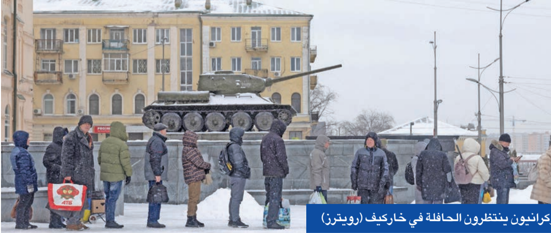
أوكرانيون ينتظرون الحافلة في خاريف

انخفاض حاد في درجات الحرارة. وقال أوليكسي كوليبا نائب رئيس الوزراء إنه لا يزال نحو 700 مبنى سكني في العاصمة كييف من دون تدفئة آسن، مع اجتياح موجة برد قارس جديدة معظم أنحاء أوكرانيا.