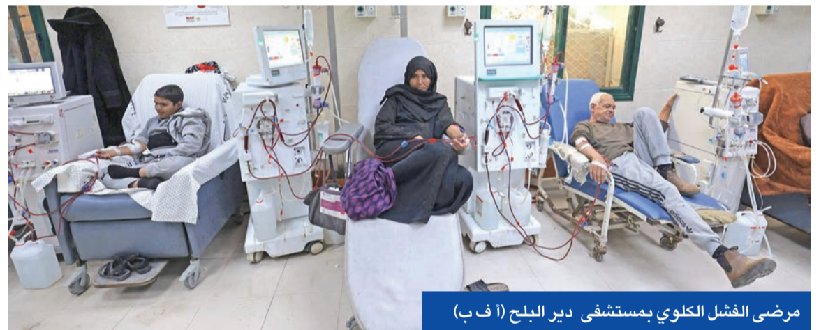
مرضى الفشل الكلوي بمستشفى دير البلح

الإعلام في مكتب الاتحاد الأوروبي بالقدس، شادي عثمان، إن إعادة فتح المعبر الحالية تدرج ضمن تشغيل تجريبي يهدف إلى تقييم الجاهزية الميدانية وضمان انسباية حركة الفلسطينيين من غزة واليهما، مؤكداً أن المرجعية القانونية لعمل الاتحاد الأوروبي في المعبر