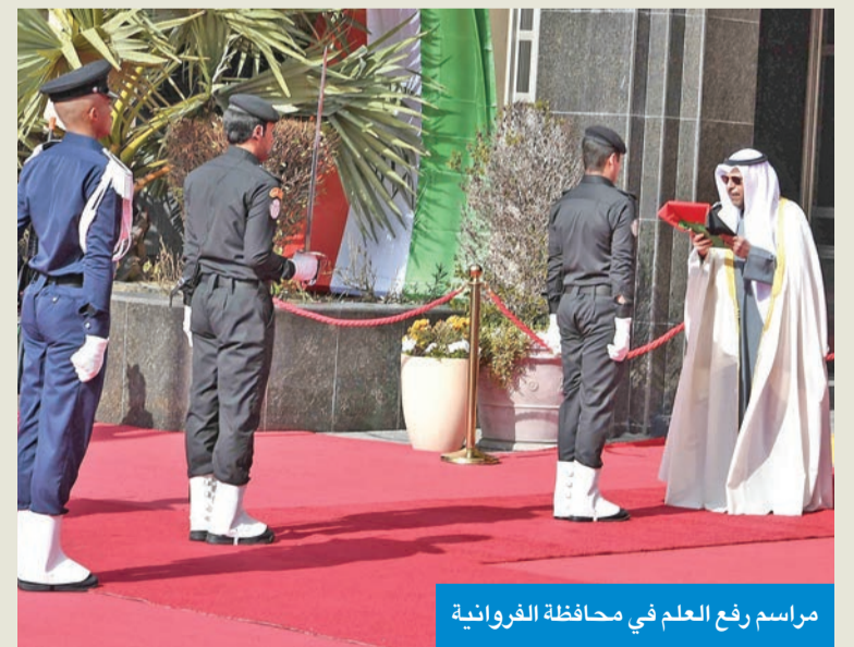
مراسم رفع العلم في محافظة الفروانية