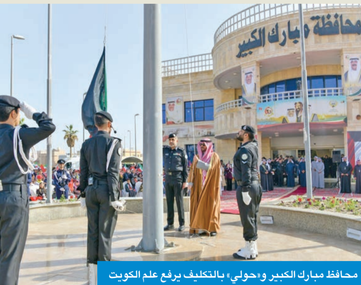
محافظ مبارك الكبير و«حولي» بالتكليف يرفع علم الكويت

البدر: تجسيد لمعاني الولاء والانتماء وترسيخ لقيم الوحدة الوطنية