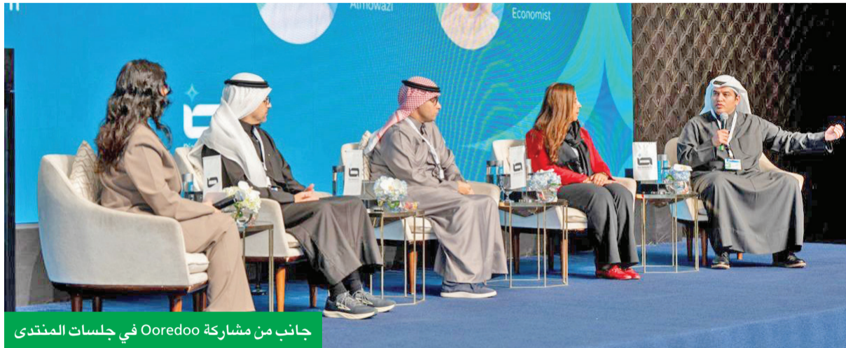
جانب من مشاركة Ooredoo في جلسات المنتدى

تعزز التزامها بالابتكار وريادة الأعمال والاستثمار القائم على التكنولوجيا والذكاء الاصطناعي