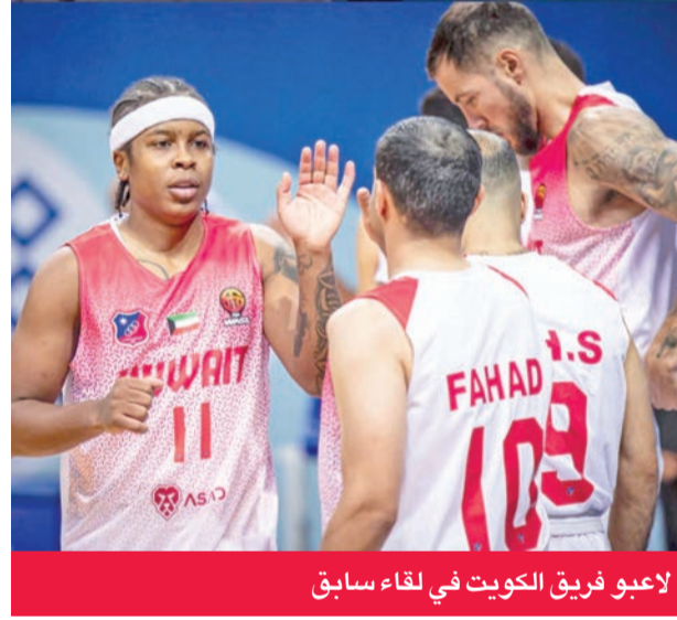
لأعو فريق الكويت في لقاء سابق

تنطلق مساء اليوم أولى مواجهات «البلاي أوف» الملحق المؤهل لنصف نهائي منطقة الخليج في دوري السوبر لغرب آسيا لكرة السلة «وصل»، عندما يستضيف فريق نادي الكويت عند الساعة مساء نظيره المحرق البحريني على صالة الاتحاد في مجمع الشيخ سعد عبدالله الرياضي. وكان فريق العلاء السعودي ضمن التأهل المباشر لنصف نهائي البطولة بعد تصدره مجموعته الثانية بخارق معدل التسجيل عن الكويت الذي حل ثانيا ولكل منهما 10 نقاط، في حين جاء العربي القطري ثالثا، وغادر المشاركة الإماراتي المنافسات بحلوله في المركز الرابع. وطبقا لنظام البطولة سيلعب «الأبيض» مواجهة اليوم أمام المحرق، ثالث المجموعة الأولى، وفق نظام «البلاي أوف» من 3 مباريات، بحيث يتأهل الفائز في مباراتين منها لملاقاة الاتحاد السعودي المتأهل مباشرة من المجموعة الأولى، بينما يلعب في المواجهة الثانية العربي القطري مع شباب الأمل الإماراتي بالنظام ذاته، ليواجه الفائز منهما فريق العلاء السعودي.