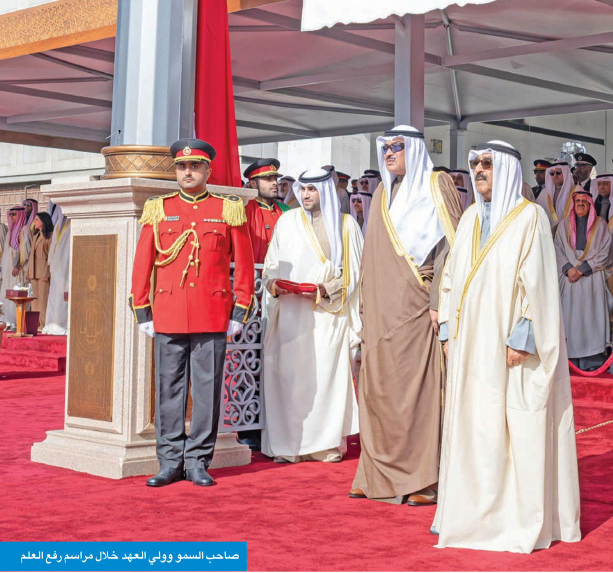
صاحب السمو وولي العهد خلال مراسم رفع العلم