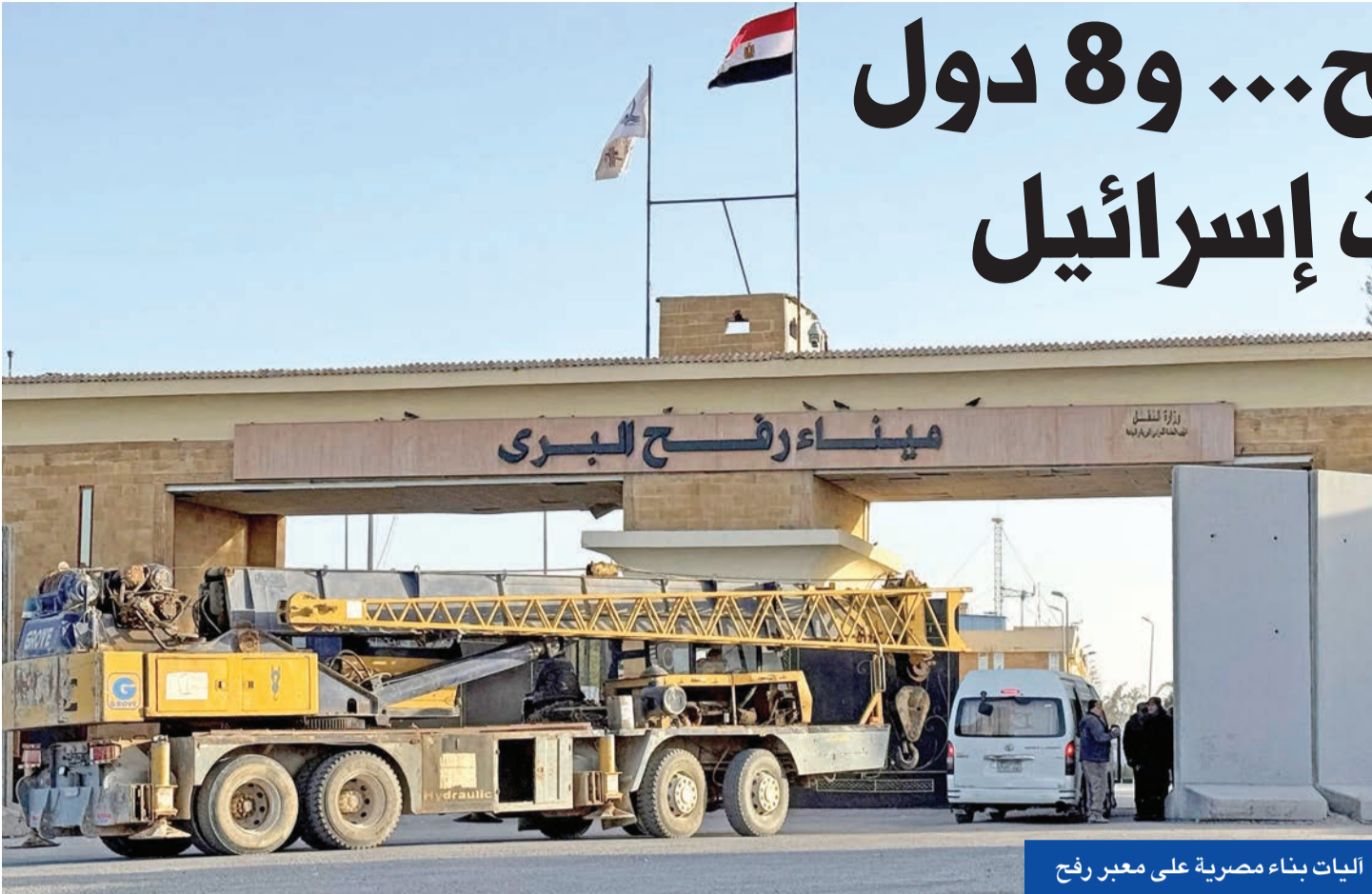
اليات بناء مصرية على معبر رفح

22 ألف مريض بحاجة للعلاج بالخارج و80 ألف أسرة تريد العودة