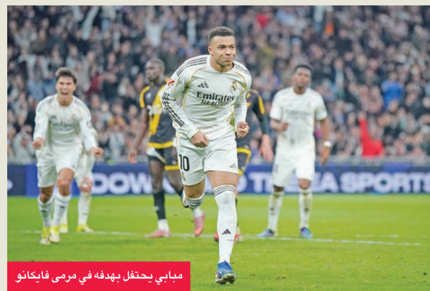
مبابي يحتفل بهدفه في مرمى فايكانو

وسطه الدولي الإنجليزي جود بيلينغهام في العضة الخلفية لخصّه الأيسر فترك مكانه للدولي المغربي إبراهيم دياس في الدقيقة العاشرة.