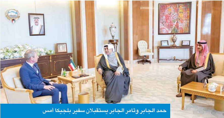
حمد الجابر وثامر الجابر يستقبلان سفير بلجيكا أمس

استقبل وزير شؤون الديوان الأميري، الشيخ حمد الجابر، ورئيس ديوان سمو ولي العهد، الشيخ ثامر الجابر، بقصر بيان صباح أمس، سفير بلجيكا لدى الكويت كريستيان دوومن. وتم خلال اللقاء بحث العلاقات الوطيدة التي تربط البلدين والتأكيد على توسعة أطر التعاون بينهما نحو أفاق أرحب لتعزيز مسارات التواصل بين البلدين.