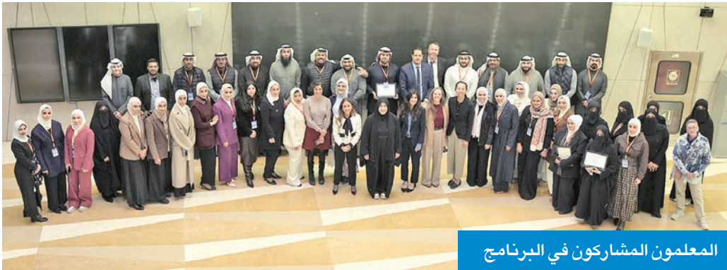
المعلمون المشاركون في البرنامج

هجين جمع بين التعلم الإلكتروني وورش العمل الحضورية المكثفة التي استضافتها جامعة الكويت. وأوضحت أن البرنامج ركّز على تزويد المشاركين بمهارات عملية في توظيف أدوات الذكاء الاصطناعي في تخطيط الدروس والتقويم وتصميم الأنشطة التعليمية التفاعلية، بما يُسهّم في تعزيز الإبداع والتفكير النقدي لدى الطلبة، مع التأكيد على الالتزام بالممارسات الأخلاقية وحماية البيانات.