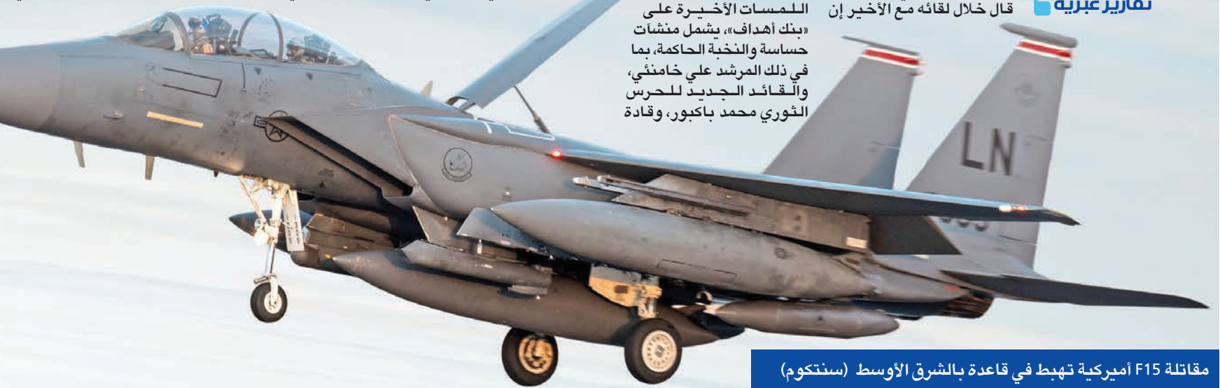
مقاتلة F15 اميركية تهبط في قاعدة بالشرق الأوسط (سنتكوم)

واشنطن تريد عملية سريعة ونظيفة ومنخفضة التكلفة تقارير عبرية