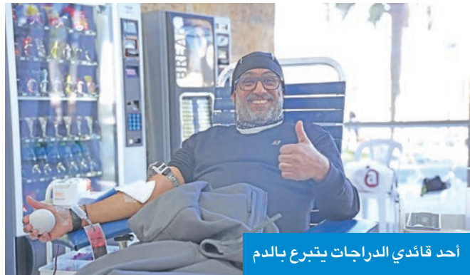
أحد قائدي الدراجات يتبرع بالدم