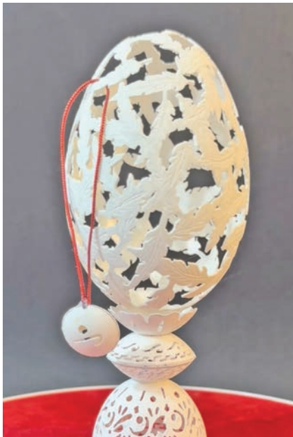
المنحوتة المشاركة في بينالي بكين