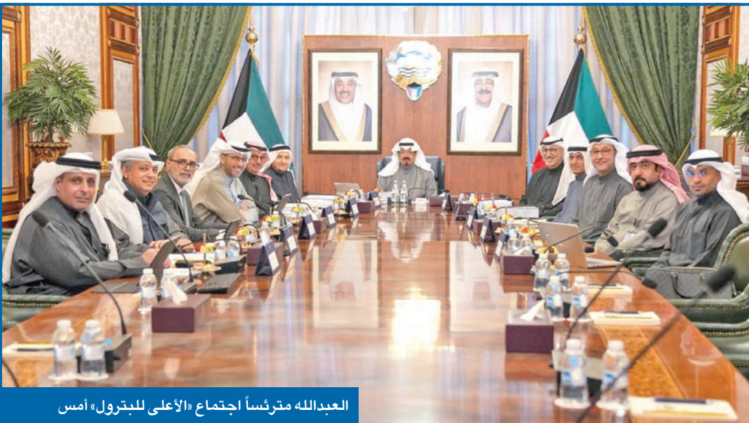
العبدالله مترئساً اجتماع «الأعلى للبتترول» أمس

ضمن الجوائز المقدمة من اللجنة العليا للجائزة في دورتها الأولى، حصل المحاور فيصل العقل على جائزة الشخصية الإعلامية الشابة الواعدة.