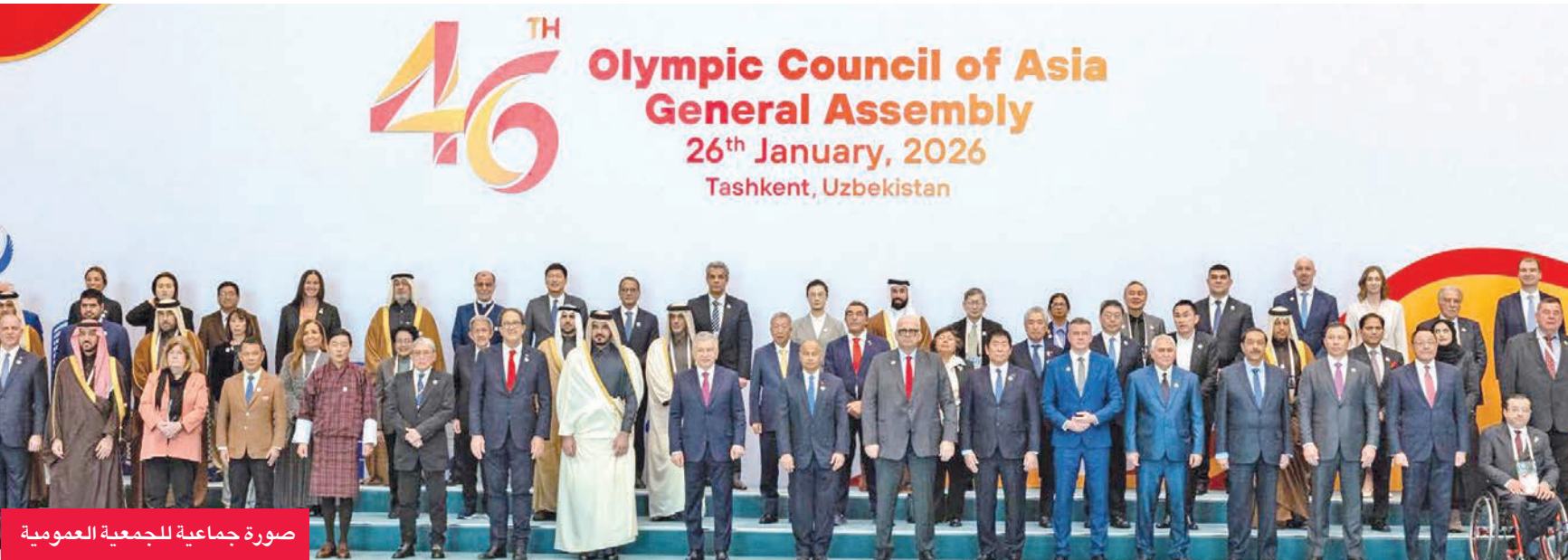
صورة جماعية للجمعية العمومية