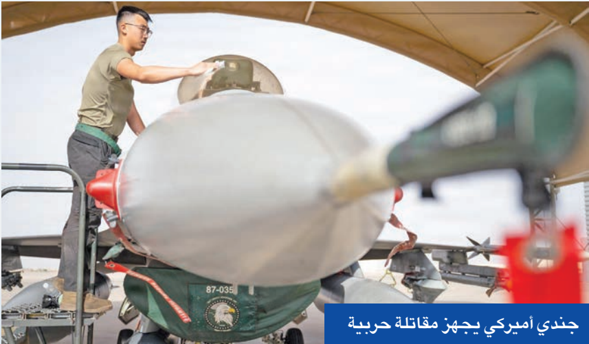
جندي اميركي يجهز مقاتلة حربية

إلى ذلك، أكدت وزارة الخارجية الإماراتية أن الإمارات لن تسمح باستخدام مجالها الجوي أو أراضيها أو مياهها في عمليات عسكرية ضد إيران، فيما حذر الكرملين من أن أي ضربة محتملة لإيران ستؤدي إلى «زعزعة خطيرة» للاستقرار في المنطقة، داعياً إلى ضبط النفس والتركيز على الحلول السلمية.