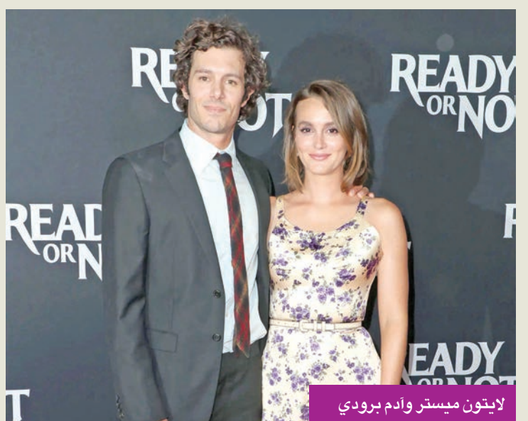
لايتون ميستر وأدم برودي

ذكرت الممثلة والمغنية الأميركية لايتون ميستر، (39 عاماً)، خلال تقارير إعلامية، أن سر زواجها الذي استمر 12 عاماً من الممثل الأميركي آدم برودي، (46 عاماً)، يكمن في استمتاعهما مع بعضهما البعض. وخلال حديثها، قالت ميستر إن الأمر مضحك جداً؛ لأن أحدهم سألها هذا السؤال في الليلة الماضية، وحينها قالت لنفسها: «أتمنى لو كنت أعرف الإجابة». لتؤكد أنها تعتقد أن مجرد الإعجاب المتبادل والتوافق هو جزء أساسي من الأمر، وإن هذا هو جوهر الأمر ببساطة، أن تقول: «أنا معجبة بهذا الشخص حقاً». وأشارت إلى أن أحد أهم أسباب نجاح علاقتهما هو زوجها هو نظرتهما الواقعية والصريحة للأمور، مضيفة أنها تعتقد أن «التواجد مع شخص آخر وإدراك لعيوبه وتحدياته، وإنك لست كاملاً، أمر بالغ