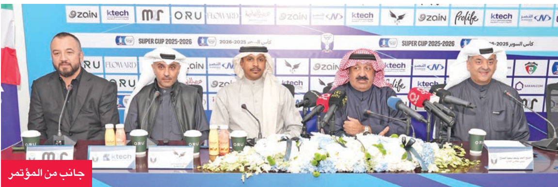
جانب من المؤتمر