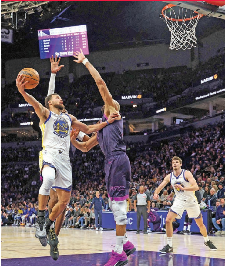
كوري نجم وويريز خلال مواجهة تمبروولفز

47 مباراة، بالفوز عليه 103 - 101. ولعب كويكلي الدور الرئيسي في الفون الرابع تواليا لرابرتوز والتاسع والعشرين هذا الموسم بتسجيله ثلاثيتين تواليا، ليمنح الضيوف التقدم 103-97 قبل دقيقة و16 ثانية على النهاية. وسجل كواي لينارد 21 من نقاطه الـ 28 في الشوط الأول، ليقود لوس آنجلوس كليبرز لفوزه الثامن في آخر تسع مباريات والحادي والعشرين هذا الموسم، وجاء بنتيجة كبيرة على ضيفه بروكلين نتس 126 - 89. واكتسح دبترويت بيستونز الذي يتصدر المنطقة الشرقية، ضيفه ساكرامنتو كينغز 139 - 116 في طريقه للفوز الخامس في آخر ست مباريات والثالث والثلاثين في 44 مباراة. وسجل كل من زبون وليامسون وصديق باي 24 نقطة مع 10 مناعبات في فوز نيو أورليانز بيليكانز على ضيفه سان أنتونيو سبيرز 104 - 95.