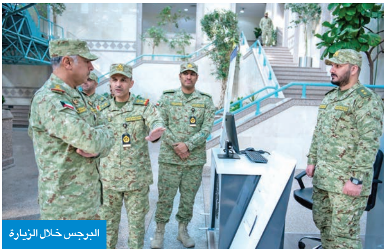
البرجس خلال الزيارة