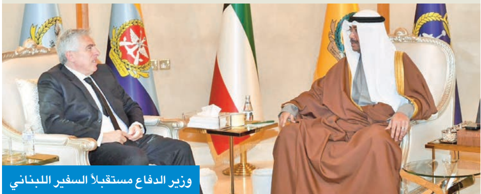
وزير الدفاع مستقبلاً السفير اللبناني

وذكرت الوزارة، في بيان صحفي، أنه تم خلال اللقاء بحث عدد من الموضوعات ذات الاهتمام المشترك لاسيما المتعلقة بالجوانب العسكرية وسبل تعزيز التعاون بين دولة الكويت والدول الشقيقة والصديقة.