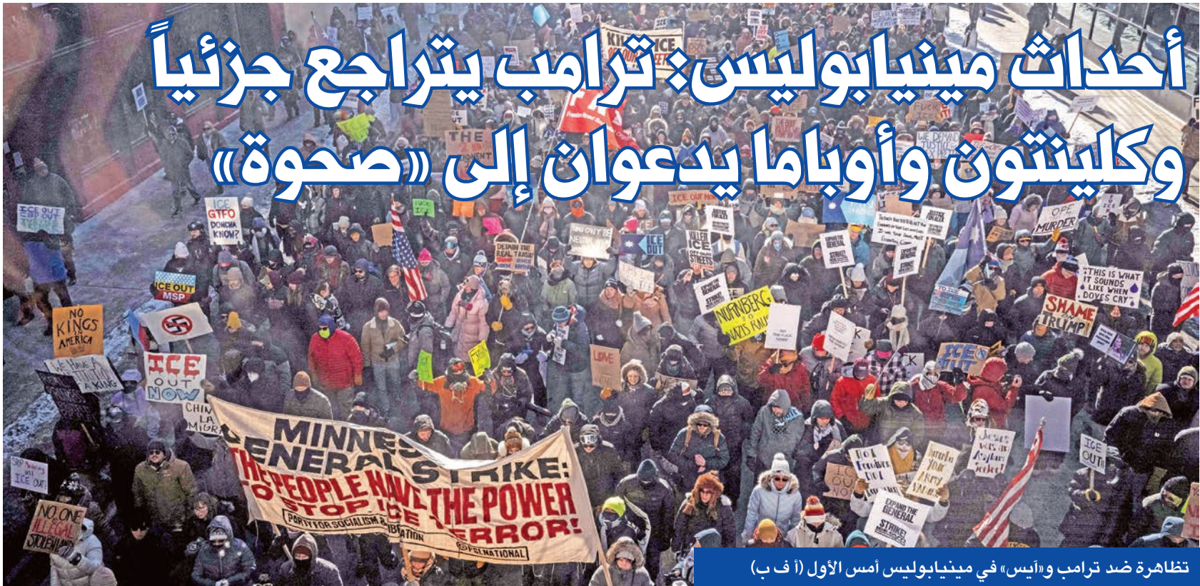
تظاهرة ضد ترامب و«ايس» في مينيابوليس أمس الأول

وجاء في مسودة الشراكة المقرر توقيعها اليوم «ستتسارو الاتحاد الأوروبي والهند بشأن مبادراتهما للدفاعية، بما في ذلك عبر تبادل الآراء حول مسائل مرتبطة بقطاع الدفاع». وأضافت «ستستكشفان» عندما توجد مصلحة متبادلة وتوافق في أولويات الأمن، إمكانات مشاركة الهند في مبادرات دفاعية ذات صلة داخل الاتحاد الأوروبي، حسبما يكون الأمر مناسباً، وبما يتماشى مع الأطر القانونية لكل طرف. وتتصور الشراكة إجراء حوار سنوي بين الاتحاد الأوروبي والهند بشأن الأمن والدفاع، إلى جانب تعزيز التعاون في أمن الملاحة البحرية والقضايا السيبرانية ومكافحة الإرهاب. وقالت الوثيقة «للتعظيم المتزايد للتهديدات الأمنية العالمية، وتساعد الفترات الجيوسياسية، والتغير التكنولوجي السريع، تؤكد الحاجة إلى حوار وتعاون أوثق بين الاتحاد الأوروبي والهند في مجال الأمن والدفاع».