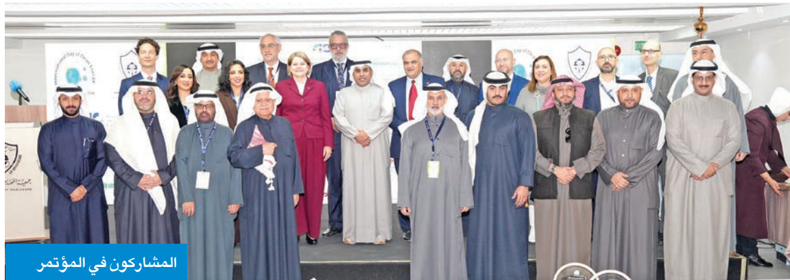
المشاركون في المؤتمر