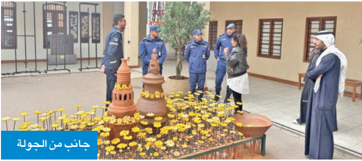
جانب من الجولة

نفذت قوة الإطفاء العام، أمس الأول، جولات ميدانية على عدد من الأماكن الحيوية والتراثية، منها: القصر الأحمر، ومتحف السلاح، ومتحف فن الحديث، ودار الآثار الإسلامية (المتحف الأميركي). وأتت هذه الجولات بالتعاون مع المجلس الوطني للثقافة والفنون والآداب، وتفعيل بنود بروتوكول التعاون المشترك بين الجهتين، حيث تهدف هذه الجولات إلى اتخاذ الإجراءات الوقائية، والتأكد من مطابقة اشتراطات السلامة والوقاية من الحريق.