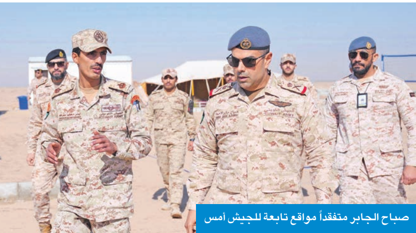
صباح الجابر متفقداً مواقع تابعة للجيش أمس

قام نائب رئيس الأركان العامة للجيش، اللواء الركن الطيار صباح الجابر، أمس، بزيارة تفقدية لعدد من المواقع التابعة للجيش الكويتي في المنطقة الشمالية، للاطلاع على آلية سير العمل في المواقع الميدانية.