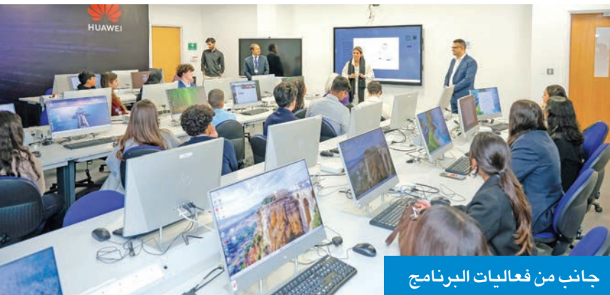
جانب من فعاليات البرنامج

ومن جانبه، قال السفير قديسي رشيد، سفير بريطانيا لدى دولة الكويت «نقف اليوم عند نقطة التقاء إنترنت الأشياء والذكاء الاصطناعي، حيث نشهد تحولاً تكنولوجياً يعيد تعريف البات عمل المجتمعات ويخلق فرصاً جديدة، وبالنسبة للشباب، فإن هذه المرحلة تمثل أكثر من مجرد تطور رقمي، فهي بوابة مفتوحة للابتكار وريادة الأعمال