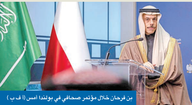
بن فرحان خلال مؤتمر صحفي في بولندا أمس

البولندي العلاقات الثنائية وسبل تعزيزها وتنميتها في مختلف المجالات، إضافة إلى بحث التطورات السياسية، وعدد من القضايا ذات الاهتمام المشترك، إلى جانب الجهود المبذولة لتحقيق الأمن والاستقرار الإقليمي والدولي.