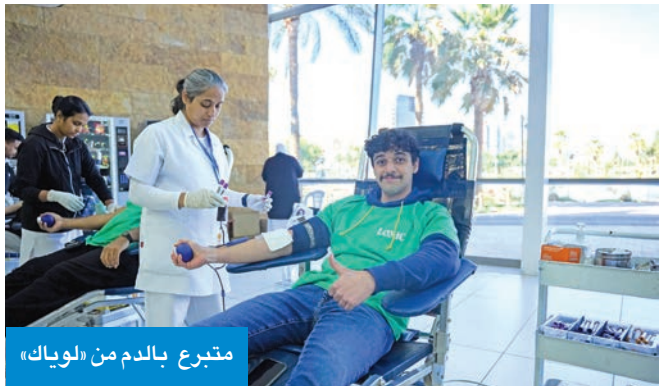
متبرع بالدم من لويك»