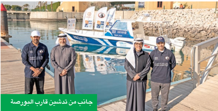
جانب من تدشين قارب البورصة

دعماً لحماية البيئة البحرية في جون الكويت