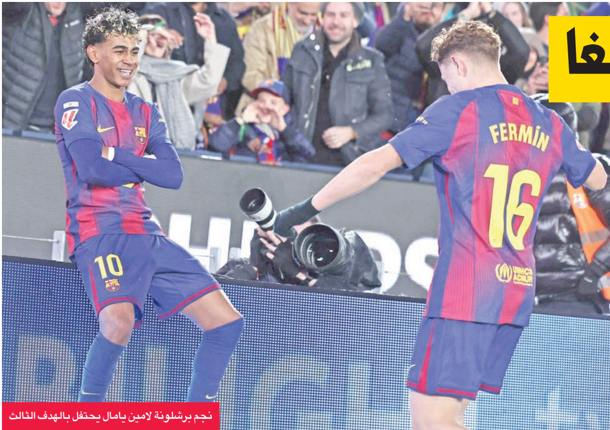
نجم برشلونة لامين يامال يحتفل بالهدف الثالث