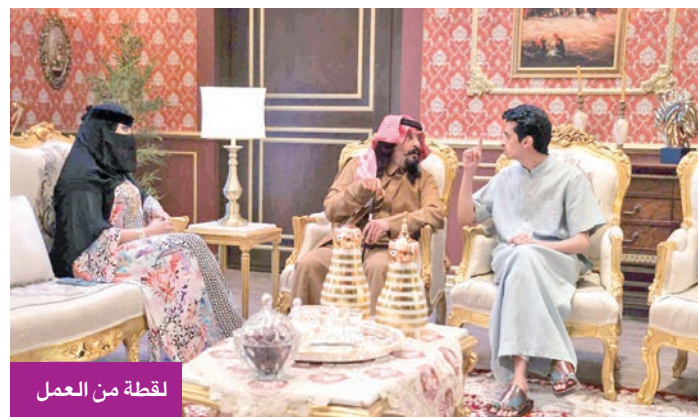
لقطة من العمل

ويشارك الحساب الرسمي للمنصة على «إكس» اليوستر الدعائي للعمل، مرفقاً بتعليق يؤكد عودة الضحك من جديد، مشيراً إلى أن حكاية عائلة أبو صامل لم تنته بعد، وأن الموسم الثالث سيعرض مجاناً وحصرياً خلال شهر رمضان. كما طرحت المنصة برومو خاصاً بشخصية