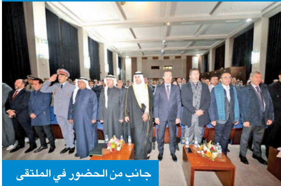
جانب من الحضور في الملتقى