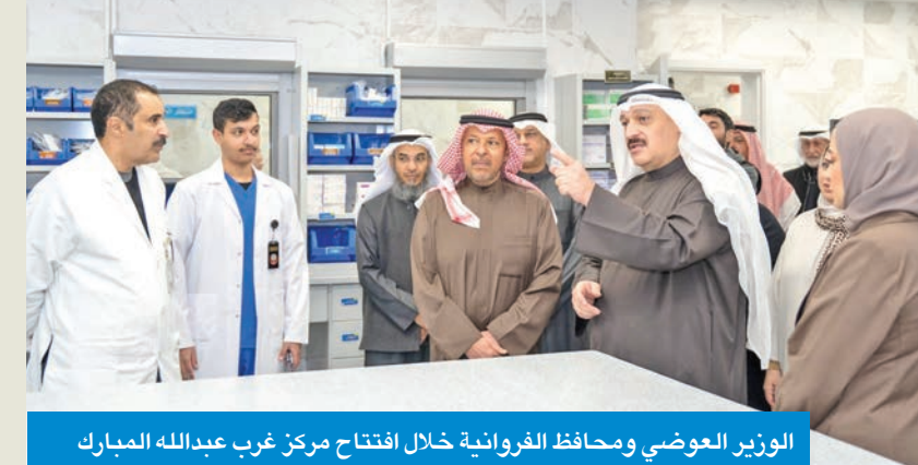
الوزير العوضي ومحاظ الفروانية خلال افتتاح مركز غرب عبدالله المبارك

أكد وزير الصحة د. أحمد العوضي، أمس الأول، أن الجراحة الروبوتية ركيزة أساسية في منظومة التطوير الجراحي بالكويت؛ لما توفره من دقة عالية وتحكم أفضل وتقليل المضاعفات وتسريع تعافي المرضى ورفع مستوى الأمان الجراحي، خصوصاً في الجراحات المعقدة وجراحات الأورام.