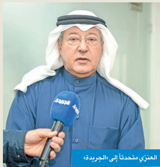
العنزي متحدثاً إلى «الجريدة»

منصة جهينة تحارب الشائعات وتردّ على الأخبار غير الصحيحة المطيري