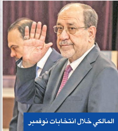
المالكي خلال انتخابات نوفمبر

رشح «الإطار التنسيقي الشيعي» العراقي، صاحب أكبر كتلة في البرلمان، رئيس الوزراء السابق نوري المالكي لرئاسة الحكومة المقبلة، مما حرك عجلة الاستحقاقات الدستورية، بدعوة البرلمان إلى انتخاب رئيس للجمهورية غداً.