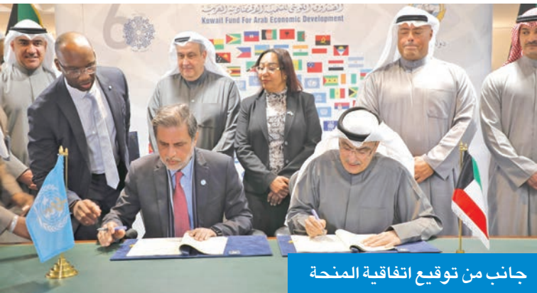
جانب من توقيع اتفاقية المنحة

بما يسهم في بناء منظومة أكثر شمولاً واستدامة. ولفت إلى دور البرنامج في تعزيز فرص التوظيف الشامل، إلى جانب دعم الجهود الوطنية في مجال الوقاية من تعاطي المواد المحظورة وتطوير خدمات العلاج وإعادة التأهيل وتمكين المتعافين من الاندماج الفاعل في المجتمع ضمن بيئة داعمة ومستدامة. من جهتها، قالت ممثلة الأمين العام للامم