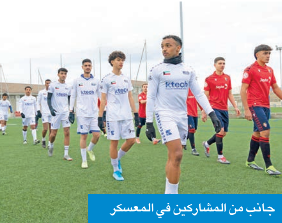
جانب من المشاركين في المعسكر

ومن أبرز محطات البرنامج زيارة ملعب إل سادار، حيث أطلع المشاركون على البنية التشغيلية والفنية لأحد أبرز الملاعب في الدوري الإسباني. كما تضمن المعسكر أنشطة ثقافية وترفيهية في مدينة بامبلونا وإقليم نافارا، في إطار رؤية متكاملة تهدف إلى بناء شخصية اللاعب وتوسيع آفاقه العالمية.