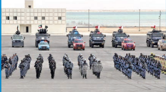
جانب من المشاركين في التمرين

بمشاركة قوات كويتية وخليجية وأميركية... وتنفيذ 70 فرضية بواقع 260 ساعة تدريب