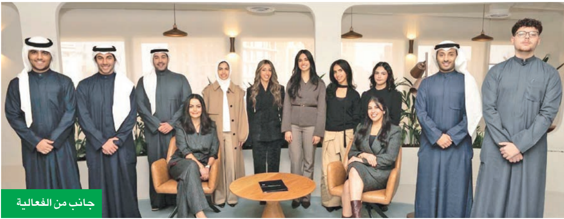
جانب من الفعالية

التي تمكّن الشباب وتسهم في إعداد جيل قيادي جديد في قطاع الاستثمار، مؤكدة أن هذا التعاون يعكس ثقافة مؤسسية راسخة تقوم على تبادل المعرفة والاستثمار، وأوضحت الشركة أن تبنيها لمثل هذه المبادرات يأتي في إطار استراتيجيتها الطويلة الأمد الرامية إلى تطوير الكفاءات الوطنية، وبناء قاعدة من المواهب الشابة القادرة على الإسهام بفعالية في نمو قطاع الاستثمار وتعزيز تنافسيته.