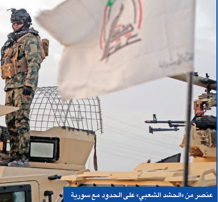
عنصر من «الحشد الشعبي» على الحدود مع سورية

وحسم الإطار ترشيح المالكي (75 عاماً) في ظل سياق إقليمي متشنج بين إيران والولايات المتحدة على الحدود الغربية للعراق، وتصاعد التوتر بين الحكومة السورية