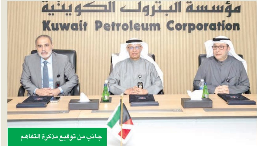
جانب من توقيع مذكرة التفاهم

والماء والطاقة المتجددة والماء والطاقة المتجددة يعكس التزام المؤسسة الراسخ بتوفير حلول مستدامة تدعم عملياتها النفطية وتلبي في الوقت ذاته احتياجات البلاد المستقبلية من الطاقة الكهربائية.