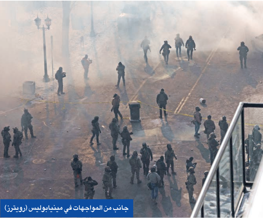
جانب من المواجهات في مينيابوليس

تيم والزن، المرشح السابق لمنصب نائب الرئيس مع كامالا هاريس، إدارة الهجرة والجمارك التي اعتبر أنها «تحت الفوضى والعنف»، منتقداً إدارة ترامب التي قال إنها «تسرعت في إصدار حكم خلال 15 دقيقة» بشأن الحادث،