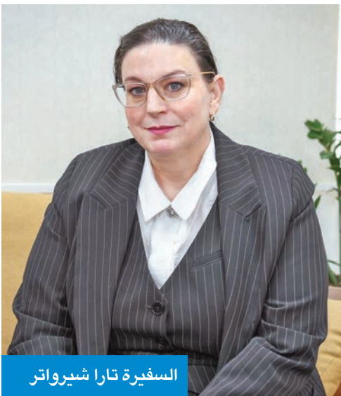
السفيرة تارا شيرواتر

لمستقبل العلاقات الكويتية - الكندية، التي وصفتها بالمتينة والمتجددة، والقائمة على شراكة استراتيجية تمتد أكثر من ستة عقود. كما سلطت الضوء على آفاق التعاون بين البلدين في مجالات حيوية تشمل الابتكار، والتجارة، والدفاع، والأمن، والتعليم، مؤكدة التزام كندا بتعزيز حضورها كشريك موثوق للكويت، ودعمها لأولوياتها التنموية والإقليمية، في إطار احترام متبادل للسيادة والمصالح المشتركة.