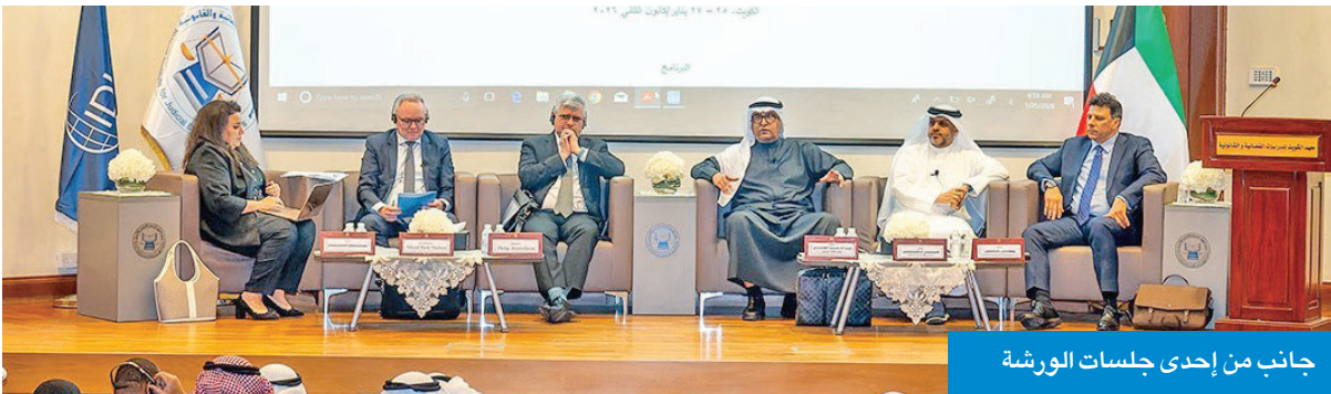
جانب من إحدى جلسات الورشة

السفغافورية، وتجربة مركز دبي المالي العالمي، وتجربة مصر، إلى جانب عدد من التجارب الأوروبية الرائدة. وتأتي الورشة ضمن إطار مؤسسي متكامل في سياق مشروع «تعزيز سيادة القانون في المجال الاقتصادي في الكويت... بناء القدرات القضائية»، الذي تنفذه المنظمة الدولية لقانون التنمية بالتعاون مع معهد الدراسات القضائية والقانونية، وبدعم من الصندوق الكويتي للتنمية، استناداً إلى مذكرة التفاهم الموقع بين الجهات المعنية، بما يعكس تكامل الجهود المؤسسية في تطوير الإطار القانوني والقضائي، وتعزيز العدالة الاقتصادية، ودعم بيئة الأعمال والاستثمار في الكويت.