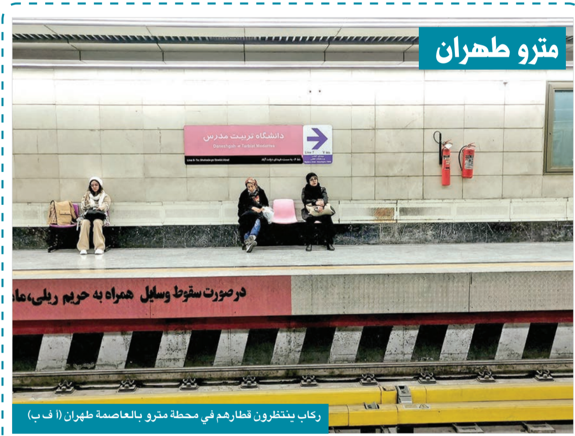
ركاب ينتظرون قطارهم في محطة مترو بالعاصمة طهران

ولكن ماذا عن شعراء العرب مثلاً قبل الإسلام، والخطباء، وأمثال سحبان بن وائل، الذي كان من أفصح العرب وبلغائهم، يضرب به المثل في البيان، فيقال «أفصح من سحبان». وقد جاء في دائرة معارف محمد فريد وجدي أن سحبان دخل يوماً عند معاوية ولديه فصحاء العرب وخطباء القبائل، فلما رآوه خرجوا خجلاً من قصورهم عنه إذا تكلموا، فقال له معاوية اضطب، فقال انظروا لي عصا. قالوا وما تصنع بها وأنت بحضرة أمير المؤمنين؟ قال وما كان يصنع بها موسى وهو يخاطب ربه؟ فأخذاها في يده فتكلم