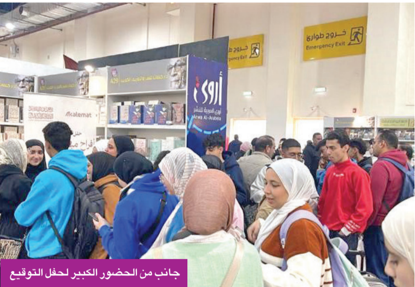
جانب من الحضور الكبير لحفل التوقيع

يُذكر أن الشاعرة أفراح مبارك الصباح من الوجوه البارزة على