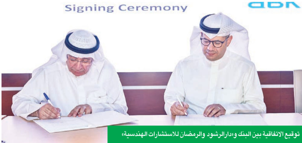
توقيع الاتفاقية بين البنك و«دار الرشود والرمضان للاستشارات الهندسية»

وباتي ذلك في إطار حرص البنك على أن يكون جزءاً من رحلة عملائه نحو تحقيق أحلامهم السكنية، في ظل التزامه الراسخ بمواصلة الابتكار وتقديم الأفضل دائماً ضمن خطته لتعزيز مكانته كمؤسسة مالية رائدة تضع احتياجات العملاء في صميم أولوياتها، وتقدم حلولاً مبتكرة تعزز تجربتهم المصرفية وتواكب تطوراتهم نحو حياة أكثر استقراراً ورفاهية.