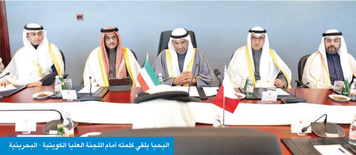
اليحيا يلقي كلمته أمام اللجنة العليا الكويتية - البحرينية

تكثيف التنسيق في مكافحة الإرهاب والتطرف حفاظاً على استقرار دولنا وأمن شعوبنا