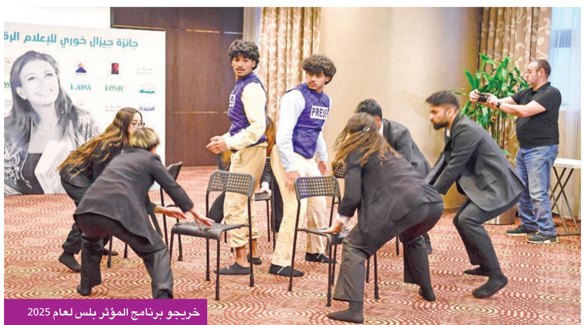
خريجو برنامج المؤثر بلس لعام 2025