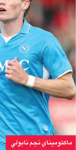
ماكتوميني نجم نابولي

يخوض ميلان، صاحب المركز الثاني برصيد 46 نقطة، بفارق ثلاث نقاط عن إنتر ميلان (المتصدر)، مواجهة صعبة أمام مضيفه روما، صاحب المركز الرابع بـ 42 نقطة، اليوم، ضمن الجولة الثانية والعشرين من الدوري الإيطالي لكرة القدم. ويدخل روما اللقاء منتشياً بفوز خارج أرضه على تورينو بهدفين دون رد، ليؤكد الفريق تطوره التكتيكي الملحوظ تحت قيادة المدرب جيان بييرو جاسبريني، الذي نجح في تحويل الفريق إلى قوة دفاعية ضاربة هي الأفضل في المسابقة حالياً، باستقبال 12 هدفاً فقط. وكذلك يخوض ميلان المباراة بمعنويات عالية، بعد فوزه الأخير على ليتشي بهدف دون رد. ويعتمد ميلان على توهج رافايل لياو وكريستوفر نوكوتو في الهجوم، مدعومين بخبر لوكا مودريتش في ضبط إيقاع خط الوسط، فيما يفقد الفريق خدمات المهاجم سانتياغو خيمينيز للإصابة. ويغيب عن صفوف روما إيفان فيرغسون وأرتيم دوفبيل للإصابة، مما يضع النقل الهجومي على عاتق باولو ديبالا وماتياس سولي. وفي قمة حفيظة بالدوري الإيطالي، يستضيف