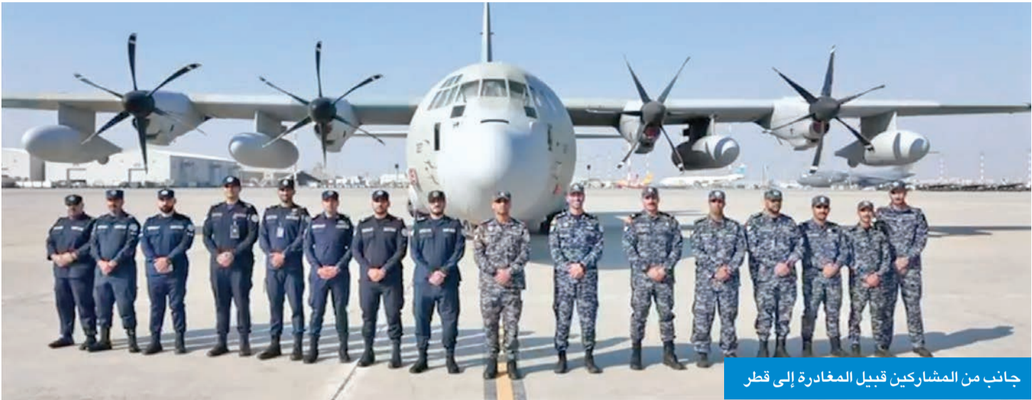
جانب من المشاركين قبيل المغادرة إلى قطر