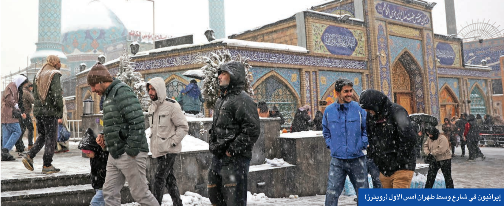
إيرانيون في شارع وسط طهران أمس الأول

طريق التوصل إلى اتفاق أفضل من ذلك الذي حققه الرئيس الأمريكي الأسبق، باراك أوباما، عام 2015 معها. وفي وقت تجد سلطات طهران نفسها محشورة براؤية ضغط ترامب الأقصى، ونسريبات عن سعيه إلى توجيه ضربة حاسمة لنظامها، صرح مسؤول إيراني رفيع بأن بلده «ستتعامل مع أي هجوم، سواء كان محدوداً أو شاملاً أو ضربة دقيقة أو استهدافاً عسكرياً مباشراً، أياً كان المسمى الذي يطلقونه عليه، على أنه حرب شاملة ضدها، وسترد عليه بأقوى طريقة ممكنة لحسم الأمر». وقال المسؤول، الذي تحدث لوسائل إعلام أميركية، «هذا الحشد العسكري، نامل ألا يكون الهدف منه مواجهة حقيقية، لكن جيشنا مستعد لأسوأ السيناريوهات، ولهذا فإن كل شيء في حالة تاهب قصوى داخل إيران». ونقلت البعثة الإيرانية لدى الأمم المتحدة عن المسؤول قوله: «إذا انتهك الأميركيون سيادة إيران وسلامة أراضيها، فسوف نرد»، وتابع: «ولا خيار أمام أي بلد يتعرض لتهديد عسكري مستمر من الولايات المتحدة سوى ضمان استخدام كل ما لديه من موارد للرد، وإن أمكن، استعادة التوازن ضد أي جهة تجرؤ على مهاجمة إيران».