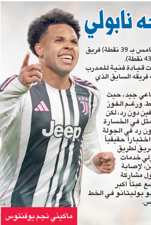
ماكيني نجم يوفنتوس

وقال مارتينيز: «البدء من الصفر أمر مهم عندما يتولى شخص ما منصب المدير الفني. لقد خلق جو إيجابي جداً، وقبل جميع اللاعبين التحدي. رونالدو كان نموذجاً، فهو لم يعد لاعباً على الأطراف، بل أصبح هدافاً ومُنهياً للهجمات».