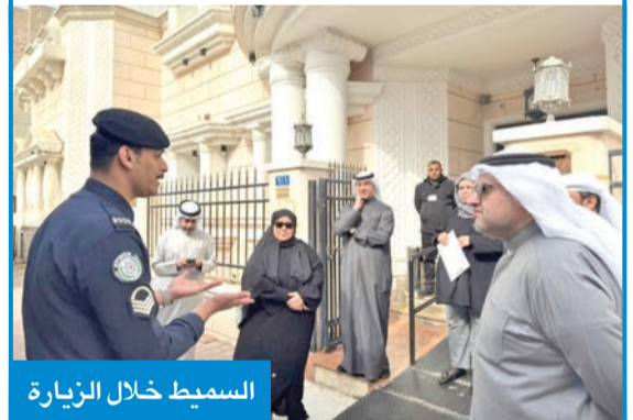
السميط خلال الزيارة

أكد وزير العدل، المستشار ناصر السميّط، أمس، أن مصلحة الطفل وراحته النفسية تمثلان المرتكز الأساسي للتطوير المرتقب في مراكز رؤية المحضونين. وذكرت وزارة العدل، في بيان صحافي، أن ذلك جاء خلال زيارة ميدانية للمستشار السميّط إلى مركز رؤية المحضونين بمنطقة الزهراء، برافقه وكالة وزارة العدل بالتكليف عواطف السند، ومجموعة من قيادي الوزارة، للاطلاع على سير العمل، والوقوف على احتياجات المراجعين والموظفين. وأضافت الوزارة أن «الزيارة تأتي في إطار المتابعة المباشرة وتحسين جودة الخدمات المقدمة، بما يراعي خصوصية الأطفال والأسر». وأوضحت أنها تأتي ضمن جهود الوزارة لتطوير آليات ونموذج عمل مراكز الرؤية، بما يسهم في توفير بيئة أكثر أماناً وملاءمة للأطفال، وتحسين تجربة الأسر المستفيدة من خدماتها.