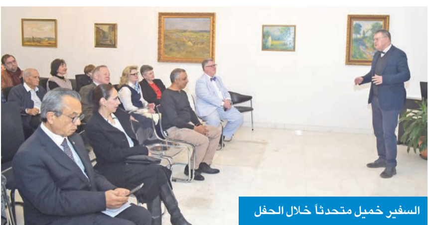
السفير خميل متحدثاً خلال الحفل

الجديدة، من بينها مذكرة تتعلق بالقطاع الصحي، مؤكداً أن التعاون لا يقتصر على تجديد الاتفاقيات السابقة، بل يشمل إطلاق شراكات