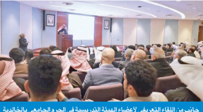
جانب من اللقاء التعريفي لأعضاء الهيئة التدريسية في الحرم الجامعي بالخالدية