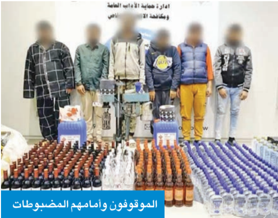
الموقوفون وأمامهم المضبوطات

تمكنت الإدارة العامة للمباحث الجنائية، ممثلة في إدارة حماية الآداب العامة ومكافحة الاتجار بالأشخاص، من ضبط مصنع يقوم بتصنيع مشروبات كحولية داخل إحدى الاستراحات بمنطقة كبد. وأوضحت وزارة الداخلية، في بيان أمس الأول، أنه بناءً على معلومات وتحريات دقيقة، جرت مصادمة الموقع، حيث تبين أنه مجهز تجهيزاً كاملاً بمعدات وأدوات متخصصة تستخدم في تصنيع المشروبات الكحولية، إضافة إلى عبوات وملصقات مطابقة للأصل تعود لمشروبات مستوردة، بقصد ترويجها وبيعها بطرق غير مشروعة داخل البلاد. وأسفرت العملية عن ضبط القانمين على المصنع، بالإضافة إلى كميات كبيرة من الزجاجات المعبأة الجاهزة للبيع، إلى جانب العثور على عدد من العبوات الفارغة وأجهزة تستخدم في تعبئة تلك العبوات، وجار إحالة المتهمين والمضبوطات إلى جهات الاختصاص لاتخاذ كل الإجراءات القانونية اللازمة بحقهم. وأكدت «الداخلية»، أنها ماضية في تنفيذ حملاتها الأمنية بكل حزم، ولن تتهاون في التعامل مع أي أنشطة غير مشروعة تمس أمن المجتمع وسلامته، مشددة على استمرار جهودها لضبط المخالفين وتقديمهم للعدالة وفقاً للقانون.