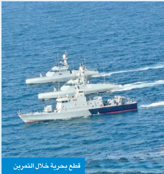
قطع بحرية خلال التمرين

رفع مستوى الجاهزية القتالية للوحدات المشاركة، وتعزيز التنسيق المشترك، وتوحيد المفاهيم التكتيكية في تنفيذ واشتملت فعاليات التمرين على تطبيق إجراءات القيادة والسيطرة عبر مراكز العمليات البحرية، والتدريب على عمليات البحث والإنقاذ، وإدارة الممارك البحرية، وصدد تهديدات الزوارق المسيّرة، إضافة إلى تنفيذ