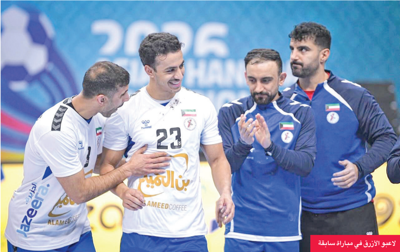
لاعبو الأزرق في مباراة سابقة

عشرة ظهرأ منتخب اليابان ب 3 نقاط منافسه العراقي من دون رصيد (المجموعة الأولى)، تليها في الثانية بعد الظهر مباراة الإمارات من دون رصيد مع قطر بنقطتين. وفي الرابعة عصرأ تلعب البحرين (4 نقاط) مع السعودية بنقطتين (المجموعة الثانية).