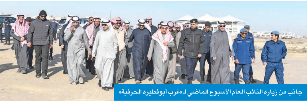
جانب من زيارة النائب العام الأسبوع الماضي لـ «غرب أبوفطيرة الحرفية»

خلال العام الماضي، فصلت محكمة الاستئناف في 62511 طعناً من أصل 67020 طعناً، بما يجاوز نسبة 93.3 في المئة، وسط تأكيد رئيس المحكمة المستشار محمد الرفاعي على أن الطعون التي لم يفصل فيها كانت لأسباب مبررة خارجة عن سلطة المحكمة، مثل تداولها أمام إدارة الخبراء أو غيرها من الجهات الفنية المختصة. وأشار رئيس محكمة إلى أن النسبة المشار إليها هي نسبة غير مسبوقة نظراً إلى زيادة عدد الطعون، وتناقص عدد وكلاء ومستشاري المحكمة لتزويد محكمة الاستئناف لمحكمة التمييز كل عام بعدد غير قليل من مستشاريها، وهو ما دعا إلى مضاعفة العمل، وإنشاء جلسات مسائية لمجابهة هذا الأمر في العام المذكور والأعوام التالية له، والتي يتوقع أن يقل فيها عدد