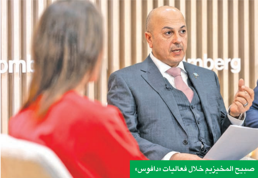
صبيح المخيزيم خلال فعاليات «دافوس»

واصل وزير المالية د. صبيح المخيزيم والتجارة خليفة العجيل سلسلة اللقاءات والتصريحات المتعلقة بالاقتصاد الكويتي وتطلعاته المستقبلية، من خلال ترؤسهما وفد الكويت في الاجتماع السنوي الـ 56 للمنتدى الاقتصادي العالمي «دافوس». وأكد وزير المالية وزير الكهرباء والماء والطاقة المتجددة وزير الدولة للشؤون الاقتصادية والاستثمار بالوكالة د. صبيح المخيزيم التزام الحكومة بمواصلة تنفيذ الإصلاحات الاقتصادية الهادفة إلى تنويع مصادر الدخل وتعزيز الاستفادة المالية، مشيراً إلى أن المرحلة المقبلة ستشهد خطوات عملية في عدد من القطاعات الحيوية، وفي مقدمتها الإسكان والاقتصاد غير النفطي.