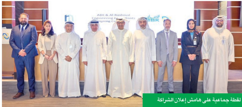
لقطة جماعية على هامش إعلان الشراكة