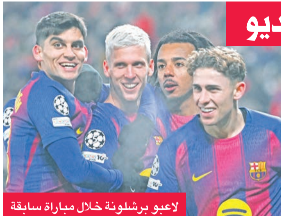
لاعبو برشلونة خلال مباراة سابقة

يسعى برشلونة للعودة إلى سكة الانتصارات، وذلك عندما يواجه ضيفه ريال أوفيديو، اليوم، ضمن المرحلة الحادية والعشرين من الدوري الإسباني لكرة القدم. ورغم أن أوفيديو لا يشكل تهديداً كبيراً لبرشلونة، بعد فوزه بمباراتين من أصل 20، بدرك الفريق الكاتالوني أهمية استعادة نغمة الانتصارات، بعد خسارته أمام ريال سوسيداد