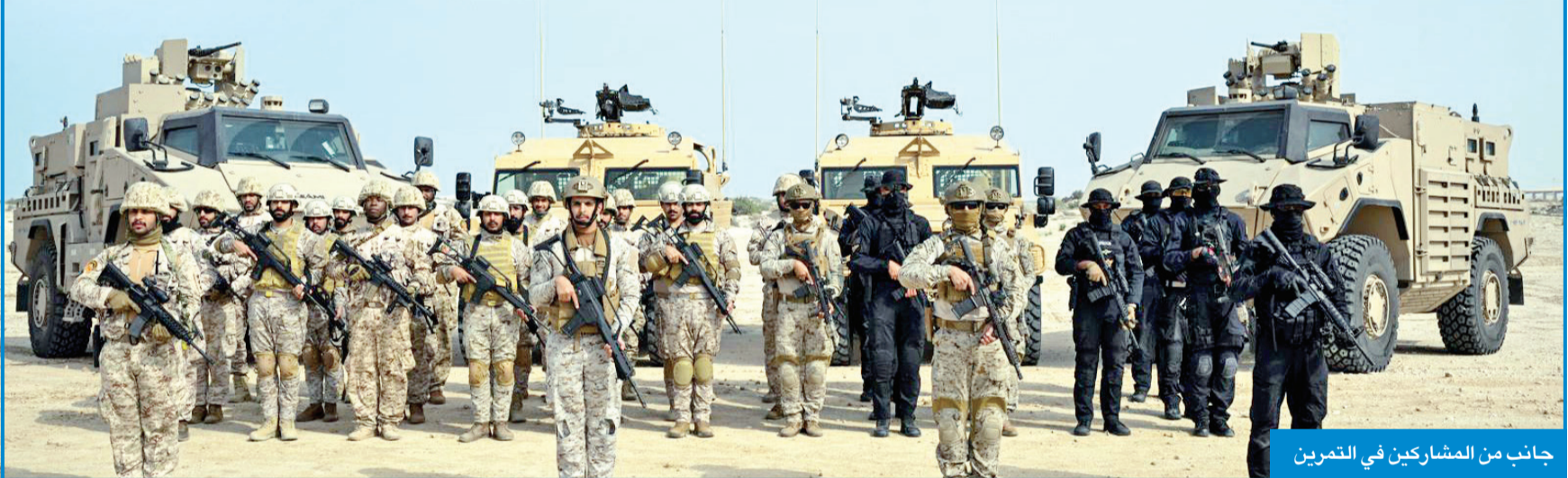
جانب من المشاركين في التمرين