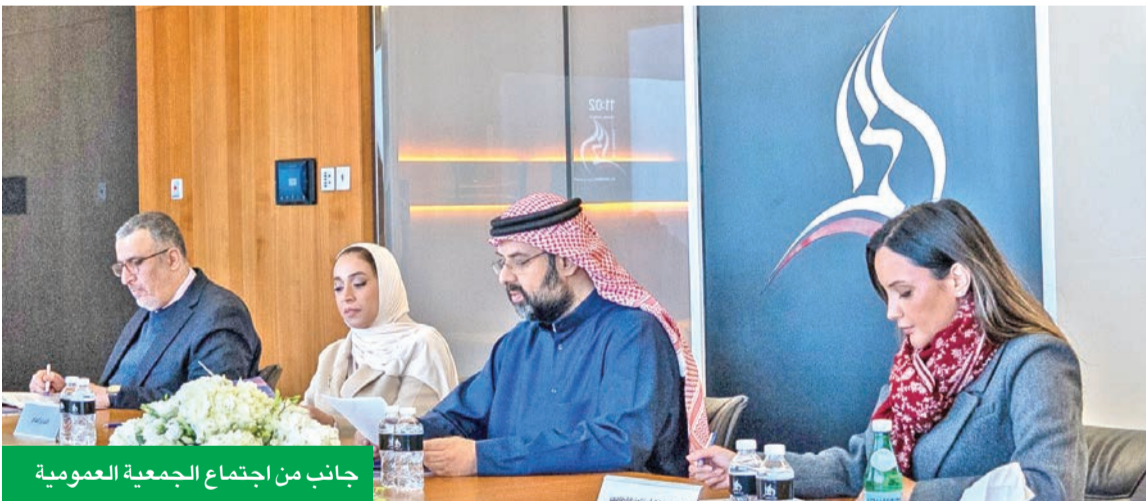
جانب من اجتماع الجمعية العمومية

الخليفة: الشركة تمضي بثبات نحو مرحلة جديدة من النمو النوعي