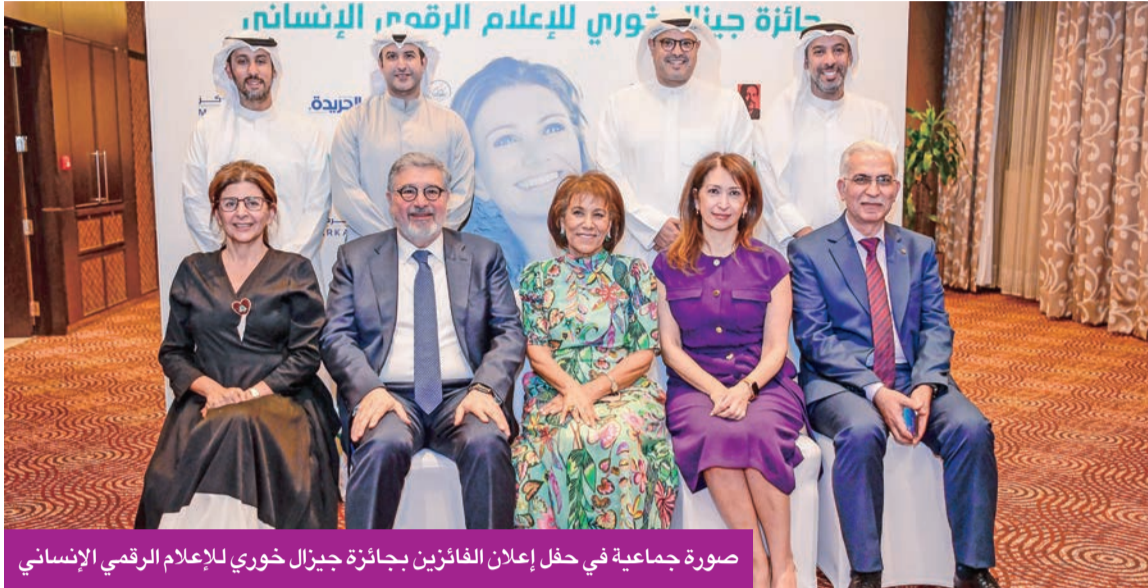
صورة جماعية في حفل إعلان الفائزين بجائزة جيزال خوري للإعلام الرقمي الإنساني

الأكاديمية التابعة للابا - لويك تحصد النجاح والتفوق للعام السادس على التوالي