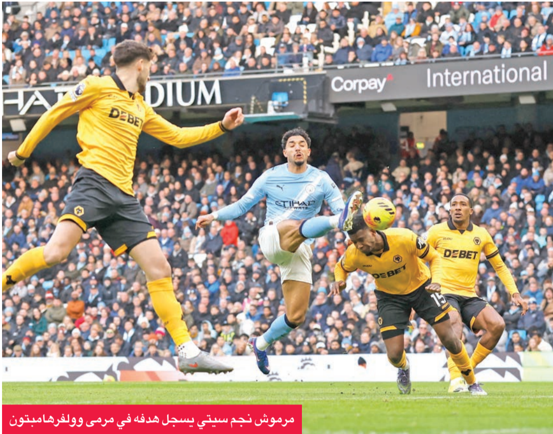
مرموش نجم سيتي يسجل هدفه في مرمى وولفرهامبتون