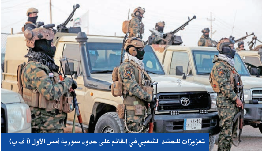
تعزيزات للحشد الشعبي في القائم على حدود سورية أمس الأول

أنه مع اقتراب الموعد النهائي، عززت «قسد» مواقعها الدفاعية في مدن القامشلي والحسكة وعين العرب (كوباني) وستعدادا لمعارك محتملة. وفي خضم حالة الاضطراب في سورية، يضطلع الجيش الأميركي بمهمة نقل نحو 7 آلاف معتقل من مقاتلي تنظيم داعش، عبر الحدود، إلى العراق.