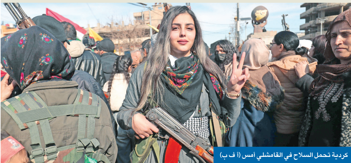
كردية تحمل السلاح في القامشلي امس

وقف إطلاق نار 4 أيام لوضع خطة لدمج المناطق الكردية في الدولة السورية براك يوجه «رصاص الرحمة» لـ «قسد»: دورها العسكري انتهى ولا ندعم الفدرالية