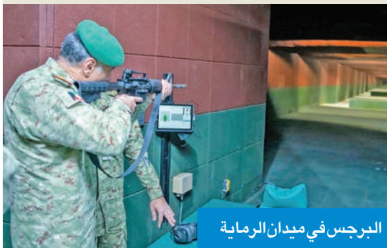
البرجس في ميدان الرماية

قام وكيل الحرس الوطني، الفريق الركن حمد البرجس، بجولة تفقدية في ميدان الشهداء بمعسكر الصمود، نقل خلالها المنتسبين تحيات القيادة ممثلة في رئيس الحرس الوطني الشيخ مبارك الحمود، ونائبه الشيخ فيصل النواف، وتقديرها لجهودهم في القيام بالمهام المنوطة بهم.