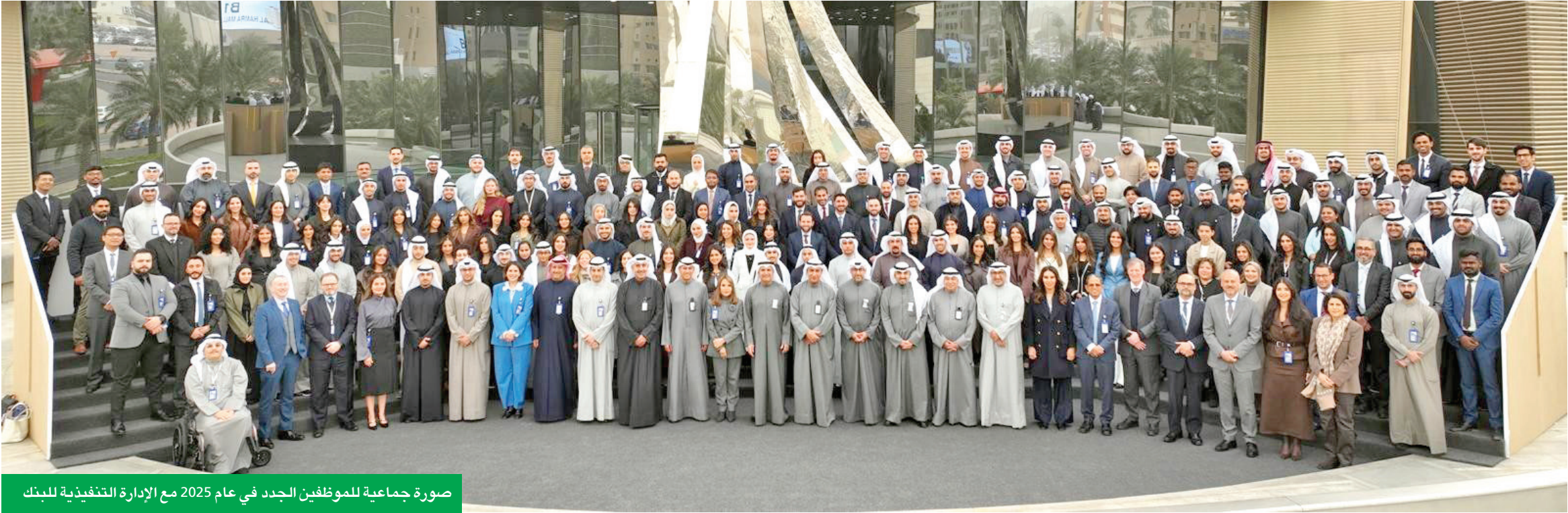
صورة جماعية للموظفين الجدد في عام 2025 مع الإدارة التنفيذية للبنك

ومسارات قيادية وأكاديميات متخصصة تهدف إلى تزويد الكفاءات الكويتية بمهارات عالمية المستوى. وتشمل منظومة التطوير في البنك برامج تأسيسية للخريجين الجدد ومسارات قيادية للموظفين ذوي الإمكانيات العالية وأكاديميات متخصصة في الأمن السيبراني والبيانات والنحول الرقمي، بالإضافة إلى برامج تدريب مع مؤسسات عالمية.