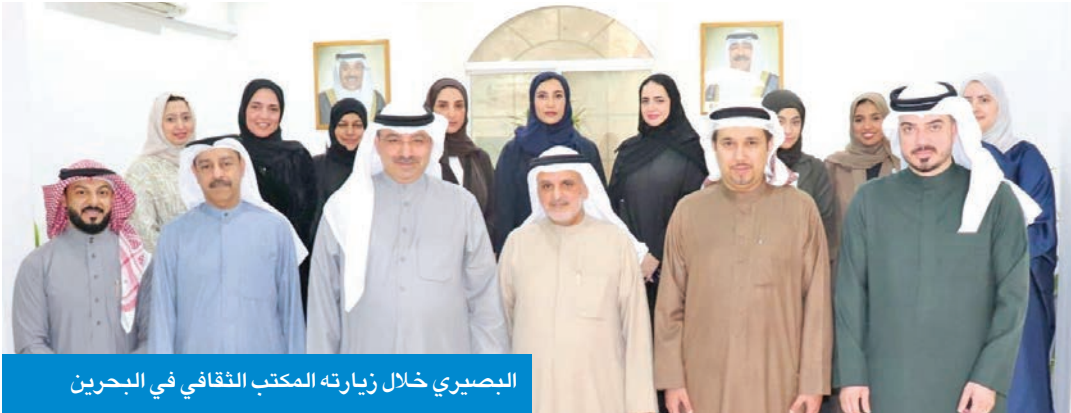
البصري خلال زيارته المكتب الثقافي في البحرين

أكد وكيل وزارة التعليم العالي، د. بدر البصري، أن الوزارة تولي اهتماماً بالغاً بتجربة بيئة تعليمية داعمة لأبنائها الطلبة في الخارج، بما يساهم في رفع جودة مخرجات الابتعاث وتحقيق الأهداف الوطنية في إعداد كوادر مؤهلة قادرة على المساهمة في مسيرة التنمية. جاء ذلك خلال زيارته الرسمية للمكتب الثقافي للكويت في مملكة البحرين، أمس، في إطار حرص «التعليم العالي» على المتابعة الميدانية لأوضاع الطلبة الكويتيين الدارسين في الخارج وتعزيز التنسيق مع المكاتب الثقافية. وبحث البصري، خلال الزيارة، عدداً من الموضوعات المتعلقة بالشان الأكاديمي والطلابي، والإطلاع على سير العمل في المكتب الثقافي، وآليات متابعة أوضاع الطلبة، إلى جانب مناقشة سبل تطوير الخدمات المقدمة لهم، وتسهيل الإجراءات الأكاديمية والإدارية، بما يضمن استقرارهم الدراسي وتهيئة البيئة المناسبة لتحقيق التميز العلمي. وأكد البصري، في تصريح، أن هذه الزيارة تأتي ضمن توجيهات الوزير د. نادر الجلال بأهمية التواصل المباشر مع المكاتب الثقافية والوقوف على احتياجات الطلبة الدارسين في الخارج عن قرب، مشدداً على أهمية الدور الذي تضطلع به هذه المكاتب في تقديم الإرشاد الأكاديمي والمتابعة المستمرة، وتعزيز العلاقة مع المؤسسات التعليمية في دول الابتعاث. وأشاد البصري بالجهود التي يبذلها المكتب الثقافي بالبحرين في رعاية الطلبة ومتابعة شؤونهم، والتنسيق المستمر مع الجامعات والمؤسسات التعليمية، بما يخدم مصلحة الطلبة ويعزز من كفاءة منظومة الابتعاث.