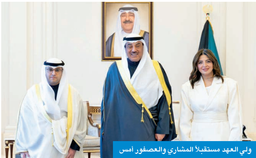
ولي العهد مستقبلاً المشاري والعصفور أمس

استقبل سمو ولي العهد الشيخ صباح الخالد، بقصر بيان صباح أمس، وزير الدولة لشؤون البلدية ووزير الدولة لشؤون الإسكان عبداللطيف المشاري، حيث قدّم لسموه مديرة بلدية الكويت المهندسة منال العصفور، وذلك بمناسبة تعيينها في منصبها الجديد.