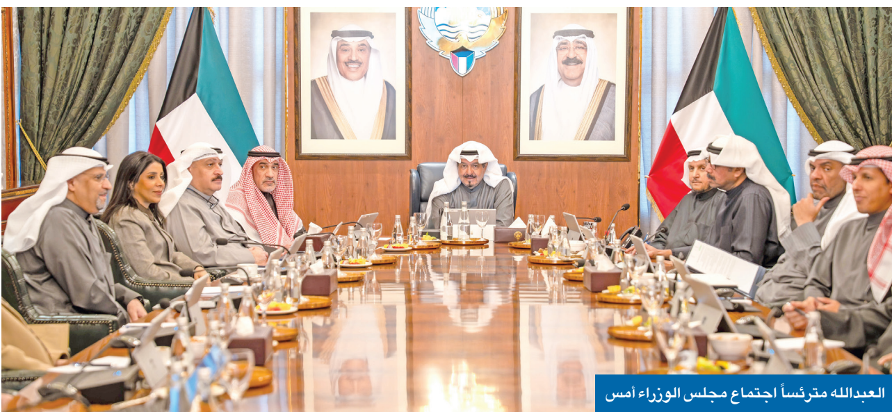
العبدالله مقررثسا اجتماع مجلس الوزراء امس

يحقّق التوازن بين متطلبات حماية الأمن الوطني وصون الحريات الدستورية