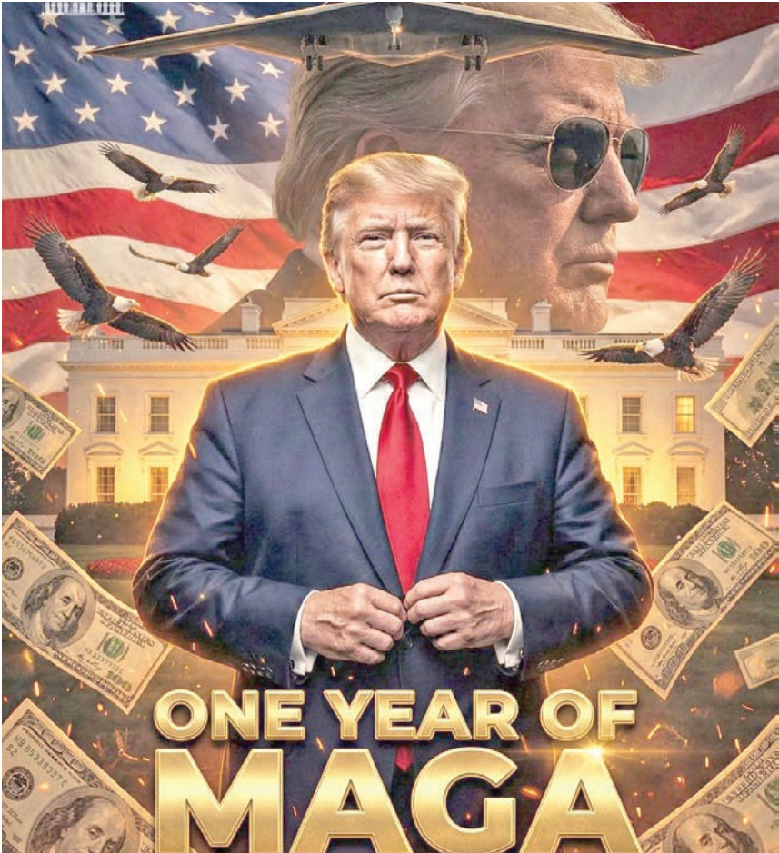
نشر البيت الأبيض هذه الصورة لترامب في ذكرى عام على تسلمه الرئاسة مع الرسالة التالية: «قبل عام، تغير كل شيء، عودة القوة، عودة أميركا أولاً، عصر الفوز هنا... ولا يزال في بداياته»

إلى ذلك، تعهدت رئيسة المفوضية الأوروبية، أورسولا فون دير لاين، أمس، برّد «حارم» على تهديدات ترامب المتكررة بشأن غرينلاند وزيادة التعريفات الجمركية. وقالت من على منصة المنتدى الاقتصادي العالمي في دافوس «نحن نعتبر الشعب الأمريكي ليس حليفاً لنا فحسب، بل صديقاً أيضاً، أما دفعنا إلى دواية من التوتر فلن نغيد إلا الخصوم الذين نحن عازمون جميعاً على ردعهم». إلى ذلك، دعا حاكم ولاية كاليفورنيا الديمقراطي، جافين نيوسوم، أمس، الأوروبيين إلى التصدي لترامب وأضاف: «نحلو بالحرم والصلابة».