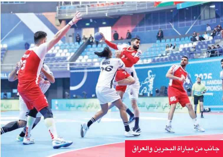
جانب من مباراة البحرين والعراق

عبدالله الخميس على أن اللاعبين يتحملون مسؤولية الأخطاء التي ظهرت في مباراة الإمارات، مؤكداً أن الفريق سيعمل على تلافيها في المواجهات المقبلة. وأشاد الخميس بالدور الكبير للجماهير الكويتية، التي وصفها بـ «النجم الحقيقي»، مؤكداً أن اللاعبين يسعون إلى رد الجميل للجماهير، وتقديم أفضل المستويات في الأدوار الرئيسية.