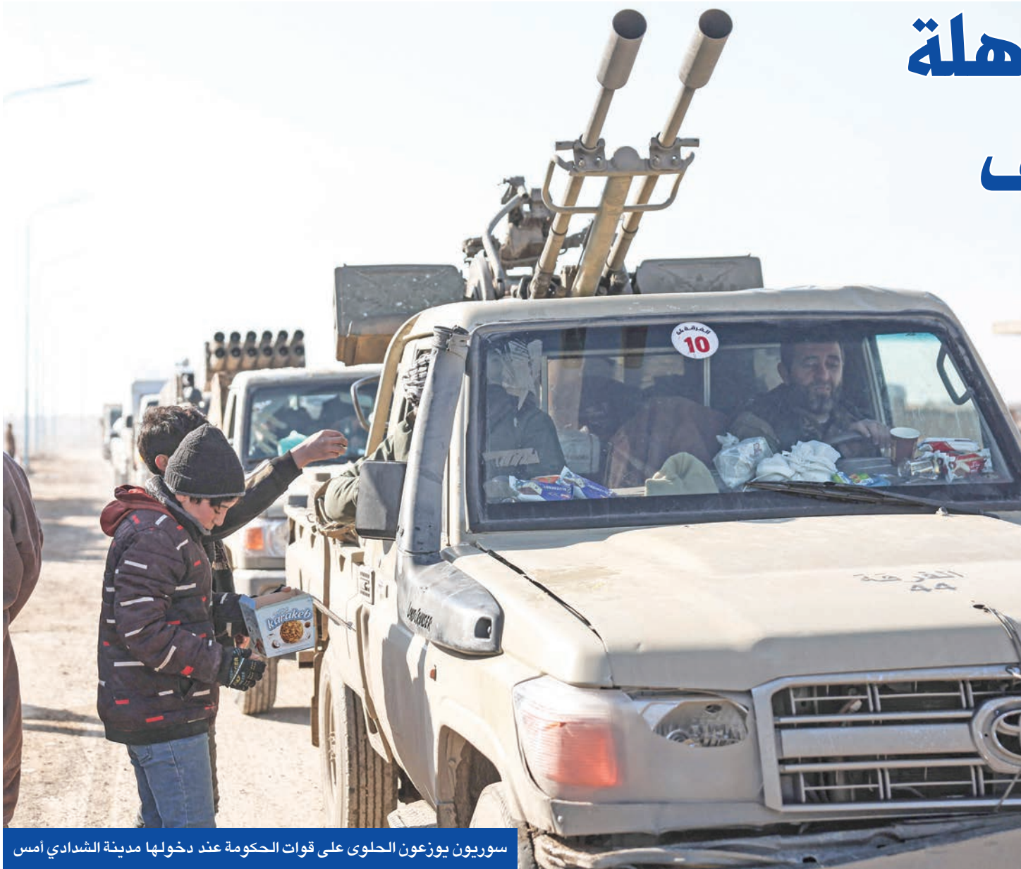
سوريون يوزعون الحلوى على قوات الحكومة عند دخولها مدينة الشدادي أمس

الشرع وترامب يؤكدان وحدة الأراضي السورية وضمنان حقوق الأكراد ضمن الدولة