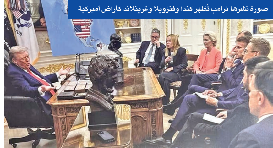
صورة نشرها ترامب تُظهر كندا وفنزويلا وغرينلاند كإراض أميركية

واقترح ماكرون عقد اجتماع لمجموعة السبع في باريس بعد دافوس، مع إمكانية دعوة ممثلين عن أوكرانيا والدنمارك وسورية وروسيا على هامش اللقاء. وفي وقت لاحق، قال ماكرون في فعالية خلال المنتدى الاقتصادي العالمي في دافوس، وبحسب الرسائل، قال ماكرون لترامب إن الطرفين «متفقان تماماً بشأن سورية، ويمكنهما تحقيق إنجازات كبيرة في ملف إيران»، معرباً في الوقت نفسه عن عدم فهمه للموقف الأمريكي بشأن غرينلاند.