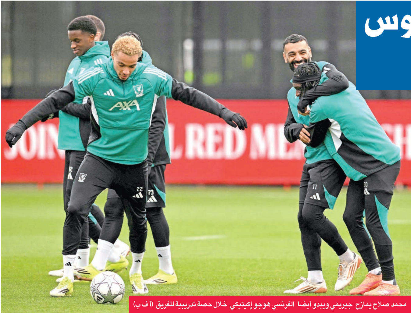
محمد صلاح يمازح جيريمي ويبو أيضا الفرنسي هوجو إكيتيكي خلال حصّة تدريبية للفريق

الفريق الكتالوني يغيب عنه نجمه لامين يامال للإيقاف وهذافه فيران توريس للإصابة