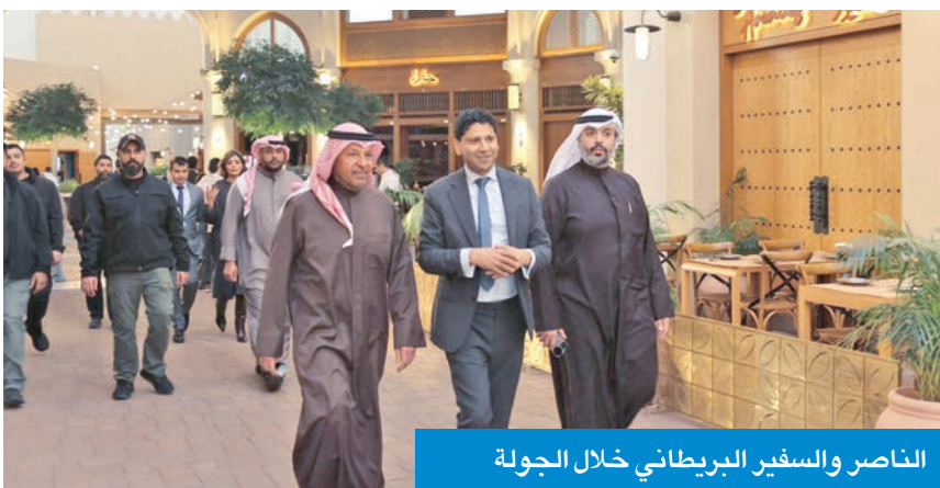
الناصر والسفير البريطاني خلال الجولة

الرياضية والمجتمعية. وجرى خلال اللقاء بحث سبل تعزيز الأنشطة الرياضية التي تستهدف مختلف فئات المجتمع، وأهمية نشر ثقافة الرياضة للجميع، لما لها من دور في تعزيز الصحة العامة وترسيخ القيم الإيجابية، إلى جانب مناقشة عدد من المبادرات والبرامج المستقبلية المشتركة. وأشاد المحافظ بالدور الذي يقوم به اتحاد الرياضة للجميع في خدمة المجتمع وتعزيز المشاركة الرياضية، مؤكدا دعم محافظة الفروانية لكل الجهود التي تسهم في تطوير الأنشطة الرياضية والمجتمعية وتحقيق الأهداف الوطنية في هذا المجال. وفي ختام اللقاء، ثخن الضيوف دعم المحافظ المتواصل للمبادرات الرياضية والمجتمعية، وحرصه الدائم على تعزيز الشراكة مع مؤسسات المجتمع بما يخدم المصلحة العامة.