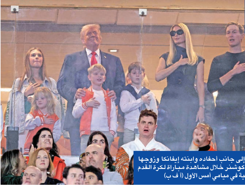
ترامب إلى جانب أخفاده وابنته إيفانكا وزوجها غاريد كوشنر خلال مشاهدة مباراة لكرة القدم الأميركية في ميامي أمس الأول (أ ف ب)