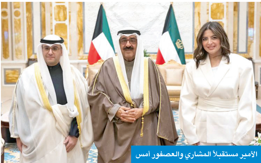
الأمير مستقبلاً المشاري والعصفور أمس

استقبل سمو أمير البلاد الشيخ مشعل الأحمد، في قصر بيان صباح أمس، وزير الدولة لشؤون البلدية ووزير الدولة لشؤون الإسكان عبداللطيف المشاري، حيث قدّم لسموه مديرة بلدية الكويت المهندسة منال العصفور، وذلك بمناسبة تعيينها في منصبها الجديد.