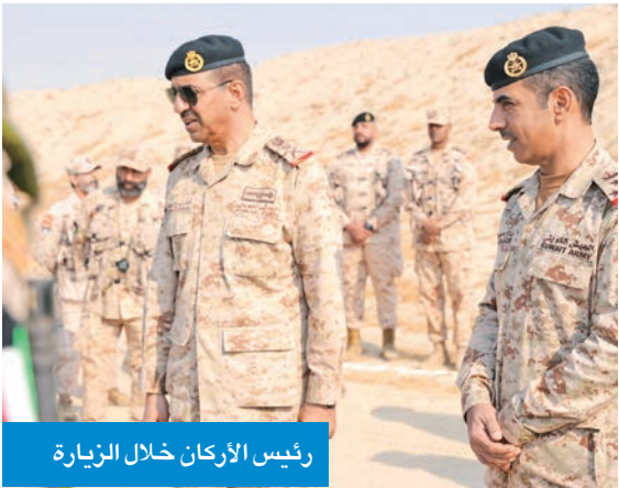
رئيس الأركان خلال الزيارة