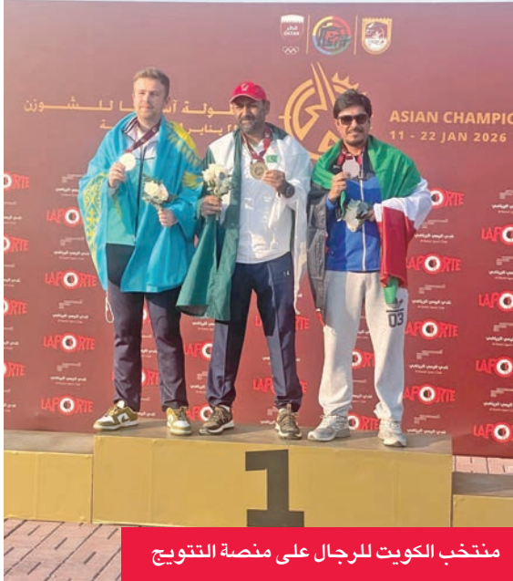
منتخب الكويت للرجال على منصة التتويج