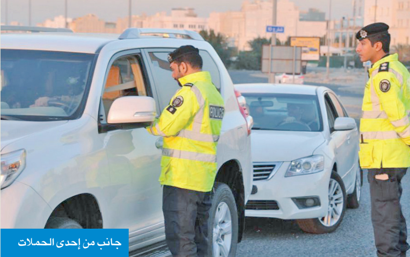
جانب من إحدى الحملات

● إحالة 25 حدثاً إلى نيابة الأحداث وضبط 45 مستهتراً