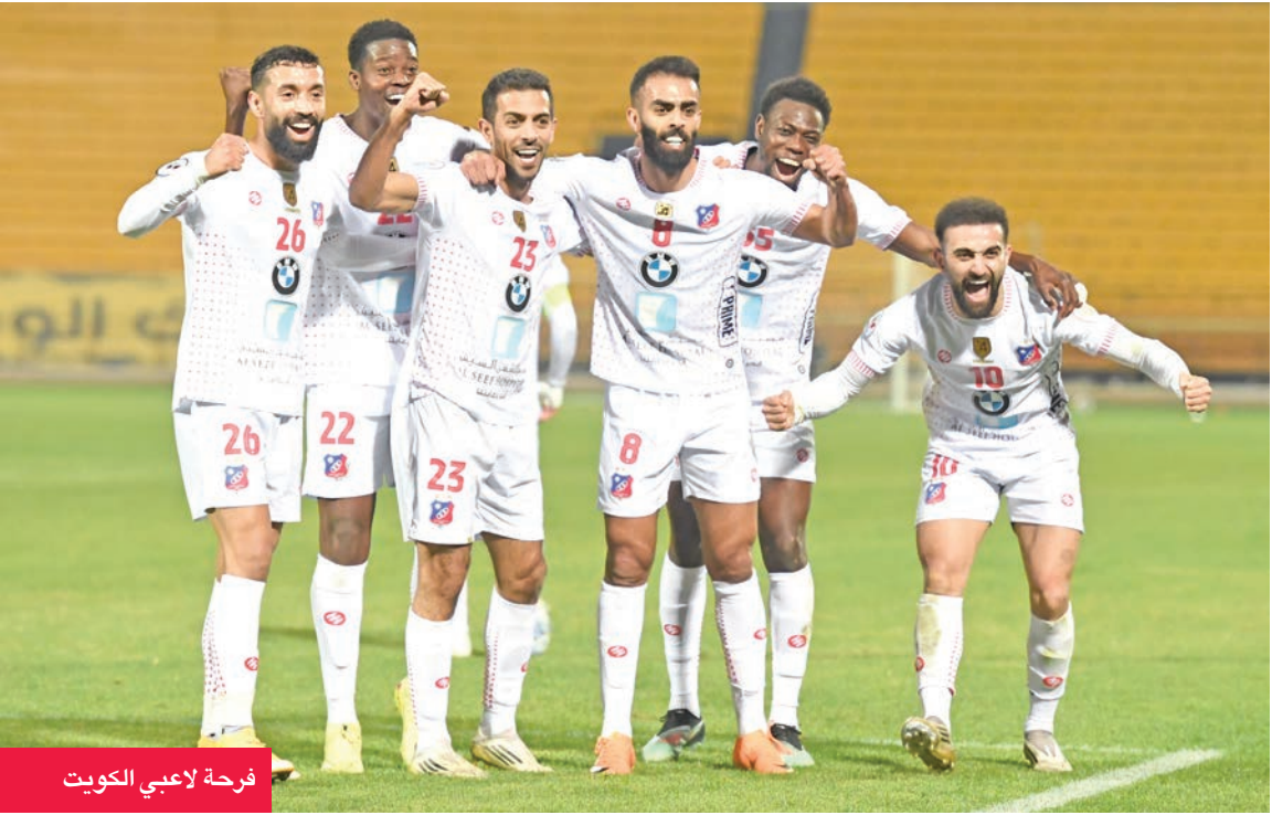
فرحة لاعبي الكويت