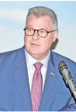
بتلر متحدثاً خلال الفعالية

إلى أن الأمن السيبراني يمثل الأساس الذي يقوم عليه هذا التحول، وهو الركيزة التي تضمن نجاح أي مستقبل رقمي آمن ومستدام. وذكر أن الولايات المتحدة قامت بإيفاد خبراء متخصصين إلى الكويت لتقديم عرض حول الأمن السيبراني، معرباً عن أملة بأن تسهم هذه الخطوة في بناء شراكات جديدة، وتطوير قنوات تواصل فعالة، وإقامة علاقات تعاونية تسهم في دفع هذا الملف الحيوي إلى الأمام. وشدد بتلر على أن تعزيز التعاون الكويتي - الأميركي في مجال الأمن السيبراني سيحقق فوائد مشتركة، ويخدم مصالح البلدين، ويسهم في دعم مستقبل