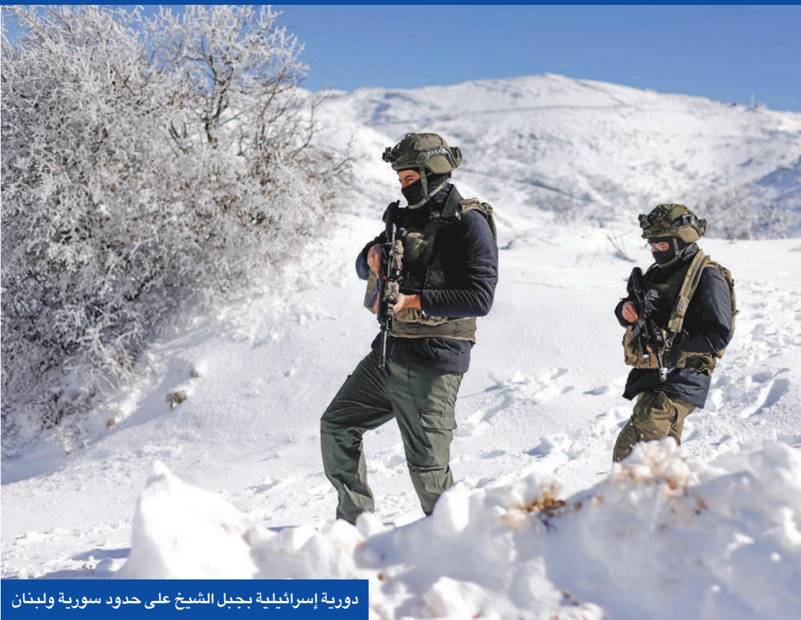
دورية إسرائيلية بجبل الشيخ على حدود سورية ولبنان