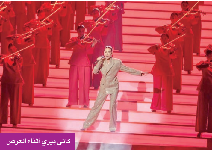
كاتي بيرى أثناء العرض

وفي مفاجأة من العيار الثقيل، هزت كاتي بيرى أرجاء المسرح بعرض مذهل فاجأ الجميع، من حيث الأغنية وتقنيات الصوت التي تفاعل معها جميع الحضور بالتصفيق، هذا بالإضافة للالعب النارية التي ملأت سماء الحفل، معلنة بدء حفل صنّاع الترفيه 2026. وأطلقت بيرى ببذلة ذهبية لامعة ومن ورائها فريق كبير من مؤدي الاستعراضات، في عملٍ جمع بين