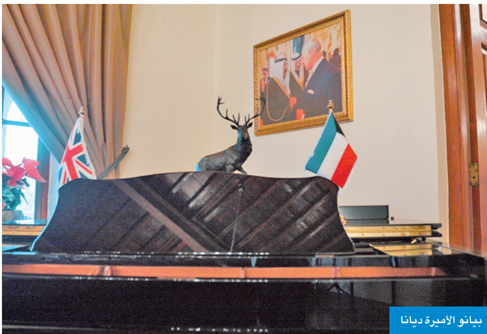
بيانو الأميرة ديانا

يختصر شواهد كثيرة... وينبض بعلاقات وطيدة بين الكويت والمملكة المتحدة