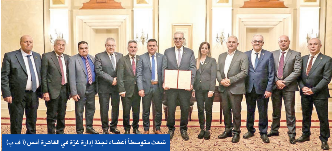
شعت متوسطاً أعضاء لجنة إدارة غزة في القاهرة أمس

تركيا وقطر إلى مجلس الإدارة المؤقت لغزة، مقترحاً حلّاً بديلاً يتمثل في تولي مصر إدارة القطاع خلال الـ 15 عاماً القادمة. من جهة ثانية، أشارت «يديعوت أحرونوت» إلى أن الرئيس الأميركي قد يسند إلى مجلس السلام دوراً أكبر بكثير من إدارة غزة، حتى أن البعض بدأ يطلق عليه تسمية «أم ترامب المتحدة». وكشفت أنه «في ليلة السبت، تبين أن ترامب وجه دعوة إلى نتنياهو ليكون عضواً في المجلس، أو من يذوب عنه. وقد وُجّهت الدعوة إلى قادة أكثر من 50 دولة، كان أحدث من كشف عنهم رئيس وزراء باكستان شهباز شريف. ولفتت الصحيفة العبرية إلى أن «حتى الآن، ومن خلال بيانات رسمية وتقارير إعلامية، تبين أن الأرجنتين وكندا وفرنسا والمانيا وأستراليا والبنانيا والبحرين ومصر وتركيا، قد تلقت دعوات للمشاركة في مجلس السلام». ولم تؤكد أي من هذه الدول رسمياً انضمامها إلى الكيان الجديد الذي يسعى ترامب لأن يحل محل «الأمم المتحدة، بحل النزاعات الدولية خلال ولايته. وذكر أن «بحسب تقرير نشرته وكالة بلومبرغ، يطالب ترامب كل دولة ترغب في أن تصبح عضواً دائماً في المجلس»، بأن تساهم بمبلغ لا يقل عن مليار دولار في السنة الأولى بعد توقيع معاهدة الانضمام، مبيّنة أن مشروع إنشاء المجلس، الذي حصلت عليه «بلومبرغ»، ينص على ما يلي «لا تتجاوز مدد عضوية كل دولة عضو في المجلس 3 سنوات من تاريخ التوقيع، رهناً بموافقة الرئيس».