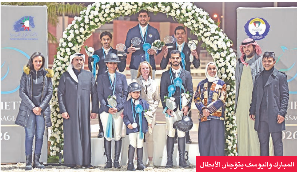
المبارك واليوسف يتوجان الإبطال

اليوسف إن «مضمار اتحاد الشرطة شهد العديد من الفعاليات الرياضية في الفترة الأخيرة، ولدينا العديد من بطولات الفروسية في الفترة الحالية»، وبدورها، أشارت الفارسة الشيخة فجر الصباح إلى أن «فروسية ترويض الخيل بدأت في الانتشار، وهي أساس ركوب الخيل، وشهد الموسم الرياضي الحالي 2026-2025 تنظيم العديد من الفعاليات والأنشطة الخاص بترويض الخيل بدعم من الاتحاد الكويتي للفروسية، وبالتنسيق مع الهيئات الدولية المختصة بالدريساچ».