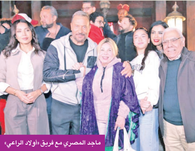
ماجد المصري مع فريق «الولاد الراعي»

ويتواجد الفنان ماجد المصري في بطولته المطلقة الأولى رمضانياً، عبر مسلسل «الولاد الراعي» من 30 حلقة. وتشارك الفنانة ياسمين عبدالعزيز على مدار الشهر الكريم بمسلسلها «ونسي اللي كان»، بمشاركة كريم فهمي وخالد سرحان. ويتواجد كعادته على مدار الشهر الفضلي عمرو سعد بمسلسل «إفراج» للعام السادس على التوالي. ويقدم الفنان حمادة هلال مسلسل «المداخ 6». ويتواجد الفنان محمد إمام بمسلسل «الكننج»، بمشاركة حنان مطاوع وميرنا جميل، كما يقدم الفنان محمد رجب مسلسله «قطر صغوط» في 30 حلقة خلال الموسم الرمضاني.