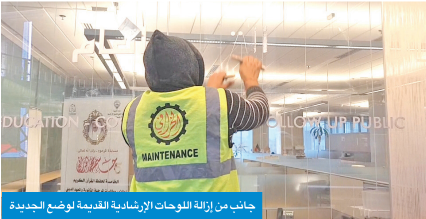
جانب من إزالة اللوحات الإرشادية القديمة لوضع الجديدة

القديمة في النظم المتكاملة إلى مراكز العمل الجديدة وفق الهيكل الجديد، لافتة إلى أن جميع القرارات يتم اعتمادها بعد مراجعة الجهات المختصة، والتأكد من سلامة الوضع القانوني للموظفين.