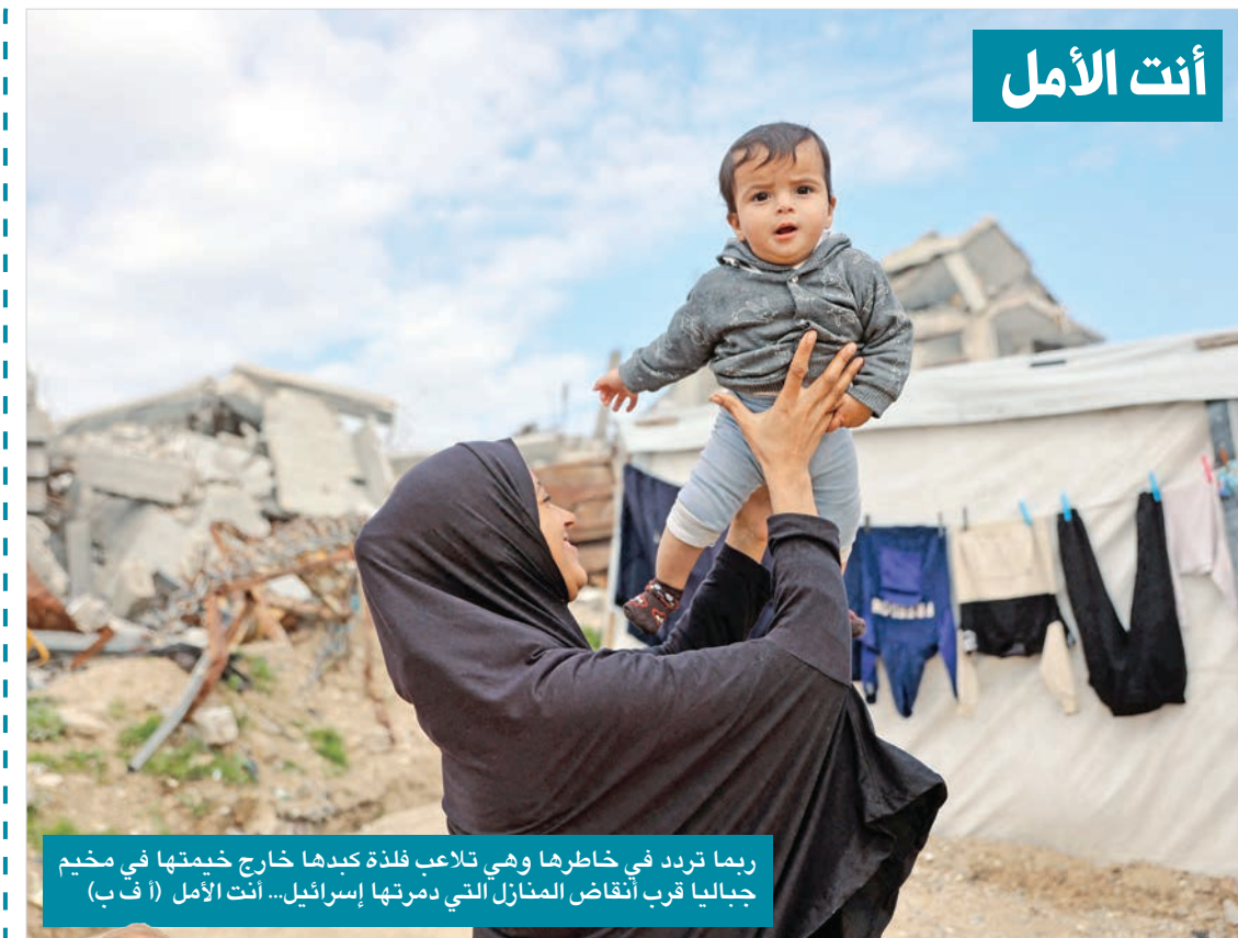
ربما تردد في خاطرها وهي تلاعب فلذة كبدها خارج خيمتها في مخيم جباليا قرب انتقاض المنازل التي دمرتها إسرائيل... أنت الأمل