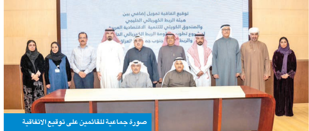
صورة جماعية للقاءين على توقيع الاتفاقية

«كن من المتفوقين» قام بجولة تاريخية وثقافية للتعرف على أهم المعالم الرئيسية في العاصمة الأوزبكية «طشقند»، بدءاً من المرور بمركز الحضارة الإسلامية، ثم زيارة مجمع «حضرة الإمام» المركز التعليمي في آسيا الوسطى الذي يتضمن ضريح المعلم أبي بكر محمد أول الدعاة للإسلام في طشقند، إضافة إلى عدة مدارس مدرجة في قائمة اليونسكو للتراث العالمي، ثم قام وفد الطلبة بزيارة ساحة الاستقلال في قلب العاصمة. وأشار الصندوق أن الوفد ختم جولته بالذهاب إلى ميدان الأمير تيمور الذي يعود بناؤه إلى القرن التاسع عشر احتفاءً بالقاءد تيمور. وعلى مستوى رحلة الطالبات ذكر الصندوق أنه بعد المرور بأحد أهم مشاريع النقل الممولة من قبل الصندوق، وهو مشروع طريق (بادارالارنج -تشيولوني السريع) في جمهورية إندونيسيا، قامت الطالبات المتفوقات ضمن رحلة «كن من المتفوقين» بجولة ثقافية في متحف «Gedung Sate» بمدينة باندونغ، شملت لقاء مع ممثلي الحكومة المحلية، واستكشافاً للتراث الإندونيسي من خلال أنغام آلة الأكونغ المدرجة ضمن قائمة اليونسكو للتراث الثقافي، واختتمت الجولة بتجربة تفاعلية لإعداد الماتشا.