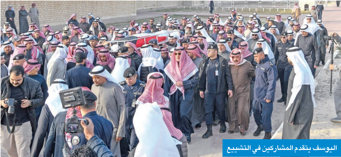
اليوسف يتقدم المشاركين في التشيع

وسمو رئيس الوزراء الشيخ أحمد العبدالله. يذكر أن العقيد سعود الخمسان الذي كان يشغل منصب مدير إدارة الخدمات الأمنية المساندة للإدارة العامة للمؤسسات الإصلاحية أصيب الأسبوع الماضي مع اثنين من زملائه في العمل أثناء اندلاع حريق بشكل مفاجئ خلال إجراء أعمال صيانة بمبنى الإدارة نقل على وفاته مساء أمس الأول.