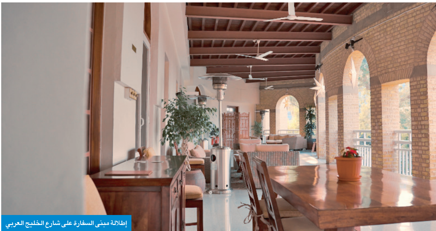
إطلالة مبنى السفارة على شارع الخليج العربي

ولدى دخولك البيت تشعر بالانبهار لوجود صور حكام وملوك وأمراء وشيوخ وشخصيات تاريخية على جدرانها، التي تفوح بعشق التاريخ وعبقه بالإضافة إلى تحف وقطع ثمينة، وأول ما بلغت انتباهك هو صندوق المبيت الذي يتم تخزين