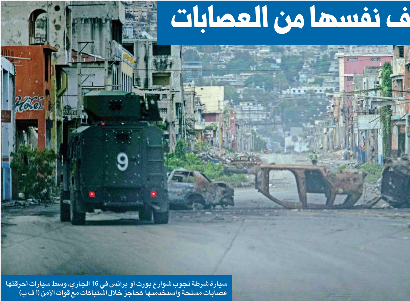
سيارة شرطة تجوب شوارع بورت أو برانس في 16 الجاري، وسط سيارات أحرقتها عصابات مسلحة واستخدمتها كحاجز خلال اشتباكات مع قوات الأمن

شركة الجريدة للصحافة والنشر والتوزيع تلفون: 1828111 - داخلي: 700 - فاكس: 22252537 البريد الإلكتروني: ads@aljarida.com