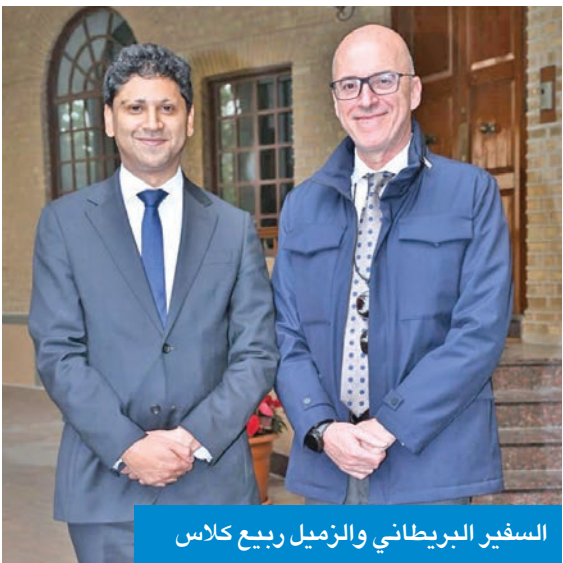
السفير البريطاني والزميل ربيع كلاس

هي مرحلة التنفيذ الفعلي، وأن الشركات البريطانية تنظر بإيجابية كبيرة إلى الفرص المتاحة في السوق الكويت. وفي المجال الدفاعي، أكد استمرار التعاون العسكري بين البلدين، الذي يشمل تدريبات مشتركة، من بينها تمرين «محارب الصحراء»، إضافة إلى برامج تدريبية للكوادر العسكرية الكويتية في بريطانيا، كما أشار