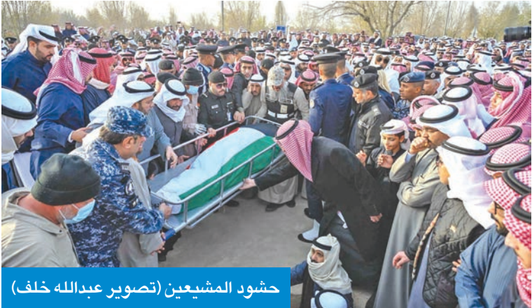
حشود المشيعين