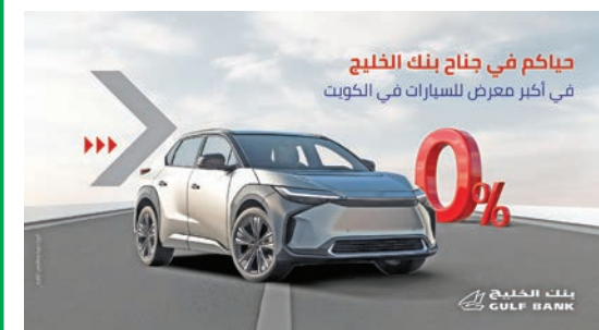
جياكم في جناح بنك الخليج في أكبر معرض للسيارات في الكويت

في إطار حرصه على التواصل مع عملائه، أعلن بنك الخليج مشاركته في معرض عالم السيارات، الذي يقام بارض المعارض على مدى 6 أيام، خلال الفترة من 19 إلى 24 الجاري، بمشاركة عدد كبير من وكالات السيارات والشركات والبنوك.