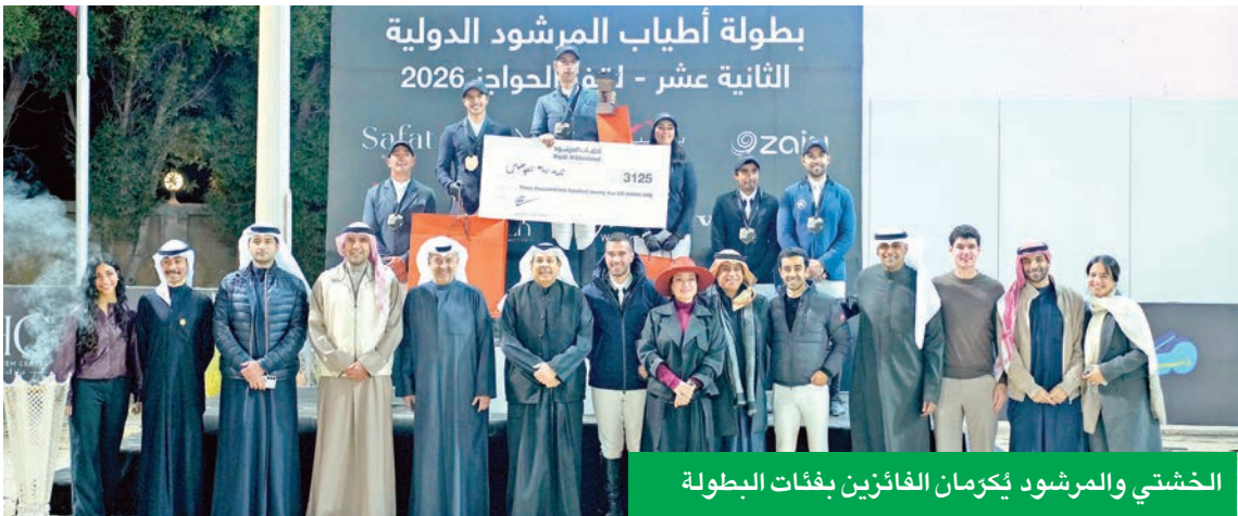
الخشتي والمرشود يُكرمان الفائزين بفئات البطولة

وتشمل التحديثات الجديدة مجموعة من المزايا التي تمنح العملاء تحكماً