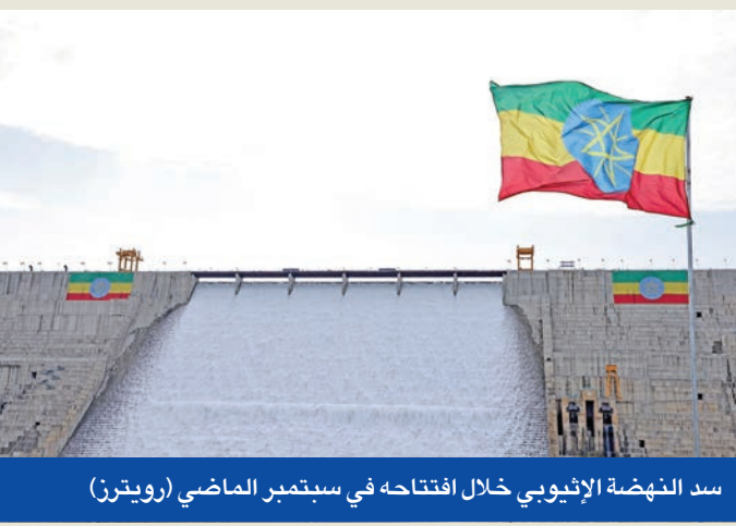
سد النهضة الإثيوبي خلال افتتاحه في سبتمبر الماضي

وقال ترامب إن حل التوترات المحيطة بالسد الكبير بحتل «المرتبة الأولى» في جدول أعماله، وأن هدفه هو تحقيق نتيجة «ضمن الاحتياجات المائية» لمصر وإثيوبيا والسودان، الدول التي تشكل جزءاً من حوض النيل. ووفقاً للرئيس، فإن «نهجاً ناجحاً» سيسمح بإطلاق المياه لمصر والسودان خلال فترات الجفاف، وفي الوقت نفسه، سيسمح لإثيوبيا بتوليد كميات كبيرة من الكهرباء. ويؤكد ترامب أنه منع خلال ولايته الأولى نشوب حرب بين مصر وإثيوبيا بسبب هذه القضية، وهو صراع بدرجه ضمن 8 نزاعات يقول إنه حلها، ويعتبر أنه يستحق جائزة نوبل للسلام بسببها. ومع ذلك، اعترف في يوليو من العام الماضي بأن السد «أصبح مشكلة خطيرة للغاية»، وأحث الأطراف على «إيجاد حل». وافتححت إثيوبيا رسمياً سد النهضة الإثيوبي الكبير، في الخريف الماضي، وكأكبر سد