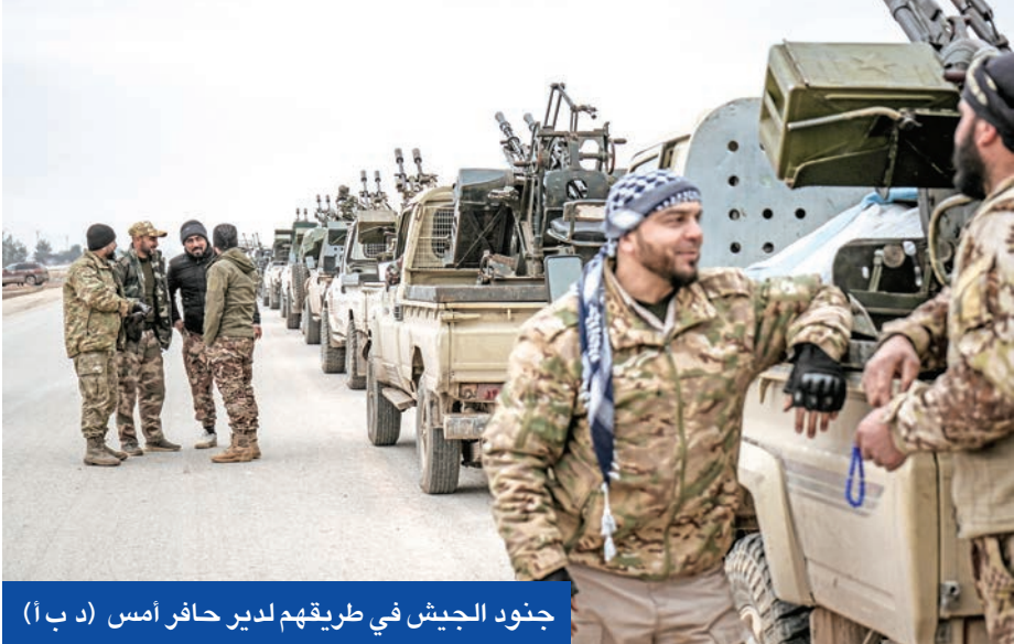
جنود الجيش في طريقهم لدير حافر أمس

«الحقوق لا تُصان بالمراسيم المؤقتة»، بل «بالدساتير المبررة عن إرادة الشعوب والمكونات كافة»، ورأت الإدارة أن «الحل الجذري» لمسألة الحقوق والحريات هو «في دستور ديموقراطي لا مركزي، داعية إلى «حوار وطني شامل» بهذا الشأن.