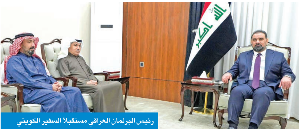
رئيس البرلمان العراقي مستقبلاً السفير الكويتي

بحث سفير الكويت في بغداد حسن زمان، مع رئيس مجلس النواب العراقي، هيبب الحلبوسي، امس الاول، سبل تعزيز التعاون الثنائي بين البلدين وعدداً من الملفات المشتركة. وقال السفير زمان، لـ «كونا»، إنه قدم في بداية اللقاء التهانى لرئيس البرلمان العراقي بمناسبة توليه منصبه، متمنياً له التوفيق في أداء مهامه بالمرحلة المقبلة. وأضاف أن اللقاء تناول سبل دعم وتعزيز العلاقات الثنائية، والمضي في مجالات التعاون المشترك بين البلدين بما يحقق تطلعات الشعبين ويضمن مصالحهما، مبيناً أن اللقاء شهد كذلك مناقشة عدد من القضايا والملفات ذات الاهتمام المشترك.