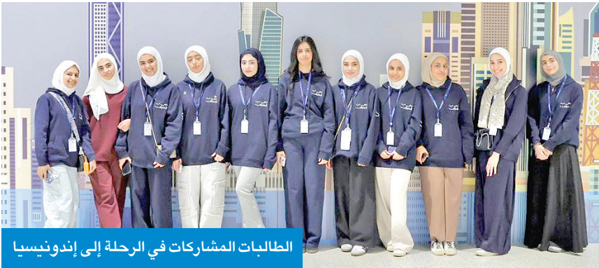
الطالبات المشاركات في الرحلة إلى إندونيسيا

من المشاريع الحيوية التي ساهم الصندوق في تمويلها وإنشائها، كما سيطلعون على مدى تأثيرها الإيجابي على الشعب والاقتصاد في أوزبكستان، وسوف يزورون كذلك أبرز المعالم التاريخية والثقافية والسياحية هناك.