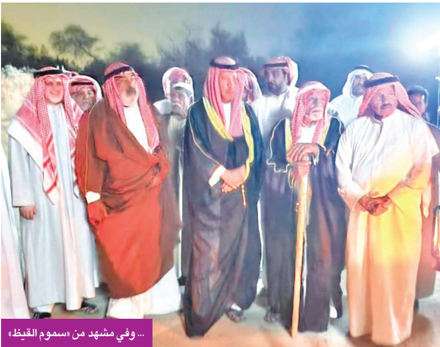
...وفي مشهد من «سموم القيظ»