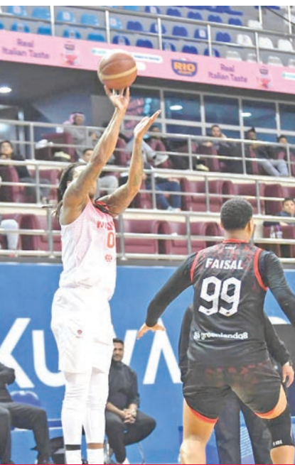
جانب من مباراة الكويت والصليبيخات

حقق فريق نادي الكويت لكرة السلة فوزاً كبيراً على منافسه الصليبيخات بنتيجة 133 - 96، في اللقاء الذي جمعهما مساء أمس الأول على صالة الاتحاد بمجمع الشيخ سعد العبدالله الرياضي، ضمن الجولة الحادية عشرة من الدوري العام للعبة. وشهدت الجولة أيضاً عودة كاظمة «البرتقالي» إلى طريق الانتصارات بفوز سهل على الساحل بنتيجة 107-72.