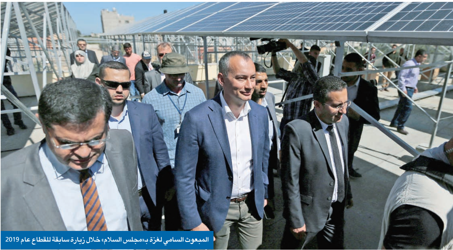
المبعوث السامي لغزة بـ«مجلس السلام»، خلال زيارة سابقة للقطاع عام 2019

القاهرة - الجريدة. في خطوة تمهد لحقبة جديدة تطوي صفحة حكم حركة حماس لقطاع غزة، وتطلق مسار تعافٍ للمنطقة الفلسطينية بعد تعرضها لحرب إسرائيلية مدمرة، أعلن البيت الأبيض قائمة أسماء الأعضاء الذين سيُشكلون «مجلس السلام» بشأن غزة بقيادة الرئيس الأمريكي دونالد ترامب، للإشراف على عمل لجنة التكنولوجيا التي تم التوافق عليها بين الفصائل لحكم القطاع بشكل مؤقت وإعادة إعمارهِ. وأفاد البيت الأبيض، في بيان له، بأن قائمة الأعضاء المؤسسين للمجلس تضم وزير الخارجية ماركو روبيو والمبعوث الخاص ستييف ويتكوف وصهر ترامب جاريد كوشنر ورئيس الوزراء البريطاني الأسبق توني بلير. وأوضح أن المجلس التأسيسي يضم أيضاً المسؤول التنفيذي في مجال الاستثمار الملياردير مارك رومان ورئيس البنك الدولي أجاي بانجا وروبرت غابرييل مستشار ترامب، مضيفاً أن نيكولاي ملادينوف مبعوث الأمم المتحدة السابق للشرق الأوسط، سيضطلع بدور الممثل السامي لغزة. ونُكر أن كل عضو من المجلس التنفيذي سيشرف على ملف محدد بالغ الأهمية لاستقرار غزة ونجاحها على المدى الطويل، بما في ذلك، على سبيل المثال لا الحصر، بناء القدرات الإدارية، والعلاقات الإقليمية، وإعادة الإعمار، وجذب الاستثمارات، والتمويل واسع النطاق، وتعبئة رؤوس الأموال، لافتاً إلى أنه دعماً لهذا النموذج التشغيلي، عُيّن الرئيس أرييه لايتستون وجوش غرينباوم مستشارين أوليين لمجلس السلام، مكلفين بقيادة الاستراتيجية والعمليات اليومية، وترجمة ولاية المجلس وأولوياته الدبلوماسية إلى تنفيذ منضبط. وتابع: «ولترسيخ الأمن والحفاظ على السلام وإرساء