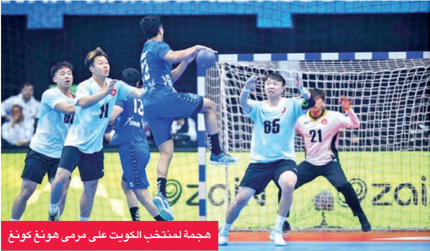
هجمة لمنتخب الكويت على مرمى هونغ كونغ

من جماهيره الوفية لتحقيق الهدف المنشود..