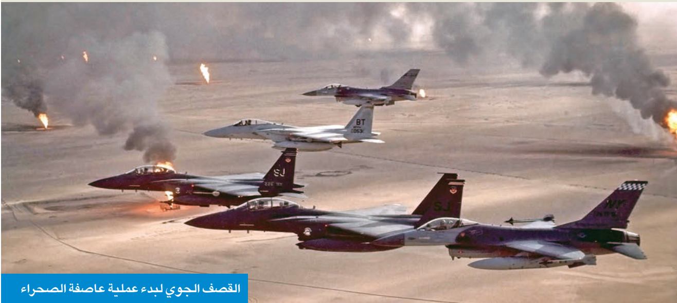
القصف الجوي لبدء عملية عاصفة الصحراء

1991 بدأ الجيش العراقي الانسحاب من الأراضي الكويتية، فيما أعلن الرئيس بوش في اليوم التالي تحرير الكويت بعد مرور 100 ساعة من انطلاق الحملة البرية.