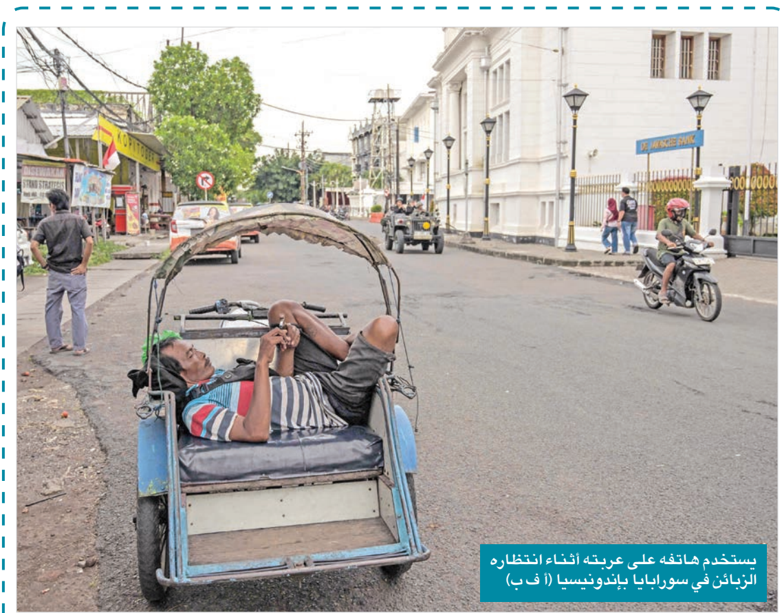
يستخدم هاتفه على عربته أثناء انتظاره الزبائن في سورايا بايندوني

الثقافة باختصار شيئان: أحدهما في غاية البساطة والسطحية، كعادات الناس، وطرق معيشتهم، وأسلوب تعاملهم مع