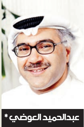
عبدالحמיד الوضي *

اتخذ الرئيس الأمريكي ترامب بداية عام 2026 قراراً بالسيطرة على إنتاج النفط الفنزويلي، وأعلن استثمار 100 مليار دولار لزيادة الإنتاج والتفرد ببيعه، إلا أنه لم يحدد أمداً للاستثمار وإن ذكر 18 شهراً، ومن جانب آخر، طالب بخفض سعر النفط إلى 50 دولاراً للبرميل، خلافاً أرقام فقط غير كافية لوضع استراتيجية استثمارية بتروولية متكاملة ناجحة دون تشخيص دقيق لواقع حال فنزويلا التي تعاني اضطرابات سياسية واقتصادية مزمنة.