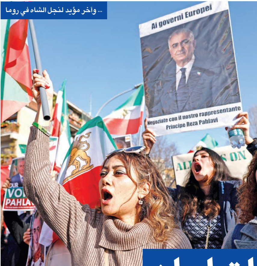
... وآخر مؤيد لنجل الشاه في روما