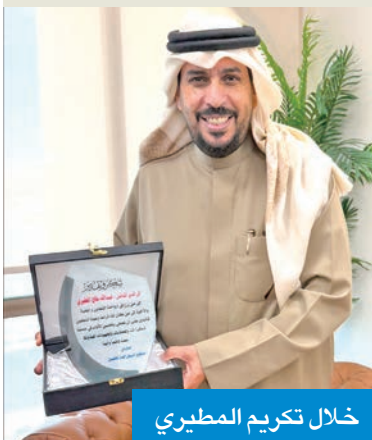
خلال تكريم المطيري

وأكدت أن عملية التحديث تهدف إلى رفع كفاءة الأنظمة، وتحسين سرعة معالجة البيانات، وتعزيز مستوى التكامل بين الأنظمة المختلفة، بما يساهم في تحسين جودة الخدمات الإلكترونية وتسريع