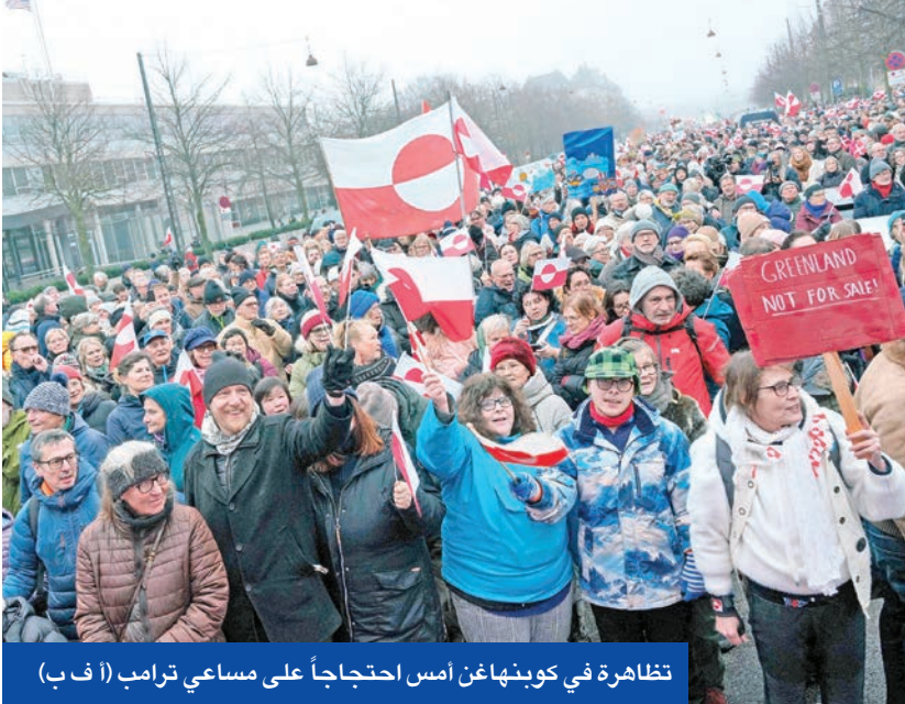
تظاهرة في كوبنهاغن أمس احتجاجاً على مساعي ترامب (أ ف ب)

والخيار الثاني إبرام اتفاق استراتيجي ثلاثي يبقى سيادة كوبنهاغن، لكنه يدخل الية صنع القرار المشترك في بعض المجالات، مما يتيح لواشنطن المشاركة في التخطيط الأمني والاقتصادي طويل الأجل. والخيار الثالث، تمنح بموجبه الدنمارك الولايات المتحدة سيطرة طويلة الأجل على مواقع أو مناطق محددة، مع احتفاظها بسيادتها، أما الخيار الرابع فيتمثل في إبرام اتفاقية ارتباط حر، بعد أن تنال غرينلاند استقلالها عن الدنمارك وتدخل في معاهدة تتولى بموجبها واشنطن مسؤولية الدفاع والشؤون الخارجية مقابل دعم مالي مستدام، ليحل محل التحويلات المالية الدنماركية. والخيار الخامس، هو البيع التفاوضي، حيث تتنازل الدنمارك عن سيادتها على الإقليم للولايات المتحدة بموجب معاهدة، وتوافق غرينلاند على ذلك. وهذا من شأنه أن يمنح واشنطن سيطرة كاملة على أراضي الإقليم، لكنها تواجه عقبات سياسية وقانونية وشرعية هائلة في ظل معايير تقرير المصير الحديثة.