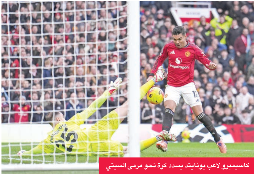
كاسيميرو لاعب يونايتد يسدد كرة نحو مرمى السيتي