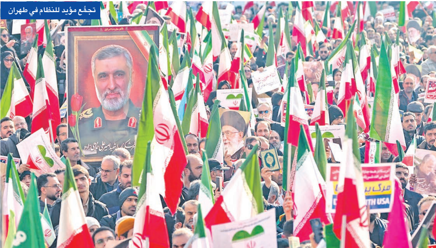
تجمع مؤيد للنظام في طهران