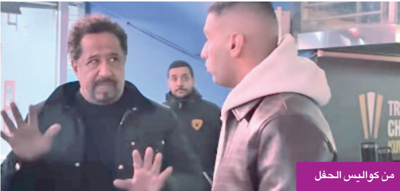
من كواليس الحفل

وتابع الشعبى: «سعيد جداً بأن أكون جزءاً من هذا الحدث الكبير مع شركاء النجاح الذين كانوا الداعم الحقيقي منذ البداية، وفي