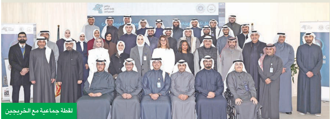
لقطة جماعية مع الخريجين

متطلبات الحصول على هذه الشهادة، وتحظى هذه الشهادة باعتماد «المركزي»، وهيئة أسواق المال، ومعهد البروك لندن في المملكة المتحدة.