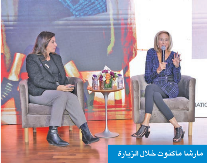
مارشا ماكنوت خلال الزيارة

وأشارت إلى أن علاقتها مع الأكاديميات الوطنية الأميركية (NASSEM) تمثل مساراً مؤسسياً ممتداً يركز على بناء القدرات وتطوير الشراكات البحثية، وتجسدت في محطات بارزة منها تنظيم مؤتمرات القيادات النسائية في العلوم (WLSITE) ومنتدى «رواد العرب والأمريكان»، الذي يعد منصة للتبادل العلمي بين العلماء الناشئين.