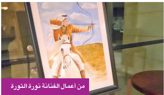
من أعمال الفنانة نورة التورة

الأعمال تبرز بشكل واضح عالم الفروسية العربية والتراث، حيث تصدر الحصان المشهد بوصفه رمزاً للقوة والأصالة والهوية. باستخدام درجسات هادئة ومدروسة من الألوان بالتفاصيل، تظهر في ملامح الحصان وتعايير العين.