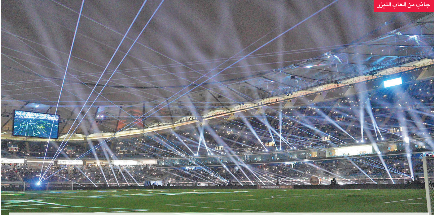
جانب من ألعاب الليزر

عبر المدير العام للهيئة العامة للرياضة، بشار عبدالله، عن فخره واعتزازه بالنجاح الكبير الذي حققته دولة الكويت في استضافة وتنظيم مباراة كأس السوبر الفرنسي لكرة القدم، مؤكداً أن هذا الإنجاز جاء ثمره لتوجيهات القيادة السياسية الحكيمة، وبدعم مباشر من القائمين على قطاعات الشباب والرياضة. وقال بشار عبدالله في تصريح له عقب التتويج: «الي شفناه اليوم مو مجرد مباراة، هذا كان مشهداً يؤكد أن الكويت راجعة بقوة. التنظيم، الحضور، التفاعل الجماهيري... كل شيء كان على مستوى عالمي، وهذا ما كان ليصير لولا دعم القيادة وتكاتف الجميع». وأضاف: «هذا الحدث هو بداية انطلاقا جديدة