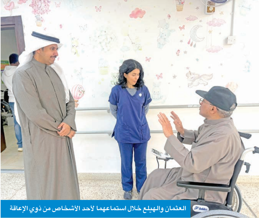
العثمان والهيلع خلال استماعهما لأحد الأشخاص من ذوي الإعاقة

حفاظاً على حقوق الأشخاص ذوي الإعاقة، مؤكداً أن هذه الخطوة تتبعها أخرى تهدف إلى حماية المال العام وإيقاف الهدر المالي، بما يضمن حفظ حقوق ذوي الإعاقة ومنع أي استغلال لهم.