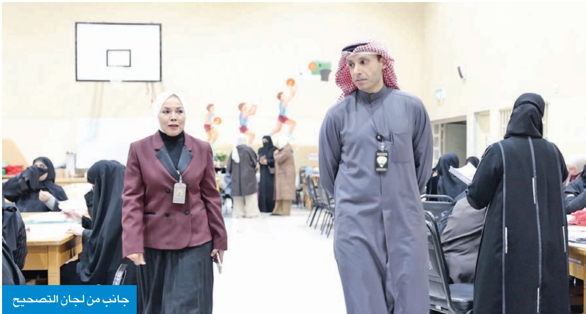
جانب من لجان التصحيح

تم توزيعها على 54 لجنة، بواقع 30 لجنة للرجال و24 للنساء، مشيراً إلى أن أعمال تصحيح أوراق الامتحان مستمرة، ومتابعة من موجي المادة الدراسية.