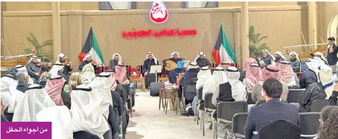
من أجواء الحفل

نظمت «ليلة كويتية» بمشاركة مجموعة كبيرة من المطربين