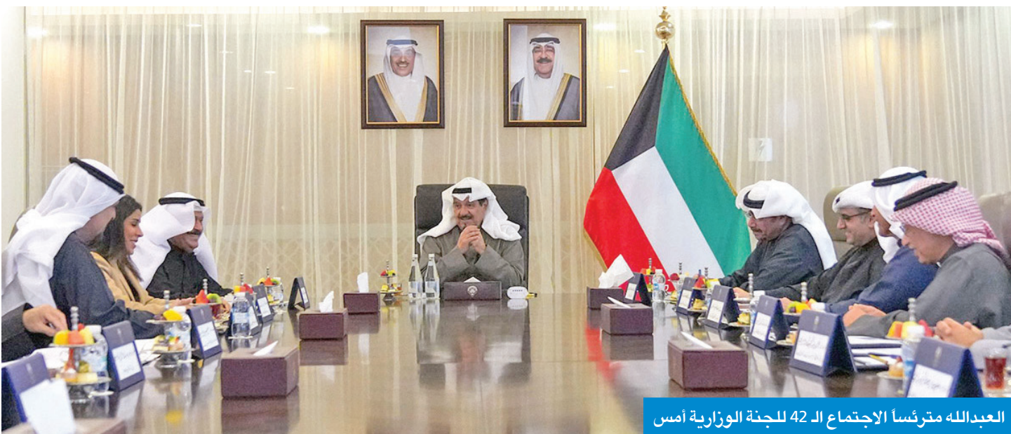
العبدالله مترأساً الاجتماع الـ 42 للجنة الوزارية أمس

في إطار متابعة اللجنة الوزارية لتنفيذ المشروعات التنموية الكبرى، أكد رئيس مجلس الوزراء سمو الشيخ أحمد العبدالله حرص صاحب السمو أمير البلاد الشيخ مشعل الأحمد على التوجيه السامي المستمر نحو تحقيق رؤية الكويت التنموية الشاملة والمستدامة في مختلف المشروعات الجاري تنفيذها في جميع القطاعات والإسراع بوتيرة معدلات إنجازها. جاء ذلك خلال ترؤس العبدالله، في قصر بيان أمس، اجتماع اللجنة الوزارية رقم 42، لمتابعة تنفيذ المشاريع التنموية الكبرى في البلاد، حيث بحث الاجتماع آخر مستجدات متابعة تقارير الجهات الحكومية المعنية في إجراءاتها المتعلقة بتنفيذ المشاريع التنموية الكبرى ذات الصلة بميناء مبارك الكبير ومنظومة الطاقة الكهربائية وتطوير الطاقة المتجددة