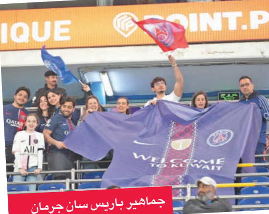
جماهير باريس سان جرمان