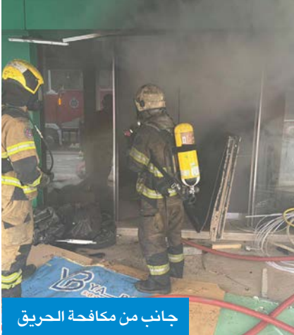
جانب من مكافحة الحريق