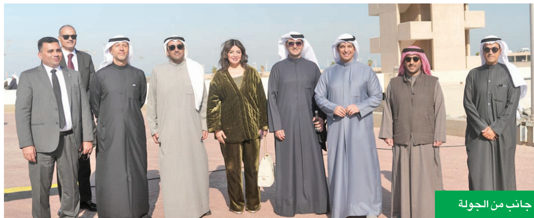
جانب من الجولة