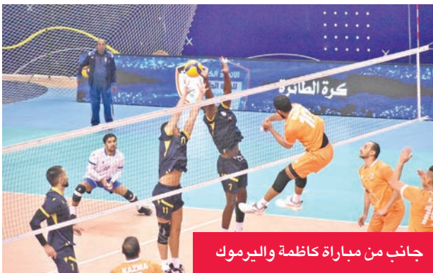
جانب من مباراة كاظمة واليرموك

عقبه البرتقالي والمنافسة على قمة الترتيب مع الكويت المتصدر بـ 17 نقطة.