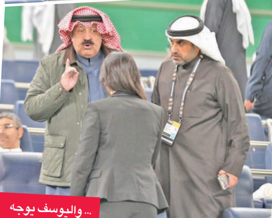
... واليوسف بوجه