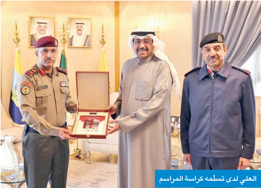
العلي لدى تسلمه كراسه المراسم

توحيد المراسم والبروتوكولات العسكرية بين الجهات العسكرية خطوة تنظيمية مهمة لتعزيز الانسجام المؤسسي وتوحيد أساليب العمل في مختلف المناسبات والفعاليات العسكرية.