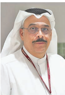
نصر سالم آل هيد

قضت محكمة الاستئناف الدائرة الثانية، برئاسة المستشار نصر سالم آل هيد، وعضوية المستشارين متعب العارضي وسعود الصانع، بتطبيق قانون المخدرات الجديد على متهم له «كونه الأصلح»، لتقضي بحبسه سنة واحدة بدلاً من 5 سنوات، في أول حكم من «الاستئناف» بهذا الشأن.