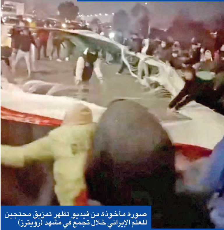
صورة مأخوذة من فيديو تظهر تمزيق محتجين للعلم الإيراني خلال تجمع في مشهد

مقتل شرطي بصدامات طهران... وأحزاب كردية تدعو لإضراب شامل