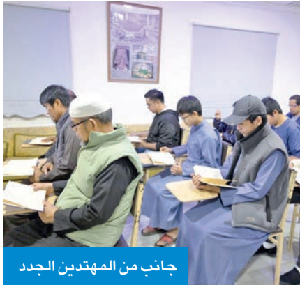
جانب من المهتدين الجدد

الكندي: قدّمنا 775 دورة لـ 7210 دارسين من جاليات غير عربية