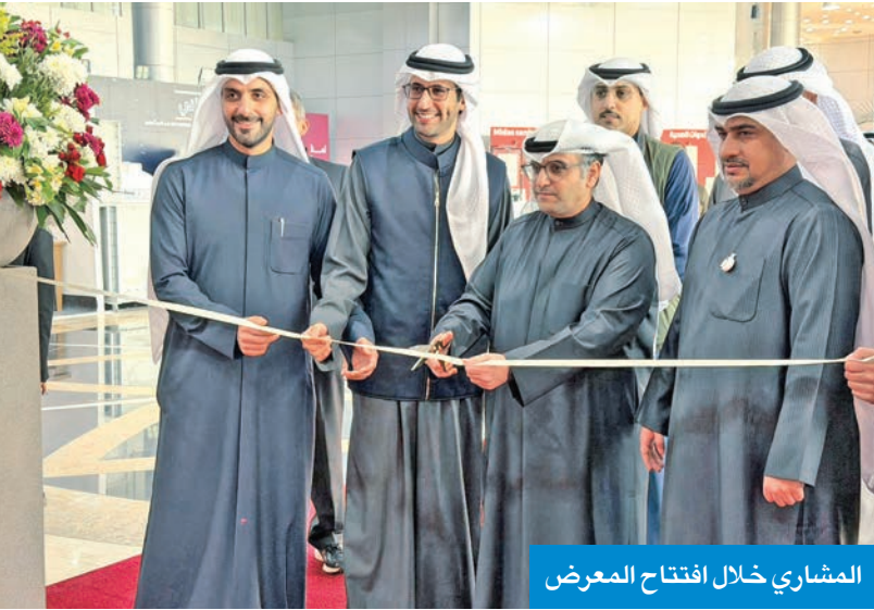
المشاري خلال افتتاح المعرض

المعنية وشركات البناء والتطوير، إلى جانب الجهود المبذولة في تطوير الخدمات المقدمة للمواطنين، وتوضيح مراحل العمل في المشروعات الإسكانية المختلفة.