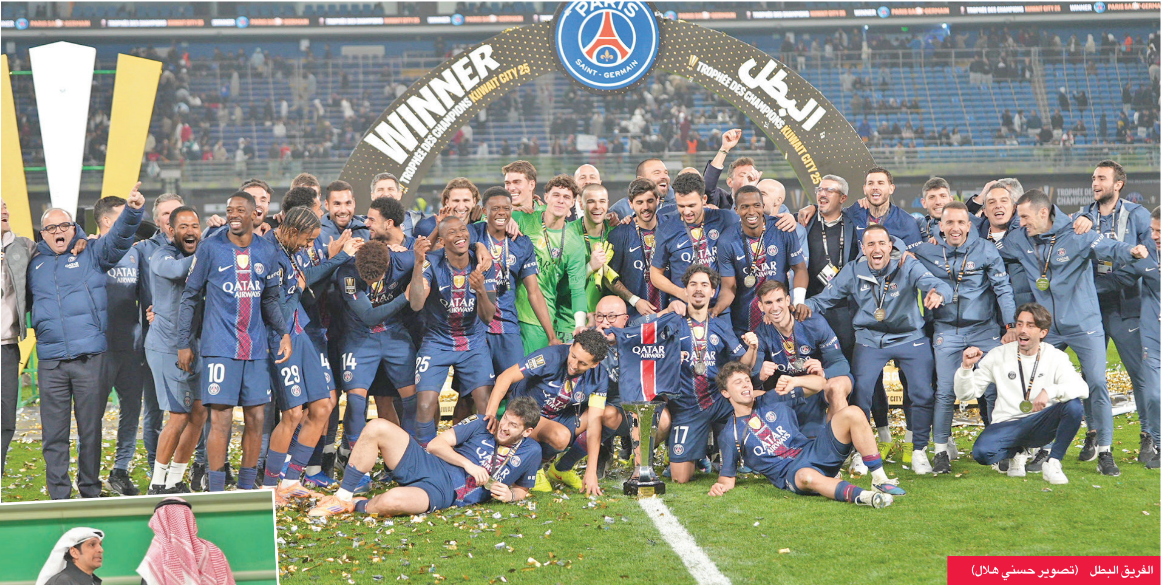
الفريق البطل

باريس سان جرمان يرفع كأس البطولة بعد فوزه على مارسيلا بركلات الترجيح