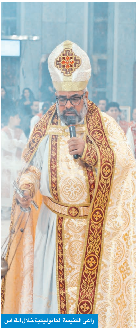
راعي الكنيسة الكاثوليكية خلال القداس

زكريا: فرصة للدعاء بأن يكون العام الجديد مليئاً بالمحبة