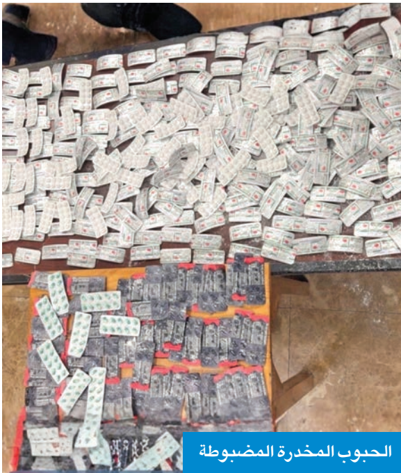
الحبوب المخدرة المضبوطة

عُثر عليها بحوزة عاملة منزلية قادمة من أديس أبابا