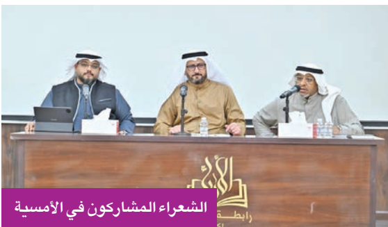
الشعراء المشاركون في الأمسية