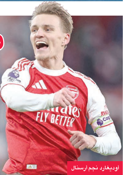
أوديجارد نجم أرسنال

ويقضي أرسنال أفضل فتراته في المسابقة حاليا، بعدما فاز في مبارياته الخمس الأخيرة بالبطولة والتي كان آخرها انتصاره المثير 2-3 على ضيفه بورنموث، في المرحلة الماضية، السبت. ومنذ خسارته 2 - 1 أمام ضيفه أستون فيلا في