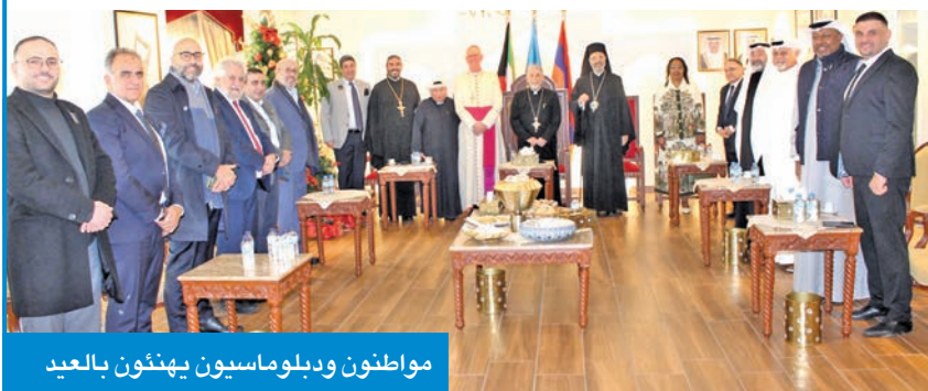
مواطنون ودبلوماسيون يهنئون بالعيد

كهيايان: قيم التعايش والانفتاح تعكس الاستقرار بالكويت