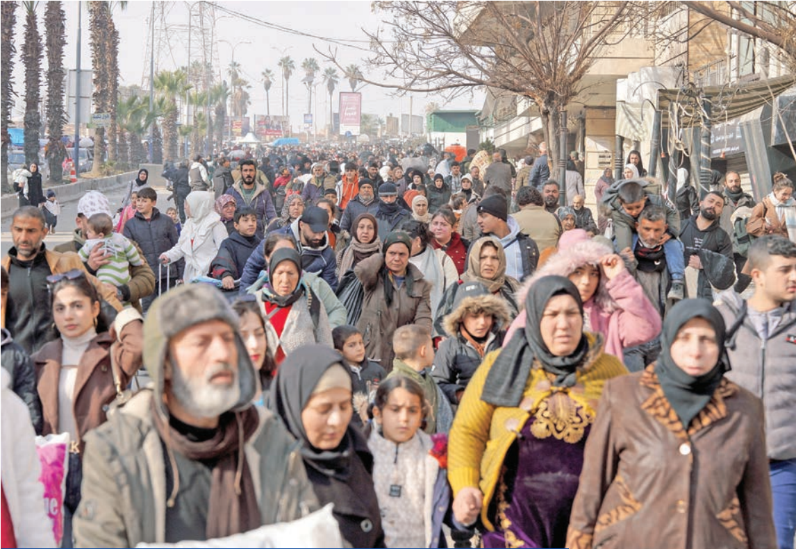
أهالي حيي الشيخ مقصود والأشرفية يخرجون منهم أمس هرباً من المعارك

والإدارات الحكومية في مدينة حلب، ثاني كبرى مدن سورية، أبوابها. وأعلنت الهيئة العامة للطيران مساء أمس الأول تعليق الرحلات الجوية من وإلى مطار حلب لمدة 24 ساعة. الى ذلك، أفادت القناة 15 الإسرائيلية، نقلاً عن مصادر، بالتوصل إلى اتفاق لبدء محادثات إسرائيلية - سورية في مجالات الطب والطاقة والزراعة، وكانت الخارجية الأميركية نشرت، أمس الأول، بياناً مشتركاً بشأن الاجتماع الثلاثي الأمريكي - السوري - الإسرائيلي في باريس جاء فيه أن الجانبين السوري والإسرائيلي أكدا «التزامهما بالسعي نحو تحقيق ترتيبات أمنية واستقرارية دائمة وانهما «قررا إنشاء آلية تنسيق مشتركة (ميكانيزم) لتسهيل التنسيق السوري والمستمر بشأن تبادل المعلومات الاستخباراتية وخفض التصعيد العسكري والمشاركة الدبلوماسية والفرص التجارية تحت إشراف الولايات المتحدة». ونوه بان «آلية ستكون بمنزلة منصة لمعالجة أي نزاعات على الفور والعمل على منع سوء الفهم».