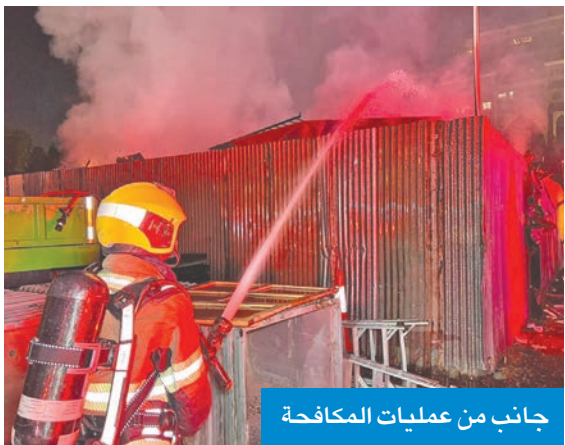
جانب من عمليات مكافحة

الطوارئ تعاملوا مع إصابتي باختناق وإجهاد حراري وتم علاجهما في نفس موقع الحادث، مشيراً إلى أن إدارة الطوارئ الطبية وجهت 4 مركبات إسعاف إلى موقع البلاغ.