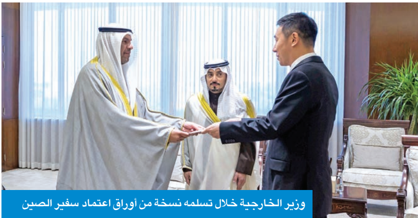
وزير الخارجية خلال تسلمه نسخة من أوراق اعتماد سفير الصين

تسلم وزير الخارجية عبدالله اليحيا، في ديوان وزارة الخارجية أمس، نسخة من أوراق اعتماد سفير الصين لدى الكويت السفير يانغ شين. وتمنى الوزير اليحيا للسفير الجديد التوفيق في مهام عمله وللعلاقات الثنائية الوثيقة المزيد من التقدم والازدهار. من جانب آخر، التقى الوزير اليحيا المدير الإقليمي لشركة ليوناردو، تيمسجن فوشي، وتم خلال اللقاء بحث مجالات التعاون المشترك.