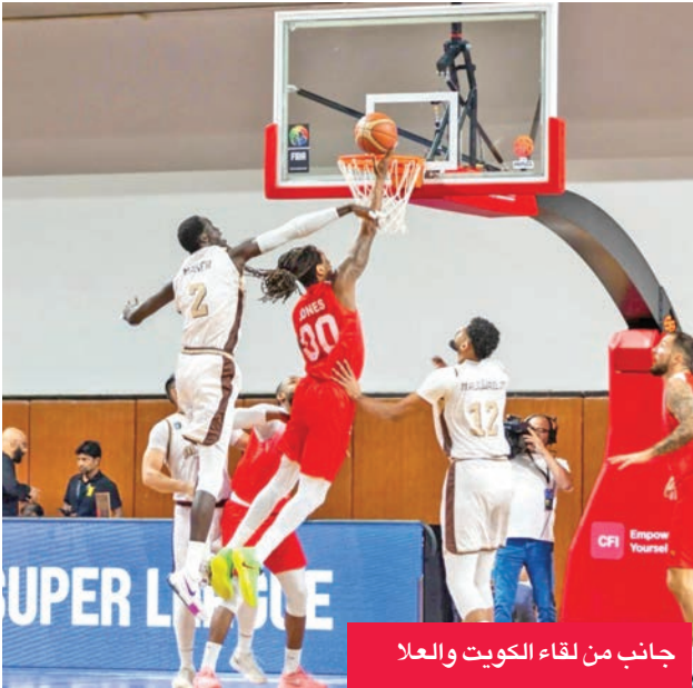
جانب من لقاء الكويت والعلا

وضعت الخسارة الثقيلة فريق الكويت في موقف معقد، حيث بات مطالباً بتحقيق الفوز في مباراته