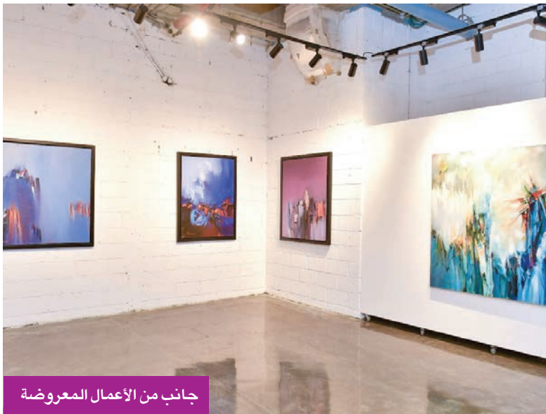
جانب من الأعمال المعروضة