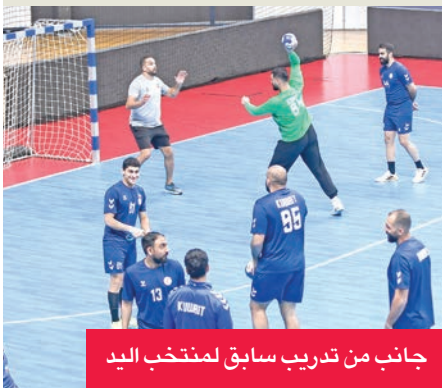
جانب من تدريب سابق لمنتخب اليد

ومن المقرر أن يفتتح منتخبنا الوطني مشواره في البطولة بمواجهة نظيره الهندي 15 يناير الجاري، ضمن الجولة الافتتاحية للمجموعة الثالثة، ثم يلتقي منتخب هونغ كونغ في 17 الجاري، قبل أن يختم دور المجموعات بمواجهة قوية أمام منتخب الإمارات في 19 الجاري.