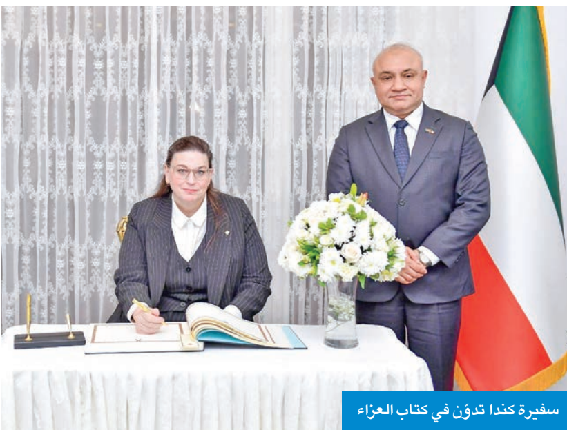
سفيرة كندا تدون في كتاب العزاء

وأوضح أن النتائج تشير إلى أن هذا القطاع يعتمد بشكل كبير على العمالة الوافدة، مع ضعف واضح في نسبة التوطين في الوظائف الصناعية، مما يستدعي تبني سياسات لتعزيز مشاركة الكوادر الوطنية في هذا القطاع، مشدداً على ضرورة توطئ الصناعات ذات الأولوية في المناطق الصناعية الجديدة، خصوصاً الدوائية والإلكترونية، وإعادة التدوير، إلى جانب تحسين جودة الإنتاج المحلي، وزيادة كفاءته التنافسية، والتوسع في الأسواق الإقليمية.