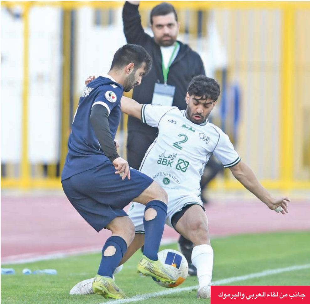
جانب من لقاء العربي واليرموك