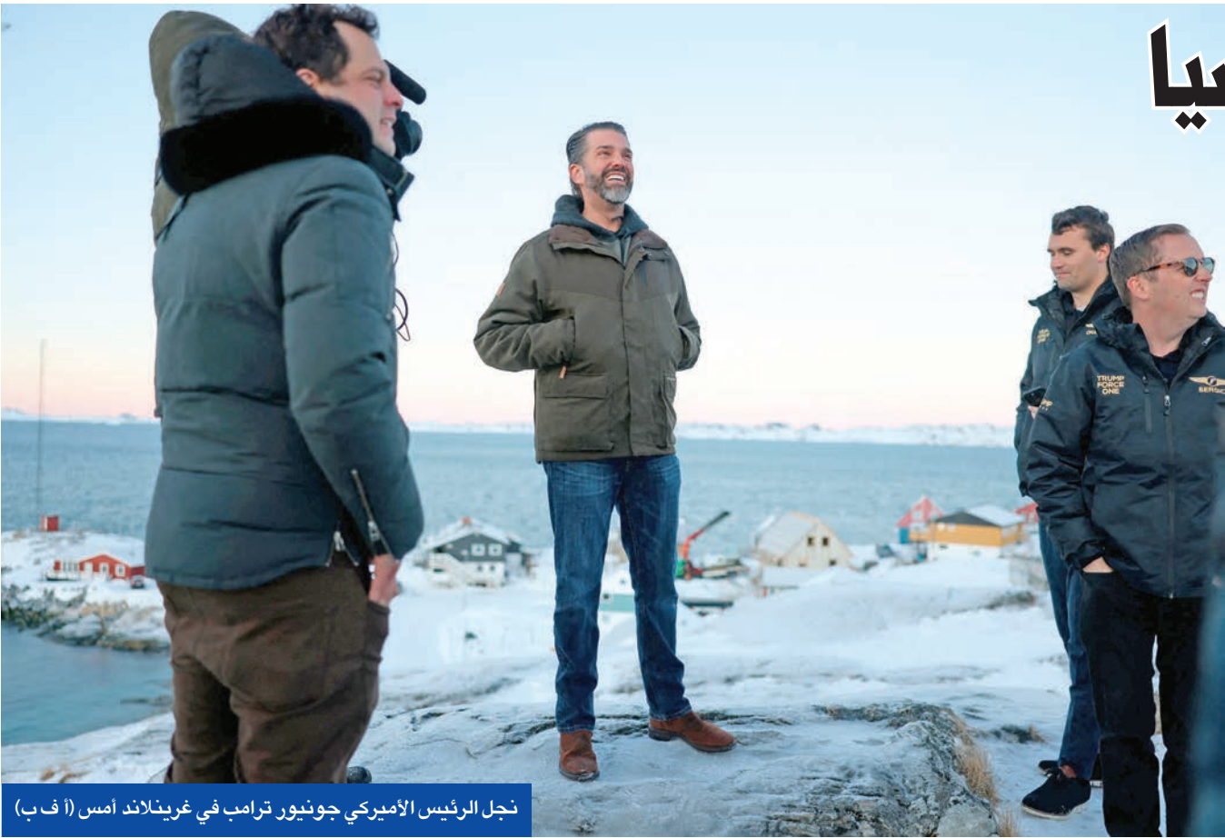
نجل الرئيس الأمريكي جونيور ترامب في غرينلاند أمس

اللفظي بينهما، اتهم رئيس كولومبيا، اليساري غوستافو بيترو، ترامب بأنه «مُخلّ عقلياً». وعزا بيترو خلافاته مع ترامب إلى عدم موافقته على «لاعقلانية» الرأسمالية التي تقود البشرية، بدافع الجشع فقط، نحو الانقراض»، نافيا صحة الاتهامات لامادورو بالعمل مع تجار المخدرات، ومعتبراً أن «هدف اختطافه هو الاستيلاء على نفط فنزويلا». وفي كوبا، التي اعتبر ترامب أنها «على وشك السقوط»، شنّ وزير الخارجية، برونو رودريغيز، هجوماً على ترامب، مؤكداً أن «سياساته الإجرامية وحربه الاقتصادية تخنق كوبا وعائلاتنا». وفي إشارة إلى روبيو، الكوبي الأصل، أكد رودريغيز أن ترامب يكر «أكاذيب سياسيه الكوبيين وبقية مجموعات المصالح، ويفتري ويهدد شعب كوبا». في المقابل، دافع الرئيس الأرجنتيني خابيير ميلي عن ترامب، مؤكداً أنه لا يسعى للاستيلاء على نفط فنزويلا، واعتبر أن ترامب «يُعد تشكيل النظام العالمي»، وحثّ على إنهاء «الاستراكية القاتلة» في فنزويلا وكوبا ونيكاراغوا.