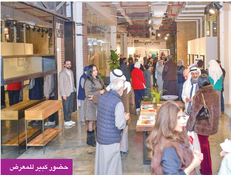
حضور كبير للمعرض