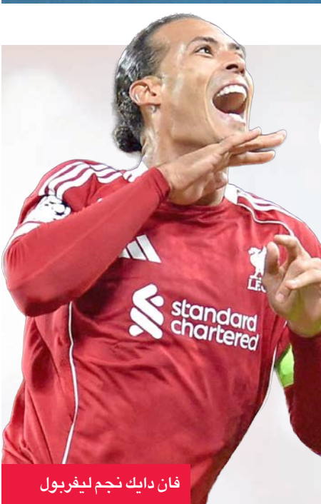
فان دايك نجم ليفربول