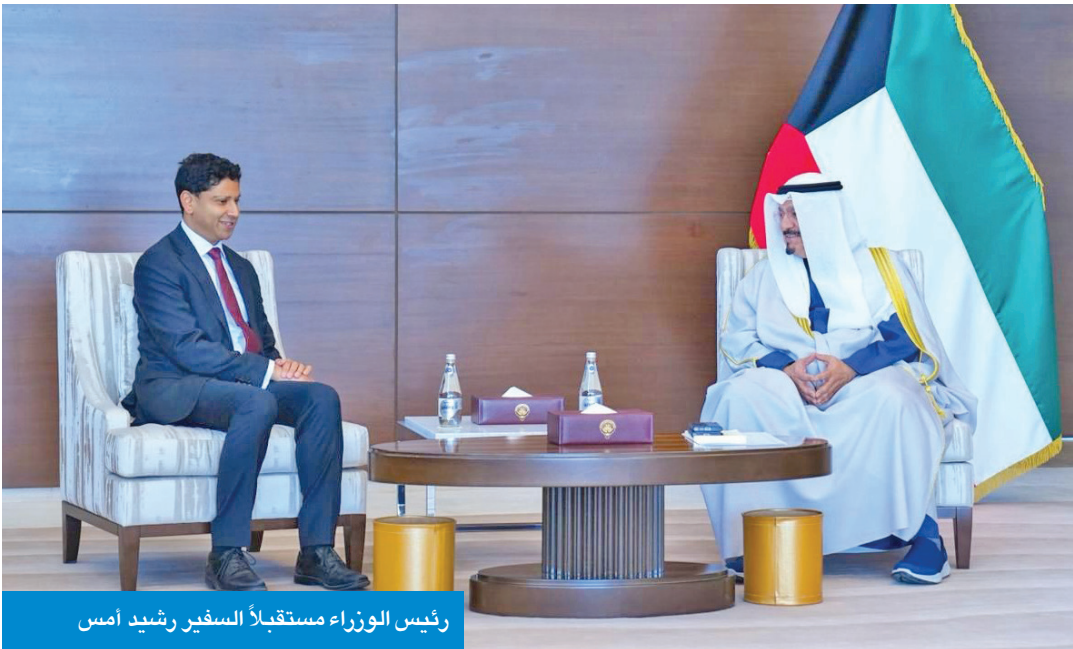
رئيس الوزراء مستقبلاً السفير رشيد أمس

استقبل رئيسة الأكاديمية الوطنية للعلوم في الولايات المتحدة