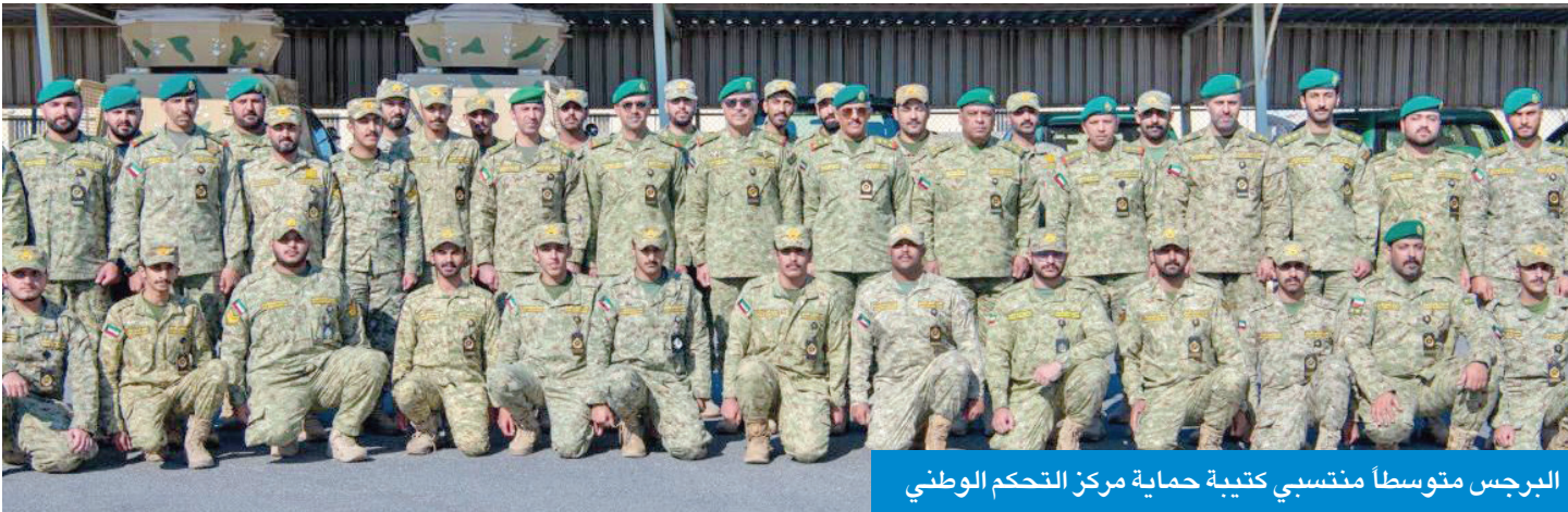
البرجس متوسطاً منتسبي كتيبة حماية مركز التحكم الوطني

واعترازها بالدور الذي يؤديه في تأمين المواقع الحيوية، مشدداً على البقطة الأمنية، وتوخي الحيطة والحذر، والالتزام بالتعليمات والواجبات الأمنية المكلفين بها، للحفاظ على أمن واستقرار البلاد.