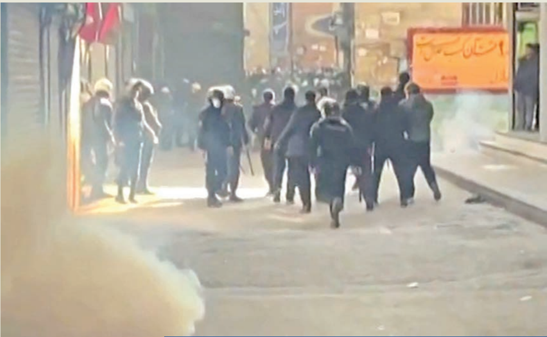
قوات أمنية تطلق الغاز على متظاهرين في بازار طهران الكبير أمس الأول

الإيراني مسعود بزشكيان الذي تبني لهجة معتدلة نسبياً منذ بدء موجة الاحتجاجات، قوات الأمن، إلى «عدم اتخاذ أي إجراء» ضد المتظاهرين وإلى التمييز بينهم وبين «مخيري الشغب الذين يحملون أسلحة نارية وحادة ويهاجمون مراكز الشرطة والمواقع العسكرية». وفي تصريحات منفصلة، نقلتها صحيفة «أفكار» الإصلاحية، أقر بزشكيان بعجز الحكومة عن إدارة الأزمات، ودعا إلى شراكة وطنية واسعة تقوم على التخطيط، والشفافية، وتقاسم المسؤولية في معالجة أزمات البلد المتدحلة. وفي وقت، أفادت آخر الإحصاءات بأن المصادمات المصاحبة للاحتجاجات أسفرت عن مقتل 35 متظاهراً و5 عناصر أمن واعتقال نحو 1500 شخص، ذكرت متحدثة باسم الحكومة أن بزشكيان شدد على أنه في الحوار مع الشعب والمتظاهرين، لن يُسمح باستغلال أو مصادرة الاحتجاجات الشعبية من قبل جهات أخرى، لافتة إلى تشكيل لجنة من وزارة الداخلية لبحث الأحداث التي وقعت في محافظة إيلام، ذات الأغلبية الكردية غربي البلاد خصوصاً ما يتعلق باقتحام قوات أمنية لمستشفى بالمدينة لاعتقال محتجين واشتباكها مع الطواقم الطبية. وفي حين أظهر مقطع فيديو متداول أن تجاراً وهم يهتفون خلال احتجاجات في بندر عباس، بشعار «هذا هو الشعار الوطني، رضا بهلوي»، زعم ولي العهد الإيراني السابق، أنه يتأهب لدخول بلده، خلال تصريحات أدلى بها من واشنطن. ووجه بهلوي دعوة صريحة لمنتسبي القوات العسكرية بترك أسلحتهم والانضمام للشعب، واعداً إياهم بـ«مصالحة وطنية»، ورافضاً «التدخل العسكري» ضد طهران.