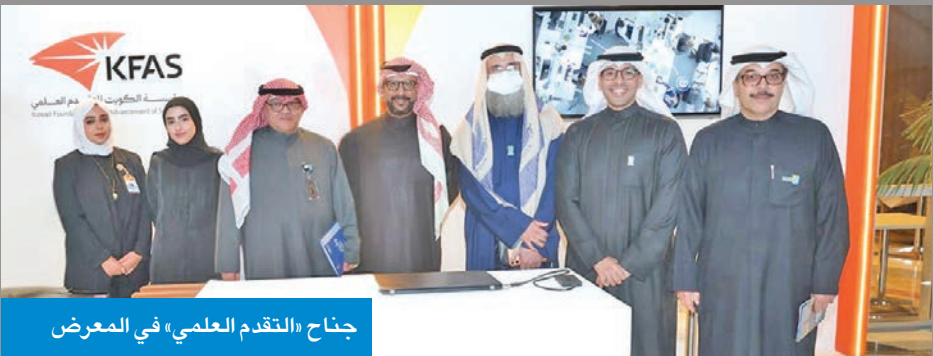
جناح «التقدم العلمي» في المعرض