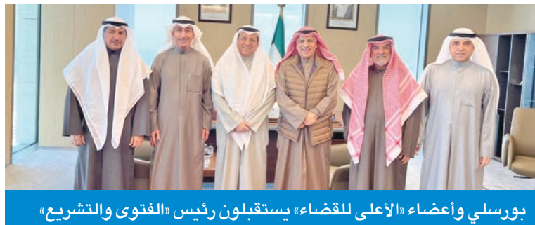
بورسلي وأعضاء «الأعلى للقضاء» يستقبلون رئيس «الفتوى والتشريع»

الجديد التباحث حول المسائل التي تهم الطرفين وما يطرا على التشريعات من تحديثات. حضر اللقاء نائب رئيس محكمة التمييز، المستشار صالح الرقدان، ورئيس محكمة الاستئناف، المستشار محمد الرفاعي، ونائب رئيس محكمة الاستئناف، المستشار بؤنس الباسين، ونائب رئيس المحكمة الكلية، المستشار خالد العثمان.