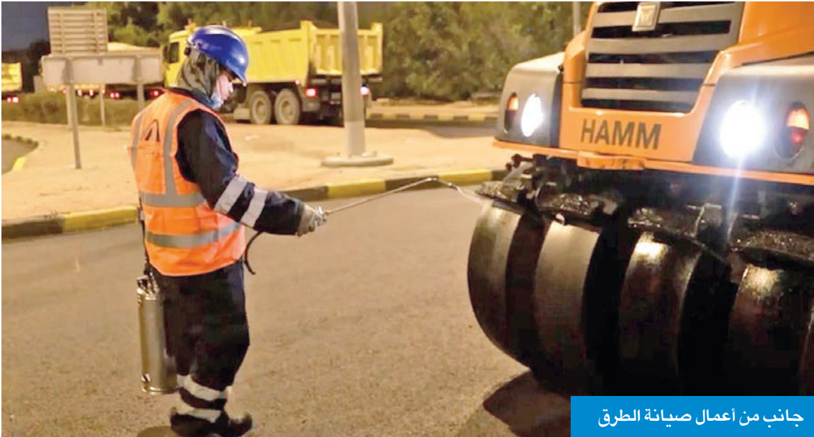
جانب من أعمال صيانة الطرق

شملت أعمال صيانة للطرق ومعالجة الحُفر والتشققات