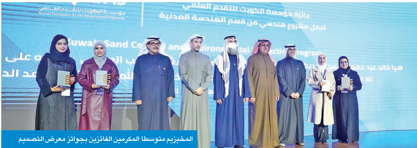
المخيزيم متوسطا المكرمين الفائزين بجوائز معرض التصميم

المشاريع المبتكرة والملهمة تسهم في تحقيق رؤية « 2035 » وتدعم الاستدامة