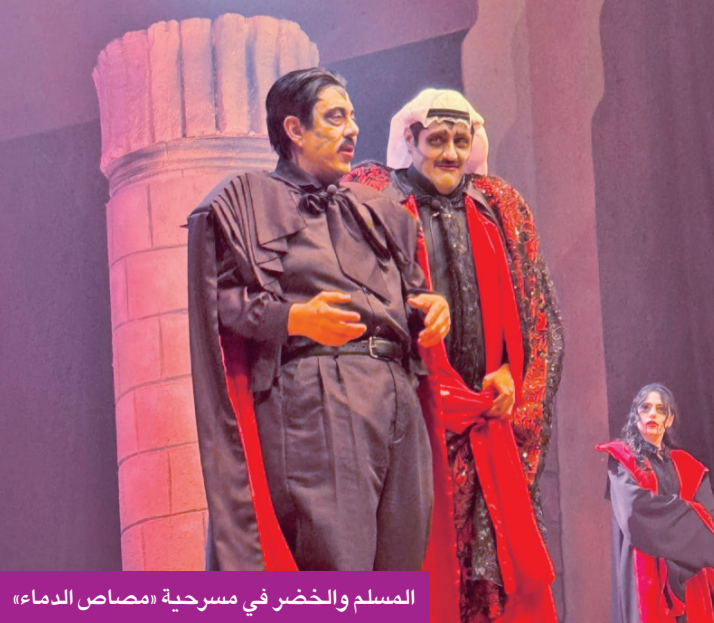
المسلم والخضر في مسرحية «مصاص الدماء»

وأشار المسلم إلى أنه اختنق بالدموع حين شاهد حرارة استقبال الجمهور له، والتصفيق الحار الذي يحمل حنيناً للماضي وتكريات جميلة لا تُنسى، وهو ما شعر معه بالوفاء من جمهور مُخلص مثقّف ومُحب للفنون وعاشق للمسرح.