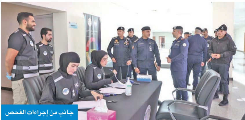
جانب من إجراءات الفحص

ومتطلبات الترقية، وتولي المناصب الإشرافية، والتعيين، وإجراءات التحقيق. وأخذت الوزارة أسرارها بكل حزم، بما يسهم في رفع مستوى الجاهزية والانضباط، والحفاظ على بيئة عمل آمنة وخالية من أي ممارسات سلبية.