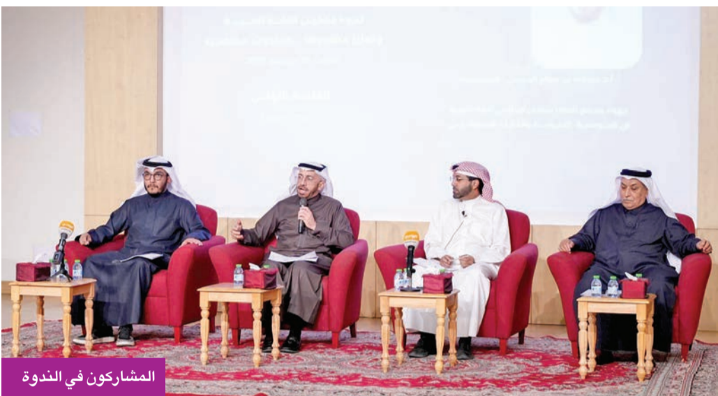
المشاركون في الندوة

خلال ندوة ثقافية حول واقع «العربية» ومستقبلها في عصر التحولات التكنولوجية المتسارعة