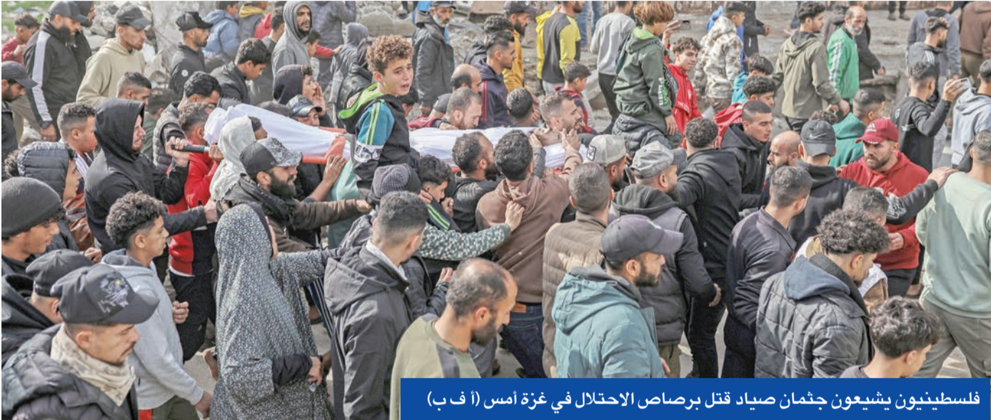
فلسطينيون يشيعون جثمان صياد قتل برصاص الاحتلال في غزة أمس

مدني حاكم سيشكل في الأسابيع المقبلة، لتولي زمام الأمور من «حماس». وأقرّ ترامب بوجود تباينات مع تننياهو بشأن الضفة الغربية المحتلة التي تخفّف الدولة العبرية تحركاتها لتعزيز الاستيطان اليهودي بها وفرض السيادة الإسرائيلية عليها، لكنه أعرب عن ثقته بالتوصل إلى تفاهمات معه. واختتمت تصريحاته بالتعبير عن أمله في أن يتمكن تننياهو من التوصل إلى تفاهم مع الرئيس السوري الانتقالي أحمد الشرع.