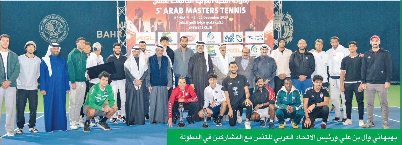
بهياني وآل بن علي ورئيس الاتحاد العربي للتنس مع المشاركين في البطولة