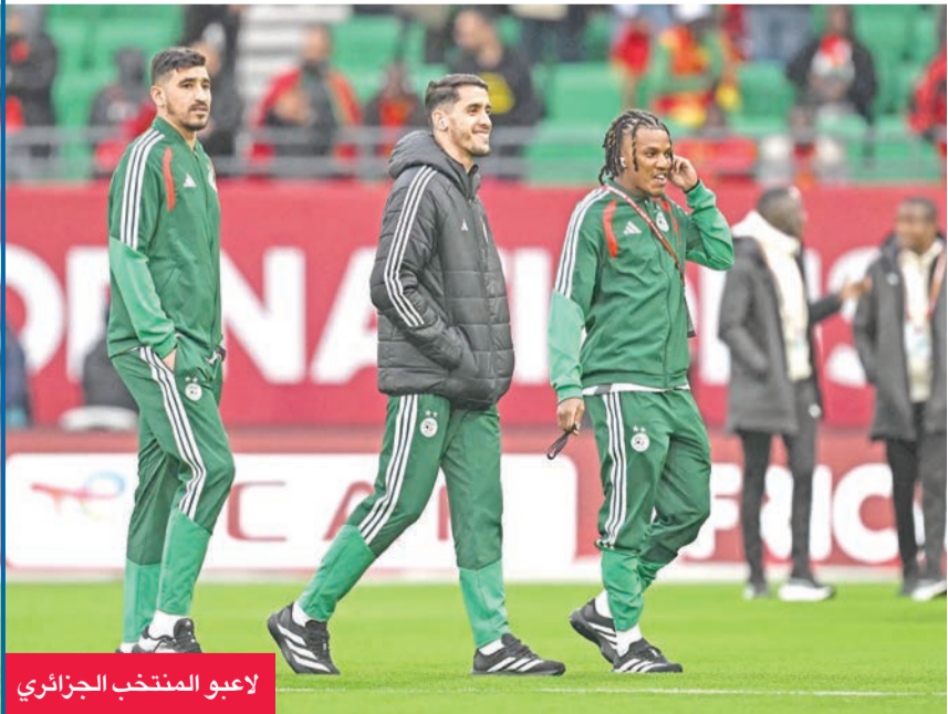
لاعبو المنتخب الجزائري

بتصدّر «الأفيال» المجموعة برصيد 4 نقاط، ويفارق الأهداف عن الكامبيرون. وتمثل هذه المباراة حجر الزاوية للمدرب إيميرس فاي، الذي يسعى للحفاظ على سجله الخالي من الهزائم في البطولة القارية، وتأمين الصدارة، لتفادي سيناريو النسخة الماضية عندما تاهل الفريق ضمن أفضل أصحاب المركز الثالث.