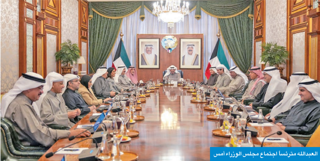
العبدالله مترئسا اجتماع مجلس الوزراء امس

الإدمان في منطقة الصليبية، الذي يأتي تنفيذاً لأحكام القانون رقم 59 لسنة 2025 في شأن مكافحة المخدرات والمؤثرات العقلية وتنظيم استعمالها والإتجار فيها. وأوضح العوضي أن هذا المشروع يعتبر مركزاً متكاملاً لعلاج الإدمان يوفر خدمات طبية وتأهيلية وفق أعلى المعايير، إذ يستهدف المدمنين الذي صدر بحقهم أحكام قضائية وشكاوى إدمان بهدف تمكينهم من استكمال فترة العلاج كاملة دون الإخلال بخطة ومدة العلاج، مبيّناً أن المشروع يقع على مساحة تبلغ 37500 متر مربع، وتضم مكونات المشروع مبنى رئيسياً يقدم خدمات صحية وفندقية بسعة 265 سريراً ومبنى المسرح ومبنى المعهد الصحي، الذي يتكون من حمام سباحة وناد رياضي وصالة علاج طبيعى، إلى جانب المبانى المساندة، التي تتكون من المطبخ والصيدلية المركزية والمصلى والمختبر، إضافة إلى 4 ملاعب خارجية، مؤكداً أن المشروع يُعد نموذجاً وطنياً رائداً للتكامل بين العمل الحكومي والدعم المجتمعي ويجسد الدور المحوري الذي تقوم به وزارتا الصحة والداخلية بالتعاون مع بيت الزكاة لتقديم العلاج وتأهيل مرضى الإدمان. واستعرض المجلس عدداً من المواضيع المدرجة على جدول الأعمال وقرر الموافقة عليها، كما قرر إحالة عدد منها إلى اللجان الوزارية المختصة لدراستها وإعداد تقارير بشأنها لاستكمال الإجراءات الخاصة لإنجازها.