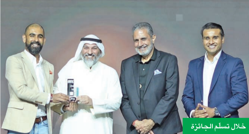
خلال تسلم الجائزة

حصلت شركة تاب للمدفوعات، الرائدة في تقديم خدمات الدفع وتطوير البنى التحتية لتقنيات المدفوعات الرقمية، والتي تمّ تأسيسها في الكويت، جائزة أفضل مقدّم لحلول الدفع «Best Payments Solution» من جمعية التقنية المالية في الشرق الأوسط وشمال إفريقيا (MENA Fintech Association)، وذلك خلال فعاليات أسبوع أبوظبي المالي.