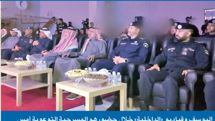
اليوسف وقياديو «الداخلية» خلال حضورهم المسرحية التوعوية أمس

أكد النائب الأول لرئيس مجلس الوزراء وزير الداخلية الشيخ فهد اليوسف أهمية فعاليات التوعية في دعم المسار الإصلاحي لنزلاء المؤسسات الإصلاحية وتعزيز القيم المجتمعية. وأشاد اليوسف، خلال رعايته وحضوره مسرحية توعوية هادفة من تأليف النزلاء وتقديمهم، بالجهود المبذولة من القائمين على هذه البرامج