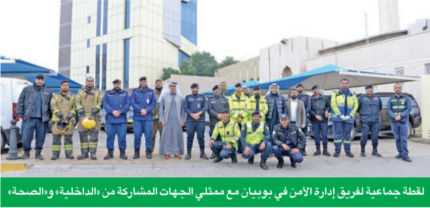
لقطة جماعية لفريق إدارة الأمن في بوبيان مع ممثلي الجهات المشاركة من «الداخلية» و«الصحة»

نجح بنك برقان أخيراً في إجراء عملية إخلاء وهمي لموظفيه في المقر الرئيسي، ضمن التزامه بمبادرات المسؤولية الاجتماعية والمؤسسية (ESG)، وحرصه المستمر على توفير بيئة عمل آمنة وتعزيز جاهزية الموظفين للتعامل مع حالات الطوارئ. وتأتي هذه الخطوة انطلاقاً من إيمان البنك بأن سلامة ورفاه موظفيه تمثل أولوية قصوى باعتبارهم من أهم أصوله، ويسهم الاهتمام بصحتهم وسلامتهم في رفع مستويات الإنتاجية، وتعزيز كفاءة الأداء، وضمان الاستجابة السريعة والفعالة في مختلف الظروف الطارئة. وأشرف على العملية فريق من قوة الإطفاء العام، حيث عمل على تقييم مدة سرعة استجابة الموظفين، إلى جانب تسجيل كل الملاحظات حول أي أخطاء محتملة لتجنبها في المستقبل، وتحديد القواعد اللازمة لمعالجتها، كما تم تنظيم تدريب شامل للموظفين حول كيفية التصرف في حال الكوارث الطبيعية أو الحوادث، وتركز جزء من التدريب على سيناريو اندلاع حريق في المبنى ووجود أشخاص مصابين ومحاصرين في أحد الطوابق.