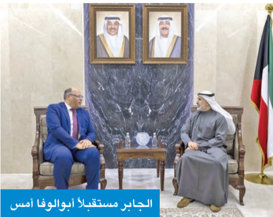
الجابر مستقبلاً أبو الوفا أمس

في إطار تطوير البنية التحتية وتعزيز انسيابية الحركة المرورية، افتتح محافظ الفروانية الشيخ عذبي الناصر، أمس، مشروع الإشارة الرباعية في تقاطع شارع الأردن مع شارع محمد بن القاسم، بعد الانتهاء من الأعمال التطويرية بالموقع، بحضور وكيل وزارة الأشغال العامة بالتكليف عبد الرشيد، ومساعد مدير أمن محافظة الفروانية العميد يحيى دشتي، ومدير مرور محافظة الفروانية العقيد راشد السليمان، وعدد من القيادات الأمنية والمسؤولين في وزارة الأشغال العامة. وأكد الناصر أن هذا المشروع يأتي