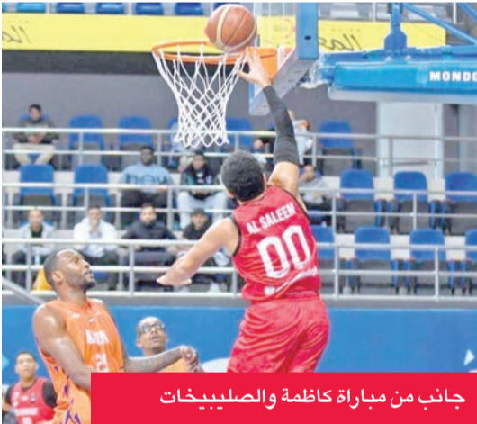
جانب من مباراة كاظمة والصليبيخات

وبهذه النتائج، رفع الكويت رصيده إلى 18 نقطة من 9 انتصارات متتالية، ليواصل تصدره للترتيب، يليه كاظمة في المركز الثاني متساوية مع القادسية الثالث برصيد 16 نقطة لكل منهما، مع أفضلية فارق التسجيل لمصلحة كاظمة. وجاء القرين رابعاً بـ 14 نقطة، ثم الصليبيخات خامساً بـ 13 نقطة، والنصر سادساً بـ 12 نقطة، والساحل سابعاً بـ 10 نقاط، في حين يقبع العربي في المركز الثامن والأخير برصيد 8 نقاط.