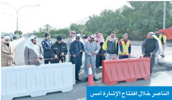
الناصر خلال افتتاح الإشارة أمس

استقبل صاحب السمو أمير البلاد الشيخ مشعل الأحمد، بقصر بيان، صباح أمس، الممثل الخاص للأمين العام للأمم المتحدة في العراق رئيس بعثة الأمم المتحدة لمساعدة العراق السفير د. محمد بن عوض الحسان، بمناسبة انتهاء عمل وولاية البعثة.