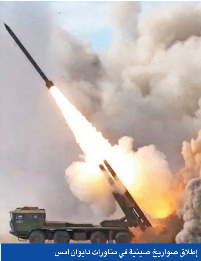
إطلاق صواريخ صينية في مناورات تايوان أمس

ترامب يبلغ نتنياهو استعداداه لكشف مخطط غزة الجديدة منتصف يناير ويتوعد «حماس» بالمحو