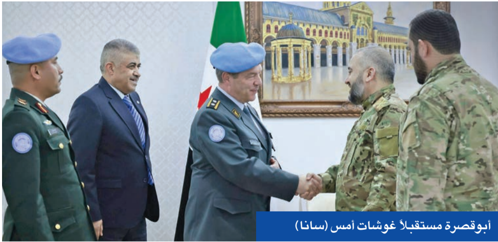
ابوقصرة مستقبلا غوшат أمس

على رأسها دمج المؤسسات المدنية والعسكرية التابعة للإدارة الذاتية الكردية في المؤسسات الوطنية بحلول نهاية العام