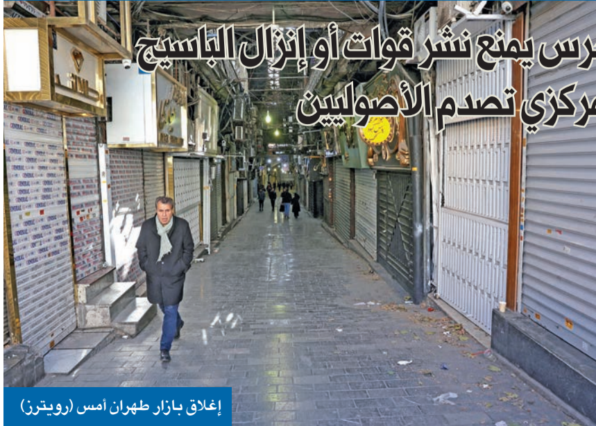
إغلاق بازار طهران أمس

واليوم الثالث على التوالي، امتدت الاحتجاجات على تدهور الوضع الاقتصادي بسرعة من بازار طهران إلى بعض المدن الأخرى مثل أصفهان وشيراز ومشهد وتبريز وكرج وزانجان وحمدان ووصلت إلى جزيرة قشم (قسم)، وشملت الطلاب في عدة جامعات، كما انضم حتى من صوتوا لبزشكيان إلى قطار الغضب الشعبي العارم، منددين بضعف قدرته على إدارة الشؤون الاقتصادية، وسياسات حكومته. وفي أول خطوة من نوعها، رفض البرلمان الميزانية الأكثر تقشفا، التي قدمها بزشكيان، واعتبرها رئيس اللجنة الاقتصادية «02