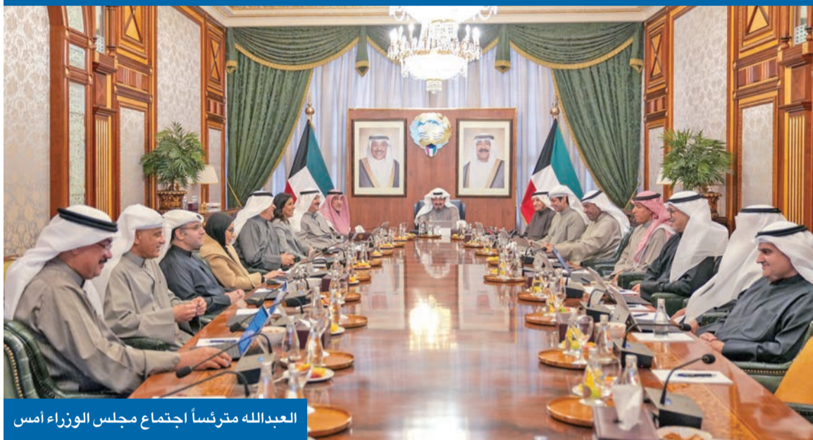
العيدالله مقررنا اجتماع مجلس الوزراء أمس