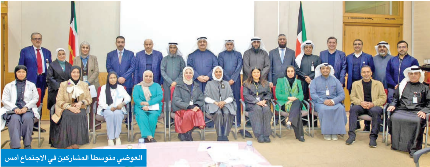
العوضي متوسلا المشاركين في الاجتماع امس

● ناقش الانتقال إلى المبنى الجديد لمركز مكافحة السرطان واستمرار الخدمات العلاجية