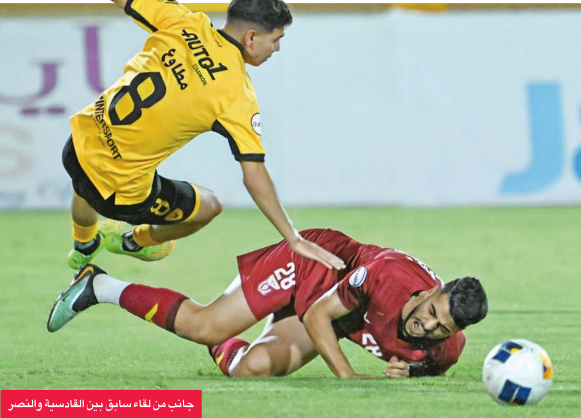
جانب من لقاء سابق بين القادسية والنصر

تنتقل مساء اليوم منافسات القسم الثاني من دوري زين الممتاز لكرة القدم بإقامة مواجهتين ضمن الجولة العاشرة، حيث يستضيف كاظمة نظيره السالمية في الـ 4:10 مساءً على استاد الصداقة والسلام، في حين يلتقي النصر مع القادسية في الـ 6:40 مساءً على استاد ثامر، في لقاءين يحملان طابع الحدي والطموح.