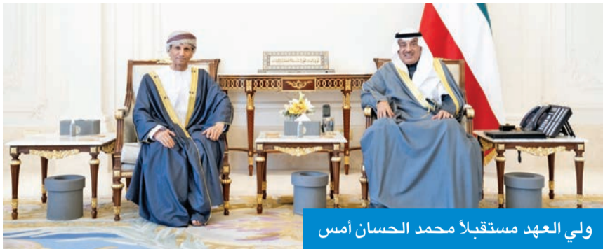
ولي العهد مستقبلاً محمد الحسان أمس

من جانب آخر، استقبل سمو ولي العهد، أمس، الممثل الخاص للأمين العام للأمم المتحدة في العراق رئيس بعثة الأمم المتحدة لمساعدة العراق السفير د. محمد بن عوض الحسان، بمناسبة انتهاء عمل وولاية البعثة.