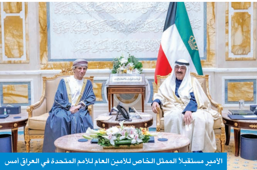
الأمير مستقبلاً الممثل الخاص للأمين العام للأمم المتحدة في العراق أمس

نقل سمو ولي العهد الشيخ صباح الخالد، تحيات صاحب السمو أمير البلاد الشيخ مشعل الأحمد، إلى رئيس الجمهورية التركية السيد عبد الله غول، عبر الفيديو، خلال اتصال هاتفي مساء أمس الأول. وجرى خلال الاتصال استعراض العلاقات الثنائية بين الكويت وتركيا لما فيه مصلحة البلدين والشعبين الصديقين، بالإضافة إلى مناقشة أبرز المستجدات ويحدث آخر التطورات والأوضاع الإقليمية والدولية.