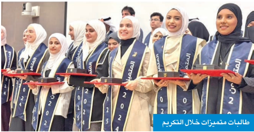
طالبات متميزات خلال التكريم

إلى أعضاء الهيئتين الأكاديمية والإدارية، ولأس الطلبة، متمنيا لهم دوام النجاح والتفوق، مؤكداً أن هذا التكريم يعكس وفاء المؤسسة التعليمية لطلبتها المتميزين، ويعزز ثقافة التميز في جامعة الكويت.