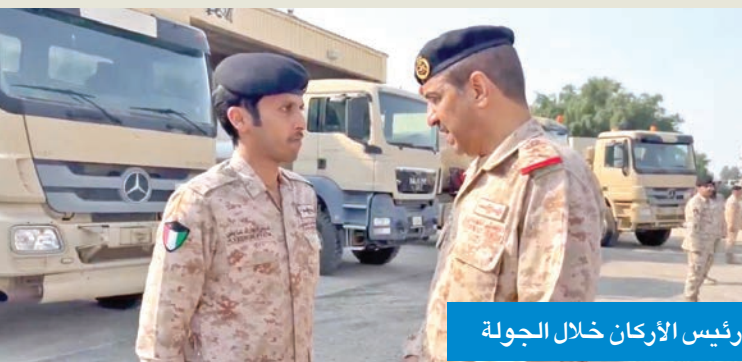
رئيس الأركان خلال الجولة

زار هيئة الإمداد والتموين واطلع على إجراءات الإسناد