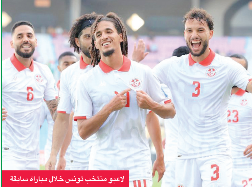
لاعبو منتخب تونس خلال مباراة سابقة

واستهلّت السنغال، التي توجب باللقب الأول في تاريخها بعدها بثلاث سنوات في الكاميرون، عندما تغلبت على مصر بركلات الترجيح، البطولة بقوة، عندما دكت شيكاب بوتسونان بثلاثية نظيفة، لكنها احتاجت إلى مهاجمها والنصر السعودي المخضرم ساديو مانيه للافلات من الخسارة أمام الكونغو الديموقراطية (1-1) في الجولة الثانية. وتميل كفة المواجهات المباشرة بين المنتخبين الى «أسود الخيرانغا» منذ المباراة الاولى عام 1961، حيث فازت في سبع من اصل تسع مباريات من دون خسارة.