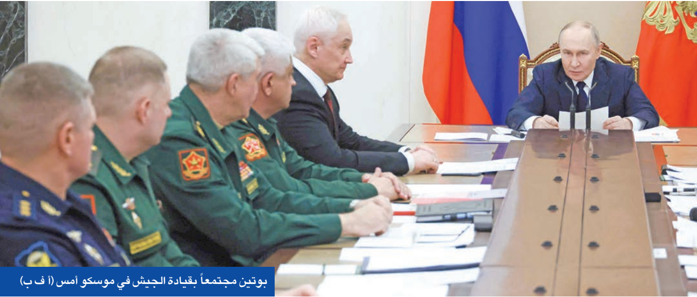
بوتين مجتمعاً بقيادة الجيش في موسكو أمس

مستقبل المناطق المحتلة وعلى رأسها دونباس، وآلية إدارة وتشغيل محطة زابورجيا النووية، إضافة إلى نشر قوات أجنبية داخل أوكرانيا ضمن منظومة الضمانات الأمنية. وجاءت تصريحات زيلينسكي حيث وصف المحادثات بأنها «مفجرة» وأحرزت تقدماً غير مسبوق، مؤكداً أن الخطة المؤلفة من 20 بنداً باتت شبه جاهزة، لكنها لا تزال بحاجة إلى قرارات سياسية حساسة قبل الانتقال إلى مرحلة التوقيع. وأوضح الرئيس الأوكراني أن الضمانات الأمنية