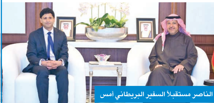
الناصر مستقبلاً السفير البريطاني أمس

رشيد : نتمن مكانة الكويت ودورها الإقليمي والدولي