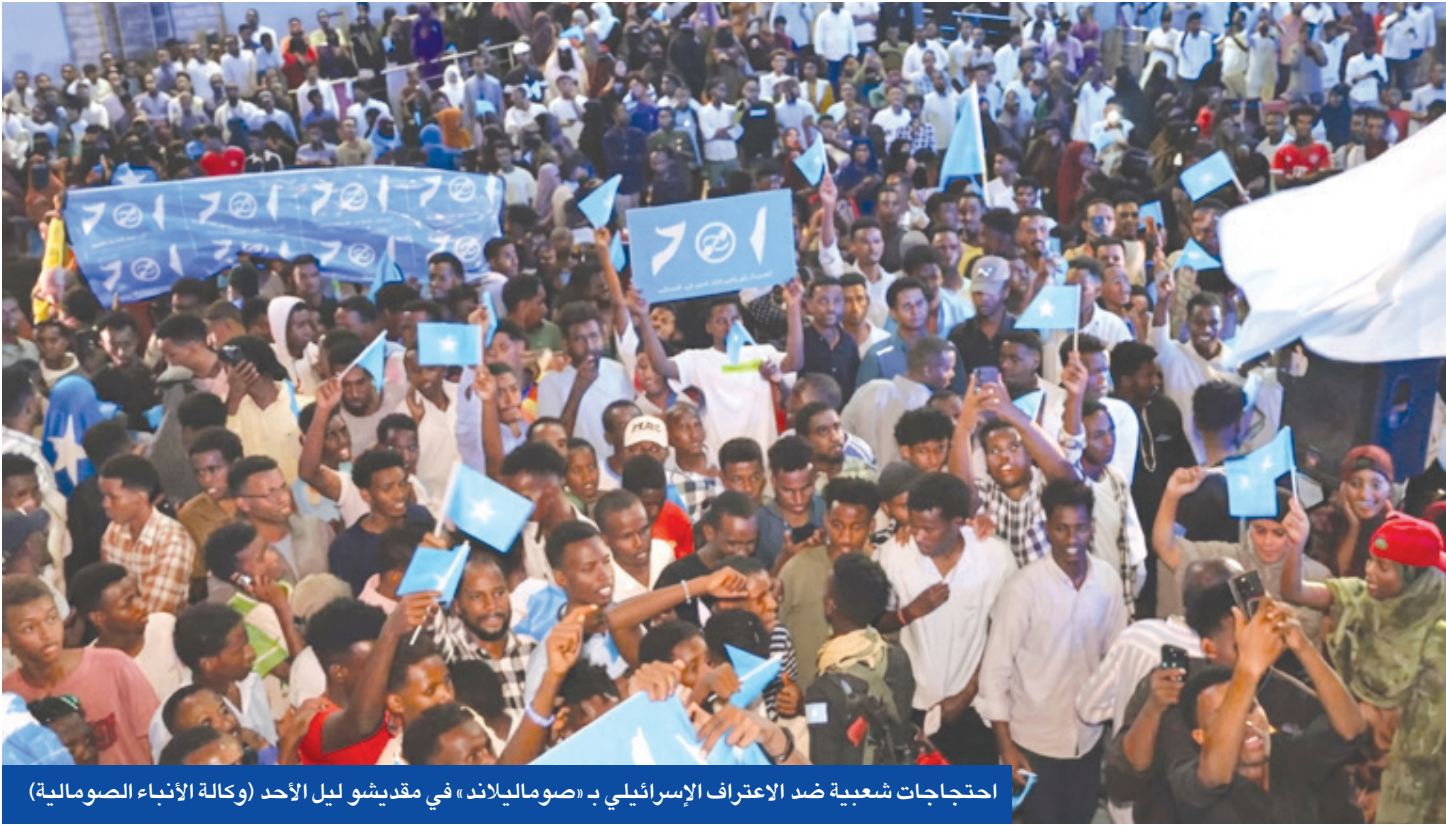
احتجاجات شعبية ضد الاعتراف الإسرائيلي بـ «صومالاند» في مقديشو ليل الأحد

مواجهة جماعة «أنصار الله» الحوثية المتمردة في اليمن وحليفاتها إيران بمنطقة استراتيجية مطلة على ساحل البحر الأحمر عند مضيق باب المندب. وفي وقت حذر زعيم المعارضة يائير لابيد من أن الاعتراف الذي أعلن عنه رئيس الوزراء بنيامين نتنياهو، وقال إنه يأتي في سياق روح اتفاقيات إبراهيم للطبيع، سيسبب سلسلة توترات إقليمية كبيرة. وترأسن ذلك مع نشر تقارير إسرائيلية، نقلا عما وصفته بمصادر عربية، تفيد بأن الدول الخليجية التي لم تطبع نقلت رسالة حازمة إلى تل أبيب، تحذرها من أن خطوتها تسهم في تأجيج تفتيت المنطقة وزعزعتها، وتعهدا عن مسار السلام، معاملة عن موقعها في حال دعم دول المنطقة للحركات الفلسطينية المسلحة بالضفة الغربية المحتلة وغزة.