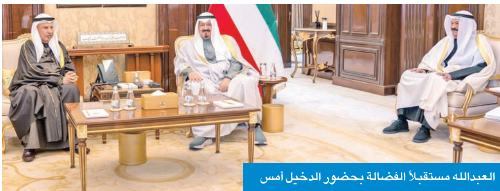
العبدالله مستقبلاً الفضالة بحضور الدخيل أمس

استقبل رئيس مجلس الوزراء سمو الشيخ أحمد العبدالله، في قصر بيان أمس، الأمين العام لمجلس التعاون لدول الخليج العربية جاسم البديوي، وذلك بمناسبة زيارته للبلاد، حيث سلم إلى سموه تقريراً حول رئاسة دولة الكويت للدورة الخامسة والأربعين للمجلس الأعلى لـ «التعاون الخليجي». وحضر المقابلة رئيس ديوان رئيس مجلس الوزراء عبد العزيز الدخيل. كما استقبل سموه الرئيس التنفيذي للجهاز المركزي لمعالجة أوضاع المقيمين بصورة غير قانونية صالح الفضالة، وحضر المقابلة رئيس ديوان رئيس مجلس الوزراء.