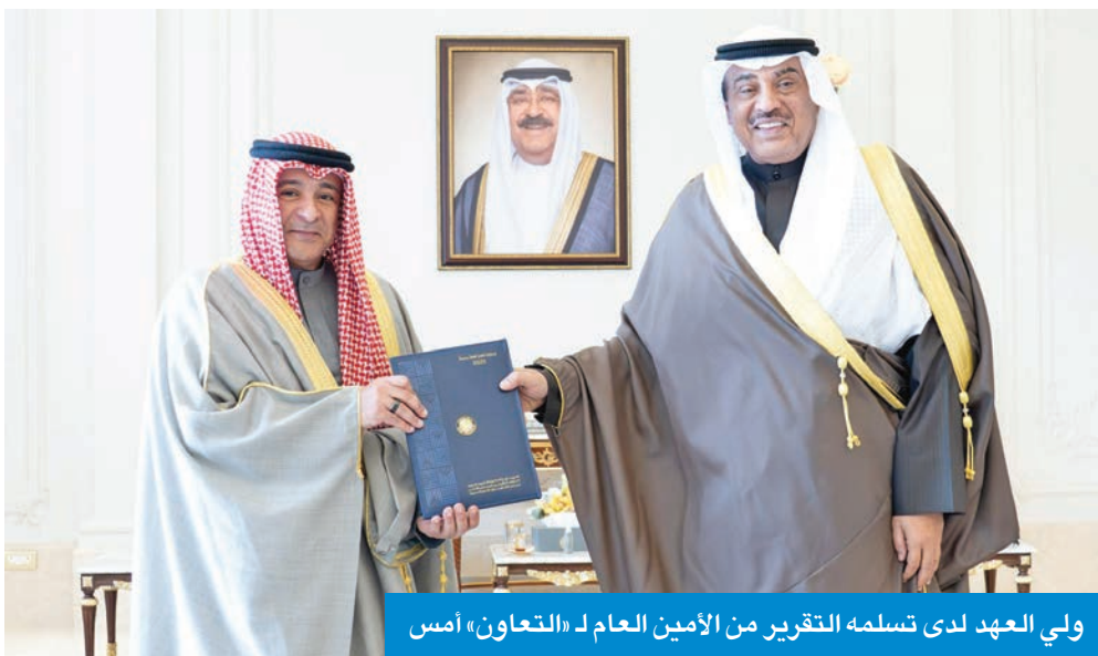
ولي العهد لدى تسلمه التقرير من الأمين العام لـ «التعاون» أمس

استقبل سمو ولي العهد الشيخ صباح الخالد، بقصر بيان أمس، الأمين العام لمجلس التعاون لدول الخليج العربية جاسم البديوي، حيث قدم إلى سموه تقريراً حول رئاسة دولة الكويت للدورة الخامسة والأربعين للمجلس الأعلى لمجلس التعاون.