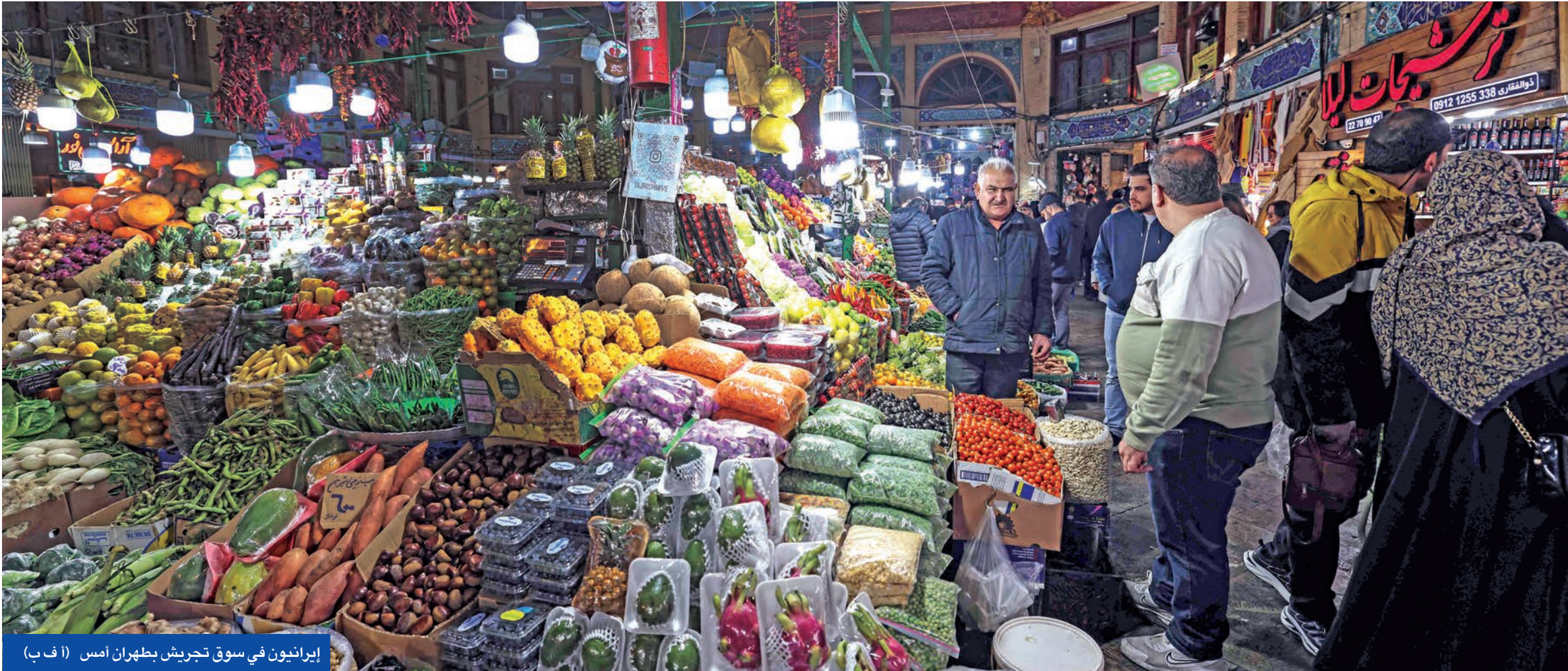
إيرانيون في سوق تجریش بطهران أمس

الإيرانية، سواء في القواعد الصاروخية أو المنشآت النووية، أثبتت فعاليتها حتى في مواجهة «أم القنابل» الأميركية، مبيّناً أن بعض هذه القواعد كانت مجهزة لتحمل حتى القصف بالقنابل النووية. وكشف المصدر أن إيران أنشأت 12 قاعدة صاروخية جديدة في الشرق، ونقلت إليها معظم إنتاجها الجديد من الصواريخ، إضافة إلى إنشاء معملين لإنتاج الصواريخ البالسيتية، لافتاً إلى أن إنتاج إيران خلال الشهر الأخير تجاوز 800 صاروخ بالستي بعيد المدى شهرياً، وهو رقم قياسي عالمي، وفق وصفه. وأكد المصدر أن الأجهزة الأمنية تهدف أيضاً إلى ضمان أمن العلماء الإيرانيين من عمليات اغتيال محتملة، مشيراً إلى نقل عدد كبير منهم إلى أماكن آمنة بقرارات رسمية، في ظل استمرار ملاحقة الأجهزة الإسرائيلية والأميركية وعملياتهما داخل إيران. وأكد أن الأجهزة الأمنية ترى أن إسرائيل تحارب إيران عبر التفوق التكنولوجي والذكاء الاصطناعي، محذراً من أن أي حرب جديدة ستقابلها عمليات اغتيال واسعة تشمل علماء وضباطاً إسرائيليين، لافتاً إلى نصيفة 5 من أصل 9 عملاء لـ «الموساد» كانوا متورطين بعملية البيجر في لبنان.