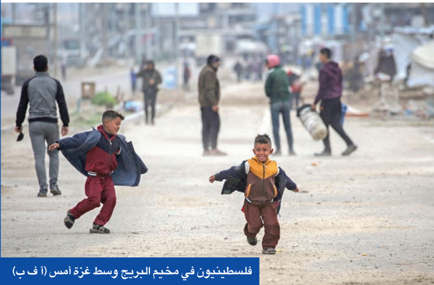
فلسطينيون في مخيم البريج وسط غزة أمس

استبق وزير الخارجية المصري بدر عبد العاطي، استقبال الرئيس الأمريكي دونالد ترامب لرئيس الوزراء الإسرائيلي بنيامين نتنياهو، الذي لم يتخلّ عن مخططاته الرامية لاحتلال غزة وتفريغها من سكانها، لتأكيد أن بلده رفضت «عروضاً سخية وكبيرة» مقابل تهجير الفلسطينيين من القطاع المحاصر، مشدداً على أن القاهرة «لا تسامو على مبادئها، وعلى رأسها عدم تصفية القضية الفلسطينية».