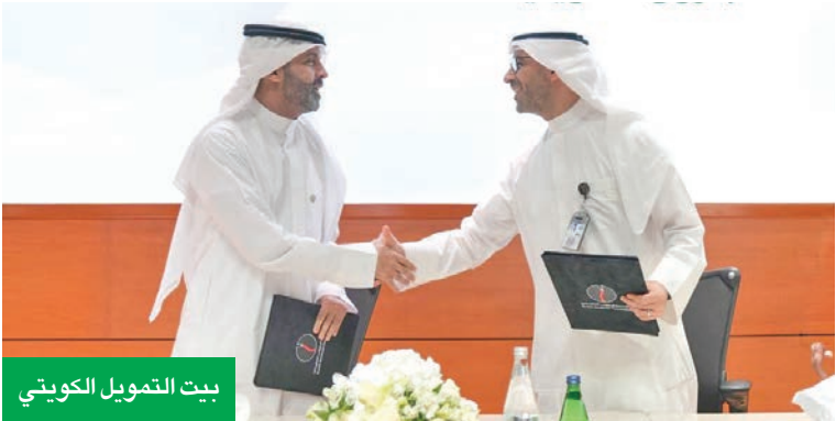
بيت التمويل الكويتي