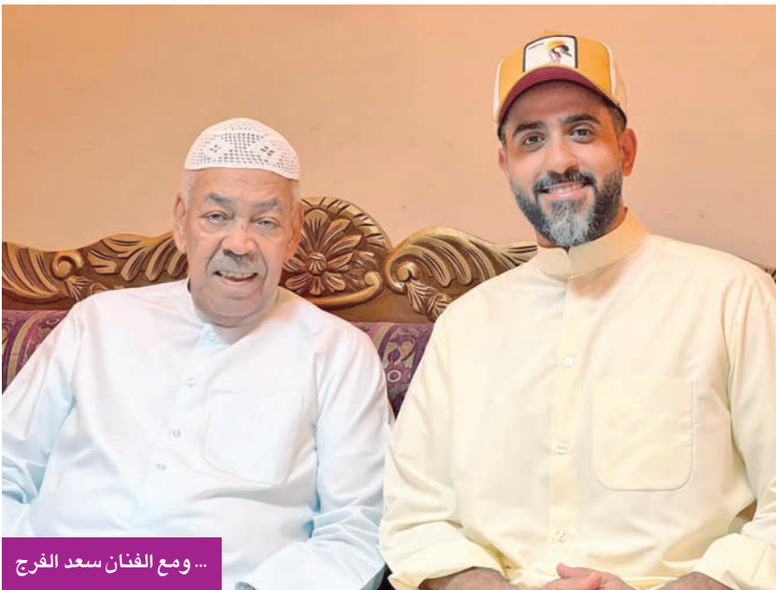
... ومع الفنان سعد الفرج

أكد أن الدراما الكويتية أثبتت قدرتها على المنافسة وتعيش حالة تطور مستمر