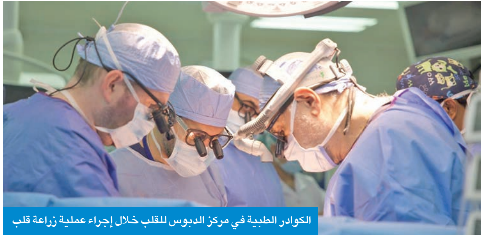
الكوادر الطبية في مركز الدبوس للقلب خلال إجراء عملية زراعة قلب

وأوضح الطرزي أن المركز نجح في زراعة مضخة القلب الصناعي (LVAD) لـ 84 حالة وهو جهاز يزرع لمرضى الفشل القلبي الشديد غير المستجيب للعلاج التقليدي ويعمل كمضخة مساعدة للبلطين الأيسر ريثما يتوفر قلب للزراعة أو كحل علاجي طويل الأمد لبعض المرضى. وأضاف أن الفرق الطبية نجحت كذلك في زراعة جهاز دعم القلب IMPELLA 2.5 لـ 20 حالة وهو جهاز ميكانيكي دقيق يستخدم لدعم القلب مؤقتاً في حالات الهبوط الحاد بالدورة الدموية أو خلال التدخلات المعقدة لضمان استقرار الدورة الدموية حتى تحسن الوظيفة القلبية. توفير الأعضاء مما يعكس النمو والفنية للمركز. بحالة واحدة في 2019 وحالة في 2021 وحالة في 2023 وحالتين في 2024 وذلك بالتنسيق مع برنامج