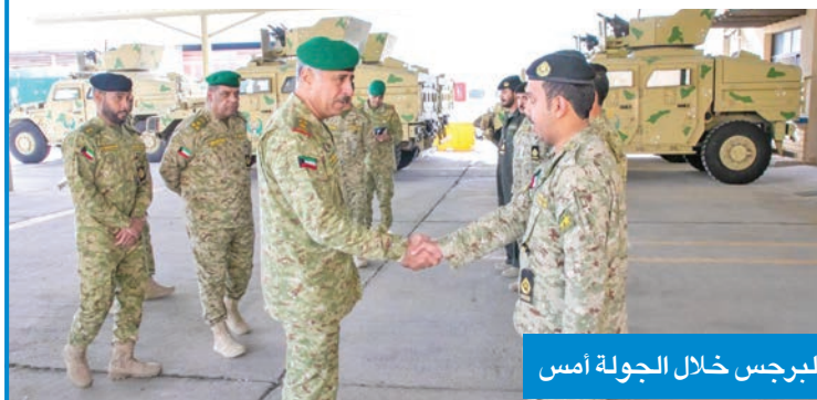
البرجس خلال الجولة أمس

تفقد معسكر التحرير ودورة المستجدين الأغرار