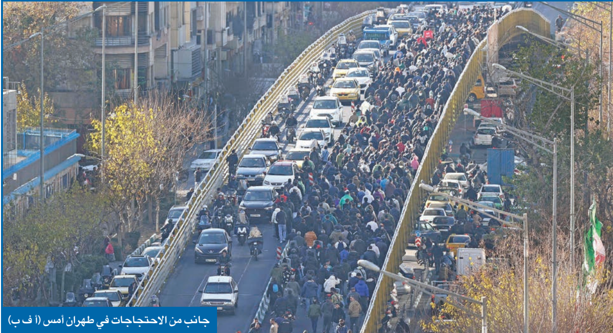
جانب من الاحتجاجات في طهران أمس