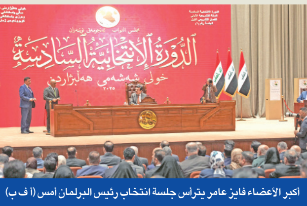
أكبر الأعضاء فايز عامر يترأس جلسة انتخاب رئيس البرلمان أمس (أ ف ب)

يوماً من الجلسة الأولى للبرلمان، وسيطلب الرئيس المنتخب بعد ذلك من الكتلة الأكبر في البرلمان تشكيل حكومة، وهي عملية عادة ما تستمر شهراً في العراق.