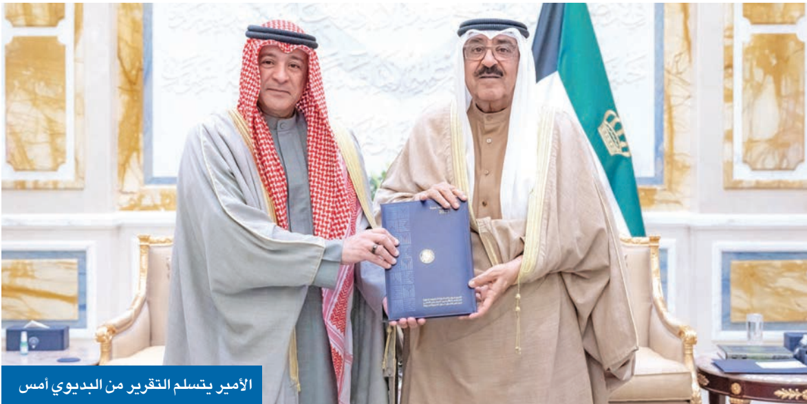
الأمير يتسلم التقرير من البيديوي أمس

سموه أكد لدى استقبله الأمين العام للمجلس أهمية تعزيز التكامل بين دوله لتلبية تطلعات شعوبها صاحب السمو وولي العهد والعبدالله تسلموا تقريراً عن رئاسة الكويت للدورة الـ 45 للمجلس البيديوي: الشكر والتقدير للأمير على رئاسته للدورة الـ 45 لمجلس التعاون ودعم أمانته العامة