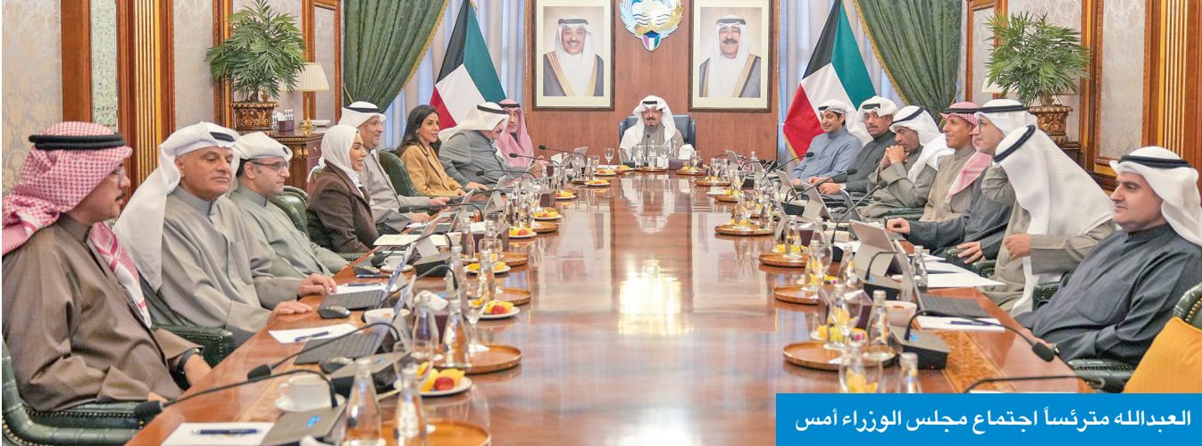
العبدالله مترئسا اجتماع مجلس الوزراء أمس

واستعرض المجلس عدداً من المواضيع المدرجة على جدول الأعمال، وقرر الموافقة عليها، كما قرر إحالة عدد منها إلى اللجان الوزارية المختصة لدراستها، وإعداد تقارير بشأنها لاستكمال الإجراءات الخاصة لإنجازها.