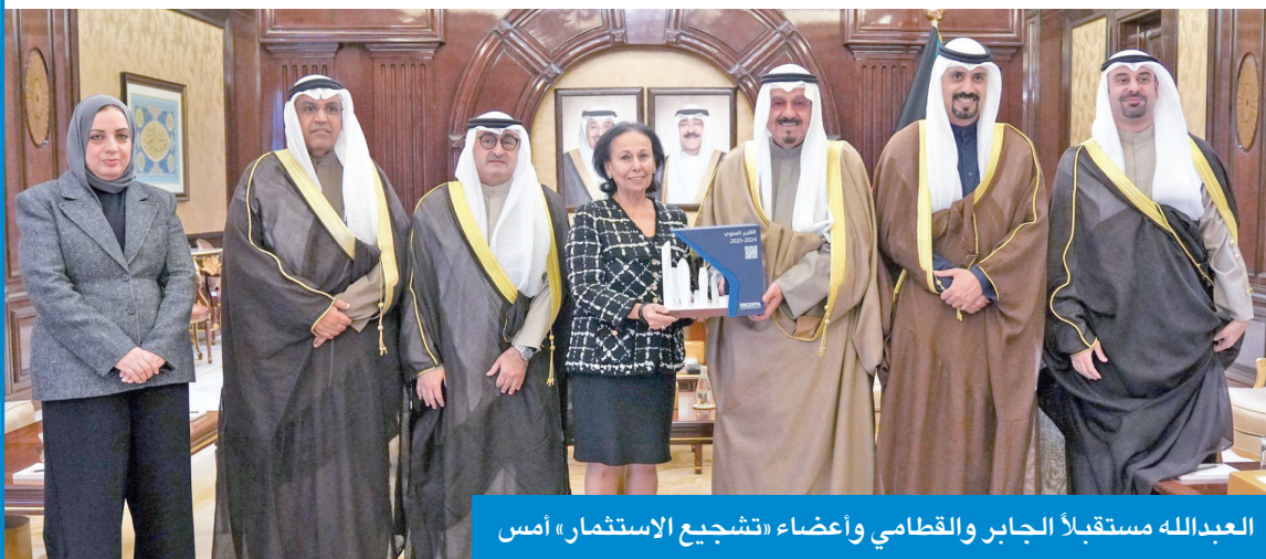
العبدالله مستقبلاً الجابر والقطامي وأعضاء «تشجيع الاستثمار» أمس

كما استقبل سمو ولي العهد الشيخ صباح الخالد مدير الهيئة الجابر ونائبته القطامي وأعضاء الهيئة، حيث قدموا لسموه التقرير السنوي العاشر لأعمال الهيئة لسنة 2024 - 2025. وعلى صعيد متصل، استقبل سمو رئيس مجلس الوزراء، الشيخ أحمد عبدالله، الجابر والقطامي وأعضاء الهيئة، حيث سلموا إلى سموه نسخة من التقرير السنوي العاشر لأعمال الهيئة لسنة 2024 - 2025.