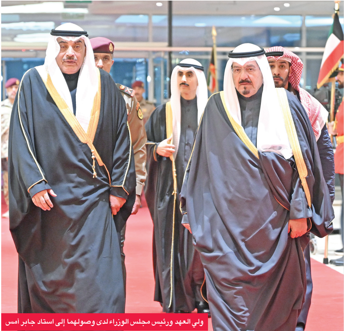
ولي العهد ورئيس مجلس الوزراء لدى وصولهما إلى استاد جابر أمس