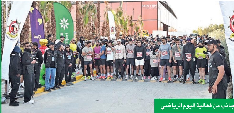
جانب من فعالية اليوم الرياضي

المؤسسي في البنك التجاري الكويتي أمانة الورع: إن رعاية البنك لليوم الرياضي تعكس حرصه على التواصل مع مختلف شرائح المجتمع، لا سيما فئة الشباب، إلى جانب تشجيع الأنشطة الرياضية ورعاية المواهب الكويتية الشابة، وأكدت الورع أن البنك يولي اهتماماً خاصاً بدعم ورعاية المبادرات الرياضية الهادفة، انطلاقاً من إيمانه بدور الشباب المحوري في تنمية المجتمع. وتقديراً لدور البنك ومساهمته في إنجاح هذه الفعالية، أعربت محافظة مبارك الكبير عن شكرها وتقديرها للبنك التجاري الكويتي على رعايته ودعمه لليوم الرياضي، مثمنة جهوده المتواصلة في دعم الأنشطة والمبادرات التي تسهم في نشر الوعي وتعزيز الاهتمام بالرياضة بين فئة الشباب