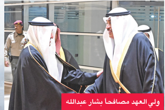
ولي العهد مصافحاً بشار عبدالله

جاء الشوط الأول ممتعاً ومثيراً من قبل الفريقين،