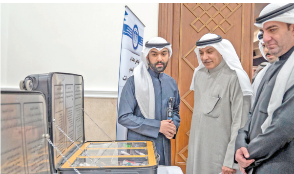
رئيس «الجمارك» خلال الجولة بالمعرض على هامش الندوة

● الفر: النيابة العامة تمد يد العون لدعم الشباب في العلاج والتأهيل قبل فوات الأوان