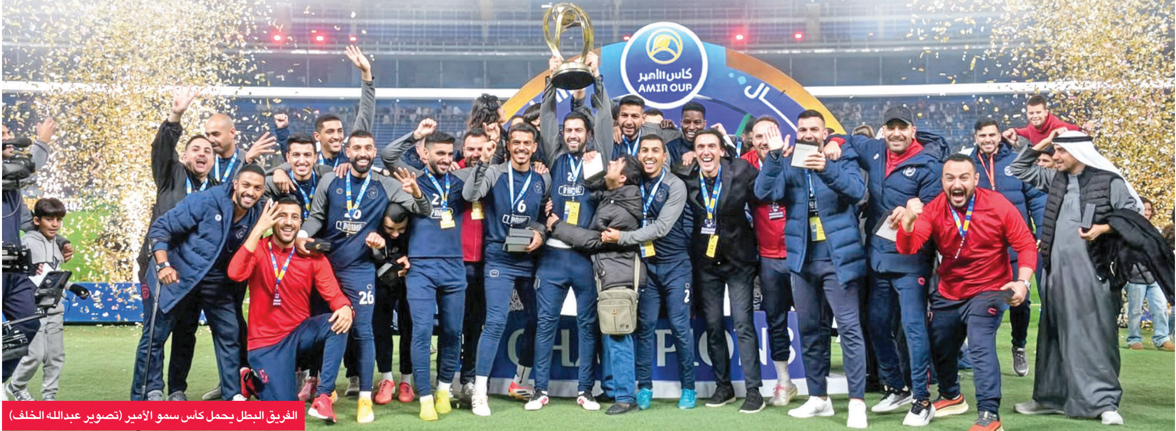
الفريق البطل يحمل كأس سمو الأمير