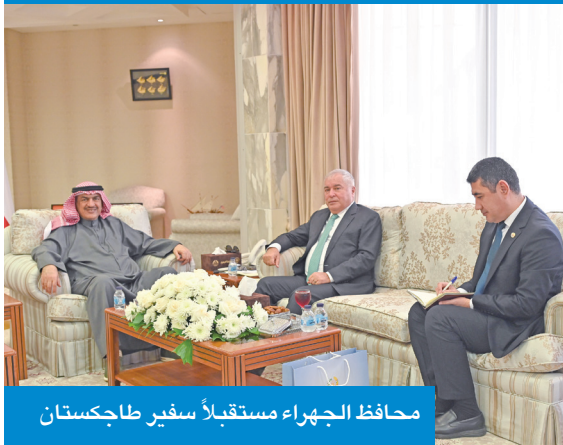
محافظ الجهرء مستقبلاً سفير طاجكستان

استقبل محافظ الجهرء حمد الحبشي، في مكتبه بديوان عام المحافظة، سفير جمهورية طاجكستان لدى الكويت د. زبيدالله زبيد زاده، حيث جرى خلال اللقاء تبادل الأحاديث الودية، واستعراض أوجه التعاون الثنائي.