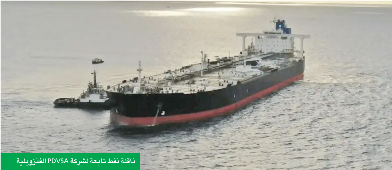
ناقله نفط تابعة لشركة PDVSA الفنزويلية