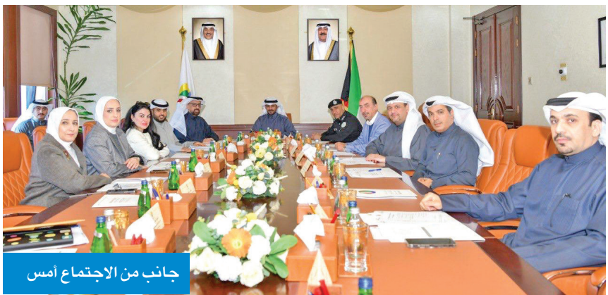
جانب من الاجتماع أمس

لتحقيق تطلعات المرحلة المقبلة، مشيداً بإسهامات أعضاء المجلس ودورهم في دعم مسيرة التنمية وتحسين الخدمات المقدمة في المحافظة.