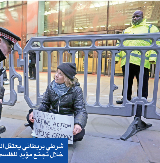
شرطي بريطاني يعتقل الناشطة السويدية غريتا ثونبرغ خلال تجمع مؤيد للفلسطينيين في لندن أمس

وأشارت المعلومات إلى أن نتائجهو يرهن ذلك بتراجع الرئيس التركي رجب طيب أردوغان عن «خطابه المعادي لإسرائيل واعتماد نهج أكثر ودية». وذكرت المصادر أن الضغط السياسي خلف الأبواب المغلقة حول «اليوم التالي» في غزة يتصاعد مع بروز دور تركي وقطري واضح، بهدف إجبار نتائجهو على الموافقة على مشاركة أنقرة في القوة الدولية، حتى أن قبل ترامب «الفيديو» الإسرائيلي ضد إدخال جنود أترك للقوات الفلسطينية. ميدانياً، أفيد بأن الجيش الإسرائيلي يعقّق المنطقة العازلة شمال غزة، بعد تقدّم أليانه في مخيم جباليا، وإزاحة «النار الأصفر» تحت غطاء الخطر المصغر، فيما ذكرت سلطات الاحتلال أنها تتحقق في ملاعبات مقتل فتى فلسطيني برصاص أحد جنوده في بلدة قباطية بالضفة.