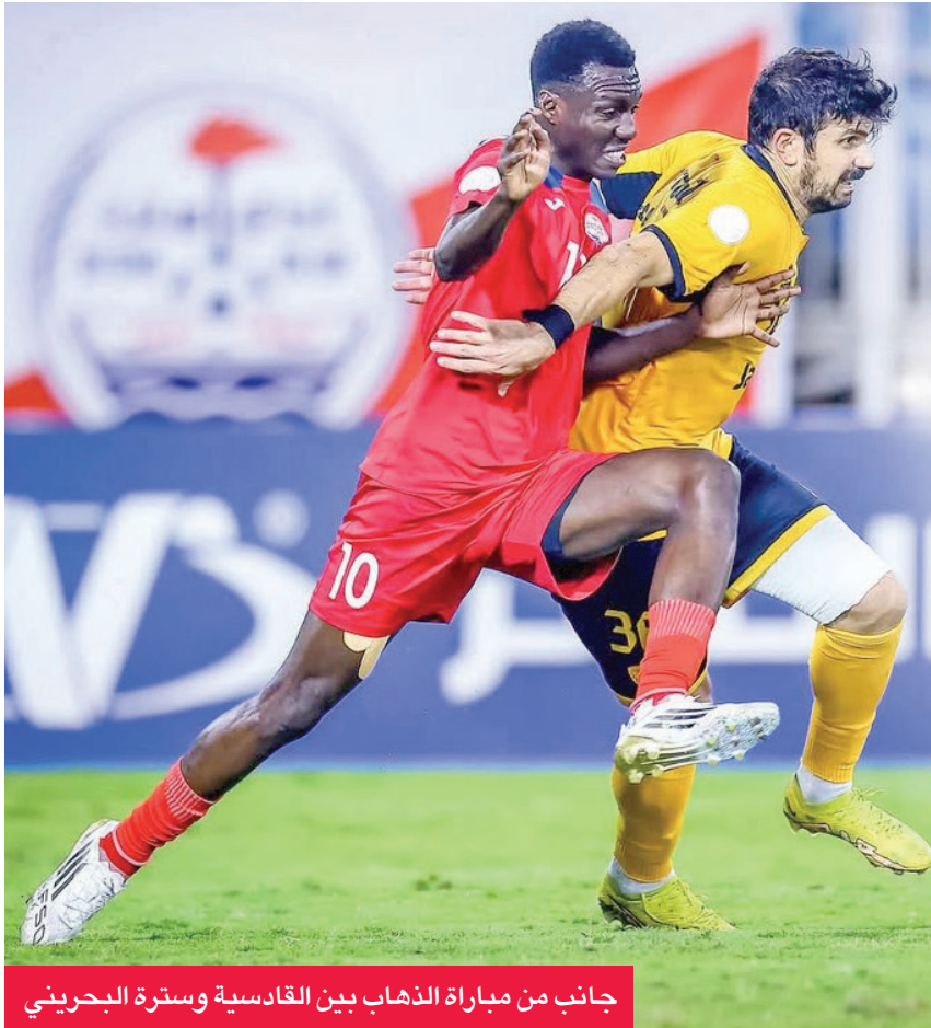
جانب من مباراة الذهاب بين القادسية وسترة البحريني