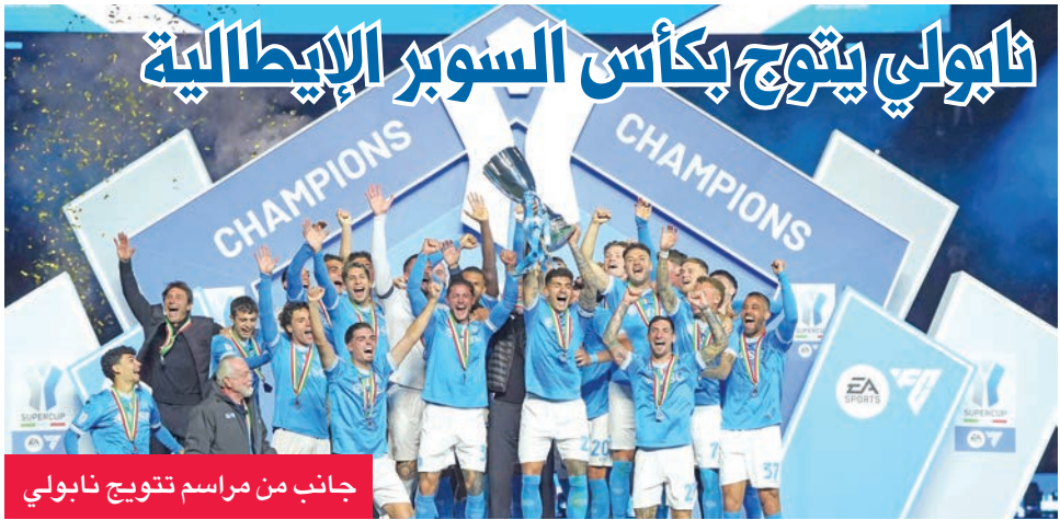
جانب من مراسم تتويج نابولي

السوبر التي أقيمت للمرة الرابعة توالياً، والسادسة تاريخياً، في السعودية. وكان إيتاليانو خسر سابقاً نهائي «كونفرنس ليغ» مع فريقه السابق فيورنتينا مرتين، في 2023 أمام وست هام الإنكليزي، وفي 2024 أمام أولمبياكوس اليوناني، كما خسر نهائي كأس إيطاليا مع فيورنتينا أيضاً في 2023 أمام إنتر.