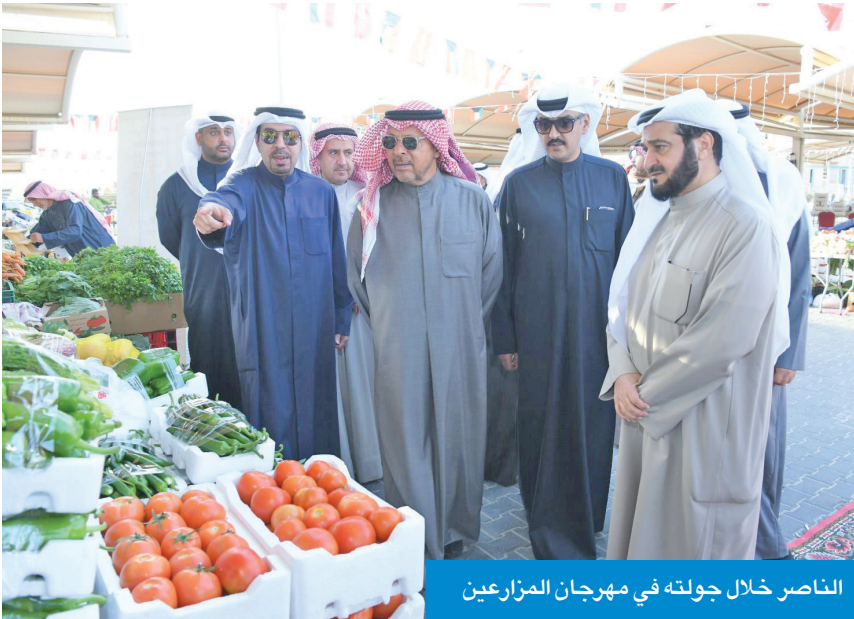
الناصر خلال جولته في مهرجان المزارعين

وملاحظاتهم حول عدد من القضايا التي تهّم الشأن المحلي والخدمي، في أجواء اتسمت بالتعاون والتواصل المباشر. وأكد الناصر خلال اللقاء حرص المحافظة على استمرار اللقاءات المفتوحة مع المواطنين، والاستماع إلى آرائهم ومقترحاتهم، بما يسهم في تعزيز الشراكة المجتمعية وترسيخ قيم الوحدة الوطنية. وثمن تفاعل أهالي المحافظة ومشاركتهم الإيجابية، مؤكداً أن هذه اللقاءات ستواصل تنظيم مثل هذه اللقاءات التي تعزز التواصل المباشر وتخدم الصالح العام. كما تخلل اللقاء كلمة توعية ألقاها الشريكة، أكد خلالها أهمية ترسيخ قيم الانتماء الوطني، وتعزيز التلاحم الشعبي، ونيد الفرقة، مشدداً على أن وحدة الصف والالتفاف حول الوطن تمثلان الركيزة الأساسية لأمن المجتمع واستقراره.