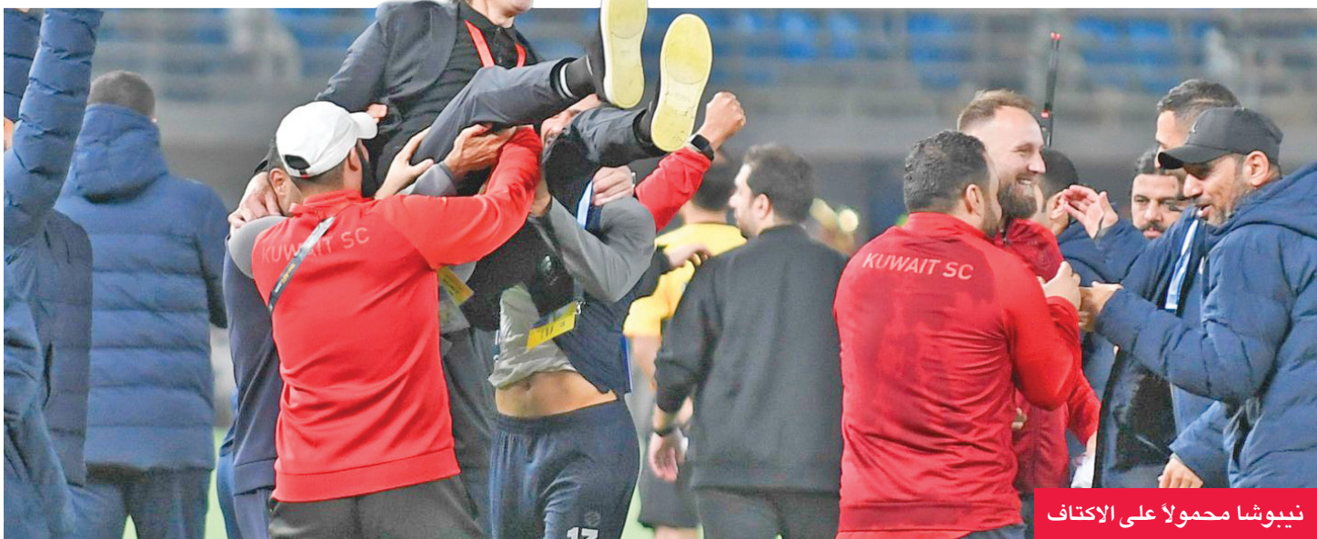
نبيوشا محمولاً على الاكتاف

بهذا الإنجاز، يصل عدد ألقاب الكويت في كأس سمو الأمير إلى 17 لقباً في تاريخه الزاخر بالبطولات، معادلاً بذلك رقم القادسية، في حين توقف رصيد العربي عند 16 لقباً، بينما نال كاظمة اللقب 8 مرات، أما السالمية واليرموك فنال كل منهما لقبين، والفحيحيل لقباً.