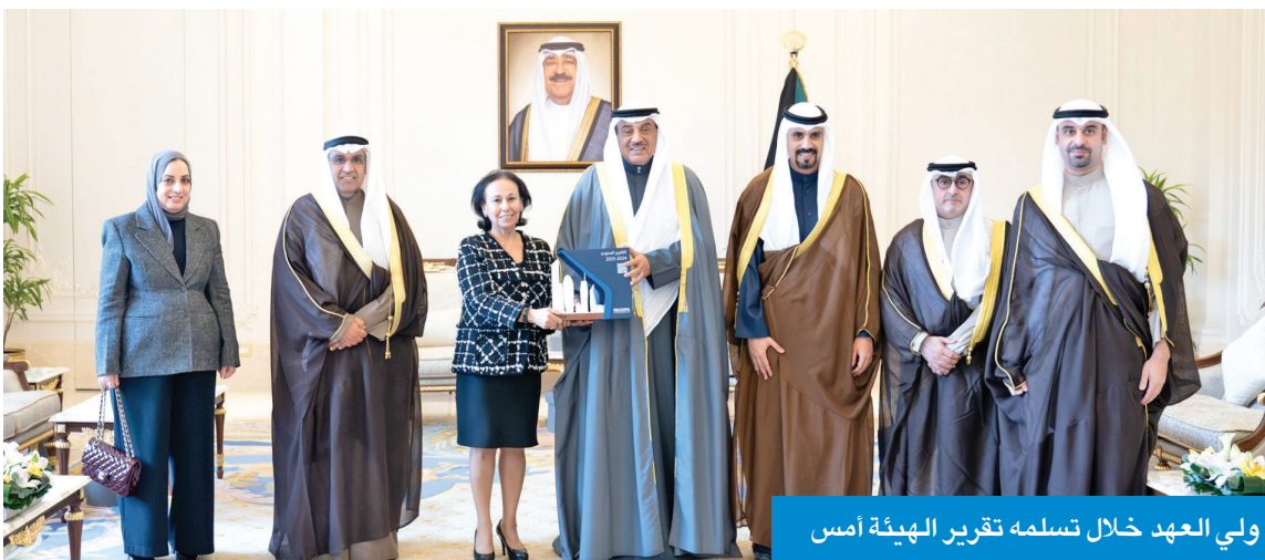
ولي العهد خلال تسلمه تقرير الهيئة أمس