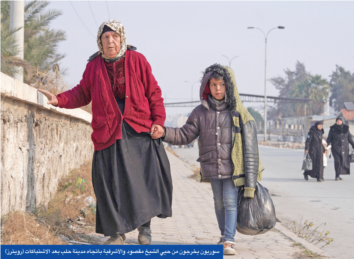
سوريون يخرجون من حي الشيخ مقصود والأشرفية باتجاه مدينة حلب بعد الاشتباكات

«واشنطن بوست»: الهجري أعد خرائط لدولة درزية تمتد للعراق... وإسرائيل و«سورية الديمقراطية» تدعماه