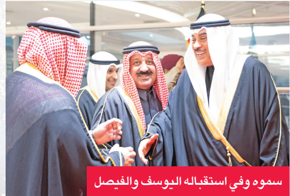
سموه وفي استقباله اليوسف والفيصل

وباتت المهمة صعبة على العربي، ويبدو أن اللاعبين افتقدوا التركيز في الدقائق التسع، التي احتسبها كوفاكس