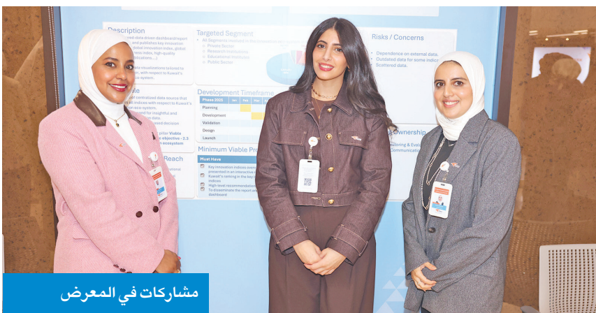
مشاركات في المعرض

وأكدت «التقدم العلمي» أن تنظيم هذا المعرض يترجم التزامها بدعم