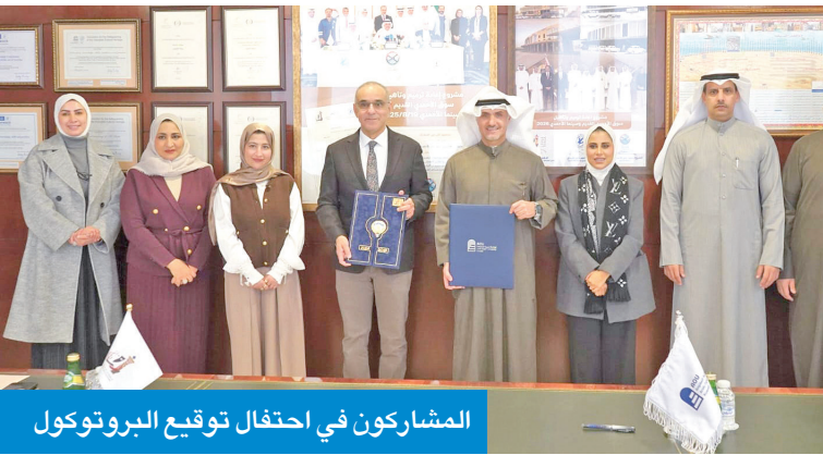
المشاركون في احتفال توقيع البروتوكول

تزامناً مع الذكرى الأولى لإقامة الشراكة الاستراتيجية بين الهند والكويت، والتي أعلنت خلال زيارة رئيس الوزراء الهندي ناريندرا مودي للكويت في ديسمبر 2024، شهدت ساحة أبراج الكويت إطلاق حملة «هند العجائب» للترويج السياحي، بحضور سفيرة الهند لدى البلاد باراميتا تريباتي، والرئيس التنفيذي لشركة المشاريع السياحية أنور الحليلة، إلى جانب ممثلين عن وسائل الإعلام الكويتية والهندية، وعدد من شركات السياحة والسفر.