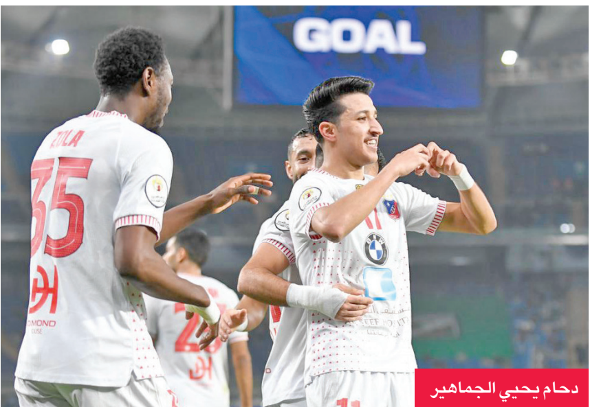
دحام يحيي الجماهير