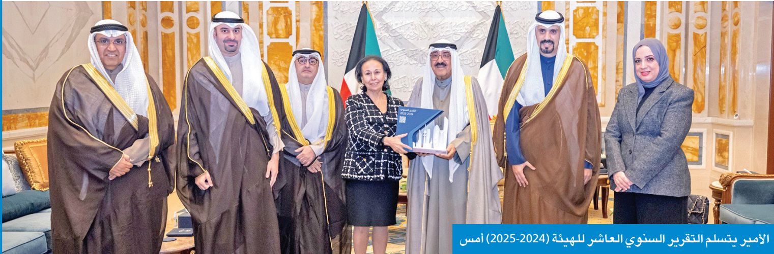
الأمير يتسلم التقرير السنوي العاشر للهيئة (2024-2025) أمس