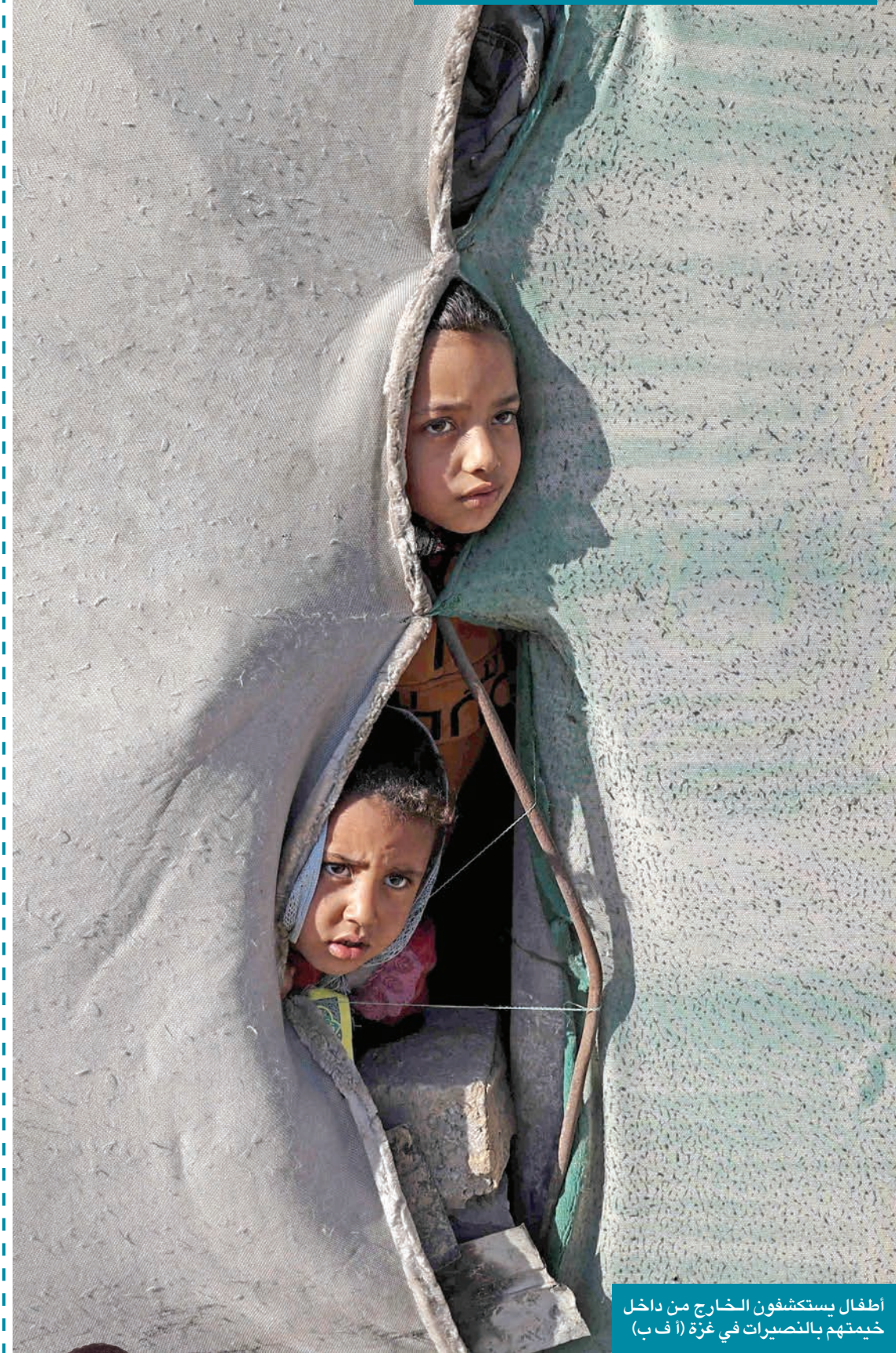
اطفال يستكشفون الخارج من داخل خيمتهم بالنصيرات في غزة