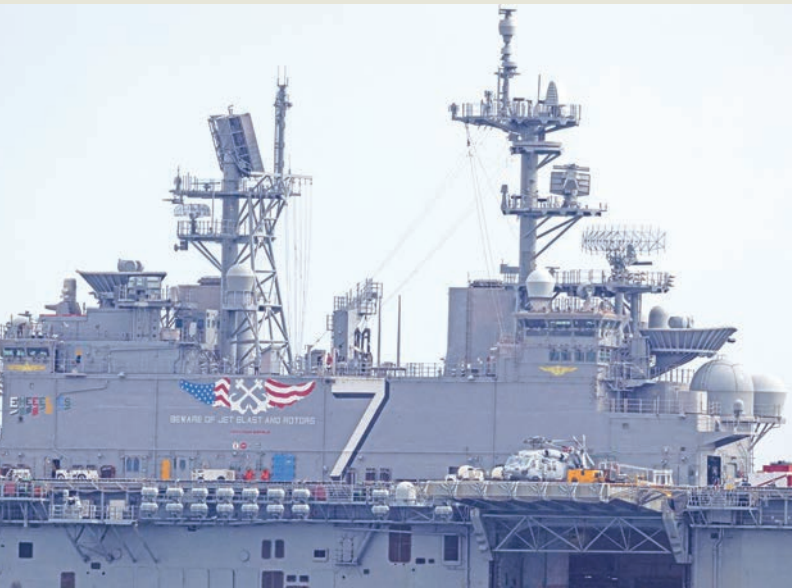
سفينة الهجوم البرمائي الأميركية «إيو جيما» راسية في بونس في بورتوريكو

في خطوة قد تتسبب مواجهة عسكرية بين فنزويلا والولايات المتحدة، نقلت صحيفة نيويورك تايمز الأميركية، عن مصادر أن الحكومة الفنزويلية أمرت السفن الحربية بمرافقة الاشتراكي، نيكولاس مادورو، بمواصلة الوفاء بالتزامات تصدير النفط، عقب إعلان الرئيس دونالد ترامب منع دخول وخروج جميع ناقلات النفط الخاضعة للعقوبات من الدولة الواقعة في أميركا الجنوبية. وعلى عكس ما حصل قبل أيام، عندما صادرت الولايات المتحدة ناقلة في عرض البحر دون أي مقاومة، قد تؤدي مرافقة سفن عسكرية فنزويلية للناقلات إلى مواجهة عسكرية، وسط التوتر المتصاعد.