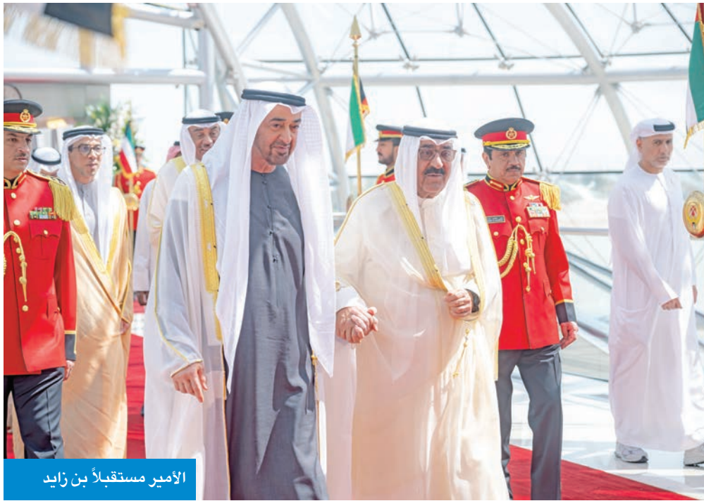
الامير مستقبلاً بن زايد

زار الكويت خلال العام الحالي عدد من رؤساء الدول العربية والأجنبية الصديقة، حيث استقبلهم صاحب السمو الشيخ مشعل الأحمد، وتبادل معهم سبل تعزيز العلاقات الدبلوماسية بين دولة الكويت وبلدانهم. ففي الخامس عشر من أبريل الماضي، زار الكويت الرئيس المصري عبدالفتاح السيسي، وفي الثاني عشر من مايو زار الكويت الرئيس اللبناني جوزيف عون. وفي الأول من يونيو، زار الكويت الرئيس السوري أحمد الشرع، وزار الكويت في الثامن من أكتوبر الرئيس الإماراتي محمد بن زايد، وفي 21 أكتوبر زارها الرئيس التركي رجب طيب أردوغان.