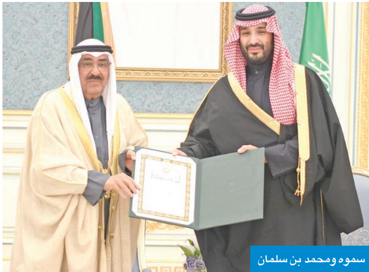
سموه ومحمد بن سلمان