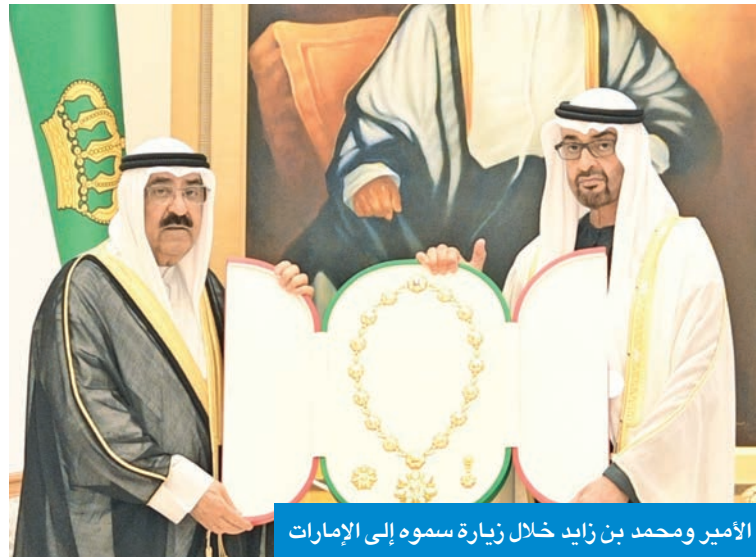
الأمير ومحمد بن زايد خلال زيارة سموه إلى الإمارات

وفي مطلع أبريل، وجّه صاحب السمو كلمة بمناسبة العشر الأواخر من شهر رمضان المبارك، وفي 7 أبريل أصدر سموه أمراً أميرياً بقبول استقالة رئيس مجلس الوزراء د. محمد الصباح والوزراء، وفي 14 أبريل صدر أمر أميرى بتعيين سمو الشيخ أحمد العبدالله رئيساً لمجلس الوزراء. وشهد شهر أبريل 2024 أيضاً زيارات لسمو الأمير إلى المملكة الأردنية الهاشمية، وجمهورية مصر العربية الشقيقة، وقام سموه بزيارة تاريخية إلى تركيا، شهدت توقيع 6 اتفاقيات للتعاون الثنائي.