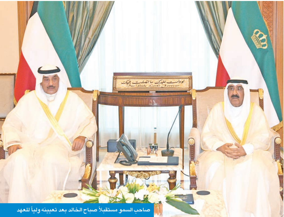
صاحب السمو مستقبلاً صباح الخالد بعد تعيينه ولياً للعهد

واستطرد أن التماذي وصل إلى حدود لا يمكن القبول بها أو السكوت عنها، من خلال التدخل في صميم اختصاصات الأمير وتدخل البعض في اختيار ولي العهد، متناسياً أن هذا حق دستوري صريح وواضح وجلي للأمرين.