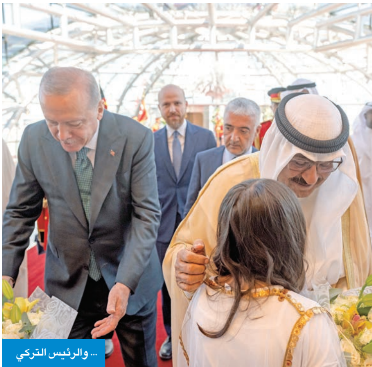
... والرئيس التركي

زار الكويت خلال العام الحالي عدد من رؤساء الدول العربية والأجنبية الصديقة، حيث استقبلهم صاحب السمو الشيخ مشعل الأحمد، وتبادل معهم سبل تعزيز العلاقات الدبلوماسية بين دولة الكويت وبلدانهم. ففي الخامس عشر من أبريل الماضي، زار الكويت الرئيس المصري عبدالفتاح السيسي، وفي الثاني عشر من مايو زار الكويت الرئيس اللبناني جوزيف عون. وفي الأول من يونيو، زار الكويت الرئيس السوري أحمد الشرع، وزار الكويت في الثامن من أكتوبر الرئيس الإماراتي محمد بن زايد، وفي 21 أكتوبر زارها الرئيس التركي رجب طيب أردوغان.