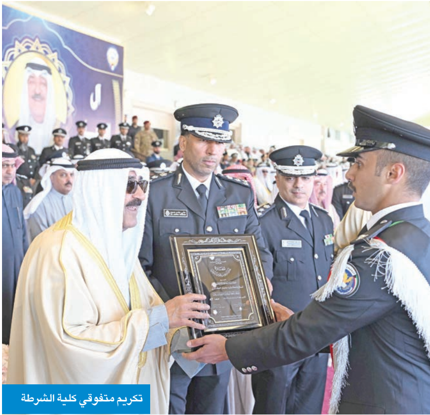
تكريم متفوقي كلية الشرطة