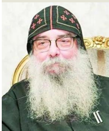
القمصن يجول الأنبا بيشوي

لها، ووضعت مصلحة الوطن واستقرار المجتمع في مقدمة الأولويات». وأضاف أن «العامين الماضيين شهدا حرصا واضحا على تعزيز الاستقرار ودعم مسارات التنمية والتوجه نحو مشروعات حضارية كبرى، إلى جانب حضور كويتي فاعل في المحيطين الإقليمي والدولي، بما يبرشخ مكانة البلاد، ويؤكد دورها الإنساني المقدر في كل الصعد وفي مختلف المحافل». وأكد يجول أن الكويت تواصل ترسيخ منهجها الإنساني القائم على التعايش والتسامح واحترام التعدد، مشدداً على أنها بقيادتها وشعبها تستغل واحة للخير والسلام، وأن رسالتها الإنسانية ممتدة ومحل تقدير، رافعا أصدق الدعوات