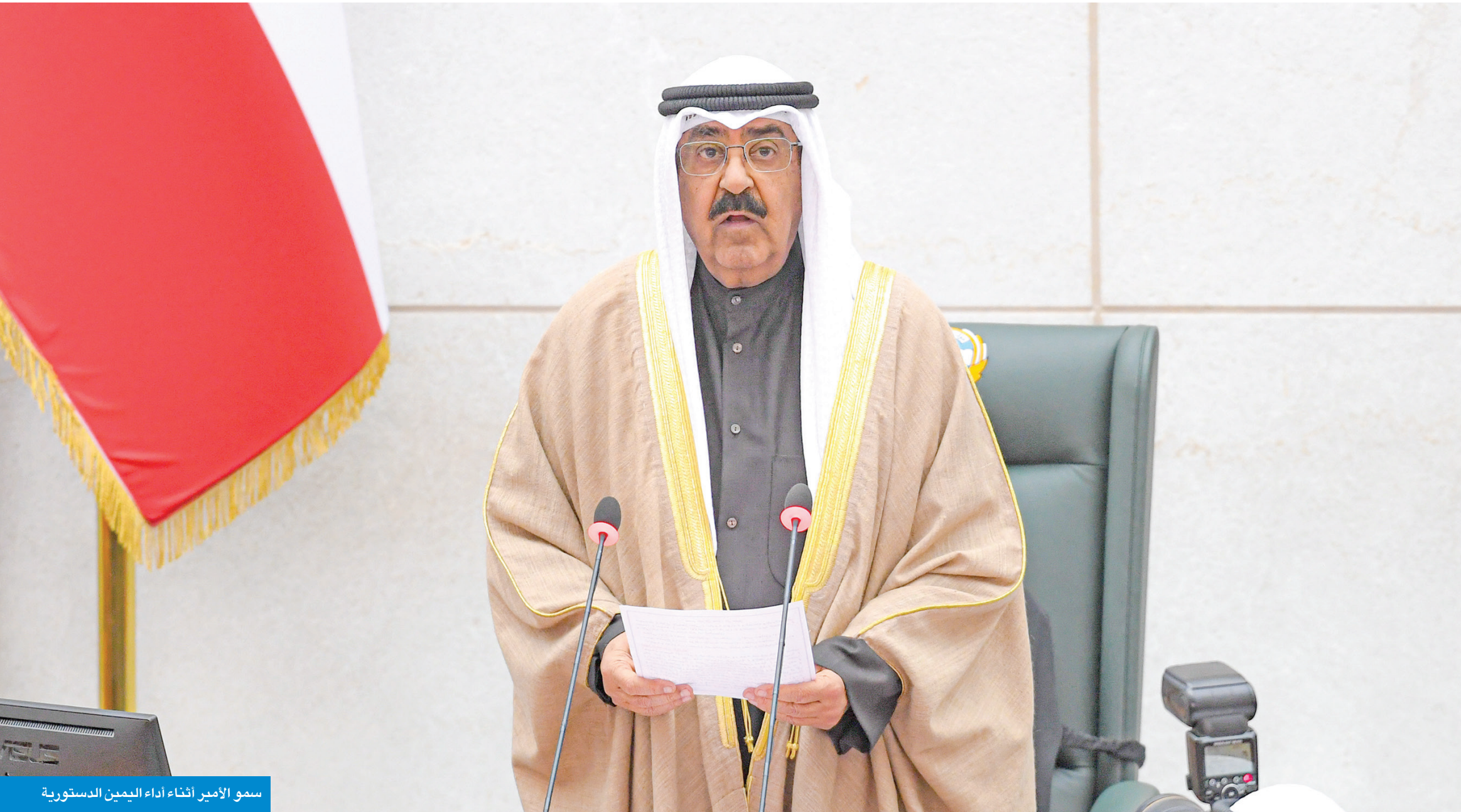
سمو الأمير أثناء أداء اليمين الدستورية

خطى ثابتة لترسيخ الاستقرار وتعزيز الإصلاحات وتكريس التنمية