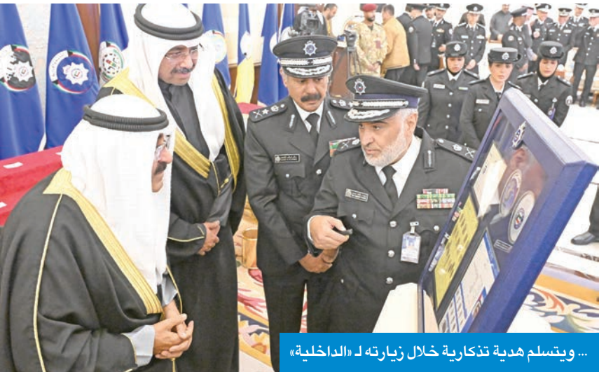
... ويتسلم هدية تذكارية خلال زيارته لـ «الداخلية»

دعاة الفتنة يحاولون من خلال ملف الجنسية خلط الأوراق لثيق وحدة الصف والتشكيك في القرارات المتخذة