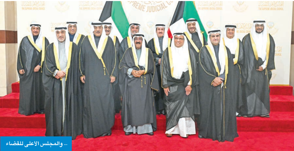
... والمجلس الأعلى للقضاء

مع النظم والأساليب الحديثة المتبعة بالبلدان المتقدمة في مجال مكافحة والوقاية من الحرائق والكوارث، وأكد الاستفادة من التكنولوجيا الحديثة لحماية الأرواح والممتلكات وتعزيز الأمن المجتمعي، وزيادة فعالية خدمات الوقاية والسلامة، والاستمرار في الدور التوعوي ونشر ثقافتها، من خلال إقامة حملات التوعية. وطالب سموه بالاهتمام بأسطول آليات القوة ومعداتنا الحديثة التي تتفق مع المعايير والمقاييس العالمية، وتساهم في تطوير أداء ومهارات القوة البشرية، وأكد أهمية التعاون المشترك مع القطاعات العسكرية والأمنية والمؤسسات المدنية الحكومية والخاصة.