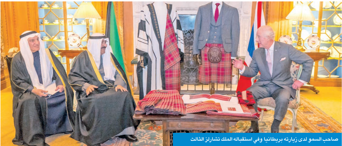
صاحب السمو لدى زيارته بريطانيا وفي استقباله الملك تشارلز الثالث

مسيرة التعاون الثنائي المشترك، خاصة في مجال التعاون الاقتصادي بما يساهم في تطوير التنسيق والتكامل على الصعيد التجاري والاستثماري لتعزيز المصالح المشتركة. والتقى سمو أمير البلاد الشيخ مشعل الأحمد، سلطان عمان هيثم بن طارق، وذلك في قصر البركة العامر بالعاصمة مسقط. وجرى خلال اللقاء بحث عمق العلاقات الأخوية الراضية بين الكويت وسلطنة عمان الشقيقة، وسبل دعم مسيرة التعاون الثنائي المشترك في شتى المجالات، خاصة في مجال التعاون الاقتصادي، بما يساهم في تطوير التنسيق والتكامل على الصعيد التجاري والاستثماري لتعزيز المصالح المشتركة وتحقيق تطلعات الشعبين الشقيقين نحو مزيد من التقدم والنماء. وأعرب سمو الأمير، في ختام الزيارة، عن رغبة مشتركة بتطوير الشراكة على أسس من التفاهم والاحترام، والدفع بها إلى آفاق أوسع وأكثر شمولاً، بما يحقق تطلعات الشعبين في بناء مستقبل أكثر ازدهاراً واستقراراً لخدمة البلدين.