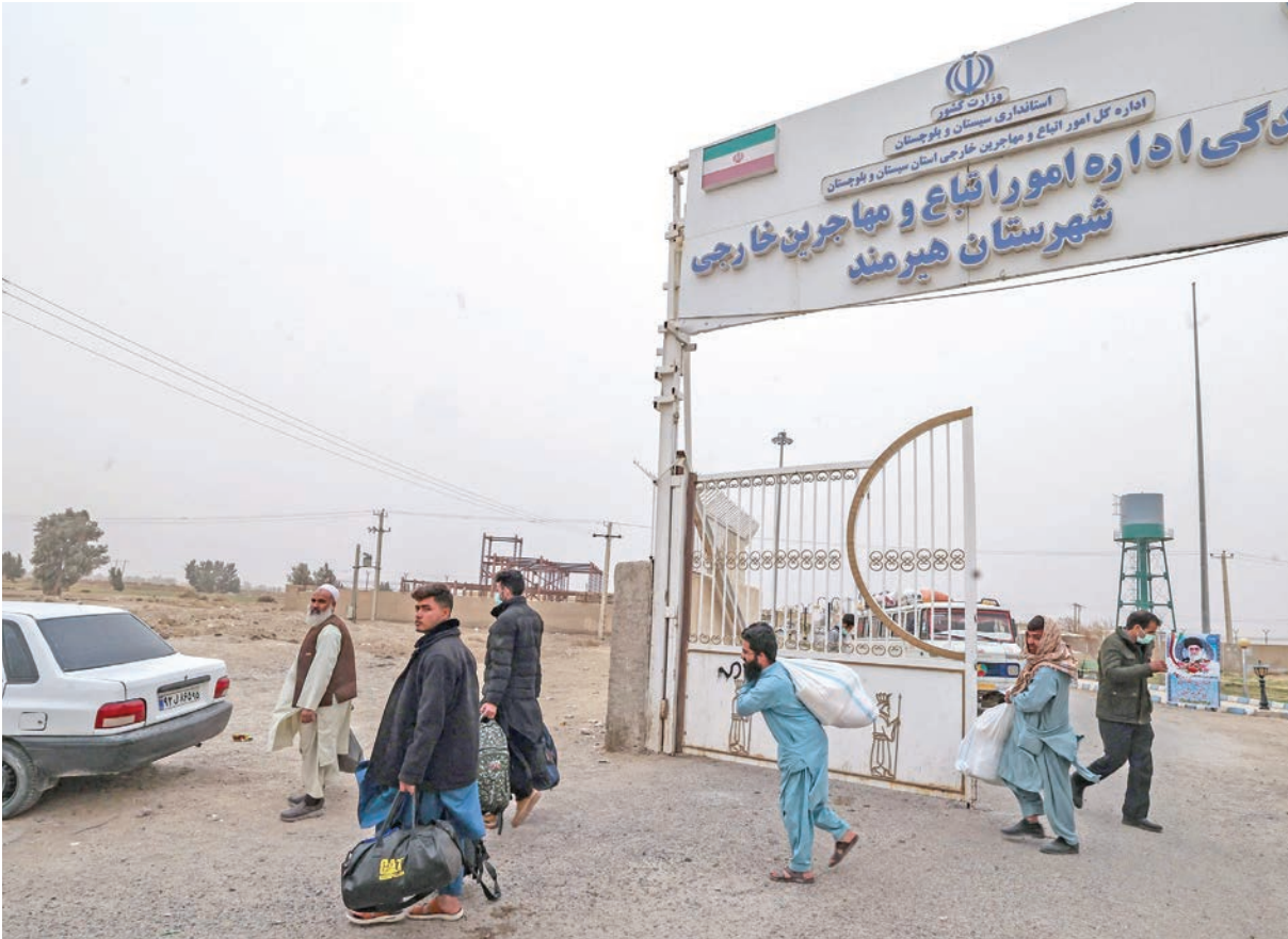
افغان داخل مركز احتجاز بمحافظة سيستان بلوخيستان يستعدون للترحيل من إيران باتجاه بلدهم امس الأول