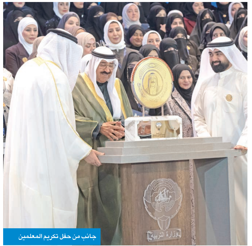
جانب من حفل تكريم المعلمين

والمدارس المتميزة. وفي 30 أبريل الماضي، كرم صاحب السمو أوائل الخريجين المتفوقين من حملة الإجازة الجامعية والدراسات العليا للجامعيين 2022/2021 و 2023/2022 في جامعة الكويت، على مسرح الدانة بمدينة صباح السالم الجامعية. كما رعى سموه حفل تكريم المتفوقين من خريجي كليات ومعاهد الهيئة العامة للتعليم التطبيقي والتدريب للعام الدراسي 2023 / 2024، على مسرح الديوان العام الجديد للهيئة بمنطقة الشويخ.