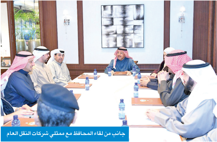
جانب من لقاء المحافظ مع ممثلي شركات النقل العام

التقى محافظ الغرمانية، الشيخ عدي الناصر، أهالي منطقة خيطان وممثلي شركات النقل العام، في إطار حرص المحافظة على تعزيز التواصل المباشر مع المواطنين، والاستماع إلى ملاحظاتهم ومقترحاتهم حول القضايا الخدمية التي تهم المنطقة. وجرى خلال اللقاء بحث عدد من الموضوعات المتعلقة بخدمات النقل العام، واليات تطويرها بما يواكب احتياجات سكان المنطقة، إلى جانب مناقشة أبرز التحديات المرورية والتنظيمية، وسبل تحسين مستوى الخدمة بما يحقق السلامة ويسهم في تسهيل حركة التنقل.