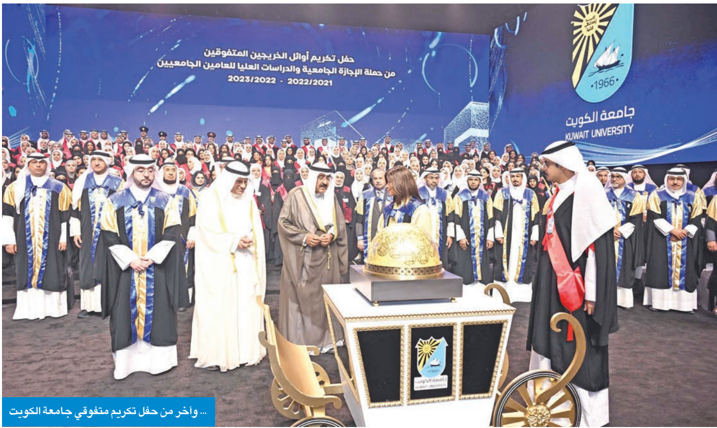
... وآخر من حفل تكريم متفوقي جامعة الكويت