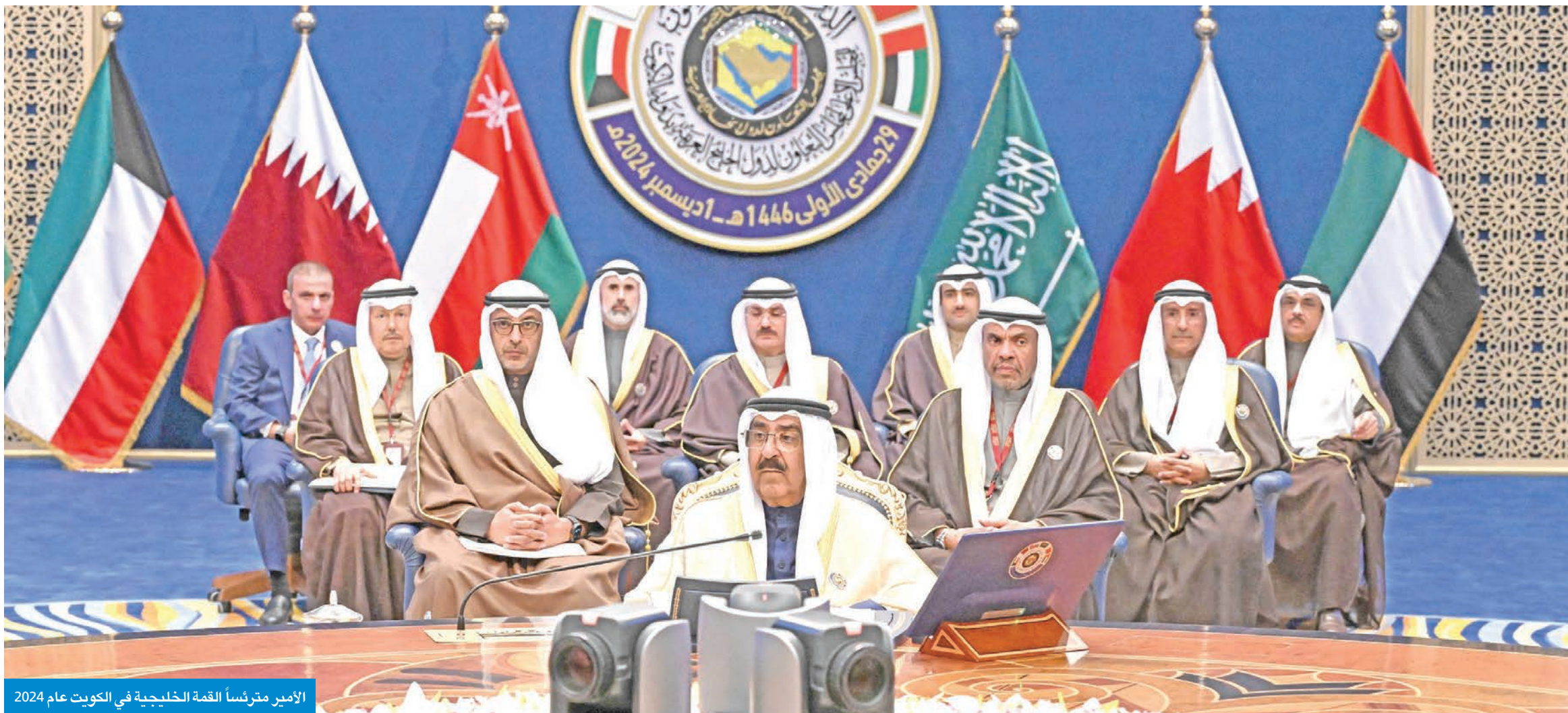
الامير مترئساً القمة الخليجية في الكويت عام 2024

الارتقاء بالتكامل الاقتصادي الخليجي لتلبية طموحات شعوب مجلس التعاون