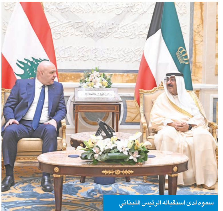
سموه لدى استقباله الرئيس اللبناني