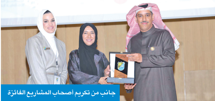
جانب من تكريم أصحاب المشاريع الفائزة

يُعنى بتمكين الطلبة والمدرسين من تحويل أفكارهم إلى مشاريع تعليمية