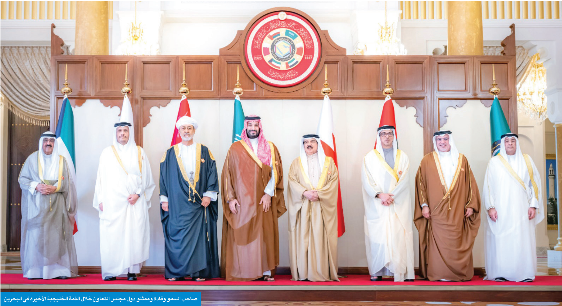
صاحب السمو وقادة وممثلو دول مجلس التعاون خلال القمة الخليجية الأخيرة في البحرين

عزيمة وإصرار بالسير على نهج الآباء المؤسسين لتحقيق التماسك والتعاقد