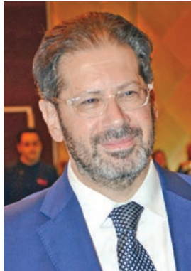
القائم بالأعمال السوري

بدورها، قالت سفيرة تركيا طوبى ثور سونمز «تأتي هذه المناسبة الوطنية الغالية وهي تجسد التزام سموه الراسخ بقيادة مسيرة التنمية، وترسيخ دعائم الاستقرار، وتحقيق رفاه وازدهار الشعب الكويتي الكريم، حيث تولي الجمهورية التركية أهمية بالغة لعلاقات الصداقة والأخوة العميقة التي تجمع بلدينا، والتي شهدت زخماً متزايداً وتعزيزاً ملحوظاً في ضوء الزيارات رفيعة المستوى