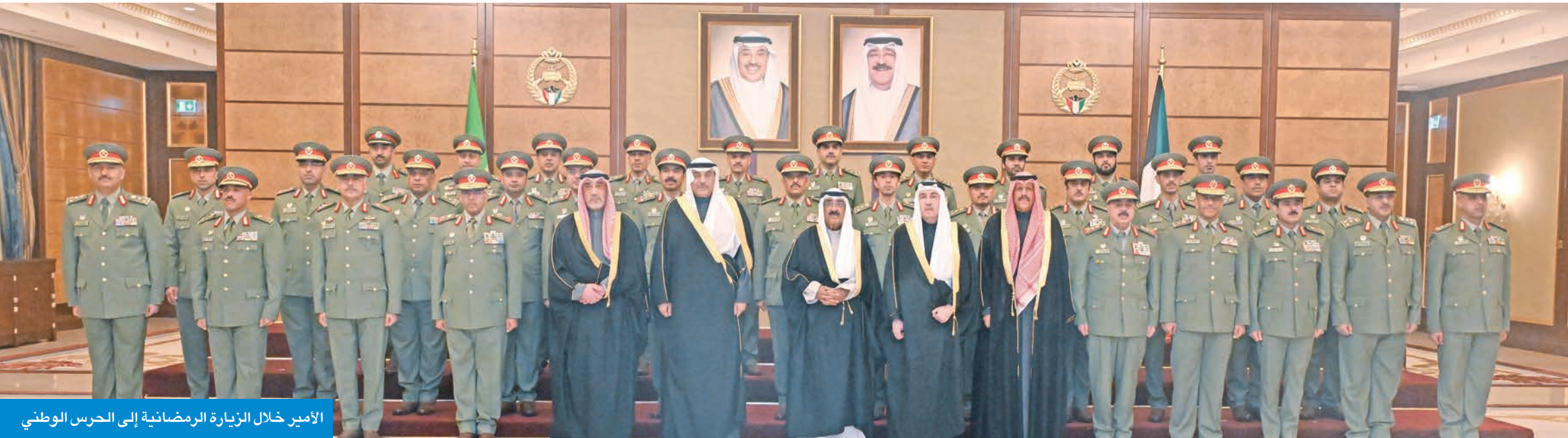
الأمير خلال الزيارة الرمضانية إلى الحرس الوطني

توجيهات سامية رسمت خريطة طريق للجهات الحكومية بمواجهة التحديات الداخلية والخارجية