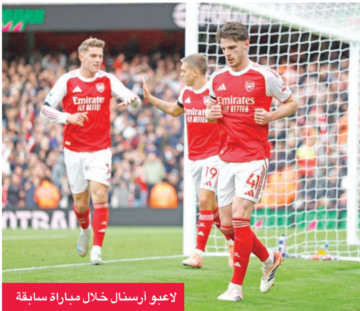
لاعبو أرسنال خلال مباراة سابقة

السبت في الجولة السابعة عشرة من الدوري الإنكليزي الممتاز