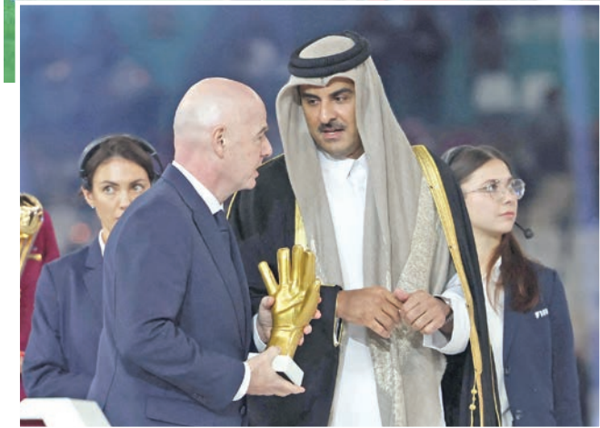
منتخب المغرب بعد فوزه بكأس العرب وفي الإطار الأمير تميم وإنفانتينو