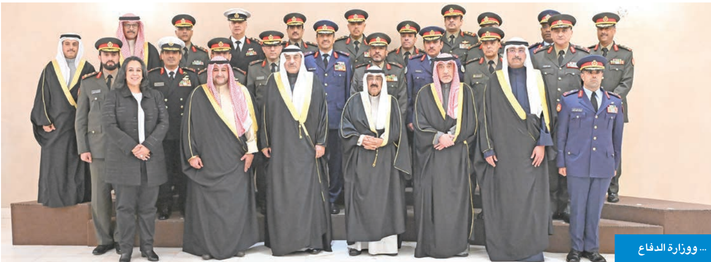
... ووزارة الدفاع