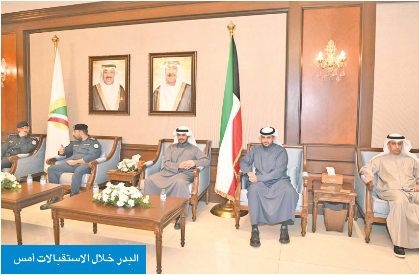
البدر خلال الاستقبالات امس

استقبل محافظ مبارك الكبير، محافظ حولي بالتكليف، صباح البدر، أهالي محافظة حولي مساء امس، خلال اللقاء المفتوح الذي عقد في ديوان محافظة حولي. واستمع البدر إلى ملاحظات الأهالي ومقترحاتهم، وأطلع على أبرز القضايا والاحتياجات الخدمية المتعلقة بمناطق المحافظة، مؤكداً حرصه على متابعتها بالتنسيق مع الجهات المعنية. وشهد اللقاء مناقشة عدد من الموضوعات ذات الصلة بالخدمات البلدية والبنية التحتية والأمنية والمرورية، إلى جانب بحث اليات تطوير العمل وتعزيز كفاءة الأداء في مختلف القطاعات الخدمية بالمحافظة بما يلبي تطلعات المواطنين.