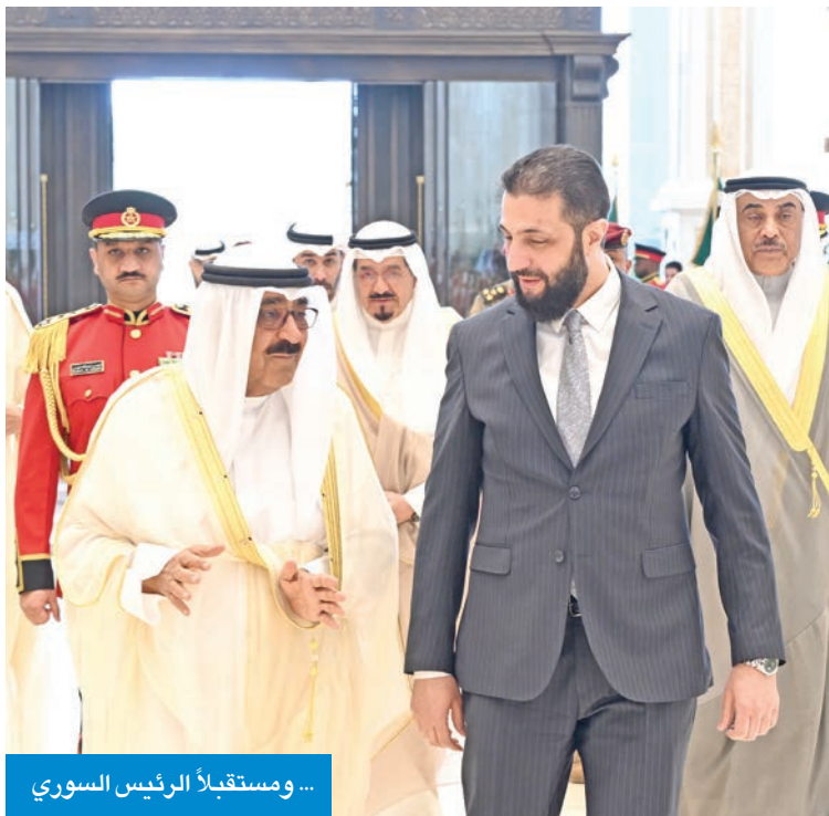
... ومستقبلاً الرئيس السوري