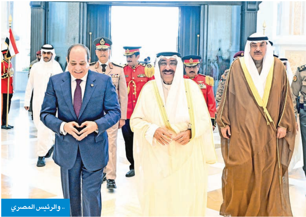
... والرئيس المصري