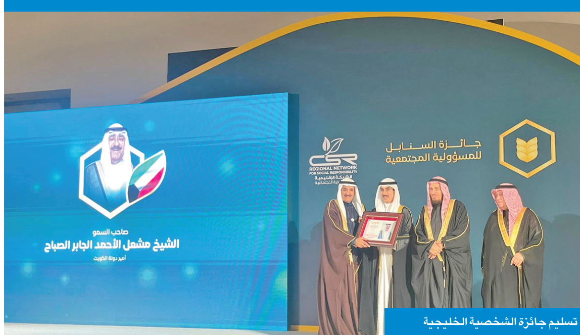
تسليم جائزة الشخصية الخليجية

البروفيسور يوسف العباسي، عن تشريف الدورة الثالثة للجائزة بتكريم سمو أمير الكويت لفئة الشخصية القيادية الفخرية لجائزة السنابل للمسؤولية المجتمعية في مؤسسة رعاية الأيتام في دول مجلس التعاون لعام 2024.