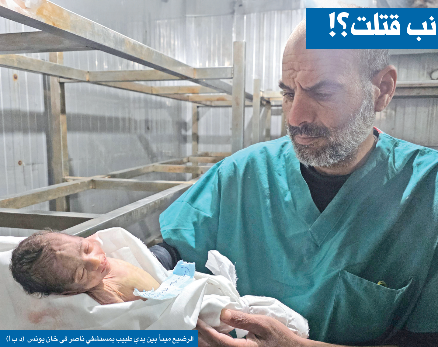
الرضيع ميتاً بين يدي طبيب بمستشفى ناصر في خان يونس

عندما تمتلئ الشوارع مجدداً في رأس السنة بالمفرقات والصواريخ والزجاجات والقمامة، يعتزم نحو 10 آلاف شاب مسلم في مختلف أنحاء ألمانيا الخروج حاملين المكائس وأكياس القمامة للمشاركة في حملة تنظيف. وقال الإمام شرجيل خالد لوكالة "د ب أ" إن هذه الحملة