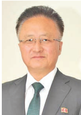
سفير كوريا الشعبية