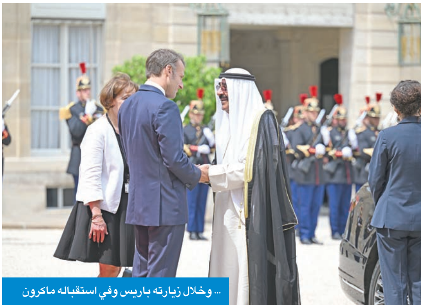
... وخلال زيارته باريس وفي استقباله ماكرون