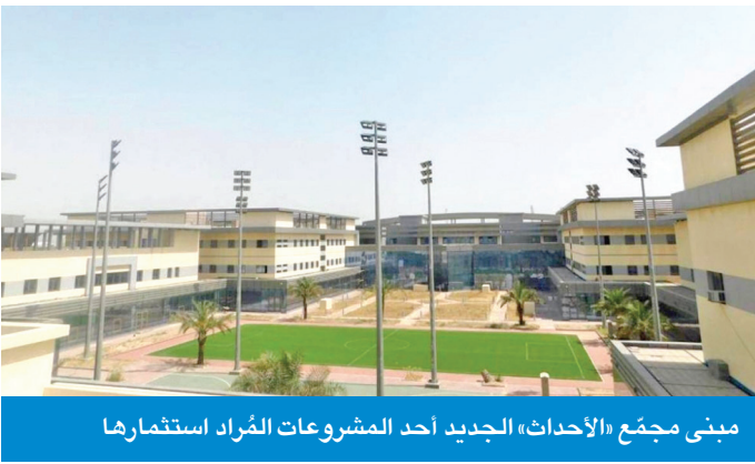
مبنى مجمّع «الأحداث» الجديد أحد المشروعات المُراد استثمارها

ونُشرت المصادر أن فكرة تحويل بعض المباني، مثل مجمّع الأحداث، للاستثمار من قبل الغير، يوفر على الوزارة ملايين الدنانير التي تصرف سنوياً على أعمال التشغيل والصيانة