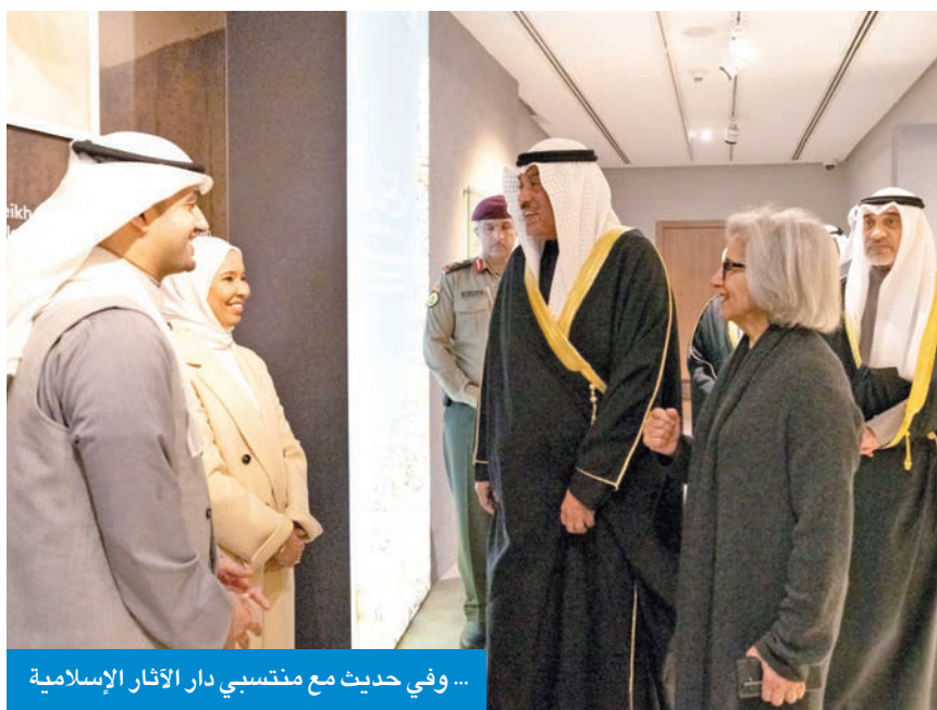
... وفي حديث مع منتسبي دار الآثار الإسلامية