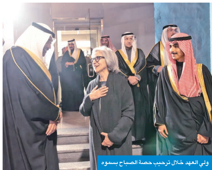
ولي العهد خلال ترحيب حصة الصباح بسموه