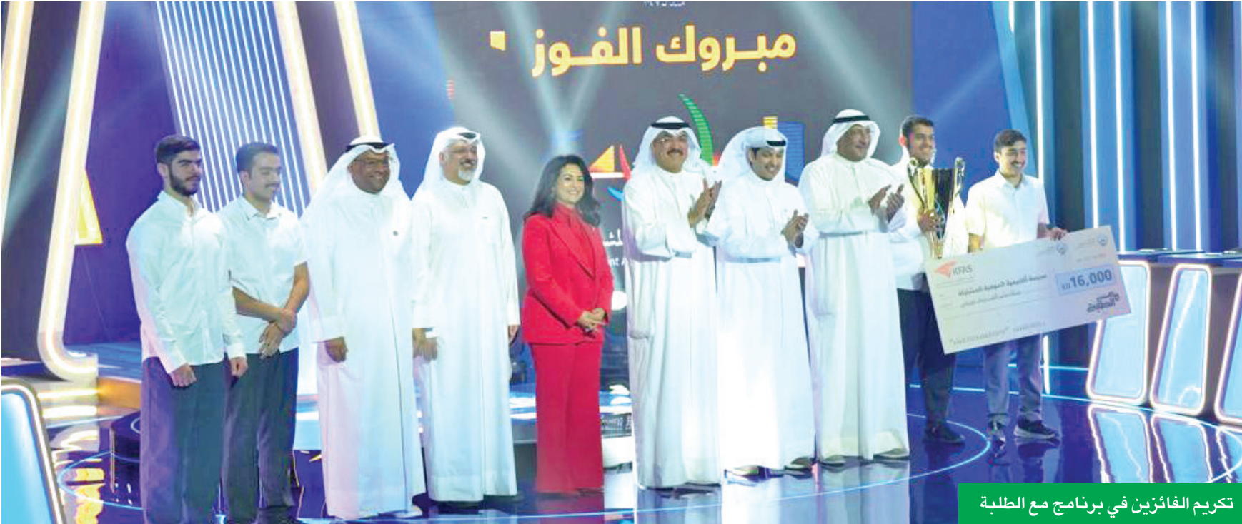
تكريم الفائزين في برنامج مع الطلبة