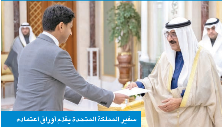
سفير المملكة المتحدة يقدم أوراق اعتماده