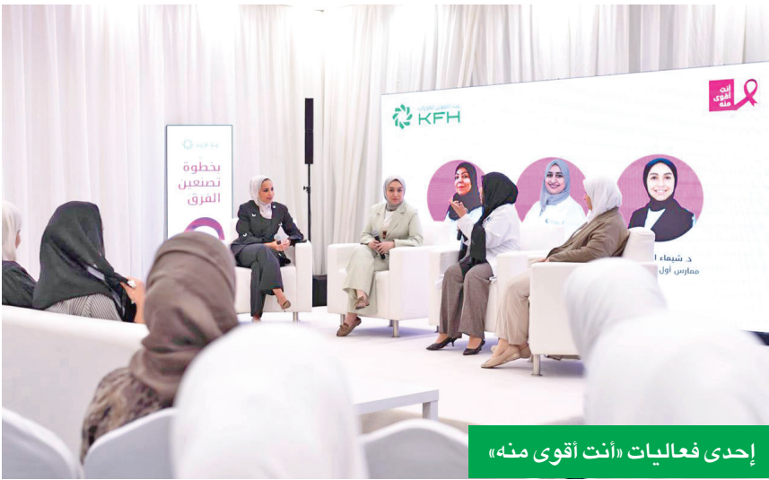
إحدى فعاليات «أنت أقوى منه»