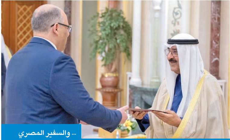
... والسفير المصري