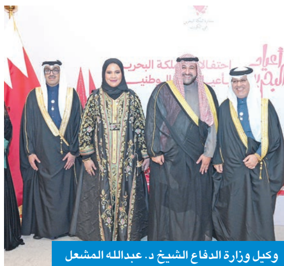
وكيل وزارة الدفاع الشيخ د. عبدالله المشعل