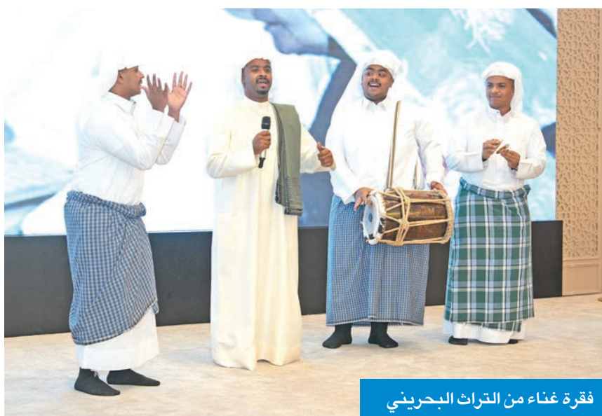
فكرة غناء من التراث البحريني