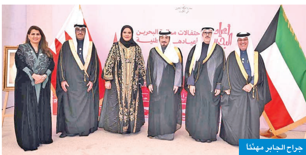
جراح الجابر مهنتا

وقال إن الاحتفالات الوطنية تمثل أيضاً مناسبة لتأكيد ثوابت السياسة الخارجية البحرينية القائمة على الاعتدال والتعاون والحوار ودعم السلام والتنمية المستدامة بما يكزس مكانة المملكة كشريك موثوق على الساحة الدولية.