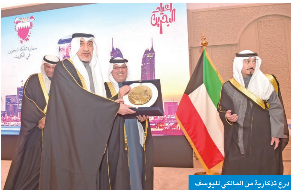
درع تذكارية من المالكي لليوسف

وازهار الأسرة الدولية، كما تؤكد مملكة البحرين موقفها المبدئي، الثابت تجاه القضية الفلسطينية، الداعم لقيام الدولة الفلسطينية وعاصمتها القدس الشرقية، وفقاً لحل الدولتين، ومبادرة السلام العربية، وقرارات الشرعية الدولية ذات الصلة.