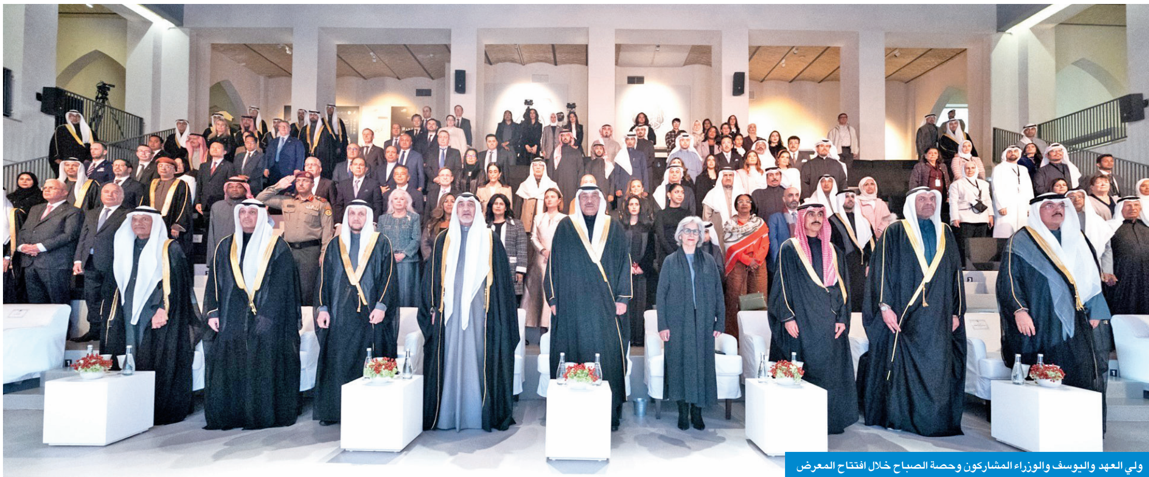
ولي العهد واليوسف والوزراء المشاركون وحصة الصباح خلال افتتاح المعرض

● المطيري: يوثق مسيرة ثقافية ورؤية متكاملة تمتد 5 عقود بجهود ناصر صباح الأحمد وحصة الصباح