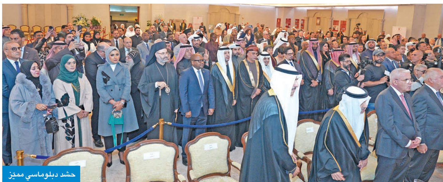
حشد دبلوماسي مميز