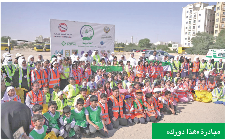
مبادرة «هذا دورك»

واصل بيت التمويل الكويتي صدارته في برنامج المسؤولية الاجتماعية خلال عام 2025، عبر تنفيذ مبادرات نوعية واستراتيجية شملت مختلف القطاعات، واستهدفت كل شرائح المجتمع، منها تمكين أكثر من 1200 طالب، ودعم 300 شاب في مجال الأمن السيبراني، وتوزيع 30 ألف وجبة إفطار صائم، وافتتاح الجناح العاشر في مركز علاج الإدمان، وإطلاق جائزة الاستدامة الرقمية، الأولى من نوعها، ومواصلة برنامج KFH Academy لتأهيل الشباب الكويتيين، ومشاركة الآلاف من أفراد المجتمع في مسابقات البنك وفعالياته التي شملت الصحة العامة، ودعم الطلبة والتعليم، وتمكين الشباب، ورعاية المواهب الرياضية، إلى جانب دعم برامج الابتكار والتحول الرقمي، ورعاية ذوي الإحتياجات الخاصة، وحماية البيئة، فضلاً عن تنفيذ الأعمال التطوعية وحملات التوعية، ليؤكد بذلك أنه ليس مجرد بنك، بل الشريك الاستراتيجي الأول للتنمية المجتمعية والاستدامة.