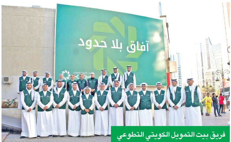
فريق بيت التمويل الكويتي التطوعي