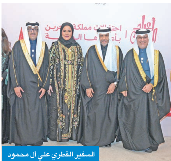
السفير القطري علي آل محمود