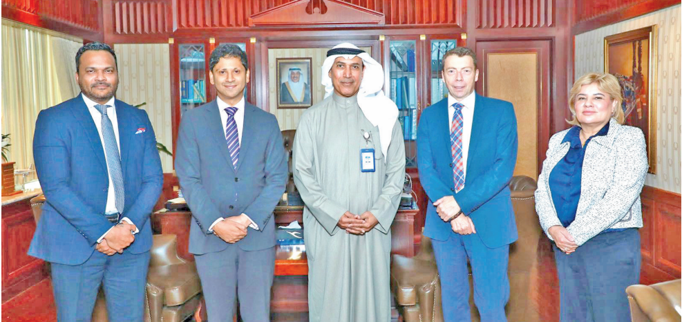
الفقاع متوسطاً اللورد ماكنتيول والسفير رشيد والوفد المرافق لهما

... وتطلق رحلاتها المباشرة إلى «ملقا» الإسبانية أعلنت شركة الخطوط الجوية الكويتية إطلاق رحلاتها المحدولة المباشرة لمدينة ملقا الإسبانية، اعتباراً من 5 يونيو 2026، بواقع 3 رحلات أسبوعياً أيام الجمعة والأحد والثلاثاء. وقالت «الكويتية»، في بيان، إنه بإمكان المسافرين بدء الحجز اعتباراً من تاريخ 19 الجاري، من خلال الموقع والتطبيق الإلكتروني للشركة وعبر مكاتب المبيعات المختلفة، مؤكدة أنها ستقوم بتشغيل طائراتها ذات البدن العريض من نوع البوينغ 300-8777 على وجهة ملقا ليستفيد العملاء الكرام من استخدام مقاعد درجات الرويال، رجال الأعمال المتميزة بأحدث سبل الراحة، ولتوفير سعة مقاعد أكثر للمسافرين على هذه الوجهة. وذكرت أن ذلك يأتي في إطار منح المسافرين على متن طائراتها خيارات أوسع وتلبية لاحتياجاتهم في السفر وتوفير خدمة أفضل لهم من خلال إطلاق وجهات جديدة ومتنوعة، لافتة إلى أن الشركة تسعى بشكل دؤوب ومتواصل لخدمة عملائها الكرام وتوفير كل سبل الراحة لهم أثناء سفرهم على متن طائراتها.