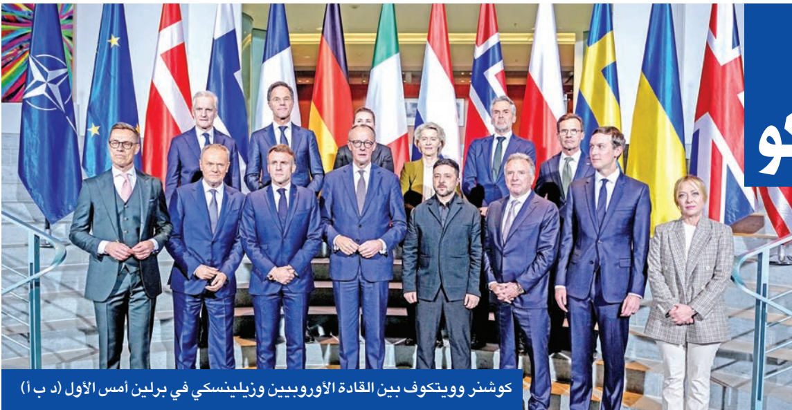
كوشنر وويتكوف بين القادة الأوروبيين وزيلينسكي في برلين أمس الأول

روسيا لن تقدم أي تنازلات تتعلق بالأراضي. وأوضحت الوكالة أن ريبكوف كان يتحدث عن دونباس وشبه جزيرة القرم ونوفوروسيا» في غضون ذلك، حافظ الأوروبيون الذي لا يتفقون بإدارة ترامب على أقصى درجات الحذر. وخلال مؤتمر صحافي مع زيلينسكي، أمس الأول، في برلين، قال المستشار الألماني ميرتس علنياً «سأزال محدوداً، لكن الفرصة حقيقية» مشدداً على ضرورة تحقيق أهداف «يتفق عليها» الأوروبية والأوروبيين بنصت إلى وقف النار بحافظ على سيادة أوكرانيا، مع ضمانات أمنية ملموسة. بدورها، جذبت فرنسا مطالباتها بتوفير «ضمانات أمنية قوية» لكيف قبل البحث في مسألة الأراضي، وفقاً لأوساط ماكرون.