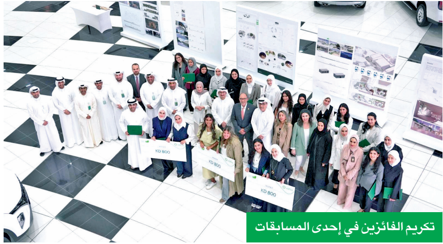
تكريم الفائزين في إحدى المسابقات