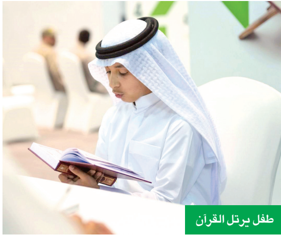
طفل يرثل القرآن