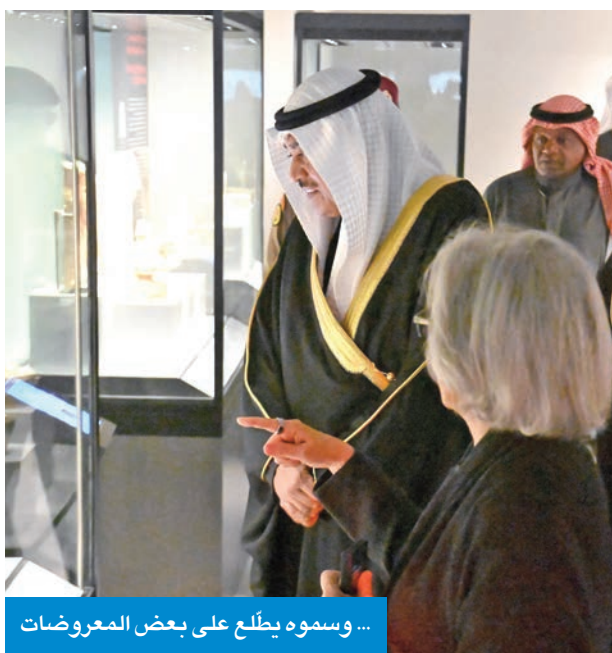
... وسموه يطلع على بعض المعروضات