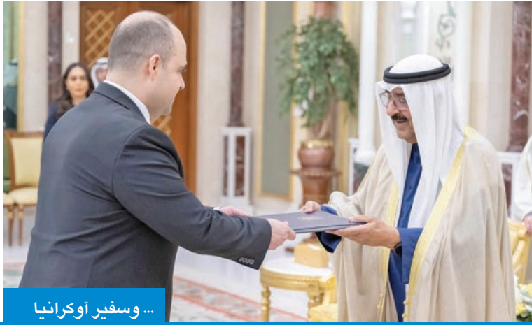
... وسفير أوكرانيا