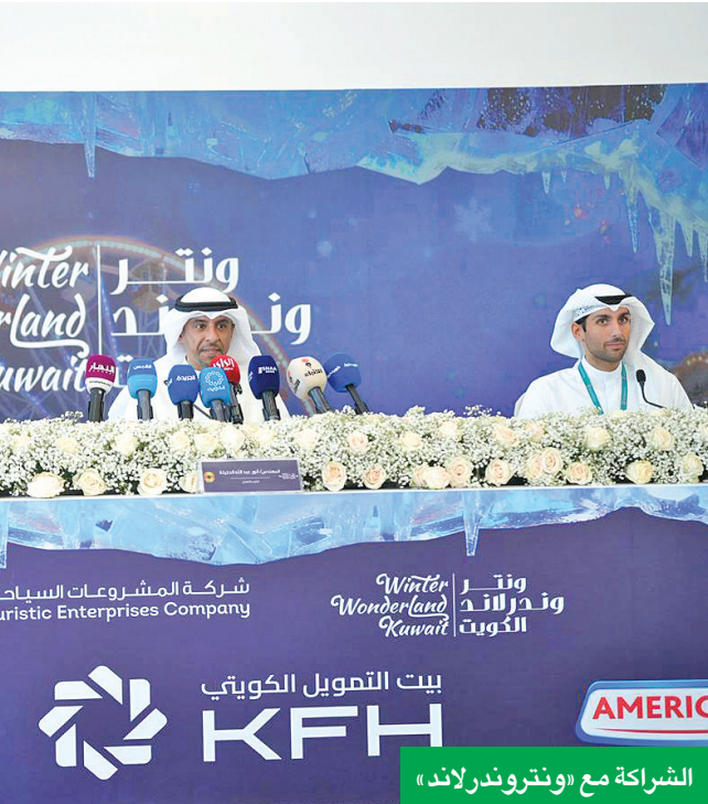
الشراكة مع «ونترولاند»

الروح: بيت التمويل الكويتي الشريك الاستراتيجي الأول للتنمية المجتمعية والاستدامة