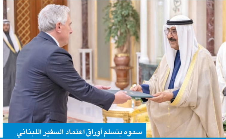
سموه يتسلم أوراق اعتماد السفير اللبناني