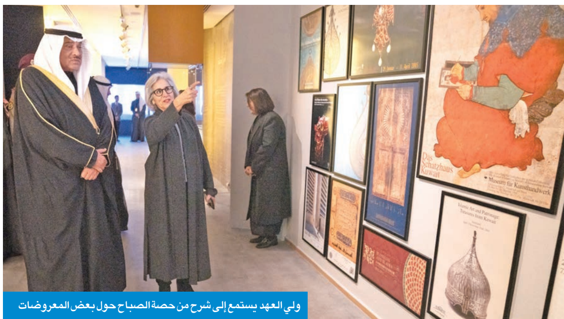
ولي العهد يستمع إلى شرح من حصة الصباح حول بعض المعروضات

ثم تحدث الوزير المطيري، فأوضح أن المعرض يوثق مسيرة ثقافية ممتدة لما يقارب 5 عقود قامت على جهد مشترك ورؤية متكاملة، للمغفور له بإذن الله، الشيخ ناصر صباح الأحمد، والشبيخة حصة الصباح، حيث تشكلت