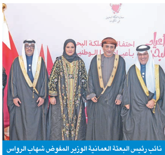
نائب رئيس البعثة العمانية الوزير المفوض شهاب الرواس