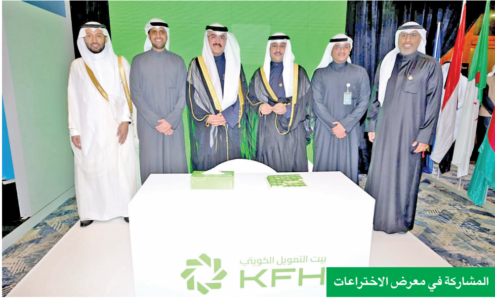
المشاركة في معرض الاختراعات