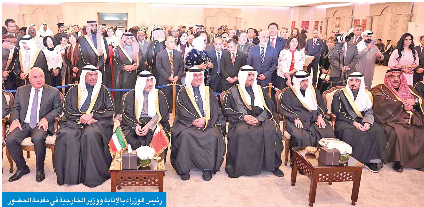
رئيس الوزراء بالإتابة ووزير الخارجية في مقدمة الحضور

● المالكي: أبوابنا مفتوحة للكويت وأهلها... والمناسبة تجسيد للولاء واستذكار لمنجزات مسيرة التنمية