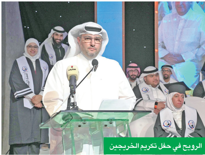
الروح في حفل تكريم الخريجين

تعزيزاً للسلوك الآمن في الأنشطة البحرية، وغير ذلك الكثير من الفعاليات والأنشطة، ونظم البنك، بالتعاون مع الشريك الاستراتيجي وزارة الداخلية، العديد من الزيارات لمدارس الكويت، من خلال استقبال الطلبة وأولياء الأمور، ونشر التوعية المرورية وتوزيع الهدايا.