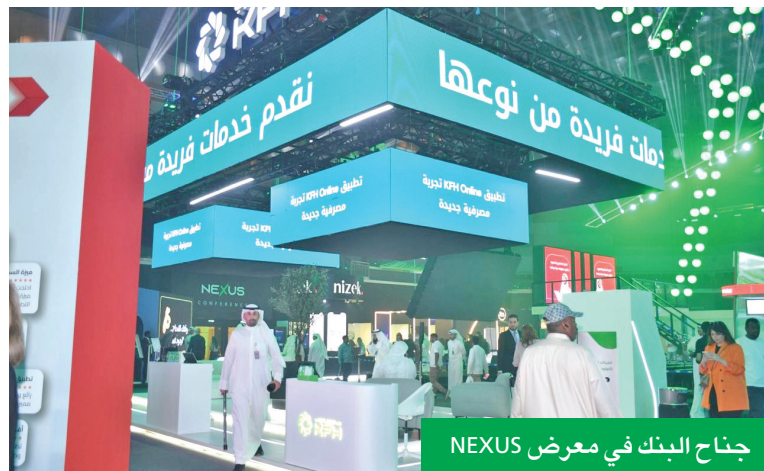
جناح البنك في معرض NEXUS

وذكر الروح أن بيت التمويل الكويتي واصل أداء رسالته المجتمعية من خلال المساهمة في التوعية الأمنية ضمن شراكته الاستراتيجية مع أسبوع المرور الخليجي الموحد الـ 38، تحت شعار «قيادة بدون هاتف»، كما واصل البنك تعاونه مع وزارة الداخلية في العديد من حملات التوعية والفعاليات المختلفة، مثل حملة التوعية الأمنية للعودة للمدارس، وحملة التوعية الأمنية لمرطادي البحر، من خلال توزيع عدة الأمن والسلامة،