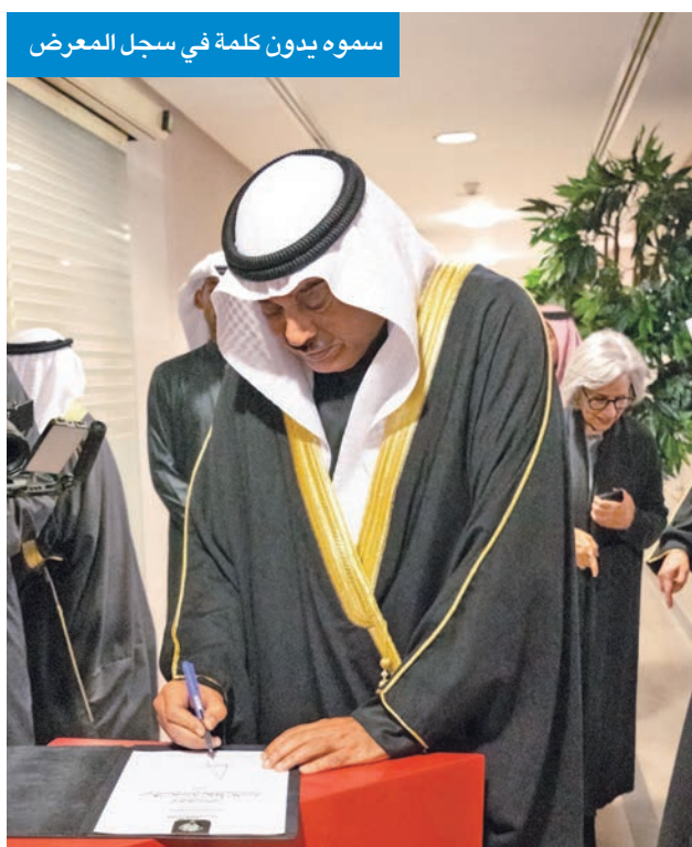
سموه يدون كلمة في سجل المعرض