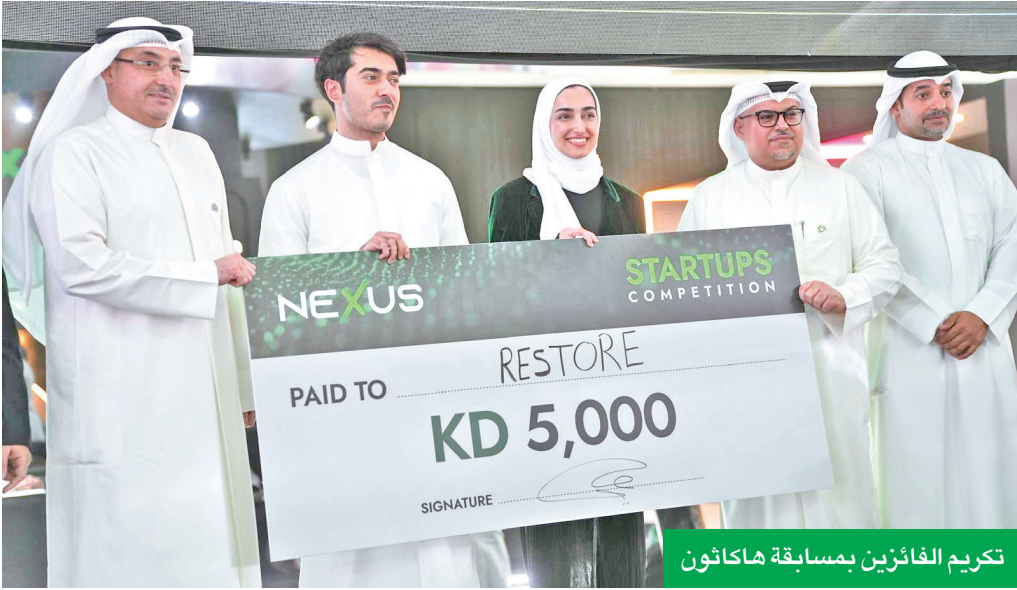
تكريم الفائزين بمسابقة هاكاثون