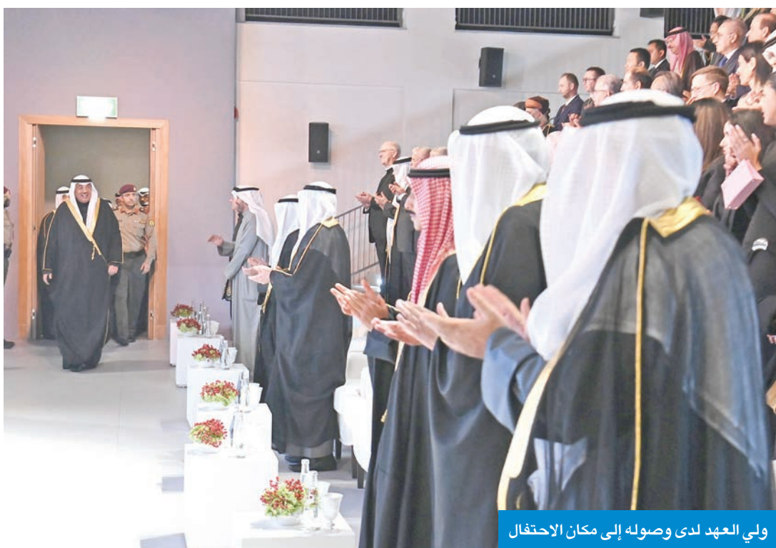
ولي العهد لدى وصوله إلى مكان الاحتفال

تحت رعاية وحضور سمو ولي العهد الشيخ صباح الخالد أقيم، مساء أمس الأول، حفل افتتاح معرض «بين تحفتين: نشأة دار الآثار الإسلامية»، وذلك في مقر مركز «الأمريكانى الثقافي» في منطقة قبلة بمدينة الكويت.