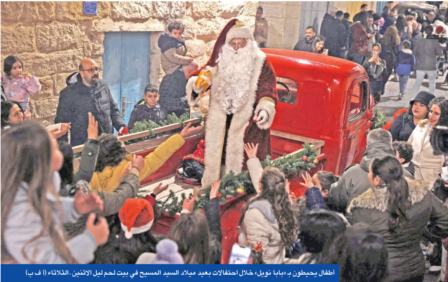
أطفال يحيطون بـ «بابا نويل» خلال احتفالات بعيد ميلاد السيد المسيح في بيت لحم ليل الاثنين. (الثلاثاء ١١ ف ب)

الإسرائيلي بنيامين نتنياهو وعدد من المستوطنين ساحة حائط (البراق - المبكى) في المسجد الأقصى بالقدس الشرقية؛ لإحياء «عيد الأنوار» اليهودي. وجاء ذلك في وقت أطلق مفوض مصلحة السجون الإسرائيلية، كوبي يعقوبي، تحذيراً من خطر انفجار وشيك في معتقلات الفلسطينيين جراء تحوّل الأمل الذي كان لديهم إلى ياس، فيما اعتبر مفوض «اونسروا» فيليب لازاريني، أن إسرائيل تنتهك امتيازات الأمم المتحدة وحصاناتها باستهدافها مقار اللوالة.