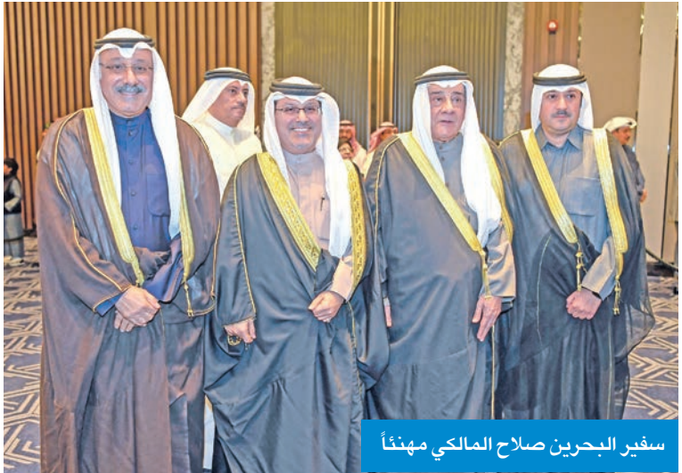
سفير البحرين صلاح المالكي مهنئاً