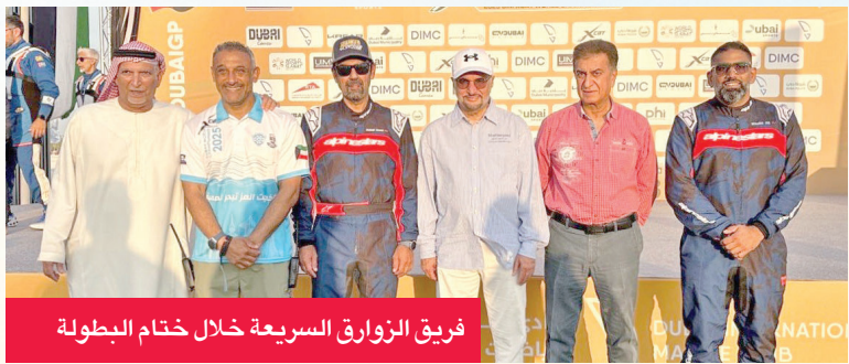
فريق الزوارق السريعة خلال ختام البطولة

أهمية المشاركة في بطولات العالم لتطوير مستوى الفريق ورفع جاهزيته للاستحقاقات المقبلة. وانطلقت بطولة العالم للزوارق السريعة لفئة (X CAT 2025) في 11 الجاري واختتمت منافساتها اليوم في دبي حيث تنافس المتسابقون في أجواء حماسية شهدت مستويات فنية عالية بين الفرق المشاركة.