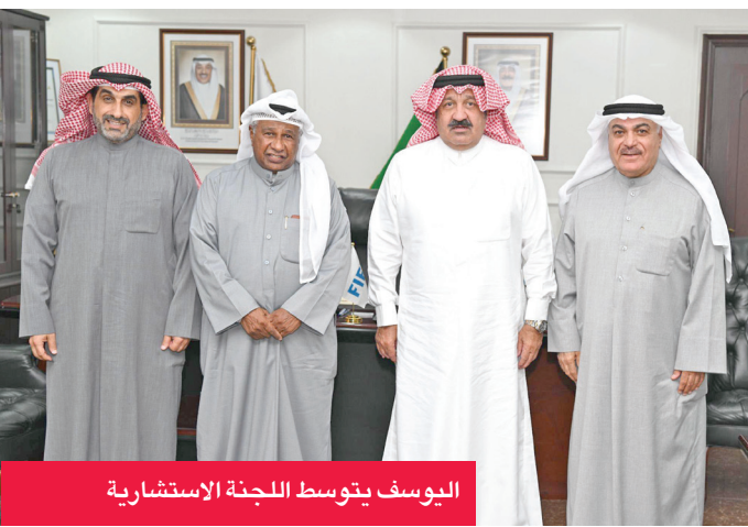
اليوسف يتوسط اللجنة الاستشارية

أعلن الاتحاد الكويتي لكرة القدم، عبر صفحته الرسمية على منصة التواصل الاجتماعي «إكس»، تشكيل لجنة استشارية برئاسة رئيس مجلس إدارة الاتحاد الشيخ أحمد البوسف.