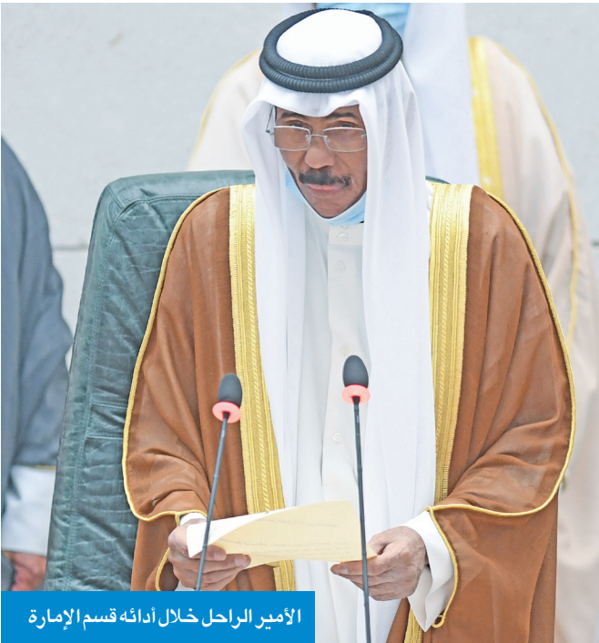
الأمير الراحل خلال أدائه قسم الإمارة

ورغم أن الكويت لم تعيش في كنف قيادته إلا ثلاثة أعوام، لكنها اتسمت بالحراك المحموم على أكثر من صعيد، داخلياً وخارجياً، لترسيخ المبادئ التي قامت عليها دولة الكويت وسارت في ركابها سنين عديدة، مقتنيا أثر رفيع دربه سمو الأمير الراحل الشيخ