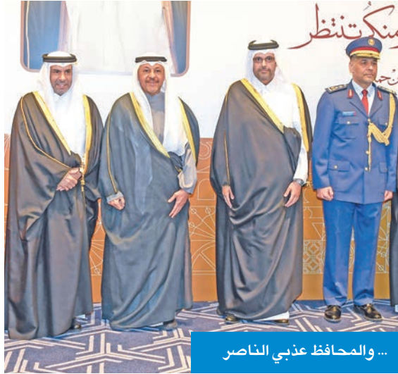
... والمحافظ عذبي الناصر