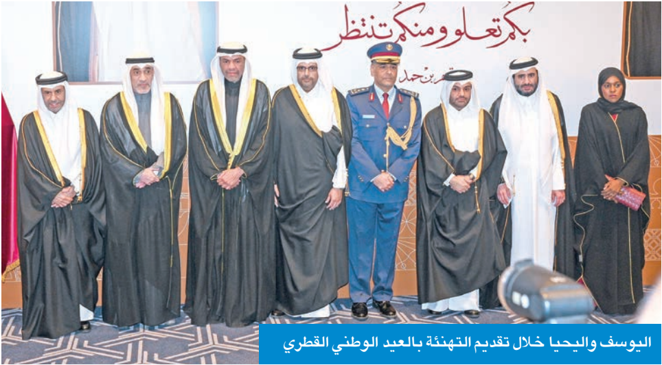
اليوسف واليحيى خلال تقديم التهنئة بالعيد الوطني القطري

احتفلت سفارة قطر لدى البلاد، أمس الأول، بمناسبة العيد الوطني القطري بحضور رئيس مجلس الوزراء بالإنيابة وزير الداخلية الشيخ فهد اليوسف، ووزير الخارجية عبدالله اليحيى وعدد المسؤولين، والشيوخ ومن رؤساء البعثات الدبلوماسية والسفراء المعتمدين لدى البلاد. وأشاد اليحيى، في تصريح صحفي، عقب مشاركته في الحفل بعمق العلاقات الأخوية التي تجمع البلدين والشعبين الشقيقين، وحرصهما المشترك على تعزيز التعاون الثنائي في مختلف المجالات. وهنا حكومة دولة قطر وشعبها الشقيق بمناسبة عيدها الوطني، متمنيا لها دوام التقدم والازدهار في ظل قيادتها الحكيمة. كما هنا بنجاح بطولة كأس العرب 2025 الذي تستضيفها دولة قطر، مشيدا بالمستوى الرفيع للتنظيم وحسن الإعداد الذي عكس قدراتها في استضافة الفعاليات الرياضية الكبرى. (كونا)