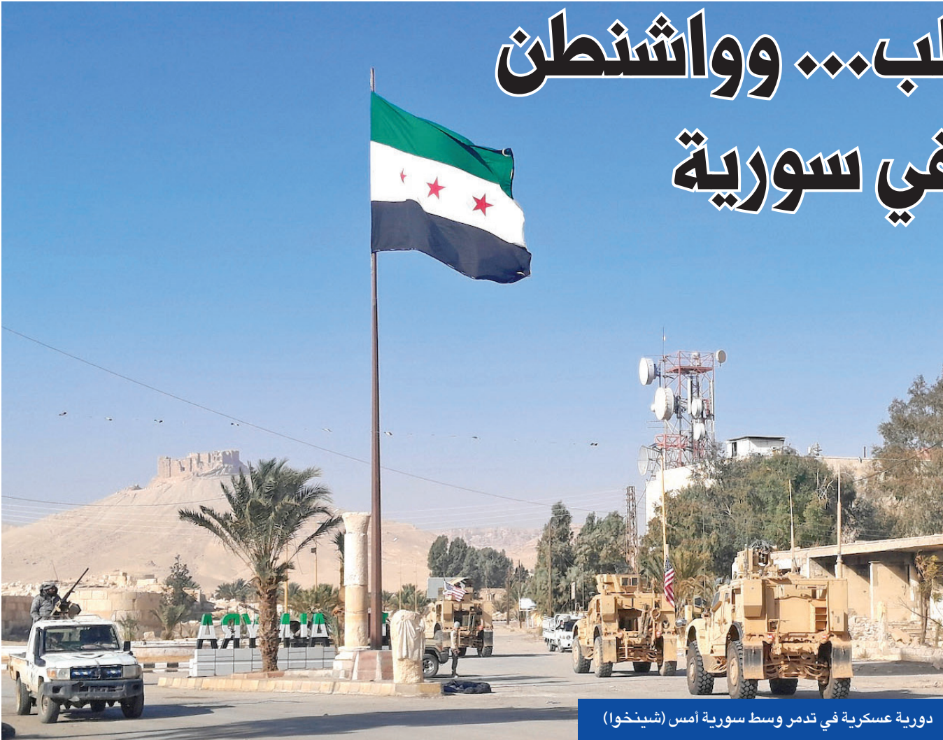
دورية عسكرية في دمر وسط سورية امس

المهنية السابقة كطبيب عيون في موسكو. ويشير التقرير إلى أن الأسد يتعلم اللغة الروسية ويبدأ تحديث معلوماته الطبية، بينما ابنائه يتكيفون مع حياة مترفة في العاصمة الروسية، ملية بالسوق في المتاجر الفاخرة والإغماس في التعليم. ووفقاً لمصدرين مطلعين على الأمر، تقيم العائلة في الأغلب في حي روبيوفكا الرافى، وهو مجمع سكني مُغلق يقطنه نخبة موسكو. وهناك، من المرجح أن يختلطوا بشخصيات بارزة مثل الرئيس الأوكراني السابق فيكتور يانوكوفيتش، الذي فز من كييف عام 2014 ويُعتقد أنه يقيم في المنطقة.