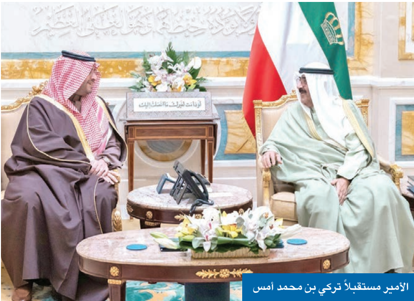
الأمير مستقبلاً تركي بن محمد أمس