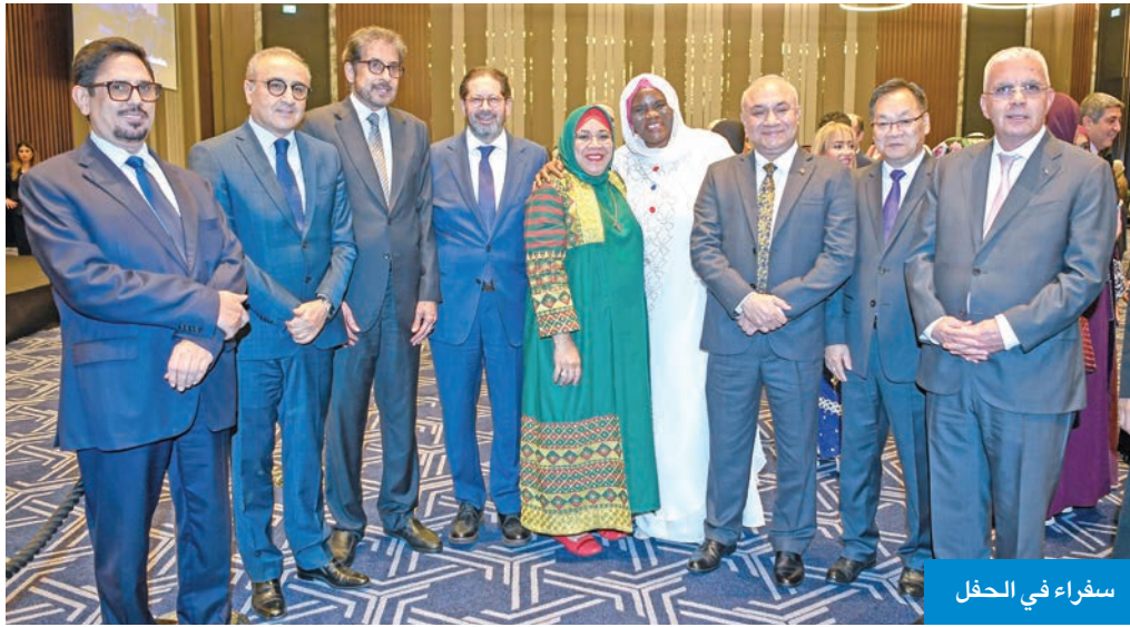
سفراء في الحفل