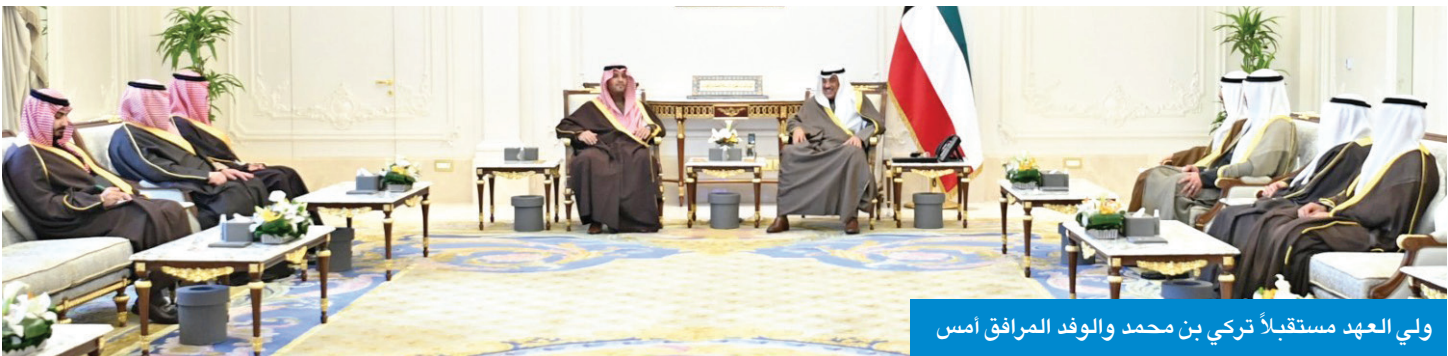
ولي العهد مستقبلاً تركي بن محمد والوفد المرافق أمس

محمد بن سلمان وتمنيتاهما لسموه بموفور الصحة ودوام العافية ولشعب دولة الكويت المزيد من التقدم والرخاء في ظل القيادة الحكيمة لسمو أمير البلاد الشيخ مشعل الأحمد. وقد حملة سمو ولي العهد تحياته الى خادم الحرمين الشريفين وولي عهده وتمنياته لهما بموفور الصحة وتمام العافية، سائلاً لسموه المولى تعالى أن استقبل سمو ولي العهد الشيخ صباح الخالد، بقصر بيان صباح أمس، الأمير تركي بن محمد، وزير الدولة عضو مجلس الوزراء بالسعودية الشقيقة والوفد المرافق، وذلك بمناسبة زيارته الرسمية للبلاد. ونقل بن محمد لسموه تحيات وخادم الحرمين الشريفين الملك سلمان بن عبدالعزيز ملك السعودية، وولي العهد رئيس مجلس الوزراء بالمملكة الأمير