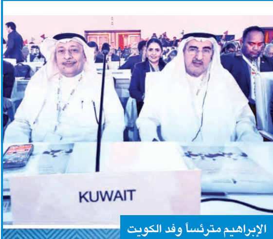
الإبراهيم مترئساً وفد الكويت

شاركت الهيئة العامة لمكافحة الفساد (نزاهة) بوفد رفيع المستوى برئاسة عبدالعزيز الإبراهيم رئيس الهيئة في فعاليات الدورة الحادية عشرة لمؤتمر الدول الأطراف في اتفاقية الأمم المتحدة لمكافحة الفساد (COSP11) في دولة قطر خلال الفترة من 15 إلى 19 الجاري.