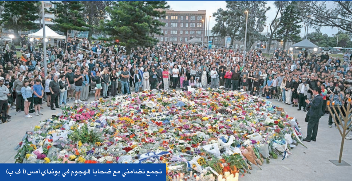
تجمع تضامني مع ضحايا الهجوم في بونداي امس