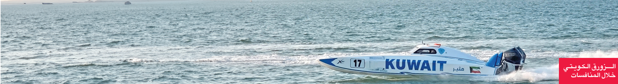
الزورق الكويتي خلال المنافسات