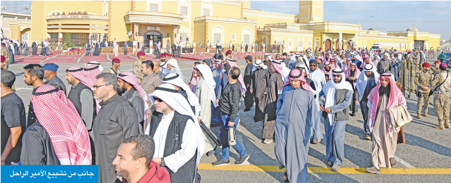
جانب من تشييع الأمير الراحل

مسيرته بالمناصب امتدت 6 عقود بذل خلالها جهوداً جبارة لتعزيز العمل الحكومي ومكانة الكويت