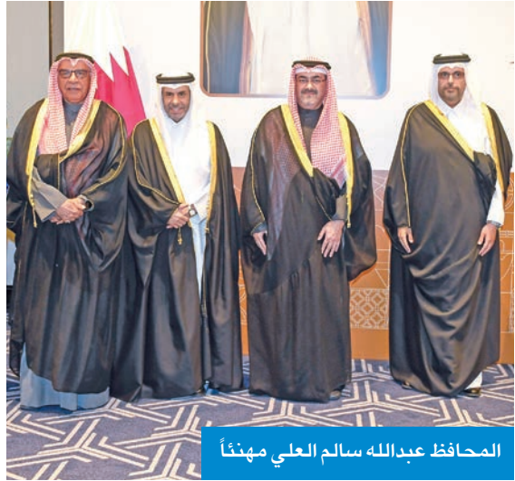
المحافظ عبدالله سالم العلي مهنئاً