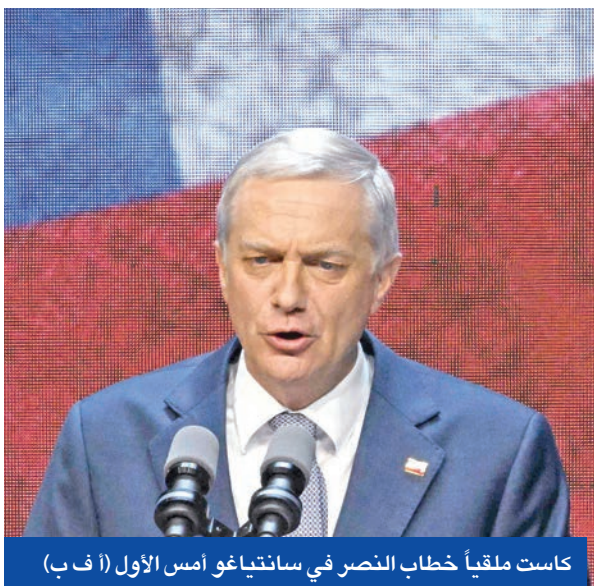
كاست مقلماً خطاب النصر في سانتياغو امس الاول

بعد أيام من إعلان استراتيجية الأمن القومي الأميركية التي تركز على النصف الغربي من الكرة الأرضية، وتتعهد بدعم اليمين القومي المتطرف في أوروبا، فاز السياسي اليميني المتطرف، خوسيه كاست، أمس، بانتخابات الجولة الثانية للرئاسة في تشيلي بأغلبية ساحقة، ليصبح أول مدافع عن دكتاتورية أوغوستو بينوشيه (1973 - 1989) يصل إلى السلطة بعد عودة الديمقراطية إلى هذا البلد اللاتيني. وحصد المرشح اليميني المتشدد، وهو نجل عائلة من المهاجرين الألمان من أصول نازية، 58.1 بالمائة من الأصوات مقابل 41.8 بالمائة لمنافسته من ائتلاف يسار الوسط، الشيوعية يانيت خارا. وجاء ذلك في عملية انتخابية شهدت للمرة الأولى في الانتخابات الرئاسية تصويتاً إلزامياً، وتضاعفت فيها الأصوات البيضاء