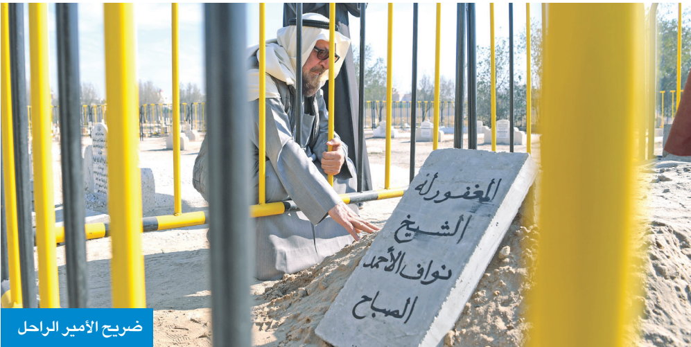
ضريح الأمير الراحل