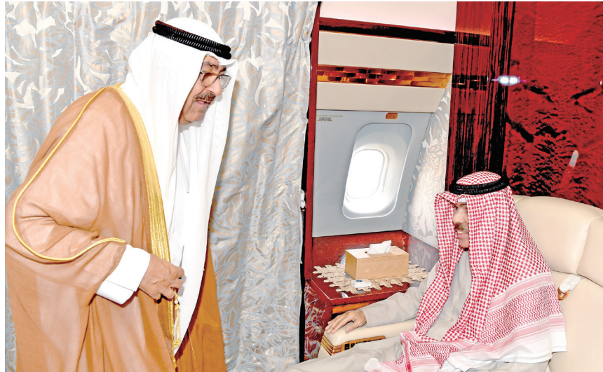
الأمير الراحل لدى مغادرته البلاد في إحدى رحلات علاجه وفي وداعه سمو الأمير الشيخ مشعل الأحمد

صباح الأحمد، مولياً قضايا الوحدة الوطنية جل اهتمامه، ومشدداً على ضرورة دعم عجلة التنمية في البلاد لخلق روافد لتنويع مصادر الدخل، وخلق بيئة اقتصادية تنافسية تعلي من شأن القطاع الخاص.