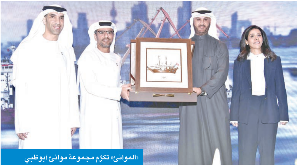
«الموانئ» تكوّن مجموعة موانئ أبوظبي

الوثيقة بين المجموعة والمؤسسات الرائدة في الكويت الشقيقة ممثلة بـ «الموانئ» الكويتية. وأكد الشامسي أن هذا التعاون ينسجم مع رؤية قيادتنا الرشيدة الرامية إلى مشاركة الخبرات وأفضل الممارسات مع الأشقاء في دول مجلس التعاون الخليجي. وأوضح أن «موانئ أبوظبي» ستقوم، انطلاقاً من كونها مزوداً رائداً للحلول اللوجستية والتجارية وطوراً عالمياً للموانئ والمحطات البحرية والبنى التحتية ذات الصلة، بتوظيف خبراتها الواسعة لإنجاح هذا المشروع.