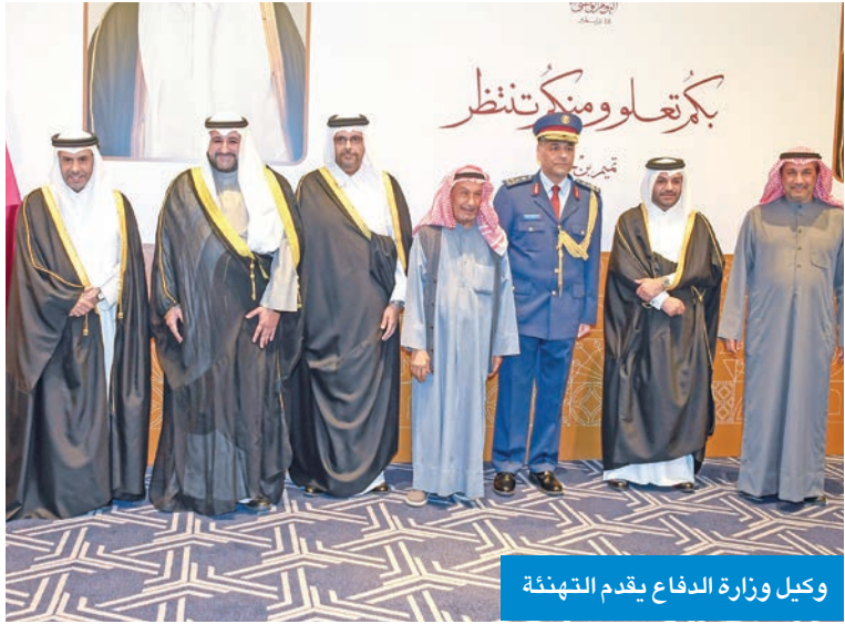
وكيل وزارة الدفاع يقدم التهنئة