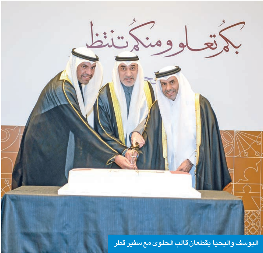
اليوسف واليحيى يقطعان قالب الحلوى مع سفير قطر