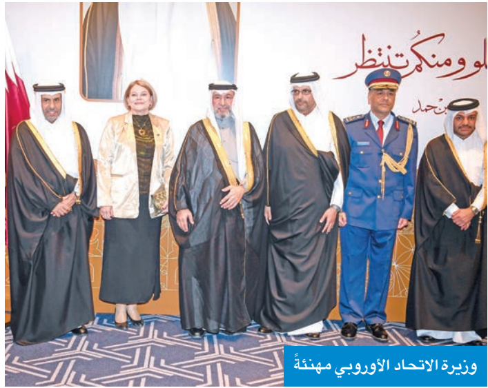
وزيرة الاتحاد الأوروبي مهنئة