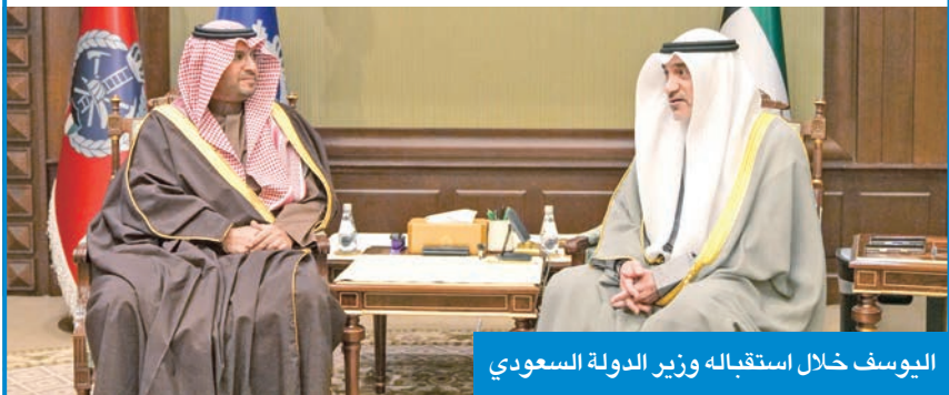
اليوسف خلال استقباله وزير الدولة السعودي

استقبل رئيس مجلس الوزراء بالإتابة الشيخ فهد اليوسف، في قصر بيان أمس، وزير الدولة عضو مجلس الوزراء في السعودية الشقيقة، الأمير تركي بن محمد بن فهد بن عبدالعزيز والوفد المرافق له بمناسبة زيارته للبلاد، بحضور وزير الدفاع ووزير الداخلية بالإتابة رئيس بعثة الشرف المرافقة الشيخ عبدالله العلي. وجرى خلال اللقاء استعراض العلاقات الفرقة متقاعد جمال الذياب، ووكيل الديوان الأميري الشيخ عبدالعزيز المشعل، ووكيل الشؤون الخارجية بالديوان الأميري مازن العيسى. الوطيدة وأوجه التعاون المختلفة، تعزيزاً للتشاور الثنائي المستمر، وترسيخاً للشراكة الاستراتيجية، بما يصب في مصلحة البلدين والشعبين الشقيقين. حضر المقابلة رئيس ديوان رئيس مجلس الوزراء عبدالعزيز الدخيل، وسفير خادم الحرمين الشريفين لدى دولة الكويت الأمير سلطان بن سعد بن خالد آل سعود.