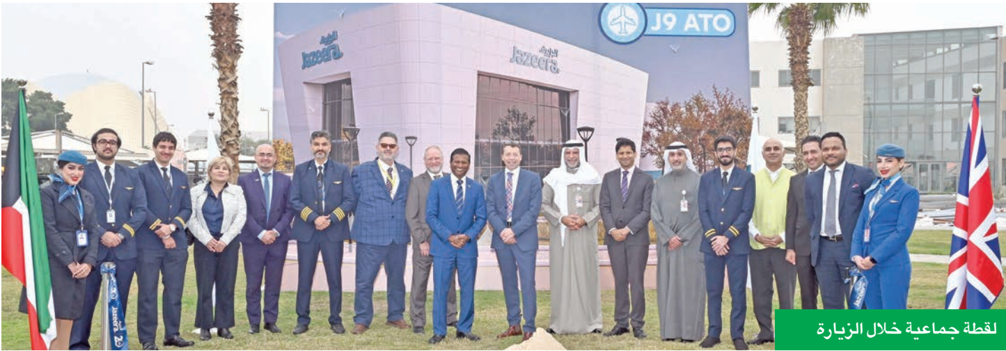
لقطة جماعية خلال الزيارة

على السفر بين الكويت والمملكة المتحدة، تدرس «طيران الجزيرة» إطلاق رحلات مباشرة إلى لندن عبر مطار لوتن، رهناً لحصولها على الموافقات التنظيمية اللازمة. وتعكس هذه الخطوة التزام الشركة المستمر بتوسيع شبكة وجهاتها والاستجابة لاحتياجات المسافرين ودعم تنمية قطاعي الطيران والسياحة بين الكويت والمملكة المتحدة. في سياق متصل، وبموجب حصولها أخيراً على الموافقة لتشغيل ناقل جوي وطني غير منتظم (عارض) من الهيئة العامة للطيران المدني في المملكة العربية السعودية، أصبحت «طيران الجزيرة» مؤهلة بتشغيل رحلات عارضة داخلية ودولية انطلاقاً من المملكة، بما يعزز دورها في دعم الربط الإقليمي وتنشيط السياحة، ودفع عجلة النمو الاقتصادي. وتواصل «طيران الجزيرة» الاستثمار في البنية التحتية وتوطيد الشراكات وتطوير الكفاءات البشرية ضمن استراتيجيتها طويلة الأمد للنمو، بما يعزز مكانة دولة الكويت كمركز إقليمي للطيران، ويساهم في تنمية المواهب الوطنية.