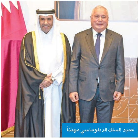
عميد السلك الدبلوماسي مهنئاً