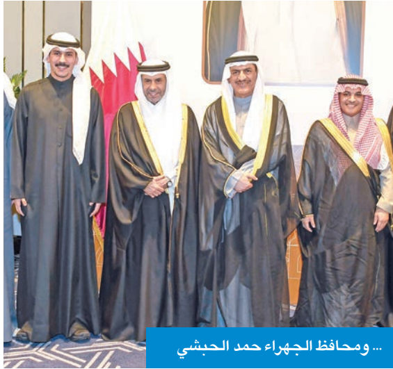
... ومحافظ الجهراء حمد الحبشي