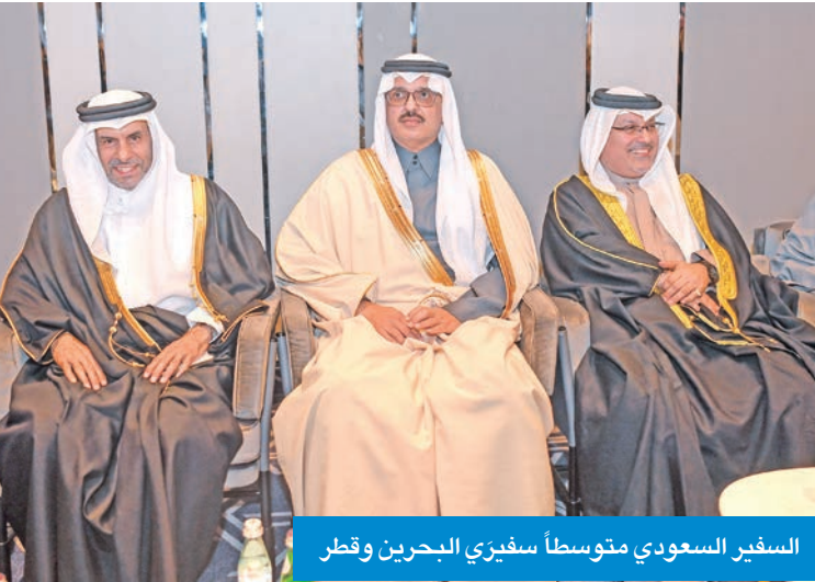
السفير السعودي متوسلاً سفير البحرين وقطر