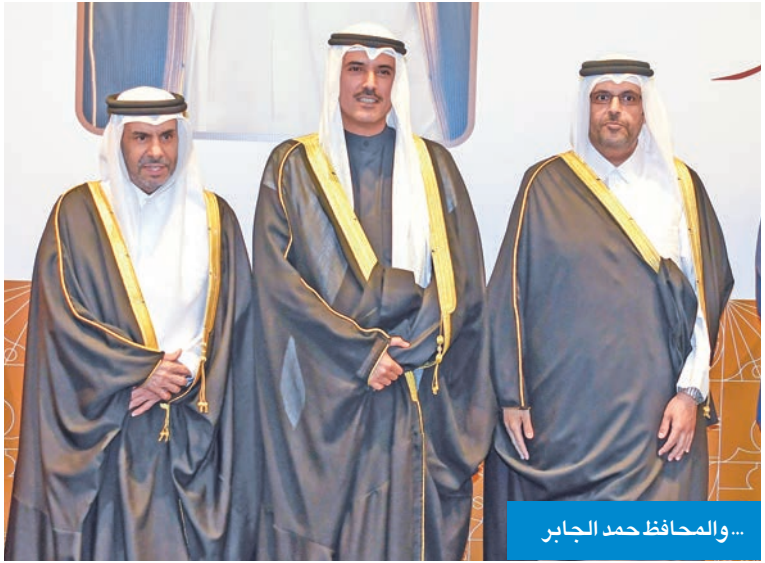
... والمحافظة حمد الجابر

احتفلت سفارة قطر لدى البلاد، أمس الأول، بمناسبة العيد الوطني القطري بحضور رئيس مجلس الوزراء بالإنيابة وزير الداخلية الشيخ فهد اليوسف، ووزير الخارجية عبدالله اليحيى وعدد المسؤولين، والشيوخ ومن رؤساء البعثات الدبلوماسية والسفراء المعتمدين لدى البلاد. وأشاد اليحيى، في تصريح صحفي، عقب مشاركته في الحفل بعمق العلاقات الأخوية التي تجمع البلدين والشعبين الشقيقين، وحرصهما المشترك على تعزيز التعاون الثنائي في مختلف المجالات. وهنا حكومة دولة قطر وشعبها الشقيق بمناسبة عيدها الوطني، متمنيا لها دوام التقدم والازدهار في ظل قيادتها الحكيمة. كما هنا بنجاح بطولة كأس العرب 2025 الذي تستضيفها دولة قطر، مشيدا بالمستوى الرفيع للتنظيم وحسن الإعداد الذي عكس قدراتها في استضافة الفعاليات الرياضية الكبرى. (كونا)