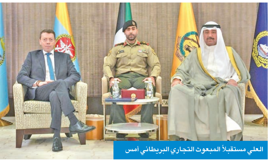
العلي مستقبلاً المبعوث التجاري البريطاني أمس

بحث وزير الدفاع الشيخ عبدالله العلي مع المبعوث التجاري للمملكة المتحدة لدى الكويت اللورد إيان ماكنيكول عدداً من الموضوعات ذات الاهتمام المشترك. وأعلنت وزارة الدفاع، في بيان أمس، أن ذلك جاء خلال استقبال العلي ماكنيكول بمناسبة زيارته الرسمية للبلاد. حضر اللقاء رئيس الأركان العامة للجيش الفريق الركن خالد الشريان، ووكيل وزارة الدفاع الشيخ الدكتور عبدالله المشعل، ومساعد وزير الخارجية لشؤون أوروبا السفير صادق معرفي، وسفير المملكة المتحدة لدى البلاد قدسي رشيد. بدوره، بحث رئيس الهيئة العامة للطيران المدني الشيخ حمود المبارك، مساء أمس الأول،