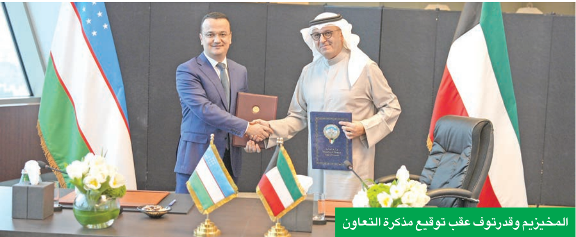
المخيزيم وقدرتوف عقب توقيع مذكرة التعاون