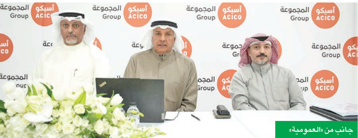
جانب من «العمومية»

المستثمرين القوة الراسمالية لـ «أسيكو»، ويدعم خططها التوسعية، بما في ذلك التوجه نحو تطوير أنشطة المطور العقاري المطروحة من قبل الدولة. كما سيوفر للمجموعة قاعدة أعمق من العلاقات الاستراتيجية التي تسهم في رفع كفاءة تنفيذ المشاريع الحكومية والبنية التحتية، ولا سيما في مجالات البنية التحتية والمواد الإنشائية. ويضيف دخول هذه الجهات بعداً نوعياً لمسار التطوير داخل الشركة، ويعزز قدرتها على تسريع خطط النمو وتحقيق أهدافها الاستراتيجية للمرحلة المقبلة.