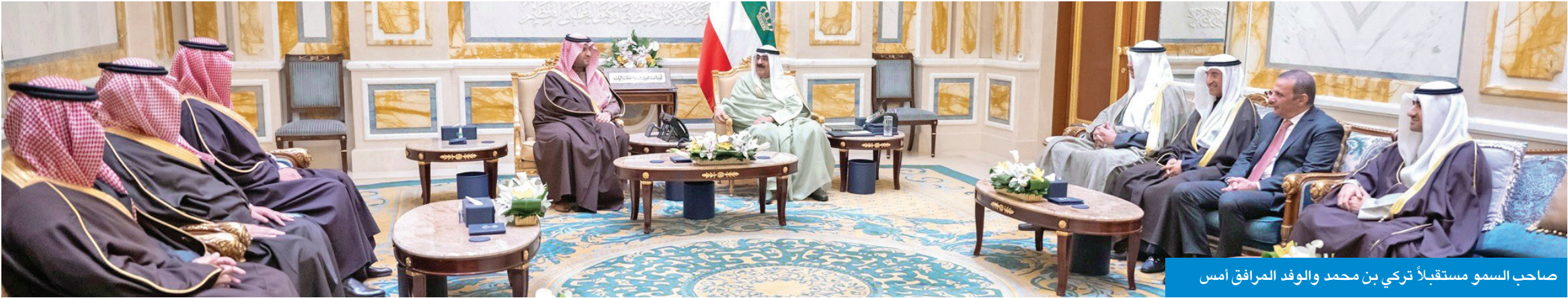
صاحب السمو مستقبلاً تركي بن محمد والوفد المرافق أمس

استقبل سمو أمير البلاد الشيخ مشعل الأحمد، في قصر بيان صباح أمس، وزير الدولة عضو مجلس الوزراء بالمملكة العربية السعودية الشقيقة، الأمير تركي بن محمد بن فهد بن عبدالعزيز آل سعود، والوفد المرافق، بمناسبة زيارته الرسمية للبلاد. ونقل تركي بن محمد لسموه تحيات وتقدير خادم الحرمين الشريفين الملك سلمان بن عبدالعزيز آل سعود ملك المملكة العربية السعودية الشقيقة، والأمير محمد بن سلمان بن عبدالعزيز آل سعود ولي العهد رئيس مجلس الوزراء، وتمنيتاهما لسموه بوافر الصحة وتمام العافية، ولشعب دولة الكويت المزيد من التقدم والرفي. وقد حملة صاحب السمو تحياته لخادم الحرمين الشريفين وولي العهد، وتمنياته لهما بموفور الصحة ودوام العافية، سائلاً لسموه المولى تعالى أن ينعم على المملكة