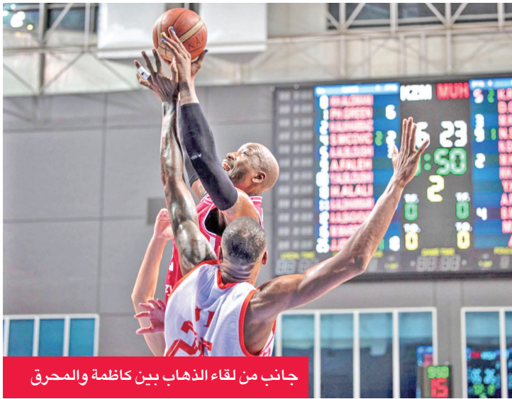
جانب من لقاء الذهاب بين كاظمة والمحرق

يخوض الفريق الأول لكرة السلة بنادي كاظمة مواجهة قوية أمام مضيفه المحرق البحريني في السابعة والنصف مساء اليوم، ضمن الجولة الرابعة من منافسات المجموعة الأولى لدوري السوبر لغرب آسيا لكرة السلة «وصل»، وذلك في العاصمة البحرينية المنامة. ويحتل الاتحاد السعودي صدارة المجموعة برصيد 7 نقاط من ثلاثة انتصارات وخسارة واحدة، يليه شباب الأهلي الإماراتي في المركز الثاني بـ 6 نقاط من فوزين وهزيمتين، فيما يتقاسم كاظمة والمحرق المركز الثالث بـ 4 نقاط لكل منهما من فوز وخسارتين. وتكتسب المباراة أهمية خاصة لكاظمة، الذي استهل مشواره في البطولة بفوز لافت على المحرق في الجولة بنتيجة 95-81، قبل أن يعرض