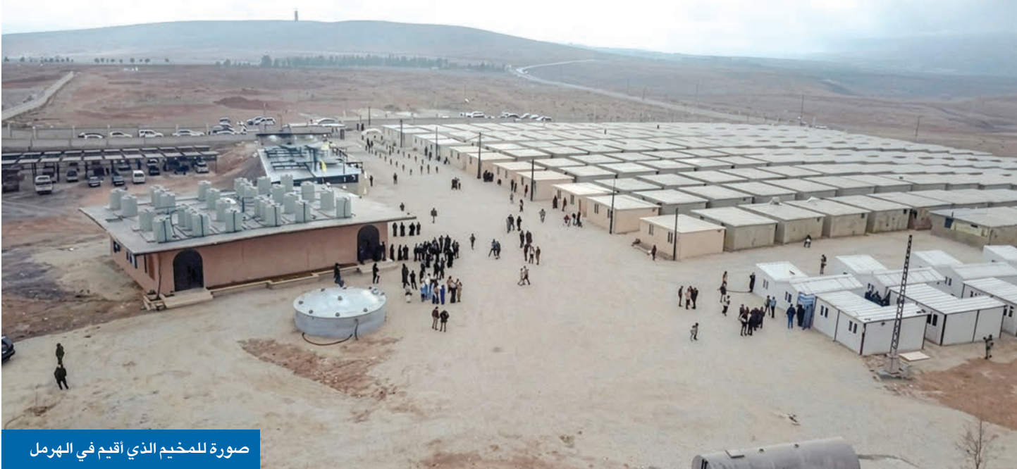
صورة للمخيم الذي أقيم في الهرمل

يثير مخيم افتُتح أخيراً في منطقة الهرمل شرق لبنان، المحاذاة للحدود السورية، توتراً مكتوماً بين بيروت ودمشق. وخلال اليومين الماضيين، أعلن افتتاح ما سُمّي بـ«مجمع الإمام علي السكني»، المخصص لإيواء «أهالي الشهداء المهجرين من سورية»، وفق ما ذكرت صفحات لبنانية شيعية على وسائل التواصل الاجتماعي. وتقول مصادر محلية إن المجمع، الذي يضم أكثر من 150 منزلاً إلى جانب مرافق خدمية، يهدف إلى إيواء عائلات علوية وشيعية سورية غادرت البلاد بعد سقوط نظام بشار الأسد في ديسمبر الماضي. في المقابل، قبدي أوساط سورية مخاوف من أن يضم المخيم عشرات الضباط والجنود السابقين في الجيش السوري، الذي جرى حله بقرار من السلطات الجديدة، ما يثير هواجس أمنية إضافية لدى دمشق. وبحسب ما أفادت به صفحات شيعية لبنانية، فإن «برنامج الإيواء ممول من العتبة الحسينية المقدسة» في كربلاء، مع «مساهمة لوجستية وطبية من حزب الله»، إلى جانب «دعم غذائي من إيران». وقال تلفزيون المنار التابع لـ«حزب الله» إن المخيم مخصص لعائلات لبنانية كانت تعيش في قرى حدودية متداخلة بين سورية ولبنان قبل سقوط النظام السابق بالإضافة «02»