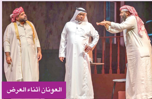
العونان أثناء العرض