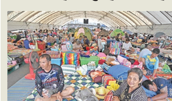
فازون من المعارك الحدودية في محافظة تايلندية حدودية مع كمبوديا يقيمون في خيام كبيرة

العسكرية التايلندية، فجر أمس، شن «ضربات انتقامية» على أهداف كمبودية. أهدافها، أفادت وزارة الدفاع الكمبودية عبر منصة «إكس» بأن «القوات المسلحة التايلندية استخدمت طائرات من مقاتلتين من طراز إف16-16 إسقاط سبع قتابل، على أهداف عدة. من ناحيته قال ماني: «الطاما التزمت كمبوديا بالوسائل السلمية لحل النزاعات».