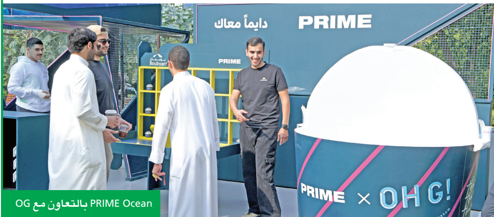
OG بالتعاون مع PRIME Ocean