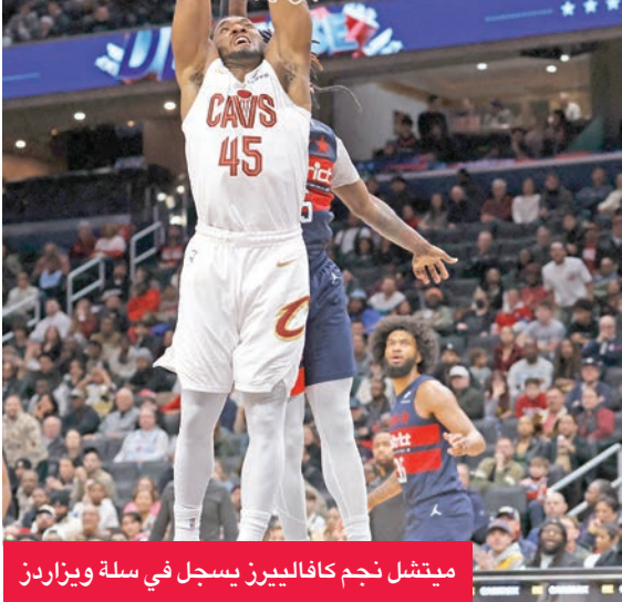
ميتشل نجم كافاليري يسجل في سلة ويزاردز

سجل دونوفان ميتشل 48 نقطة، منها 24 في الربع الأخير، وقاد عودة كليفلاند كافاليري للفوز على واشنطن ويزاردز 130-126، فيما قدّم جويل إمبيد أفضل أداء له منذ ما يقارب العامين في انتصار فريقه فيلادلفيا سفنثي سيكرز على إنديانا بيسرز 115-105 في دوري كرة السلة الجمعة.