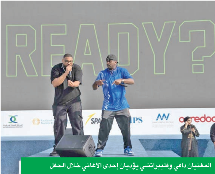
المغنيان دافي وفليبراتشي يؤديان إحدى الأغاني خلال الحفل

شكر خاص لرجال «الداخلية» و«الطوارئ الطبية» و«الإطفاء» و«السياحية»