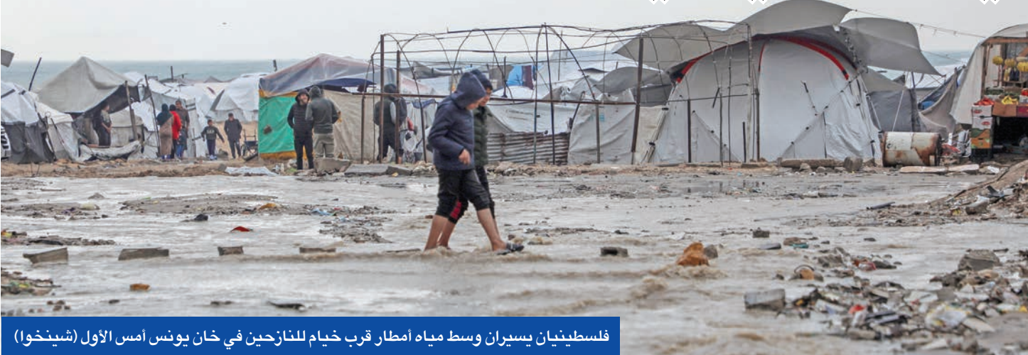
فلسطينيان يسيران وسط مياه امطار قرب خيام للنازحين في خان يونس أمس الأول

من جهة ثانية، أعلن المكتب الحكومي بغزة، أن المنخفض الجوي الأخير أدى لمقتل 11 فلسطينياً وفقدان واحد بفعل خيمة بشكل كلي أو جزئي، وتسبب بخسائر أولية مباشرة بلغت 4 ملايين دولار. وأمس، أكدت منظمة الصحة العالمية أن نحو 1092 مريضاً توفوا أثناء انتظار الإجراء الطبي من غزة. إلى ذلك، أعلن الجيش الإسرائيلي استهداف رائد سعد، الرجل الثاني في الجناح العسكري لـ «حماس»، وبشغل حالياً منصب نائب القائد العسكري ومسؤول التصنيع، وكان سابقاً رئيس شعبة العمليات.