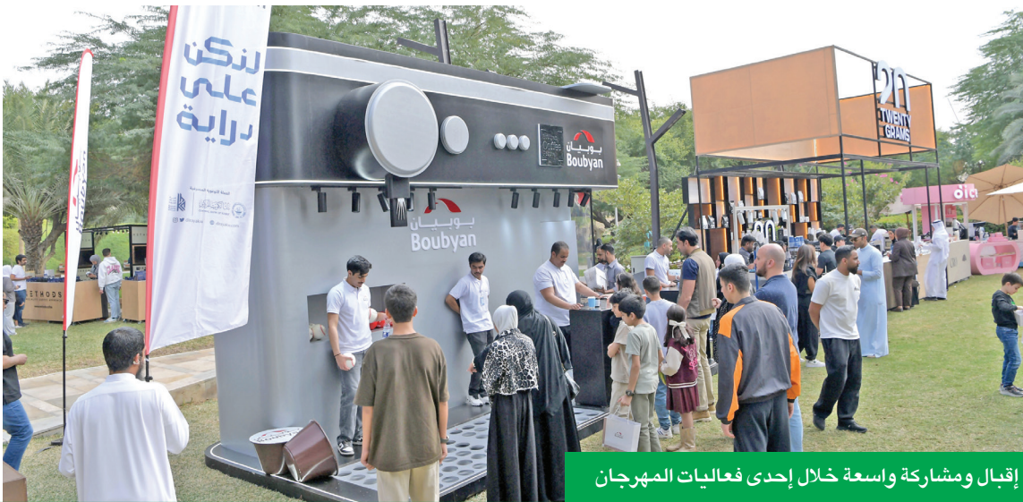
إقبال ومشاركة واسعة خلال إحدى فعاليات المهرجان