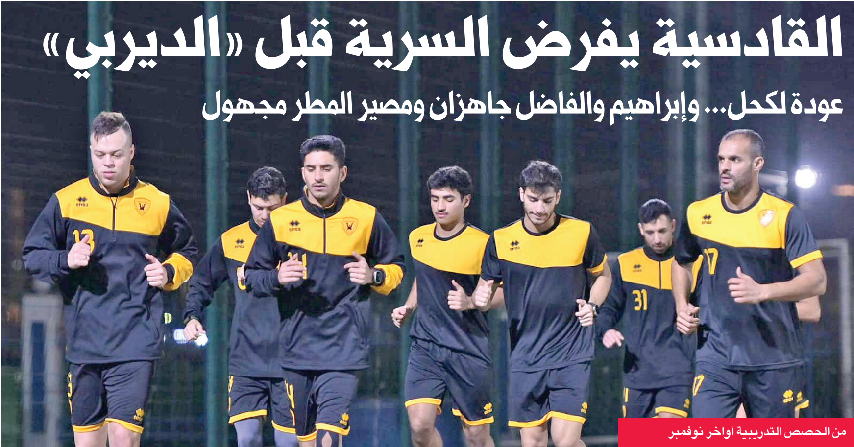
من الحصص التدريبية أواخر نوفمبر

قانون الرياضة... مو مهم إذا كان فيه شوية ملاحظات، المهم إنه بقر... يمكن بطرد معاه شوية من اللي «يشتغلون رياضة»، وهم أصلاً ما يعرفون يفرقون بين الركض والمشى.