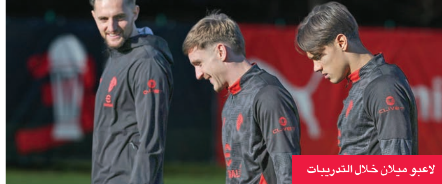
لاعبو ميلان خلال التدريبات

وفي مباراة أخرى تقام اليوم أيضاً، يحل نابولي ضيفاً على أودينيزي. ويحتل نابولي المركز الثاني في الدوري