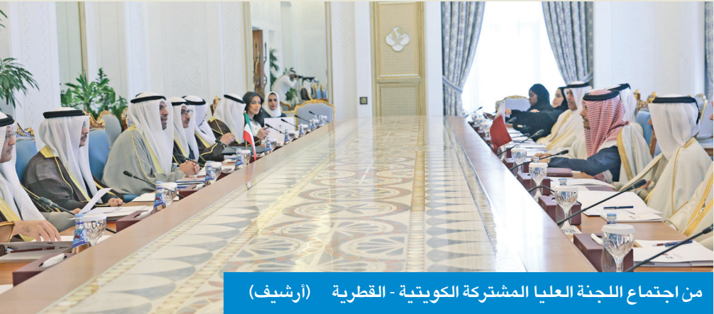
من اجتماع اللجنة العليا المشتركة الكويتية - القطرية

شراكات واتفاقيات مالية وأمنية واقتصادية وصحية مع السعودية وقطر والبحرين واليمن ومصر والأردن