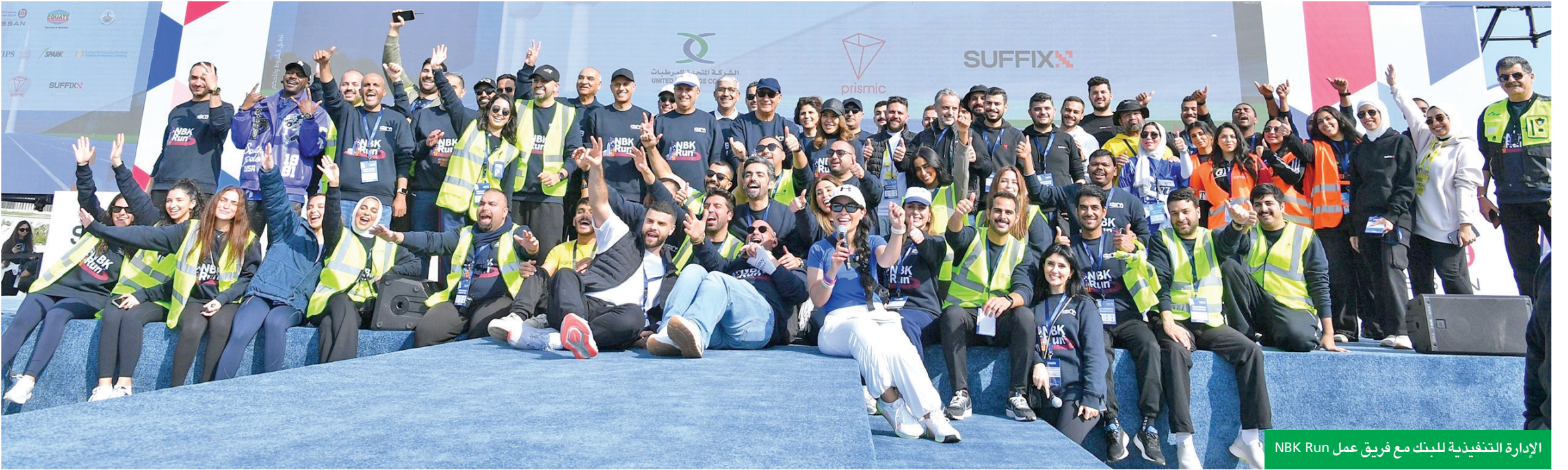
الإدارة التنفيذية للبنك مع فريق عمل NBK Run

أهداف السباق تنسجم مع التوجهات الوطنية نحو تحقيق التنمية المستدامة في الصحة والرياضة «الوطني» سيمضي قدماً في تبني ودعم الفعاليات المشجعة لسلوك التغيير الفاعل والمؤثر NBK Run أكبر تجمع عائلي ترفيهي في الكويت ومنصة فريدة لتعزيز القيم الإيجابية