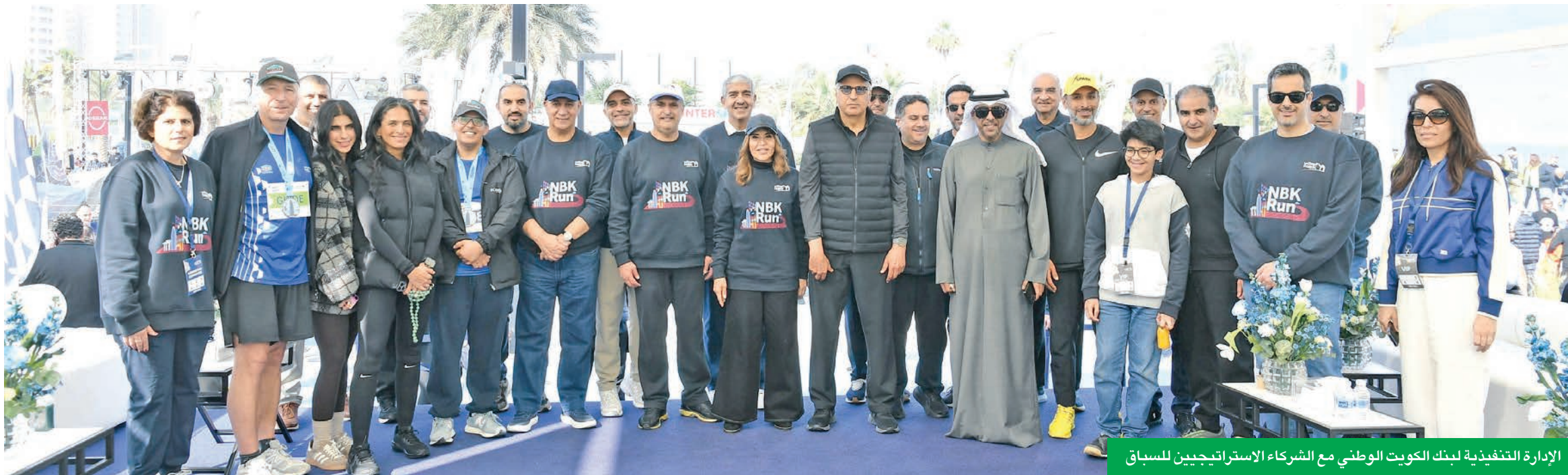
الإدارة التنفيذية لبنك الكويت الوطني مع الشركاء الاستراتيجيين للسباق

أكثر من 7 آلاف متسابق وحشود جماهيرية غفيرة شاركت في النسخة الـ 31 من السباق