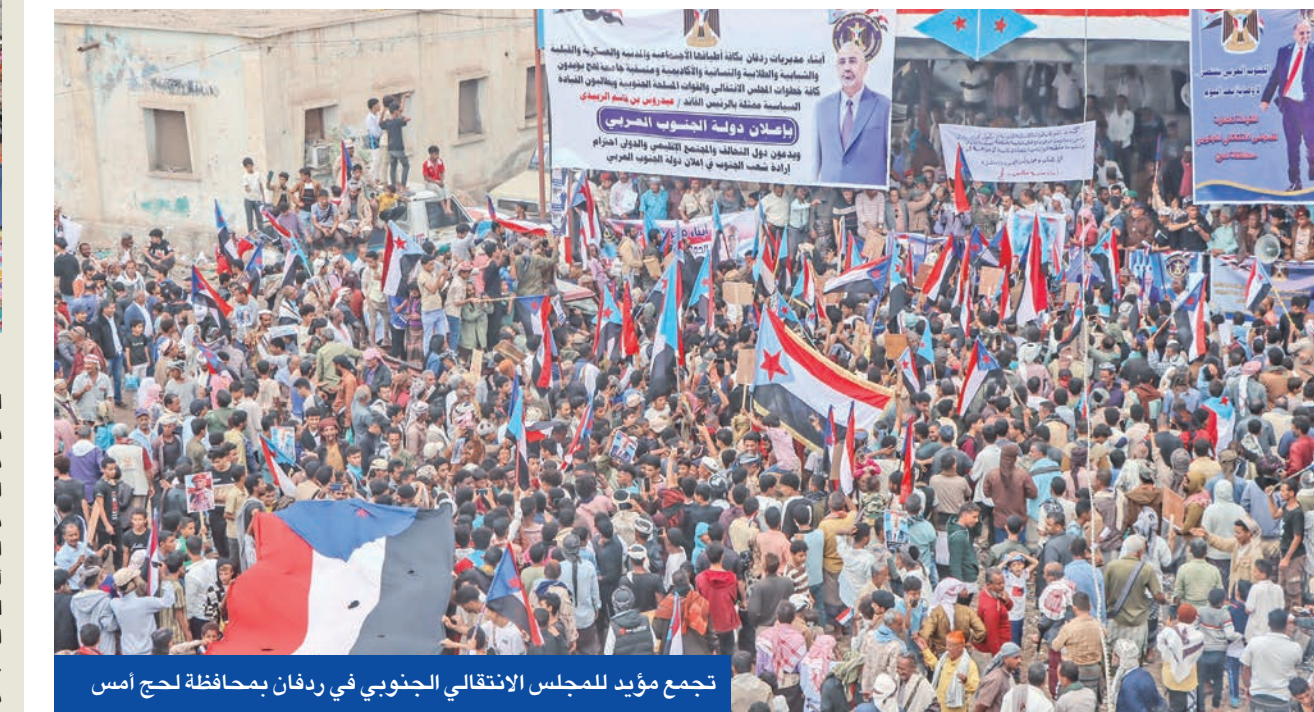
تجمع مؤيد للمجلس الانتقالي الجنوبي في ردقان بمحافظة لحج أمس

«المجلس الانتقالي الجنوبي» أنور التميمي قال لـ «الجزيرة» يوم الخميس الماضي إن قرار إعلان استقلال الجنوب يخضع لعدة اعتبارات وإنه لن يكون هناك إعلان استقلال من دون تنسيق مع دول المحيط العربي في غضون ذلك، عقدت القيادة التنفيذية العليا بالمجلس الانتقالي الجنوبي اجتماعاً أمس، أشاد خلاله بـ «الجهود التي تبذلها القوات المسلحة الجنوبية، والقيادات المحلية التابعة للمجلس الانتقالي، بالتنسيق مع السلطات المحلية، لتطبيق الأوضاع وحفظ السكينة العامة، ومواجهة أي محاولات لزعة الأمن والاستقرار».