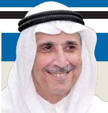
غياب العين الحمراء

ثلاثة كُتّاب في عدد يناير/ فبراير «فورن افيرز» وضعوا إدارة الرئيس ترامب تحت المجهر، ليقولوا إن إدارة الرئيس الأميركي تمثل صورة حقيقية لما يسمى «الاستبداد التنافسي». في هذا النظام هناك انتخابات حقيقية لكن الرئيس يسيّس القضاء ويلاحق المعارضين عبر الإدارة القانونية، ويمارس الضغط على الإعلام والمجتمع المدني، ويستخدم أجهزة الدولة لتخويف المعارضين. ويلاحظ الكتاب الثلاثة أنه في ظل هذه الإدارة يُطبّق القانون انتقائيًا عندما تحولت السلطة القضائية من أداة استقرار للمراكز القانونية إلى سلاح سياسي ضد الخصوم. وأن هذا النظام استهدف صحفًا كبرى بدعاوى تشهير، وأنه سيّس الأمن وأجهزة الشرطة، فقد استخدم الحرس الوطني في عدد من الولايات دون موافقتها، ويرفض الكتاب أن يقال، ما يحدث الآن يمثل امتداداً طبيعياً لتاريخ أميركي قديم، مثل الكارثية وترغبت وغيرهما، فوزارة العدل لم تسيّس بهذه الصورة من قبل، ولم يحدث أن استُخدِم القضاء لملاحقة المعارضين السياسيين.