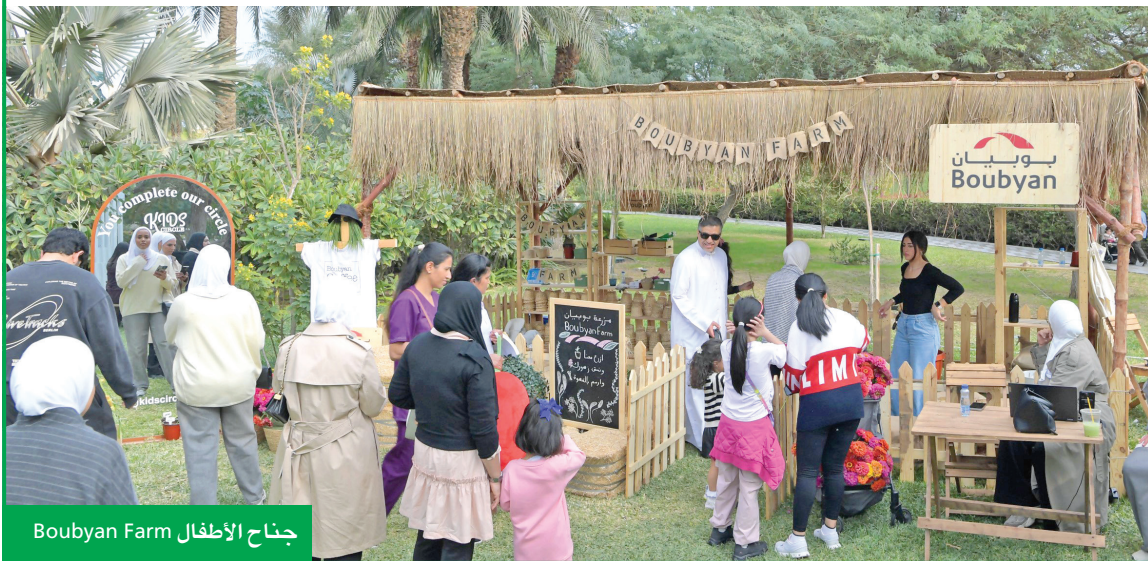
جناح الأطفال Boubyan Farm

إدراج المهرجان على منصة Visit Kuwait يعزز حضور البلاد على خريطة الفعاليات السياحية قتيبة البسام