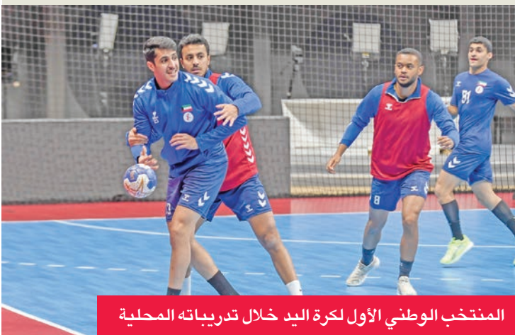
المنتخب الوطني الأول لكرة اليد خلال تدريباته المحلية

القصوى من فترة الإعداد الحالية. وأشار طالب إلى أن قائمة المنتخب تخلق حالياً من الإصابات، متمنياً استمرار هذا الوضع لضمان جاهزية جميع العناصر خلال البطولة. ومن المنتظر أن يختم المنتخب معسكره في القاهرة يوم 21 الجاري، ليعود إلى البلاد لاستكمال المرحلة التالية من التحضيرات، قبل التوجه إلى كرواتيا للحدوث في معسكر خارجي أخير، بهدف إلى وضع اللمسات النهائية على التشكيلة الأساسية والخطط الفنية التي سيعتمدها الجهاز الفني في البطولة الآسيوية المرتقبة.