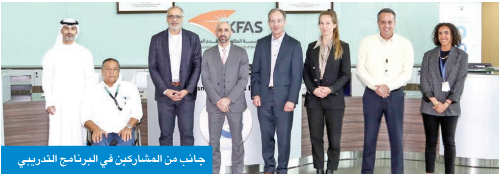
جانب من المشاركين في البرنامج التدريبي

وجامعة الكويت، وجامعة السلام، والعديد من الجهات الحكومية والخاصة في الكويت. وأعلن المعهد أن هذا البرنامج يأتي ضمن استراتيجيته لتعزيز الابتكار واستخدام التقنيات الحديثة في مكافحة السكري ودعم التحول الرقمي في مجال الرعاية الصحية بالكويت، بما يواكب التطور العالمي المتسارع في هذا المجال.