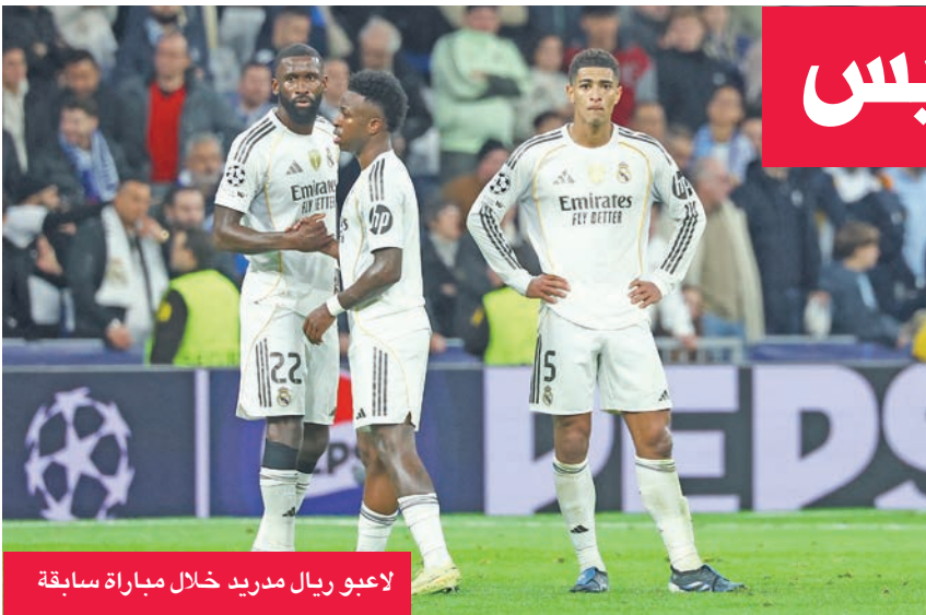
لاعبو ريال مدريد خلال مباراة سابقة

وأضاف المدرب الإسباني: «مقارنة بمباراة السيتي لا