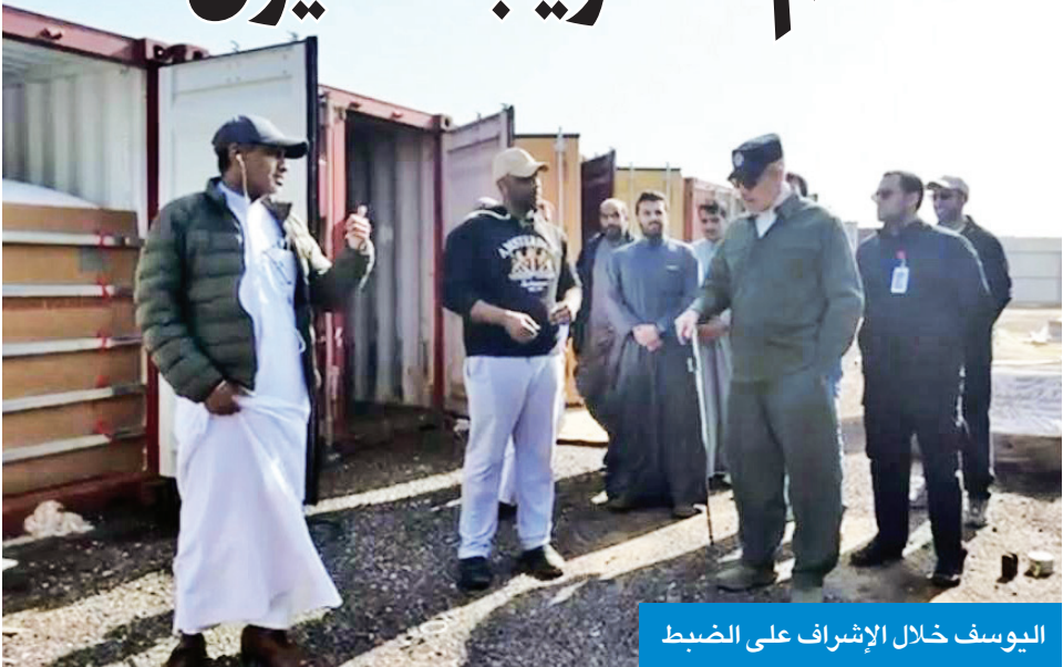
اليوسف خلال الإشراف على الضبط

واتخاذ الإجراءات القانونية اللازمة بشأنها. وأكدت وزارة الداخلية أنه سيتم سحب الحيازات التي تُستغل في الأعمال غير المشروعة، أو في غير الأغراض المخصصة لها، واتخاذ كل الإجراءات القانونية بحق المتورطين، وإحالتهم إلى الجهات المختصة. وشددت «الداخلية» على استمرار حملاتها الأمنية لضبط المخالفين والتصدي لمحاولات التهريب، داعية الجميع إلى الالتزام بالقوانين والأنظمة المعمول بها، والإبلاغ عن أي مخالفات تسهم في حماية أمن الوطن ومقدراته.