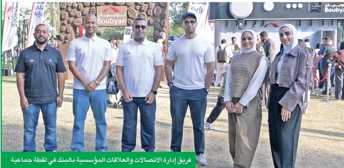
فريق إدارة الاتصالات والعلاقات المؤسسية بالبنك في لقطة جماعية