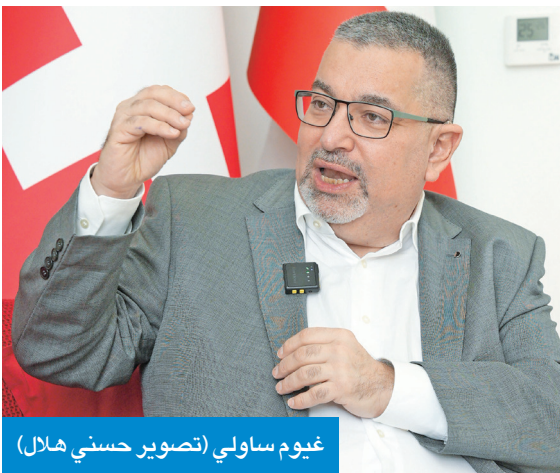
غيوم ساولي

أشاد الخبر السبراني غيوم ساولي الأمن السبراني غيوم ساولي بالمستوى المتقدم الذي حققته الكويت في مجال البنية الرقمية والاتصالات، مؤكداً أن البلاد تتمتع بقاعدة قوية يمكن البناء عليها إذا استُكملت بتشريعات عصرية وورش تدريبية مؤسسية للكوادر الوطنية. وفي تصريح لـ«الجريدة»، خلال زيارته مؤخراً للكويت للاطلاع على الواقع السبراني، قال ساولي إن الكويت تستند اليوم إلى واحدة من أفضل البنى التحتية الرقمية في المنطقة، مضيفاً أن تغطية الألياف البصرية تصل إلى 97 في المئة من البلاد، كما أن شبكات الجيل الخامس 5G منتشرة على نطاق واسع. وشدد على أن هذا المستوى من الجاهزية يضع الكويت في موقع تنافسي قوي لبناء اقتصاد رقمي متطور، ورأى أن