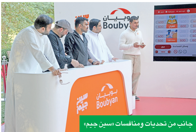
جانب من تحديات ومناقشات «سين جيم»

شهدت حضوراً وتفاعلاً مع المباريات بروج رياضية عالية، وسط أجواء ممتعة جمعت بين تجربة الاستمتاع بالقهوة ومتابعة المناقشات الكروية.