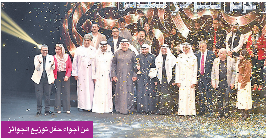
من أجواء حفل توزيع الجوائز

«ما ليس لي» لفرقة الخليج العربي حصدت 5 جوائز