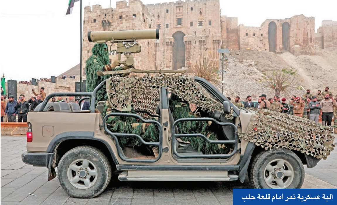
آلية عسكرية تمر أمام قلعة حلب

وقال الشرع، في كلمة بعد أدائه الصلاة، «أيها السوريون أطيعوني ما أطيع الله فيكم، فوالله لن يقق في وجهنا أي أحد مهما كبر أو عظم، ولن تقق في وجهنا العقبات، وسنواجه جميعاً كل التحديات»، مضيفاً: «بعد أن منّ الله علينا بالنصر المبين، كانت أولى زياراتنا الخارجية إلى المملكة العربية السعودية، وأثرنا في ذاك اليوم إلا أن نزور بيت الله