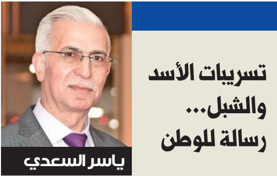
تسريبات الأسد والشبل... رسالة للوطن

الشرع من «الأموي»: سنعيد سورية قوية وحصون النصر والبناء مهمة السوريين جميعاً ● احتفالات واستعراضات عسكرية في دمشق وإدلب واللاذقية وحمص وحماة