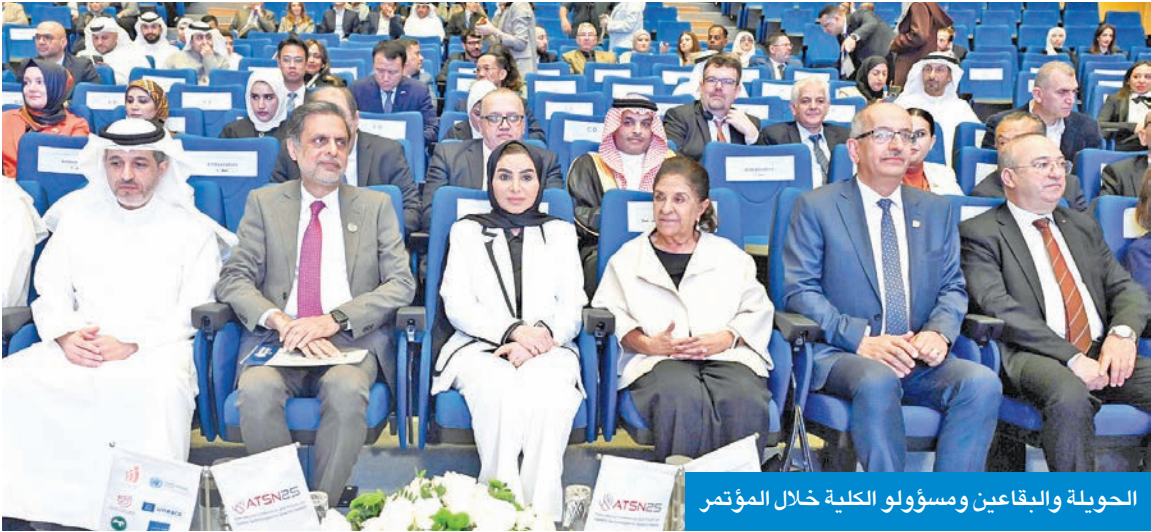
الحويلة والبقاعين ومسؤولو الكلية خلال المؤتمر

عن فخرها بوجود (KIB) في مثل هذه المبادرات التي تعكس روح المسؤولية المجتمعية وتعزز دعم الفئات المستحقة. وأوضحت أن المشاركة في مثل هذه المبادرات تدعم من يستحق فرصة حقيقية لدعم من يستحق الدعم، مؤكدة تقديرها لتنظيم مبادرة «أكثر من رائعة» تحمل قيمة اجتماعية وإنسانية كبيرة.