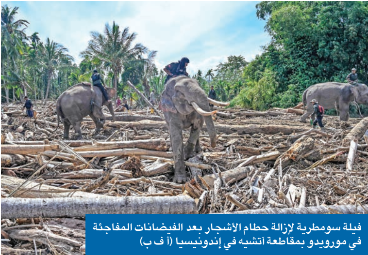
فيلة سومطرية لازالة حطام الأشجار بعد الفيضانات المفاجئة في مورويديو بمقاطعة أنتشيه في إندونيسيا

900 ألف شخص، لافتة إلى أن مياه الفيضانات بدأت تنحسر في عدد من المقاطعات الساحلية، رغم أن مناطق