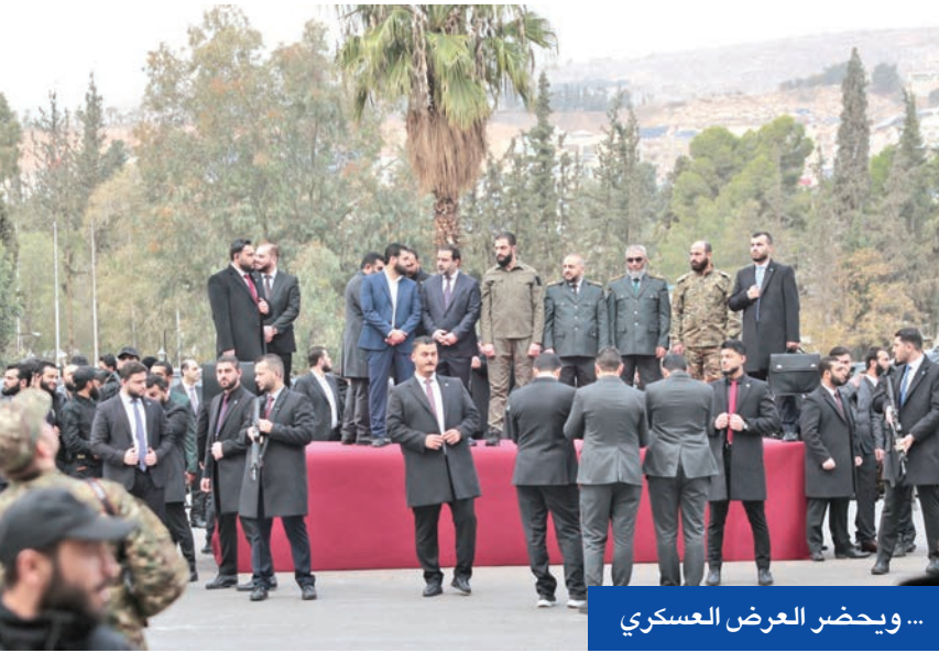
...ويحضر العرض العسكري