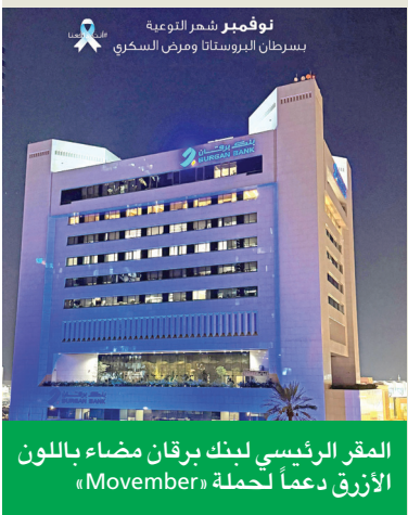
المقر الرئيسي لبنك بركان مضاء باللون الأزرق دعماً لحملة «November»

كما تعكس هذه الجهود حرص البنك على تعزيز مكانته كجهة عمل مفضلة، ودوره كمساهم فاعل في تحقيق التنمية المجتمعية الشاملة والمستدامة.