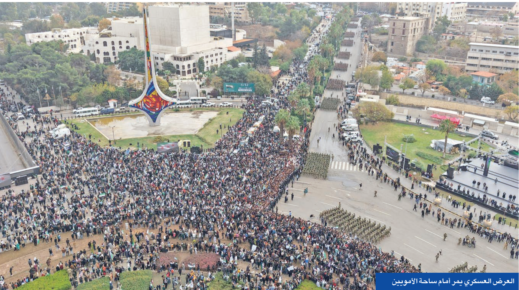
العرض العسكري يمر أمام ساحة الأمويين

ومع إدارتنا الكامل لما يقع على عاتق القيادة الجديدة من مسؤوليات محلية وإقليمية ودولية، فإننا نذكرها بما نادت به هي دائماً، لا لأنها نسيت، بل لأنها في حاجة إلى التأكيد دوماً على ضرورة بناء وطن للمواطنين جميعاً بكل طوائفهم وانتماءاتهم دون إقصاء لأحد، من أجل تأسيس جبل يؤمن بالديمقراطية، ويحترم الرأي الآخر، ويطبق القانون بسطوة واحدة على الجميع دون تمييز. إنها صفحة جديدة في بناء صرح وطن آمن لا يلقى فيه برءى في أقبية سجون حائلة قاسية قد لا يرى بعدها شمس الحرية، لمجرد كلمة نفوه بها أو رأي أبداه... ذلك العهد الأثم قد ولى بمراراته إلى غير رجعة، والآن جاء وقت البناء والعمل والتنمية بسواعد أبناء سورية الموحدة سورية المستقبل، سورية المجموع لا سورية الفرد.