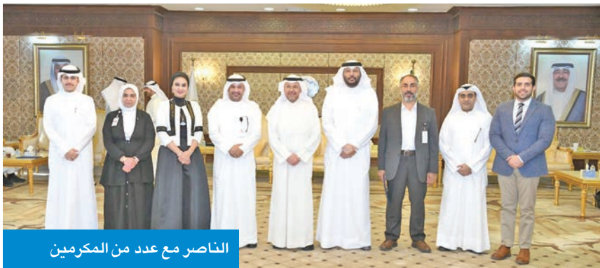
الناصر مع عدد من المكرمين

وبالبلدية، والذي يعتبر حافزاً للمنافسة بالعمل الميداني، والتميز في خدمة أهالي المحافظة وتطوير خدماتها.