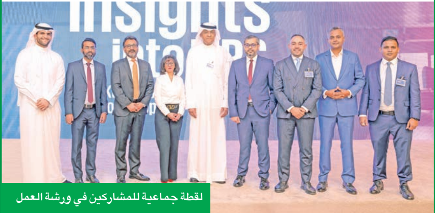
لقطة جماعية للمشاركين في ورشة العمل

لمناقشة المعايير الدولية للتقارير المالية