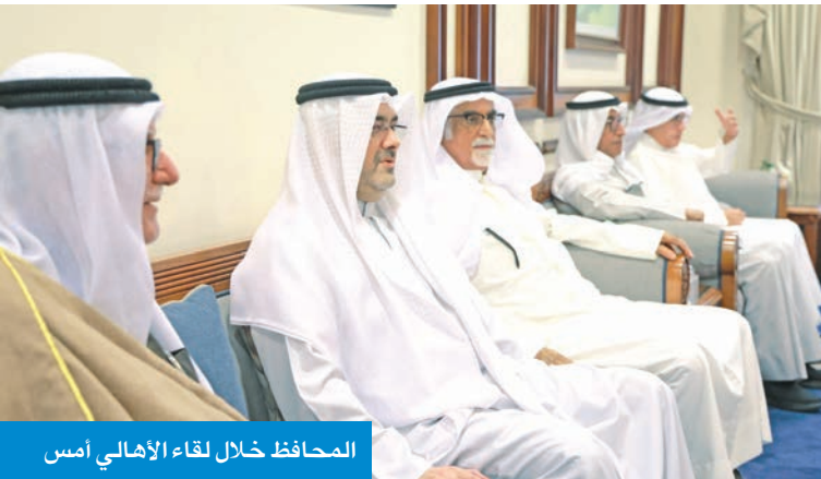
المحافظ خلال لقاء الأهالي أمس