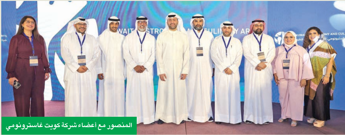
المنصور مع أعضاء شركة كويت غاسترونومي

تجدر الإشارة إلى أن جهود «طلبات» في تطوير قطاع الأغذية والمشروبات تمتد إلى ما هو أبعد من تعزيز التكنولوجيا وتحسين تجربة العملاء؛ فهي تشمل أيضاً تمكين الموظفين والشركاء ضمن بيئة عمل عادلة وشاملة تحفز الإبداع وتدعم المشاريع الناشئة وتمكين الكفاءات الوطنية، انسجاماً مع رؤيتها في تعزيز مستقبل الاقتصاد الكويتي، وتحقيق أهداف رؤية الكويت 2035.