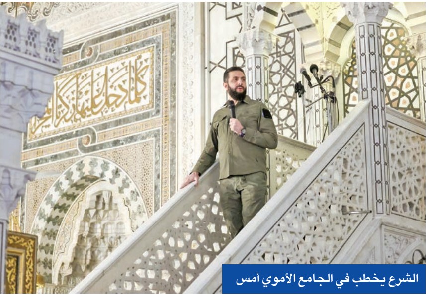
الشرع يخطب في الجامع الأموي أمس

العسكري من دوار المطاحن، وتقدمت الوحدات بتشكيلاتها المختلفة عبر الشوارع الرئيسة، مروراً بمسجد خالد بن الوليد ومنطقتي الساعين القديمة والجديدة وصولاً إلى مشفى الرازي، بمشاركة عناصر من المشاة والإسناد الناري والمدفعية ووحدات الشاهين، إلى جانب البات عسكرية متنوعة.