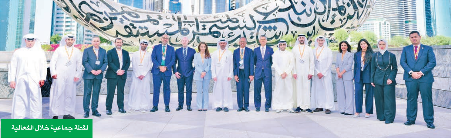
لقطة جماعية خلال الفعالية

100 اجتماع بين 9 شركات كويتية وجهات عالمية بالتعاون مع «جيفيريز»