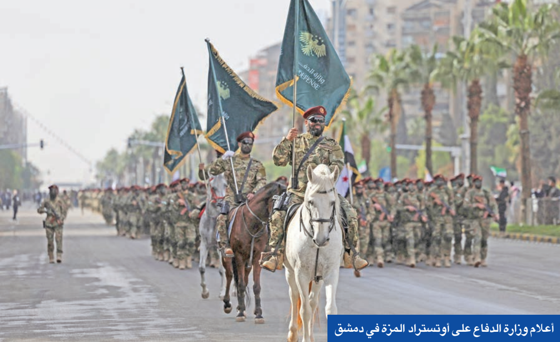
أعلام وزارة الدفاع على أوتستراد المزة في دمشق