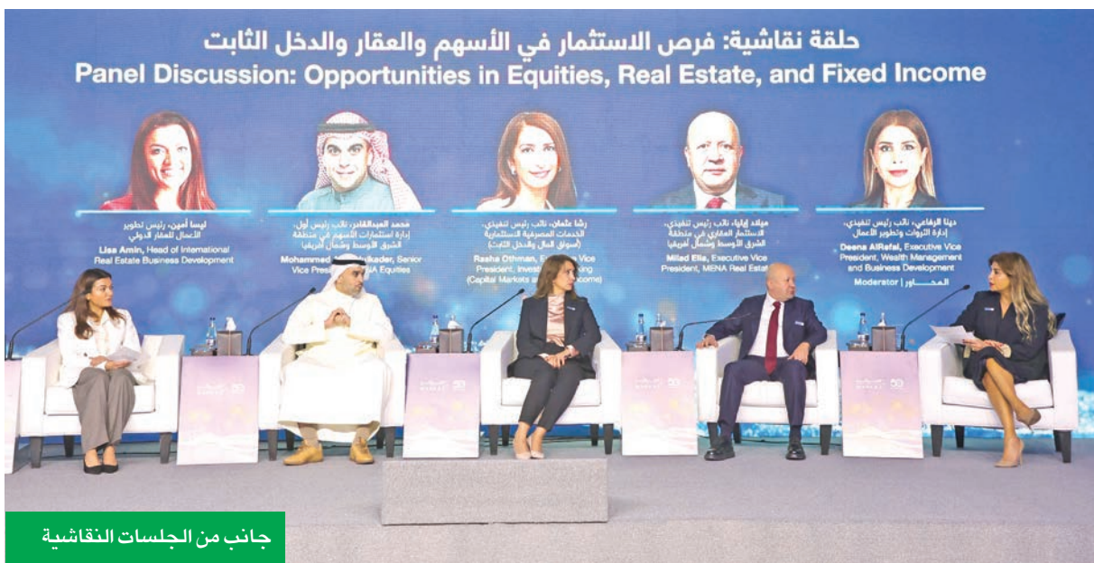
جانب من الجلسات النقاشية