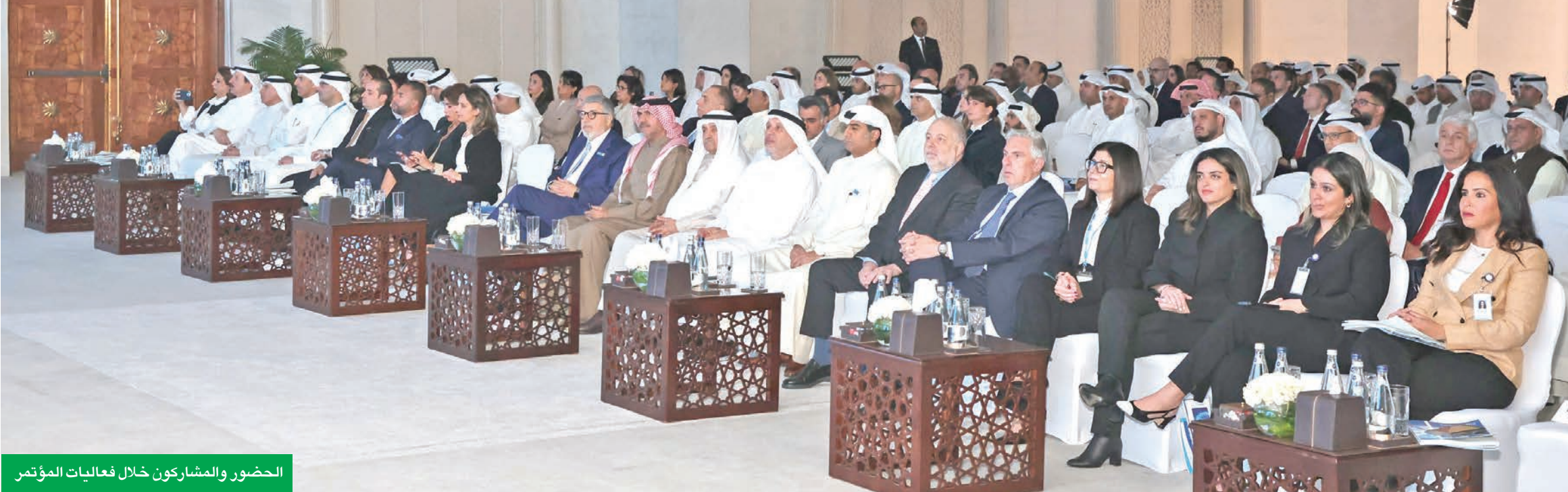
الحضور والمشاركون خلال فعاليات المؤتمر