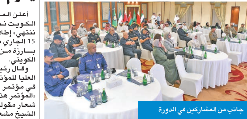
جانب من المشاركين في الدورة

بأن تسهم مخرجات هذه الدورة في ترسيخ منظومة استجابة أكثر قوة وتكاملاً في المنطقة. وتأتي هذه الدورة برعاية البديوي الوثيق الذي تبديه الدول الأعضاء من خلال تزيح نخبة من كوادرها الفنية للمشاركة في هذه البرامج النوعية. وأكد أن تطوير جاهزية الطوارئ هو استثمار مباشر في أمن واستقرار شعوب دول المجلس، معرباً عن ثقته