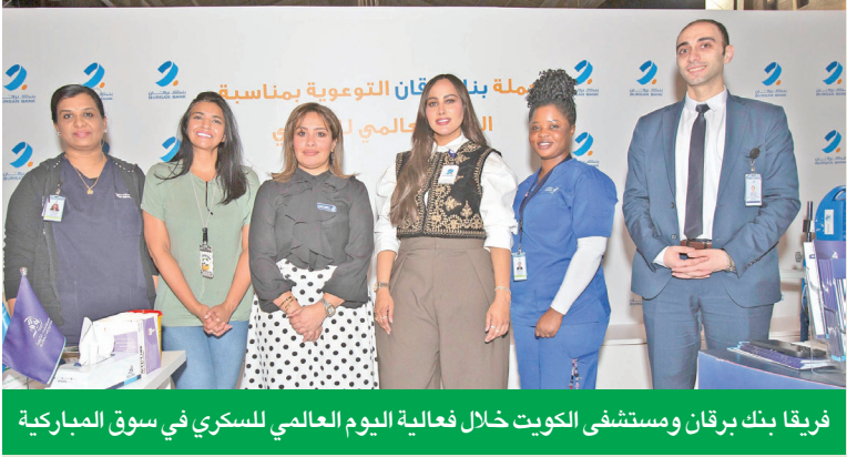
فريقا بنك بركان ومستشفى الكويت خلال فعالية اليوم العالمي للسكري في سوق المباركية