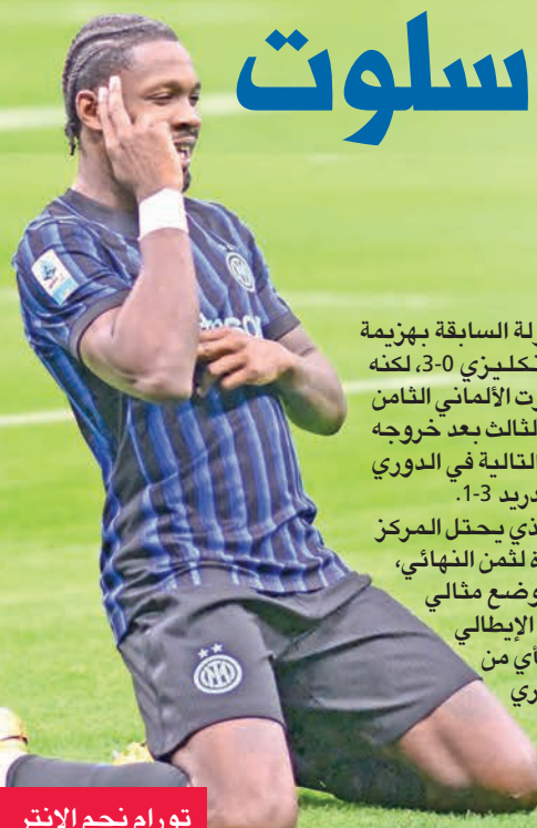
تورام نجم الإنتر

الإسباني الذي مني في الجولة السابقة بهزيمة قاسية على يد تشلسي الإنكليزي 3-0، لكنه يستضيف أينتراخت فرانكفورت الألماني الثامن والعشرين، وهو مرشح لفوز الثالث بعد خروجه منتصراً من مبارياته الثلاث التالية في الدوري المحلي، بينها على أتلتيكو مدريد 1-3.