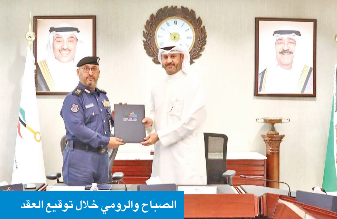
الصباح والرومي خلال توقيع العقد

وقّعت قوة الإطفاء العام مع مؤسسة الموانئ الكويتية عقد ترخيص استغلال مخزن ضمن الأراضي التابعة للمؤسسة في منطقة ميناء عبدالله بمساحة 2800 م2، ولمدة 3 سنوات. ومثل الجانبين رئيس «الإطفاء»، اللواء طلال الرومي، والمدير العام للمؤسسة، الشيخ خالد الصباح.