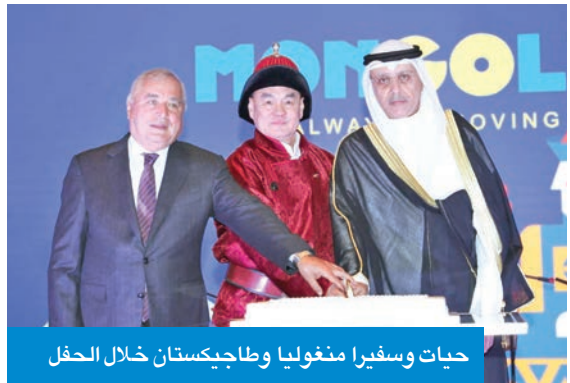
حيات وسفيراً منغولياً وطاجيكستان خلال الحفل

أكد مساعد وزير الخارجية لشؤون آسيا، السفير سميج حيات، أن الكويت «ستكون مركزاً لتصدير المنتجات المنغولية إلى دول الخليج».