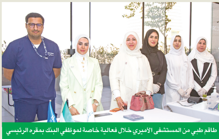
طاقم طبي من المستشفى الأميري خلال فعالية خاصة لموظفي البنك بمقره الرئيسي

كما تعكس هذه الجهود حرص البنك على تعزيز مكانته كجهة عمل مفضلة، ودوره كمساهم فاعل في تحقيق التنمية المجتمعية الشاملة والمستدامة.