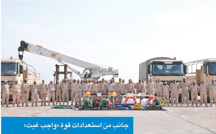
جانب من استعدادات قوة «واجب غيث»

عقد الاجتماع التنسيق في لواء صالح المحمد الألي/94 لقوة «واجب غيث»، برئاسة مساعد أمر قوة الواجب العميد الركن بدر الشطي، ومشاركة عدد من ضباط وحدات الجيش المختلفة، ضمن إطار الاستعدادات الجارية لموسم الأمطار. وشهد الاجتماع استعراض خطة العمل الميدانية وآلية التنسيق بين الجهات المشاركة، إضافة إلى مراجعة إجراءات التعامل مع البلاغات والحالات الطارئة.