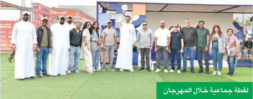
لقطة جماعية خلال المهرجان