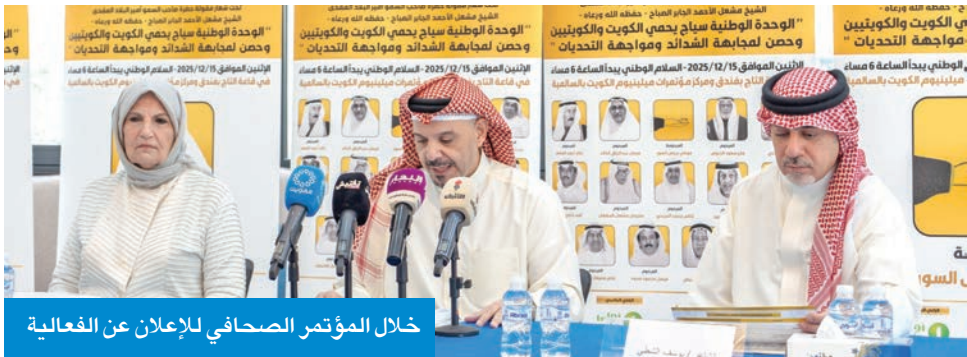
خلال المؤتمر الصحافي للإعلان عن الفعالية

اختيارها على مفاهيم الوسطية في الفكر والطرح والعقيدة والاستناد إلى تعاليم الدين الإسلامي، والتمسك بالتقاليد الكويتية العريقة المستمدة من الآباء والأجداد.