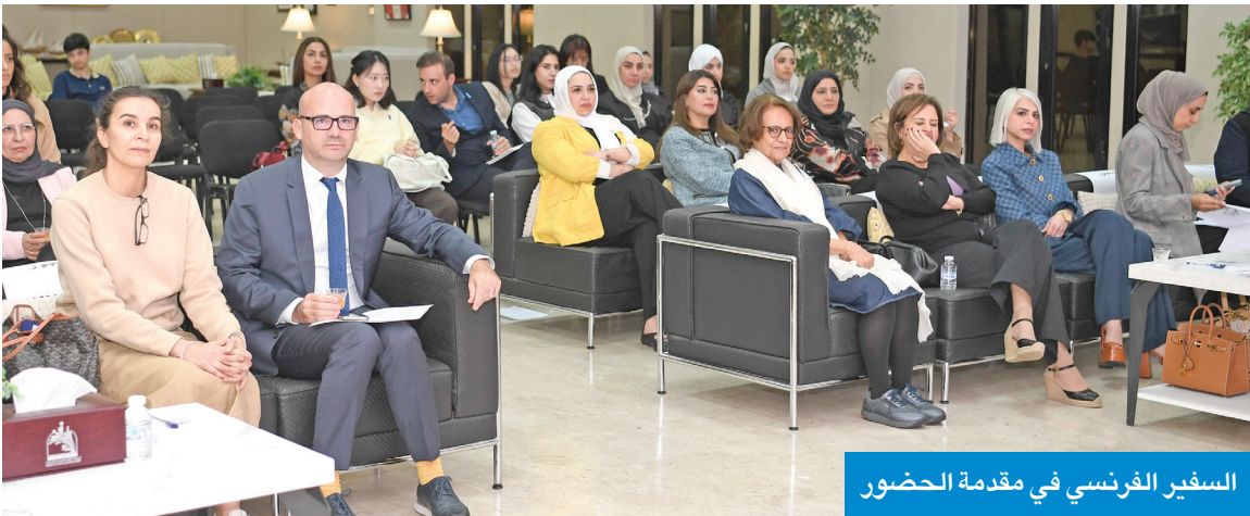
السفير الفرنسي في مقدمة الحضور

أكد السفير الفرنسي لدى الكويت، أوليفيه غوفان، أن استراتيجية بلاده الدولية للسياسة الخارجية النسوية، تنطلق من إيمان فرنسا الراسخ بأن المساواة بين المرأة والرجل حجر الزاوية في السلام والعدالة والتنمية.