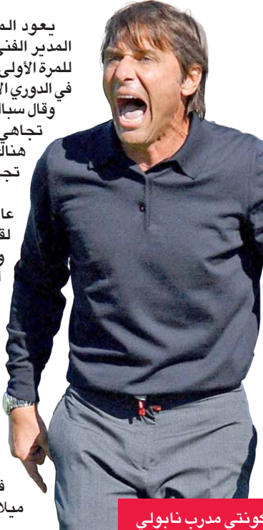
كونتي مدرب نابولي

وانتهى المدرب أنطونيو كونتي سلسلة التتويج المتتالية ليوفنتوس في الدوري الإيطالي؛ حينما قاد إنتر ميلان للفوز باللقب في عام 2021، كما قاد