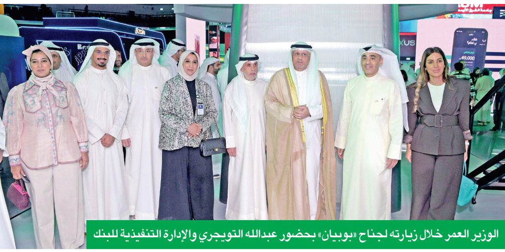
الوزير العمر خلال زيارته لجناح «بوبيان» بحضور عبدالله التوجيهي والإدارة التنفيذية للبنك

ومع اختتام فعاليات المعرض، شارك السعدون ضمن لجنة تحكيم Startup Challenge، والتي شهدت مشاركة وعرض 20 مشروعاً ناشئاً، قدم من خلالها المبادرين وأصحاب المشاريع أفكاراً مبتكرة في مجالات التكنولوجيا المالية والخدمات والحلول الذكية.