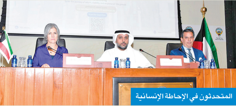
المتحدثون في الإحاطة الإنسانية

«الدبلوماسي» يستضيف إحاطة إنسانية عن العودة والاستقرار