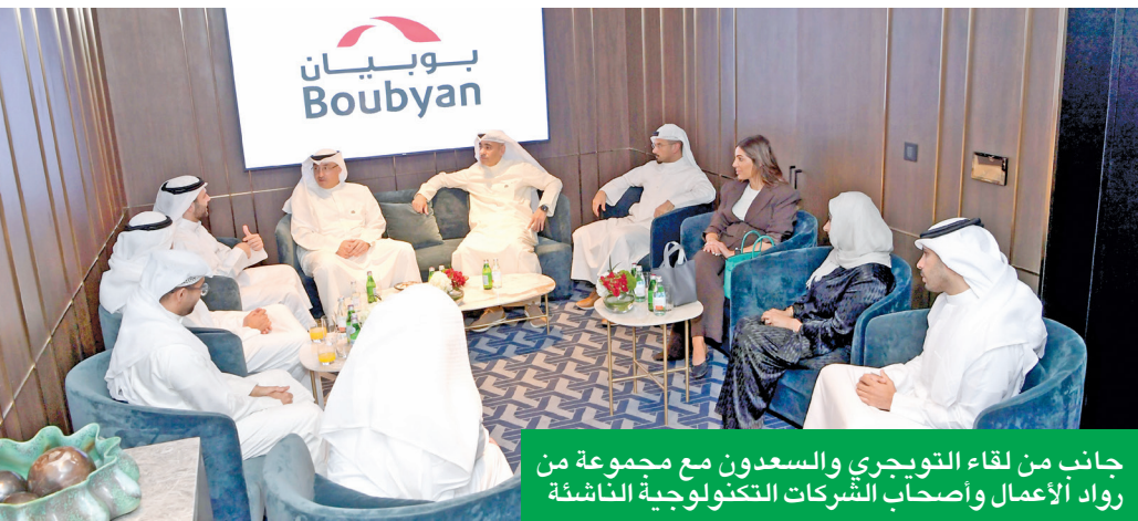
جانب من لقاء التوجيهي والسعدون مع مجموعة من رواد الأعمال وأصحاب الشركات التكنولوجية الناشئة

وأضاف أن «بوبيان» يمتلك بيئة تمكين استثنائية لتعزيز القدرات الرقمية لقطاع الشركات التكنولوجية الناشئة، من خلال استكشاف ووضع منهجيات للابتكار الرقمي وتطوير حلول ذكية تعتمد على التقنيات الناشئة والذكاء الاصطناعي والحوسبة السحابية والأمن السيبراني، مبيناً أن البنك استطاع خلال السنوات الماضية بناء بنية رقمية تضاهي