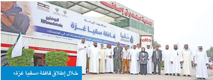
خلال إطلاق قافلة «سقيا غزة»

15 شاحنة بها مليون عبوة من مياه الشرب بتبرع من شركة الروضتين