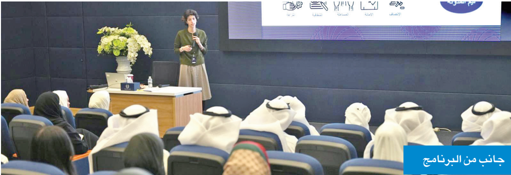
جانب من البرنامج

نظمت الهيئة العامة لمكافحة الفساد (نزاهة) برنامجها الوطني بعنوان «تعزيز النزاهة والشفافية في القطاع العام» الموجه لموظفي الجهات الحكومية بمشاركة 88 متدرباً من عدد من الجهات الحكومية، بهدف تعزيز الشفافية في القطاع العام، من خلال تعريف الموظفين بمفهوم الفساد وأساليبه وأثاره، إضافة إلى تطبيق الإطار القانوني الدولي والمحلي لمكافحة الفساد. وقالت «نزاهة»، في بيان صحفي أمس، إن البرنامج تضمن مجموعة من المحاور الأساسية التي تغطي جوانب متعددة، ويعتمد على منهجيات