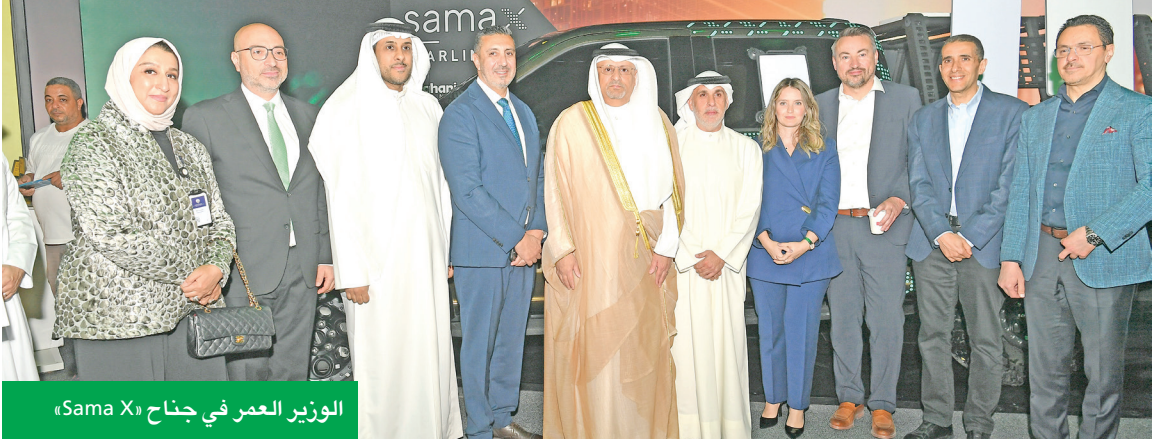
الوزير العنبر في جناح «Sama X»

الحدث عن منصتها الإلكترونية MatrixX، التي تتيح للعملاء مراقبة شبكاتهم وإدارتها في الوقت الفعلي، بما يشمل تتبع التشغيل واستجابة الخدمة. والتحكم بالإعدادات، معززة بذلك مستوى الشفافية وسهولة التشغيل واستجابة الخدمة. وتواصل الشركة تنسيقها مع الجهات التنظيمية في عدد من دول المنطقة للحصول على الموافقات اللازمة لتقديم خدمات الاتصال عبر الأقمار الصناعية وفق خصائص ومتطلبات كل سوق، خصوصاً مع حصول «ستارلينك»، على تراخيص تشغيل بحرية في دولة الإمارات العربية المتحدة وتأمينها بالموافقات الرسمية في الأردن، وسلطنة عُمان، وقطر، والبحرين، ولبنان.