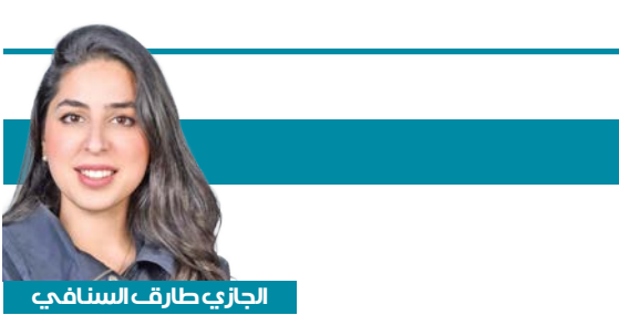
الجازيري ظرف السنافي

مفتوحة كالبحر، تُقاس بالعباءة لا بالورق. اليوم حين نسمع أصواتنا تصرخ «ارجع لبلدك»، فنحن لا نحمي الوطن... بل نجرده من روحه. نحلّح التاريخ إلى قطعة ضيقة، ونحوّل الإنسان إلى رقم، ونحوّل المجتمع إلى جدار، الوطن ليس وثيقة تُحدّد، الوطن انتماء يتجزّد. طفل فلسطيني ينشد النشيد الوطني في يومه الدراسي لا يقل انتماء عن أي طفل آخر. ورجل عاش عمره هنا لا يصبح غريباً لأن مزاجاً عاماً تتغيّر. الوطن مساحة تكبر فيها معاً أو تنصغر فيها معاً. هذه ليست كويت الأجداد إن تحولت للتمكين. هذه ليست الكويت إن صار القياس بالدم لا بالهوية. الكويت التي نريدها ونفخر بها هي التي تُقيّم الإنسان بما قدّم، بما زرّع، بما علم، بما بنى لا بما كتب على صفحته الأولى من جواز السفر. فلنقلها بوضوح لا يلتوي: العنصرية تجاه الوافدين ليست من الكويت، من قبل تاريخها، ولا تليق بمستقبلها. من عاش هنا، من تعب هنا، من بنى وشارك ووقف... ليس ضيفاً. الضيف الحقيقي هو الجحود، والغريب الحقيقي هو من لا يرى الإنسان إلا لوناً أو جنسية. الكويت تكبر بالعدل، لا بالرفض. نبغّ العنصرية تجاهه، لا بالإقصاء. وطنٌ يبنى بالناس جميعاً... أو لا يبنى أبداً.