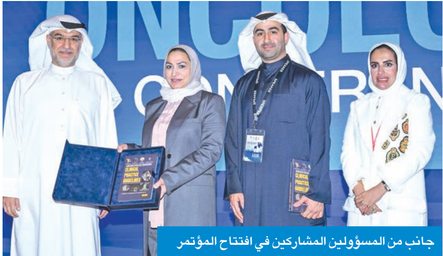
جانب من المسؤولين المشاركين في افتتاح المؤتمر

بعدم التعليم الطبي المستمر، والتعاون الإقليمي، وتعزيز تبادل الخبرات بين المختصين»، مؤكدة أن مواجهة السرطان ليست مسؤولية فردية، بل هي عمل جماعي يمتزج فيه البحث العلمي مع الخبرة الإكلينيكية، وتلتقي فيه التخصصات المختلفة لخدمة مريض السرطان في جميع المجالات للوصول به إلى بر الأمان. وأشارت إلى أن رعاية مريض السرطان، لا تقوم فقط على العلاج المتقدم، بل تعتمد أيضاً على فهم عميق لاحتياجاته، ورعاية إنسانية تحفظ كرامته، وتمنحه الطمأنينة في رحلة وعكس حازج الخوف للوصول إلى أفضل النتائج العلاجية.