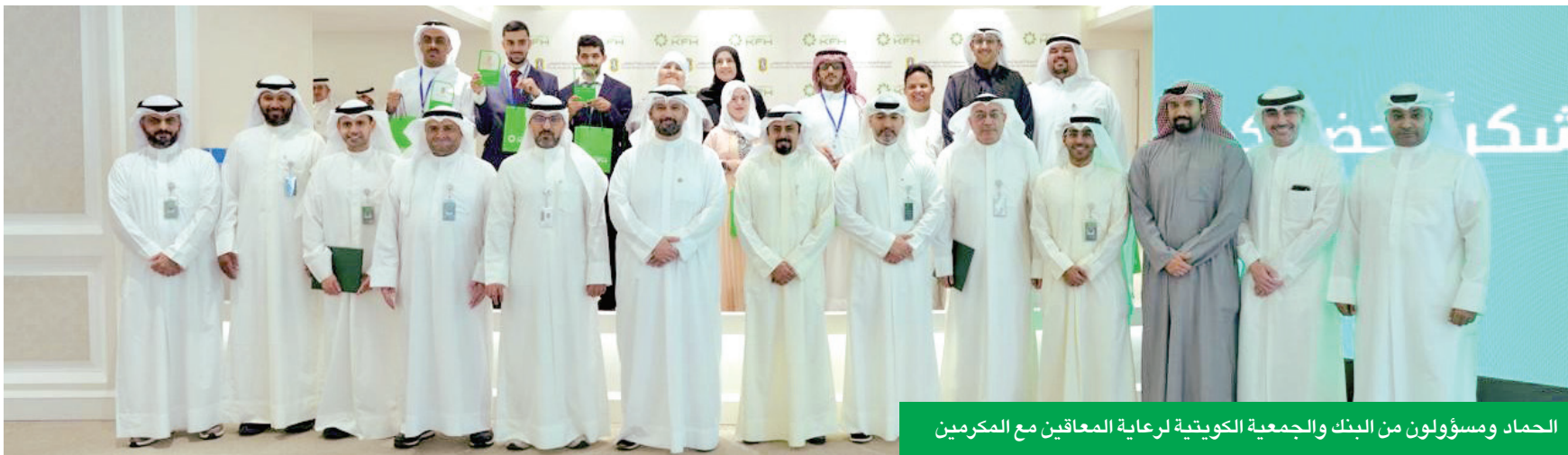
الحمداد ومسؤولون من البنك والجمعية الكويتية لرعاية المعاقين مع المكرمين

في ختام برنامج تدريبي شامل نظمه البنك للعام الخامس على التوالي