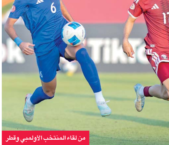
من لقاء المنتخب الأولمبي وقطر

وذلك من أجل تجهيزه لتصفيات كأس آسيا القادمة، وتصفيات لوس أنجلوس 2028، بينما للمنتخب المشاركة في البطولة من مواليد 2003 و2004. ولفت إلى أن البطولة فرصة رائعة للاعبين من أجل اكتساب الخبرات اللازمة، والتأكيد على قدراتهم.