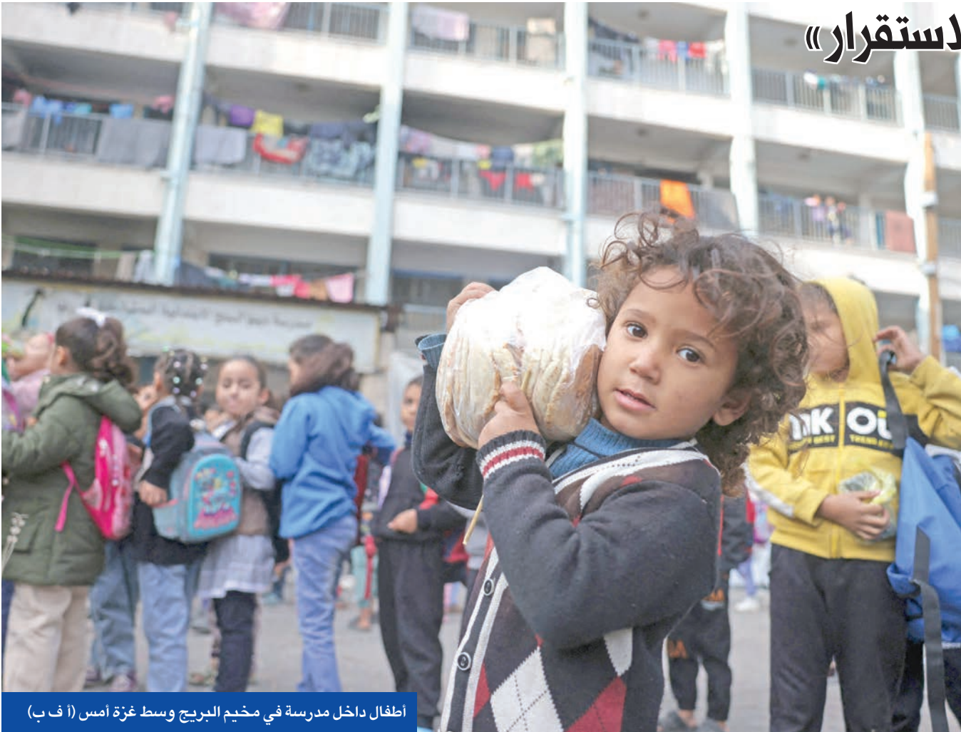
اطفال داخل مدرسة في مخيم البريج وسط غزة أمس