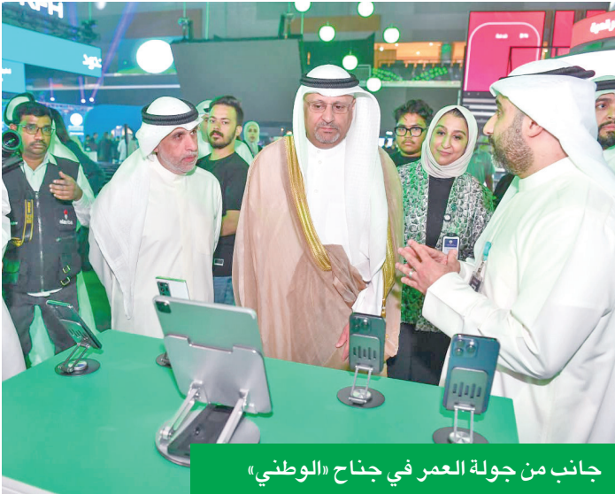
جانب من جولة العمر في جناح «الوطني»

بمجال صرف العملات الأجنبية، وقدرته على تطوير حلول مبتكرة تواكب التغيرات السريعة في الأسواق العالمية، ما يجعله الخيار الأول للعملاء في الكويت والمنطقة.