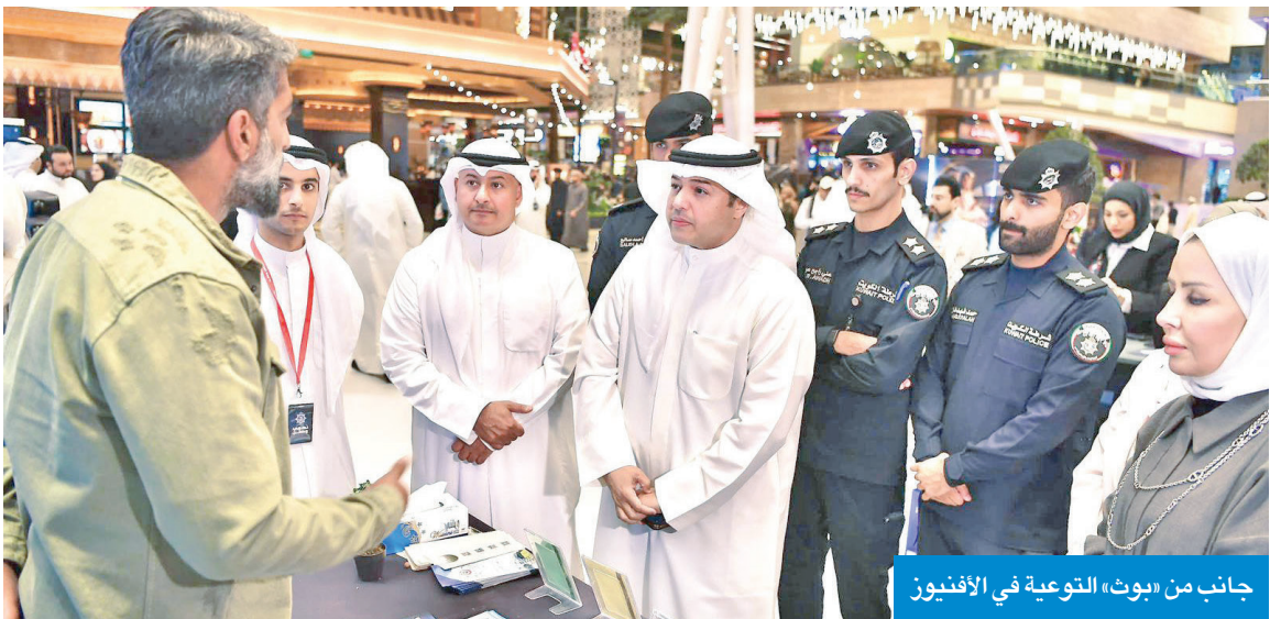
جانب من «بوت» التوعية في الأفيون

أبوصليب: شرح مواد القانون الجديد ورفع مستوى الوعي بخطورة الآفة