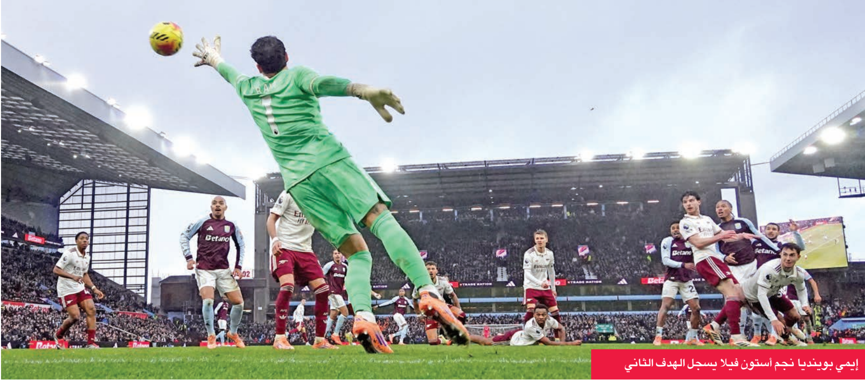
إيمي بوينديا نجم أستون فيلا يسجل الهدف الثاني

حطم الأرجنتيني إيمي بوينديا سلسلة أرسنال الخالية من الهزائم في 18 مباراة، بعدما سجل هدف الفوز القاتل لأستون فيلا 2-1 على متصدر الدوري الإنكليزي لكرة القدم أمس.