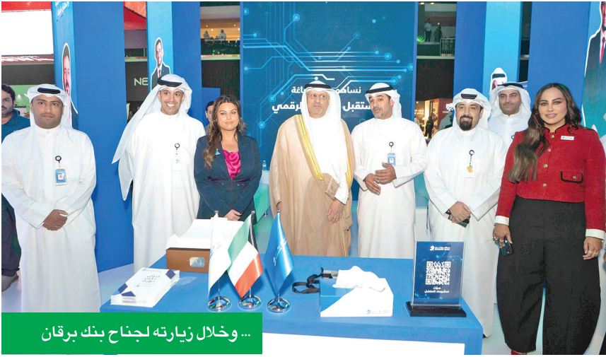
... وخلال زيارته لجناح بنك برقان