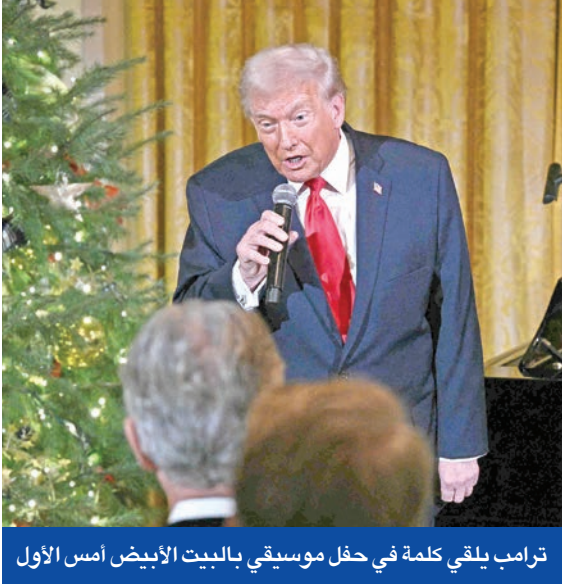
ترامب يلقي كلمة في حفل موسيقي بالبيت الأبيض أمس الأول

روسيا في سياق استمرار التنافس، لكن التركيز العملي الأكبر يذهب إلى قضايا التجارة والطاقة، وإعادة توزيع الأعباء الأمنية بدل مواجهة أيديولوجية شاملة. كما في بعض الوثائق السابقة.