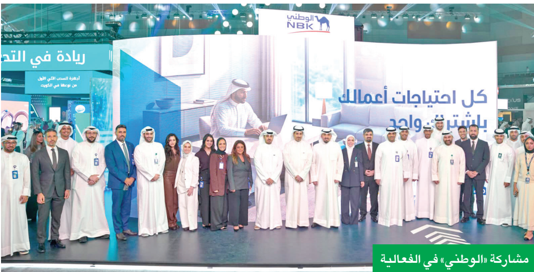
مشاركة «الوطني» في الفعالية

وتأتي هذه الرعاية في إطار التزام «الوطني» و«وياي» بدعم مسيرة التحول الرقمي في القطاع المصرفي الكويتي، وتقديم حلول مبتكرة