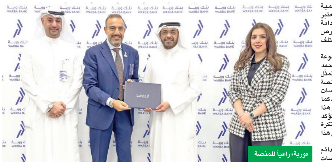
«وربة»، راعيا للمنصة

أعلن بنك وربة رعايته الرسمية لمنصة «فرصة» التطوعية، التي تعتبر شريكاً في تحقيق التنمية المستدامة من خلال تمكين الأفراد، وتوفير فرص تطوعية متنوعة بالتعاون مع مختلف القطاعات.