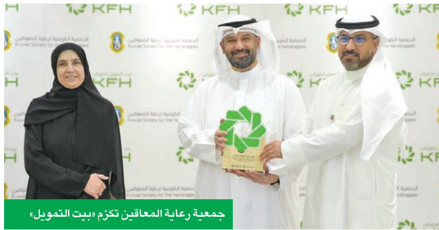
جمعية رعاية المعاقين تكرم «بيت التمويل»