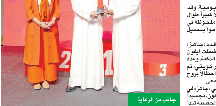
جانب من الرعاية

أكثر من 10,000 عذاء من أكثر من 100 جنسية، من بينهم ما يقارب من 5,000 من المقيمين، إضافة إلى 800 مشارك دولي قدموا إلى الكويت خصيصاً للمشاركة في الماراثون. واستناداً إلى هذا الإقبال الكبير والتفاعل المتنوع، يؤكد «جاهز» مواصلته تنفيذ مبادرات مماثلة خلال العام المقبل، دعماً للرياضة والصحة والفعاليات المجتمعية التي تعزز نمط حياة نشط وصحي في الكويت.