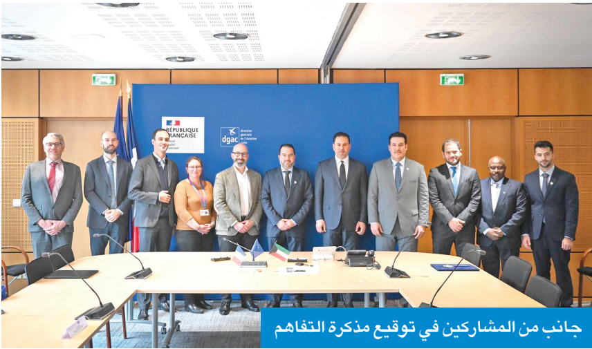
جانب من المشاركين في توقيع مذكرة التفاهم

على تشغيل رحلات إلى مطار الكويت الدولي، بما يسهم في تنشيط الحركة الجوية، ودعم الربط المباشر بين البلدين.