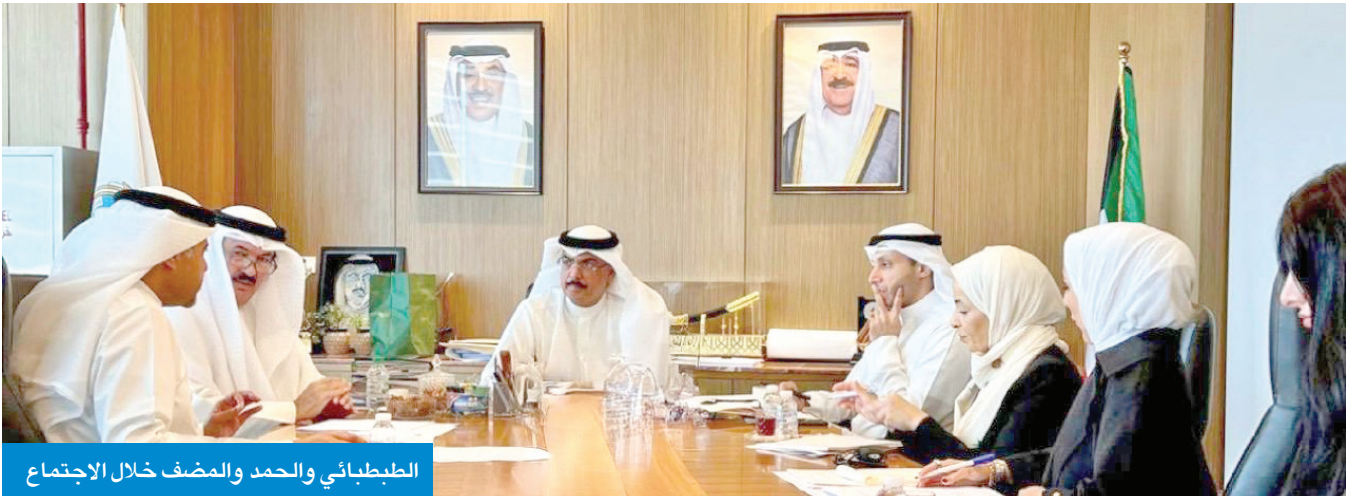
الطبيباني والحمد والمضف خلال الاجتماع

وتعتمد الجائزة مفهومًا واسعًا للحلول الرقمية يشمل مزيجاً من التكنولوجيات الرقمية والموارد الرقمية التي يمكن الوصول إليها عبر هذه التقنيات، بما في ذلك المحتوى الرقمي والبيانات والمعارف التفاعلية، ويبلغ إجمالي قيمة الجائزة 40 ألف دولار تمنح كل سنتين، ويتم توزيعها بالتساوي بين الفائزين من الأفراد والمؤسسات.