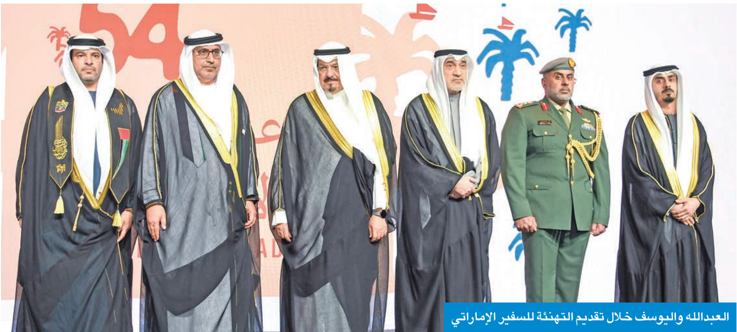
العبدالله واليوسف خلال تقديم التهنئة للسفير الإماراتي