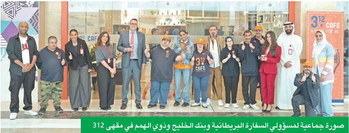
صورة جماعية لمسؤولي السفارة البريطانية وبنك الخليج وذوي الهمم في مقهى 312

وتعد الصيرفة كخدمة BaaS أحد أبرز تطبيقات الاقتصاد الرقمي، حيث تدمج بين المرونة التقنية والنماذج التعاونية، مما يفتح آفاقاً جديدة للابتكار، ويوسع من نطاق الوصول الناشئة التي تتطلب حلولاً مصرفية مخصصة وقابلة للتوسع. وفي هذه الإضاءة يتم التركيز على البنية عمل الصيرفة كخدمة (BaaS)، إضافة إلى بيان فوائد الصيرفة كخدمة (BaaS)، ثم توضيح التحديات والمخاطر المتعلقة بها، وأهم تطبيقات الصيرفة كخدمة (BaaS) في الكويت. وتضمن الإصدار محاور حول البنية عمل الصيرفة كخدمة (BaaS)، وفوائد الصيرفة كخدمة (BaaS)، والتحديات والمخاطر للصيرفة كخدمة (BaaS)، وتطبيقات الصيرفة كخدمة (BaaS) في الكويت. وجاء في الخاتمة أن الصيرفة كخدمة (BaaS) تمثل تحولا جوهريا في بنية العمل المصرفي، من نموذج مغلق ومركزي إلى نموذج مفتوح