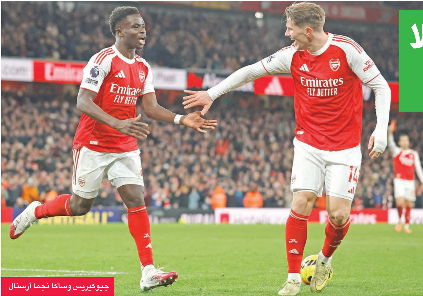
جيو كيريس وساكاجا نجما أرسنال