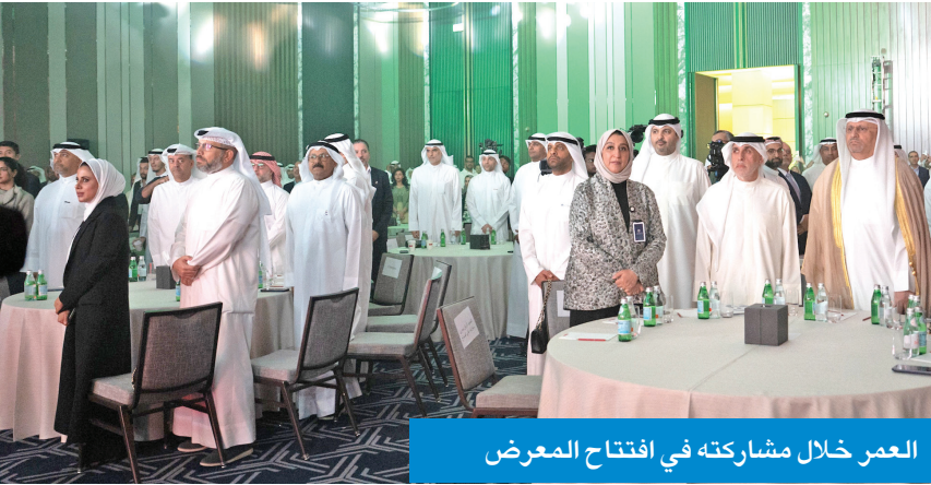
العمر خلال مشاركته في افتتاح المعرض

أكد وزير الدولة لشؤون الاتصالات، عمر العمر، أن دولة الكويت تعمل على تطوير منظومتها الرقمية عبر مشاريع مستمرة تستهدف تعزيز البنية التحتية التقنية وتحسين كفاءة الأنظمة وتوسيع الاعتماد على الحلول الرقمية في الجهات الحكومية.