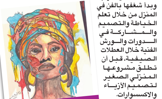
من أعمال الرامزي

وتلقت دعماً من أسرته، وبدأت شغفها بالفن في المنزل من خلال تعلم الخطابة والتصميم والمشاركة في السدورات والورش الفنية خلال العطلات الصيفية، قبل أن تتطرق لمشروعها المنزلي الصغير لتصميم الأزياء والاكسسوارات.