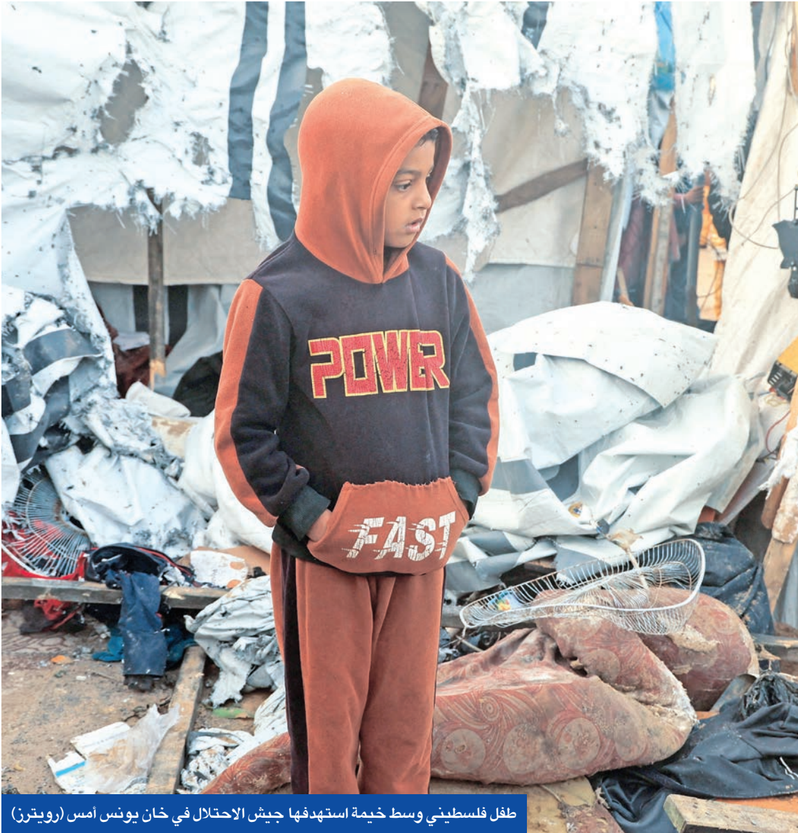
طفل فلسطيني وسط خيمة استهدفتها جيش الاحتلال في خان يونس أمس