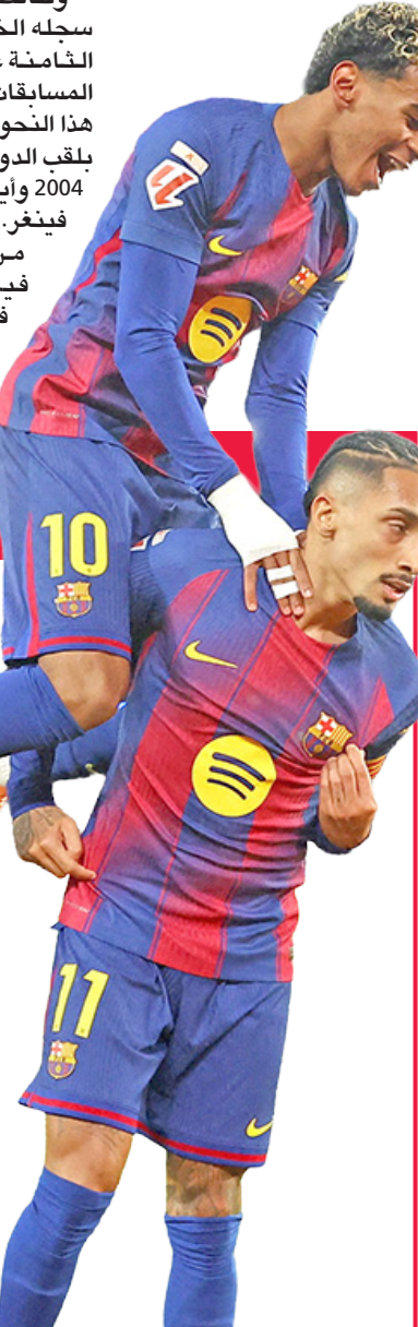
لاعبا برشلونة خلال المباراة الماضية

يسعى فريق برشلونة إلى الحفاظ صدارة الدوري الإسباني لكرة القدم، عندما يحل ضيفا على فريق ريال بيتيس غدا (السبت) في الجولة الخامسة عشرة من المسابقة. ويتصدر برشلونة قمة جدول الترتيب برصيد 37 نقطة بفارق نقطة أمام الريال، ويعلم أن أي تعثر من شأنه أن يبعده عن الصدارة في حالة فوز ريال مدريد على سلتا فيغو في اليوم التالي. وفي المقابل، يحتل فريق ريال بيتيس المركز الخامس برصيد 24 نقطة، ويسعى هو الآخر للفوز بهذه المباراة من أجل الحفاظ على مركزه والاقتراب أكثر من المراكز الأربعة الأولى. ويدخل برشلونة اللقاء منتشيا بفوزه على أتلتيكو مدريد 1-3 الثلاثاء الماضي، في مباراة مقدّمة من الجولة التاسعة عشرة، حيث تم تقديمها بسبب انشغال