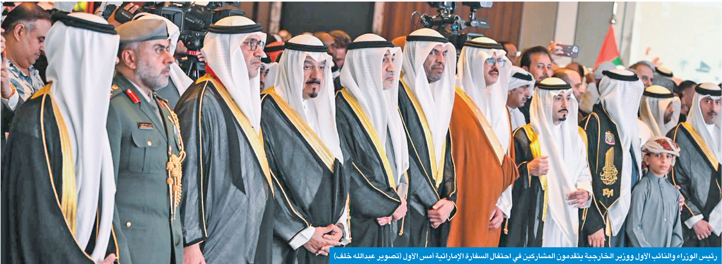
رئيس الوزراء والنائب الأول ووزير الخارجية يتقدمون المشاركين في احتفال السفارة الإماراتية أمس الأول

اليحيا: القمة عكست وحدة الصف... ونواصل العمل المشترك في الملفات الاقتصادية والأمنية والجمركية النيادي: الإمارات لن تنسى مواقف الكويت... وعلاقتنا وفاء متجذر عبر التاريخ ونموذج للأخوة الصادقة