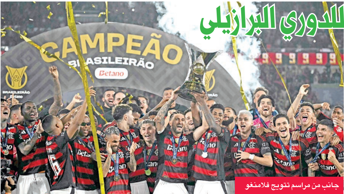
جانب من مراسم تتويج فلامنغو

تحقيق الثنائية المحلية والقارية في موسم واحد. كما بات فلامنغو أول ناد برازيلي يحرز 4 القاب في كوبا ليبرتادوريس المعادلة لمسابقة دوري أبطال أوروبا. وقال مدرب فلامنغو فيليببي لويس مغربا عن «فخره الشديد» خلال المؤتمر الصحفي، «بعد بضع سنوات، سيدرك اللاعبون ما أنجزوه. هم خالدون.» وفي ملعب ماراكانا المكتمل، رفع مشجعو «فلا» لافتة ضخمة كتب عليها «ملك الكؤوس» احتفالاً باللقب الجديد. وسجل لينو (25 عاما) المنضم إلى فلامنغو هذا الموسم قادما من أتلتيكو مدريد الإسباني مقابل مبلغ قياسي بلغ 31.6 مليون يورو، هدف الفوز في الدقيقة 38 بعد تمريرة ببينة من الكولومبي خورخي كاراسكال.