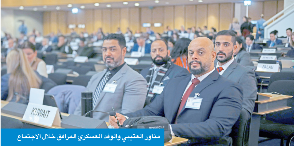
مناور العتيبي والوفد العسكري المرافق خلال الاجتماع

ويرأس العتيبي وفد وزارة الدفاع إلى الاجتماع، الذي يضم كذلك كلا من المقدم الركن نواف العلي، والمقدم عبدالله العجمي، والرائد عبدالعزيز