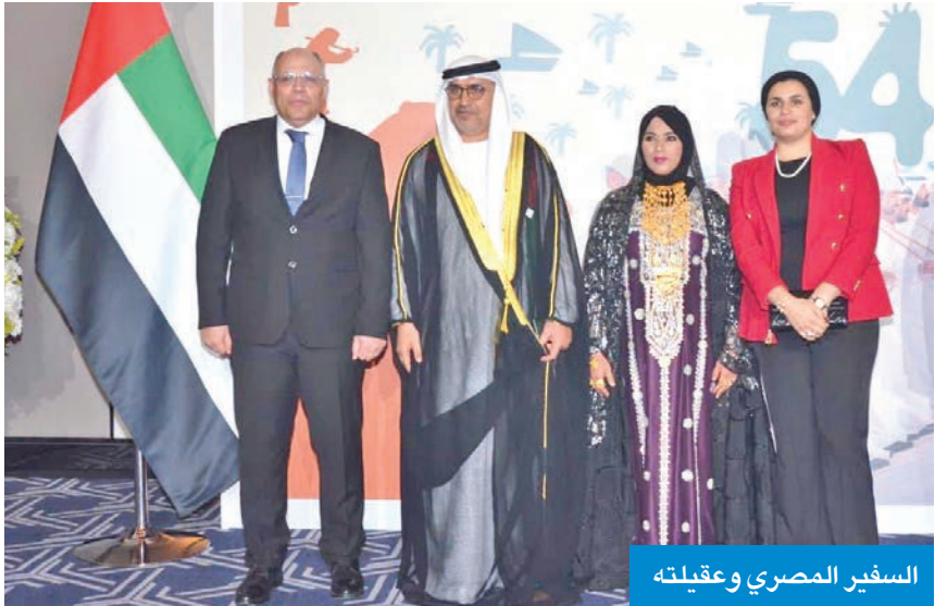
السفير المصري وعقيلته