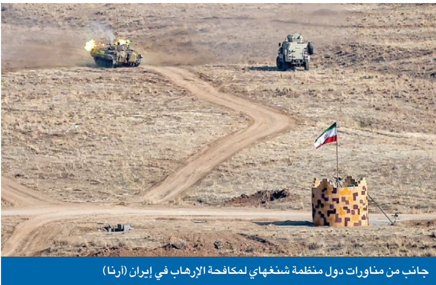
جانب من مناورات دول منظمة شنغهاي لمكافة الإرهاب في إيران

اعتبر ما تضمنه البيان الختامي عن حقل الدرة والجزر الإماراتية ادعاءات غير بناءة! أكد أن دور الجيران تعزيز الأمن لا اللعب بالخطوط الحمراء للأمة الإيرانية