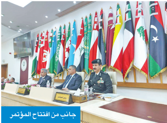
جانب من افتتاح المؤتمر