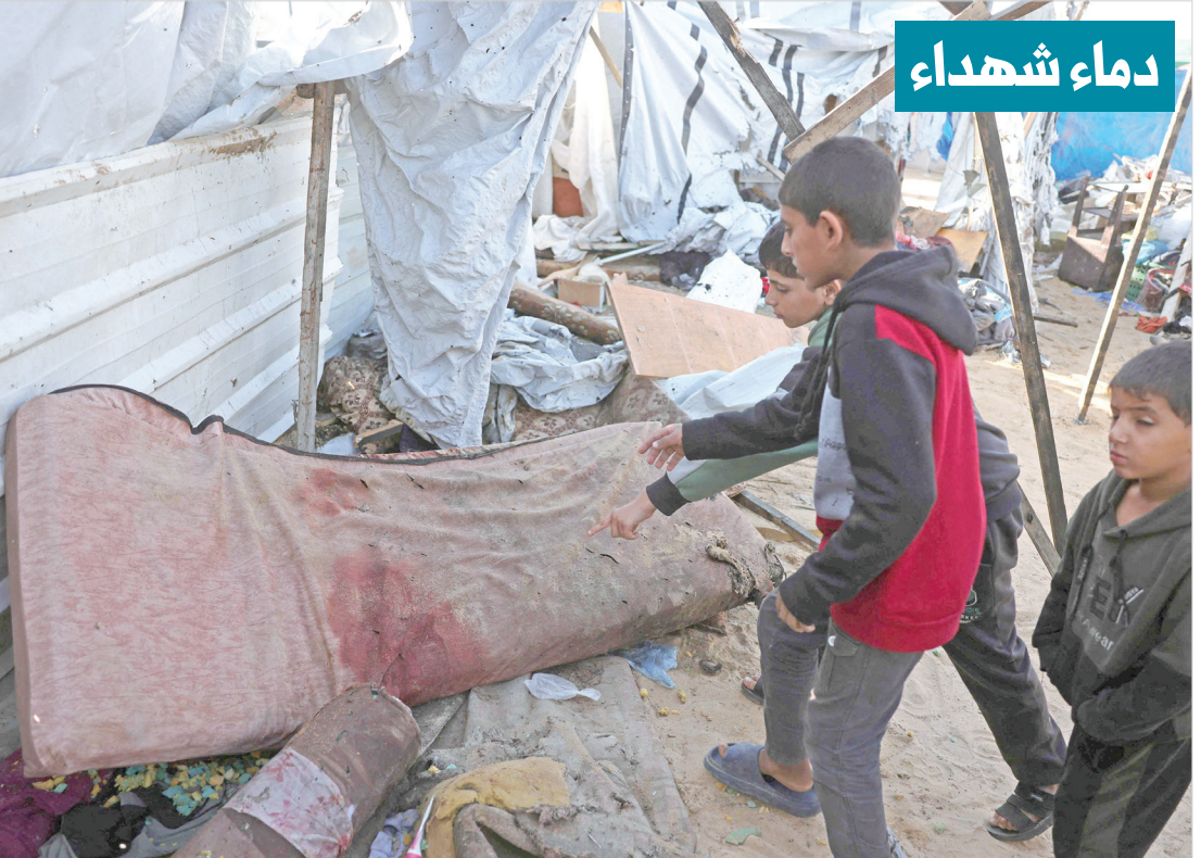
فراش ملتح بالدماء في الموقع الذي استشهد فيه فلسطينيون في 3 ديسمبر بغارة إسرائيلية في خان يونس جنوب قطاع غزة