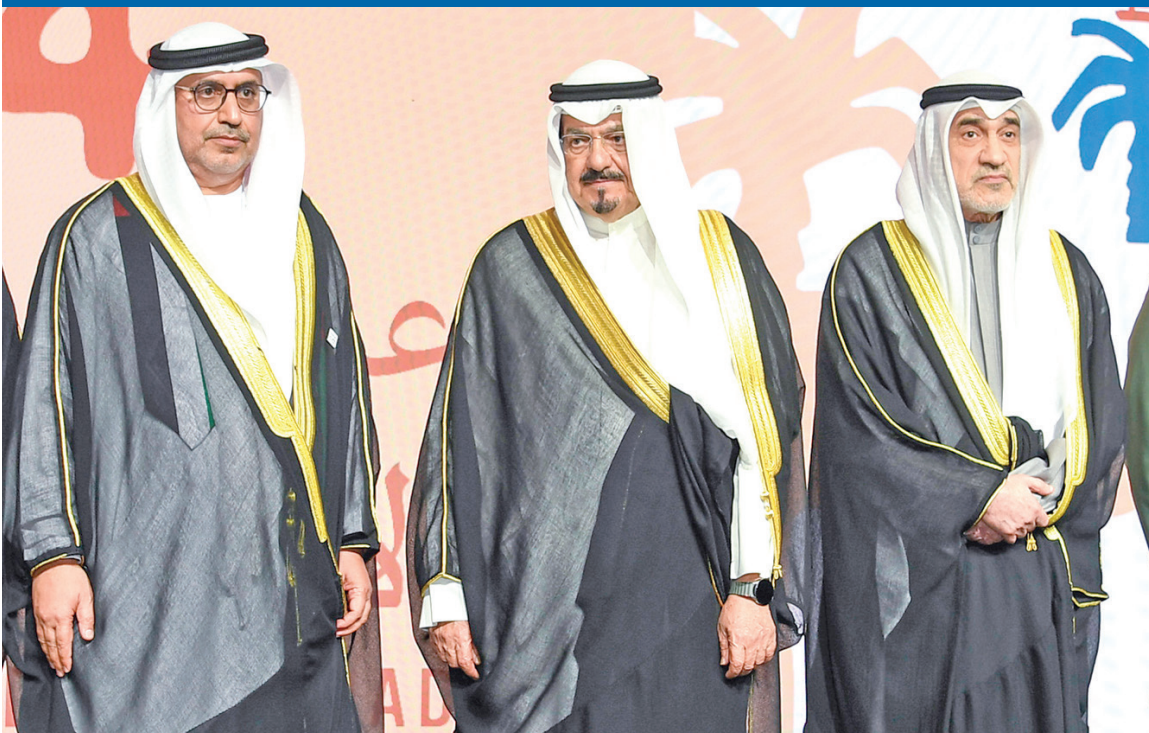
العدالله متوسطاً اليوسف والسفير الإماراتي في حفل السفارة أمس الأول

خلال ترؤسها اجتماع اللجنة الوزارية لمتابعة الموقف التنفيذي للمشروعات الكبرى في البلاد، نقلت وزيرة الأشغال العامة د. نورة المشعان إلى اللجنة توجيهات القيادة السياسية العليا بضرورة متابعة جميع تفاصيل تلك المشروعات، والعمل على تسريع إجراءاتها وخطواتها التنفيذية بالتنسيق مع الجهات الحكومية ونظيراتها في دول العالم. وبحث الاجتماع رقم 37 آخر مستجدات تنفيذ المشاريع التنموية الكبرى، التي تضمنتها مذكرات التفاهم الموقعة بين حكومة دولة الكويت والحكومات الشقيقة والصديقة، لاسيما التعاون في مشروع ميناء مبارك الكبير، وفي مجال المنظومة الكهربائية وتطوير الطاقة المتجددة، وبشأن المنظومة الخضراء المنخفضة الكربون، لإعادة تدوير النفايات، فضلاً عن التعاون في مجال التطوير الإسكاني، والبنية التحتية البيئية لمحطات معالجة مياه الصرف الصحي، وفي مجال المناطق الحرة