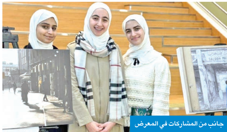
جانب من المشاركات في المعرض