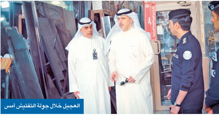
العجيل خلال جولة التفتيش أمس

• أكد لـ الجريدة. أننا نعالج تراكمات سنوات من التسبب... والقانون سيُطبّق على الجميع