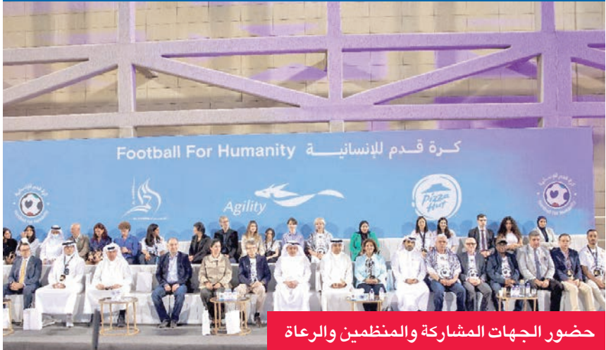
حضور الجهات المشاركة والمنظمين والرعاة

اختتم القطاع الخاص الكويتي، ممثلاً بشركات «الحمراء العقارية» و«مخازن» (أجياليتي للمخازن العمومية سابقاً) ومجموعة كوت الغذائية – وكيل علامة «بيتزا هت» في الكويت – رعايته الناجحة لمبادرة «كرة قدم للإنسانية»، وهي مبادرة أممية دبلوماسية رياضية أقيمت تحت رعاية وزير الخارجية، وبالشراكة مع الأمم المتحدة، وبدعم من الاتحاد الكويتي لكرة القدم وبرنامج الفيفا لتنمية المواهب، وبمشاركة سفارات 11 دولة، وتهدف إلى توظيف الشعبية العالمية لكرة القدم في خدمة الدبلوماسية الإنسانية، وتقديم الدعم للأطفال المتأثرين بالأزمات، حيث خصصت نسخة هذا العام لأطفال فلسطين.