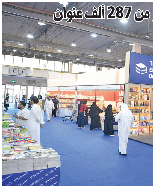
611 دار نشر من 33 دولة شاركت بأكثر من 287 ألف عنوان

ونداوت ومحاضرات وجلسات حوارية أقيمت في الرواق الثقافي والمقهى الثقافي وجناح الطفل. وجاء المعرض هذا العام تزامناً مع احتفاء دولة الكويت بوصفها عاصمة الثقافة والإعلام العربي لعام 2025، وكانت سلطنة عمان هي ضيف الشرف لهذا العام، تكريماً لدورها الثقافي.