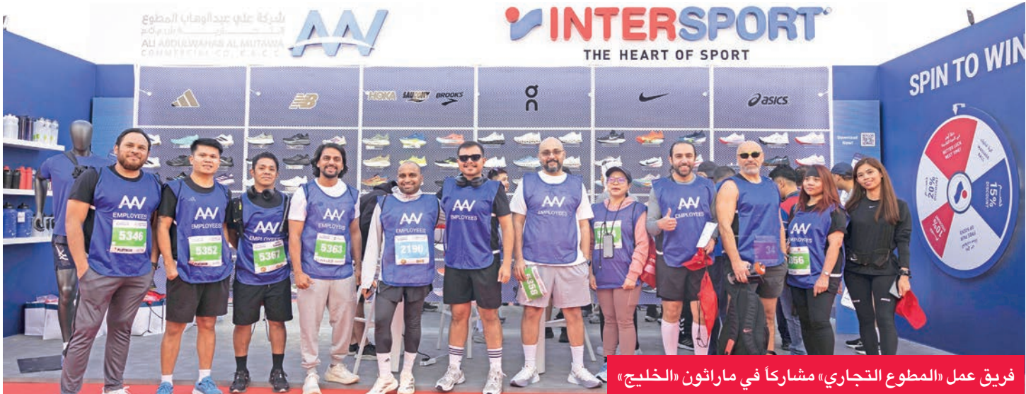
فريق عمل «المطوع التجاري» مشاركاً في ماراثون «الخليج»

قدراتهم والفوز بجوائز قيمة. فيما أنت مشاركة «جو أند ذا جوس» عبر Joe Tour من خلال بيع العصائر والمشروبات والمأكولات الخفيفة والصحية، حيث قدمت عصيراً خاصاً في الماراثون.