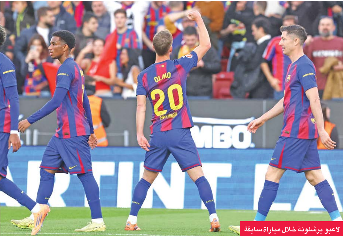
لاعبو برشلونة خلال مباراة سابقة

يحل أتلتيكو مدريد ضيفاً على برشلونة، اليوم، في مباراة مقدّمة من المرحلة التاسعة عشرة من الدوري الإسباني لكرة القدم.