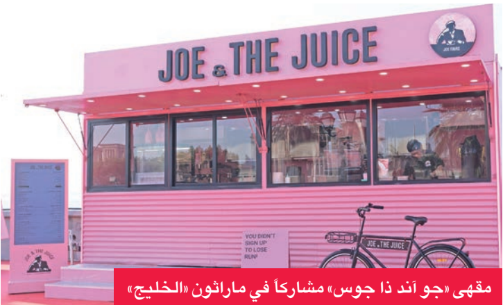
مقهى «جو أند ذا جوس» مشاركاً في ماراثون «الخليج»