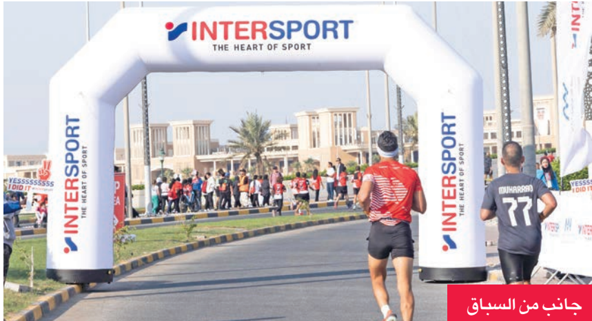
جانب من السباق

تستمر «المطوع التجارية» بدعمها المستمر للمبادرات والأنشطة المجتمعية والرياضية التي من شأنها أن تشجع الأفراد على اتباع نمط حياة صحي ونشط، وتعزز الصحة العامة في الكويت.