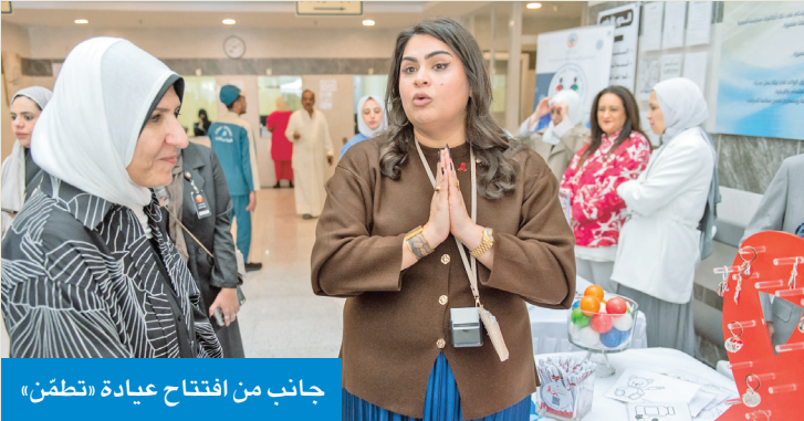
جانب من افتتاح عيادة «تطمّن»

افتتحت وزارة الصحة، ممثلة بمنطقة حولي الصحية، أمس، عيادة «تطمّن» للفحص الطوعي والمشورة في مركز سلوى التخصصي، بهدف تعزيز الوصول لخدمات الفحص المبكر بسرّية تامة واحترام كامل لخصوصية المراجع كجزء من تطوير منظومة الرعاية الوقائية في الكويت.