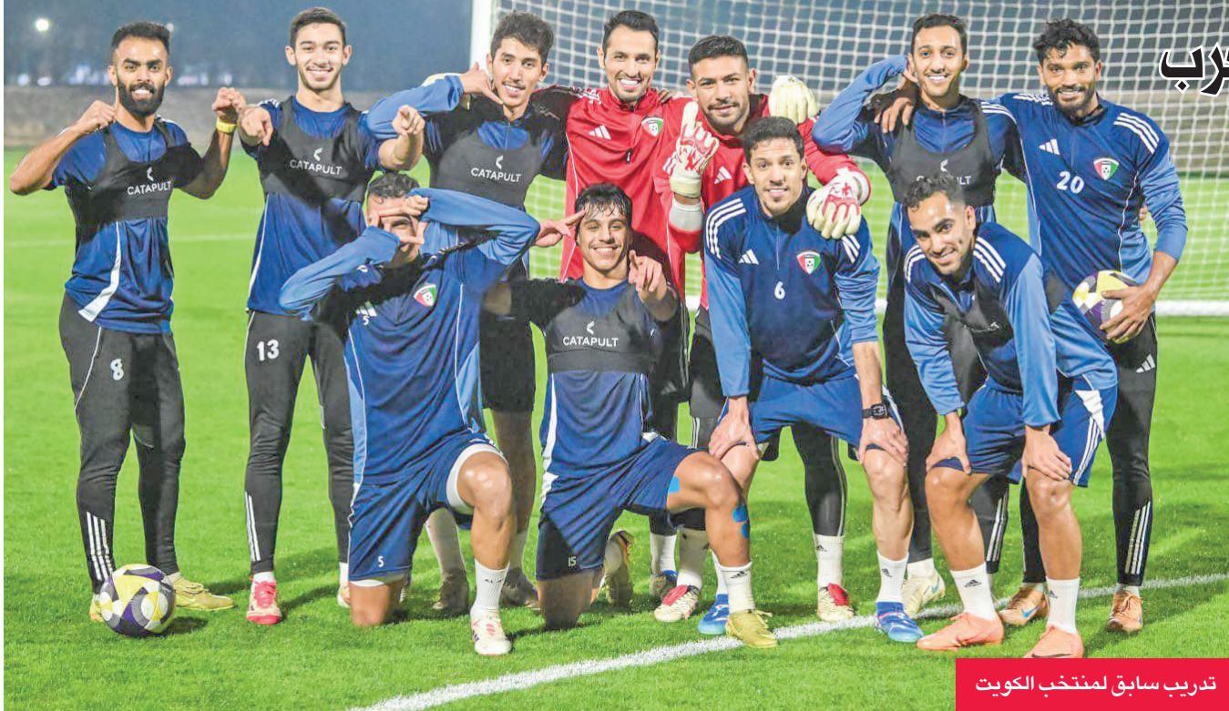
تدريب سابق لمنتخب الكويت

يستهل منتخب الكويت الأول لكرة القدم منافساته في بطولة كأس العرب قطر 2025، بمواجهة المنتخب المصري الساعة 5:30 على استاد لوسيل، في الجولة الأولى من منافسات المجموعة الثالثة. ويلتقي منتخب المغرب وجزر القمر الساعة 3:00 على استاد خليفة الدولي، ومنتخبا السعودية مع عمان الساعة 8:00 مساء على استاد المدينة التعليمية، في الجولة الأولى من منافسات المجموعة الثانية للبطولة. وكان الأزرق تاهل للبطولة بعد فوزه على المنتخب الموريتاني بهدفين دون رد، في المباراة التي جمعتهما الثلاثاء الماضي على استاد جاسم بن حمد بنادي السد، ضمن منافسات الدور التمهيدي الذي أقيم من مواجهة واحدة. واستعد الأزرق للبطولة من خلال معسكر في الإمارات، خاض خلاله مباراة ودية، حيث تعادل مع منتخب سورية 2-2، ثم