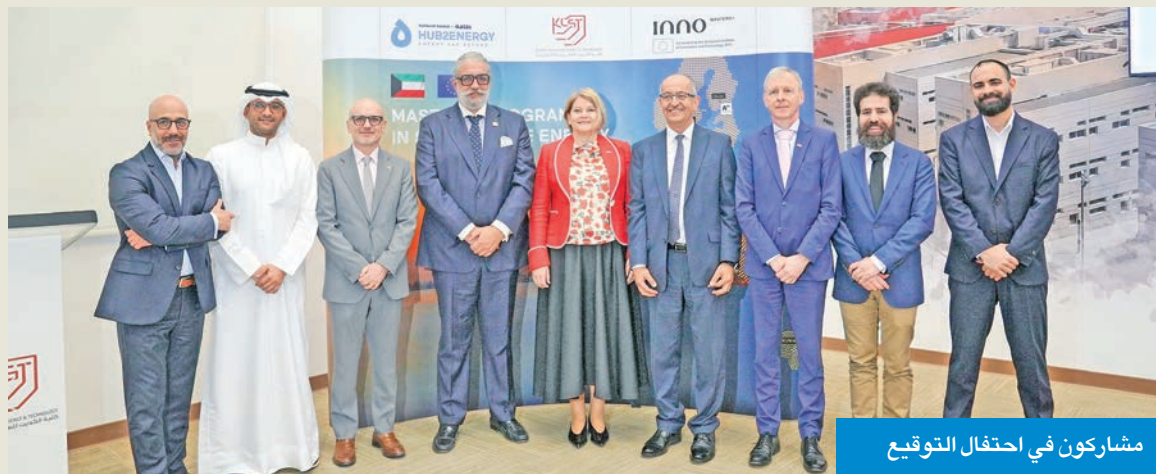
مشاركون في احتفال التوقيع

من جانبه، قال الشريك المؤسس الرئيس التنفيذي لـ «Hub2Energy»