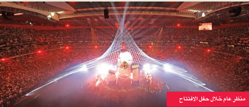
منظر عام خلال حفل الافتتاح

واستهل الحفل بلوحة درامية بعنوان «حيث انطلقت الحكاية»، جسدت اجتماع القبائل العربية قديماً لبناء صرح موحد يتحول مع الزمن إلى منارة للعلم والحضارة، في حين تدرجت الرسائل البصرية لتطرح تساؤلاً رمزياً حول قدرة الشعوب العربية على الحفاظ على هذا الإرث وتجديده.