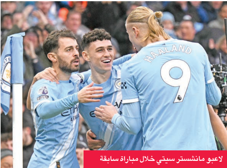
لاعبو مانشستر سيتي خلال مباراة سابقة

بنتيجة إيجابية أمام فريق المدرب الإسباني جوسيب غوارديولا، وتشهد المرحلة أيضاً العديد من اللقاءات المهمة الأخرى، حيث يلتقي نيوكاسل مع توتنهام، فيما يلعب بورنموث مع إيفرتون.