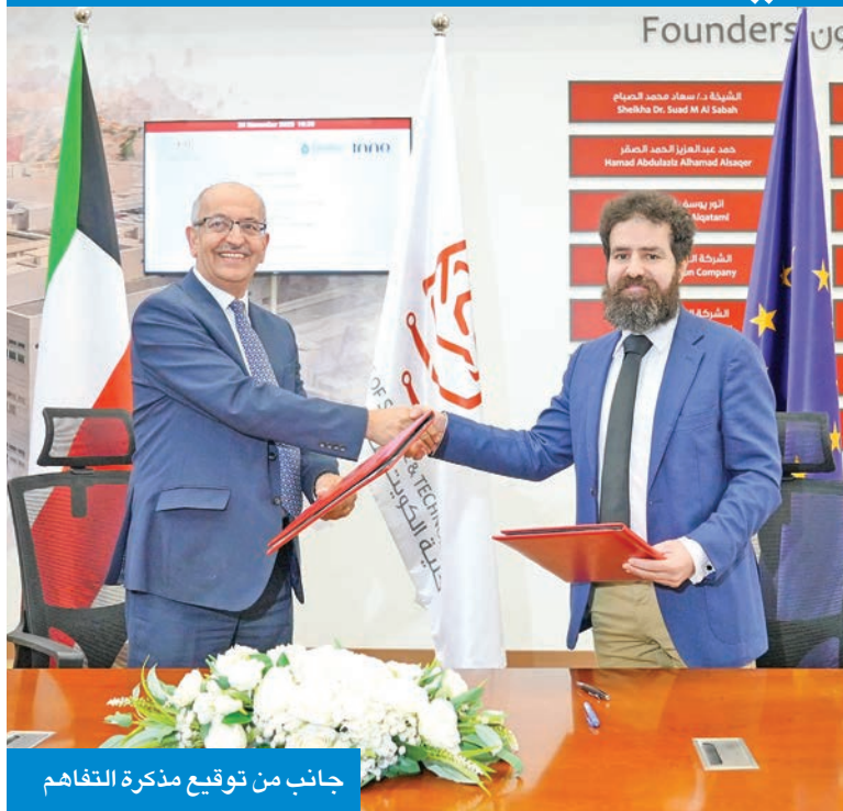
جانب من توقيع مذكرة التفاهم

بالشراكة مع المعهد الأوروبي للابتكار والتكنولوجيا بـ 10 درجات ماجستير مزدوجة عبر نخبة من الجامعات الأوروبية، فضلاً عن مساهمته في إطلاق أكثر من 500 شركة ناشئة في مجال التكنولوجيا النظيفة في أوروبا.