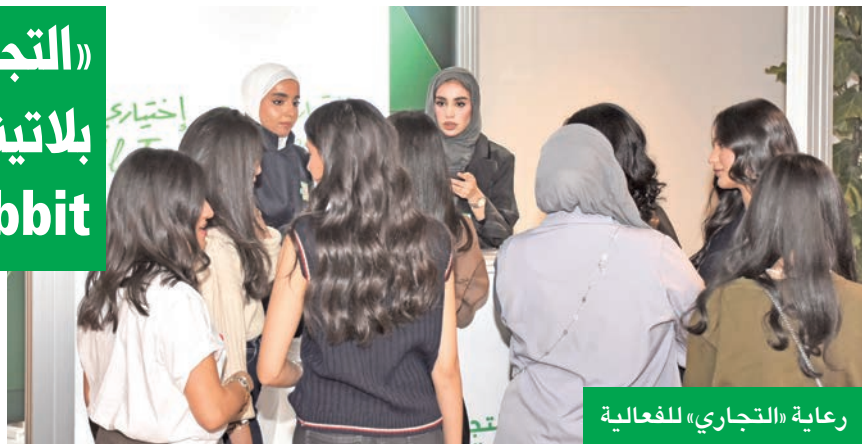
رعاية «التجاري» للفعالية

ويؤكد البنك التجاري الكويتي، من خلال هذه الرعاية، استمراره في دعم الفعاليات التي تساهم في تمكين الشباب وتعزيز دورهم الهام، مع مواصلة جهوده في رعاية الأنشطة الشبابية التي تخلق تجارب إيجابية تنوع بالفائدة على الجيل القادم.