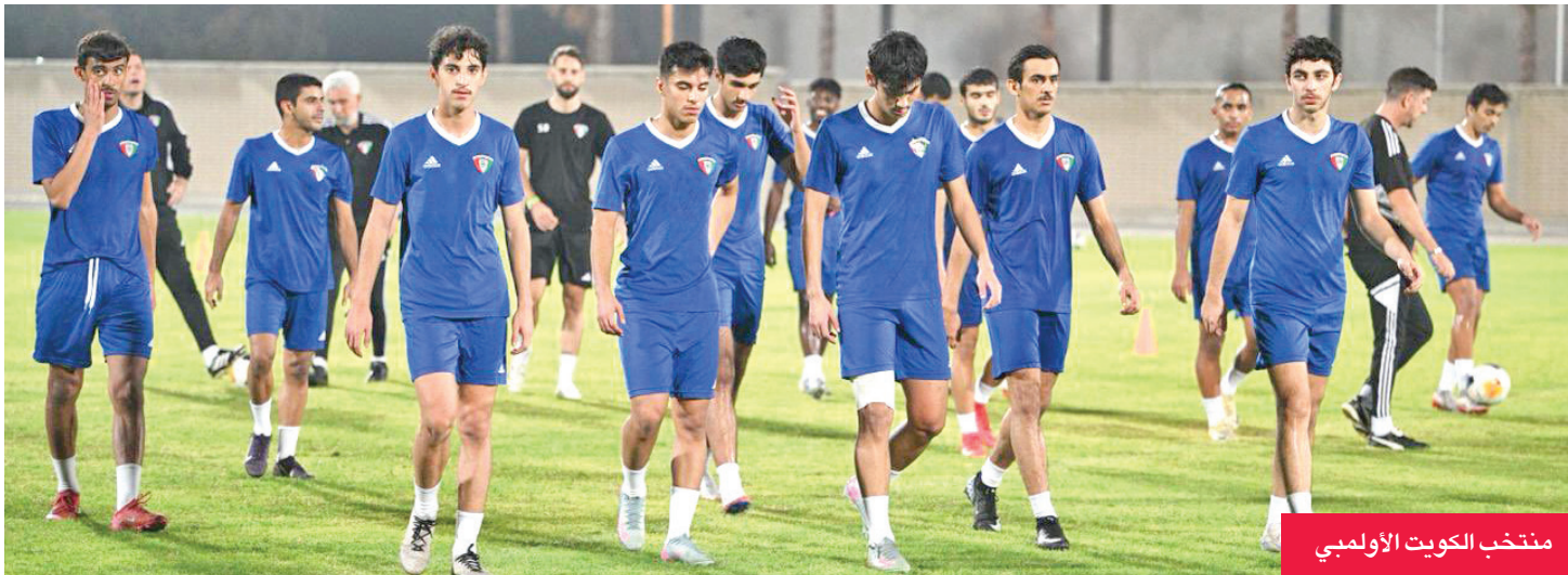
منتخب الكويت الأولمبي

أمس الأول (الأحد) مباراته التجريبية الخاضعة، والتي التقى فيها النضر الإماراتي، والتي خسرها «الأزرق» بهدف من دون رد. وكان «الأزرق» واجه في المعسكر ذاته، نادي دبي سيتي، وانتهت المباراة لمصلحته بالفوز بهدف نظيف.