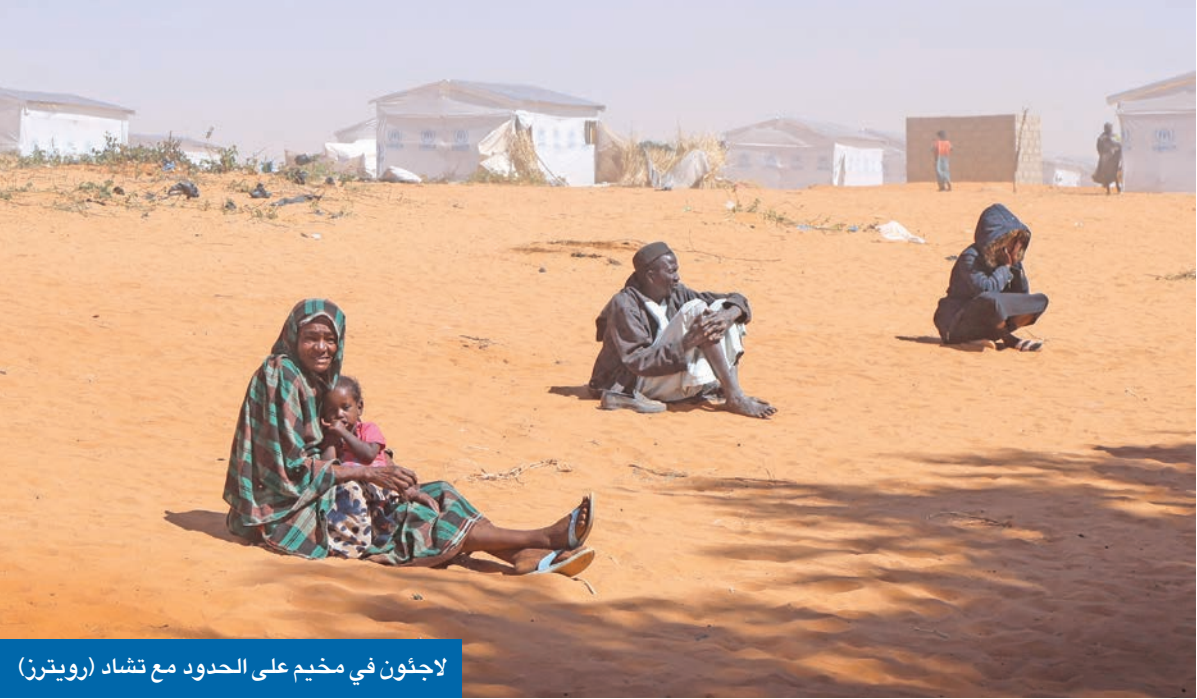
لاجئون في مخيم على الحدود مع تشاد

ازداد عدد المتحدثين باللغة الإسبانية بنسبة 5 في المئة العام الماضي وصولاً إلى 635 مليون متحدث بها، وهي ثالث أكثر اللغات انتشاراً في العالم (من حيث العدد) بعد الصينية (الماندرين) والهندية، ولذا تواجه مخاطر أن تصبح «لغة مشبوهة» في الولايات المتحدة بوصفها تهديدا للهوية الوطنية لكثرة المتحدثين بها. وقال رئيس المعهد الثقافي الإسباني ثربانتيس خلال مؤتمر الأحد على هامش معرض جوادالأكارا الدولي للكتاب، نقلته «إفي»، إن «الإسبانية لغة أغلبية. هناك أكثر من 600 مليون متحدث بها بالعالم، كما أن هناك أكثر من 530 مليوناً الإسبانية هي لغتهم الأم».