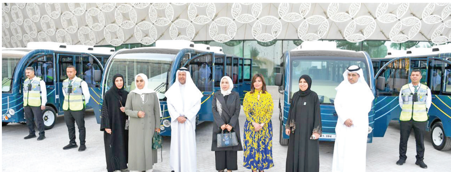
الميلم والناصر ومسؤولو الجامعة خلال تدشين المشروع

من الأمانة العامة للأوقاف. وأضاف أن المشروع يساهم بشكل مباشر وأساسي في الحد من التكدس المروري، ويسهم في نقل الطلبة من نقطة إلى أخرى في زمن قياسي في ظل العوامل الجوية، سواء كانت صيفية أو شتوية، علماً بأن السيارة مكيفة ومغلقة بالكامل.