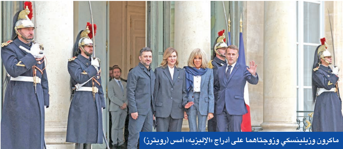
ماكرون وزيلينسكي وزوجتهما على أدراف «الإليزية» أمس

ويتكوف يفاوض بوتين على «الخطة المعدلة» لإنهاء الحرب