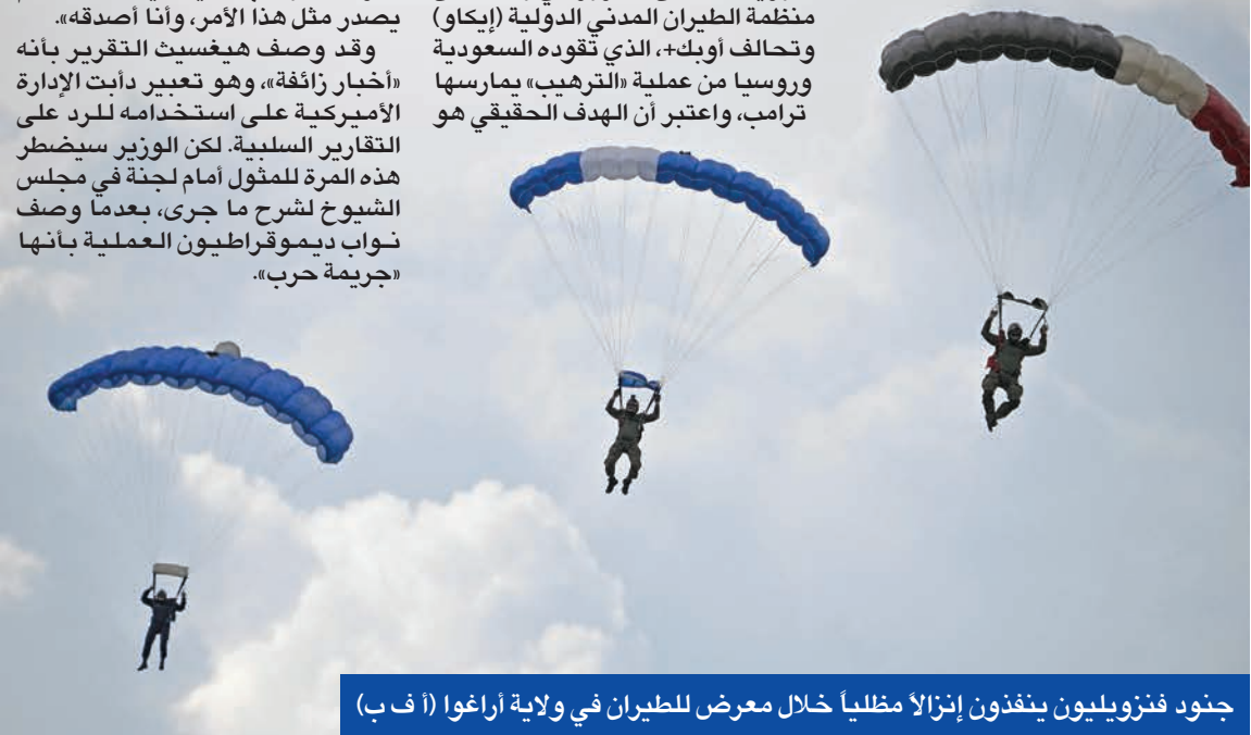
جنود فنزويليون ينفذون إنزالاً مظلياً خلال معرض للطيران في ولاية أراغوا

ووفق صحيفة ميامي هيرالد، فإن ترامب وجّه، خلال المكالمة، إنذاراً نهائياً إلى مادورو لمغادرة فنزويلا