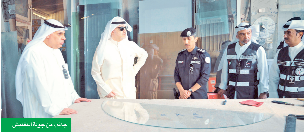
جانب من جولة التفتيش

• ترأس جولة تفتيش بمشاركة جهات حكومية كشفت عن وجود قسائم صناعية مخالفة