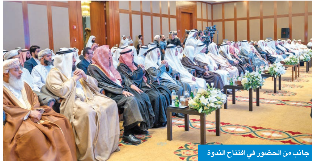
جانب من الحضور في افتتاح الندوة

ناب عن العبدالله في افتتاح الندوة الـ 29 لقضايا الزكاة المعاصرة