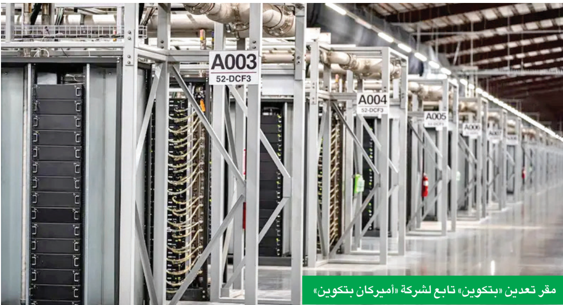
مقر تعدين «بتكوين» تابع لشركة «أميركان بتكوين»

«برشلونة» في مرمى الانتقادات بعد صفقة رعاية مع شركة كريبتو غامضة