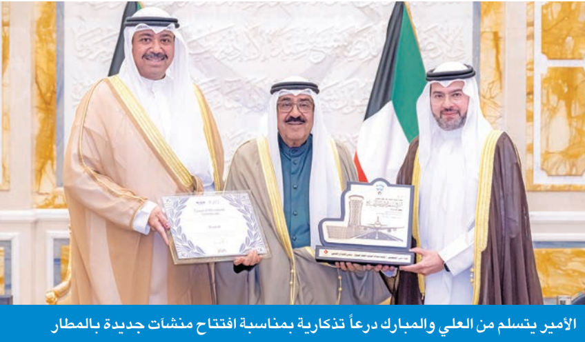
الأمير يتسلم من العلي والمبارك درعاً تذكارية بمناسبة افتتاح منشآت جديدة بالمطار

سموه استقبل ولي العهد والعبدالله واليوسف والعلي وحمود المبارك