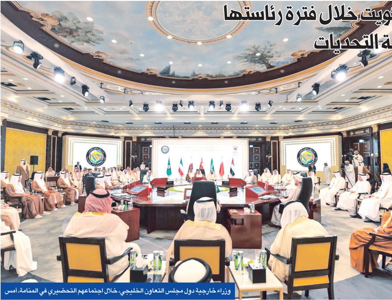
وزراء خارجية دول مجلس التعاون الخليجي، خلال اجتماعهم التحضيري في المنامة، أمس

وتنتائج الاجتماعات المشتركة بين مجلس التعاون وعدد من الدول الصديقة والتكتلات الدولية، والترتيبات الجارية لعقد عدد من القمم والمؤتمرات والحوارات الاستراتيجية بين مجلس التعاون وعدد من الدول الصديقة. كما ناقش المجلس الوزاري تطورات الأوضاع الإقليمية والدولية والرهانة وتداعياتها على الأمن والاستقرار الإقليمي، ومستجدات الأوضاع في عدد من الدول، والجهود التي تبذل لتخفيف حدة التوتر والتصعيد، ودعم جهود