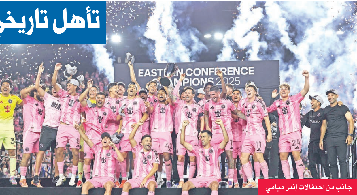
جانب من احتفالات إنتر ميامي

بأنه «ما زال لا يصدق» أنه تمكّن من التسجيل في مباراة بهذه الأهمية. وبذلك التمريرة إلى سيلفيتي، حطّم ميسي الرقم القياسي لأكثر عدد من التمريرات الحاسمة في التاريخ، حيث وصل إلى 405، متجاوزاً بذلك الرقم القياسي الذي كان يحمله فيرنك بوشكاش برصيد 404. وسيحظى إنتر ميامي الآن بأسبوع للراحة والاستعداد للنهائي، الذي سيقام على أرضه في السادس من ديسمبر على ملعب تشيس ستاديو، بمدينة فورت لودرديل، على بُعد 30 كيلومتراً شمال ميامي، بولاية فلوريدا الأميركية. (إفي)