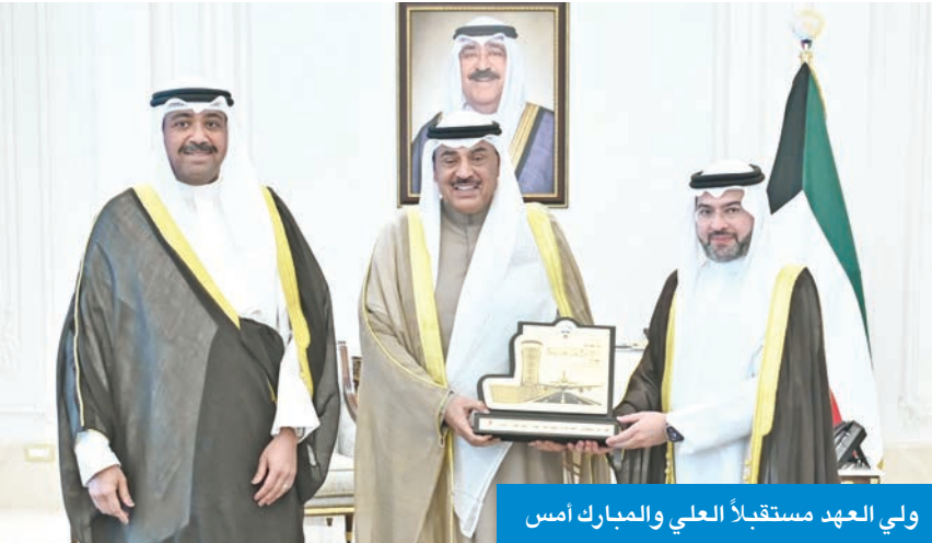
ولي العهد مستقبلاً العلي والمبارك امس

سموه استقبل العبدالله واليوسف وأشاد بالحصول على شهادة أمن الطيران