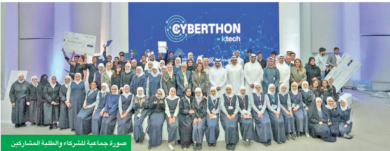
صورة جماعية للشركاء والطلبة المشاركين