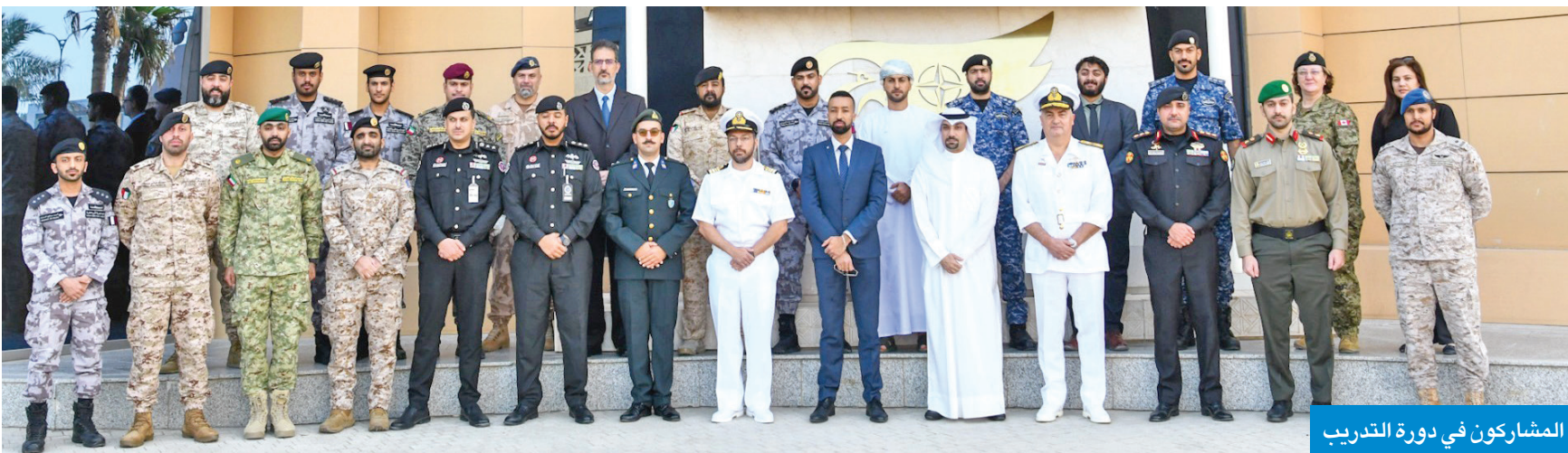
المشاركون في دورة التدريب

المنشآت البحرية وسلامة الخطوط البحرية. وأكد أن تنظيم مثل هذه الدورات التدريبية والورش المتخصصة يأتي في إطار تعزيز العمل المشترك بين منظمة حلف شمال الأطلسي وأعضاء مبادرة إسطنبول للتعاون، مبيّناً أن المركز سيمثل خطة عمله المقبلة لعام 2026.