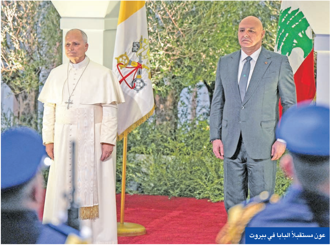
عون مستقبل البابا في بيروت

مجلس الأمن الدولي يوم الخميس المقبل، لتحقيق خرق دبلوماسي عبر الضغط الدولي على إسرائيل لدفعها إلى وقف عملياتها وبدء بالانسحاب من النقاط الخمس التي تحتلها داخل الأراضي اللبنانية، مقابل التزام لبنان الكامل بالعمل على حصر السلاح. وسيكون للبعثة الأممية لقاءات مع الرؤساء الثلاثة، الذين سيؤكدون استمرار عمل لبنان على حصر السلاح والالتزام باتفاق وقف النار، بينما إسرائيل في المدياني، حيث سيستمع إلى شكاوى لبنان من الخروقات الإسرائيلية، إضافة إلى الجدار غير القانوني الذي تقوم القوات الإسرائيلية بتنشيدته. وتعلم الجهات الدولية أن الولايات المتحدة وإسرائيل لا تريدان استمرار عمل قوات «يونيفيل» في جنوب لبنان، أي الإطاحة بالقدر 1701. كما أن إدارة الرئيس الأميركي دونالد ترامب تسعى للوصول إلى اتفاق سلام أو إنهاء حالة الصراع بين لبنان وإسرائيل، وهو تماماً ما تحاول فرضه كذلك على سورية قبل الانتخابات النصفية الأميركية.