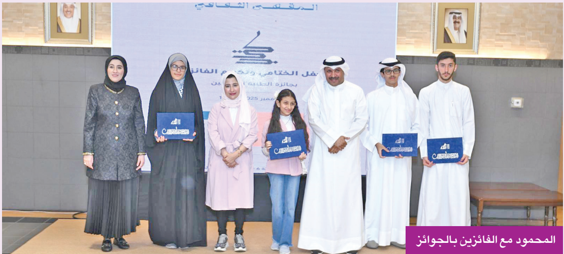
المحمود مع الفائزين بالجوائز