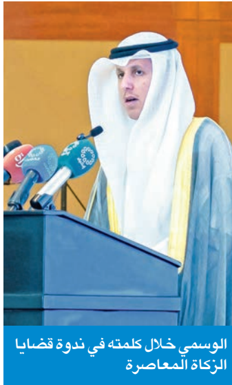
الوطني خلال كلمته في ندوة قضايا الزكاة المعاصرة

قال وزير الشؤون الإسلامية، د. محمد الوسمي، إن الكويت جعلت العمل الخيري والإنساني ركيزة أساسية في سياستها الداخلية والخارجية، من خلال قيادتها الحكيمة وشعبها المعطاء. جاء ذلك في كلمة للوطني في ندوة «العمل الخيري والإنساني ركيزة أساسية في سياستها الداخلية والخارجية، من خلال قيادتها الحكيمة وشعبها المعطاء. عن رئيس مجلس الوزراء سمو الشيخ أحمد العبدالله، في حفل افتتاح «الندوة 29 لقضايا الزكاة المعاصرة»، التي تستمر 3 أيام. وأضاف الوسمي أن الندوة تهدف إلى أن تكون جسراً للتواصل بين أصالة النص الشرعي وواقع العصر المتغير، مؤكداً أن مثل هذه الندوات تمثل استثماراً استراتيجياً في «رأس المال الفكري»، من خلال دعم الجهود الضامنة لبقاء فريضة الزكاة فاعلة ومؤثرة في المجتمع.