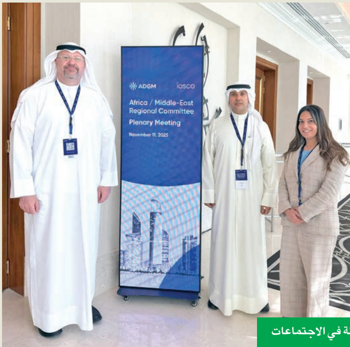
جانب من مشاركة الهيئة في الاجتماعات