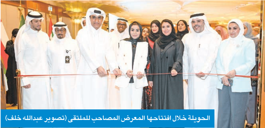
الحويلة خلال افتتاحها المعرض المصاحب للملتقى

الخاص، وفرصة لتوسيع دائرة الاستثمار والشراكات الاقتصادية، عبر تقديم منصات حقيقية للتمويل، والتدريب، والتسويق الرقمي والحلول التقنية، بما يمكن هذه المشاريع من الانتقال من نطاقها المحدود إلى مشاريع رائدة على مستوى الإقليم. وأشار العبيدي إلى أن انعقاد الملتقى في الوقت الحالي يأتي في ظل تزايد الحاجة إلى توفير مسارات تمكين حقيقية للمشاريع المنزلية، التي أصبحت رافداً اقتصادياً مهماً في دول «التعاون»، وعصراً فعالاً في دعم الاستدامة الاجتماعية وتمكين الأسر. وأوضح أن المكتب التنفيذي ينظر إلى الملتقى بوصفه قناة ربط عملية بين أصحاب المشاريع المنزلية والقطاع الاجتماعي في دول «التعاون»، شكره وتقديره للكويت على الاستضافة والتنظيم المتميزين، مؤكداً دعم المكتب التنفيذي لأنشطة وبرامج الوزارة خلال المرحلة الماضية، معتبراً أن فترة رئاسة الكويت للجنة الشؤون الاجتماعية نموذج متميز للدعم والتعاون البناء، يعكس التزاماً راسخاً بدعم العمل الخليجي المشترك وتعزيز التكامل بين دول المجلس.