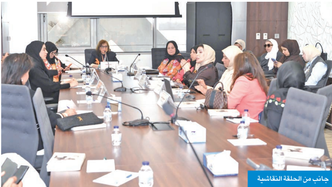
جانب من الحلقة النقاشية

القعود: ضرورة الدفع نحو تشريعات أكثر فاعلية لضمان بيئة آمنة للنساء