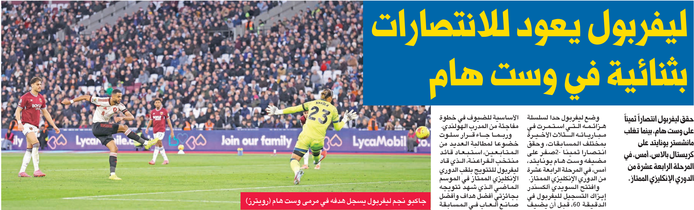
حاكبو نجم ليفربول يسجل هدفه في مرمى وست هام