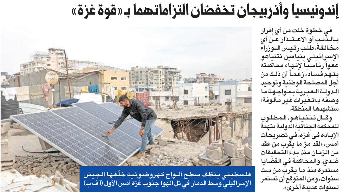
فلسطيني يخلط سطح الواح كهروضوئية خلفها الجيش الإسرائيلي وسط الدمار في تل الهوا جنوب غزة أمس الأول