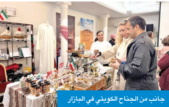
جانب من الجناح الكويتي في البازار