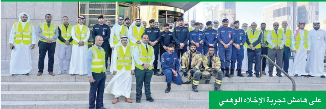
على هامش تجربة الإخلاء الوهمي

الرئيسي وداخل فروعه، إلى جانب تحديد نقاط التجمّع وممرات الطوارئ، وتدريب الموظفين على الإسعافات الأولية، وغيرها من الخطوات الأساسية التي تتخذها لضمان سلامة المجمع. ويحرص البنك على التعاون مع مختلف الجهات والمؤسسات الحكومية بشكل مستمر لتطبيق السياسات والإجراءات التي تضمن صحة وسلامة الموظفين في جميع الحالات، ضمن التزامه بوضع العنصر البشري في مقدمة أولوياته.