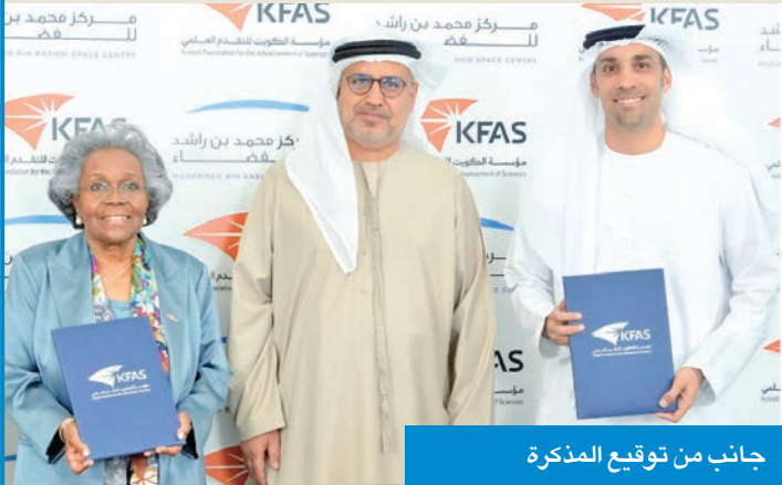
جانب من توقيع المذكرة

لتعزيز جهود الكويت في قطاع الفضاء وتطوير مشاريع تقنية مشتركة