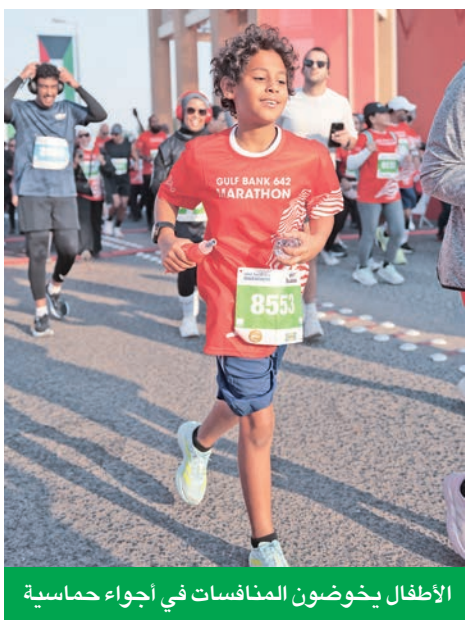
الأطفال يخوضون المنافسات في أجواء حماسية