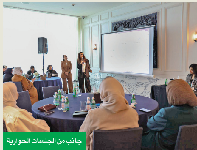
جانب من الجلسات الحوارية

البرنامج شهد هذا العام عملية تطوير شاملة ومتكاملة لتحسين التجربة التعليمية الجاسم