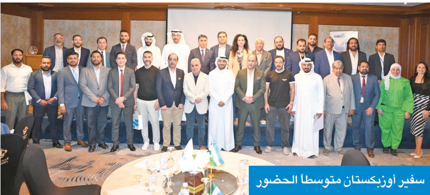
سفير أوزبكستان متوسطا الحضور