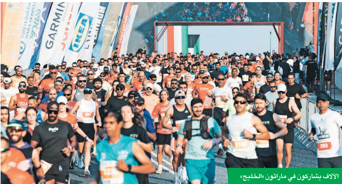
الآلاف يشاركون في ماراثون «الخليج»

حصل بنك الخليج على جائزة أكبر شركة في عدد الموظفين الذين شاركوا في النسخة الحادية عشرة من الماراثون، بعدد 615 موظفاً.