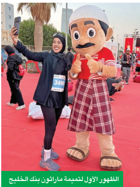
الظهور الأول لتميمة ماراثون بنك الخليج