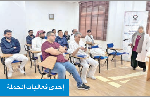
إحدى فعاليات الحملة

أطلقت الحملة الوطنية للتوعية بمرض السرطان (كان) حملة التوعية بسرطان البروستاتا تحت شعار «صحتك تستحق الاهتمام»، تزامناً مع نوفمبر، الشهر العالمي للتوعية بهذا المرض، بالتعاون مع الرابطة الكويتية لراحة المسالك البولية.