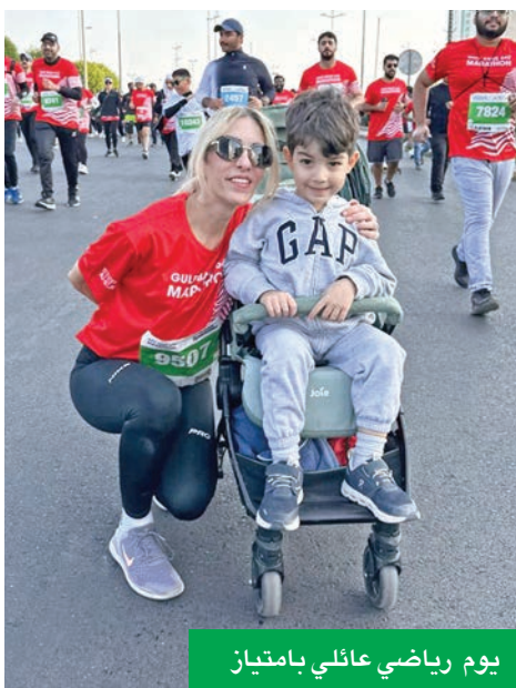
يوم رياضي عائلي بامتياز