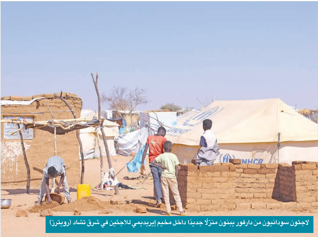
لاجئون سودانيون من دارفور يبنون منزلاً جديداً داخل مخيم إيريديمي للاجئين في شرق تشاد