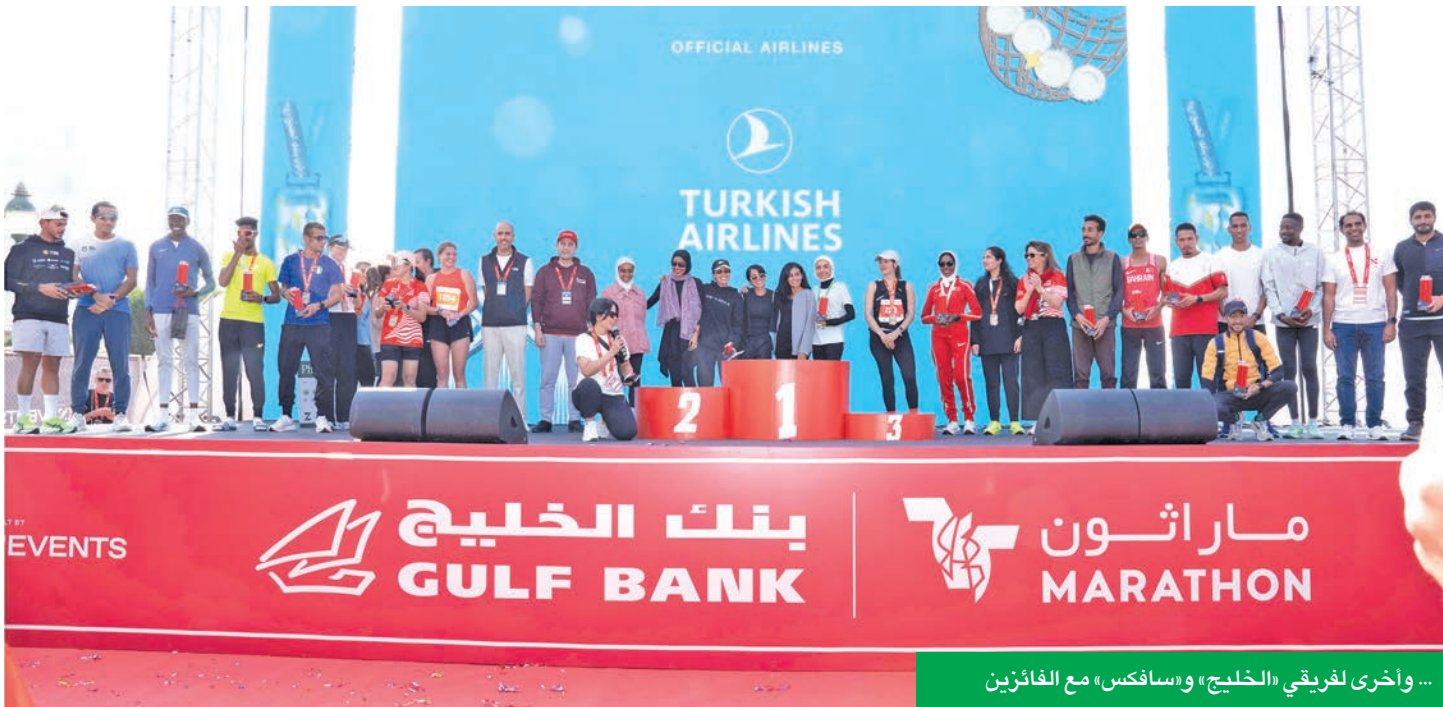
... وأخرى لفرقي «الخليج» و«سافكس» مع الفائزين

الماراثون الأول والوحيد في الكويت المصنّف عالمياً... ومدرج على منصة Visit Kuwait