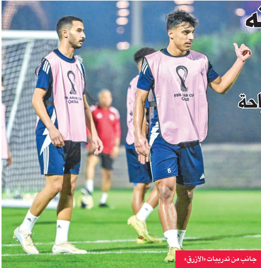
جانب من تدريبات «الأزرق»

التدريبات الاستشفائية للاعبين، مبيناً أنه أقام، كالعادة، عيادة طبية في مقر إقامة الوفد بالدوحة، لمتابعة حالة اللاعبين أولاً بأول، سواء قبل أو بعد التدريبات والمباريات.