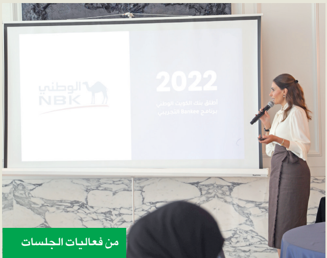
من فعاليات الجلسات