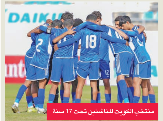
منتخب الكويت للناشئين تحت 17 سنة