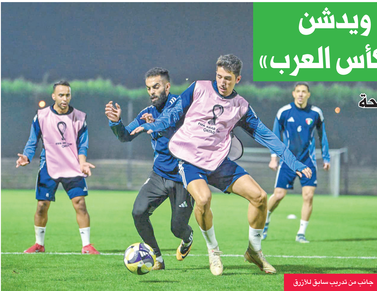
جانب من تدريب سابق للأزرق