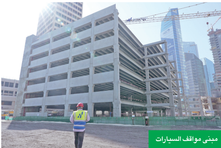
مبنى مواقف السيارات