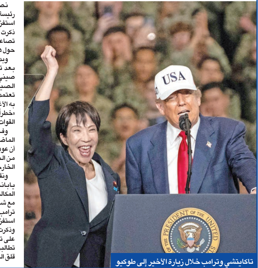
تاكايتشي وترامب خلال زيارة الأخير إلى طوكيو

ونقلت «ول ستريت جورنال» عن مسؤولين يابانيين ومسؤول أميركي مطلعين على المكالمة أنه في اليوم نفسه الذي تحدّث ترامب مع شي، الذي كان غاضباً من اليابان، «رتّب ترامب مكالمة مع تاكايتشي، ونصحها بعدم استفزاز بكين بشأن مسألة سيادة الجزيرة» وذكرت الصحيفة أن ترامب رغم ذلك «لم يضغط على تاكايتشي للتراجع عن تعليقاتها»، كما تطالبها الصين، غير أن الرسالة الأميركية أثارت قلق المسؤولين اليابانيين، لاسيما أن ترامب