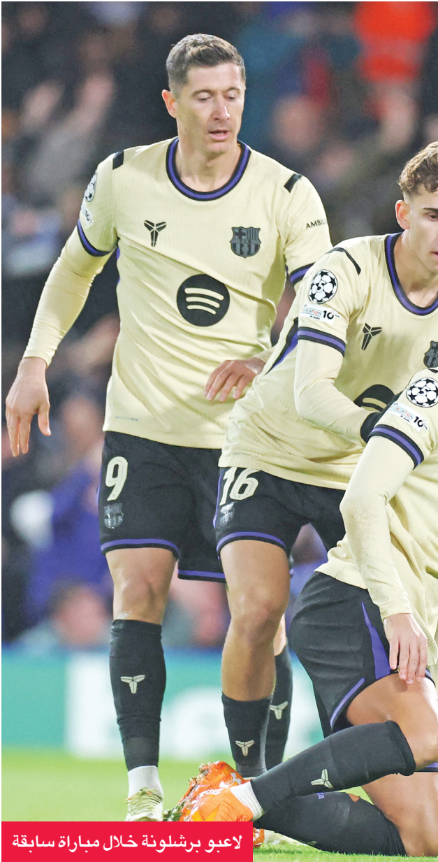
لاعبو برشلونة خلال مباراة سابقة