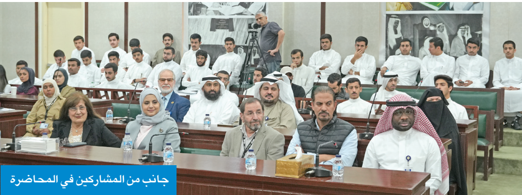
جانب من المشاركين في المحاضرة

مفهوم الصفр اللغوي الذي يعني: نظام الّية عمل الدماغ لإنتاج اللغة، وكيف أنه يُعدّ اكتشافاً يُشابه في أهميته اكتشاف الصفр الرياضي، فمن الصفр الرياضي يبدأ العدّ إلى ما لا نهاية من الأعداد سلباً أو إيجاباً، ومن مرحلة الصفр اللغوي تُؤلّف ما لا نهاية من الجُمَل في النصوص المختلفة، وكلّها