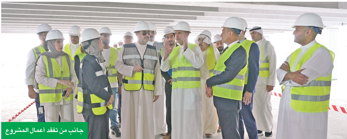
جانب من تفقد أعمال المشروع

الصقر: خطوة نوعية تجسد التزام البنك بدعم رؤية الكويت التنموية عبر مبادرات تواكب أعلى معايير الاستدامة