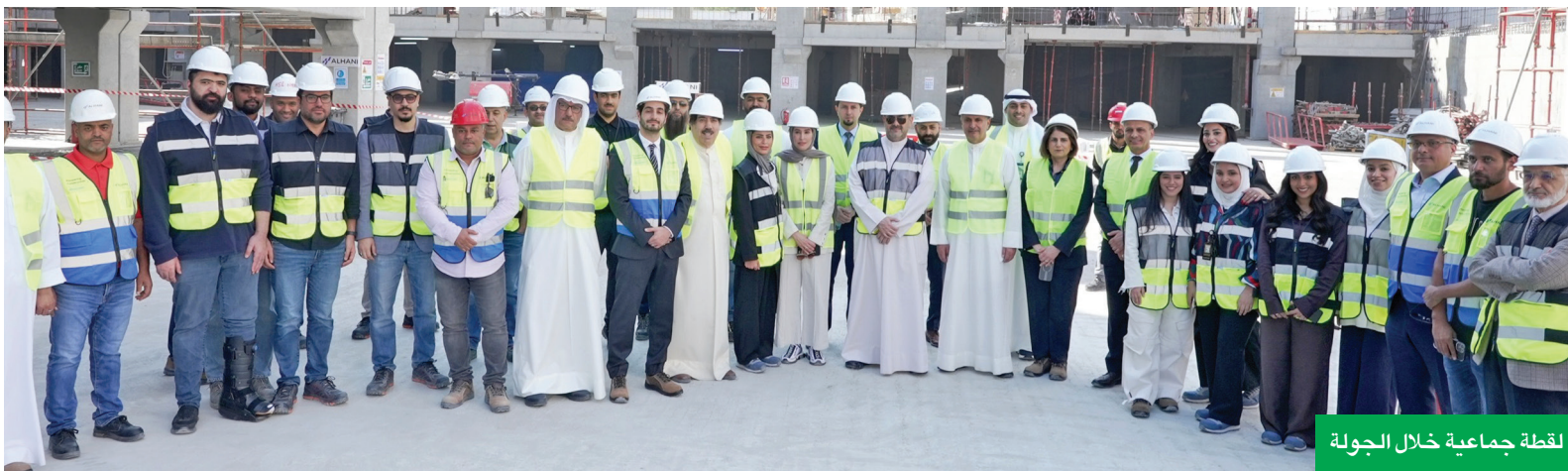
لقطة جماعية خلال الجولة