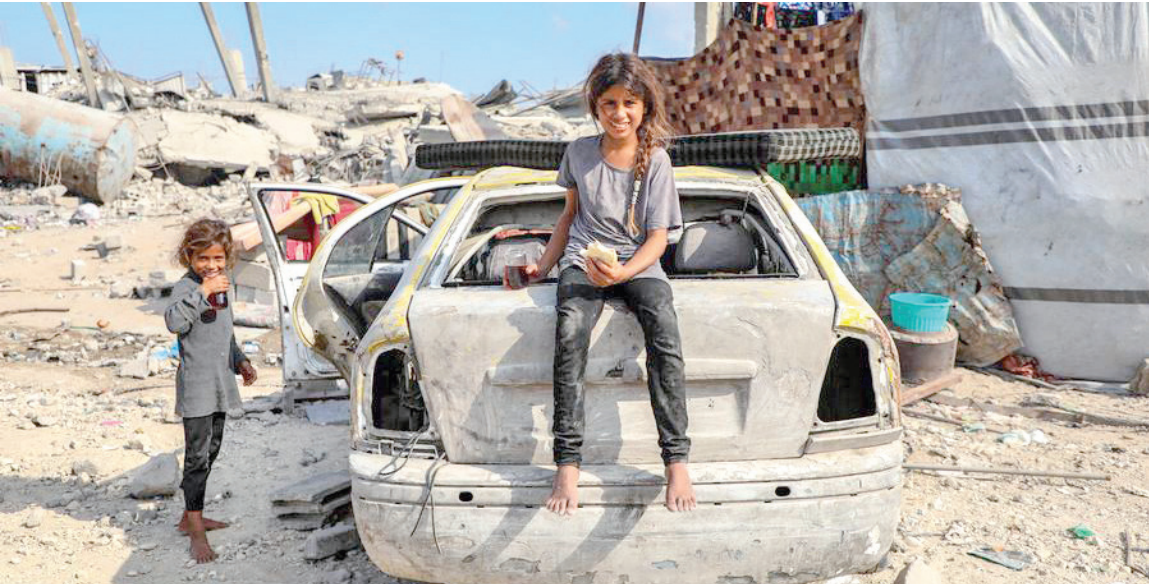
طفلتان في مخيم جباليا شمال غزة الأثنتين الماضي

بعد نحو أسبوع من مهاجمة رئيس الوزراء الإسرائيلي بنيامين نتانياهو للرئيس السوري المؤقت أحمد الشرع بأنه «بدأ يفعل كل ما لن تقبله» الدولة العبرية، عقب عودة الأخير من زيارته التاريخية إلى البيت الأبيض، استبعد وزير الدفاع يسرائيل كاتس أن تكون بلده على طريق سلام مع دمشق، محذراً من أن جماعات مسلحة عاملة على الأراضي السورية تستعد لاجتياح الجولان السوري المحتل.