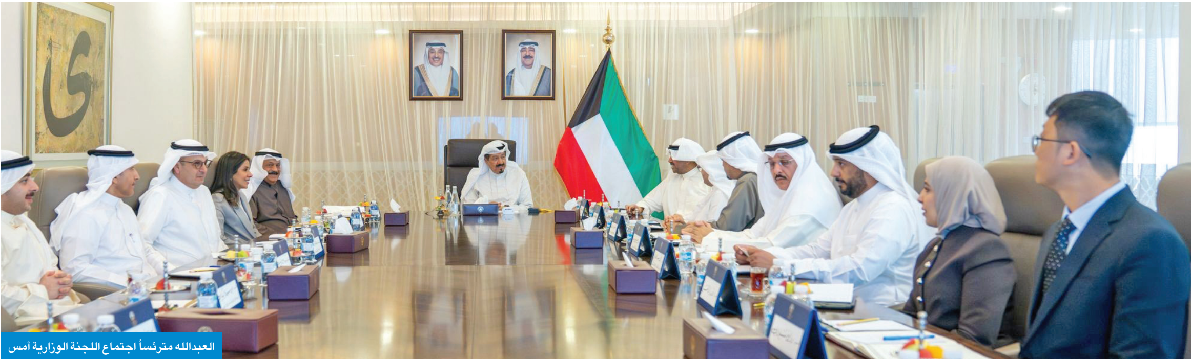
العدالله مرفساً اجتماع اللجنة الوزارية أمس

سموه طالب بإطلاق المزيد من المشاريع الرائدة... واستمرار تحقيق الإنجازات الوطنية