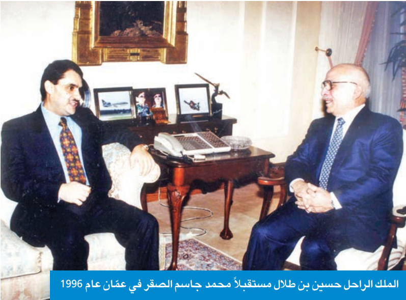
الملك الراحل حسين بن طلال مستقبلاً محمد جاسم الصقر في عمّان عام 1996

(يرحمه الله) في منطقة السرة لاطمئنان عليه، وفور مغادرتنا الفندق - ونحن بجانب محلات أشرف - وجدّث الجيش الشعبي العراقي عند أول نقطة تفتيش فاستوقفنا الجندي، وقال: إلى أين؟ فقال الأخ جهاد له: سوف نذهب ونحضر لكم الأكل، ووضع الرشاش علينا مهدداً، وبعدها سمحوا لنا بالمرور، وخرجنا من المنطقة، وكان الأخ جهاد يسوق بسرعة يحاول أن يخطئ نقاط التفتيش عبر الشوارع الداخلية والابتعاد عن الشوارع الرئيسية ويعبر من شارع إلى شارع، حتى وصلنا إلى السرة، وكان الوالد (الله يرحمه) مشغول البال، وكان لا بد لي من العودة إلى عمّان، وكان الخروج من الكويت أمراً ضرورياً للاتصال بعلمي في عمان، وقد كنت ملاحقاً من قبل القوات العراقية، حيث كانوا يفتشون عن عدد من المسؤولين الكويتيين. وقام الأخ اللبناني جهاد بإحضار جوازي الدبلوماسي وأوراقه وحقيبتني إلى منطقة السرة وأخفيتهما هناك.