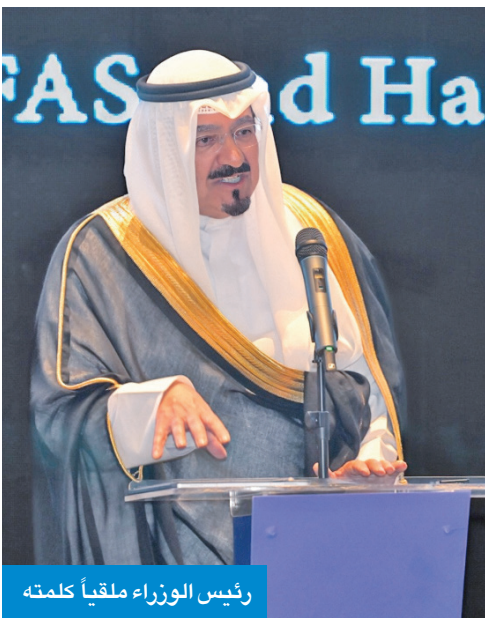
رئيس الوزراء ملقياً كلمة

منصة وطنية رائدة لدعم البحث العلمي والابتكار وبناء القدرات، منوها سموه بالشراكة المتجددة مع كلية «كيندي» بوصفها استثماراً استراتيجياً في الإنسان الكويتي من خلال تزويد القيادات الوطنية بأدوات علمية ومنهجية حديثة في القيادة وصنع القرار وتحليل السياسات العامة، بما يواكب التحولات العالمية المتسارعة في مجالات الاقتصاد والحكومة والذكاء الاصطناعي. وذكرت المؤسسة في بيانها أنه انطلاقاً من هذا التوجه الاستراتيجي، فقد أسست «التقدم العلمي»، خلال السنوات الماضية، شبكة واسعة من الشراكات العالمية مع مؤسسات أكاديمية وبحثية مرموقة شملت كلية لندن للأعمال بجامعة سنغافورة الوطنية وكلية وورتن بجامعة كامبريدج وكلية لندن للاقتصاد والعلوم السياسية، وأخيراً الكلية الأوروبية للإدارة