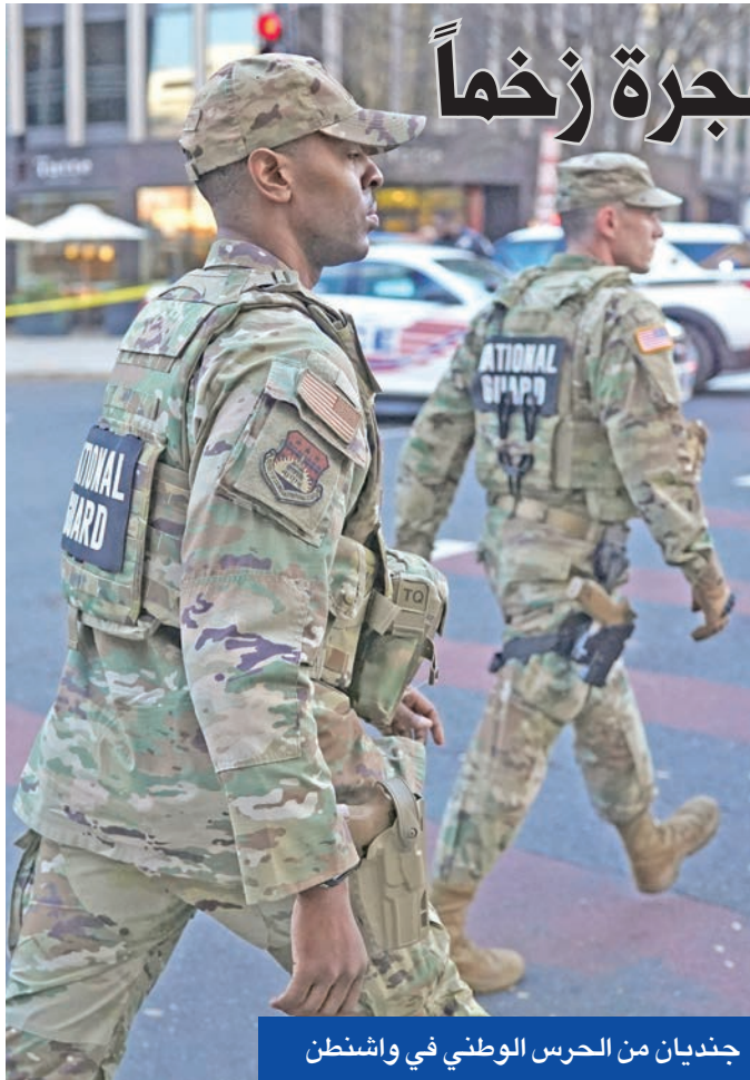
جنديان من الحرس الوطني في واشنطن

أن المشتبه به أفغاني وصل على متن «إحدى رحلات بايدين السيئة السمعة». وقال ترامب، في خطاب، هذا «الاعتداء الشنيع عمل إرهابي وحشي وجريمة ضد أمّتنا والإنسانية»، مشدداً على أنه «لن يلين أمام الإرهاب ولن يتخيه هذا الاعتداء عن المهمة التي أنجزها جنوده في تخفيض الجرائم بواشنطن بشكل غير مسبوق». وأعلن ترامب أنه وجّه وزير الحرب بيت هيغسيث بتعبئة 500 جندي لمساعدة 2000 آخرين في تأمين واشنطن، وتعهده بتقديم مرتكب الهجوم إلى العدالة السريعة.