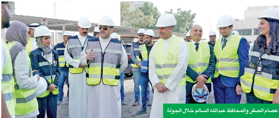
عصام الصقر والمحافظ عبدالله السالم خلال الجولة