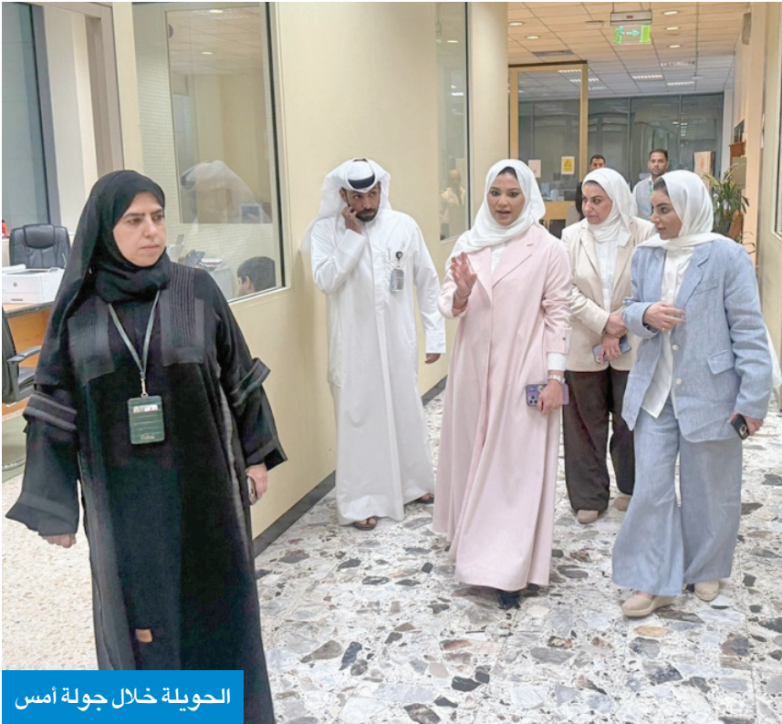
الحويلة خلال جولة أمس